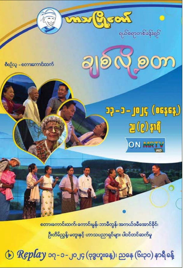
ညနေ ၆ နာရီ သတင်းအပြီး ထုတ်လွှင့်ပြသမည် ဖြစ်ကြောင်း တွင်လည်း (Replay) ထပ်မံ သိရသည်။ သတင်းစဉ်