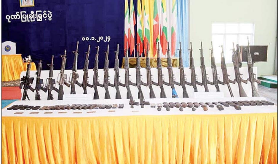
နတ်သံကွင်းရဲစခန်းဖြစ်စဉ်တွင် သိမ်းဆည်းရမိခဲ့သည့် လက်နက်ခဲယမ်းများ မှတ်တမ်းဓာတ်ပုံ။

ခြမ်း/အနောက်ခြမ်းတို့ရှိ လုံခြုံရေးအဖွဲ့များနှင့် နတ်သံကွင်းမြို့တွင်းရှိ မြို့နယ်ရဲစခန်းမှ ရဲတပ်ဖွဲ့ဝင် များ အခြေပြုနေထိုင်သည့် နတ်သံကွင်းရဲစခန်းအား KNLA အဖွဲ့နှင့် PDF အမည်ခံ အကြမ်းဖက် သောင်းကျန်းသူပူးပေါင်းအဖွဲ့များမှ ၂၀၂၃ ခုနှစ် နိုဝင်ဘာလမှ စတင်ပြီး သွေးတိုးစမ်း ချောင်းမြောင်း ပစ်ခတ်ခြင်း၊ ၎င်းတို့အကျိုးအမြတ်ရရှိရေး အဖွဲ့ငယ် များအား စနစ်ပါဖြင့် လှည့်စားနှောင့်ယှက်ပစ်ခတ် ခြင်းနှင့် နတ်သံကွင်းရွာဝန်းကျင်၌ ၎င်းတို့အင်အား တိုးမြှင့်ချထား၍ ဆက်သွယ်ရေးလမ်းကြောင်းနှင့် ရိက္ခာဖြတ်တောက် ပိတ်ဆို့ခြင်းတို့ ဆောင်ရွက်ခဲ့ပြီး ဒီဇင်ဘာ ၂၆ ရက်မှစ၍ အကြမ်းဖက် ပူးပေါင်းအင်အား ၂၀၀ ခန့်ဖြင့် အပြင်းအထန် ပစ်ခတ်တိုက်ခိုက်လာခဲ့ သည်။