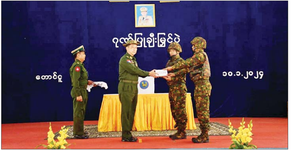
ဒုတိယဗိုလ်ချုပ်ကြီး တေကျော် နတ်သံကွင်းရဲစခန်းကို အကြမ်းဖက်သမားများ လာရောက် တိုက်ခိုက်သည့်ဖြစ်စဉ်တွင် စွမ်းစွမ်းတမံပါဝင်ဆောင်ရွက်ခဲ့ကြသည့် တပ်မတော်သား အရာရှိ၊ စစ်သည် များအတွက် ဂုဏ်ပြုချီးမြှင့်ငွေများ ပေးအပ်စဉ်။

တောင်ပိုင်းတိုင်းစစ်ဌာနချုပ် နယ်မြေအတွင်း ရန်ကုန်-မန္တလေး ကားလမ်းဟောင်းပေါ်ရှိ ပဲခွယ်ကုန်း မြို့နှင့် ကျောက်ကြီးမြို့ကို ဆက်သွယ်ထားသော ၁၇ မိုင်ရှည်လျားသည့် လမ်းကြောင်းပေါ်မှ စစ်တောင်း မြစ်အား ဖြတ်ကူးသော နတ်သံကွင်းတံတား အရှေ့