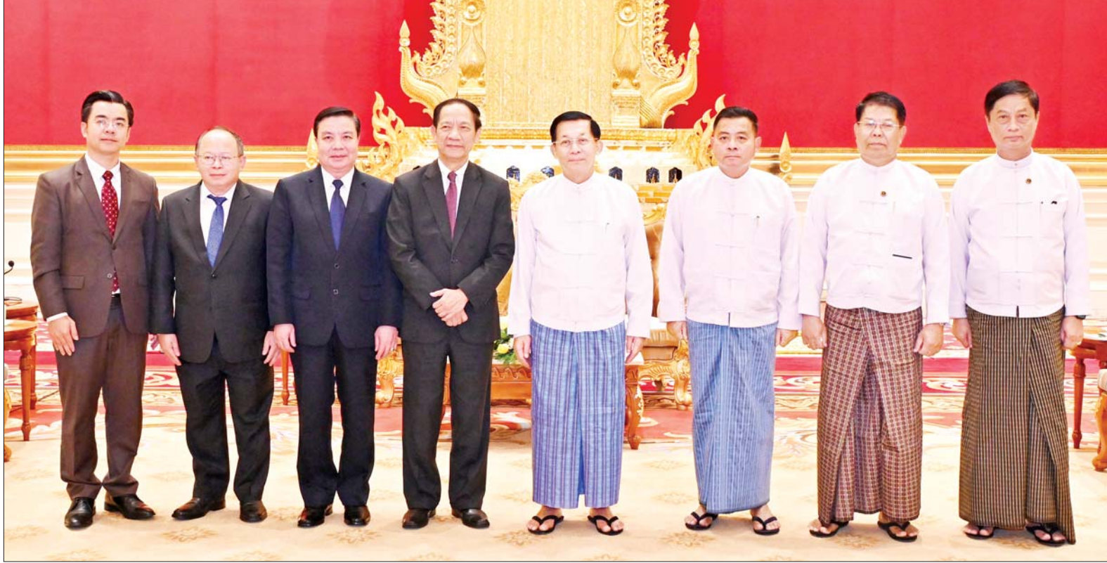
နိုင်ငံတော်စီမံအုပ်ချုပ်ရေးကောင်စီဥက္ကဋ္ဌ နိုင်ငံတော်ဝန်ကြီးချုပ် ဗိုလ်ချုပ်မှူးကြီး မင်းအောင်လှိုင်နှင့်အဖွဲ့ဝင်များ အာဆီယံဥက္ကဋ္ဌ၏ မြန်မာနိုင်ငံဆိုင်ရာ အထူးကိုယ်စားလှယ် ဖြစ်သူ H.E. Mr. Alounkeo Kittikhoun ဦးဆောင်သည့် အဖွဲ့နှင့်အတူ စုပေါင်းမှတ်တမ်းတင်ဓာတ်ပုံရိုက်စဉ်။

ကြီးနှင့် တာဝန်ရှိသူများ တက်ရောက်ခဲ့ကြကြောင်း သိရသည်။ သတင်းစဉ်