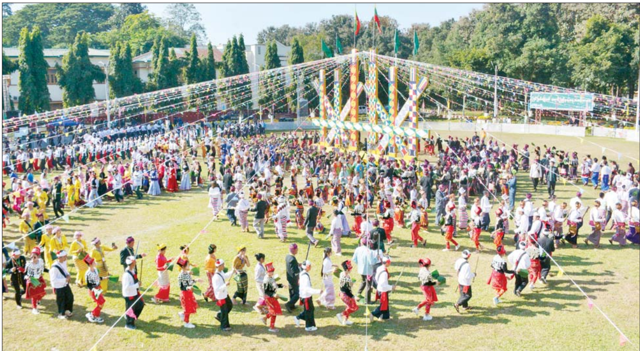
(၇၆)နှစ်မြောက် ကချင်ပြည်နယ်နေ့ အထိမ်းအမှတ်အခမ်းအနား ကျင်းပစဉ်။

ယင်းနောက် ပြည်နယ်ဝန်ကြီး ဦးခက်ထိန်နန်က နှစ်သစ် နှုတ်ခွန်းဆက် အမှာစကား ပြောကြားသည်။ ထို့နောက်နယ်စပ်ရေးရာဝန်ကြီး ဌာန ပြည်ထောင်စုဝန်ကြီး ဒုတိယ ဗိုလ်ချုပ်ကြီး ထွန်းထွန်းနောင်က ကချင်ပြည်နယ် ဒေသဖွံ့ဖြိုး တိုးတက်ရေးအတွက် လိုအပ် သောနေရာများတွင် ထောက်ပံ့ ပေးအပ်နိုင်ရန် နေရောင်ခြည် စွမ်းအင်သုံး အိမ်သုံးဆီလီဆာ (Panels 120W Solar Home System) အစုံ ၁၅၀ ကို ပြည်နယ် အစိုးရအဖွဲ့ထံ ပေးအပ်ရာ ပြည်နယ် လုံခြုံရေးနှင့်နယ်စပ် ရေးရာဝန်ကြီးက လက်ခံရယူ သည်။ ဆက်လက်၍ ပြန်ကြားရေး ဝန်ကြီးဌာန ပြည်ထောင်စုဝန်ကြီး ဦးမောင်မောင်အုန်းက ကချင် ပြည်နယ် အစိုးရအဖွဲ့အတွက် MRTV DTD ငါးစုံနှင့် DVB T2 Set Top Box အလုံး ၅၀ ကို ပြည်နယ် တိုင်းရင်းသားရေးရာဝန်ကြီးထံ လည်းကောင်း၊ မြောက်ပိုင်းတိုင်း ယင်းနောက် ပြည်နယ်အစိုးရ