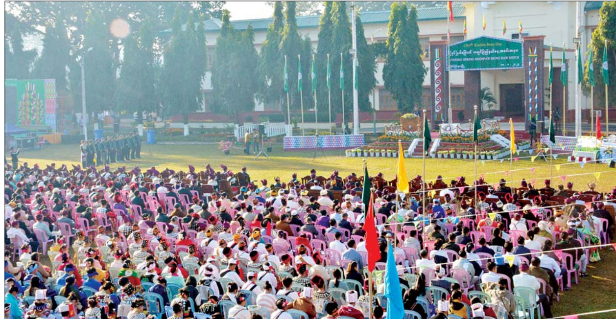
ပြည်ထောင်စုသမ္မတ မြန်မာနိုင်ငံတော် နိုင်ငံတော်စီမံအုပ်ချုပ်ရေးကောင်စီဥက္ကဋ္ဌ နိုင်ငံတော်ဝန်ကြီးချုပ် ဗိုလ်ချုပ်မှူးကြီး သတိုးမဟာ သရေစည်သူ သတိုးသီရိသုဓမ္မ မင်းအောင်လှိုင်ထံမှ ၂၀၂၄ ခုနှစ် (၇၆)နှစ်မြောက် ကချင်ပြည်နယ်နေ့ အခမ်းအနားသို့ ပေးပို့သည့် သဝဏ်လွှာအား နိုင်ငံတော်စီမံအုပ်ချုပ်ရေးကောင်စီအဖွဲ့ဝင် ဒုတိယဝန်ကြီးချုပ်နှင့် ပြည်ထောင်စုဝန်ကြီး ဗိုလ်ချုပ်ကြီးတင်အောင်စန်း ဖတ်ကြားစဉ်။

ကွင်းအတွင်း တပျော်တပါး စုပေါင်းဆင်နွှဲခဲ့ကြပြီး မှတ်တမ်း တင် ဓာတ်ပုံရိုက်ကြသည်။ ကချင်ပြည်နယ်နေ့သည် မြန်မာ နိုင်ငံ လွတ်လပ်ရေးရရှိခဲ့သည့် ၁၉၄၈ ခုနှစ် ဇန်နဝါရီ ၄ ရက်ပြီး နောက်မြောက်ရက်အကြာ ဇန်နဝါရီ ၁၀ ရက်နေ့တွင် ကျင်းပခဲ့သည့် ကချင်ပြည်နယ်ကောင်စီ ညီလာခံကို မြစ်ကြီးနားမြို့ စီတာပူ မနောကွင်း၌ ကျင်းပပြုလုပ်ခဲ့ရာ မြန်မာနိုင်ငံ၏ ပထမဆုံးသော သမ္မတ စစ်ရွှေသိုက်ကိုယ်တိုင် တက်ရောက်၍ ကချင်ပြည်နယ် အစိုးရအဖွဲ့ကို ဖွဲ့စည်းပေးခဲ့ပြီး ၎င်း ဇန်နဝါရီ ၁၀ ရက်နေ့ကို ကချင်ပြည်နယ်နေ့ အဖြစ် သတ်မှတ်၍ နှစ်စဉ်ကျင်းပခဲ့ရာ ယခုနှစ်တွင် (၇၆)နှစ်မြောက်အထိ ရောက်ရှိခဲ့ပြီ ဖြစ်သည်။ တက်ရောက် မွန်းလွဲပိုင်းတွင် ဒုတိယဝန်ကြီး ချုပ်နှင့် ပြည်ထောင်စုဝန်ကြီး၊ နိုင်ငံတော်စီမံအုပ်ချုပ်ရေးကောင်စီ အဖွဲ့ဝင်များ၊ ပြည်ထောင်စုဝန်ကြီး များ စာမျက်နှာ ၇ သို့ ❖