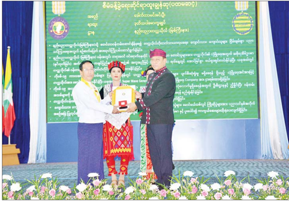
ဒုတိယဝန်ကြီးချုပ်နှင့် ပြည်ထောင်စုဝန်ကြီး ဗိုလ်ချုပ်ကြီးတင်အောင်စန်း စီမံခန့်ခွဲရေးဆိုင်ရာ ထူးချွန်ဆု (ပထမအဆင့်) ရရှိသူတစ်ဦးကို ဆုပေးအပ်ချီးမြှင့်စဉ်။