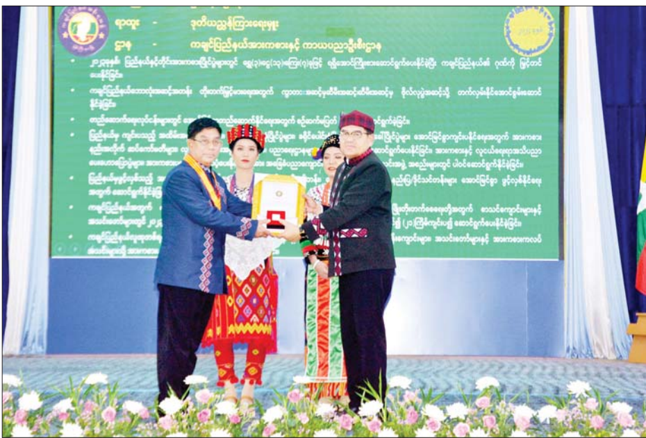
ပြည်နယ်ဝန်ကြီးချုပ် ဦးခက်ထိန်နန် လူမှုရေးဆိုင်ရာထူးချွန်ဆု (ပထမအဆင့်) ရရှိသူတစ်ဦးကို ဆုပေးအပ်ချီးမြှင့်စဉ်။

ဦးစွာ ပြည်နယ်ဝန်ကြီးချုပ်က ဂုဏ်ထူးဆောင်ဆုနှင့် ဂုဏ်ပြု မှတ်တမ်းလွှာများ ချီးမြှင့်အပ်နှင်း နိုင်ရေး ဆောင်ရွက်ခဲ့မှုအခြေအနေ များကို ရှင်းလင်းတင်ပြသည်။ ရှင်းလင်းတင်ပြ ယင်းနောက် လုံခြုံရေးနှင့် နယ်စပ်ရေးရာဝန်ကြီးဗိုလ်မှူးကြီး ကျော်သူရက ဂုဏ်ထူးဆောင် လက်မှတ်၊ ဂုဏ်ထူးဆောင်ဆုနှင့် မှတ်တမ်းတင် ဂုဏ်ပြုလွှာများ ချီးမြှင့်အပ်နှင်းနိုင်ရေး လုပ်ငန်း ကော်မတီများ ဖွဲ့စည်းပြီး ဥပဒေ နှင့်အညီ စိစစ်ရွေးချယ် ဆောင်ရွက်ခဲ့မှု အခြေအနေများ ကို ရှင်းလင်းတင်ပြသည်။ ထို့နောက် ဒုတိယဝန်ကြီးချုပ် နှင့် ပြည်ထောင်စုဝန်ကြီးဗိုလ်ချုပ်