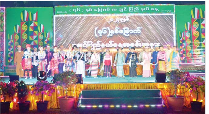
(၇၆)နှစ်မြောက် ကချင်ပြည်နယ်နေ့ အထိမ်းအမှတ် ဂုဏ်ပြုညစာစားပွဲအခမ်းအနား ကျင်းပစဉ်။