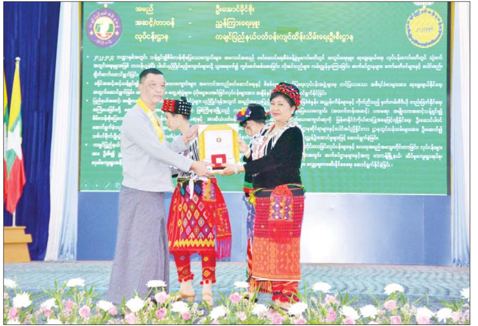
နိုင်ငံတော်စီမံအုပ်ချုပ်ရေးကောင်စီအဖွဲ့ဝင် ဒေါ်ခွဲဘူ စီမံခန့်ခွဲရေးဆိုင်ရာထူးချွန်ဆု (ပထမအဆင့်) ရရှိသူတစ်ဦးကို ဆုပေးအပ်ချီးမြှင့်စဉ်။