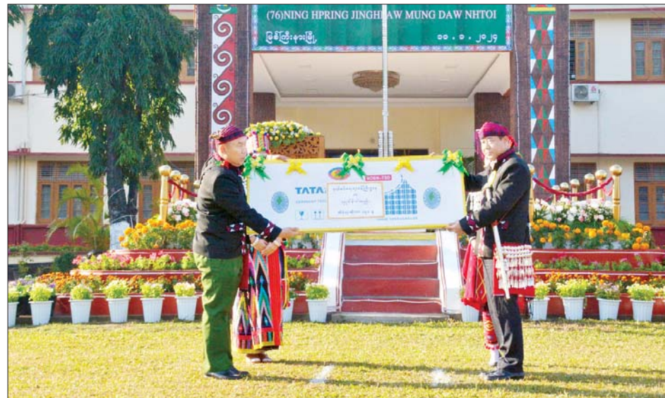
ပြည်ထောင်စုဝန်ကြီး ဒုတိယဗိုလ်ချုပ်ကြီး ထွန်းထွန်းနောင်က ကချင်ပြည်နယ် ဒေသဖွံ့ဖြိုး တိုးတက်ရေးအတွက် ထောက်ပံ့ပစ္စည်းများ ပေးအပ်စဉ်။