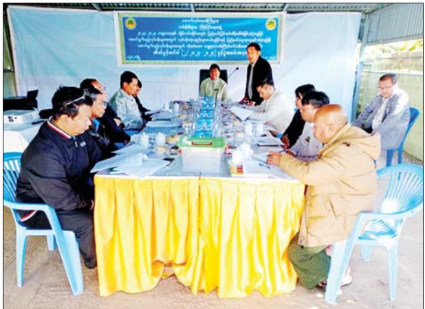
နံနက် ၁၀ နာရီက လမ်းဦးစီးဌာန ကြီးကြပ်ရေးအဖွဲ့ရုံးတွင် ကျင်းပ သည်။

လှိုင်လင် ဇန်နဝါရီ ၁၀ ရှမ်းပြည်နယ် (တောင်ပိုင်း) လှိုင်လင်မြို့ လမ်းဦးစီးဌာန ကြီးကြပ်ရေးအဖွဲ့က ၂၀၂၃-၂၀၂၄ ဘဏ္ဍာနှစ်အတွက် လှိုင်လင်ခရိုင် အတွင်း ပြည်နယ် ပြင်ဆင်ထိန်း သိမ်းခြင်းရန်ပုံငွေဖြင့် ဆောင်ရွက် မည့်လုပ်ငန်းများအတွက် လုပ်ငန်း သုံးပစ္စည်းများ ဝယ်ယူခြင်းနှင့် ပြည်နယ် ငွေလုံးငွေရင်းရန်ပုံငွေ ဖြင့် ဆောင်ရွက်မည့်လုပ်ငန်းများ အတွက် လိုအပ်သော ယန္တရား (လမ်းကြိုတံစက်) ဝန်ဆောင်မှု ရယူခြင်း အိတ်ဖွင့်တင်ဒါ (၂/၂၀၂၃- ၂၀၂၄) ဖွင့်ပွဲအခမ်းအနားကို ယနေ့