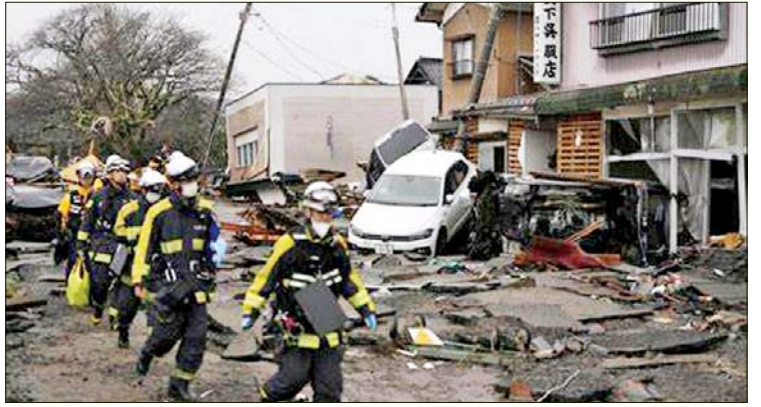
ရှု အခက်အခဲများကို ဖြေရှင်းပေးသည်။ တိုယာမာ နိုင်ငံတကာ စင်တာကလည်း အရေးပေါ်ဖုန်းလိုင်းများတွင် စကားပြန်များ ခန့်ထားကာ ဂျပန်၊ အင်္ဂလိပ်၊ တရုတ်၊ ဗီယက်နမ်နှင့် ပေါ်တူဂီအပါအဝင် ဘာသာ စကားအမျိုးမျိုးဖြင့် ဝန်ဆောင်မှုပေးလျက် ရှိသည်။ ဖူကင်းစီရင်စုတွင်လည်း ဖုန်းနှင့် လူမှု ဆက်သွယ်ရေး မီဒီယာများဖြစ်သည့် ဖေ့စ်ဘွတ်၊ လိုင်းနှင့်အင်စတာဂရမ်တို့မှ ဘာသာစကား ၁၇ မျိုးဖြင့် ငလျင်ဘေးသင့် သူများအား အကူအညီပေးကြောင်း သိရ သည်။ ကိုးကား - အင်န်အိတ်ချီကေ ဘာသာပြန် - စိုးသူရ

၁၃ ရက်တွင် အဆိုပါ သဘာဝဘေးဒဏ်သင့် ဒေသများသို့ သွားရောက်ပြီး ထိခိုက် နစ်နာသူများကို ပံ့ပိုးကူညီရန် ဆောင်ရွက် မည်ဖြစ်သည်။ ဂျပန်နိုင်ငံအလယ်ပိုင်း အိဂျီကာဝါစီ ရင်စုမှ ငလျင်ဒဏ်ခံရသည့် နိုင်ငံခြားသား များအတွက် ဘာသာစကားအထောက်အပံ့ ပေးသည့် လုပ်ငန်းကို ဆောင်ရွက်လျက်ရှိ သည်။ အိဂျီကာဝါစီရင်စုတွင် ဗီယက်နမ်၊ တရုတ်၊ အင်ဒိုနီးရှား၊ ထိုင်း၊ မြန်မာ၊ ဂျပန် ဘာသာစကားများဖြင့် ငလျင်ဘေးသင့်သူ များအတွက် အကြံညာပေးသည့် ဝက်ဘ်ဆိုက်ကို တည်ထောင်ခဲ့သည်။ ၎င်းဝက်ဘ်ဆိုက်တွင် အကူအညီ တောင်းခံသည့် မက်ဆေ့ချ်များကို ပေးပို့ နိုင်ပြီး တာဝန်ရှိသူများက အီးမေးလ်ပေးပို့