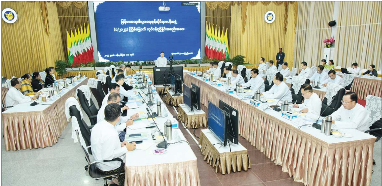
နိုင်ငံတော်စီမံအုပ်ချုပ်ရေးကောင်စီဒုတိယဥက္ကဋ္ဌ ဒုတိယဝန်ကြီးချုပ် ဒုတိယဗိုလ်ချုပ်မှူးကြီးစိုးဝင်း မြန်မာအထူးစီးပွားရေးဇုန်ဆိုင်ရာဗဟိုအဖွဲ့၏ (၁/၂၀၂၄)ကြိမ်မြောက် လုပ်ငန်းညှိနှိုင်းအစည်းအဝေးတွင် အမှာစကားပြောကြားစဉ်။

နေပြည်တော် ဇန်နဝါရီ ၁၀ မြန်မာ အထူးစီးပွားရေးဇုန်ဆိုင်ရာ ဗဟိုအဖွဲ့၏ (၁/၂၀၂၄) ကြိမ်မြောက် လုပ်ငန်းညှိနှိုင်းအစည်းအဝေးကို ယနေ့ မွန်းလွဲ ၁ နာရီခွဲတွင် နေပြည်တော်ရှိ စီးပွားရေးနှင့် ကူးသန်းရောင်းဝယ်ရေး ဝန်ကြီးဌာန ညီလာခံခန်းမ၌ ကျင်းပရာ မြန်မာအထူးစီးပွားရေးဇုန်ဆိုင်ရာ ဗဟို အဖွဲ့ဥက္ကဋ္ဌ နိုင်ငံတော်စီမံအုပ်ချုပ်ရေး ကောင်စီ ဒုတိယဥက္ကဋ္ဌ ဒုတိယဝန်ကြီးချုပ် ဒုတိယဗိုလ်ချုပ်မှူးကြီးစိုးဝင်း တက်ရောက် အမှာစကား ပြောကြားသည်။ တက်ရောက် အစည်းအဝေးသို့ မြန်မာအထူးစီးပွား ရေးဇုန်ဆိုင်ရာ ဗဟိုအဖွဲ့ဝင်များ ဖြစ်ကြ သည့် ပြည်ထောင်စုဝန်ကြီးများ၊ ဒုတိယ ဝန်ကြီးများ၊ သီလဝါ၊ ကျောက်ဖြူနှင့် ထားဝယ်အထူးစီးပွားရေးဇုန်တို့မှ စီမံ ခန့်ခွဲမှုကော်မတီဥက္ကဋ္ဌများ၊ ညွှန်ကြားရေး မှူးချုပ်များနှင့်တာဝန်ရှိသူများတက်ရောက် ကြပြီး ရန်ကုန်တိုင်းဒေသကြီး ဝန်ကြီးချုပ်၊ စာမျက်နှာ ၅ ကော်လံ ၁ သို့ ။