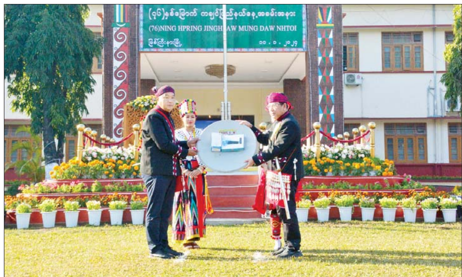
ပြည်ထောင်စုဝန်ကြီး ဦးမောင်မောင်အုန်းက ထောက်ပံ့ပစ္စည်းများကို ပေးအပ်စဉ်။