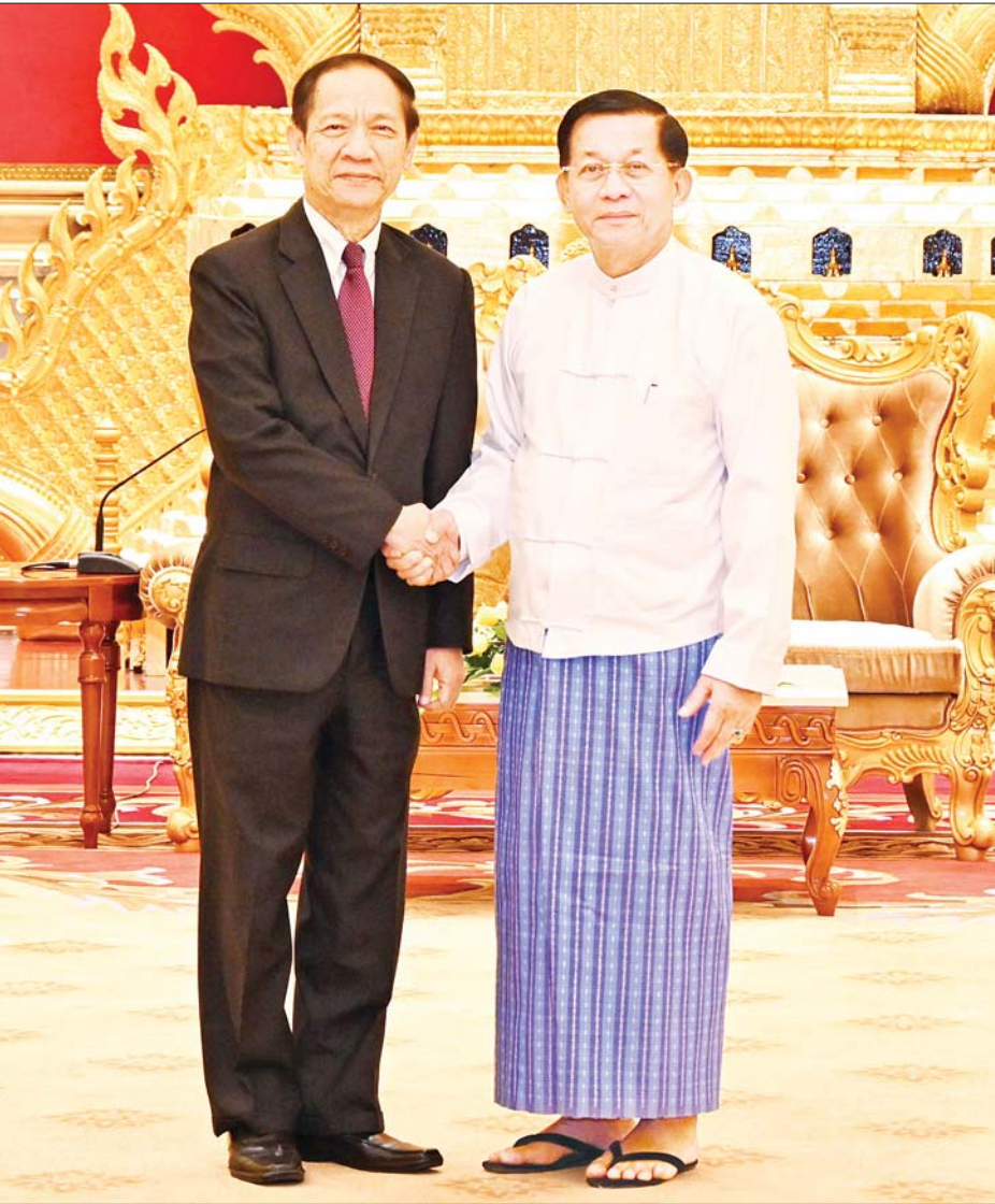
နိုင်ငံတော်စီမံအုပ်ချုပ်ရေးကောင်စီဥက္ကဋ္ဌ နိုင်ငံတော်ဝန်ကြီးချုပ် ဗိုလ်ချုပ်မှူးကြီး မင်းအောင်လှိုင် အာဆီယံဥက္ကဋ္ဌ၏ မြန်မာနိုင်ငံဆိုင်ရာအထူးကိုယ်စားလှယ်ဖြစ်သူ H.E. Mr. Alounkeo Kittikhoun အားရင်းရင်းနှီးနှီးနှုတ်ဆက်စဉ်။

တွေ့ဆုံပွဲအပြီးတွင် နိုင်ငံတော်စီမံအုပ်ချုပ်ရေးကောင်စီ ဥက္ကဋ္ဌ နိုင်ငံတော်ဝန်ကြီးချုပ်နှင့် အာဆီယံ ဥက္ကဋ္ဌ၏ မြန်မာနိုင်ငံဆိုင်ရာ အထူးကိုယ်စားလှယ် တို့သည် တက်ရောက် လာကြသူများနှင့် အတူ စုပေါင်းမှတ်တမ်းတင်ဓာတ်ပုံရိုက်ကြသည်။ တက်ရောက် အဆိုပါတွေ့ဆုံပွဲသို့ နိုင်ငံတော်စီမံအုပ်ချုပ်ရေးကောင်စီ ဥက္ကဋ္ဌ နိုင်ငံတော်ဝန်ကြီးချုပ်နှင့် အတူ ကောင်စီ တွဲဖက်အတွင်းရေးမှူး ဒုတိယဗိုလ်ချုပ်ကြီး ရဲဝင်းဦး၊ ဒုတိယဝန်ကြီးချုပ်နှင့် နိုင်ငံခြားရေး