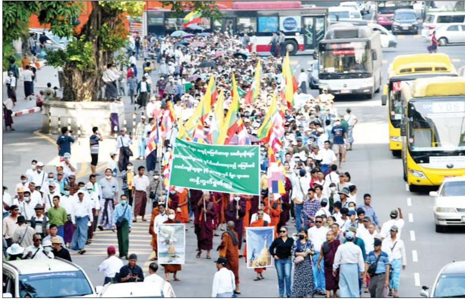
သည့်ကြွေးကြော်သံများမှာ သာသနာကို ဖျက်ဆီးနေ သော အကြမ်းဖက်သူပုန်များအား ရှင်းလင်းရေး (ဒို့အရေး)၊ ဗုဒ္ဓသာသနာအား အကြမ်းဖက်ဖျက်ဆီး နေသော သူပုန်များ(ကျရှုံးပါစေ)၊ လူသတ်အကြမ်း ဖက်သူပုန်မှန်သမျှ(ဆန့်ကျင်ကြ)၊ ဗုဒ္ဓသာသနာကို အကြမ်းဖက်ဖျက်ဆီးနေသော လူသတ်မိစ္ဆာသူပုန်များ

ရန်ကုန် ဇန်နဝါရီ ၁၀ စစ်ရေးနှင့် သက်ဆိုင်ခြင်းမရှိသည့် ဘုရားစေတီ ပုထိုးများ၊ ဗုဒ္ဓဆင်းတုတော်များအား ဖျက်ဆီး စော်ကားနေသည့် အကြမ်းဖက်သောင်းကျန်းသူများ အား ကန့်ကွက်ရှုတ်ချပွဲကို ယနေ့မွန်းလွှဲပိုင်းတွင် ရန်ကုန်မြို့ မြို့တော်ခန်းမရှေ့ရှိ မဟာဗန္ဓုလပန်းခြံ ဘေး၌ ကျင်းပသည်။