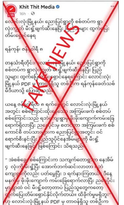
ရန် လူမှုကွန်ရက်စာမျက်နှာများတွင် မဟုတ်မမှန်ရေးသားဖြန့်ဝေနေခြင်းသာဖြစ်ကြောင်း သိရသည်။ သတင်းစဉ်

နေပြည်တော် ဇန်နဝါရီ ၉ - တနင်္သာရီတိုင်းဒေသကြီး လောင်းလုံးမြို့နယ် ညောင်ပြင်ရွာကို ဇန်နဝါရီ ၈ ရက်တွင် လုံခြုံရေးတပ်ဖွဲ့ဝင်များက ရွာလုံးကျွတ် မီးရှို့ဖျက်ဆီးနေပြီး ပြည်သူများ ထွက်ပြေးတိမ်းရှောင်နေရကြောင်း သတင်းတု၊ သတင်းအမှားများကို Khit Thit Media က လူမှုကွန်ရက်စာမျက်နှာများတွင် မဟုတ်မမှန်ရေးသားဖြန့်ဝေနေသည်ကို တွေ့ရှိရသည်။ ဖြစ်စဉ်အမှန်မှာ ဇန်နဝါရီ ၈ ရက်တွင် လောင်းလုံးမြို့နယ် ညောင်ပြင်ကျေးရွာ၏ အနောက်တောင်ဘက် မီတာ ၃၇၀၀ ခန့်၌ အနီးဝန်းကျင်ကျေးရွာများကို မီးရှို့ဖျက်ဆီးနေသည့် အကြမ်းဖက်သောင်းကျန်းသူများ ခိုအောင်းလှုပ်ရှားနေကြောင်း အကြမ်းဖက်မှုကို မလိုလားသည့် ဒေသခံပြည်သူများ၏ သတင်းပေးမှုအရ လုံခြုံရေးတပ်ဖွဲ့များက နယ်မြေလုံခြုံရေးဆောင်ရွက်ခဲ့ရာ အကြမ်းဖက်သမားများသည် ၎င်းတို့အခြေပြုနေထိုင်သည့် တဲများအား မီးရှို့ထွက်ပြေးသွားခဲ့ကြောင်းနှင့် လက်လုပ်မိုင်းများ၊ ဖောက်ခွဲရေးဆက်စပ်ပစ္စည်းများ သိမ်းဆည်းရမိခဲ့ကြောင်း သိရသည်။ တရားမဝင် ပြည်ပျက်မိဒီယာများအနေဖြင့် သတင်းတု၊ သတင်းအမှားများကို ရည်ရွယ်ချက်ရှိရှိ လုပ်ကြံရေးသားပြီး ဒေသခံပြည်သူများနှင့် လုံခြုံရေးတပ်ဖွဲ့ဝင်များအကြား အထင်အမြင်လွှဲမှားစေရန်နှင့် လုံခြုံရေးတပ်ဖွဲ့ဝင်များ၏ ဂုဏ်သိက္ခာကျဆင်းစေ