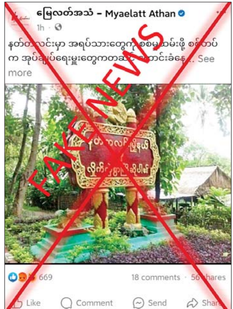
ပေါ်တွင် လုပ်ကြံရေးသားပြီး အကြောက်တရားများ၊ အမှန်းတရားများကို လေလှိုင်းပေါ်မှတစ်ဆင့် နည်းလမ်းမျိုးစုံဖြင့် ပြည်သူများအား လှုံ့ဆော်ဝါဒဖြန့်ဝေခြင်းသာဖြစ်ကြောင်း သိရသည်။ သတင်းစဉ်

နေပြည်တော် ဇန်နဝါရီ ၉ - ပဲခူးတိုင်းဒေသကြီး နတ်တလင်းမြို့နယ် အထွေထွေအုပ်ချုပ်ရေးမှူးရုံးတွင် ဇန်နဝါရီ ၅ ရက်က တပ်မတော်မှ အုပ်ချုပ်ရေးမှူးများကို ခေါ်ယူကာ အသက် ၁၈ နှစ်မှ ၅၅ နှစ်ကြား အမျိုးသားများကို ကျေးရွာတစ်ခုစီအုပ်စုလျှင် ၁၀ ဦး ပေးရမည်ဟု စစ်မှုထမ်းအင်အားများတောင်းခံနေကြောင်း သတင်းတု၊ သတင်းအမှားများကို လူမှုကွန်ရက်စာမျက်နှာများတွင် မဟုတ်မမှန်ရေးသားဖြန့်ဝေနေသည်ကို တွေ့ရှိရသည်။ အဆိုပါသတင်းနှင့်ပတ်သက်၍ ပဲခူးတိုင်းဒေသကြီး နတ်တလင်းမြို့နယ်မှ တာဝန်ရှိသူတစ်ဦး၏ ပြောကြားချက်အရ တပ်မတော်မှ ဒေသခံပြည်သူများအား စစ်မှုထမ်းဆောင်ရန် အင်အားတောင်းခံခြင်းနှင့် အတင်းအဓမ္မ စစ်မှုထမ်းဆောင်ခိုင်းခြင်း မရှိပါကြောင်း၊ ကောလာဟလသတင်းများကို မသမာသူများက လုပ်ကြံပြောဆိုနေခြင်းသာ ဖြစ်ကြောင်း သိရသည်။ တရားမဝင် ပြည်ပျက်မိဒီယာများအနေဖြင့် တပ်မတော်၏ ဂုဏ်သိက္ခာကျဆင်းစေပြီး ပြည်သူများမှ အထင်အမြင်လွှဲမှားစေရန်အတွက် ကောလာဟလသတင်းများကို လူမှုကွန်ရက်စာမျက်နှာများ