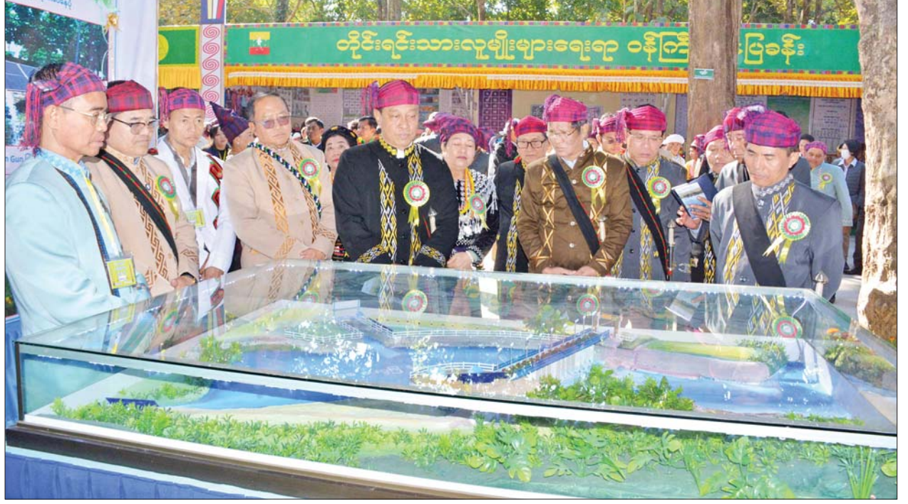
နိုင်ငံတော်စီမံအုပ်ချုပ်ရေးကောင်စီအဖွဲ့ဝင် ဒုတိယဝန်ကြီးချုပ်နှင့် ကာကွယ်ရေးဝန်ကြီးဌာန ပြည်ထောင်စုဝန်ကြီး ဗိုလ်ချုပ်ကြီး တင်အောင်စန်းနှင့် အဖွဲ့ဝင်များ၊ ပြည်ထောင်စုဝန်ကြီးများက ကချင်ပြည်နယ်နေ့အထိမ်းအမှတ် ခင်းကျင်းပြသထားသည့် ဌာနဆိုင်ရာ ပြခန်း များနှင့် ဟင်းသီးဟင်းရွက်နှင့် ဒေသထွက်ကုန်ပစ္စည်းပြခန်းများကို ကြည့်ရှုအားပေးစဉ်။

ပေးခဲ့သည့် လူပုဂ္ဂိုလ်၊ အဖွဲ့အစည်း များအား ဂုဏ်ထူးဆောင်လက်မှတ် နှင့် ဂုဏ်ထူးဆောင်ဆုများ ပေးအပ် ချီးမြှင့်ပွဲသို့ တက်ရောက်ကြသည်။ ဆက်လက်၍ ဂုဏ်ထူးဆောင် လက်မှတ်နှင့် ဂုဏ်ထူးဆောင်ဆု များကို ပေးအပ်ချီးမြှင့်ရာ နိုင်ငံတော် စီမံအုပ်ချုပ်ရေးကောင်စီ အဖွဲ့ဝင် ဒေါက်တာမူထန်၊ ဦးရွှေကြိမ်း၊ ပြည်ထောင်စုဝန်ကြီး ဒုတိယ ဗိုလ်ချုပ်ကြီး ထွန်းထွန်းနောင်၊ ဦးမင်းနောင်၊ ဦးညွှန်ထွန်း၊ Jeng Phang နော်တောင်၊ ပြည်နယ်တရား လွှတ်တော် တရားသူကြီးချုပ်၊ ဒုတိယဝန်ကြီး ဦးဇော်အေးမောင်တို့ က စီမံခန့်ခွဲရေးဆိုင်ရာ ထူးချွန်ဆု (ဒုတိယအဆင့်) ဆုရ ၂၂ ဦးကို ဆုများ ပေးအပ်ချီးမြှင့်ကြသည်။