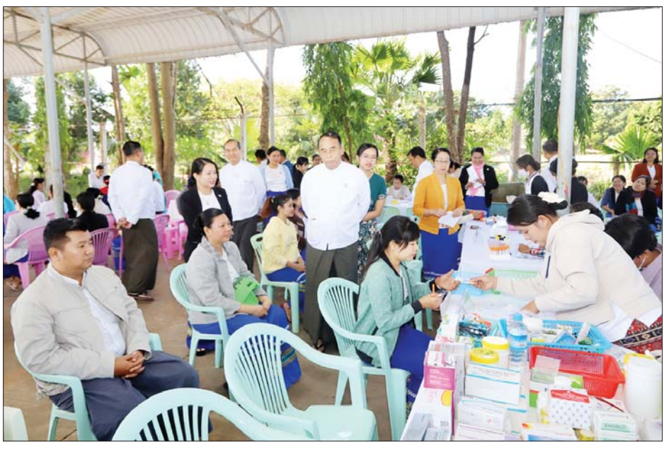
ဆောင်ရွက်သည့် စာချုပ်ဆေးခန်း ၂၃ ခန်း၊ မီးဖွားဝန်ဆောင်မှုဆောင်ရွက်လျက်ရှိသော စာချုပ်ဆေးရုံ/သားဖွားခန်း ၁၂ ခန်း၊ တိုင်းရင်းဆေးခန်း တစ်ခန်းတို့ဖြင့် ဝန်ဆောင်မှု ဆောင်ရွက်ပေးလျက်ရှိသည်။ နေပြည်တော်ကောင်စီရှိ ပို့ဆောင်ရေးနှင့် ဆက်သွယ်ရေးဝန်ကြီးဌာနနှင့် လူမှုဖူလုံရေးအဖွဲ့ (ရုံးချုပ်)ရှိ ဝန်ထမ်းများကို ကျန်းမာရေးစောင့်ရှောက်မှုများအနေဖြင့် ဇန်နဝါရီ ၁၀ ရက်မှ ၁၅ ရက်အထိ ဆက်လက်ဆောင်ရွက်သွားမည်ဖြစ်ကြောင်း သိရသည်။ သတင်းစဉ်

၄၅၀ အား လိုအပ်သော ဆေးဝါးကုသမှုများ၊ ၁၇၄ ဦးအား ဓာတ်ခွဲစစ်ဆေးမှုများ၊ ၄၂ ဦးအား နှလုံးအတွက် ECG စစ်ဆေးခြင်းများ ဆောင်ရွက်ပေးခဲ့ရာ ပြည်ထောင်စုဝန်ကြီး ဦးမြင့်နောင်၊ ဒုတိယဝန်ကြီး ဦးဝင်းရှိန်နှင့် တာဝန်ရှိသူများက ကြည့်ရှုအားပေးသည်။ အာမခံအလုပ်သမား ၁ ဒသမ ၂ သန်းကျော် လူမှုဖူလုံရေးအဖွဲ့က လူမှုဖူလုံရေးစီမံကိန်းကို အကောင်အထည်ဖော်ဆောင်ရွက်ရာ၌ ၂၀၂၃ ခုနှစ် နိုဝင်ဘာလတွင် အကျိုးဝင်အာမခံအလုပ်သမား ၁ ဒသမ ၂ သန်းကျော်ရှိပြီး ကျန်းမာရေးစောင့်ရှောက်မှုအတွက် လူမှုဖူလုံရေးအဖွဲ့ပိုင် ဆေးရုံကြီး သုံးရုံး၊ မြို့နယ်လူမှုဖူလုံရေးဆေးခန်း ၉၆ ခန်း၊ ဌာနကြီးဆေးခန်း ၆၀၊ စာချုပ်ဆေးခန်း ၅၄ ခန်း၊ သားဖွားမီးယပ်ပြင်ပလူနာကုသမှု (Specialist OG OPD)