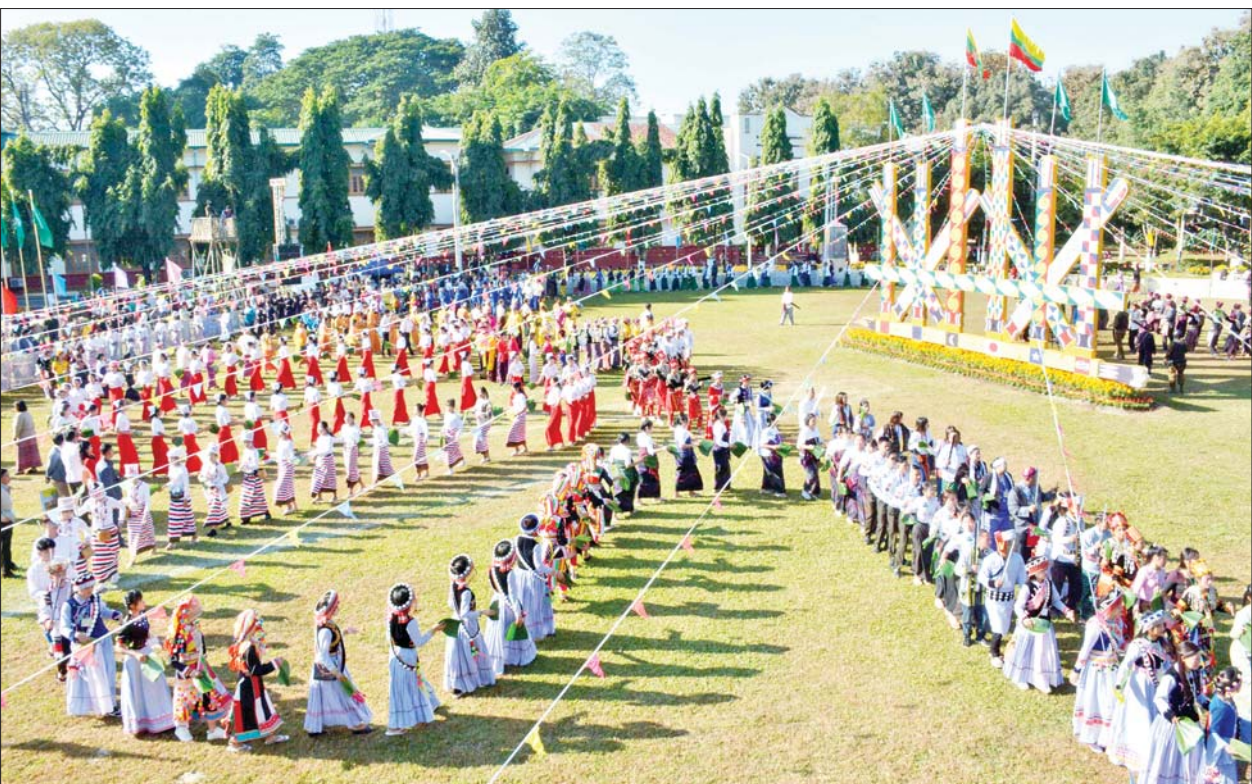
(၇၆) နှစ်မြောက် ကချင်ပြည်နယ်နေ့ ဖွင့်ပွဲအခမ်းအနားကို ကချင်ပြည်နယ်အစိုးရအဖွဲ့ရုံး မြက်ခင်းပြင်၌ ဌာနေတိုင်းရင်းသားတို့၏ စည်းလုံးညီညွတ်ခြင်းကို ဖော်ထုတ်ပြသသည့် မနောအကဖြင့် စည်ကားသိုက်မြိုက်စွာ ကျင်းပစဉ်။

ယင်းနောက် ဒုတိယဝန်ကြီးချုပ် နှင့် ပြည်ထောင်စုဝန်ကြီး ဗိုလ်ချုပ် ကြီး တင်အောင်စန်းနှင့် ကောင်စီ အဖွဲ့ဝင်များ၊ ပြည်ထောင်စုဝန်ကြီး များ၊ ပြည်နယ်ဝန်ကြီးချုပ်၊ တိုင်းမှူး၊ ပြည်နယ် တရားလွှတ်တော်တရား သူကြီးချုပ်၊ ပြည်နယ်အစိုးရအဖွဲ့ဝင် ဝန်ကြီးများနှင့် ၎င်းတို့၏ ဇနီးများ၊ ပြည်နယ် ဥပဒေချုပ်၊ ပြည်နယ် အဆင့်ဌာနဆိုင်ရာများ၊ ငြိမ်းချမ်း ရေးအကျိုးဆောင် အဖွဲ့ဝင်များ