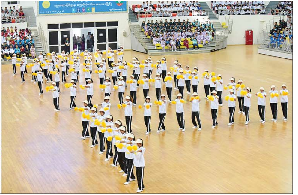
နိုင်ငံတော်စီမံအုပ်ချုပ်ရေးကောင်စီဒုတိယဥက္ကဋ္ဌ ဒုတိယဝန်ကြီးချုပ် ဒုတိယဗိုလ်ချုပ်မှူးကြီးစိုးဝင်း တက္ကသိုလ်ကျောင်းသားကျောင်းသူများ၏ ပန်းဖွားအကဖြင့် ကပြဖျော်ဖြေမှုများကို ကြည့်ရှုအားပေးစဉ်။

ရှေးမှ ဒုတိယဗိုလ်ချုပ်မှူးကြီး စိုးဝင်းက အမှာစကား ပြောကြားရာတွင် အားကစားသည် လူငယ်များ၏ ရုပ်ပိုင်းဆိုင်ရာ၊ စိတ်ပိုင်းဆိုင်ရာ ကျန်းမာကြံ့ခိုင်မှုကို ဖြစ်ပေါ်စေရုံသာမက ဗလငါးတန်ဖွံ့ဖြိုးမှု၏ အခြေခံမျိုးစေ့လည်း ဖြစ်ပါကြောင်း၊ အားကစားနည်းငါးမျိုး ထည့်သွင်းကျင်းပသွားမည် ဟု ပညာသင်နှစ် ပညာရေးဝန်ကြီး ဌာန တက္ကသိုလ်ပေါင်းစုံ အားကစားပြိုင်ပွဲတွင် ဘောလုံး၊ ဘော်လီဘော၊ ပြေးခုန်ပစ်၊ ပိုက်ကျော်ခြင်း၊ စားပွဲတင်တန်းနှစ် စသည့် အားကစားနည်းငါးမျိုး ထည့်သွင်း ကျင်းပသွားမည်ဖြစ်ကြောင်း၊ ယင်းအားကစားနည်း ငါးမျိုးအနက် ဘောလုံးနှင့် ဘော်လီဘော အားကစားနည်း များကို ရန်ကုန်၊ ဒဂုံ၊ ပုသိမ်၊ ဇန့်၊ မော်လမြိုင်၊ မန္တလေး၊ ဇန့်၊ မကွေး၊ တောင်ကြီး၊ ရှမ်း၊ ဇန့်၊ မြစ်ကြီးနား၊ ဇန့်၊ ရှစ်ခု ဖွဲ့စည်းပြီး သတ်မှတ်ရန်များက