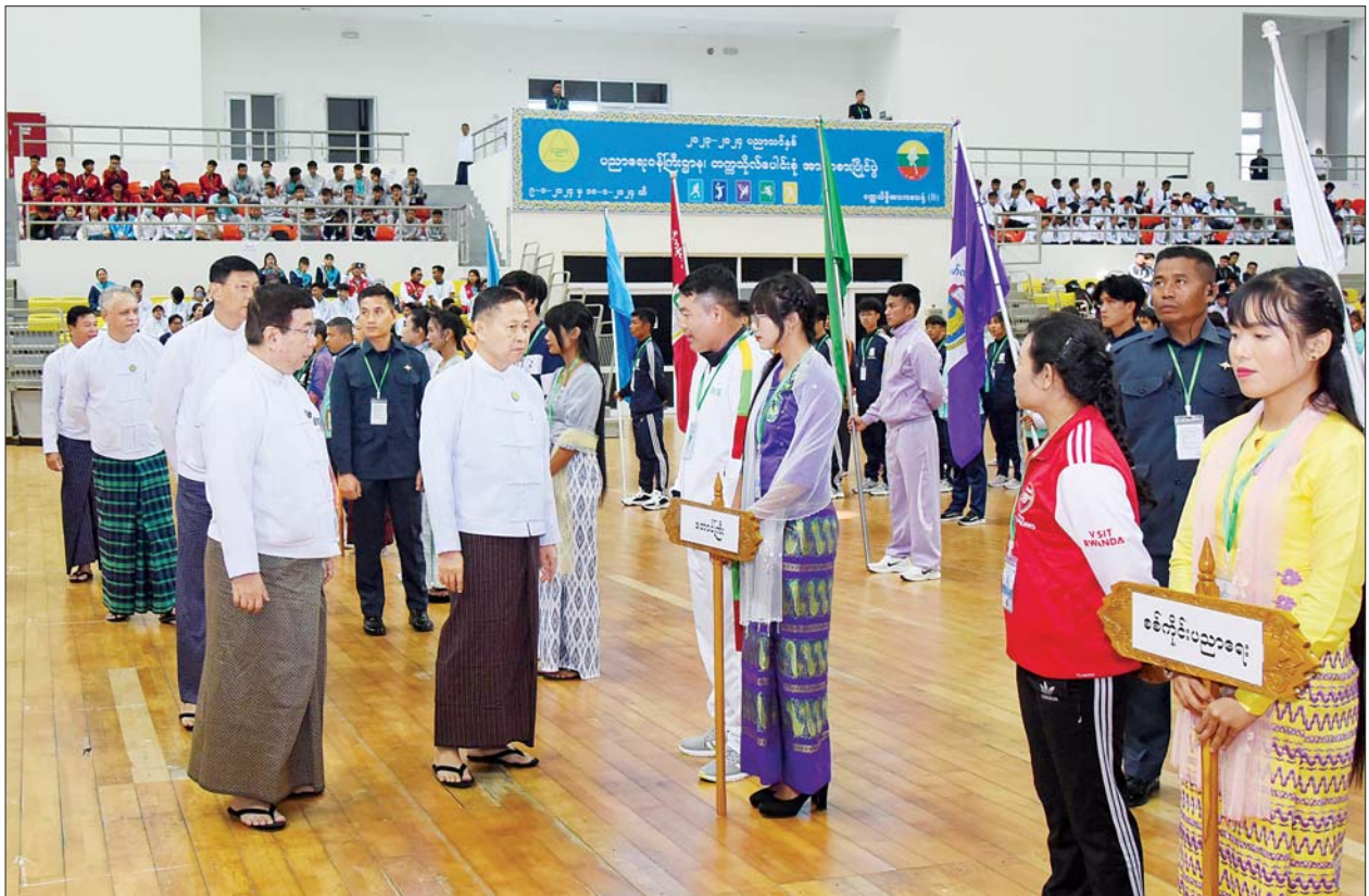
နိုင်ငံတော်စီမံအုပ်ချုပ်ရေးကောင်စီဒုတိယဥက္ကဋ္ဌ ဒုတိယဝန်ကြီးချုပ် ဒုတိယဗိုလ်ချုပ်မှူးကြီးစိုးဝင်း ပြိုင်ပွဲဝင်အသင်းများမှ အသင်း အုပ်ချုပ်သူ/နည်းပြများနှင့် အားကစားသမားများကို ရင်းရင်းနှီးနှီးလိုက်လံနှုတ်ဆက်စဉ်။

ရန်ကုန်တက္ကသိုလ် ဘောလုံး အသင်းသည် ၁၉၆၅၊ ၁၉၆၆ နှင့် ၁၉၆၇ ခုနှစ်များတွင်လည်း မြန်မာ နိုင်ငံဘောလုံးအဖွဲ့ချုပ်က ကျင်းပ သည့် ရှုံးထွက်ဖလားပတ်လည်ခိုင်း နှင့် ကွင်းဖွင့်ဖလားပြိုင်ပွဲများတွင် သုံးနှစ်ဆက်တိုက် ပထမဆု ရရှိခဲ့ ဖူးပါကြောင်း၊ ရန်ကုန်တက္ကသိုလ် ၏ ကျောင်းတွင်းအားကစားပြိုင်ပွဲ စာမျက်နှာ ၅ သို့