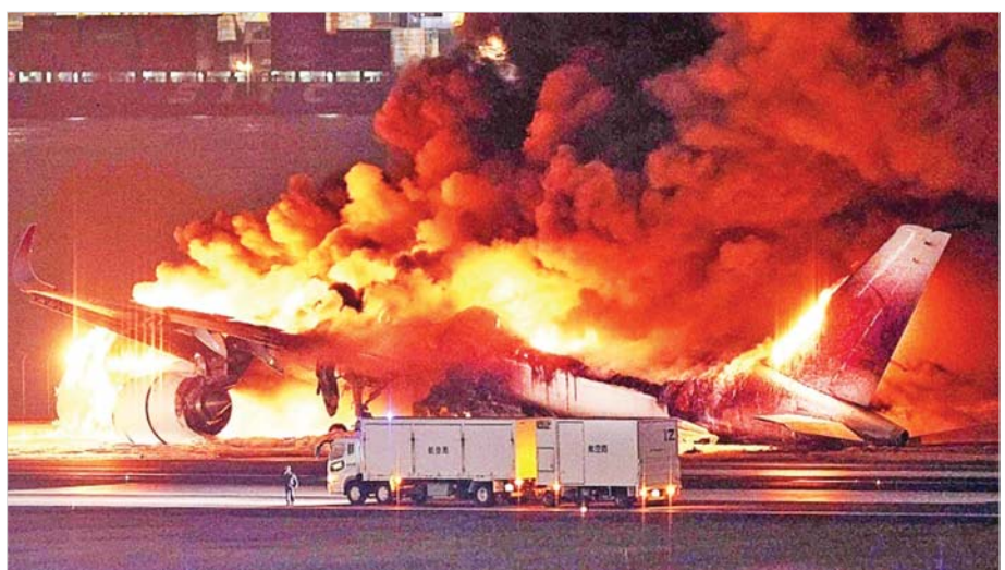
တိုကျိုမြို့၊ လေဆိပ်တွင် ဇန်နဝါရီလ ၂ ရက်နေ့က ဂျပန်လေကြောင်းလိုင်း ခရီးသည်တင်လေယာဉ်နှင့် ဂျပန်ကမ်းခြေစောင့်တပ်ဖွဲ့ပိုင်လေယာဉ်တို့ တိုက်မိပြီးနောက် ခရီးသည်တင်လေယာဉ် မီးစွဲလောင်နေစဉ်။