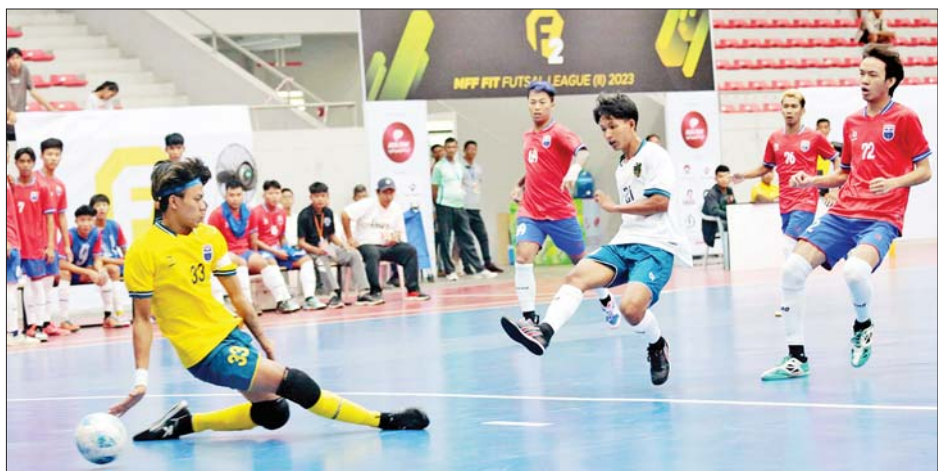
M-Million အသင်းနှင့် Maryar အသင်းတို့ ယှဉ်ပြိုင်ကစားကြစဉ်။