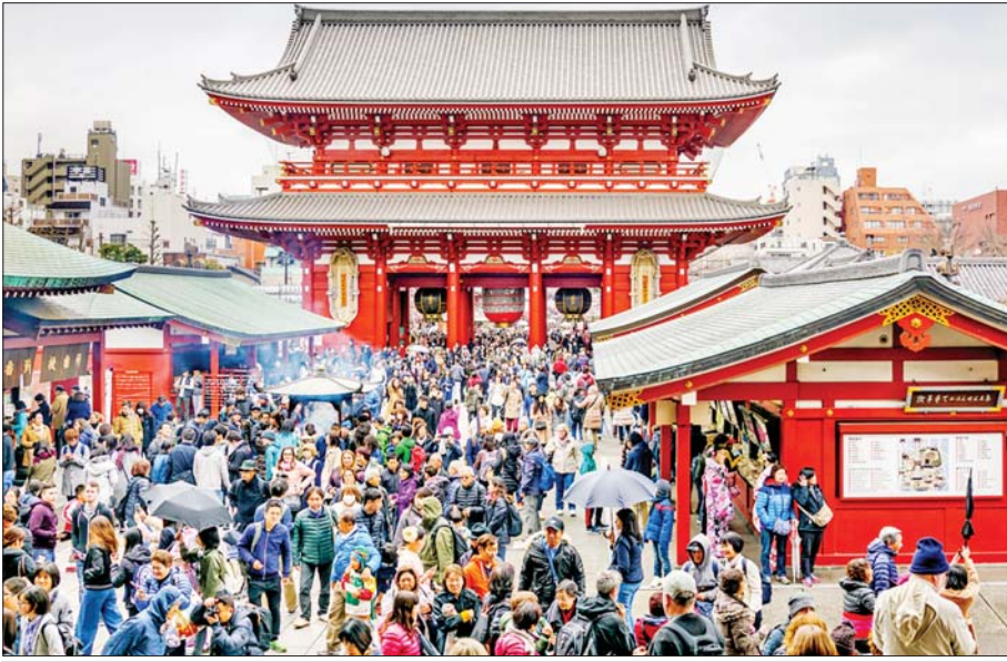
နှစ်စဉ် ဇန်နဝါရီလ ၁ ရက်နေ့သည် ဂျပန်လူမျိုးများ ဘုရားကျောင်းများသို့ သွားရောက်ဝတ်ပြုဆုတောင်း ကြသည့်နေ့ ဖြစ်သည်။

အင်အားပြင်းမြေငလျင်ကြီး အဲဒီဖြစ်စဉ်ကတော့ ၂၀၂၄ ခုနှစ် ဇန်နဝါရီလ ၁ ရက်နေ့ ညနေပိုင်း ဂျပန်စံတော်ချိန် ၁၆:၁၀ နာရီမှာ ဂျပန်နိုင်ငံအနောက်ဘက် ဂျပန်ပင်လယ်ပြင်ကို မျက်နှာမူနေတဲ့ အိရှိကာဝါပြည်နယ် (Ishikawa Prefecture) မှာရှိတဲ့ နိုတိုကျွန်းဆွယ် (Noto Peninsula) ကို ဗဟိုပြုပြီး အင်အားပြင်းထန်တဲ့ ရစ်ချ်တာစကေး အဆင့် ၆ ဒသမ ၇ ရှိ မြေငလျင်ကြီး လှုပ်ခတ်ခဲ့ခြင်း ဖြစ်ပါတယ်။ မြေငလျင်ရဲ့ ပြင်းအား ပမာဏ ကြီးမားတာကြောင့်လည်း ဂျပန်ပင်လယ်ပြင်ကို ဗဟိုပြုနေတဲ့ ကမ်းရိုးတန်းဒေသမှာ လှုပ်ခတ်ခဲ့တဲ့ ငလျင်ကြီးဖြစ်လို့ နောက်ဆက်တွဲ ဆူနာမီရေလှိုင်း ကြီးတွေ ဖြစ်ပေါ်လာနိုင်တာကြောင့် ဂျပန်မိုးလေဝသ အေဂျင်စီဟာ အိရှိကာဝါပြည်နယ်၊ နိုတိုဒေသ၊ ယာမာဂါတာ၊ နီဂါတာ၊ တိုးယာမ၊ ဖူကူအီ၊ ဟိုဂို ပြည်နယ်တွေအတွက် ဆူနာမီသတိပေးချက်တွေ ချက်ချင်းထုတ်ပြန်ခဲ့ရပါတယ်။ အဲဒီပြည်နယ်အတွင်းရှိ ကမ်းခြေနဲ့နီးစပ်တဲ့ဒေသတွေမှာ နေထိုင်နေကြတဲ့ ပြည်သူတွေအနေနဲ့ ကုန်းမြင့်ဒေသတွေဆီကို ပြောင်းရွှေ့နေထိုင်ကြဖို့လည်း သတိပေးချက်တွေ အဆက်မပြတ် ထုတ်လွှင့်ခဲ့ပါတယ်။