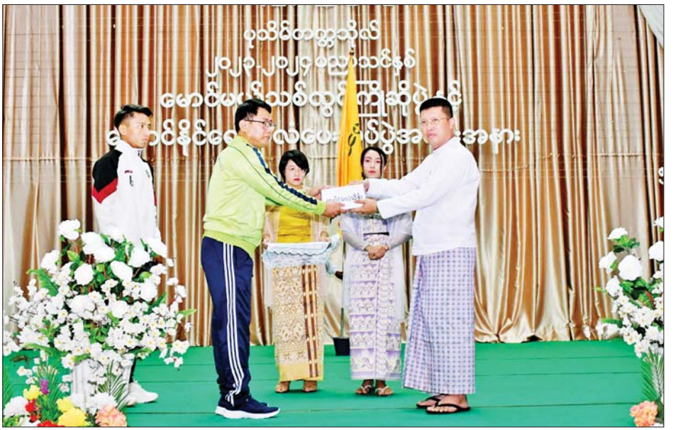
ပိုက်ကျော်ခြင်း၊ ပြေးခုန်ပစ်၊ စားပွဲတင်တင်းနစ် ဖြင့် ဝင်ရောက်ယှဉ်ပြိုင်ပွဲများမည်ဖြစ်ကြောင်း သိရအားကစားနည်း ငါးခုတွင် အားကစားနည်းအလိုက် သည်။ အုပ်ချုပ်၊ နည်းပြ၊ အားကစားသမား စုစုပေါင်း ၇၀ တိုင်းဒေသကြီး(ပြန်/ဆက်)

ဆက်လက်၍ ပုသိမ်တက္ကသိုလ် ပါမောက္ခချုပ်က မောင်မယ်သစ်လွင်များအား ကြိုဆိုနှုတ်ခွန်းဆက်စကားနှင့် တက္ကသိုလ်၊ ဒီဂရီကောလိပ်ပေါင်းစုံ အားကစားပြိုင်ပွဲ ဝင်ရောက်ယှဉ်ပြိုင်မည့် ပုသိမ်ဇုန်အသင်း ဖွဲ့စည်းထားရှိမှုနှင့် ပြိုင်ပွဲဝင်ရောက်မည့် အစီအစဉ်များအား ရှင်းလင်းတင်ပြသည်။ ထို့နောက် တိုင်းဒေသကြီးဝန်ကြီးချုပ်က ပြိုင်ပွဲဝင်အားကစားသမားများအား အောင်နိုင်ရေးအလံနှင့် ချီးမြှင့်ထောက်ပံ့ငွေများ ပေးအပ်ခဲ့သည်။ လေ့လာဆည်းပူးလျက်ရှိ ပုသိမ်တက္ကသိုလ်တွင် ၂၀၂၃-၂၀၂၄ ပညာသင်နှစ် ပထမနှစ်(၂၀၂၃-အောင်) သစ်လွင်မောင်မယ် ၄၀၉ ဦး တက်ရောက်ပညာလေ့လာဆည်းပူးလျက် ရှိပြီး ပုသိမ်ဇုန်အနေဖြင့် တက္ကသိုလ်၊ ဒီဂရီကောလိပ်ပေါင်းစုံ အားကစားပြိုင်ပွဲသို့ ဘောလုံး၊ ဘောလီဘော၊