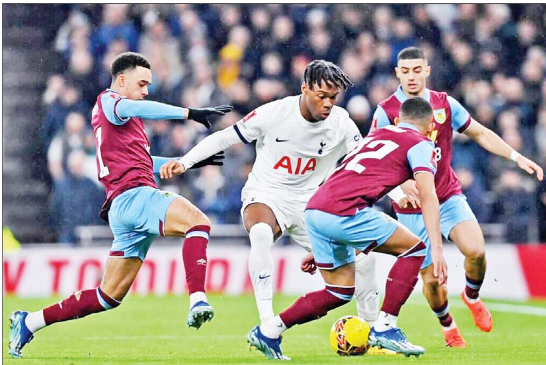
စပါးအသင်းနှင့် ဘန်လေအသင်းတို့ ယှဉ်ပြိုင်ကစားကြစဉ်။

(နိုင်ငံတော်စီမံ အုပ်ချုပ်ရေးကောင်စီဥက္ကဋ္ဌ နိုင်ငံတော်ဝန်ကြီးချုပ် ဗိုလ်ချုပ်မှူးကြီးမင်းအောင်လှိုင်၏ ၂၀၂၃ခုနှစ်၊ ဇူလိုင်လ ၂၈ ရက်နေ့တွင် ပြုလုပ်သော ၂၀၂၃ခုနှစ်၊ ဒုတိယအကြိမ် နိုင်ငံအဆင့် မိုးရာသီသစ်ပင်စိုက်ပျိုးပွဲအခမ်းအနားမှ အမှာစကား ကောက်နုတ်ချက်)