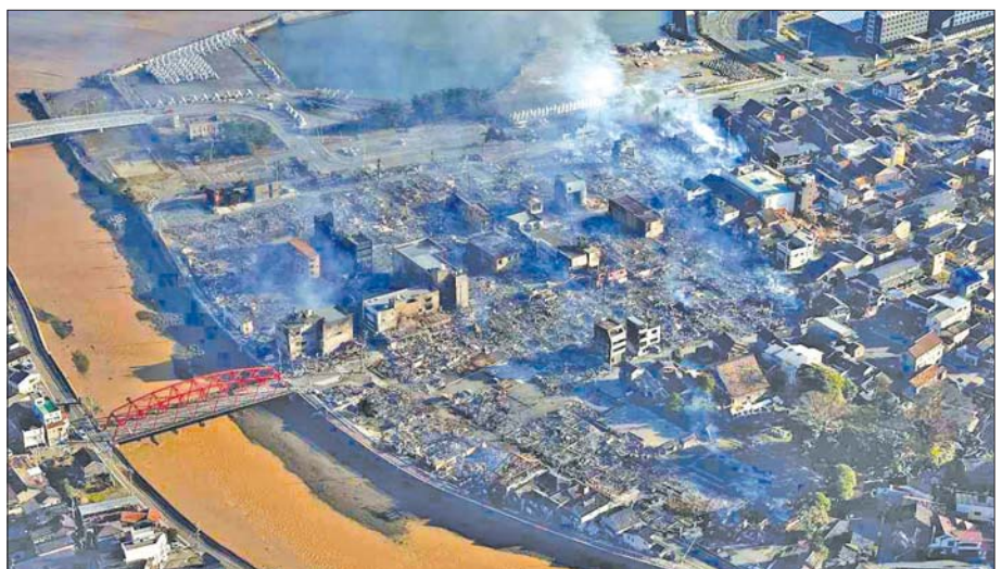
အိရှိကာဝါပြည်နယ် ဝါဂျီးမားမြို့တွင် မြေငလျင်ကြောင့် ဖြစ်ပွားခဲ့သည့် ပျက်စီးမှုများကို တွေ့ရစဉ်။

ဂျပန်နိုင်ငံဟာ ငလျင်ဒဏ်ကို မကြာခင်ကြုံတွေ့ခံစားရတာကြောင့် အရာရာတိုင်းကို စနစ်တကျတွက်ချက်ဆောင်ရွက်ထားတဲ့ နိုင်ငံတစ်နိုင်ငံဖြစ်ပါတယ်။ ငလျင်လှုပ်ပြိုဆိုတာနဲ့ အန္တရာယ်ရှိနိုင်မှုအနေအထားပေါ်မူတည်ပြီး မြန်နှုန်းမြင့်အရှိန်နဲ့ မောင်းနှင်နေတဲ့ကျည်ဆန်ရထားတွေ အလိုအလျောက်ရပ်တန့်သွားစေမယ့် အာရုံခံစနစ်တွေ၊ ပြည်သူလူထုကို ရုပ်မြင်သံကြား၊ ရေဒီယိုနဲ့ ရုပ်ကွက်အလိုက် အသိပေးနိုင်မယ့်စနစ်တွေ စီစဉ်ထားရှိပါတယ်။ အဆောက်အအုံတွေ ဆောက်လုပ်ရာမှာလည်း သတ်မှတ်ထားတဲ့ စံနှုန်းစံထားဆိုင်ရာဥပဒေ (The Building Standards Law) ကို ငလျင်ပြင်းအားပမာဏ ၆ (သို့မဟုတ်) ၇ အထိ ခံနိုင်ရည်ရှိရမယ့် ပြင်ဆင်ချက်ကို ၁၉၈၁ ခုနှစ်မှာ အတည်ပြုပြဋ္ဌာန်းခဲ့ပါတယ်။ ကလေးသူငယ်၊ ကျောင်းသူ ကျောင်းသားတွေ အပါအဝင် ပြည်သူလူထုကိုလည်း ငလျင်လှုပ်လာရင် ဆောင်ရာ၊ ရှောင်ရမယ့်အချက်တွေကိုလည်း အမြဲတမ်းအသိပေးလျက်ရှိသလို လေ့ကျင့်မှုတွေလည်း မကြာခင်ပြုလုပ်လေ့ရှိပါတယ်။ တစ်နည်းအားဖြင့် ငလျင်ကို ရင်ဆိုင်နိုင်အောင် စနစ်တကျပြင်ဆင်ထားတဲ့နိုင်ငံဖြစ်