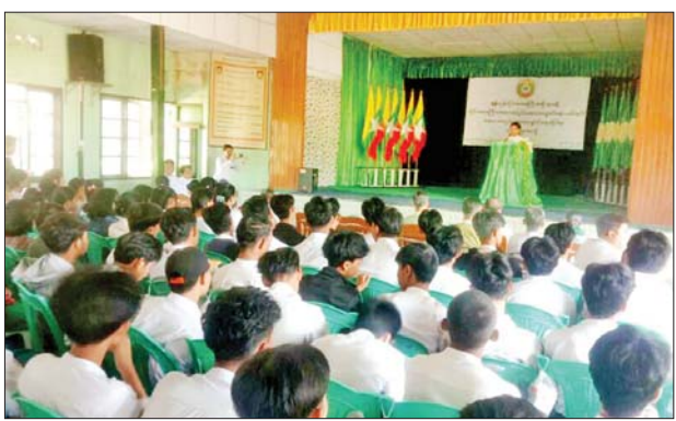
ဟောပြောပွဲတွင် ရန်ကုန်တိုင်းဒေသကြီး ကလေးအလုပ်သမား ပပျောက်ရေးဆိုင်ရာ ကော်မတီ

ရန်ကုန် ဇန်နဝါရီ ၆ ရန်ကုန်တိုင်းဒေသကြီးအစိုးရအဖွဲ့ တိုင်းဒေသကြီး ကလေးအလုပ်သမား ပပျောက်ရေးကော်မတီမှဦးဆောင်၍ ကလေးအလုပ်သမားပပျောက်ရေးဆိုင်ရာ အသိပညာပေးဆွေးနွေးဟောပြောပွဲကို ဇန်နဝါရီ ၃ ရက်က ရွှေပြည်သာ အမှတ်(၁)အခြေခံပညာ အထက်တန်းကျောင်း ရွှေပြည်သာကန်ခန်းမ၌ ကျင်းပသည်။ အသိပညာပေး ဆွေးနွေး