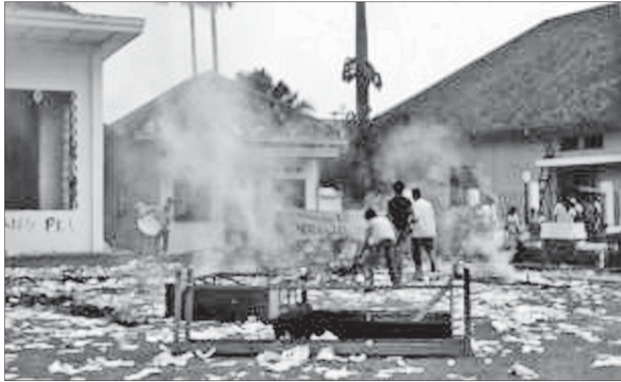
အင်ဒိုနီးရှားနိုင်ငံ၌ ၁၉၆၅ ခုနှစ်နောက်ပိုင်း ဗိုလ်ချုပ်ကြီး ဆူဟာတိုအာဏာသိမ်းပြီးနောက် ကွန်မြူနစ်လူငယ်အဖွဲ့ဌာနချုပ်ကို မီးရှို့ဖျက်ဆီးစဉ်။

ကိုယ့်မျက်ချေးကျတော့မမြင်၊ သူများမျက်ချေးသာ မြင်တတ်သူက လောကမှာ အများသား။ ဘယ်သူမှအပြစ်မကင်းတဲ့ လောကကြီးမှာ အခြားသူအပြစ်တော့ ရဲရဲတောက်မြင်တတ်ပြီး ကိုယ့်အပြစ်တော့ မမြင်နိုင်တဲ့ နိုင်ငံများစွာရှိပါတယ်။ အင်ဒိုနီးရှားနိုင်ငံ အပါအဝင်ပေါ့။ လွန်ခဲ့တဲ့လကပဲ သူများနိုင်ငံပြည်တွင်းရေး ဘာမဆိုင်ညာမဆိုင် မြောင်ဝင်စွက်ဖက်တဲ့ အရှေ့တီမောဆိုတဲ့နိုင်ငံက ဟိုဆေးရာမိုစ်ဟော်တာဆိုတဲ့လူကို ပြင်းပြင်းထန်ထန်တုံ့ပြန်ခဲ့ရပါသေးတယ်။ အခုတစ်ဖန်လာပြန်ပါပြီ။ အင်ဒိုနီးရှားအောက်လွှတ်တော်က ပါလီမန်များ ပူးပေါင်းဆောင်ရွက်ရေးအေဂျင်စီ BKSAP မှ လက်ထောက်ဥက္ကဋ္ဌ အာမတ် ဟာဖစ် တိုဟီဆိုသူရဲ့ ပြောကြားချက်များအပေါ် ပြန်လည်တုံ့ပြန်မှတ်ချက်ပေးရန် ဖြစ်ပါတယ်။