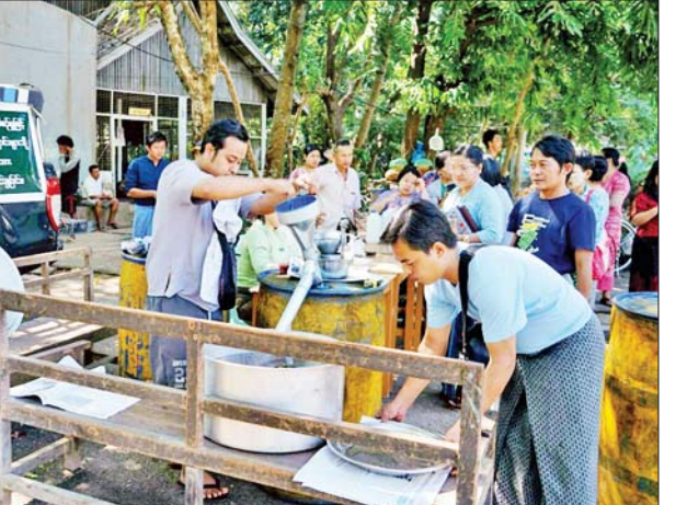
ငွေကျပ် ၅၂၀၀ ဖြင့် ဈေးနှုန်းသက်သာစွာ ရောင်းချပေးခဲ့ကြောင်း သိရသည်။