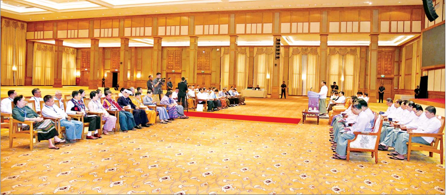
နိုင်ငံတော်စီမံအုပ်ချုပ်ရေးကောင်စီဥက္ကဋ္ဌ နိုင်ငံတော်ဝန်ကြီးချုပ် ဗိုလ်ချုပ်မှူးကြီးမင်းအောင်လှိုင် မှတ်ပုံတင်ခွင့်ပြုပြီး နိုင်ငံရေးပါတီများမှ တာဝန်ရှိသူများနှင့် ရင်းရင်းနှီးနှီး တွေ့ဆုံဆွေးနွေးစဉ်။