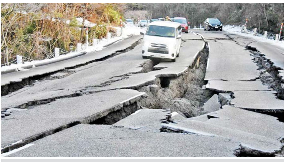
မြေငလျင်ကြောင့် မော်တော်ကားလမ်း ပျက်စီးမှုများကို တွေ့ရစဉ်။ (ကားလမ်းပျက်စီးမှုကြောင့် ကယ်ဆယ်ရေးလုပ်ငန်းများအတွက် အနှောင့်အယှက်ဖြစ်စေခဲ့သည်)