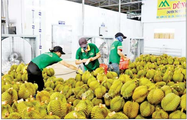
၃ ဒသမ ၅ ဘီလီယံအထိ ရှိလာနိုင်ကြောင်း ဗီယက်နမ်နိုင်ငံ သစ်သီးဝလံနှင့် ဟင်းသီးဟင်းရွက်များ အသင်းအထွေထွေအတွင်းရေးမှူး ဒန်ဖက်ငုယင်က ပြောကြားခဲ့သည်။

ဟနွိုင်း ဇန်နဝါရီ ၅ ဗီယက်နမ်နိုင်ငံသည် ၂၀၂၃ ခုနှစ်တွင် ခူးရင်းသီးတင်ပို့မှုမှ အမေရိကန်ဒေါ်လာ ၂ ဘီလီယံကျော်ရရှိကာ နှစ်စဉ်ဝင်ငွေထက် ငါးဆကျော်ရရှိပြီးနောက် ယခုနှစ်တွင် ဝင်ငွေ အမေရိကန်ဒေါ်လာ ၃ ဒသမ ၅ ဘီလီယံအထိ ရှိလာရန် မျှော်မှန်းထားကြောင်း ဗီယက်နမ်နိုင်ငံ စိုက်ပျိုးရေးနှင့် ကျေးလက်ဖွံ့ဖြိုးရေးဝန်ကြီးဌာန၏ ပြောကြားချက်ကို ကိုးကား၍ ပြည်တွင်းမီဒီယာများက ဇန်နဝါရီ ၅ ရက်တွင် သတင်းဖော်ပြခဲ့သည်။