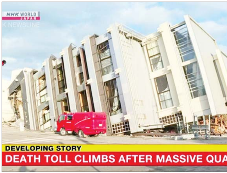
DEVELOPING STORY DEATH TOLL CLIMBS AFTER MASSIVE QUA

တိုကျို ဇန်နဝါရီ ၅ ဂျပန်နိုင်ငံအလယ်ပိုင်း အိရီကာဝါစီရင်စု၌ ပြင်းအား ရစ်ချိတာစကေး ၇ ဒသမ ၆ ရှိ ငလျင်လှုပ်ခတ်ပြီးနောက် သေဆုံးသူ ၈၄ ဦးရှိကြောင်း တာဝန်ရှိသူများက ပြောကြားသည်။