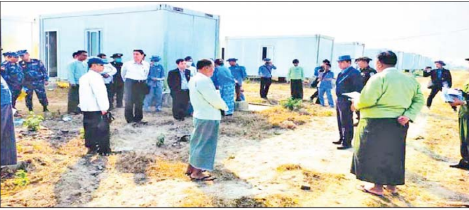
အာဆီယံနိုင်ငံများနှင့် အိမ်နီးချင်းနိုင်ငံသံရုံးများမှ သံရုံးအကြီးအကဲများ၊ AHA Center တို့မှ ကိုယ်စားလှယ်များပါဝင်သည့်အဖွဲ့ နေရပ်စွန့်ခွာသူများပြန်လည်လက်ခံရေးစခန်းများ ပြင်ဆင်ဆောင်ရွက်မှုများကို သွားရောက်လေ့လာကြစဉ်။

ဘင်္ဂါလီတွေဟာ နိုင်ငံသားမဟုတ်လို့ တိုင်းရင်းသားမဟုတ်လို့ ခွဲခြားဆက်ဆံမှုရှိသလား မေးရင် မရှိပါဘူးလို့ပဲ လိုတိုရှင်းရှင်းဖြေရာမှာဖြစ်ပါတယ်။ တိုင်းရင်းသားဆိုတာ ဖန်တီးယူလို့ရတဲ့အရာမျိုးလည်း မဟုတ်ပါဘူး။ နိုင်ငံသားဆိုတာကတော့ သတ်မှတ်ချက်တွေနဲ့ ကိုက်ညီရင်မှ ဖြစ်ပါတယ်။ နိုင်ငံတိုင်းမှာလည်း နိုင်ငံသားဖြစ်ဖို့ဆိုတာ လွယ်လွယ်နဲ့ ရတတ်တာမျိုးမဟုတ်ပါဘူး။ မြန်မာနိုင်ငံမှာလည်း ၁၉၈၂ ခုနှစ်၊ မြန်မာနိုင်ငံသားဥပဒေဆိုတာရှိပြီးဖြစ်ပါတယ်။ ဒီဥပဒေမှာ နိုင်ငံသား၊ ဧည့်နိုင်ငံသား၊ နိုင်ငံသားပြုခွင့်ရသူ၊ နိုင်ငံခြားသားဆိုပြီး ဖော်ပြထားတာရှိပါတယ်။ ဘင်္ဂါလီတွေထဲကလည်း သတ်မှတ်ချက်နဲ့ ကိုက်ညီသူတွေဟာ နိုင်ငံသားပြုခွင့်ရနိုင်တာ ဖြစ်ပါတယ်။ မကြာသေးခင်ကပဲ ရခိုင်ပြည်နယ်မှာ အင်အားပြင်းဆိုင်ကလုန်းမုန်တိုင်း တိုက်ခတ်ခဲ့ပါတယ်။ ကြိုတင်ပြင်ဆင်မှုကောင်းတဲ့အတွက် အသေအပျောက်နည်းခဲ့ပေမယ့် အပျက်အစီးကတော့များပါတယ်။ ဒီအတွက်လည်း မြန်မာအစိုးရက တိုင်းရင်းသားရယ်၊ ဘင်္ဂါလီရယ် ခွဲခြားမှုမရှိဘဲ တစ်ပြေးညီ ထောက်ပံ့ကူညီခဲ့တာ ဖြစ်ပါတယ်။ ထိုခိုက်ခံရသူအားလုံးရဲ့ ပြန်လည်ထူထောင်ရေးအတွက် တပ်မတော်အရာရှိကြီးတွေကိုယ်တိုင် အနီးကပ်ကွပ်ကဲပြီး အင်တိုက်အားတိုက် ကူညီဆောင်ရွက်ပေးခဲ့တာ ဖြစ်ပါတယ်။