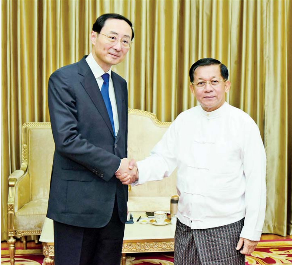
နိုင်ငံတော်စီမံအုပ်ချုပ်ရေးကောင်စီဥက္ကဋ္ဌ နိုင်ငံတော်ဝန်ကြီးချုပ် ဗိုလ်ချုပ်မှူးကြီးမင်းအောင်လှိုင် တရုတ်နိုင်ငံ နိုင်ငံခြားရေးဝန်ကြီးဌာန ဒုတိယဝန်ကြီး Mr. Sun Weidong အား ရင်းနှီးနှီးနှူတ်ဆက်စဉ်။

နှစ်နိုင်ငံ ပြည်သူများအကျိုးစီးပွားအတွက် ရှိရင်းစွဲ ပူးပေါင်းဆောင်ရွက်မှု ဆက်ဆံရေးအား ပိုမိုတိုးတက် ခိုင်မာစေရေးအတွက် အတူတကွလက်တွဲဆောင်ရွက်သွားရန် မိမိတို့၏ စိတ်အားထက်သန်မှုကို ထပ်လောင်းအတည်ပြုပြောကြားလိုပါသည်။