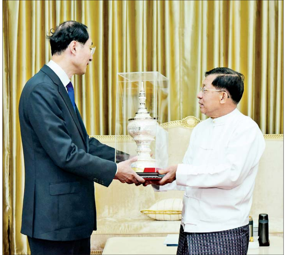
နိုင်ငံတော်စီမံအုပ်ချုပ်ရေးကောင်စီဥက္ကဋ္ဌ နိုင်ငံတော်ဝန်ကြီးချုပ် ဗိုလ်ချုပ်မှူးကြီးမင်းအောင်လှိုင် တရုတ်နိုင်ငံ နိုင်ငံခြားရေးဝန်ကြီးဌာန ဒုတိယဝန်ကြီး Mr. Sun Weidong အား အမှတ်တရလက်ဆောင် ပစ္စည်းပေးအပ်စဉ်။

ရှေ့ပုံးမှ အဆိုပါတွေ့ဆုံပွဲသို့ နိုင်ငံတော် စီမံအုပ်ချုပ်ရေးကောင်စီဥက္ကဋ္ဌ နိုင်ငံတော် ဝန်ကြီးချုပ်နှင့်အတူ တွဲဖက်အတွင်းရေးမှူး ဒုတိယဗိုလ်ချုပ်ကြီး ရဲဝင်းဦး၊ ပြည်ထဲရေး ဝန်ကြီးဌာန ပြည်ထောင်စုဝန်ကြီး ဒုတိယ ဗိုလ်ချုပ်ကြီး ရာပြည့်၊ နိုင်ငံခြားရေးဝန်ကြီး ဌာန ပြည်ထောင်စုဝန်ကြီး ဦးသန်းဆွေနှင့် တာဝန်ရှိသူများ တက်ရောက်ကြသည်။ ထိုသို့တွေ့ဆုံရာတွင် နှစ်နိုင်ငံ ဆွေးနွေး ပေါက်ဖော် ရင်းနှီးချစ်ကြည်စွာ ပူးပေါင်း ဆောင်ရွက်လျက်ရှိသည့် အခြေအနေများ၊ နှစ်နိုင်ငံ ပူးပေါင်းဆောင်ရွက်မှုများ ဆက်လက်တိုးမြှင့်ဆောင်ရွက်သွားမည့် ကိစ္စရပ်များ၊ နှစ်နိုင်ငံ နယ်စပ်ဒေသ တည်ငြိမ်အေးချမ်းရေးအတွက် ဆောင်ရွက် လျက်ရှိမှုနှင့် ဆက်လက်ဆောင်ရွက်မည့် ကိစ္စရပ်များနှင့် ပတ်သက်၍ ရင်းနှီး ပွင့်လင်းစွာ အမြင်ချင်းဖလှယ်ဆွေးနွေး ခဲ့ကြသည်။ တွေ့ဆုံပွဲအပြီးတွင် နိုင်ငံတော် စီမံအုပ်ချုပ်ရေးကောင်စီဥက္ကဋ္ဌ နိုင်ငံတော် ဝန်ကြီးချုပ်နှင့် တရုတ်နိုင်ငံ နိုင်ငံခြားရေး ဝန်ကြီးဌာန ဒုတိယဝန်ကြီး Mr. Sun Weidong တို့သည် အမှတ်တရလက်ဆောင် ပစ္စည်းများ အပြန်အလှန်ပေးအပ်ကြပြီး မှတ်တမ်းတင်ဓာတ်ပုံရိုက်ခဲ့ကြကြောင်း သိရသည်။ သတင်းစဉ်