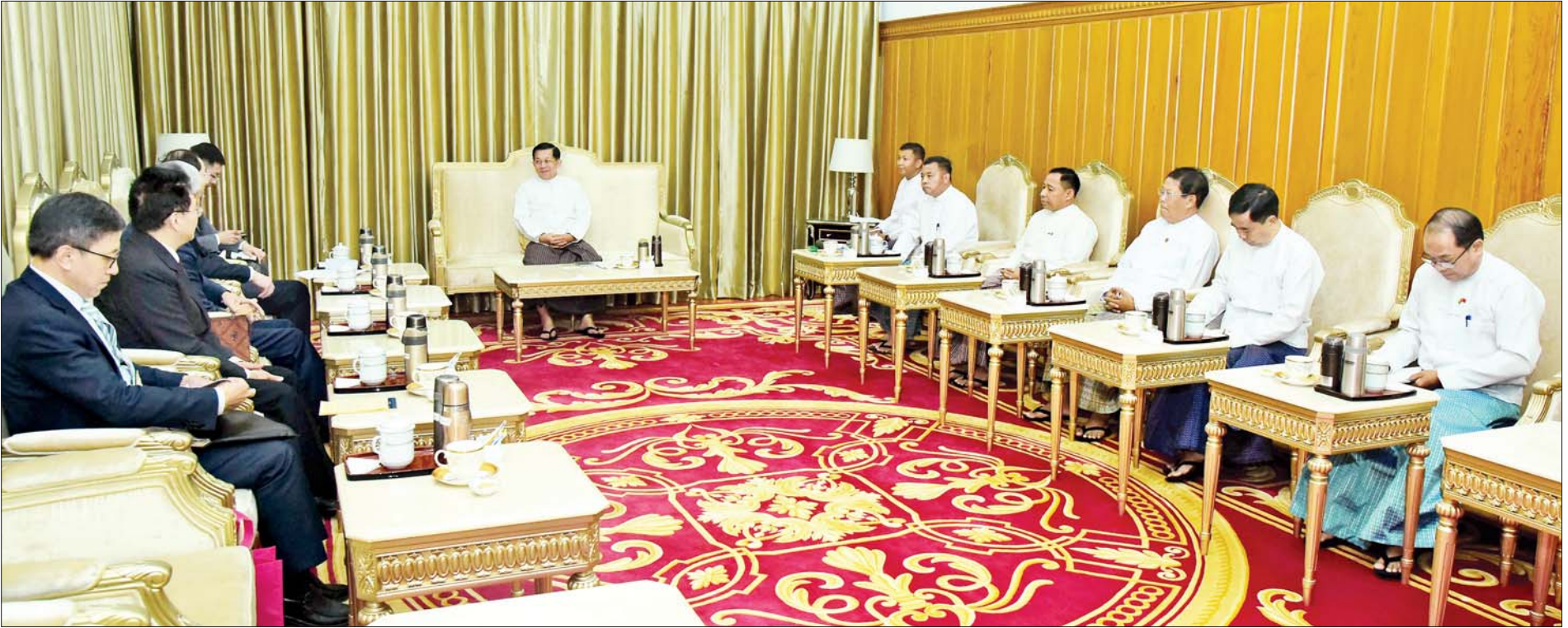
နိုင်ငံတော်စီမံအုပ်ချုပ်ရေးကောင်စီဥက္ကဋ္ဌ နိုင်ငံတော်ဝန်ကြီးချုပ် ဗိုလ်ချုပ်မှူးကြီးမင်းအောင်လှိုင် တရုတ်နိုင်ငံ နိုင်ငံခြားရေးဝန်ကြီးဌာန ဒုတိယဝန်ကြီး Mr. Sun Weidong အား လက်ခံတွေ့ဆုံစဉ်။