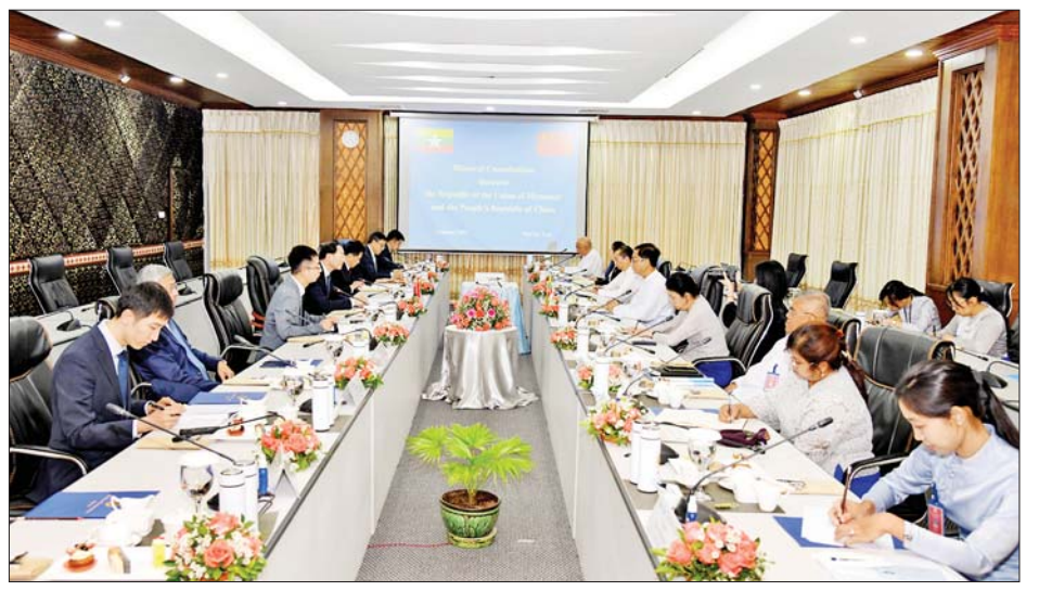
သမ္မတနိုင်ငံ နိုင်ငံခြားရေးဝန်ကြီးဌာန ဒုတိယဝန်ကြီး ဦးဆောင်သည့် တရုတ်ကိုယ်စားလှယ်အဖွဲ့အား မြတ်တော်ဝင်ဟိုတယ်၌ နေ့လယ်စာဖြင့် တည်ခင်း ဧည့်ခံခဲ့ကြောင်း သိရသည်။

နေပြည်တော် ဇန်နဝါရီ ၅ ပြည်ထောင်စုသမ္မတ မြန်မာနိုင်ငံတော် နိုင်ငံခြားရေးဝန်ကြီးဌာန ဒုတိယဝန်ကြီး ဦးလွင်ဦး သည် တရုတ်ပြည်သူ့သမ္မတနိုင်ငံ နိုင်ငံခြားရေး ဝန်ကြီးဌာန ဒုတိယဝန်ကြီး Mr. Sun Weidong နှင့် မြန်မာ-တရုတ် နှစ်နိုင်ငံဆွေးနွေးပွဲကို ယနေ့ ညနေ ၄ နာရီခွဲတွင် နိုင်ငံခြားရေးဝန်ကြီးဌာန နေပြည်တော်၌ ကျင်းပသည်။ အမြင်ချင်းဖလှယ်ဆွေးနွေး အဆိုပါ နှစ်နိုင်ငံဆွေးနွေးပွဲတွင် မြန်မာ-တရုတ် နှစ်နိုင်ငံအကြား ရှိရင်းစွဲ ဆွေးနွေးပေါက်ဖော်ဆက်ဆံ ရေးကို ပိုမိုခိုင်မာလာစေရေး၊ မြန်မာ-တရုတ် နှစ်နိုင်ငံ ပူးပေါင်းဆောင်ရွက်မှု စီမံကိန်းများကို ဆက်လက် အကောင်အထည်ဖော်ရေး၊ မြန်မာ-တရုတ် စီးပွားရေး စင်္ကြံနှင့် ရပ်ဝန်းနှင့်ပိုမိုလမ်းမအောက်မှ စီမံကိန်းများ အရှိန်အဟုန်မြှင့်တင် ဆောင်ရွက်သွားရေး၊ နှစ်နိုင်ငံ နယ်စပ်ဒေသ တည်ငြိမ်အေးချမ်းရေးအတွက် ဆက်လက်ပူးပေါင်းဆောင်ရွက်သွားရေး၊ အာဆီယံ နှင့် မဲခေါင်-လန်ချန်း ပူးပေါင်းဆောင်ရွက်မှု ဒေသ ဆိုင်ရာ ယန္တရားမူဘောင်အောက်တို့မှ ပူးပေါင်း ဆောင်ရွက်မှုများ ဆက်လက်မြှင့်တင်သွားရေး ကိစ္စရပ်များနှင့် ဒေသတွင်းနှင့် နိုင်ငံတကာမျက်နှာစာ များတွင် နှစ်နိုင်ငံအပြန်အလှန် ထောက်ခံရပ်တည် သွားရေးနှင့် အကျိုးတူကိစ္စရပ်များနှင့် စပ်လျဉ်း၍ ရင်းနှီးပွင့်လင်းစွာ အမြင်ချင်းဖလှယ် ဆွေးနွေး ခဲ့သည်။ မွန်းလွဲပိုင်းတွင် နိုင်ငံခြားရေးဝန်ကြီးဌာန ဒုတိယဝန်ကြီး ဦးကျော်မျိုးထွဋ်သည် တရုတ်ပြည်သူ့