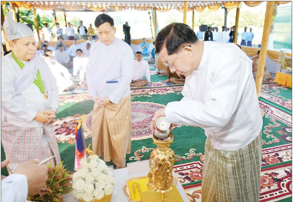
နိုင်ငံတော်စီမံအုပ်ချုပ်ရေးကောင်စီဥက္ကဋ္ဌ နိုင်ငံတော်ဝန်ကြီးချုပ် ဗိုလ်ချုပ်မှူးကြီး မင်းအောင်လှိုင် ရတနာစိန်ဖူးတော်မြတ်အတွင်းသို့ ဌာပနာတော်များ ထည့်သွင်းပူဇော်စဉ်။