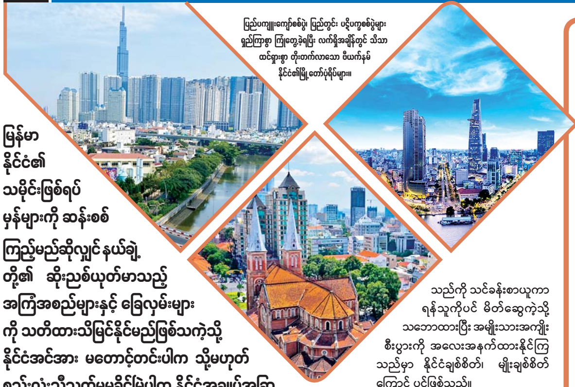
ပြည်ပကျူးကျော်စစ်ပွဲ၊ ပြည်တွင်း ပဋိပက္ခစစ်ပွဲများ ရှည်ကြာစွာ ကြုံတွေ့ခဲ့ရပြီး လက်ရှိအချိန်တွင် သိသာ ထင်ရှားစွာ တိုးတက်လာသော ဗီယက်နမ် နိုင်ငံ၏မြို့တော်ပုံရိပ်များ။

မြန်မာ နိုင်ငံ၏ သမိုင်းဖြစ်ရပ် မှန်များကို ဆန်းစစ်