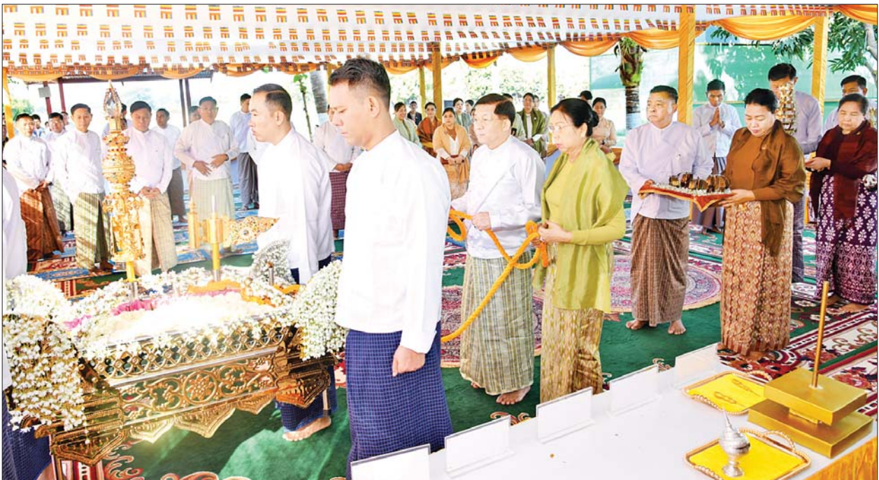
နိုင်ငံတော်စီမံအုပ်ချုပ်ရေးကောင်စီဥက္ကဋ္ဌ နိုင်ငံတော်ဝန်ကြီးချုပ် ဗိုလ်ချုပ်မှူးကြီး မင်းအောင်လှိုင်နှင့် ဇနီးဒေါ်ကြူကြူလှ ရွှေထီးတော်၊ ငှက်မြတ်နားတော်၊ ရတနာစိန်ဖူးတော်တို့ကို မင်္ဂလာဝေါယာဉ်တော်ဖြင့် ပင့်ဆောင်၍ စေတီတော်မြတ်ကြီးအား လက်ယာရစ်လှည့်လည် ပူဇော်ကြစဉ်။

ယင်းနောက် နိုင်ငံတော်စီမံ အုပ်ချုပ်ရေးကောင်စီဥက္ကဋ္ဌ နိုင်ငံ တော်ဝန်ကြီးချုပ်နှင့် ဇနီး၊ အဖွဲ့ ဝင်များသည် ပါဠိဆရာတော်ကြီး ထံမှ အနုမောဒနာတရား နာယူ၍