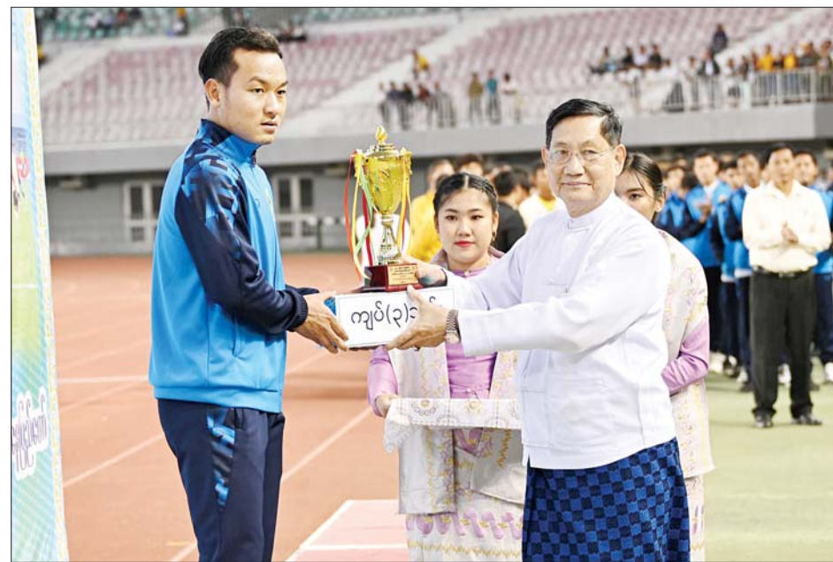
နိုင်ငံတော်စီမံအုပ်ချုပ်ရေးကောင်စီအဖွဲ့ဝင် ဒေါက်တာဘရွှေ အကောင်းဆုံးအားကစားသမားဆု ရရှိသူတစ်ဦးအား ဂုဏ်ပြုဆုနှင့် ချီးမြှင့်ငွေများ ပေးအပ်ချီးမြှင့်စဉ်။