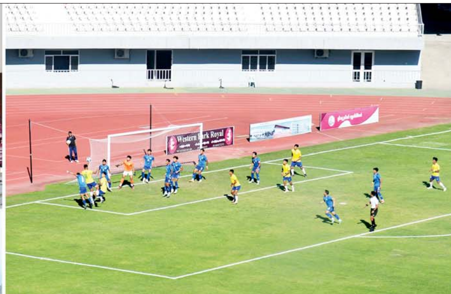
နိုင်ငံတော်စီမံအုပ်ချုပ်ရေးကောင်စီဥက္ကဋ္ဌ နိုင်ငံတော်ဝန်ကြီးချုပ် ဗိုလ်ချုပ်မှူးကြီး မင်းအောင်လှိုင် (၇၆)နှစ်မြောက် လွတ်လပ်ရေးနေ့အထိမ်းအမှတ် ဝန်ကြီးဌာနပေါင်းစုံ ဘောလုံးပြိုင်ပွဲ(အမျိုးသား)ဗိုလ်လုပွဲကို ကြည့်ရှုအားပေးစဉ်။

ဝ (၇၆)နှစ်မြောက်မှ မြန်မာနိုင်ငံ ဘောလုံးအဖွဲ့ချုပ်မှ တာဝန်ရှိသူများ၊ အားကစား ဝါသနာရှင်ပြည်သူများတက်ရောက် ကြည့်ရှုအားပေးကြသည်။ အကြိတ်အနယ်ယှဉ်ပြိုင် (၇၆)နှစ်မြောက် လွတ်လပ်ရေး နေ့အထိမ်းအမှတ် ဝန်ကြီးဌာန ပေါင်းစုံဘောလုံးပြိုင်ပွဲ(အမျိုးသား) ဗိုလ်လုပွဲတွင် စီမံကိန်းနှင့် ဘဏ္ဍာရေးဝန်ကြီးဌာန အသင်းနှင့်