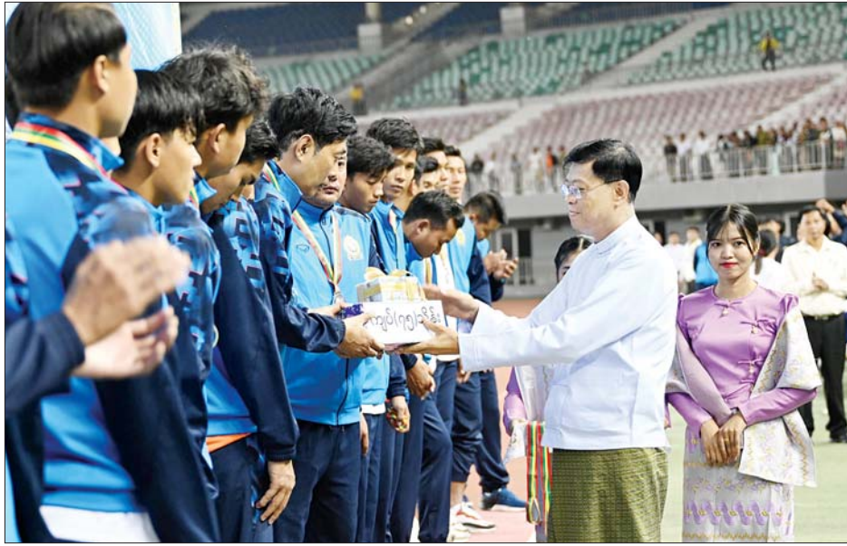
နိုင်ငံတော်စီမံအုပ်ချုပ်ရေးကောင်စီအဖွဲ့ဝင် ဗိုလ်ချုပ်ကြီး မြထွန်းဦး ဒုတိယဆုရရှိသည့် စီမံကိန်းနှင့် ဘဏ္ဍာရေးဝန်ကြီးဌာနအသင်းအား ဂုဏ်ပြုဆုနှင့် ချီးမြှင့်ငွေများ ပေးအပ်ချီးမြှင့်စဉ်။

ညိုစောကလည်းကောင်း၊ တတိယ ဆုရရှိသည့် ပြည်ထဲရေးဝန်ကြီး ဌာနအသင်းအား ကောင်စီဝင် ဒုတိယဗိုလ်ချုပ်ကြီး ရာပြည့်က လည်းကောင်း၊ ဒုတိယဆုရရှိသည့် စီမံကိန်းနှင့် ဘဏ္ဍာရေးဝန်ကြီး ဌာနအသင်းအား ကောင်စီဝင် ဗိုလ်ချုပ်ကြီး မြထွန်းဦးကလည်း ကောင်း တစ်ဦးချင်းဆုတံဆိပ်၊ ဂုဏ်ပြုဆုနှင့် ချီးမြှင့်ငွေများကို အသီးသီးပေးအပ်ချီးမြှင့်ကြသည်။