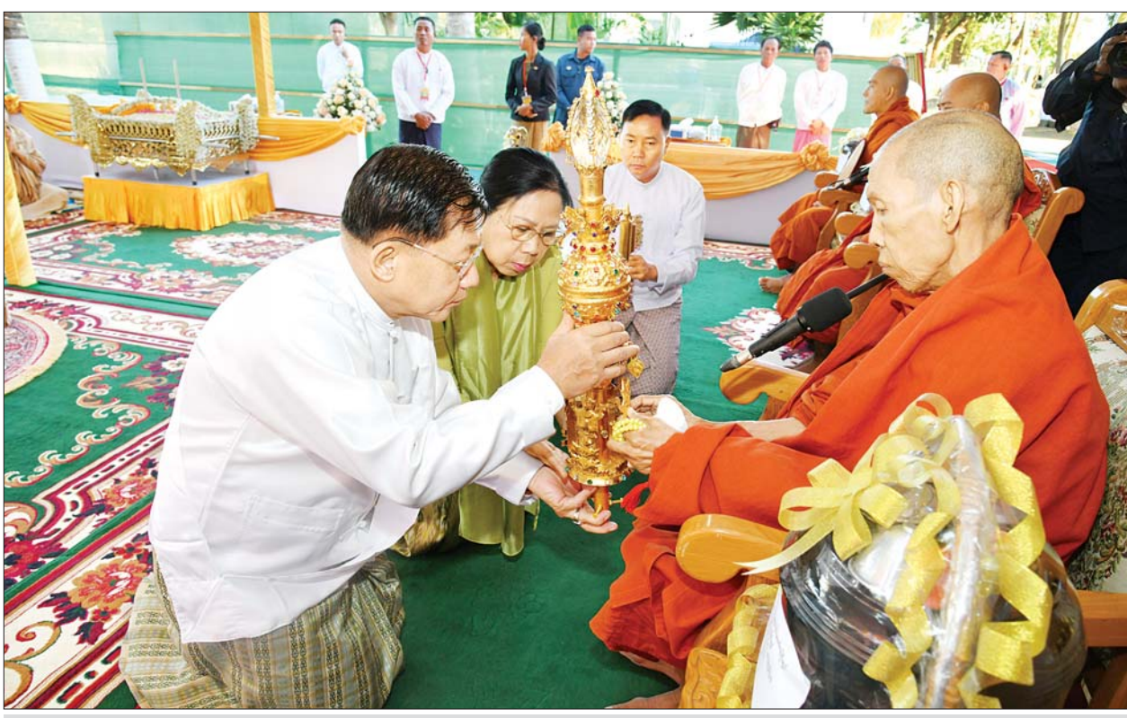
နိုင်ငံတော်စီမံအုပ်ချုပ်ရေးကောင်စီဥက္ကဋ္ဌ နိုင်ငံတော်ဝန်ကြီးချုပ် ဗိုလ်ချုပ်မှူးကြီး မင်းအောင်လှိုင်နှင့် ဇနီးဒေါ်ကြူကြူလှ ပါဠိဆရာတော် ကြီးထံ ရတနာစိန်ဖူးတော်ကို သာယာထွက်ကဒါနမြောက် ဆက်ကပ်ပူဇော်ကြစဉ်။

ပြည်ထောင်စုအဆင့် ပုဂ္ဂိုလ်များ၊ ပြည်ထောင်စုဝန်ကြီးများနှင့်ဇနီး များ၊ နေပြည်တော်ကောင်စီဥက္ကဋ္ဌ နှင့်ဇနီး၊ ကာကွယ်ရေးဦးစီးချုပ်ရုံး မှ အဆင့်မြင့်တပ်မတော်အရာရှိ ကြီးများနှင့်ဇနီးများ၊ နေပြည်တော် တိုင်းစစ်ဌာနချုပ်တိုင်းမှူး၊ အလှူ ရှင်များနှင့် ဖိတ်ကြားထားသည့် ဧည့်သည်တော်များ၊ ဝတ်အသင်း အဖွဲ့များနှင့် ဒေသခံပြည်သူများ တက်ရောက်ပူဇော်ကြသည်။ ဦးစွာ နိုင်ငံတော်စီမံအုပ်ချုပ်ရေး ကောင်စီဥက္ကဋ္ဌ နိုင်ငံတော် ဝန်ကြီးချုပ် ဗိုလ်ချုပ်မှူးကြီး မင်းအောင်လှိုင်သည် နေပန်လပန် ရှေးဟောင်းစေတီတော် ပရိဂုဏ် တော်အတွင်းသို့ ရောက်ရှိပြီး မဟာမင်္ဂလာမဏ္ဍပ်တော် အတွင်း ရှိ ဗုဒ္ဓရုပ်ပွားတော်မြတ်အား မြှောက်တော်မူခဲ့ပြီး သစ်သီးဆွမ်း၊ ပန်း၊ ရေချမ်း၊ ဆီမီးတို့ကို ကပ်လှူ ပူဇော်သည်။ ယင်းနောက် နိုင်ငံ တော် စီမံအုပ်ချုပ်ရေးကောင်စီ ဥက္ကဋ္ဌ နိုင်ငံတော်ဝန်ကြီးချုပ်က ရတနာစိန်ဖူးတော်မြတ်အတွင်း သို့ဌာပနာတော်များကို ထည့်သွင်း