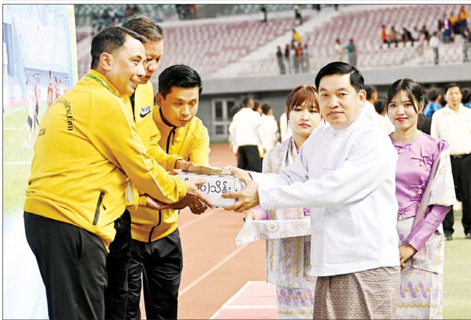
နိုင်ငံတော်စီမံအုပ်ချုပ်ရေးကောင်စီအဖွဲ့ဝင် ဒုတိယဗိုလ်ချုပ်ကြီး ညိုစော စတုတ္ထဆုရရှိသည့် ဆောက်လုပ်ရေးဝန်ကြီးဌာနအသင်းအား ဂုဏ်ပြုဆုနှင့် ချီးမြှင့်ငွေများ ပေးအပ်ချီးမြှင့်စဉ်။

ယင်းနောက် ပထမဆုရရှိသည့် အားကစားနှင့် လူငယ်ရေးရာ ဝန်ကြီးဌာနအသင်းအား ကောင်စီ တွဲဖက်အတွင်းရေးမှူး ဒုတိယ ဗိုလ်ချုပ်ကြီး ရဲဝင်းဦးက တစ်ဦး ချင်း ဆုတံဆိပ်များကို ပေးအပ် ချီးမြှင့်သည်။ ထို့နောက် နိုင်ငံတော်စီမံ အုပ်ချုပ်ရေးကောင်စီဥက္ကဋ္ဌ နိုင်ငံ တော်ဝန်ကြီးချုပ် ဗိုလ်ချုပ်မှူးကြီး မင်းအောင်လှိုင်က ပထမဆုရရှိ သည့်အားကစားနှင့်လူငယ်ရေးရာ ဝန်ကြီးဌာနအသင်းအား ဂုဏ်ပြု ချီးမြှင့်ငွေနှင့် တံခွန်စိုက်ဖလား တို့ကို ပေးအပ်ချီးမြှင့်ပြီး အားကစား သမားများကို ရင်းရင်းနှီးနှီး နှုတ်ဆက်ခဲ့ကြကြောင်း သိရ သည်။ သတင်းစဉ်