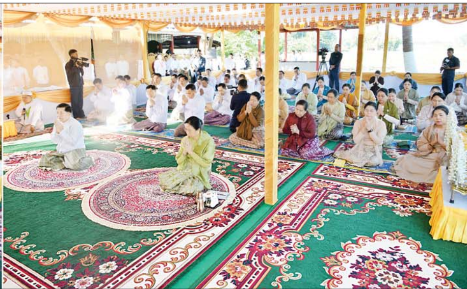
နိုင်ငံတော်စီမံအုပ်ချုပ်ရေးကောင်စီဥက္ကဋ္ဌ နိုင်ငံတော်ဝန်ကြီးချုပ် ဗိုလ်ချုပ်မှူးကြီး မင်းအောင်လှိုင်၊ ဇနီးဒေါ်ကြူကြူလှနှင့် အခမ်းအနားတက်ရောက်လာကြသူများ ပါဠိဆရာတော်ကြီးထံမှ အနုမောဒနာတရား နာယူကြစဉ်။