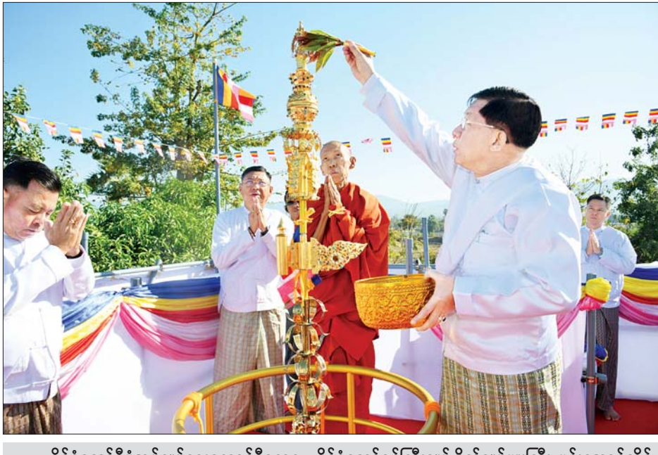
နိုင်ငံတော်စီမံအုပ်ချုပ်ရေးကောင်စီဥက္ကဋ္ဌ နိုင်ငံတော်ဝန်ကြီးချုပ် ဗိုလ်ချုပ်မှူးကြီး မင်းအောင်လှိုင် ရတနာစိန်ဖူးတော်၊ ငှက်မြတ်နားတော်နှင့် ရွှေထီးတော်တို့အဆင့်ဆင့်တို့ကို စေတီတော်အထွတ်၌ တင်လှူ ပူဇော်ကာ ပရိတ်နံ့သာရည်များ ပက်ဖျန်းပူဇော်စဉ်။

ပူဇော်သည်။ ထို့နောက် အခမ်းအနားကို “နမောတဿ” သုံးကြိမ်ရွတ်ဆို ဘုရားကန်တော့ဖွင့်လှစ်ပြီး နိုင်ငံ တော်စီမံအုပ်ချုပ်ရေး ကောင်စီ ဥက္ကဋ္ဌ နိုင်ငံတော်ဝန်ကြီးချုပ်နှင့် ဇနီး၊ အခမ်းအနား တက်ရောက် ဆောက်တည်ကြကာ ဥပါသကာ များက ပရိတ်ပန်း၊ ပရိတ်ရေ၊ ကိုးပါးသီလခံယူ ပရိတ်ချည်၊ စာမျက်နှာ ၅ သို့ ❖