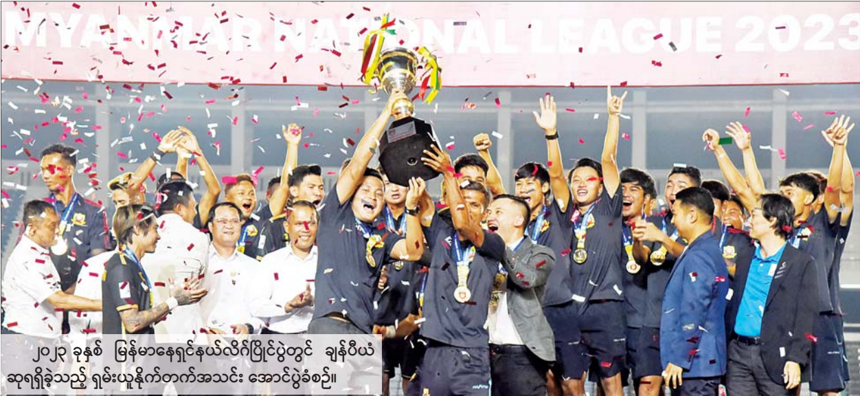
၂၀၂၃ ခုနှစ် မြန်မာနေရှင်နယ်လိဂ်ပြိုင်ပွဲတွင် ချန်ပီယံဆုရရှိခဲ့သည့် ရှမ်းယူနိုက်တက်အသင်း အောင်ပွဲခံစဉ်။

❖ အုပ်ချုပ်မှုပိုင်းဆိုင်ရာ တာဝန်ရှိသူများက စီမံခန့်ခွဲခြင်း၊ စိုက်ပျိုးမွေးမြူရေးလုပ်ဆောင်သူများက ကုန်ကြမ်းများထုတ်လုပ်ခြင်း၊ ကုန်ထုတ်လုပ်သူများက ထုတ်ကုန်များ ဆောင်ရွက်ကြခြင်းဖြစ်ပြီး ထုတ်ကုန်များ ထုတ်လုပ်နိုင်မှသာ ရောင်းဝယ်ခြင်း ဝန်ဆောင်မှုများ ဖြစ်ပေါ်လာမည်ဖြစ်သဖြင့် ကိုင်းကျွန်းမှ၊ ကျွန်းကိုင်းမှ အပြန်အလှန် မှီခိုနေရခြင်းကြောင့် အပြန်အလှန် အကျိုးရှိစေရေး ဆောင်ရွက်ပေးနိုင်ရေး တိုက်တွန်းပြောကြားလို... (နိုင်ငံတော်စီမံအုပ်ချုပ်ရေးကောင်စီဥက္ကဋ္ဌ နိုင်ငံတော်ဝန်ကြီးချုပ် ဗိုလ်ချုပ်မှူးကြီး မင်းအောင်လှိုင်၏ ၂၀၂၃ ခုနှစ်၊ ဇူလိုင်လ ၂ ရက်နေ့တွင် ပြုလုပ်သော ပြည်ထောင်စုသမ္မတမြန်မာနိုင်ငံ ကုန်သည်များနှင့် စက်မှုလက်မှုလုပ်ငန်းရှင်များအသင်းချုပ်(UMFCCI) ညီနောင်အသင်းအဖွဲ့များနှင့်တွေ့ဆုံ၍ နိုင်ငံစီးပွားမြှင့်တင်နိုင်ရေး ကိစ္စရပ်များ ဆွေးနွေးပွဲမှ အမှာစကားကောက်နုတ်ချက်)