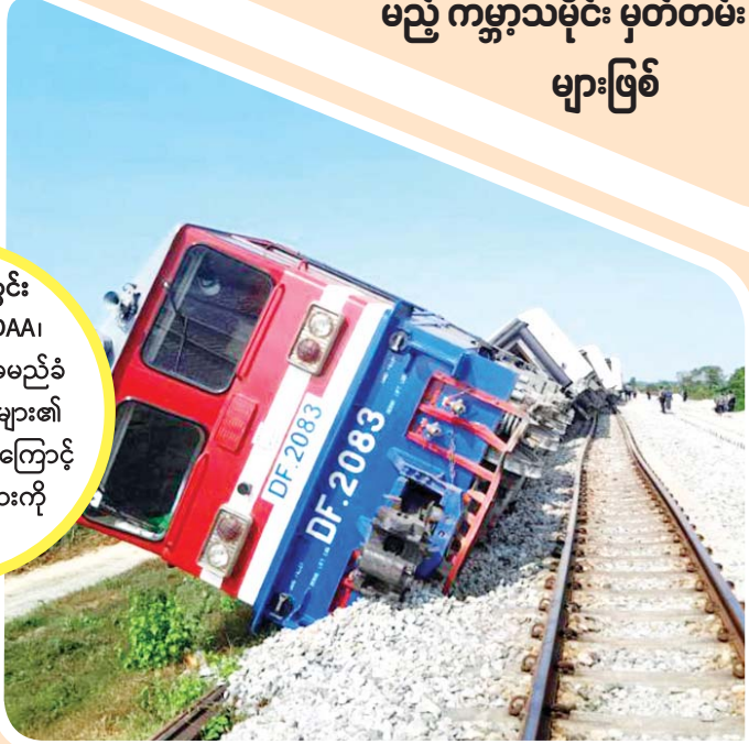
၂၀၂၃ ခုနှစ်အတွင်း AAI၊ KNLA၊ MNDAA၊ TNLA နှင့် PDF အမည်ခံ အကြမ်းဖက် အဖွဲ့များ၏ ဗုံးခွဲတိုက်ခိုက်မှုများကြောင့် ပျက်စီးဆုံးရှုံးမှုများကို တွေ့ရစဉ်။