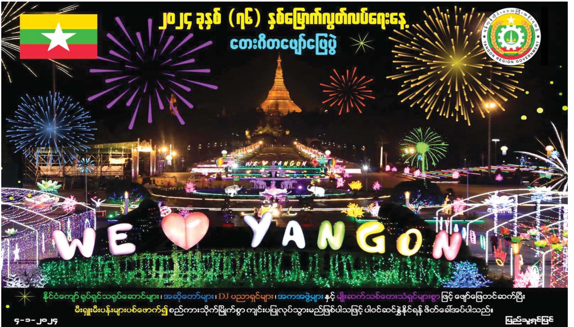
နိုင်ငံကျော် ရုပ်ရှင်သရုပ်ဆောင်များ၊ အဆိုတော်များ၊ DJ ပညာရှင်များ၊ အကအဖွဲ့များနှင့် မျိုးဆက်သစ်တေးသံရှင်များစွာဖြင့် ဖျော်ဖြေတင်ဆက်ပြီး မီးရှူးမီးပန်းများပစ်ဖောက်၍ စည်ကားသိုက်မြိုက်စွာ ကျင်းပပြုလုပ်သွားမည်ဖြစ်ပါသဖြင့် ပါဝင်ဆင်နွှဲနိုင်ရန် ဖိတ်ခေါ်အပ်ပါသည်။