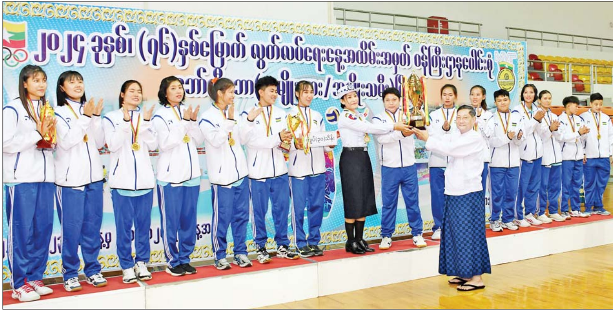
နိုင်ငံတော်စီမံအုပ်ချုပ်ရေးကောင်စီအဖွဲ့ဝင် ဒေါက်တာဘရွှေက ဝန်ကြီးဌာနအသင်းအား တံခွန်စိုက်ဆုဖလားကို ပေးအပ်ချီးမြှင့်စဉ်။

ပြည်ထောင်စုဝန်ကြီးများ၊ ဒုတိယဝန်ကြီးများ၊ ဌာနဆိုင်ရာအကြီးအကဲများနှင့် တာဝန်ရှိသူများ၊ မြန်မာနိုင်ငံ ဘော်လီဘောအဖွဲ့ချုပ်မှ တာဝန်ရှိသူများ၊ ဝန်ထမ်းများနှင့် ဘော်လီဘောဝါသနာရှင်