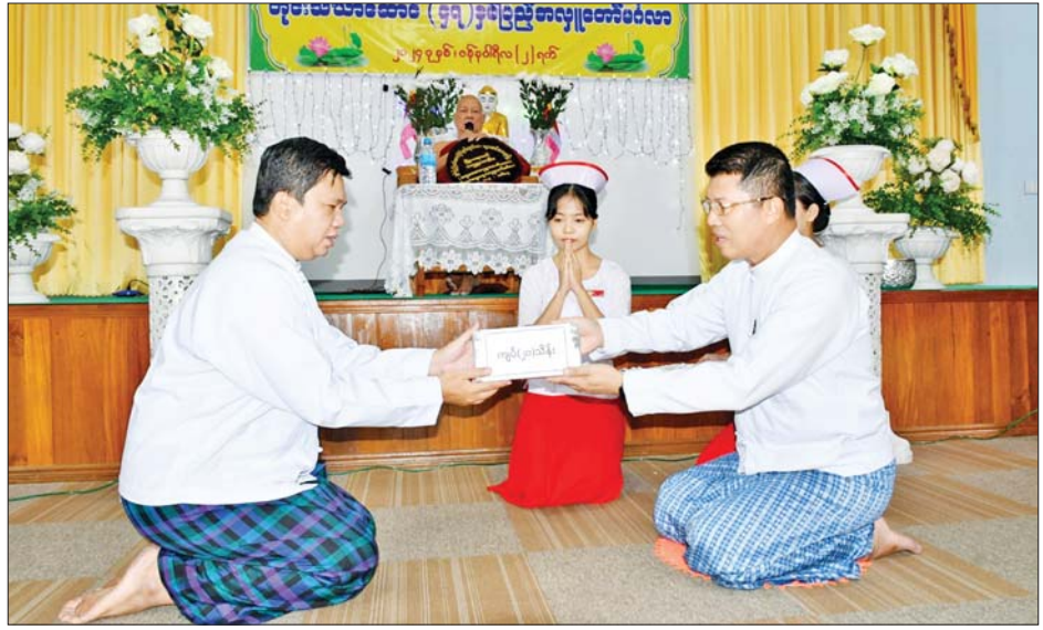
ဝေယျာဝစ္စကိစ္စရပ်များအား ပြည့်စုံစွာဆောင်ရွက်ပေးနိုင်ရေး မှာကြားခဲ့သည်။ ယင်းနောက် တိုင်းသံဃာဆောင် (၄၇)နှစ်ပြည့်အလှူတော်မင်္ဂလာအခမ်းအနား

ဦးစွာ တိုင်းဒေသကြီးဝန်ကြီးချုပ်နှင့် ဧည့်သည်တော်များသည် တိုင်းသံဃာဆောင်သို့ သွားရောက်၍ ကျန်းမာရေးစောင့်ရှောက်မှုခံယူနေသည့် သံဃာတော်များအား ဖူးမြော်ကြည်ညို၍ ကျန်းမာရေးစောင့်ရှောက်မှုဆိုင်ရာကိစ္စရပ်များ တင်ပြလျှောက်ထားခဲ့ပြီး တာဝန်ရှိသူများကို သံဃာတော်များအား လိုအပ်သည့် ကျန်းမာရေးစောင့်ရှောက်မှုများ အပြည့်အဝ ဖြည့်ဆည်းဆောင်ရွက်ပေးနိုင်ရေး၊ ဆေးဝါးနှင့်