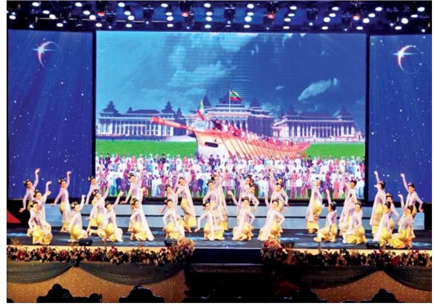
မြန်မာ့ယဉ်ကျေးမှုအကအလှ

[နိုင်ငံတော်စီမံအုပ်ချုပ်ရေးကောင်စီဥက္ကဋ္ဌ နိုင်ငံတော်ဝန်ကြီးချုပ် ဗိုလ်ချုပ်မှူးကြီး သတိုးမဟာသရေစည်သူ သတိုးသီရိသုဓမ္မ မင်းအောင်လှိုင်ထံမှ ၁၀-၁-၂၀၂၃ ရက်နေ့တွင် (၇၅)နှစ်မြောက် စိန်ရတုကချင်ပြည်နယ်နေ့အခမ်းအနားသို့ ပေးပို့သည့်သဝဏ်လွှာမှ ကောက်နုတ်ချက်]