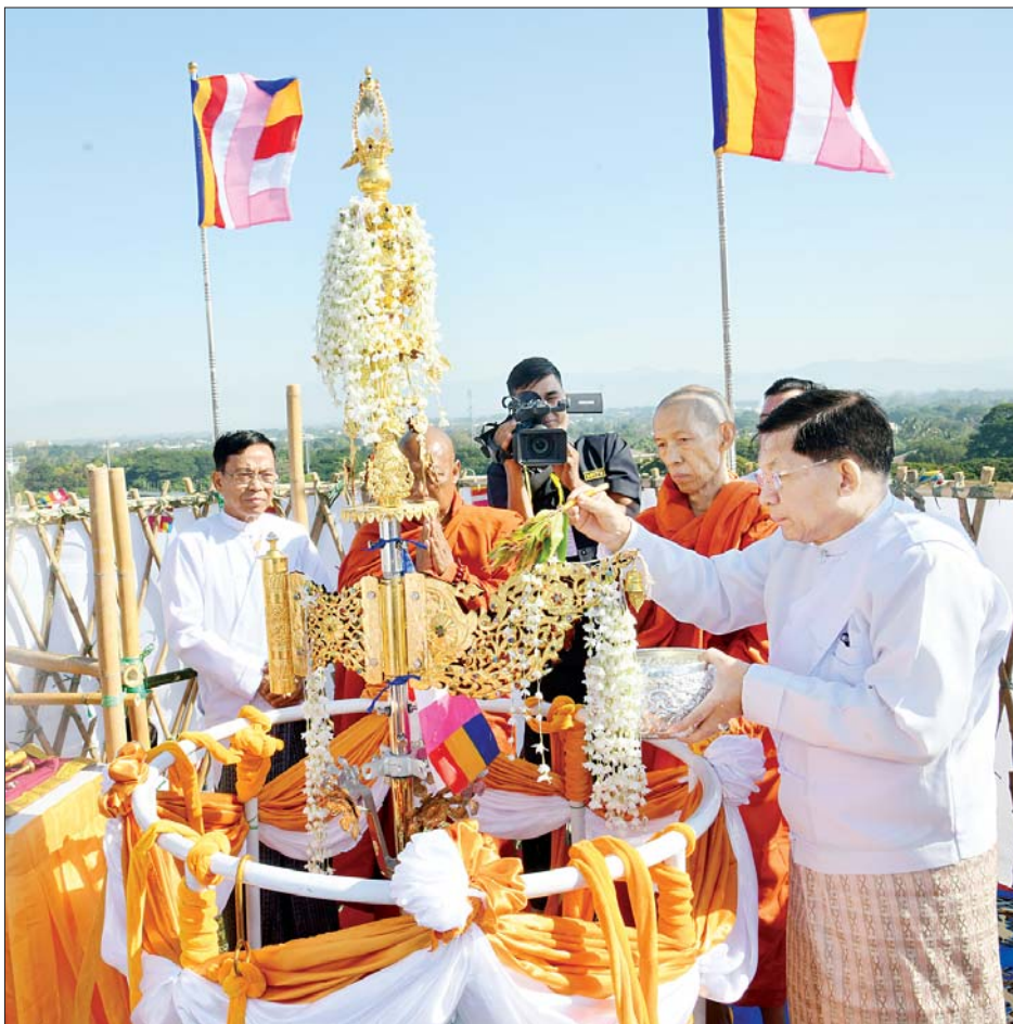
နိုင်ငံတော်စီမံအုပ်ချုပ်ရေးကောင်စီ ဥက္ကဋ္ဌ နိုင်ငံတော်ဝန်ကြီးချုပ် ဗိုလ်ချုပ်မှူးကြီး မင်းအောင်လှိုင် ရတနာစိန်ဖူးတော်၊ ငှက်မြတ်နားတော်တို့ကို စေတီတော်အတွက်တွင် တင်လှူပူဇော်၍ ပရိတ်နဲ့သာရည်များ ပက်ဖျန်းစဉ်။