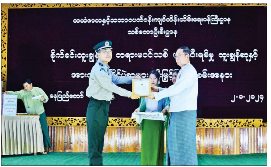
မိမူ ထူးချွန်ဆုပထမ၊ အမျိုးသားလွန်ဆွဲ ပထမ၊ အမျိုးသမီးလွန်ဆွဲ ပထမဆုများကို လည်းကောင်း၊ ဒုတိယဝန်ကြီးက စိုက်ခင်းထူးချွန်ဆု ဒုတိယ၊ တရားမဝင်သစ်ဖမ်းဆီးရမိမှု ထူးချွန်ဆု ဒုတိယ၊ အမျိုးသားလွန်ဆွဲ ဒုတိယ ဆုများကိုလည်းကောင်း ပေးအပ်ချီးမြှင့်ပြီး အမြဲတမ်းအတွင်းဝန်နှင့် ဌာနအကြီးအကဲများက ကျန်သည့် အားကစားပြိုင်ပွဲများအလိုက် ဆုများချီးမြှင့်ခဲ့ကြောင်း သိရသည်။ သတင်းစဉ်

ပြောင်းလဲမှုနှင့် သဘာဝဘေးအန္တရာယ် လျော့ပါးသက်သာစေရေးအတွက် အရေးပါသော သစ်တောစိုက်ခင်းများ တည်ထောင်ခြင်းတွင် ထူးချွန်စွာ ဆောင်ရွက်ခဲ့သူများနှင့် သစ်တောသယံဇာတများ ထာဝစဉ်တည်တံ့စေရန်နှင့် သစ်နှင့်သစ်တောထွက်ပစ္စည်း ခိုးယူထုတ်လုပ်မှုများ လျော့နည်းပျောက်စေရေးအတွက် တရားမဝင်သစ်ဖမ်းဆီးရေးတွင် ထူးချွန်စွာ ဆောင်ရွက်ခဲ့သူများအား ဂုဏ်ပြုချီးမြှင့်ခြင်းဖြစ်ကြောင်း။ သစ်တောဦးစီးဌာနအနေဖြင့် ၂၀၂၃ မိုးရာသီတွင် သစ်တောစိုက်ခင်းတည်ထောင်ခြင်း စုစုပေါင်း ၁၆၀၇၈ ဧက ဆောင်ရွက်ခဲ့ပြီး တရားမဝင်သစ်တားဆီးကာကွယ်ရေးအတွက် ဆက်စပ်အဖွဲ့အစည်းများနှင့် ပူးပေါင်း၍ နည်းလမ်း ရှစ်သွယ်ဖြင့် ဆောင်ရွက်လျက်ရှိရာ ၂၀၂၃ ခုနှစ် ဇန်နဝါရီမှ ဒီဇင်ဘာအထိ စုစုပေါင်း တန် ၁၀၀၀၀ ကျော် ဖမ်းဆီးရမိခဲ့ကြောင်း၊ ဆက်လက်၍လည်း အရှိန်အဟုန်မပြတ် ဆောင်ရွက်သွားရမည် ဖြစ်ကြောင်း ပြောကြားသည်။ ထို့နောက် ပြည်ထောင်စုဝန်ကြီးက စီးပွားရေးစိုက်ခင်း ထူးချွန်ဆုပထမ၊ တရားမဝင်သစ်ဖမ်းဆီးရ