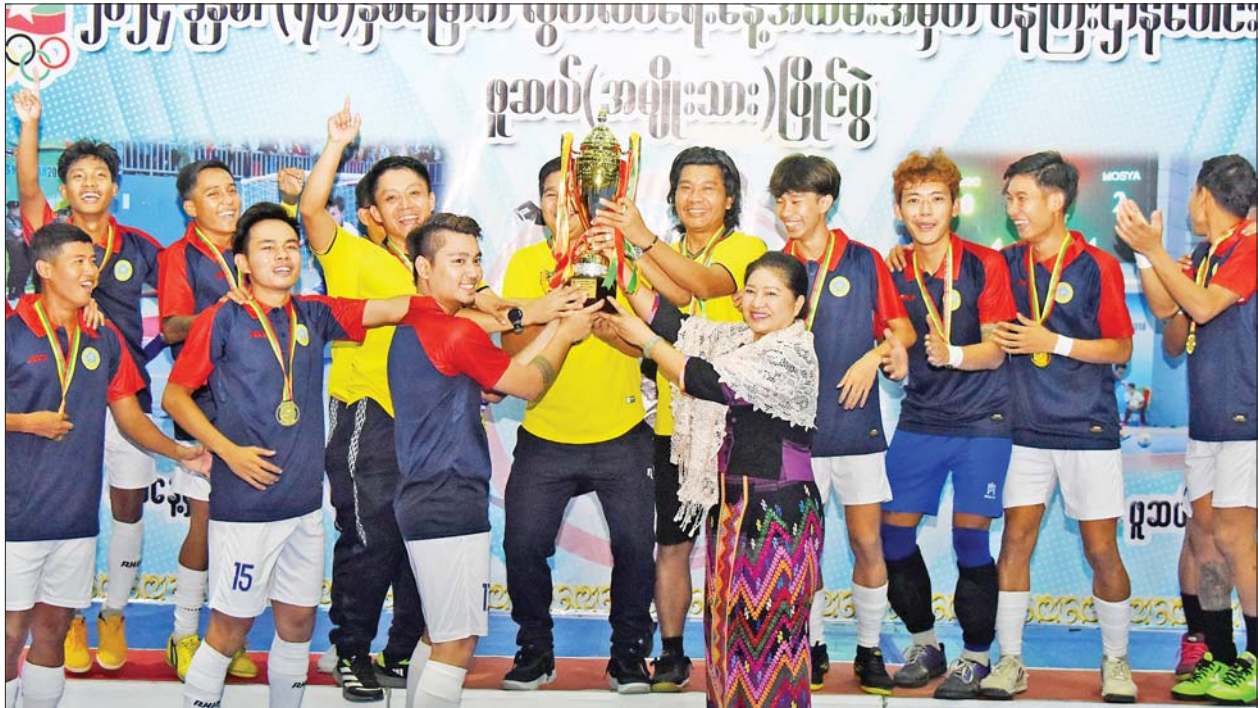
နိုင်ငံတော်စီမံအုပ်ချုပ်ရေးကောင်စီအဖွဲ့ဝင် ဒေါ်ဒွေဘူ အမျိုးသားဖူဆယ်ပြိုင်ပွဲတွင် ပထမဆုရရှိသည့် လူမှုဝန်ထမ်း၊ ကယ်ဆယ်ရေးနှင့် ပြန်လည်နေရာချထားရေးဝန်ကြီးဌာနအသင်းအား တစ်ဦးချင်း ဂုဏ်ပြုဆုတံဆိပ်များ၊ ဂုဏ်ပြုဆုငွေများနှင့်အတူ တံခွန်စိုက်ဆုဖလား ပေးအပ်ချီးမြှင့်စဉ်။

ဆက်လက်၍ နိုင်ငံတော်စီမံအုပ်ချုပ်ရေးကောင်စီ အဖွဲ့ဝင်