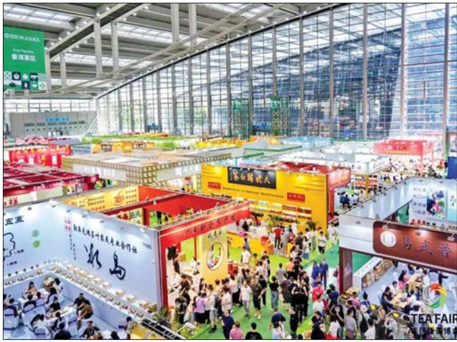
၂၀၂၃ ခုနှစ် ဒီဇင်ဘာလ ၂၁ ရက်မှ ၂၅ ရက်အထိ တရုတ်နိုင်ငံ Shenzhen မြို့၌ကျင်းပသည့် ကမ္ဘာလုံးဆိုင်ရာအကြီးဆုံး လက်ဖက်ပြပွဲတွင် မြန်မာနိုင်ငံမှ လက်ဖက်ခြောက်ထုတ်ကုန်တစ်ခုဖြစ်သည့် TGT Tea Co., Ltd က အထူးရွှေတံဆိပ် ဆွတ်ခူးစဉ်။

ယခုလတ်တလောမှာပဲ အိန္ဒိယက ပဲလိုအပ်ချက်ကြောင့် မြန်မာ့မတ်ပဲနဲ့ ပဲစင်းငုံတန်ချိန် သန်းနဲ့ ချီပြီး ဝယ်ယူဖို့စဉ်နေတယ်လို့ သိရတယ်။ အိန္ဒိယ နိုင်ငံမှာ မတ်ပဲဈေးနှုန်းက အရင်ထက် ၁၈၊ ၁၉ ရာခိုင်နှုန်း၊ ပဲစင်းငုံက ၄၀ ရာခိုင်နှုန်းလောက်အထိ ဈေးတက်နေတဲ့အပြင် စိုက်ဧကနည်းတာနဲ့ အထွက်နှုန်းလျော့နေတာကြောင့် အိန္ဒိယပြည်တွင်းမှာ စားသုံးမှုလုံလောက်စေဖို့နဲ့ ဈေးတက်နေတာကို ထိန်းချုပ် နိုင်ဖို့အတွက် မြန်မာ့မတ်ပဲတန်ချိန် တစ်သန်းနဲ့