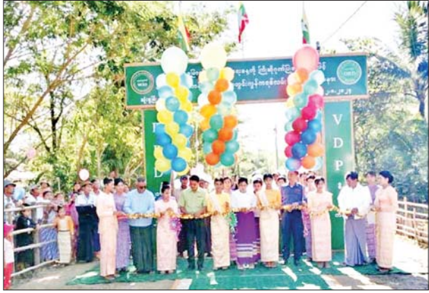
သုံးခွ ဇန်နဝါရီ ၂

(၇၆)နှစ်မြောက် လွတ်လပ်ရေးနေ့ကို ကြိုဆိုဂုဏ်ပြုသောအားဖြင့် ရန်ကုန်တိုင်းဒေသကြီး သန်လျင်ခရိုင် သုံးခွမြို့နယ်ညောင်ပင်ခင်တန်းကျေးရွာတွင်းကွန်ကရစ်လမ်းဖွင့်ပွဲကို ယနေ့နံနက် ၁၀ နာရီက အဆိုပါလမ်း၌ ကျင်းပသည်။