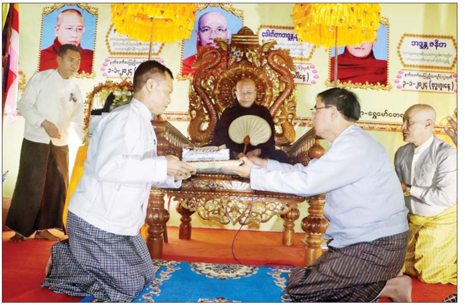
နာယက သာသနာ့ဓမ္မဓမ္မာစရိယ အဂ္ဂမဟာပဏ္ဍိတ ဒေါက်တာဘဒ္ဒန္တသုန္ဒရီ ကလည်းကောင်း၊ ဇန်နဝါရီ ၃ ရက်တွင် ပဲခူးမြို့ သာသနာ့ဓမ္မာစရိယ မဟာဂန္ထဝါစကပဏ္ဍိတ

ပဲခူးတိုင်းဒေသကြီးအစိုးရအဖွဲ့က ကြီးမှူးကျင်းပသည့် ၂၀၂၄ ခုနှစ် နှစ်သစ်ကူးတရားအလှူတော်ဓမ္မသဘင်ပွဲကို ဇန်နဝါရီ ၁ ရက်မှ ၃ ရက်အထိ သုံးညတိုင်တိုင်ကျင်းပမည်ဖြစ်ပြီး ဇန်နဝါရီ ၂ ရက်တွင် နိုင်ငံတော်သံဃမဟာနာယကအဖွဲ့ အဖွဲ့ဝင် ဆရာတော် ပဲခူးမြို့ ဥဿာသီရိစာသင်တိုက် ပဓာန