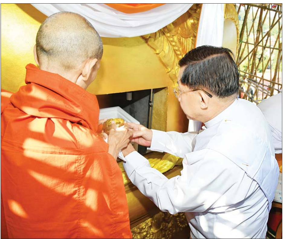
နိုင်ငံတော်စီမံအုပ်ချုပ်ရေးကောင်စီဥက္ကဋ္ဌ နိုင်ငံတော်ဝန်ကြီးချုပ် ဗိုလ်ချုပ်မှူးကြီး မင်းအောင်လှိုင် ဌာပနာတိုက်အတွင်းသို့ ဌာပနာတော် သွင်းလှူပူဇော်စဉ်။

သည်။ ယင်းနောက် ပါဠိဆရာတော်ကြီးထံမှ အနုမောဒနာ တရားနာယူ၍ လှူဒါန်းမှုအစုစုအတွက် ရေစက်သွန်းချ အမျှပေးဝေကြသည်။ ဆက်လက်၍ နိုင်ငံတော်စီမံအုပ်ချုပ်ရေး ကောင်စီဥက္ကဋ္ဌ နိုင်ငံတော် ဝန်ကြီးချုပ်နှင့်ဇနီး၊ အဖွဲ့ဝင်များသည် ရတနာစိန်ဖူးတော်၊ ငှက်မြတ်နားတော်တို့ကို မင်္ဂလာဝေါယာဉ် တော်ဖြင့် ပင့်ဆောင်၍ စေတီတော်မြတ်ကြီးအား လက်ယာရစ် လှည့်လည်ပူဇော်ကာ မဟာမင်္ဂလာမဏ္ဍပ်ရှေ့ရှိ ခေတ္တအပူဇော်ခံနေရာသို့ ပို့ဆောင်ကြသည်။ ဌာပနာတော်သွင်းလှူပူဇော်ထိုနောက် ပါဠိဆရာတော်ကြီးအမှူးပြု၍ နိုင်ငံတော်စီမံအုပ်ချုပ်ရေးကောင်စီဥက္ကဋ္ဌ နိုင်ငံတော်ဝန်ကြီးချုပ်က အထက်ဌာပနာတိုက်တွင် တက်ရောက်နေရာယူပြီး အထက်ဌာပနာတိုက်ကို ဖွင့်လှစ်၍ ဆီမီးထွန်းညှိ ပူဇော်သည်။ ယင်းနောက် မင်္ဂလာအချိန်တွင် နိုင်ငံတော်စီမံအုပ်ချုပ်ရေးကောင်စီဥက္ကဋ္ဌ နိုင်ငံတော်ဝန်ကြီး