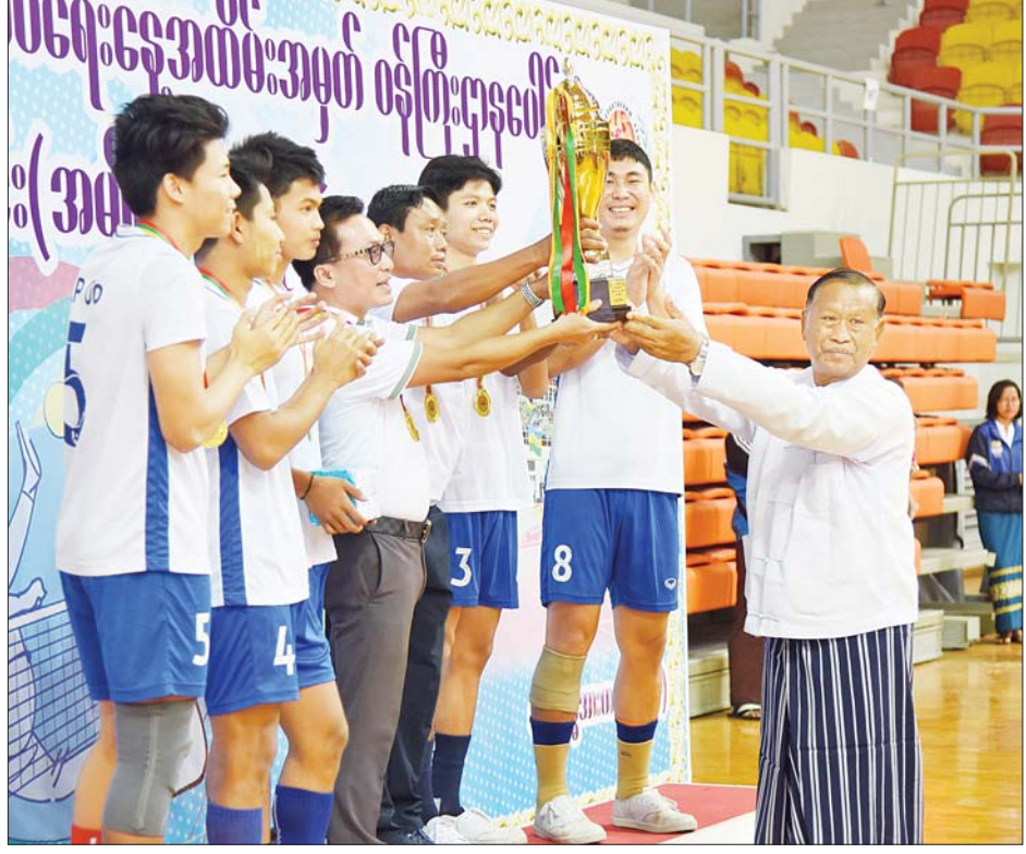
နိုင်ငံတော်စီမံအုပ်ချုပ်ရေးကောင်စီအဖွဲ့ဝင် ပိုးရယ်အောင်သိန်း ပိုက်ကျော်ခြင်းပြိုင်ပွဲတွင် ပထမဆုရရှိသည့် နယ်စပ်ရေးရာဝန်ကြီးဌာနအသင်းအား တစ်ဦးချင်းဂုဏ်ပြုဆုတံဆိပ်များ၊ ဂုဏ်ပြုဆုငွေများနှင့်အတူ တံခွန်စိုက်ဆုဖလား ပေးအပ်ချီးမြှင့်စဉ်။

အားကစားနှင့် လူငယ်ရေးရာ ဝန်ကြီးဌာနမှ ကြီးမှူးကျင်းပသည့် ၂၀၂၄ ခုနှစ် (၇၆) နှစ်မြောက် လွတ်လပ်ရေးနေ့အထိမ်းအမှတ် ဝန်ကြီးဌာနပေါင်းစုံ အားကစားပြိုင်ပွဲတွင် အသက် (၂၅)နှစ်အောက် ဘောလုံးပြိုင်ပွဲ (အမျိုးသား/အမျိုးသမီး)၊ ဘော်လီဘောပြိုင်ပွဲ (အမျိုးသား/ အမျိုးသမီး)၊ ပိုက်ကျော်ခြင်းပြိုင်ပွဲ(အမျိုးသား)၊ ဖူဆယ်ပြိုင်ပွဲ (အမျိုးသား)၊ ထုပ်ဆီးတိုးပြိုင်ပွဲနှင့် လွန်ဆွဲပြိုင်ပွဲတို့ကို ထည့်သွင်းကျင်းပလျက်ရှိပြီး ဇန်နဝါရီ ၃ ရက်တွင် ဗိုလ်လုပွဲစဉ်များအဖြစ် ထုပ်ဆီးတိုးပြိုင်ပွဲ၊ ဘော်လီဘောပြိုင်ပွဲ (အမျိုးသား/အမျိုးသမီး) နှင့် အမျိုးသားဘောလုံးပြိုင်ပွဲကို ဆက်လက်ယှဉ်ပြိုင်ကစားသွားကြမည်ဖြစ်ကြောင်း သိရသည်။