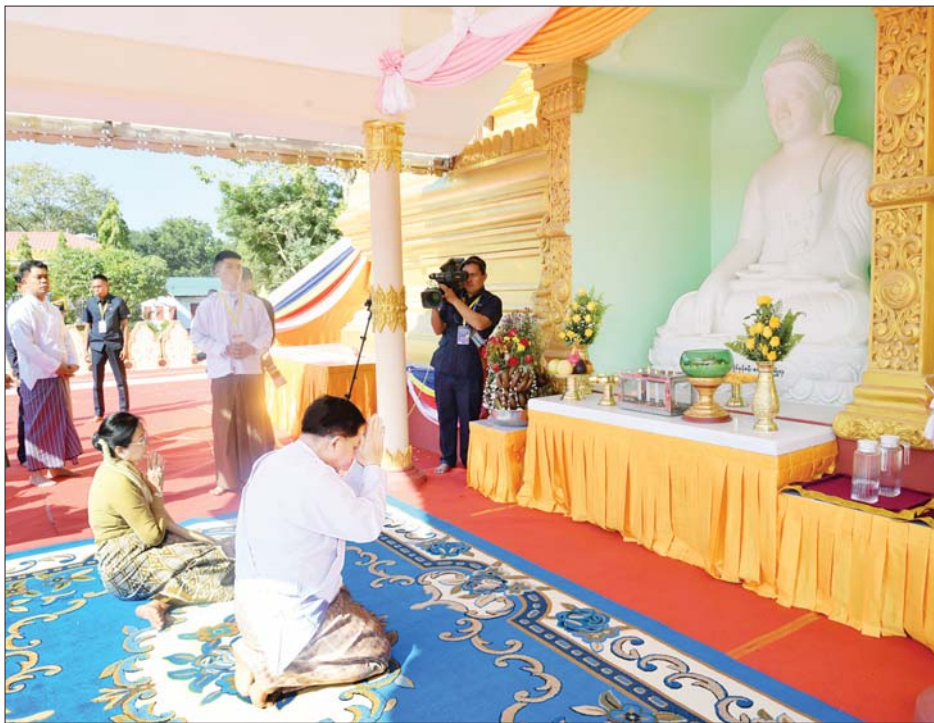
နိုင်ငံတော်စီမံအုပ်ချုပ်ရေးကောင်စီ ဥက္ကဋ္ဌ နိုင်ငံတော်ဝန်ကြီးချုပ် ဗိုလ်ချုပ်မှူးကြီး မင်းအောင်လှိုင်နှင့် ဇနီးဒေါ်ကြာကြာလှ စေတီတော်ကြီးတောင်ဘက်အရပ်ရှိ ဗုဒ္ဓရုပ်ပွားတော်မြတ်အား ဖူးမြော်ကြည်ညိုကြစဉ်။