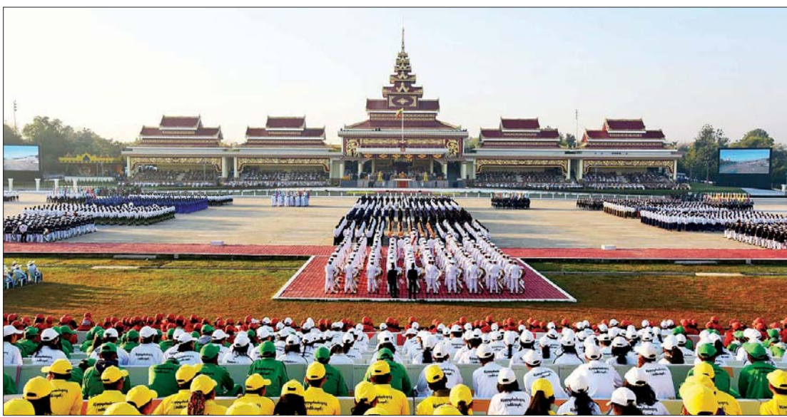
၂၀၂၃ ခုနှစ် (၇၅)နှစ်မြောက် စိန်ရတုလွတ်လပ်ရေးနေ့ အခမ်းအနားကျင်းပစဉ်။

လွတ်လပ်ရေးကို တိုင်းရင်းသား အားလုံး တညီတညွတ်တည်း လက်တွဲ ရယူပြီး ပြည်ထောင်စုနိုင်ငံတော်ကြီး တည်ဆောက်ဖို့သဘောတူခဲ့ကြပါတယ်။ ပြည်ထောင်စုကြီး နိုင်ငံတော်အတွက် အုတ်မြစ်တွေချခဲ့ကြပါတယ်။ လွတ်လပ် ရေးကြီးအတွက် သန္နိဋ္ဌာန်တွေချခဲ့ကြပါ တယ်။ ညီညွတ်မှုရဲ့ရလဒ်က အားလုံး လိုလားတဲ့ လွတ်လပ်ရေးရရှိခြင်းပဲဖြစ်ပါ တယ်။ အဲဒီအချိန်က သူ့ကျွန်ဘဝက လွတ်မြောက်ပြီး လွတ်လပ်တဲ့နိုင်ငံ၊ လွတ်လပ်တဲ့ ပြည်သူတွေအဖြစ်နဲ့ အပျော်ကြီးပျော်ခဲ့ကြပါတယ်။ လွတ်လပ် ရေးအောင်ပွဲတွေ ခြိမ်းခြိမ်းသဲကျင်းပပြီး အောင်ပွဲခံခဲ့ကြပါတယ်။