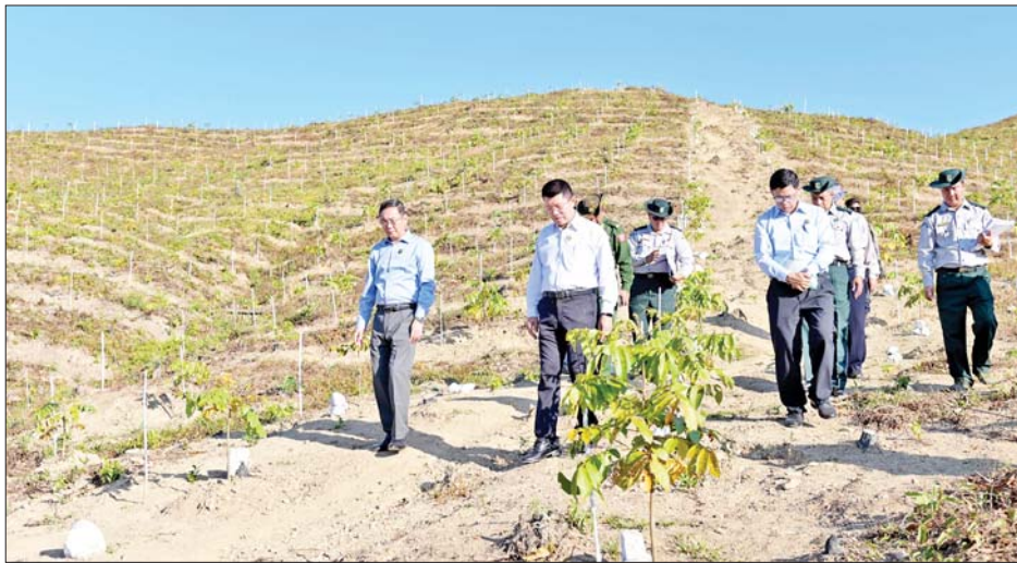
မျိုးသန့် သစ်စေ့များ ကြိုတင်စုဆောင်းပျိုးထောင်ရေး၊ အချိန်မီစိုက်ပျိုးရေးနှင့် စိုက်ပျိုးပြီးသော အပင်များ ရှင်သန်အောင် ထိန်းသိမ်းစောင့်ရှောက်ရေးသည် အရေးကြီးကြောင်း၊ ဒေသပြည်သူများအတွက် ကျေးရွာသုံးထင်းစိုက်ခင်းများ တည်ထောင်ရေးနှင့် တရားမဝင်သစ် တားဆီးကာကွယ်ရေးတို့ကိုလည်း အရှိန်အဟုန်ဖြင့် ဆက်လက်ဆောင်ရွက်သွားရမည် ဖြစ်ကြောင်း မှာကြားသည်။ ဆက်လက်၍ ပြည်ထောင်စုဝန်ကြီးနှင့်အဖွဲ့ သည် ပုသိမ်မြို့နယ် သလပ်ခွာကြီးပိုင်း အကွက်

အမှတ်(၂၇) ရှိ ၁/၂၀၁၈ စီးပွားရေး ပျဉ်းကတိုး စိုက်ခင်း၏ ရှင်သန်အောင်မြင်မှုနှင့် စိုက်ခင်းအတွင်း ပင်ကြပ်နုတ်ခြင်း ဆောင်ရွက်ထားမှု၊ ၂၀၂၂ ခုနှစ် မိုးရာသီတွင် စိုက်ပျိုးခဲ့သော ပုဂ္ဂလိကသစ်မာ ပျဉ်းကတိုးနှင့် မန်ဂျန်ရှားစိုက်ခင်း ၄၅ ဧက၏ ရှင်သန် အောင်မြင်မှုကို လှည့်လည်ကြည့်ရှုစစ်ဆေးပြီး လိုအပ်သည်များ မှာကြားသည်။