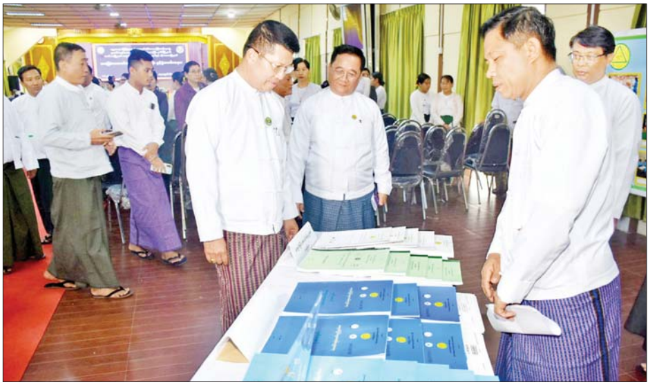
ကြီးကြပ်မှုကော်မတီနာယက တိုင်းဒေသကြီးဝန်ကြီးချုပ်နှင့် ဧည့်သည်တော်များက ခင်းကျင်းပြသထားသည့် အခြေခံစာတတ်မြောက်ရေးလုပ်ငန်းမှတ်တမ်းဓာတ်ပုံများ၊ သင်ထောက်ကူပစ္စည်းများနှင့် ထောက်ပံ့ပစ္စည်းများကို လှည့်လည်ကြည့်ရှုပြီး နည်းပြဆရာ ဆရာမများ၊ စာသင်သားများအား ရင်းရင်းနှီးနှီးနို့ဆက်ဆက်ခွဲကြောင်း သိရသည်။ တိုင်းဒေသကြီး(ပြန်/ဆက်)

ထို့နောက် တိုင်းဒေသကြီးဝန်ကြီးချုပ်၊ တိုင်းဒေသကြီးတရားသူကြီးချုပ်နှင့် ညွှန်ကြားရေးမှူးချုပ်တို့က စာသင်သားများအား အမှတ်တရလက်ဆောင်ပစ္စည်းများပေးအပ်ပြီး အခြေခံစာတတ်မြောက်ရေးလုပ်ငန်း