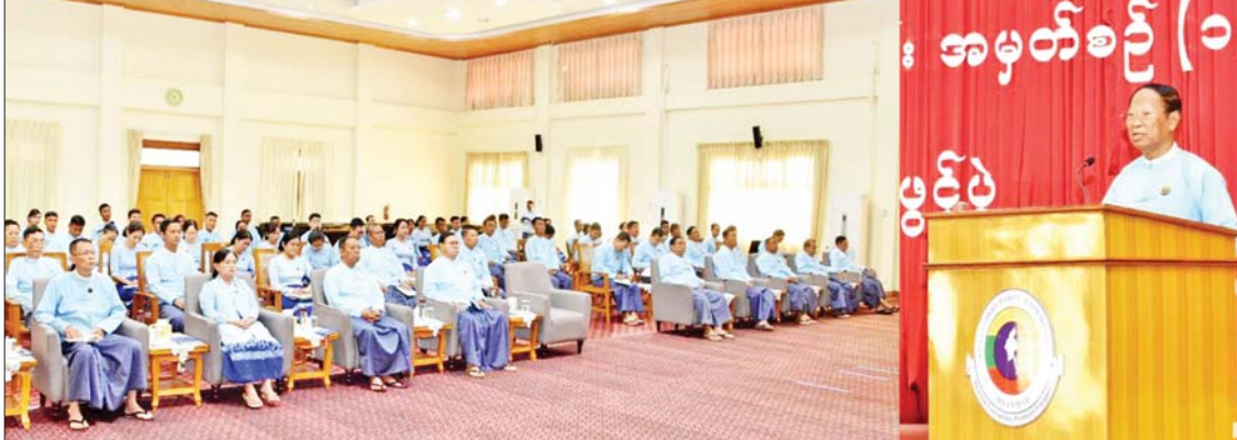
ကော်မရှင်၏ ဂုဏ်သိက္ခာအပေါ် အလေး ထား၍ ကောင်းမွန်သောခံယူချက်ဖြင့် အများပြည်သူအကျိုးကို ထမ်းဆောင်နေ သည့် ဝန်ထမ်းများဖြစ်အောင် ကျင့်ကြံ နေထိုင်ကြစေလိုကြောင်း၊ ပေးအပ်သည့် တာဝန်များကို အကောင်းဆုံးထမ်းဆောင် နိုင်ရန်လိုကြောင်း၊ ဝန်ထမ်းတစ်ဦးချင်းစီ က မိမိဌာန၊ နိုင်ငံအပေါ် သစ္စာရှိရန်နှင့် ဝန်ထမ်းသစ္စာ အဓိပ္ပာယ်(၆)ချက်ကို စွဲမြဲစွာ လိုက်နာရန်လိုကြောင်း၊ အဂတိလိုက်စား မှုသည် အကျင့်စာရိတ္တပျက်ယွင်းခြင်းဖြစ် ပြီး ယင်းကို ပြုပြင်ပေးရန်တာဝန်မှာ ကော်မရှင်တာဝန်ဖြစ်ကြောင်း၊ ကော်မရှင် အနေဖြင့် အဂတိလိုက်စားမှုကို လုံးဝ လက်မခံသည့် ယဉ်ကျေးမှုတစ်ရပ် ဖြစ်တည်လာစေရေး ဦးတည်ဆောင်ရွက် လျက်ရှိကြောင်း၊ ထိုသို့ဆောင်ရွက်ရာ တွင် ကော်မရှင်၏ “အဂတိပယ်ခွာ

ပြည်သာယာ” ဆိုသည့် ဆောင်ပုဒ်နှင့်အညီ အဂတိပယ်ခွာခြင်းဖြင့် နိုင်ငံဖွံ့ဖြိုး တိုးတက်အောင် ဆောင်ရွက်ကြရန်လို ကြောင်း တိုက်တွန်းပြောကြားသည်။