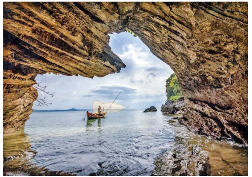
ဂေါ်ရင်ဂျီကျွန်းသဘာဝအလှ ဓာတ်ပုံ-ဦးချမ်းသာ

[ဗိုလ်ချုပ်အောင်ဆန်း၏ ၂၃-၁-၁၉၄၆ ရက်နေ့တွင် ကျင်းပသော ဖဆပလပြည်လုံးကျွတ် ညီလာခံသဘင်ကြီး၌ ပြောကြားခဲ့သည့်မိန့်ခွန်းမှ ကောက်နုတ်ချက်]