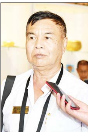
ဦးမြင့်ချို

ရုပ်ပွားတော်မြတ်ကြီး စတင်ဖူးမြော်ခွင့်ပြုတဲ့ အချိန်ကတည်းက လာရောက်ဖူးမြော်ချင်ခဲ့ပေမယ့် မရောက်ဖြစ်ခဲ့ပါဘူး။ အခုတော့ သက်ဆိုင်ရာတာဝန်ရှိ သူတွေက ကျွန်တော်တို့ ရန်ကုန်တိုင်းဒေသကြီး အတွင်းက ဂေါပကအဖွဲ့တွေကို ပထမအသုတ်အနေ နဲ့ ဖူးမြော်ဖို့ စီစဉ်ဆောင်ရွက်ပေးတဲ့အတွက် ကျေးဇူး တင်ရှိပါတယ်။ မြန်မာနိုင်ငံမှာ အကြီးဆုံးလည်းဖြစ်တဲ့ အပြင် တစ်နိုင်ငံလုံးက ကြိုတင်ကြိုတိုင်း လာရောက်ဖူး မြော်နေကြတဲ့ ရုပ်ပွားတော်မြတ်ကြီးဖြစ်တဲ့အတွက် အင်မတန်မှ စိတ်ထဲမှာ ထူးခြားလေးနက်စွာ ဖူးမြော် ကန်တော့ခဲ့ပါတယ်။ နောက်ပြီး ကျွန်တော်တို့ ကမ္ဘာအေးစေတီတော်မှာ လိုအပ်မယ့် ပြုပြင်မွမ်းမံမှု တွေအားလုံးကို ဗုဒ္ဓဥယျာဉ်တော်အတွင်း တည်ဆောက် ပူဇော်ထားတဲ့ ဘုရား၊ စေတီ၊ သာသနိကအဆောက် အအုံတွေကတစ်ဆင့်လေ့လာဆောင်ရွက်သွားဖို့လည်း