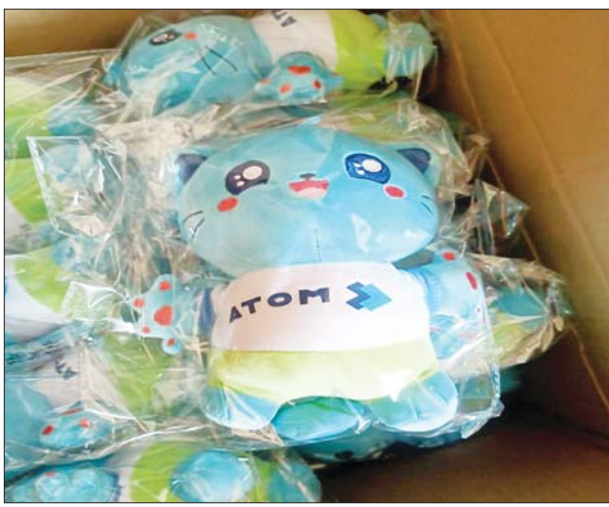
အေးရှားဝေါလ်ဆိပ်ကမ်း၌ သိမ်းဆည်းရမိမှု မှတ်တမ်းဓာတ်ပုံ။

၄၃၄၁၉၆၀)နှင့် အဆိုပါသစ်များ တင်ဆောင်လာသည့် Fuso Canter တစ်စီး (ခန့်မှန်းတန်ဖိုးငွေကျပ် ၁၈၀၀၀၀၀)ကို သစ်တောဥပဒေအရ လည်းကောင်း၊ ရွာသာကြီး Dry Port ၌ မန္တလေးမြို့မှ ရန်ကုန်မြို့သို့ မောင်းနှင်လာသော ယာဉ်တစ်စီးပေါ်မှ သွင်းကုန်ကြေညာလွှာတွင် ကြေညာထားခြင်းမရှိသည့် 100% Rayon Fabric ၉၂၆၈ ကီလိုဂရမ် (ခန့်မှန်းတန်ဖိုးငွေကျပ် ၁၃၉၀၂၀၀)နှင့် အဆိုပါပစ္စည်းများ တင်ဆောင် လာသည့် MAN Tractor Head တစ်စီးနှင့် နောက်တွဲယာဉ်တစ်တွဲ (ခန့်မှန်းတန်ဖိုးငွေကျပ် ၉၅၀၀၀၀၀)ကို အကောက်ခွန်လုပ်ထုံး လုပ်နည်းများအရလည်းကောင်း စုစုပေါင်း ခန့်မှန်းတန်ဖိုးငွေကျပ် ၁၃၁၂၄၃၉၆၀ ကို ဖမ်းဆီးအရေးယူ ဆောင်ရွက်လျက်ရှိသည်။ ထို့အတူ ပဲခူးတိုင်းဒေသကြီး တရားမဝင်ကုန်သွယ်မှုတိုက်ဖျက်ရေး အထူးအဖွဲ့၏ စီမံခန့်ခွဲမှုဖြင့် တာဝန်ကျပူးပေါင်းအဖွဲ့များက စစ်ဆေးမှု များဆောင်ရွက်ခဲ့ရာ ဒီဇင်ဘာ ၂၈ ရက် နှင့် ၂၉ ရက်တို့တွင် တောင်ငူ ခရိုင်အတွင်း၌ တရားမဝင်ကျွန်းသစ် ၁ ဒဿမ ၂၈၆ တန်နှင့် အခြားသစ် သုည ၃ ဒဿမ ၇၄၅ တန် စုစုပေါင်း ခန့်မှန်းတန်ဖိုးငွေကျပ် ၉၆၈၈၃၄ ကို သိမ်းဆည်းရမိခဲ့ပြီး သစ်တောဥပဒေနှင့်အညီ အရေးယူဆောင်ရွက် လျက်ရှိသည်။ သို့ဖြစ်ပါ၍ ဒီဇင်ဘာ ၂၇ ရက်၊ ၂၈ ရက်နှင့် ၂၉ ရက်တို့တွင် သိမ်းဆည်းရမိမှု စုစုပေါင်းမှာ အမှုတွဲ ၁၅ မှု ခန့်မှန်းတန်ဖိုးငွေကျပ် ၃၁၅၅၁၅၉၄ ဖြစ်ကြောင်း တရားမဝင်ကုန်သွယ်မှုတိုက်ဖျက်ရေး ဦးဆောင်ကော်မတီမှ သိရသည်။ သတင်းစဉ်