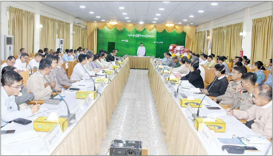
မြောက် လွတ်လပ်ရေးနေ့အခမ်းအနား အောင်မြင်စွာ ကျင်းပနိုင်ရေး လုပ်ငန်းကော်မတီအတွင်းရေးမှူးများက လုပ်ငန်းအလိုက် ဆွေးနွေးကြပြီး ပြည်နယ်ဝန်ကြီးချုပ်နှင့် ပြည်နယ်ဝန်ကြီးများက ပြည်နယ်အဆင့် ဌာနဆိုင်ရာအကြီးအကဲများအား စားသောက်ကုန်များ ထောက်ပံ့ပေးအပ်သည်။ တင်ပြချက်များအပေါ် ပြည်နယ်ဝန်ကြီးချုပ်က လိုအပ်သည်များကို မှာကြားပေးကာ နိဂုံးချုပ်အမှာစကားပြောကြားခဲ့သည်။ ပြည်နယ် (ပြန်/ဆက်)

ပြည့်စီစဉ်ဆောင်ရွက်ပေးရန်အတွက် သွားကြရန်လိုအပ်ကြောင်း လမ်းညွှန်မှာကြားသည်။ ဆွေးနွေးတင်ပြ ဆက်လက်၍ ပြည်နယ်ဝန်ကြီးများ၊ ပြည်နယ်ဥပဒေချုပ်နှင့် အစိုးရအဖွဲ့အတွင်းရေးမှူးတို့က လုံခြုံရေးဆိုင်ရာကိစ္စရပ်များ၊ ဒေသဖွံ့ဖြိုးရေး ဆောင်ရွက်နေမှုများ၊ ဆက်သွယ်ရေးကိစ္စရပ်များ၊ ခရီးသွားလာခွင့်ဆိုင်ရာကိစ္စရပ်များ၊ သတင်းအချက်အလက်များ၊ ပြည်ထောင်စုအစိုးရအဖွဲ့၏ ညွှန်ကြားချက်များနှင့် ပတ်သက်၍ ရှင်းလင်းဆွေးနွေးတင်ပြကြပြီး ပြည်နယ်အဆင့်ဌာနဆိုင်ရာများက မိမိတို့ဌာနအလိုက် လုပ်ငန်းဆောင်ရွက်နေမှုများကို ရှင်းလင်းတင်ပြကြသည်။ ထို့နောက် တက်ရောက်လာကြသည့် (၇၆) နှစ်