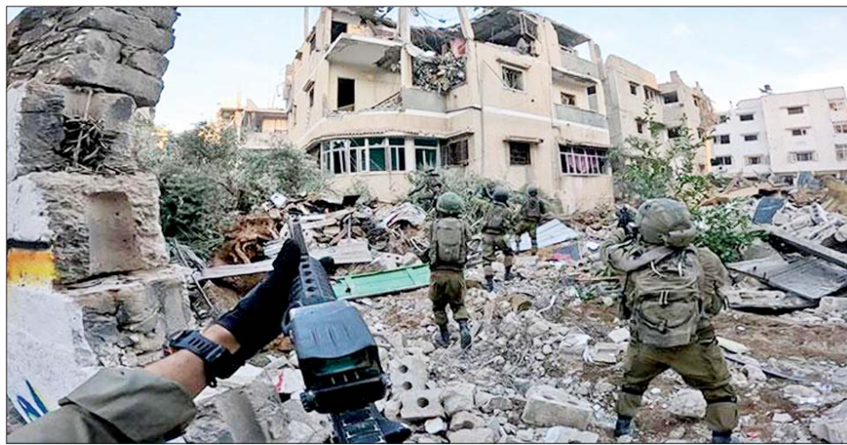
အီဂျစ်အစိုးရသည် ဂါဇာဒေသ၌ အပစ်အခတ် ကြောင်း ဒီဇင်ဘာ ၂၈ ရက်တွင် ကြေညာခဲ့သည်။ ရပ်စဲရေး အဆင့်သုံးဆင့် အစီအစဉ်ကို ချမှတ်ခဲ့ ယင်းအဆိုပြုချက်သည် ဂါဇာကမ်းမြောင်းဒေသ

ဂျေရုဆလင် ဒီဇင်ဘာ ၂၉ အစ္စရေးတပ်ဖွဲ့ဝင်များသည် ဂါဇာအလယ်ပိုင်း နှင့် တောင်ပိုင်းတို့တွင် လေကြောင်းနှင့် မြေပြင် ထိုးစစ်များကို ပြင်းထန်စွာ ဆင်နွှဲလျက်ရှိပြီး ပြည်သူ ဒါဇင်နှင့်ချီ သေဆုံးခဲ့ကြောင်း သိရသည်။ ဂါဇာအလယ်ပိုင်းရှိ ဒုက္ခသည်စခန်းနှစ်ခုတွင် အစ္စရေး၏ လေကြောင်းတိုက်ခိုက်မှုကြောင့် အနည်းဆုံး ၃၅ ဦး သေဆုံးခဲ့ကြောင်း သိရသည်။ ဝင်ရောက်စီးနင်း ဂါဇာကမ်းမြောင်းတောင်ပိုင်း ရာဖာမြို့ရှိ လူနေ ရပ်ကွက်တစ်ခုကို အစ္စရေးတိုက်လေယာဉ်က ဒီဇင်ဘာ ၂၉ ရက်တွင် ဝင်ရောက်စီးနင်းခဲ့ရာ အနည်းဆုံး ၂၀ သေဆုံးခဲ့ကြောင်း သိရသည်။ ရာဖာ မြို့၌ စစ်ဘေးရှောင်ပြည်သူများနှင့် လူဦးရေ ထူထပ် လျက်ရှိသည်။