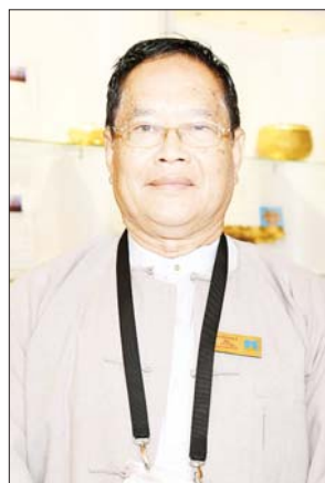
ဒေါက်တာအေးကို