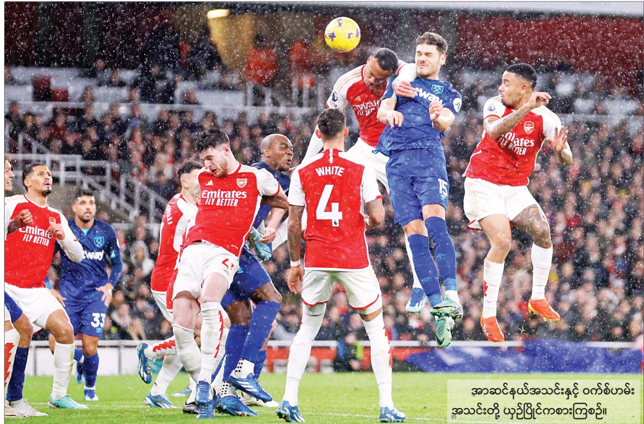
အာဆင်နယ်အသင်းနှင့် ဝက်စ်ဟမ်းအသင်းတို့ ယှဉ်ပြိုင်ကစားကြစဉ်။

နှစ်သစ်ကူးအတွက် ခရီးသွားလာမှုများပြားသော အထင်ကရနေရာများမှ ဈေးအသင့်အတင့်ရှိဟိုတယ်များတွင် အခန်းများကြိုတင်မှာယူမှုပြည့်နေ စာမျက်နှာ » ၁၈