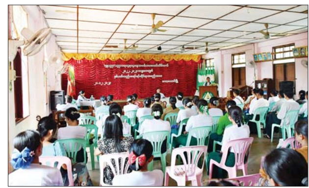
စုဆောင်းငွေအပေါ် အတိုးငွေကျပ် ၁၁၅၈၁၂၃၇ တို့အား ထုတ်ပေးခဲ့ ကြောင်း သိရသည်။