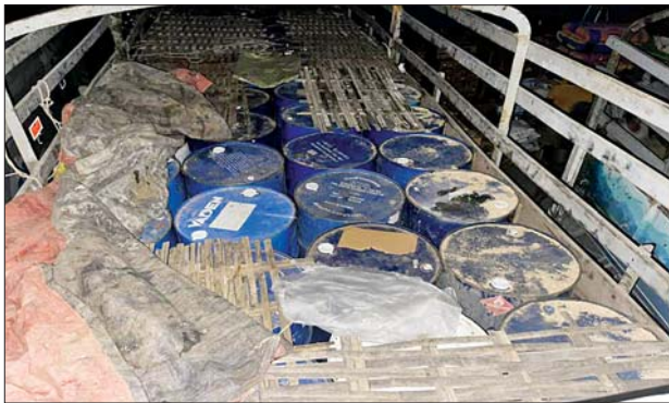
မန္တလေးတိုင်းဒေသကြီး၌ ဖမ်းဆီးရမိမှု။

တရားမဝင်ကုန်သွယ်မှုတိုက်ဖျက်ရေး ဦးဆောင်ကော်မတီ၏ ကြီးကြပ်ကွပ်ကဲမှုဖြင့် တရားမဝင်ကုန်သွယ်မှုများကို ဥပဒေနှင့်အညီ ထိရောက်စွာ တားဆီးအရေးယူနိုင်ရေး ဆောင်ရွက်လျက်ရှိရာ ဒီဇင်ဘာ ၂၆ ရက်တွင် မန္တလေးတိုင်းဒေသကြီး တရားမဝင်ကုန်သွယ်မှုတိုက်ဖျက်ရေး အထူးအဖွဲ့၏စီမံခန့်ခွဲမှုဖြင့် တာဝန်ကျပူးပေါင်းအဖွဲ့က စစ်ဆေးမှုများ ဆောင်ရွက်ရာတွင် လက်ပံလှ-စဉ့်ကူးယာယီ စစ်ဆေးရေးစခန်း၌ မော်တော်ယာဉ်တစ်စီးပေါ်မှ တရားဝင်စာရွက်စာတမ်း အထောက်အထား တင်ပြနိုင်ခြင်းမရှိသည့် စက်သုံးဆီ ဓာတ်ဆီ ၉၂ ဂါလန် ၁၉၂၀ အပါအဝင် ကုန်ပစ္စည်းနှစ်မျိုး (ခန့်မှန်းတန်ဖိုးငွေ ၃၃၇၅၆၇၇၇ ကျပ်)နှင့် အဆိုပါစက်သုံးဆီများ တင်ဆောင်လာသည့် Fuso Truck တစ်စီး (ခန့်မှန်းတန်ဖိုးငွေကျပ် ၂၅၀၀၀၀၀) စုစုပေါင်း ခန့်မှန်းတန်ဖိုးငွေ ၅၈၇၅၆၇၇၇ ကျပ် ) ကို သိမ်းဆည်းရမိခဲ့ပြီး အကောက်ခွန်လုပ်ထုံးလုပ်နည်းများနှင့်အညီ အရေးယူဆောင်ရွက်လျက်ရှိသည်။