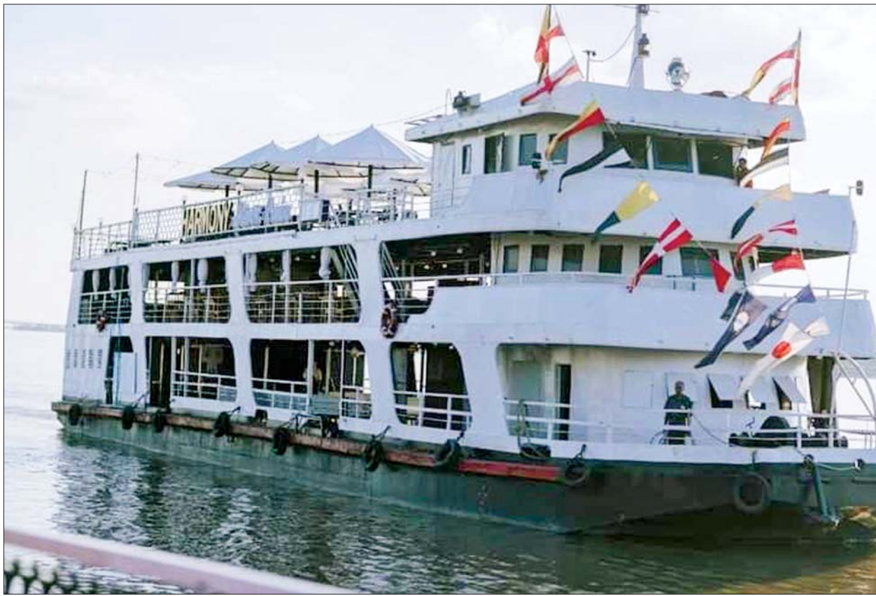
Harmony River Cruise သင်္ဘောကို တွေ့ရစဉ်။

မွန်ပြည်နယ် မော်လမြိုင်မြို့၌ ပထမဆုံး အပန်းဖြေ အပျော်စီးသင်္ဘောခရီးစဉ်ကို Harmony River Cruise သင်္ဘောက အပတ်စဉ် သောကြာ၊ စနေနှင့် တနင်္ဂနွေနေ့တိုင်း ပြေးဆွဲပေးနေကြောင်း အဆိုပါလုပ်ငန်းမှ တာဝန်ရှိသူက ပြောသည်။ စာမျက်နှာ ၃ ကော်လံ ၁ သို့ *