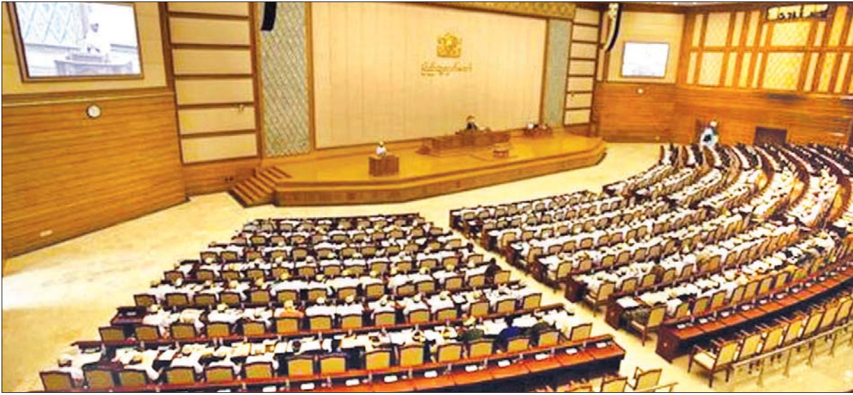
၂၀၁၂ ခုနှစ်အတွင်းက ပြည်သူ့လွှတ်တော်အစည်းအဝေးကျင်းပစဉ်။

မြန်မာနိုင်ငံတွင် လွတ်လပ်ရေးရရှိပြီးချိန်မှစ၍ ၁၉၅၈ ခုနှစ် အထိ ကာလတွင် ဖဆပလအဖွဲ့က ဖွဲ့စည်းခဲ့သော အစိုးရအဖွဲ့များက အုပ်ချုပ်ခဲ့သဖြင့် ထိုကာလကို ဖဆပလခေတ်ဟု ခေါ်ဆိုခဲ့သည်။ လွတ်လပ်ရေးရပြီးစအချိန်တွင် ဖဆပလအဖွဲ့သည် အင်အားကောင်း ခွဲသော်လည်း နောက်ပိုင်း၌ ခေါင်းဆောင်များအတွင်း သဘောထား ကွဲလွဲမှုများ ပေါ်ပေါက်လာခဲ့သည်။ ၁၉၅၈ ခုနှစ် မေလတွင် ဦးနုနှင့် သခင်တင်တို့ ဦးဆောင်သည့် သန့်ရှင်းဖဆပလနှင့် ဦးကျော်ငြိမ်းနှင့် ဦးဘဆွေတို့ ဦးဆောင်သည့် တည်မြဲဖဆပလဟူ၍ နှစ်ခြမ်းကွဲခဲ့သည်။ ၁၉၅၈ ခုနှစ် ဇူလိုင်လတွင် ဦးနုခေါင်းဆောင်သော အစိုးရအဖွဲ့ကို အယုံ အကြည်မရှိကြောင်း တည်မြဲဖဆပလအဖွဲ့က ပါလီမန်အထူး အစည်းအဝေးကျင်းပပြီး အဆိုတင်သွင်း၍ မဲခွဲရာ ထောက်ခံမဲ ၁၁၉ မဲ၊ ကန့်ကွက်မဲ ၁၂၇ မဲဖြင့် သန့်ရှင်းဖဆပလက အနိုင်ရခဲ့သည်။ အနိုင်ရရှိခြင်းမှာ ရခိုင်အမျိုးသားညီညွတ်ရေးအဖွဲ့နှင့် ပြည်သူ့ အမျိုးသားညီညွတ်ရေးတပ်ဦးအပါအဝင် ပမညတတို့ကို အပေး အယူပြုလုပ်ခဲ့ကြကြောင်း သိရသည်။ ဖဆပလအဖွဲ့ကြီး အကွဲအပြဲ ကြောင့် ရောင်စုံသောင်းကျန်းသူများ၏ တိုက်ပွဲများ ပေါ်ပေါက် လာခဲ့သည်။ နိုင်ငံရေးလိုက်လျောမှုအနေဖြင့် တောခိုသူတိုင်းအား လွတ်ငြိမ်းချမ်းသာခွင့်ဥပဒေနှင့် လက်နက်ချအဖွဲ့အစည်းများအား တရားဝင်ထူထောင်ခွင့်ပေးသည့်အမိန့်ကို ၁၉၅၈ ခုနှစ် ဩဂုတ်လ ၁ ရက်နေ့တွင် ထုတ်ပြန်ခဲ့သည်။ ၁၉၅၈ ခုနှစ် စက်တင်ဘာလ ၂၆ ရက်နေ့တွင် ဝန်ကြီးချုပ် ဦးနုက နိုင်ငံတော်၏ အခြေအနေအရပ်ရပ်