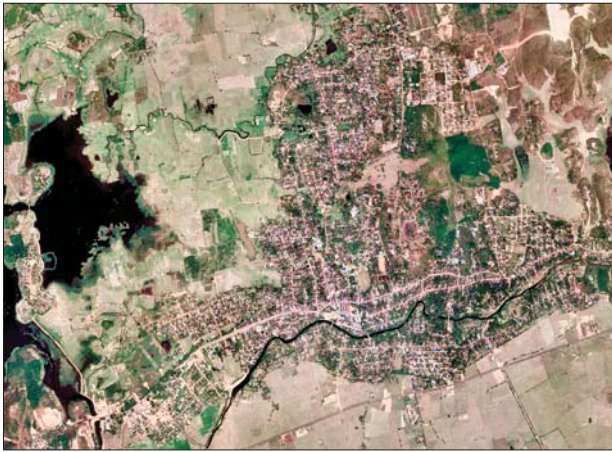
ကော့ကရိတ်မြို့ အမှတ်(၅) ရပ်ကွက်အတွင်းရှိ လူနေအိမ်များအား KKO (ခွဲထွက်)အဖွဲ့နှင့် PDF အမည်ခံအကြမ်းဖက်သမားများ ပူးပေါင်း အဖွဲ့က မီးရှို့ဖျက်ဆီးခဲ့သည့် နေရာပြပုံ။

နေပြည်တော် ဒီဇင်ဘာ ၂၆ ကရင်ပြည်နယ် ကော့ကရိတ် မြို့ အမှတ်(၅)ရပ်ကွက်အတွင်းရှိ လူနေအိမ်များအား KKO (ခွဲထွက်) အဖွဲ့နှင့် PDF အမည်ခံ အကြမ်းဖက် သမားများ ပူးပေါင်းအဖွဲ့က မီးရှို့ ဖျက်ဆီးခဲ့ကြောင်း သိရသည်။