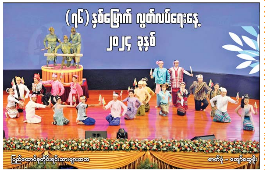
ပြည်ထောင်စုတိုင်းရင်းသားများအက

[နိုင်ငံတော်စီမံအုပ်ချုပ်ရေးကောင်စီဥက္ကဋ္ဌ နိုင်ငံတော်ဝန်ကြီးချုပ် ဗိုလ်ချုပ် မျိုးကြီးမင်းအောင်လှိုင်၏ (၃-၃-၂၀၂၁) ရက်တွင် အမျိုးသားစည်းလုံးညီညွတ်ရေး နှင့်ငြိမ်းချမ်းရေးဖော်ဆောင်မှုဗဟိုကော်မတီ အစည်းအဝေး (၁/၂၀၂၁) တွင် ပြောကြားသည့်အမှာစကားမှ ကောက်နုတ်ချက်]