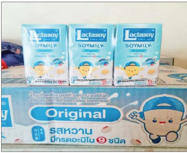
ကရင်ပြည်နယ်၌ သိမ်းဆည်းရမိမှု။

တရားမဝင်ကုန်သွယ်မှုတိုက်ဖျက်ရေး ဦးဆောင်ကော်မတီ၏ ကြီးကြပ်ကွပ်ကဲမှုဖြင့် တရားမဝင် ကုန်သွယ်မှုများကို ဥပဒေနှင့်အညီ ထိရောက်စွာ တားဆီးအရေးယူနိုင်ရေး ဆောင်ရွက်လျက်ရှိရာ ဒီဇင်ဘာ ၂၂ ရက်တွင် ဧရာဝတီတိုင်းဒေသကြီးတရားမဝင်ကုန်သွယ်မှု တိုက်ဖျက်ရေးအထူးအဖွဲ့၏ စီမံခန့်ခွဲမှုဖြင့် တာဝန်ကျပူးပေါင်းအဖွဲ့များက စစ်ဆေးမှုများ ဆောင်ရွက်ရာတွင် ဟင်္သာတခရိုင် လေးမျက်နှာမြို့နယ်၌ တရားမဝင် အခြားသစ် တန် ၃ ဒသမ ၂၇၁ (ခန့်မှန်းတန်ဖိုးငွေကျပ် ၂၂၈၉၇၀)နှင့် မြန်အောင်ခရိုင် အင်္ဂပူမြို့နယ်၌ တရားမဝင် အခြားသစ် တန် ၂၅ ဒသမ ၈၂၀ (ခန့်မှန်းတန်ဖိုးငွေကျပ် ၁၈၀၇၄၅၆)ကို သစ်တော ဥပဒေအရလည်းကောင်း၊ ဖျာပုံမြို့နယ်၌ လိုင်စင်မဲ့ Honda Fit ယာဉ် တစ်စီးနှင့် Nissan Wingroad ယာဉ်တစ်စီး (ခန့်မှန်းတန်ဖိုးငွေကျပ် ၅၅၀၀၀၀)ကို ပို့ကုန်သွင်းကုန်ဥပဒေအရလည်းကောင်း စုစုပေါင်း (ခန့်မှန်းတန်ဖိုးငွေကျပ် ၇၅၂၆၄၂၆)ကို သိမ်းဆည်းအရေးယူဆောင်ရွက် လျက်ရှိသည်။