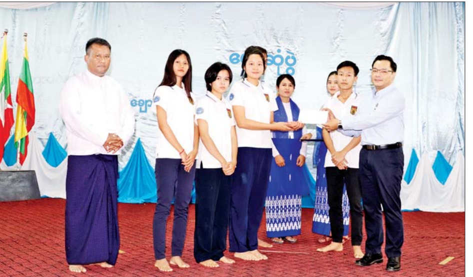
အခက်အခဲတင်ပြမှုများအပေါ် ပေါင်းစပ်ညှိနှိုင်း ဆောင်ရွက်ပေးပြီး ဂုဏ်ပြုလက်ဆောင်များ ပေးအပ်သည်။

ဆက်လက်၍ ဒုတိယဝန်ကြီးသည် အစိုးရစက်မှုလက်မှုသိပ္ပံ(ရေနံချောင်း)သို့ ရောက်ရှိပြီး ဝန်ထမ်းများနှင့်တွေ့ဆုံ၍ ပြည်သူများ၏ အကျိုးစီးပွားဖြစ်ထွန်းစေသော နည်းပညာသင်တန်းများဖြင့် လှုပ်ရှားသက်ဝင်နေသော သိပ္ပံဖြစ်စေရေး ကြိုးပမ်းဆောင်ရွက်ကြရန် တိုက်တွန်းပြောကြားပြီး