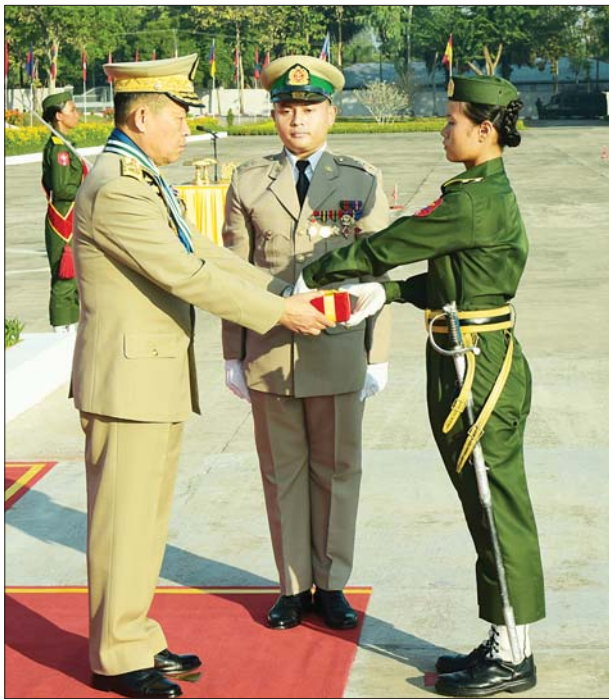
နိုင်ငံတော်စီမံအုပ်ချုပ်ရေးကောင်စီ ဒုတိယဥက္ကဋ္ဌ ဒုတိယ တပ်မတော်ကာကွယ်ရေးဦးစီးချုပ် ကာကွယ်ရေးဦးစီးချုပ်(ကြည်း) ဒုတိယဗိုလ်ချုပ်မှူးကြီး သီရိပျံချို မဟာသရေစည်သူ စိုးဝင်း စာပေ ထူးချွန်ဆုရရှိသူ သင်တန်းသူ အိမ်နီကျော်ကို ဆုပေးအပ်ချီးမြှင့်စဉ်။