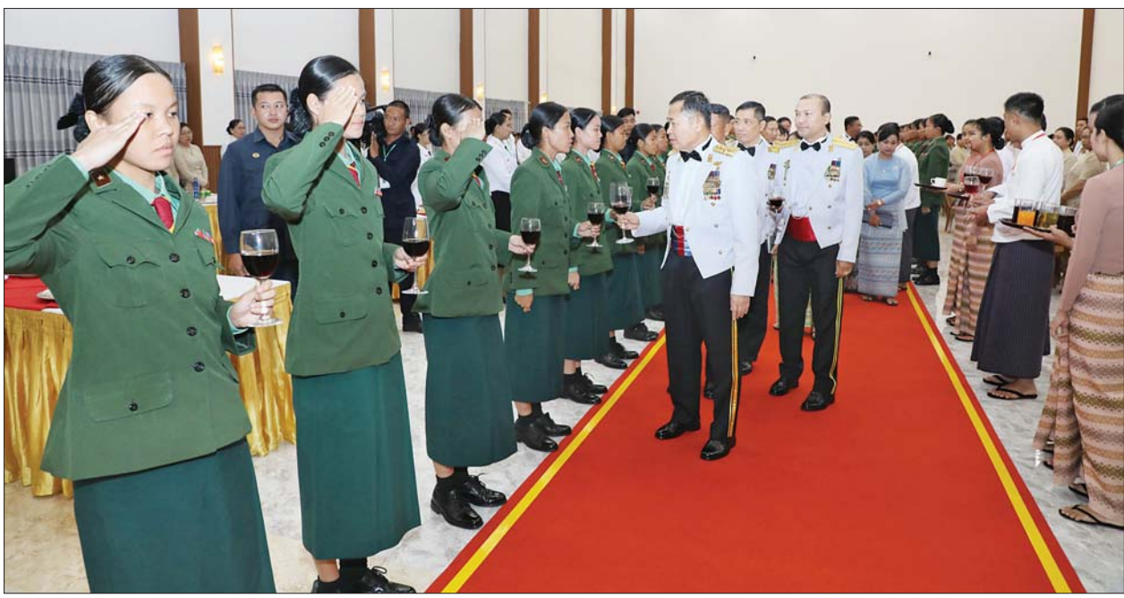
နိုင်ငံတော်စီမံအုပ်ချုပ်ရေးကောင်စီဒုတိယဥက္ကဋ္ဌ ဒုတိယတပ်မတော်ကာကွယ်ရေးဦးစီးချုပ် ကာကွယ်ရေးဦးစီးချုပ်(ကြည်း) ဒုတိယ ဗိုလ်ချုပ်မှူးကြီး သီရိပျံချီ မဟာသရေစည်သူစိုးဝင်း တပ်မတော်သူနာပြုနှင့် ဆေးဘက်ပညာတက္ကသိုလ်၊ သူနာပြုနှင့် ဆေးဘက်ပညာသိပ္ပံဘွဲ့ သင်တန်းအမှတ်စဉ်(၂၁)နှင့် အမျိုးသမီးသူနာပြုနှင့် ဆေးဘက်ပညာသိပ္ပံဘွဲ့သင်တန်း အမှတ်စဉ်(၈) သင်တန်းဆင်း ဂုဏ်ပြုညစာစားပွဲ အခမ်းအနားတွင် သင်တန်းဆင်းသူနာပြုများအား ရင်းရင်းနှီးနှီးနှုတ်ဆက်စဉ်။

စုစည်းညီညွတ်သည့်အားနှင့် ပြည်ထောင်စုကြီးကို ကာကွယ်စောင့်ရှောက် တပ်မတော်သည် နိုင်ငံတော်၏ အစိတ်အပိုင်း ဖြစ်သကဲ့သို့ တပ်မတော်သားများသည်လည်း ပြည်သူများ၏ အစိတ်အပိုင်းဖြစ် ကြောင်း၊ ပြည့်အင်အားသည် ပြည်တွင်းမှာသာရှိသည့်အတွက် ပြည်သူလူထု၏အားကို အရင်း တည်ပြီး စုစည်းညီညွတ်သည့် အားနှင့် ပြည်ထောင်စုကြီးကို ကာကွယ်စောင့်ရှောက်သွားရမည် ဖြစ်ကြောင်း၊ ထိုသို့ကာကွယ်စောင့် ရှောက်ရာတွင်လည်း သမိုင်းပေး သင်ခန်းစာများအရ ပြည်ထောင်စု မပြိုကွဲရေး၊ တိုင်းရင်းသားစည်းလုံး ညီညွတ်မှုမပြိုကွဲရေးနှင့် အချုပ် အခြာအာဏာ တည်တံ့ခိုင်မြဲရေး ဆိုသည့် ဒီတာဝန်အရေးသုံးပါးကို ပြည်ထောင်စု စိတ်ဓာတ်နှင့်