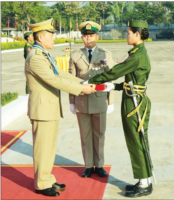
နိုင်ငံတော်စီမံအုပ်ချုပ်ရေးကောင်စီ ဒုတိယဥက္ကဋ္ဌ ဒုတိယ တပ်မတော်ကာကွယ်ရေးဦးစီးချုပ် ကာကွယ်ရေးဦးစီးချုပ်(ကြည်း) ဒုတိယဗိုလ်ချုပ်မှူးကြီး သီရိပျံချို မဟာသရေစည်သူ စိုးဝင်း လေ့ကျင့် ရေး ထူးချွန်ဆုရရှိသူ သင်တန်းသူ သီရိပါဝါကို ဆုပေးအပ်ချီးမြှင့်စဉ်။