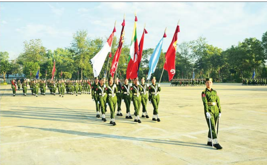
နိုင်ငံတော်စီမံအုပ်ချုပ်ရေးကောင်စီဒုတိယဥက္ကဋ္ဌ ဒုတိယတပ်မတော်ကာကွယ်ရေးဦးစီးချုပ် ကာကွယ်ရေးဦးစီးချုပ် (ကြည်း) ဒုတိယဗိုလ်ချုပ်မှူးကြီး သီရိပျံချီ မဟာသရေစည်သူ စိုးဝင်း သင်တန်းဆင်းတပ်ခွဲများ၏ အလေးပြုခြင်းကို ခံယူစဉ်။