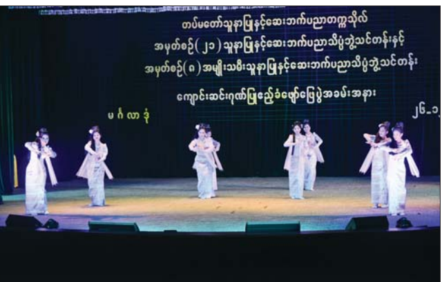
နိုင်ငံတော်စီမံအုပ်ချုပ်ရေးကောင်စီဒုတိယဥက္ကဋ္ဌ ဒုတိယတပ်မတော်ကာကွယ်ရေးဦးစီးချုပ် ကာကွယ်ရေးဦးစီးချုပ်(ကြည်း) ဒုတိယဗိုလ်ချုပ်မှူးကြီး သီရိပျံချီ မဟာသရေစည်သူစိုးဝင်းနှင့် အဖွဲ့ဝင်များ မြဝတီတေးဂီတအဖွဲ့၏ ဂုဏ်ပြုဖျော်ဖြေတင်ဆက်မှုကို ကြည့်ရှု အားပေးစဉ်။

ပြည်ထောင်စုတည်ဆောက်ရေး အတွက် အလေးထားကြိုးပမ်း ဆောင်ရွက်လျက်ရှိကြောင်း၊ ထိုသို့ ဆောင်ရွက်ရာတွင် စစ်မှန် စည်းကမ်းပြည့်ဝသည့် ပါတီစုံ ဒီမိုကရေစီစနစ် ခိုင်မာရေးနှင့် ဒီမိုကရေစီနှင့် ဖက်ဒရယ်စနစ်ကို အခြေခံသည့် ပြည်ထောင်စု တည်ဆောက်ရေးဆိုသည့် နိုင်ငံ ရေး ရည်မှန်းချက် ၂ ရပ်ကိုလည်း ချမှတ် အကောင်အထည်ဖော် လျက်ရှိကြောင်း၊ ထိုသို့ဆောင်ရွက် ရန်အတွက် တိုင်းရင်းသားလူမျိုး ပေါင်းစုံစုစည်းနေထိုင်သည့် မိမိ တို့နိုင်ငံအနေဖြင့် တိုင်းရင်းသား အချင်းချင်း သွေးမကွဲဘဲ