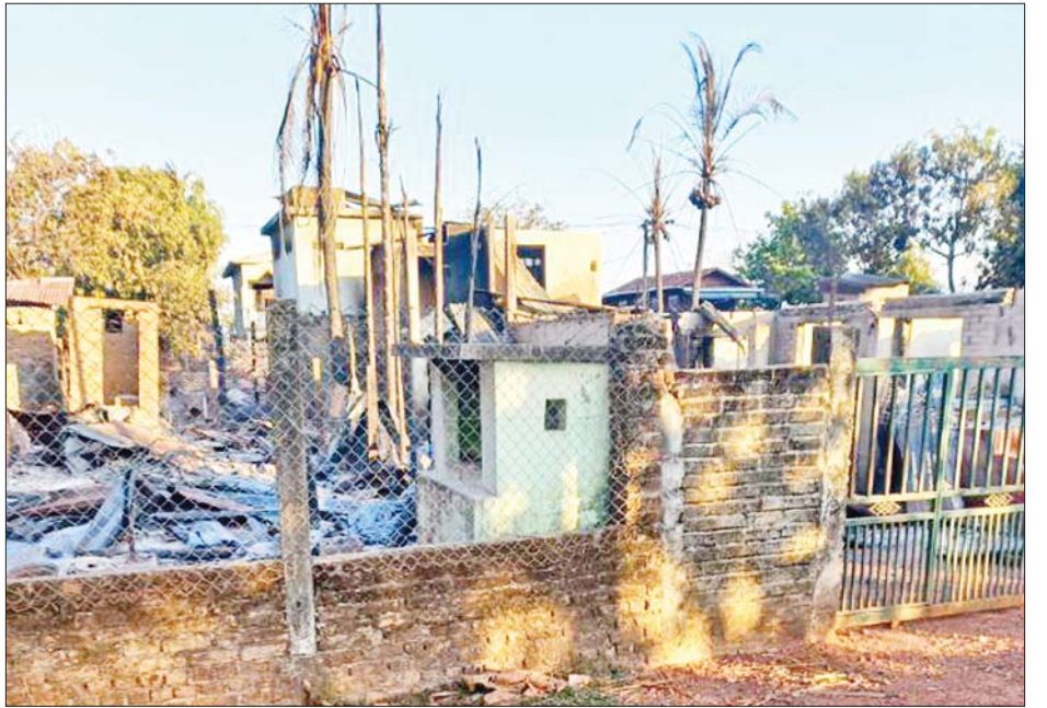
ကော့ကရိတ်မြို့ အမှတ်(၅) ရပ်ကွက် မီးလောင်ပျက်စီးမှု မှတ်တမ်းဓာတ်ပုံ။

ဆောင်ရွက်ရာ နံနက် ၈ နာရီခန့် တွင် မီးငြိမ်းသွားခဲ့ကြောင်း၊ မီးလောင်မှုကြောင့် နေအိမ် ၁၆ လုံး မီးလောင် ပျက်စီးခဲ့ကြောင်းနှင့် လူထိခိုက်မှုမရှိကြောင်း သိရသည်။ ယခုကဲ့သို့ အပြစ်မဲ့ပြည်သူများ အား အိုးမဲ့အိမ်မဲ့ဖြစ်အောင် နေအိမ်များကို အကြောင်းမဲ့ မီးရှို့ ဖျက်ဆီးခဲ့သည့် အကြမ်းဖက် သမားများအား ဒေသခံပြည်သူ