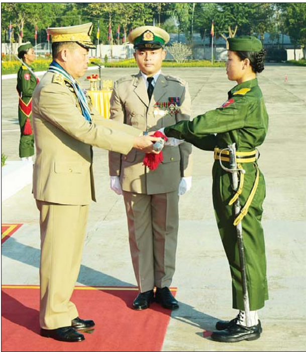
နိုင်ငံတော်စီမံအုပ်ချုပ်ရေးကောင်စီ ဒုတိယဥက္ကဋ္ဌ ဒုတိယ တပ်မတော်ကာကွယ်ရေးဦးစီးချုပ် ကာကွယ်ရေးဦးစီးချုပ်(ကြည်း) ဒုတိယဗိုလ်ချုပ်မှူးကြီး သီရိပျံချို မဟာသရေစည်သူ စိုးဝင်း အကောင်းဆုံးသင်တန်းသူဆုရရှိသူ သင်တန်းသူ နန်းနွယ်နွယ်အေးကို ဆုပေးအပ်ချီးမြှင့်စဉ်။