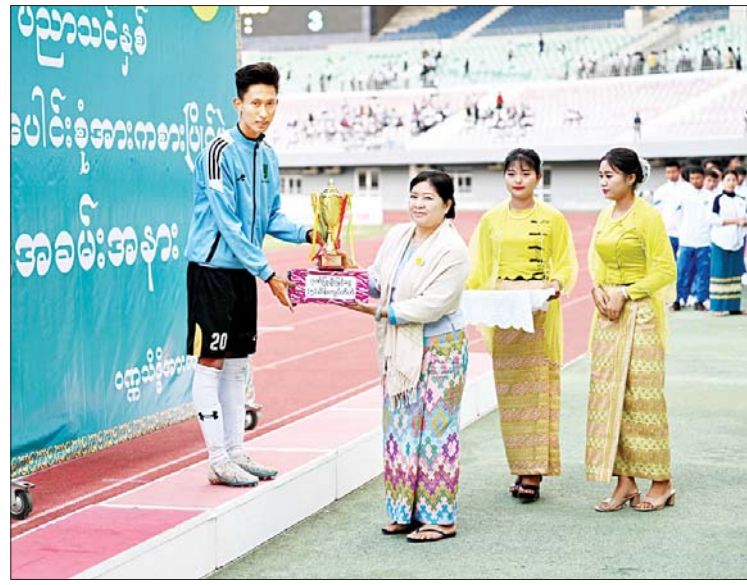
နိုင်ငံတော် စီမံအုပ်ချုပ်ရေးကောင်စီအဖွဲ့ဝင် ဒေါ်ခွဲဘူ ပွဲစဉ် တစ်လျှောက် အကောင်းဆုံးအားကစားသမားဆု ရရှိသူအား အကောင်းဆုံးဆုတံဆိပ်နှင့် ဂုဏ်ပြုဆုငွေ ပေးအပ်ချီးမြှင့်စဉ်။