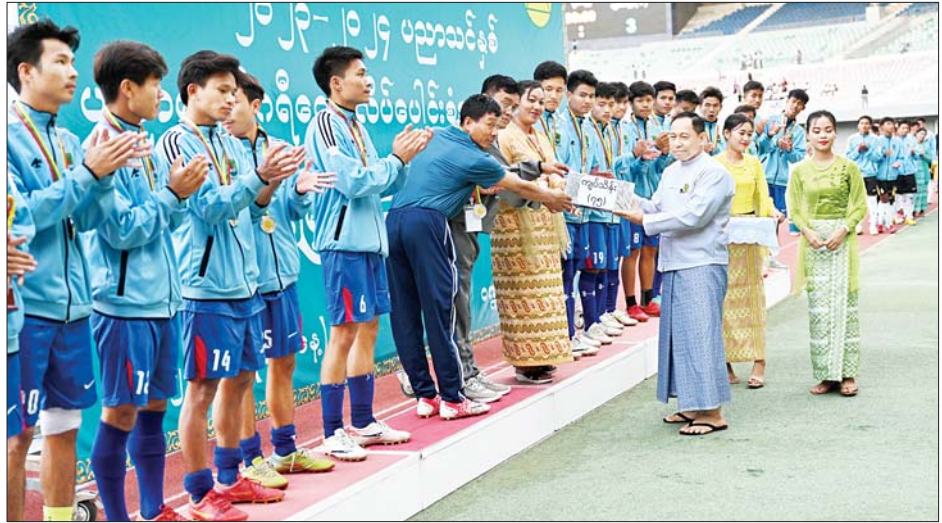
နိုင်ငံတော်စီမံအုပ်ချုပ်ရေးကောင်စီအဖွဲ့ဝင် ဒုတိယဗိုလ်ချုပ်ကြီးရဲပြည့် ဒုတိယဆုရရှိသည့် မန္တလေးဇုန် (က)အသင်းကို တစ်ဦးချင်းဆုတံဆိပ်များနှင့် ဂုဏ်ပြုဆုငွေများ ပေးအပ်ချီးမြှင့်စဉ်။