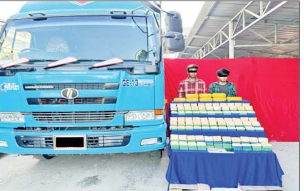
မြူးဝေယံ(ခ)လွန်ပီးနှင့် ခမ်းလျှင်းမှတို့အား သိမ်းဆည်းရမိသည့် မူးယစ်ဆေးဝါးများနှင့်အတူ တွေ့ရစဉ်။

နေပြည်တော် ဒီဇင်ဘာ ၂၆ မူးယစ်ဆေးဝါး တားဆီးနှိမ်နင်း ရေးရဲတပ်ဖွဲ့မှ တပ်ဖွဲ့ဝင်များ ပါဝင် သော ပူးပေါင်းအဖွဲ့သည် ဒီဇင်ဘာ ၂၅ ရက် မွန်းလွဲ ၂ နာရီတွင် ဗန်းမော်မြို့ သာစည်ရပ်ကွက် ဂျူဗလီလမ်းမပေါ်၌ ခန့်ညား ကျော် မောင်းနှင်ပြီး မလေပြေ နွေးနွေး လိုက်ပါလာသည့် ဆိုင်ကယ်ကို ရပ်တန့်စစ်ဆေး ရှာဖွေရာ စိတ်ကြွေးသွပ်ဆေးပြား ၇၈၀၀ ကိုလည်းကောင်း။