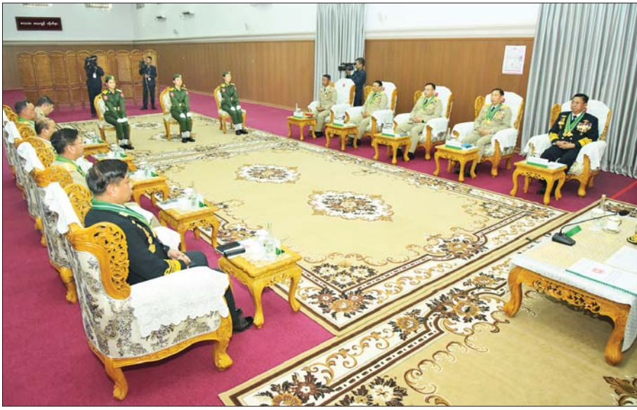
နိုင်ငံတော်စီမံအုပ်ချုပ်ရေးကောင်စီဒုတိယဥက္ကဋ္ဌ ဒုတိယတပ်မတော် ကာကွယ်ရေးဦးစီးချုပ် ကာကွယ်ရေးဦးစီးချုပ်(ကြည်း) ဒုတိယဗိုလ်ချုပ်မှူးကြီး သီရိပျံချို မဟာ သရေစည်သူ စိုးဝင်း ထူးချွန်ဆုရရှိကြသည့် သင်တန်းသူများအား တွေ့ဆုံ၍ ဂုဏ်ပြုအမှာစကားပြောကြားစဉ်။

ဆေးဝါးနှင့် ဆေးဘက်ဆိုင်ရာ နည်းပညာ သင်တန်းသား သင်တန်းသူများသည်လည်း အမိ တက္ကသိုလ်က သင်ကြားပေးလိုက် သည့် ပညာရပ်များကို ကျွမ်းကျင် ပိုင်နိုင်စွာအသုံးပြုပြီး ဆေးရုံ၊ ဆေးတပ်ဖွဲ့များတွင် တာဝန် အသီးသီးကို ထမ်းဆောင်သွားကြ ရတော့မည်ဖြစ်ကြောင်း၊ ဆေးဝါး ကျွမ်းကျင်သူများအနေနှင့် လူသား တို့၏ ကျန်းမာရေးအတွက် အသုံး ဝင်နိုင်သည့် သစ်ပင်၊ သစ်မြစ်၊ သစ်ညှု၊ သစ်ဖုများ၏ မည်သည့် အစိတ်အပိုင်းများက အသုံးဝင်နိုင် ကြောင်းကို လေ့လာနေကြရမည် ဖြစ်ကြောင်း၊ နွယ်မြက်သစ်ပင်များ ၏ သဘာဝပစ္စည်း၊ ဓာတ်ပစ္စည်း၊ ရုပ်ဂုဏ်သတ္တိ၊ ဓာတ်ဂုဏ်သတ္တိ များမှတစ်ဆင့် ဆေးဝါးဆိုင်ရာ အာနိသင်များကိုလူသားတို့အသုံး ပြုနိုင်ရန် ရှာဖွေဖော်စပ်နေကြရ မည်ဖြစ်ကြောင်း၊ ထိုသို့ဖော်စပ်ရာ တွင် အသုံးပြုသည့် စက်ပစ္စည်း ကိရိယာများ အကြောင်းကို နားလည်ရမည့်အပြင် ကျွမ်းကျင် ပိုင်နိုင်စွာ အသုံးပြုတတ်ရန်လည်း လိုအပ်ကြောင်း၊ ဆေးဝါးများကို ထိန်းသိမ်းခြင်း၊ လူနာလက်ဝယ်သို့ မပျက်မစီး မှန်မှန်ကန်ကန်ရောက် ရှိအောင် ဆောင်ရွက်ပေးခြင်းတို့ သည်လည်း ဆေးဝါးကျွမ်းကျင်သူ များ၏ လုပ်ငန်းတာဝန်များပင်ဖြစ် ကြောင်း။