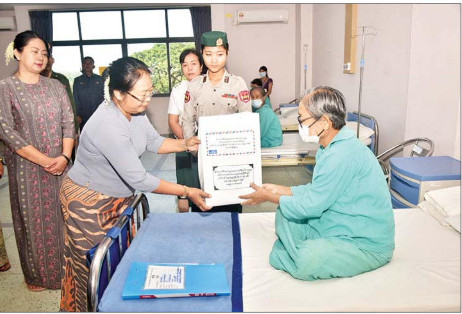
နိုင်ငံတော်စီမံအုပ်ချုပ်ရေးကောင်စီ ဒုတိယဥက္ကဋ္ဌ ဒုတိယတပ်မတော်ကာကွယ်ရေးဦးစီးချုပ် ကာကွယ် ရေးဦးစီးချုပ်(ကြည်း) ဒုတိယဗိုလ်ချုပ်မှူးကြီး စိုးဝင်း၏ဇနီး ဒေါ်သန်းသန်းနွယ် အထူးကုသမှုစင်တာ၌ တက်ရောက်ဆေးကုသမှုခံယူလျက်ရှိသည့် ရဲမေများနှင့် မိသားစုဝင်များအား စားသောက်ဖွယ်ရာနှင့် ထောက်ပံ့ပစ္စည်းများ ပေးအပ်စဉ်။

ပြောကြားပြီး စားသောက်ဖွယ်ရာ များနှင့် ထောက်ပံ့ငွေများ ပေးအပ် သည်။ အလားတူ နိုင်ငံတော်စီမံ အုပ်ချုပ်ရေးကောင်စီ ဒုတိယဥက္ကဋ္ဌ ဒုတိယတပ်မတော် ကာကွယ်ရေး ဦးစီးချုပ် ကာကွယ်ရေးဦးစီးချုပ် (ကြည်း)၏ဇနီး ဒေါ်သန်းသန်းနွယ် နှင့် အဖွဲ့ဝင်များသည် အထူးကုသ မှုစင်တာ၌ တက်ရောက်ဆေးကုသ မှုခံယူလျက်ရှိသည့် ရဲမေများနှင့် မိသားစုဝင်များအား လိုက်လံ ကြည့်ရှုကာတစ်ဦးချင်း၏ ရောဂါ ဖြစ်ပွားမှုအခြေအနေများ၊ ဆေးဝါး ကုသပေးထားမှု အခြေအနေများ နှင့် ကျန်းမာရေးတိုးတက် ကောင်းမွန်မှုအခြေအနေများအား ရင်းရင်းနှီးနှီး မေးမြန်းအားပေး စကားပြောကြားပြီး စားသောက် ဖွယ်ရာများ ပေးအပ်သည်။ ထို့နောက် နိုင်ငံတော်စီမံ