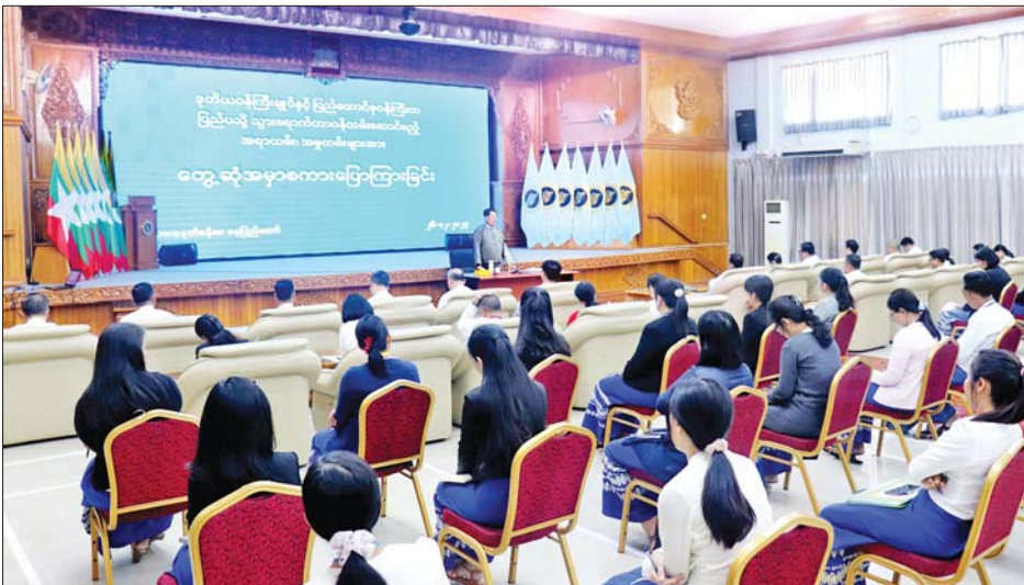
ဒုတိယဝန်ကြီးချုပ်နှင့် ပြည်ထောင်စုဝန်ကြီးဦးသန်းဆွေ မြန်မာသံရုံး၊ မြန်မာအမြဲတမ်းကိုယ်စားလှယ်အဖွဲ့ရုံးနှင့် မြန်မာကောင်စစ်ဝန်ချုပ်ရုံးများသို့ သွားရောက်တာဝန်ထမ်းဆောင်ကြမည့် အရာထမ်း / အမှုထမ်းများအား တွေ့ဆုံအမှာစကားပြောကြားစဉ်။

ပြည်ပရှိမြန်မာသံရုံး၊ မြန်မာအမြဲတမ်းကိုယ်စားလှယ်အဖွဲ့ရုံးနှင့် မြန်မာကောင်စစ်ဝန်ချုပ်ရုံးများသို့ သွားရောက်တာဝန်ထမ်းဆောင်ကြမည့် သံအမတ်ကြီးများ၊ သံရုံးယာယီတာဝန်ခံများနှင့် အရာထမ်း၊ အမှုထမ်းများအား ဒုတိယဝန်ကြီးချုပ်နှင့် ပြည်ထောင်စုဝန်ကြီးက တွေ့ဆုံအမှာစကားပြောကြားသည့် အခမ်းအနားကို ယနေ့နံနက် ၁၀ နာရီတွင် နိုင်ငံခြားရေးဝန်ကြီးဌာန လောကနတ်ခန်းမ၌ ကျင်းပရာ ဒုတိယဝန်ကြီးချုပ်နှင့် နိုင်ငံခြားရေးဝန်ကြီးဌာန ပြည်ထောင်စုဝန်ကြီး ဦးသန်းဆွေ၊ ဒုတိယဝန်ကြီး ဦးကျော်မျိုးထွဋ်နှင့် ဦးလွင်ဦး၊ သံအမတ်ကြီးများ၊ ညွှန်ကြားရေးမှူးချုပ်များ၊ ဒုတိယညွှန်ကြားရေးမှူးချုပ်များနှင့် ပြည်ပသို့ သွားရောက်တာဝန်ထမ်းဆောင်ကြမည့် အရာထမ်း၊ အမှုထမ်းများ တက်ရောက်ကြသည်။