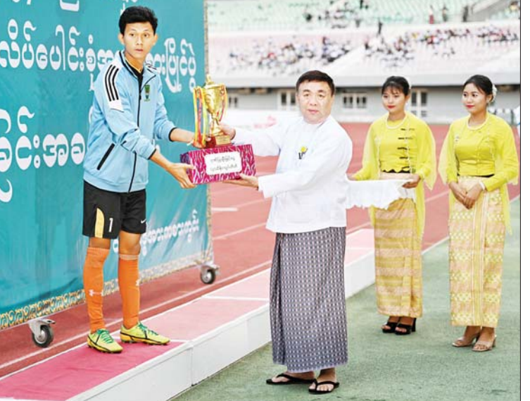
နိုင်ငံတော် စီမံအုပ်ချုပ်ရေးကောင်စီအဖွဲ့ဝင် ဒေါက်တာမူထန် အကောင်းဆုံးနောက်တန်းဆု ရရှိသူအား အကောင်းဆုံး ဆုတံဆိပ်နှင့် ဂုဏ်ပြုဆုငွေ ပေးအပ်ချီးမြှင့်စဉ်။