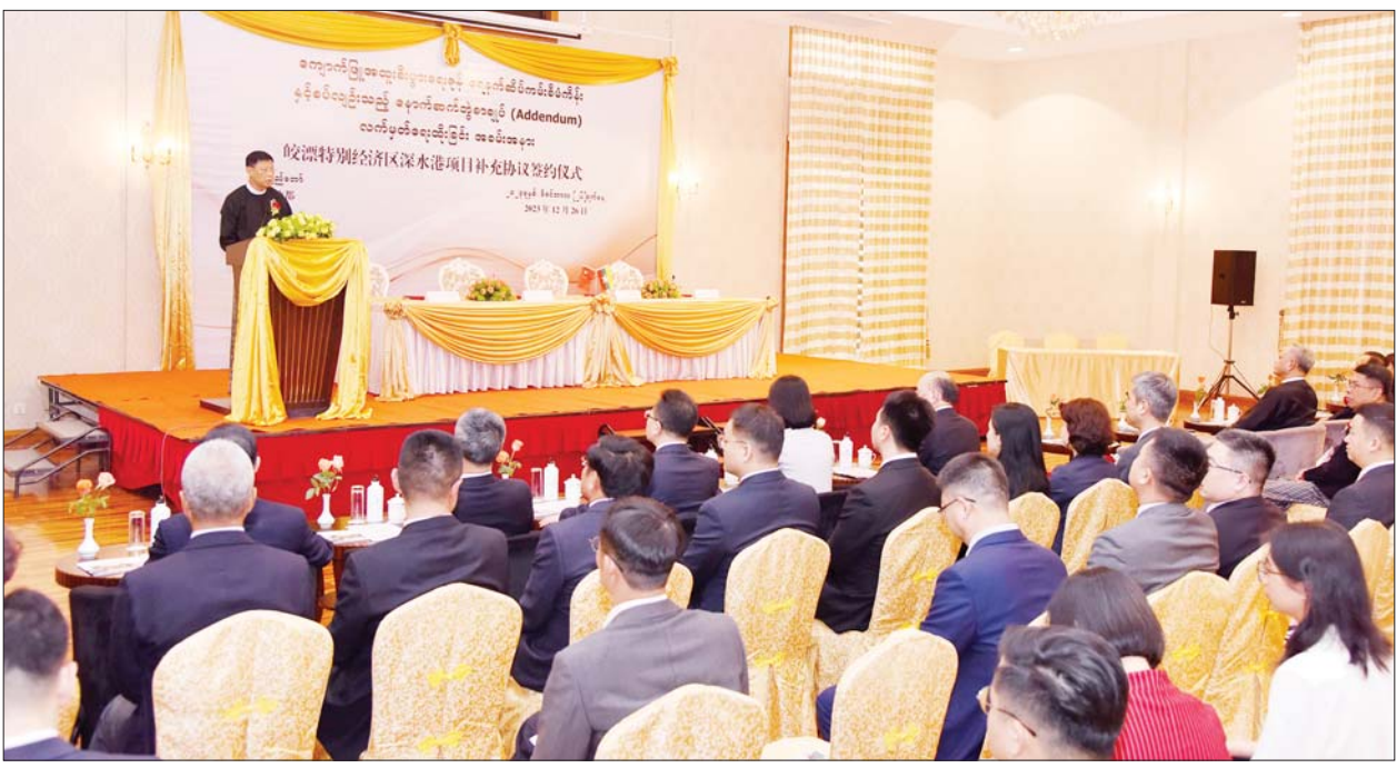
နိုင်ငံတော်စီမံအုပ်ချုပ်ရေးကောင်စီအဖွဲ့ဝင် ဒုတိယဝန်ကြီးချုပ်နှင့် ပြည်ထောင်စုဝန်ကြီး ဗိုလ်ချုပ်ကြီးမြထွန်းဦး ကျောက်ဖြူ အထူးစီးပွားရေးဇုန် ရေနက်ဆိပ်ကမ်းစီမံကိန်း အကောင်အထည်ဖော်ဆောင်ရွက်နိုင်ရေးအတွက် နောက်ဆက်တွဲစာချုပ် (Addendum) လက်မှတ်ရေးထိုးခြင်းအခမ်းအနားတွင် အမှာစကားပြောကြားစဉ်။

နေပြည်တော် ဒီဇင်ဘာ ၂၆ ကျောက်ဖြူ အထူးစီးပွားရေးဇုန်တွင် ရေနက်ဆိပ်ကမ်းစီမံကိန်း အကောင်အထည်ဖော်ဆောင်ရွက်နိုင်ရေးအတွက် လုပ်ငန်းလုပ်ကိုင်ခွင့် သဘောတူစာချုပ် (Concession Agreement) ကို ဖြည့်စွက်သည့် နောက်ဆက်တွဲစာချုပ် (Addendum) လက်မှတ်ရေးထိုးခြင်းအခမ်းအနားကို ယနေ့ညနေပိုင်းတွင် နေပြည်တော်ရှိ Horizon Lake View Hotel ၌ ကျင်းပရာ မြန်မာအထူးစီးပွားရေးဇုန်ဆိုင်ရာ ဗဟိုအဖွဲ့ဝင် နိုင်ငံတော်စီမံအုပ်ချုပ်ရေးကောင်စီအဖွဲ့ဝင် ဒုတိယဝန်ကြီးချုပ်နှင့် ပို့ဆောင်ရေးနှင့် ဆက်သွယ်ရေး ဝန်ကြီးဌာန ပြည်ထောင်စုဝန်ကြီး ဗိုလ်ချုပ်ကြီး မြထွန်းဦး တက်ရောက် အမှာစကား ပြောကြားသည်။