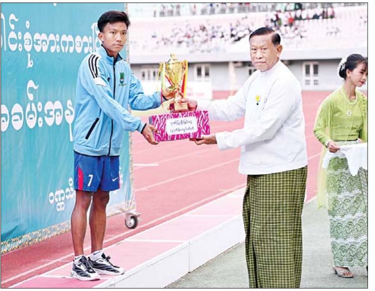
နိုင်ငံတော် စီမံအုပ်ချုပ်ရေးကောင်စီအဖွဲ့ဝင် ပိုးရယ်အောင်သိန်း အကောင်းဆုံးရှေ့တန်းဆု ရရှိသူအား အကောင်းဆုံး ဆုတံဆိပ်နှင့် ဂုဏ်ပြုဆုငွေ ပေးအပ်ချီးမြှင့်စဉ်။