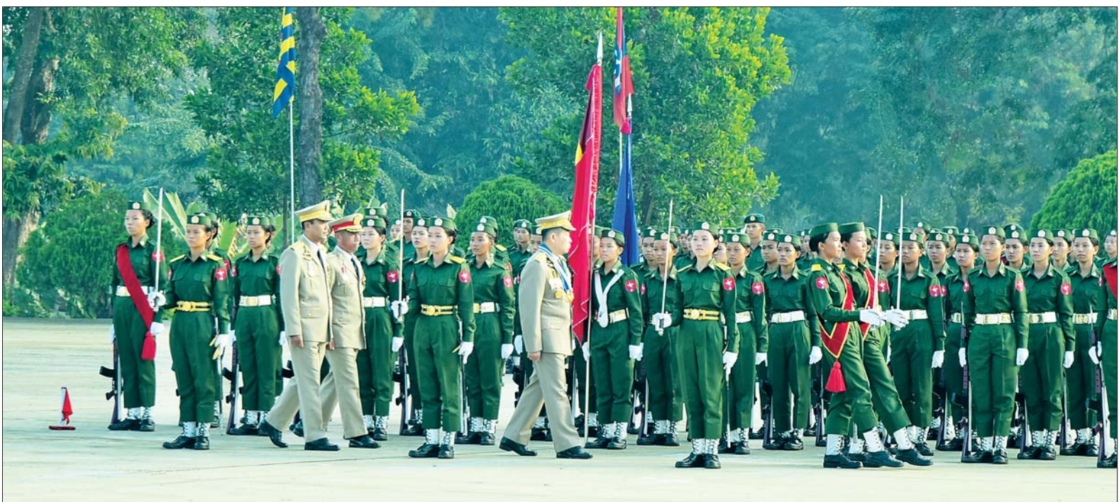
နိုင်ငံတော်စီမံအုပ်ချုပ်ရေးကောင်စီဒုတိယဥက္ကဋ္ဌ ဒုတိယတပ်မတော်ကာကွယ်ရေးဦးစီးချုပ် ကာကွယ်ရေးဦးစီးချုပ်(ကြည်း) ဒုတိယဗိုလ်ချုပ်မှူးကြီး သီရိပျံချီ မဟာသရေစည်သူ စိုးဝင်း သင်တန်းဆင်းတပ်ခွဲများအား စစ်ဆေးစဉ်။

အဆိုပါ အခမ်းအနားသို့ နိုင်ငံတော် စီမံအုပ်ချုပ်ရေးကောင်စီ ဒုတိယဥက္ကဋ္ဌ ဒုတိယတပ်မတော်ကာကွယ်ရေးဦးစီးချုပ် ကာကွယ်ရေးဦးစီးချုပ်(ကြည်း)နှင့်အတူ ဇနီးဒေါ်သန်းသန်းနွယ်၊ ပြည်ထောင်စုဝန်ကြီးများနှင့်ဇနီးများ၊ ကာကွယ်ရေးဦးစီးချုပ်ရုံးမှ တပ်မတော်အရာရှိကြီးများနှင့်ဇနီးများ၊ ရန်ကုန်တိုင်းဒေသကြီး ဝန်ကြီးချုပ်၊ ရန်ကုန်တိုင်း စစ်ဌာနချုပ်တိုင်းမှူး၊ တပ်မတော်သူနာပြုနှင့်ဆေးဘက်ပညာ တက္ကသိုလ်ကျောင်းအုပ်ကြီး၊ ရန်ကုန်တပ်နယ်မှ တာဝန်ရှိသူများ၊ ကျောင်းဆင်းသင်တန်းသား၊ သင်တန်းသူများ၏ မိဘအုပ်ထိန်းသူများဖြစ်သည့် တပ်မတော်သူနာပြုနှင့်ဆေးဘက်ပညာတက္ကသိုလ် စာပေဌာနနှင့် လေ့ကျင့်ရေးဌာနတို့မှ နည်းပြစာမျက်နှာ ၆ ကော်လံ ၁ သို့ ❖