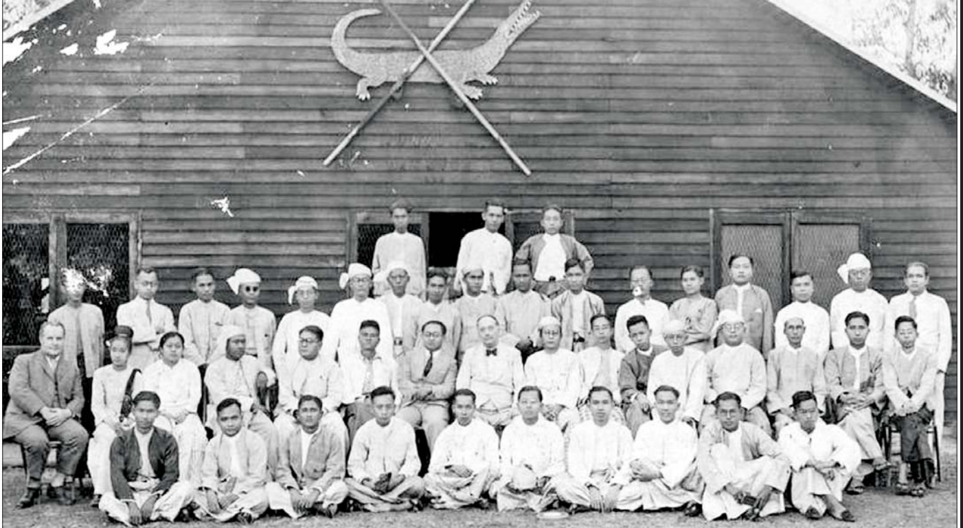
၁၉၃၉ ခုနှစ်က ရန်ကုန်မြို့ အင်းယားကန်လှေလှော်အသင်းအဆောက်အအုံတွင် ကမ္ဘာကျော်စာရေးဆရာကြီး HG. Well နှင့် မြန်မာစာရေးဆရာ၊ သတင်းစာဆရာများတွေ့ဆုံပွဲ မှတ်တမ်းဓာတ်ပုံ။

တက္ကသိုလ်မြတ်သူ လှေကားဆက်ထက် အပေါ်ပေါ်မှာ ထီးဖြူတော်နှစ်လက်ကြောင့် အသက်ထွက်လွယ်စေ ဓားနှစ်ချက်မွှေ။ လေးလက်ဖြင့် လေးချက်မွှေမယ်၊ ဘေးသက်သေ လက်ငင်းကွဲလေး။ မြန်မာ့လွတ်လပ်ရေးကြိုးပမ်းမှုကို ပံ့ပိုးသောစာများ သီပေါလွန် နယ်ချဲ့ကျွန်ခေတ်တစ်လျှောက် မြန်မာသတင်းစာများ(အမျိုးအမည် တစ်ရာမက) ထုတ်ဝေခဲ့ကြပြီး နယ်ချဲ့ကို သတင်းမှန်များဖြင့် ထိုးနှက်တိုက်ခိုက်ခဲ့ကြရာ ကျွန်တော်တို့မိသော မျက်မှောက်ခေတ်မှာပင် ဆရာ ဆရာကြီးများ၏ မျိုးချစ်စိတ်၊ ဇာတိသွေး ဇာတိမာန်ဖြင့် ရေးသားကာ