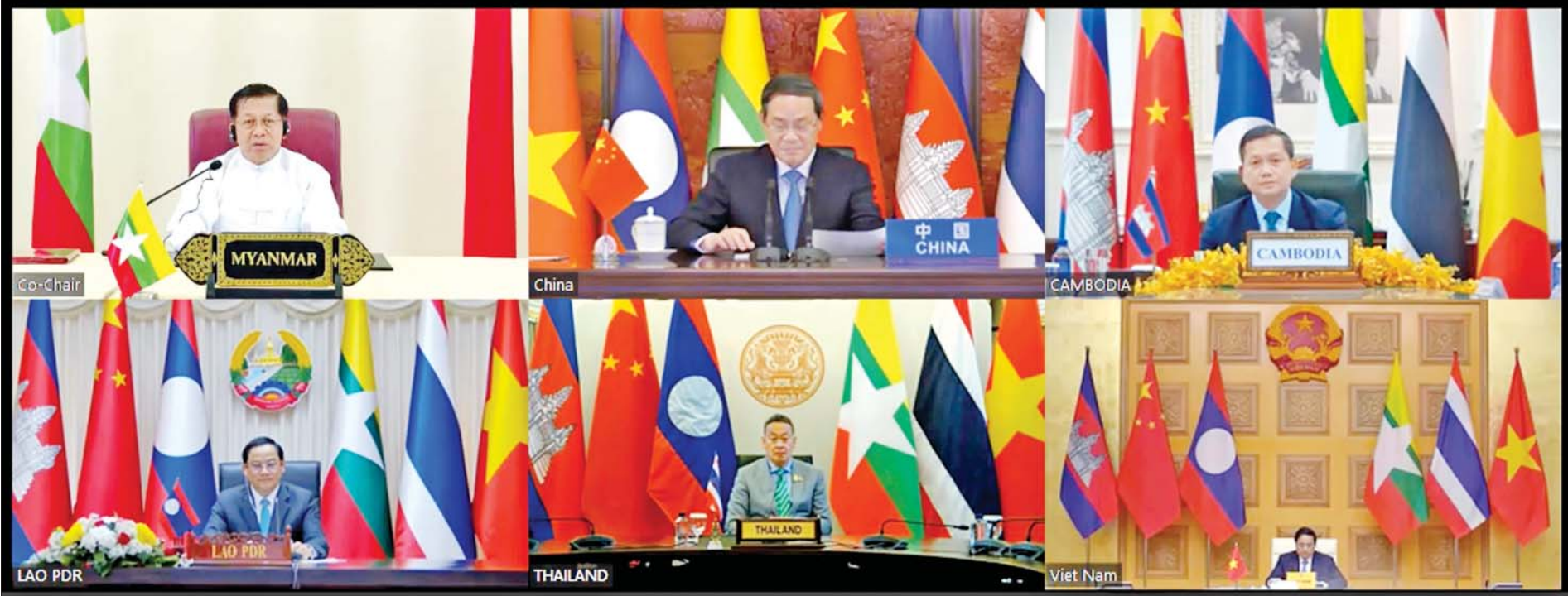
နိုင်ငံတော်စီမံအုပ်ချုပ်ရေးကောင်စီဥက္ကဋ္ဌ နိုင်ငံတော်ဝန်ကြီးချုပ် ဗိုလ်ချုပ်မှူးကြီးမင်းအောင်လှိုင် (၄)ကြိမ်မြောက် မဲခေါင်-လန်ချန်း ပူးပေါင်းဆောင်ရွက်မှု နိုင်ငံ့ခေါင်းဆောင်များ အစည်းအဝေးသို့ ဗီဒီယိုကွန်ဖရင့်ဖြင့် တက်ရောက် ဆွေးနွေးစဉ်။