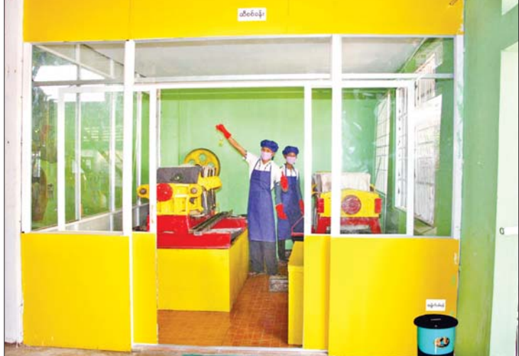
ဆီသန့်စင်ခြင်း ဆောင်ရွက်နေစဉ်။

ဖြေ။ ။ နိုင်ငံတော်က ထပ်မံပြဋ္ဌာန်းလိုက်တဲ့ဥပဒေက တကယ်ကောင်းပါတယ်။ ဘာလို့လဲဆိုတော့ ဆီကို နိုင်ငံရဲ့ အရေးကြီးထုတ်ကုန်အဖြစ် သတ်မှတ်ပြီး သားဖြစ်တဲ့အတွက် ဆီစက်တွေက FDA ခွင့်ပြုချက်မရရင် စက်မှုကနေ ထုတ်မပေးတဲ့ အနေအထားဖြစ်ပါတယ်။ ဆီစက်လည်ပတ်မယ်ဆိုရင် ကျန်းမာရေးနဲ့ ညီညွတ်တဲ့ဆီကို ထုတ်လုပ်ဖို့ နိုင်ငံတော်က သတ်မှတ်ထားတဲ့ စည်းမျဉ်းစည်းကမ်းတွေကိုလိုက်နာဖို့ အဓိကလိုပါတယ်။ ဆီလုပ်ငန်းလုပ်ကိုင်မယ်ဆိုရင် FDA လက်မှတ်ကိုရအောင် လုပ်ပါလို့ပဲ တိုက်တွန်းလိုပါတယ်။ စက်မှုက လိုင်စင်အသစ်လုပ်တာပဲဖြစ်ဖြစ်၊ သက်တမ်းတိုးတာပဲဖြစ်ဖြစ် လုပ်မယ်ဆိုရင် FDA လက်မှတ်မပါရင် တိုးလို့မရပါဘူး။ ဆီက နိုင်ငံရဲ့ အရေးကြီးကုန်ဖြစ်တဲ့အတွက် ကြောင့် FDA ခွင့်ပြုချက်ကို အရင်ယူသင့်ပါတယ်။ အကြံပြုစကားကတော့ ကိုယ်လုပ်တဲ့အလုပ်အပေါ် ဖွဲ့ရှိရှိလုပ်ဖို့နဲ့ ကျွမ်းကျင်ပိုင်နိုင်အောင် အရင်ဆုံး သိအောင်လေ့လာရပါမယ်။ ဘယ်အလုပ်မဆို တစ်သမတ်တည်း လုပ်ဆောင်ဖို့ တိုက်တွန်းချင်ပါတယ်။ ။