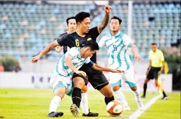
ရမ်းယူနိုက်တက်အသင်းနှင့် ရန်ကုန်ယူနိုက်တက်အသင်းတို့ ယှဉ်ပြိုင်ကစားကြစဉ်။

ရန်ကုန် ဒီဇင်ဘာ ၂၅ မြန်မာနေရှင်နယ်လိဂ်သည် လာမည့်ရာသီ MNL ပြိုင်ပွဲမတိုင်မီ Myanmar National League Cup 2024 ပြိုင်ပွဲကို အသင်းစုစုပေါင်း ၂၂ သင်းဖြင့် ကျင်းပသွားမည်ဖြစ်သည်။ ယှဉ်ပြိုင်ခွင့်ရရှိမည် မြန်မာနေရှင်နယ်လိဂ်သည် လာမည့်ရာသီ MNL အမှတ်ပေးပြိုင်ပွဲကျင်းပမည့်ကာလကို အပြောင်းအလဲ ပြုလုပ်မည်ဖြစ်သောကြောင့် ယင်းကာလမတိုင်မီ ပြိုင်ပွဲတစ်ခုကျင်းပရန် စီစဉ်ထားခြင်းဖြစ်သည်။ စာမျက်နှာ ၂၇ ကော်လံ ၃ သို့ ✕