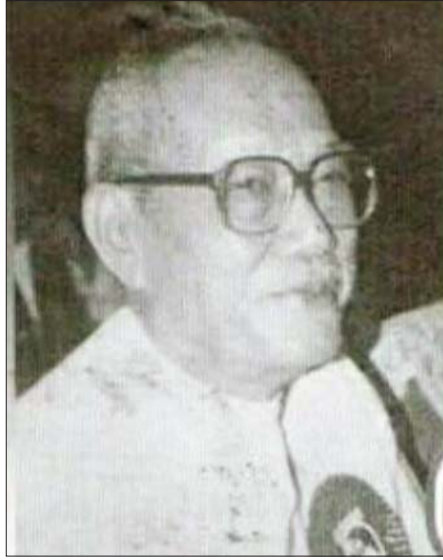
ဆရာ တက္ကသိုလ်ထင်ကြီး