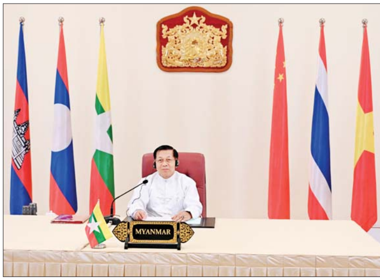
နိုင်ငံတော်စီမံအုပ်ချုပ်ရေးကောင်စီဥက္ကဋ္ဌ နိုင်ငံတော်ဝန်ကြီးချုပ် ဗိုလ်ချုပ်မှူးကြီး မင်းအောင်လှိုင် (၄)ကြိမ်မြောက် မဲခေါင်-လန်ချန်း ပူးပေါင်းဆောင်ရွက်မှု နိုင်ငံ့ ခေါင်းဆောင်များ အစည်းအဝေးသို့ ဗီဒီယိုကွန်ဖရင့်ဖြင့် တက်ရောက် ဆွေးနွေးစဉ်။

● ရှေးဖုံးမှ အစည်းအဝေးတွင် ပြည်ထောင်စု သမ္မတ မြန်မာနိုင်ငံတော် နိုင်ငံတော် စီမံအုပ်ချုပ်ရေးကောင်စီဥက္ကဋ္ဌ နိုင်ငံတော် ဝန်ကြီးချုပ် ဗိုလ်ချုပ်မှူးကြီး မင်းအောင်လှိုင် နှင့် တရုတ်ပြည်သူ့သမ္မတနိုင်ငံ ဝန်ကြီးချုပ် မစ္စတာလီချန်းတို့က ပူးတွဲဥက္ကဋ္ဌများ အဖြစ် ဆောင်ရွက်ကြပြီး ကမ္ဘောဒီးယား နိုင်ငံဝန်ကြီးချုပ် မစ္စတာ ဆမ်ဒက် မဟာ ပဝရ မိပတိ ဟွန်မာနိုက်၊ လာအိုပြည်သူ့ ဒီမိုကရက်တစ်သမ္မတနိုင်ငံ ဝန်ကြီးချုပ် မစ္စတာ ဆိုဆိုင်း ဆီဖန်နို၊ ထိုင်းနိုင်ငံဝန်ကြီး ချုပ် မစ္စတာ ဆရက်ထာ ထာဗီဆင်နှင့် ဗီယက်နမ်ဆိုရှယ်လစ်သမ္မတနိုင်ငံ ဝန်ကြီး ချုပ် မစ္စတာ ဖန်မင်ချင်းတို့ တက်ရောက် ကြသည်။