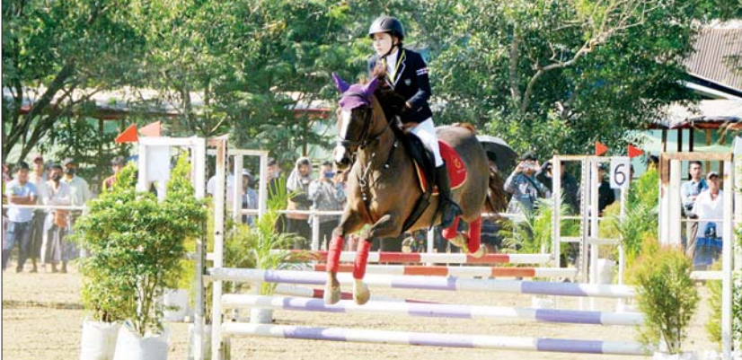
(၇၅) နှစ်မြောက် စိန်ရတုလွတ်လပ်ရေးနေ့ အထိမ်းအမှတ် မြင်းစီးပြိုင်ပွဲကျင်းပမည်။

ကြောင်း၊ ပြိုင်ပွဲဝင်ရန် လျှောက်ထားသည့် မည်သည့်မြင်းမဆို မြန်မာနိုင်ငံ မြင်းစီးအားကစားအဖွဲ့ချုပ်၏ အထောက်အထားမှတ်တမ်းတွင် အပြည့်အစုံဖြည့်စွက်ထားပြီး ဖြစ်ရန်နှင့် တရားဝင်သက်တမ်းရှိရမည်ဖြစ်ပြီး မှတ်တမ်းပြုလုပ်ထားခြင်း မရှိသေးပါက ပြိုင်ပွဲဝင်ရန် စာရင်းပေးသွင်းသည့်ရက်တွင် မှတ်တမ်းပြုလုပ်ပေးမည် ဖြစ်ကြောင်း၊ ဒီဇင်ဘာ ၃၁ ရက်အထိ မြန်မာနိုင်ငံ မြင်းစီးအားကစားအဖွဲ့ချုပ် ဖုန်း ၀၉-၅၀၂၁၃၂၈၊ ၀၉-၇၉၅၄၀၈၀၅၊ ၀၉-၉၇၇၂၄၈၂၁၉ တို့သို့ ဆက်သွယ်၍ ပြိုင်ပွဲဝင်ခွင့်လျှောက်ထားစာရင်း ပေးသွင်းနိုင်ကြောင်း သိရသည်။ အပြည်ပြည်ဆိုင်ရာ မြင်းစီးတန်းခုန်ပြိုင်ပွဲကို ကမ္ဘာ့မြင်းစီးအားကစားအဖွဲ့ချုပ် (F.E.I) ၏ တန်းခုန်ပြိုင်ပွဲ စည်းမျဉ်းများအတိုင်း ယှဉ်ပြိုင်စေမည်ဖြစ်ပြီး ဆုရရှိသည့် ကစားသမားနှင့် မြင်းများအား ဆုဖလား၊ အသိအမှတ်ပြုလက်မှတ်နှင့် ဖဲပြားများ ချီးမြှင့်သွားမည်ဖြစ်ကြောင်း သိရသည်။ လင်းရာမ