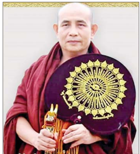
အခမ်းအနားအစီအစဉ်အရ ဇန်နဝါရီ ၁ ရက် မှ ၃ ရက်အထိ နံနက် ၄ နာရီတွင် လွန်းလိန်းစေတီတော်၌ ဘုရားဝတ်တက်ပြီး ပန်းခြံအတွင်း ဆွမ်းတော်