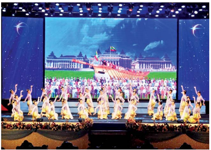
မြန်မာ့ယဉ်ကျေးမှုအကအလှ

[နိုင်ငံတော်စီမံအုပ်ချုပ်ရေးကောင်စီဥက္ကဋ္ဌ၊ နိုင်ငံတော်ဝန်ကြီးချုပ် ဗိုလ်ချုပ်မှူးကြီး သတိုးမဟာသရေစည်သူ သတိုးသီရိသုဓမ္မ မင်းအောင်လှိုင်ထံမှ ၁၀-၁-၂၀၂၃ ရက်နေ့တွင် (၇၅)နှစ်မြောက် စိန်ရတုကချင်ပြည်နယ်နေ့အခမ်းအနားသို့ ပေးပို့သည့်သဝဏ်လွှာမှ ကောက်နုတ်ချက်]