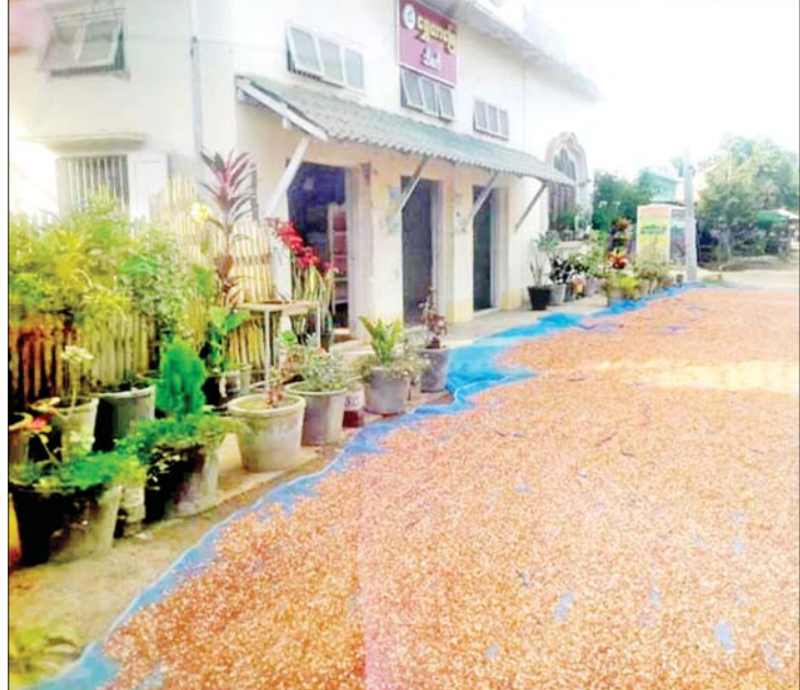
သန့်စင်ပြီးသော ပဲဆီများကို မှီဓာတ်ကင်းစေရန် နေရောင်ခြည်ပြစဉ်။

ဖြေ။ ။ ဆောင်ရန် ရှောင်ရန်အတွက် အဓိကကတော့ အလုပ်အပေါ် ဖွဲ့၊ လုံ့လရှိရှိနဲ့ တစ်သမတ်တည်း လုပ်ဖို့ လိုပါမယ်။ ဘယ်လိုအခက်အခဲတွေပဲ ရှိရှိ ဒါမလုပ်တော့ဘူး၊ တခြားဟာ