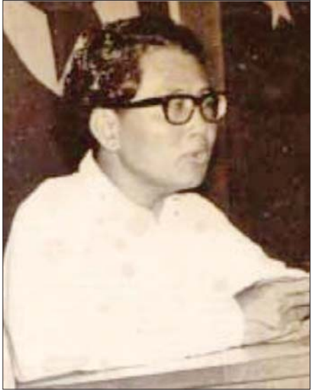
ဆရာ ဒဂုန်တာရာ