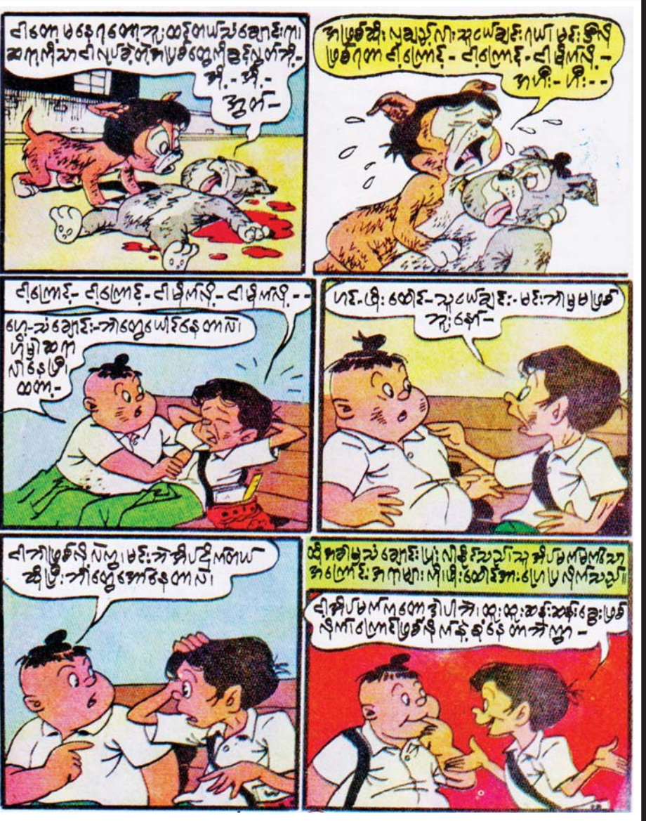
(ဆက်လက်ဖော်ပြပါမည်)

အလုပ်ရှင် - ခု ၉ နာရီ တိုးနေပြီ။ မင်း ဘယ် သွားနေတာလဲ။ မင်း အနေနဲ့ ဒီကို ရှစ်နာရီမှာ ရောက်နေသင့် တာပေါ့...။ အလုပ်သမား - ဘာကြောင့်လဲ ခင်ဗျ။ ရှစ်နာရီ တုန်းက ဘာဖြစ်နေခဲ့ လို့လဲ ဟင်...။