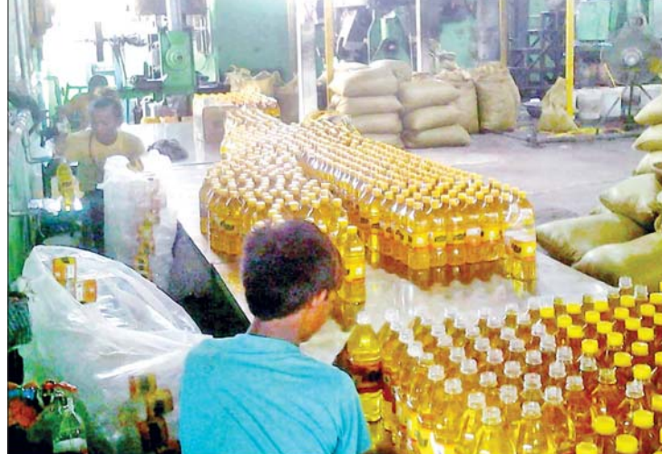
ဆီပါကင် ထုပ်ပိုးစဉ်။