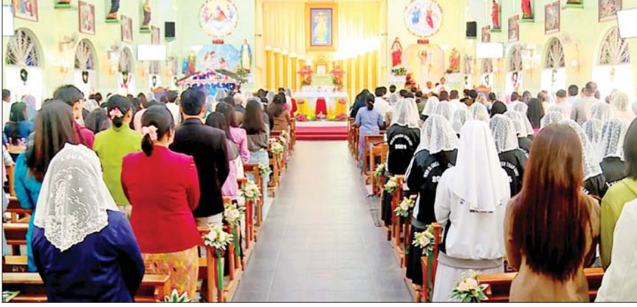
အခါသမယအခမ်းအနားကို အဖွင့် မေတ္တာပို့ဆုတောင်း၍ ဖွင့်လှစ်ပေး ကာ ဓမ္မသီချင်းများကို စုပေါင်း သီဆိုချီးမွမ်းကြသည်။ ထို့နောက် ခရစ်ယာန်ဘုရားတော် ကြီးများ၊ သိက္ခာတော်ရ ဆရာတော် များနှင့်အတူ ခရစ်ယာန်ဘာသာ ဝင်များသည် သမ္မာကျမ်းစာဖတ် ကြားပြီး မေတ္တာပို့ဆုတောင်းခြင်း များ ဆောင်ရွက်ကြကာ ကျေးဇူး ပေးခြင်း အစီအစဉ်များ ဆောင်ရွက်ကြပြီး ညပိုင်းတွင် ဘုရားကျောင်းများ၌ ရောင်စုံ လျှပ်စစ်မီးများ အလှဆင်ထွန်းညှိ ၍ ခရစ်တော်မွေးနေ့ကို ပျော်ရွှင် စွာဖြင့် ဂုဏ်ပြုကြိုဆိုခဲ့ကြကြောင်း သိရသည်။ သတင်း - အောင်ရဲသွင်

နေပြည်တော် ဒီဇင်ဘာ ၂၅ ယနေ့သည် ယေရှုခရစ်တော် ဖွားမြင်တော်မူသည့် နေ့ကို အထိမ်းအမှတ်ပြုသည့် ခရစ္စမတ် နေ့ဖြစ်သည့်အတွက် မြန်မာနိုင်ငံ တစ်ဝန်းလုံးရှိ ခရစ်ယာန်ဘာသာ ဝင်များသည် သက်ဆိုင်ရာ ခရစ်ယာန် ဘုရားကျောင်းများ အလိုက် ဝတ်ပြုဆုတောင်းခြင်း၊ ကျေးဇူးတော် ချီးမွမ်းခြင်းတို့ကို ဆောင်ရွက်ကြပြီး ညပိုင်းတွင် ရောင်စုံလျှပ်စစ်မီးများဖြင့် အလှ ဆင် ထွန်းညှိကြသည်။ ယနေ့ နံနက်ပိုင်းမှ စတင်၍ နေပြည်တော်ကောင်စီနယ်မြေ အတွင်းရှိ စိန်မိုင်ကယ်ကက် သလစ်ဘုရားကျောင်း၊ မြန်မာ နှစ်ခြင်း ခရစ်ယာန်အသင်းတော် နှင့် အခြားခရစ်ယာန်ဘုရား ကျောင်းများ၌ ခရစ်ယာန်ဘာသာ ဝင်များသည် ခရစ္စမတ်နေ့