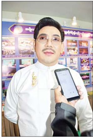
အကယ်ဒမီရန်အောင်