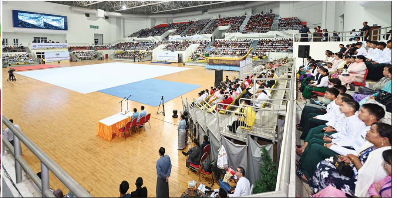
နိုင်ငံတော်စီမံအုပ်ချုပ်ရေးကောင်စီဥက္ကဋ္ဌ နိုင်ငံတော်ဝန်ကြီးချုပ် ဗိုလ်ချုပ်မှူးကြီးမင်းအောင်လှိုင် (၇၆) နှစ်မြောက်လွတ်လပ်ရေးနေ့အထိမ်းအမှတ် လူငယ်နှင့်စာပေအနုပညာပွဲတော် ဖွင့်ပွဲအခမ်းအနားတွင် အမှာစကားပြောကြားစဉ်။

★ စာမျက်နှာ ၃ မှ စစ်အေးခေတ် နှောင်းပိုင်း ကာလများတွင် အင်အားကြီးသည့် နိုင်ငံကြီးများသည် အင်အားနည်းသည့် နိုင်ငံငယ်များအပေါ် ထိန်းချုပ် ခြယ်လှယ်နိုင်စေရန် သို့မဟုတ် ဩဇာလွှမ်းမိုးနိုင်စေရန် နိုင်ငံရေး၊ စီးပွားရေး၊ ယဉ်ကျေးမှု ကဏ္ဍများကို မဟာဗျူဟာကျ သည့် နည်းလမ်းပေါင်းစုံဖြင့် ချဉ်းကပ်ဆောင်ရွက်နေကြသည် ကို အားလုံးအသိပင် ဖြစ်ပါကြောင်း။ လုံခြုံရေးနှင့် အရေးကြီးသည့် အထူးသဖြင့် အင်အားကြီးနိုင်ငံ တချို့သည် ဖွံ့ဖြိုးဆဲနိုင်ငံများကို ၎င်းတို့၏ ဩဇာခံပုဆိန်ရိုးများ၊ ကြိုးဆွဲခံရပ်သေးရပ်များနှင့် ထိုးဖောက်ဝင်ရောက်ပြီး လူမျိုးရေး၊ ဘာသာရေးမှိုင်းတိုက်ကာ မီးမွှေးဆောင်ရွက်နေမှုများ၊ မတည်မငြိမ် ကမောက်ကမဖြစ်အောင် လုပ်ကြံဖန်တီးမှုမျိုးစုံနှင့် သွေးထိုး မြှောက်ပင်ပေးနေကြပါကြောင်း။ လူ့အခွင့်အရေး၊ ဒီမိုကရေစီရေးဆိုင်ရာ သည့် စကားလုံးများကို ရောင်းကုန် ပစ္စည်းကဲ့သို့ သဘောထားပြီး လိုသလိုပုံဖော် ဖိအားပေးအကျပ် ကိုင်မှုများနှင့် နည်းလမ်းပေါင်းစုံ၊ အကြံအစည်ပေါင်းစုံ အသုံးပြုပြီး ၎င်းတို့၏ ဩဇာလောင်းရိပ် အောက် သွတ်သွင်းရန် ကြိုးစား နေကြပါကြောင်း။