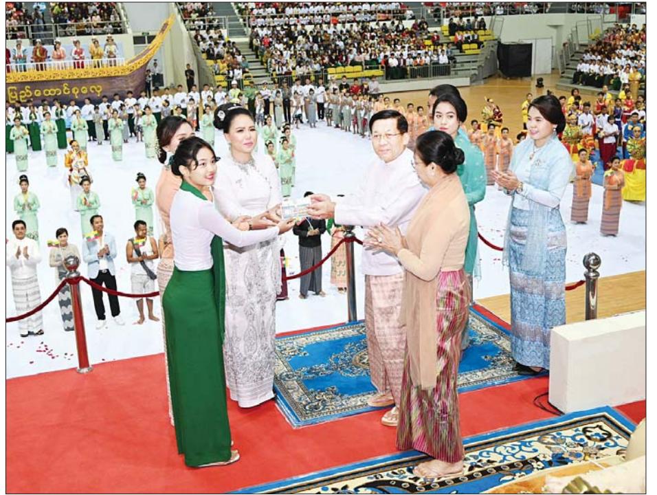
နိုင်ငံတော်စီမံအုပ်ချုပ်ရေးကောင်စီဥက္ကဋ္ဌ နိုင်ငံတော်ဝန်ကြီးချုပ် ဗိုလ်ချုပ်မှူးကြီး မင်းအောင်လှိုင်နှင့်ဇနီး ဒေါ်ကြူကြူလှ ကပြဖျော်ဖြေခဲ့ကြသည့် ကျောင်းသား ကျောင်းသူများနှင့် အနုပညာရှင်များအား ဂုဏ်ပြုပန်းခြင်းနှင့် ချီးမြှင့်ငွေများ ပေးအပ်ချီးမြှင့်စဉ်။