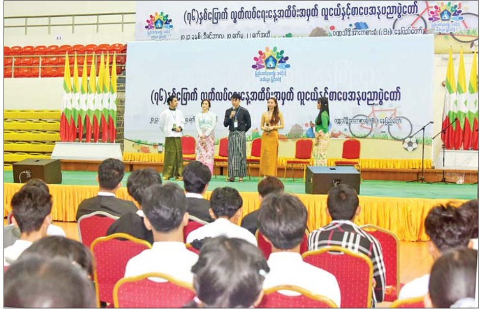
အကောင်းမြင်စိတ်” ခေါင်းစဉ်ဖြင့် လည်းကောင်း၊ စကားဝိုင်းဆွေးနွေးပွဲများကို ဆက်လက်ကျင်းပ ဒီဇင်ဘာ ၂၂ ရက်တွင် “ လူငယ်နှင့် ပေါင်းသင်း သွားမည်ဖြစ်ကြောင်း သိရသည်။ မျိုးဆက်သစ်