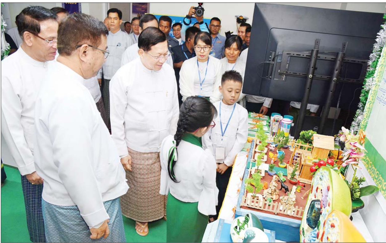
နိုင်ငံတော်စီမံအုပ်ချုပ်ရေးကောင်စီဥက္ကဋ္ဌ နိုင်ငံတော်ဝန်ကြီးချုပ် ဗိုလ်ချုပ်မှူးကြီး မင်းအောင်လှိုင် (၇၆) နှစ်မြောက် လွတ်လပ်ရေးနေ့ အထိမ်းအမှတ် လူငယ်နှင့်စာပေ အနုပညာပွဲတော်ပြခန်းများ ခင်းကျင်းပြသထားမှုကို လှည့်လည်ကြည့်ရှုစဉ်။

နိုင်ငံတော် အစိုးရအနေဖြင့် လူငယ်များကို အရည်အချင်း ပြည့်ဝသည့် နိုင်ငံ့သားကောင်း များ ဖြစ်ထွန်းလာစေရန်အတွက် လူငယ်ရေးရာမူဝါဒများကို ခေတ်ကာလနှင့် ကိုက်ညီအောင် ပြင်ဆင်ချမှတ် ဆောင်ရွက်လျက်ရှိပါကြောင်း၊ လူငယ်ရေးရာအသိပညာပေး ဟောပြောပွဲများ၊ လူငယ်စကားဝိုင်းများ၊ လူငယ်နှင့်စာပေအနုပညာပြပွဲများ၊ ကျောင်းသားအားကစားပြိုင်ပွဲများ၊ နွေရာသီအားကစား သင်တန်းများ၊ အာဆီယံနှင့် ဒေသတွင်း လူငယ်ဆိုင်ရာ နိုင်ငံတကာအစည်းအဝေးပွဲများနှင့် ပြပွဲပြိုင်ပွဲများတွင် တက်ရောက်ဆွေးနွေး ပြသယှဉ်ပြိုင်ခြင်းများကို ဆောင်ရွက်ပေးနေသည့်အတွက် လူငယ်များ၏ အသိပညာနှင့် အတွေးအမြင်များ ပိုမိုဆန်းသစ်တိုးတက်လာစေခဲ့ပါကြောင်း။