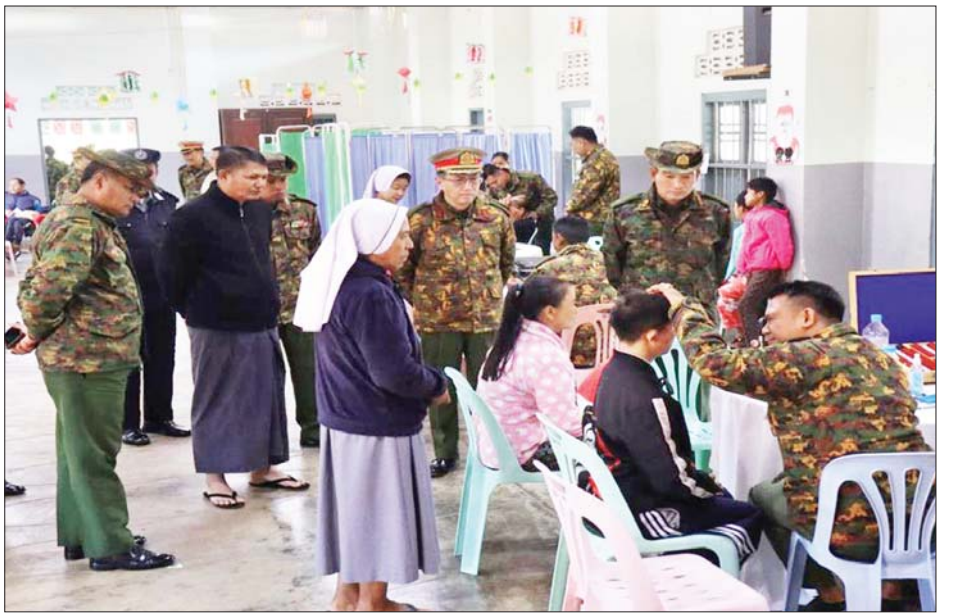
ရောဂါ၊ ခွဲစိတ်ကုသမှုဆိုင်ရာရောဂါ၊ အထွေထွေရောဂါ တို့နှင့်ပတ်သက်၍ လိုအပ်သည့် ကျန်းမာရေးစစ်ဆေး ကုသပေးခြင်းများ ဆောင်ရွက်ပေးပြီး ECG Ultra-sound စက်ဖြင့် ရောဂါရှာဖွေစမ်းသပ်ခြင်းနှင့် ဆီးချို/သွေးချို စစ်ဆေးပေးခြင်းများ ဆောင်ရွက် ပေးကာ ဆေးရုံတက်ရောက်ကုသရန် လိုအပ်သော လူနာများအား နယ်မြေခံတပ်မတော်ဆေးရုံများသို့ တက်ရောက်ကုသနိုင်ရေး စီစဉ်ဆောင်ရွက်ပေးသည်။ ယင်းသို့ဆောင်ရွက်ပေးနေမှုများကို သက်ဆိုင်ရာ တိုင်းစစ်ဌာနချုပ်မှ တာဝန်ရှိသူများက သွားရောက် ကြည့်ရှုအားပေးခဲ့ကြောင်း သိရသည်။ သတင်းစဉ်

ဗိုလ်ချုပ် အောင်ခိုင်ဝင်းနှင့် တာဝန်ရှိသူများက သွားရောက်ကြည့်ရှုအားပေးပြီး ကျန်းမာရေးအခြေ အနေများမေးမြန်းကာ ဆေးရုံတက်ရောက်ကုသရန် လိုအပ်သော လူနာများအား နယ်မြေခံတပ်မတော် ဆေးရုံသို့ တက်ရောက်ကုသနိုင်ရေး စီစဉ်ဆောင်ရွက် ပေးခဲ့သည်။ အလားတူ ရန်ကုန်တိုင်းစစ်ဌာနချုပ် နယ်လှည့် ဆေးကုသရေးအဖွဲ့က ရန်ကုန်တိုင်းဒေသကြီး လှည်းကူးမြို့နယ် ဝါးရုံစွန်းကျေးရွာနှင့် ပတ်ဝန်းကျင် ကျေးရွာများမှ သံဃာတော် လေးပါး၊ ဒေသခံပြည်သူ ၁၆၇ ဦးနှင့် အလယ်ပိုင်းတိုင်းစစ်ဌာနချုပ် နယ်လှည့် ဆေးကုသရေးအဖွဲ့က မန္တလေးတိုင်းဒေသကြီး ပြင်ဦးလွင်မြို့ ရပ်ကွက်ကြီး(၉) အေးမြချမ်းသာ သီလရှင်ပရိယတ္တိစာသင်တိုက်မှ သာသနာ့နယ်ဝင် သီလရှင် ၁၈၃ ပါးနှင့် ဒေသခံပြည်သူ ၁၁၀ တို့အား သက်ဆိုင်ရာနေရာများတွင် သွားနှင့်ခံတွင်းရောဂါ၊ မျက်စိရောဂါ၊ သားဖွားမီးယပ်ရောဂါ၊ အရိုးအကြော ရောဂါ၊ နား၊ နှာခေါင်း၊ လည်ချောင်းရောဂါ၊ ကလေး