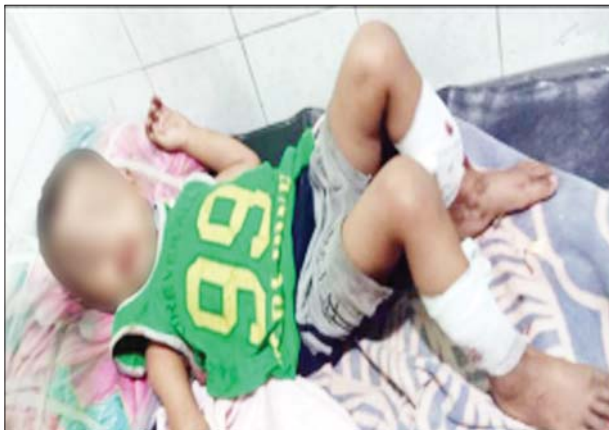
ကျောက်တံခါးမြို့နယ် သူဌေးကုန်းကျေးရွာအတွင်းသို့ PDF အမည်ခံ အကြမ်းဖက်သမားများက Drone အသုံးပြု၍ Drop Bomb များ ပစ်ချတိုက်ခိုက်ခဲ့မှုကြောင့် ထိခိုက်ဒဏ်ရာရရှိခဲ့သည့် ကလေးငယ်။

နေပြည်တော် ဒီဇင်ဘာ ၂၀ တိုင်းဒေသကြီးနှင့် ပြည်နယ်အသီးသီးရှိ မြို့နယ်အချို့၌ အကြမ်းဖက်မှုကို လိုလားသူ လက်နက်ကိုင်သောင်းကျန်းသူများနှင့် PDF အမည်ခံ အကြမ်းဖက်အဖွဲ့များက စစ်ရေးပစ်မှတ်မဟုတ်သည့် အပြစ်မဲ့ပြည်သူများသွားလာရာ လမ်းတံတားများ၊ နေထိုင်ရာရပ်ကွက်၊ ကျေးရွာများအတွင်းသို့ လက်နက်ကြီး၊ လက်လုပ်စိန်ပြောင်း၊ Drop Bomb များဖြင့် ပစ်ခတ်တိုက်ခိုက်ခြင်းနှင့် နေအိမ်များအား အကြောင်းမဲ့ မီးရှို့ဖျက်ဆီးခြင်း စသည့် အကြမ်းဖက်မှုလုပ်ရပ်များအား လုပ်ဆောင် လျက်ရှိသည်။