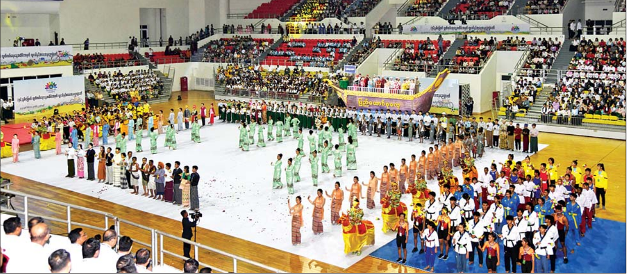
ဖျော်ဖြေရေးအဖွဲ့များ “ပြည့်ရတနာ” သီချင်းဖြင့် သီဆိုကပြဖျော်ဖြေကြစဉ်။

အခမဲ့လာရောက်လေ့လာနိုင်အဆိုပါ (၇၆)နှစ်မြောက် လွတ်လပ်ရေးနေ့ အထိမ်းအမှတ် လူငယ်နှင့်စာပေအနုပညာပွဲတော်ကို “ပြည်ထောင်စုအကျိုး သယ်ပိုးဖို့ အသိပညာမြှင့်တင်ဖို့” ဆိုသည့် ဆောင်ပုဒ်ဖြင့် ကျင်းပခြင်းဖြစ်ပြီး ဒီဇင်ဘာ ၂၂ ရက်အထိ နေ့စဉ် နံနက် ၉ နာရီခွဲမှ ညနေ ၄ နာရီခွဲအထိ စည်ကားသိုက်မြိုက်စွာ ကျင်းပ ပြုလုပ်သွားမည်ဖြစ်ပြီး ပွဲတော်တွင် ဝန်ကြီးဌာနများမှ ပြခန်းများ ခင်းကျင်းပြသထားကာ ဖျော်ဖြေရေးအစီအစဉ်များ၊ အနုပညာရှင်များနှင့် ဆွေးနွေးပွဲများ၊ တိုင်းရင်းသား ရိုးရာအစားအစာဆိုင်များနှင့် စာအုပ်အရောင်းဆိုင်များ ခင်းကျင်းပြသထားပြီး မည်သူမဆို အခမဲ့ လာရောက်လေ့လာနိုင်ကြောင်း သိရသည်။ သတင်းစဉ်