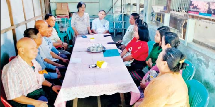
ဖွင့်ပွဲတွင် မြို့နယ်သမဝါယမဦးစီးအရာရှိ ဒေါ်တင်နှင့်ရည်က သမဝါယမကုန်သွယ်မှုကဏ္ဍ မြှင့်တင်နိုင်ရေးအတွက် ယခုကဲ့သို့ သမကုန်စုံဆိုင်များ ဖွင့်လှစ်နိုင်ခြင်းသည် ရပ်ကွက်ပြည်သူများ ဈေးနှုန်းချိုသာစွာ ဝယ်ယူနိုင်မည်ဖြစ်၍ ဝမ်းမြောက်ကြောင်း ပြောကြားခဲ့သည်။

ရန်ကုန် ဒီဇင်ဘာ ၂၀ ကမာရွတ်မြို့နယ် အမှတ်(၁၀) ရပ်ကွက်၌ သံလွင်ရောင်းဝယ်ရေး သမဝါယမလီမိတက်မှ ဆန်၊ ဆီ၊ ဆားနှင့် လူသုံးကုန်ပစ္စည်းများ အရောင်းဆိုင်သစ် ဖွင့်ပွဲကို ယနေ့နံနက်ပိုင်းတွင် ကျင်းပသည်။