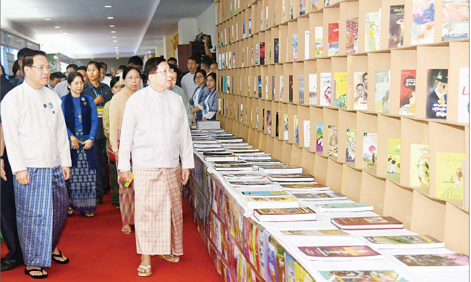
နိုင်ငံတော်စီမံအုပ်ချုပ်ရေးကောင်စီဥက္ကဋ္ဌ နိုင်ငံတော်ဝန်ကြီးချုပ် ဗိုလ်ချုပ်မှူးကြီးမင်းအောင်လှိုင်နှင့် ဇနီး ဒေါ်ကြူကြူလှ (၇၆)နှစ်မြောက် လွတ်လပ်ရေးနေ့ အထိမ်းအမှတ် လူငယ်နှင့်စာပေအနုပညာပွဲတော်ပြခန်းများ ခင်းကျင်းပြသထားမှုကို လှည့်လည်ကြည့်ရှုစဉ်။

နေပြည်တော် ဒီဇင်ဘာ ၂၀ (၇၆) နှစ်မြောက် လွတ်လပ်ရေးနေ့ အထိမ်းအမှတ် လူငယ်နှင့်စာပေအနုပညာ ပွဲတော် ဖွင့်ပွဲအခမ်းအနားကို ယနေ့နံနက် ပိုင်းတွင် နေပြည်တော်ရှိ ဝဏ္ဏသိဒ္ဓိ အားကစားကွင်း (B) ရုံ၌ ကျင်းပရာ နိုင်ငံ တော်စီမံအုပ်ချုပ်ရေးကောင်စီဥက္ကဋ္ဌ နိုင်ငံတော်ဝန်ကြီးချုပ် ဗိုလ်ချုပ်မှူးကြီး မင်းအောင်လှိုင် တက်ရောက်ဖွင့်လှစ် ပေးပြီး အမှာစကားပြောကြားသည်။ တက်ရောက် အခမ်းအနားသို့ နိုင်ငံတော်စီမံ အုပ်ချုပ်ရေးကောင်စီဥက္ကဋ္ဌ နိုင်ငံတော် ဝန်ကြီးချုပ်၏ဇနီး ဒေါ်ကြူကြူလှကောင်စီ တွဲဖက်အတွင်းရေးမှူးနှင့် ဇနီး၊ ကောင်စီ အဖွဲ့ဝင်များနှင့် ဇနီးများ၊ ပြည်ထောင်စု အဆင့်ပုဂ္ဂိုလ်များ၊ ပြည်ထောင်စုဝန်ကြီး များနှင့် ဇနီးများ၊ နေပြည်တော်ကောင်စီ ဥက္ကဋ္ဌ၊ ကာကွယ်ရေးဦးစီးချုပ်ရုံးမှ အဆင့်မြင့်တပ်မတော်အရာရှိကြီးများ၊ နေပြည်တော်တိုင်းစစ်ဌာနချုပ်တိုင်းမှူး၊ ဒုတိယဝန်ကြီးများ၊ ဝန်ကြီးဌာနများမှ တာဝန်ရှိသူများ၊ စာပေအနုပညာရှင်များ၊ ဆရာ ဆရာမများနှင့် ကျောင်းသား ကျောင်းသူများ၊ ဘုန်းတော်ကြီးသင်ပညာ ရေး စာမျက်နှာ ၃ သို့