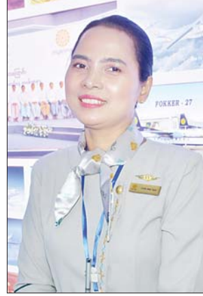
မလွင်မာအေး

တွေရဲ့ သင်ကြားမှုတွေထဲက အခြေခံ ကျောင်းသား ကျောင်းသူအားလုံး သိသင့်သိထိုက်တဲ့ပြကွက်လေးတွေလည်း ပါဝင်ပါတယ်။ အခြားပြကွက်ကတော့ ဇီဝဗေဒနဲ့ပတ်သက်ပြီး ခရုလေးတွေကမှ ဓာတ်ခွဲခန်းမှာ အသုံးကျတဲ့ သားလောင်းလေးတွေ မွေးမြူရေး ဆိုင်ရာ ဗဟုသုတဖြစ်ဖွယ်လေးတွေကိုလည်း ပြသထားပါတယ်။ သင်ရိုးညွှန်းတမ်းထဲမှာ မပါပေမယ့် ဆက်စပ်မှုတွေရှိတယ်လို့ ပြောရမှာပါ။ အဓိကကတော့ ကျွန်တော်တို့မြန်မာတွေရဲ့ ရှေးဟောင်းယဉ်ကျေးမှုအမွေအနှစ်တွေကို ကလေးတွေသိပြီး တန်ဖိုးထားတတ်အောင် ပြသထားတာဖြစ်ပါတယ်။