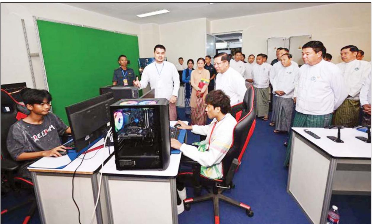
နိုင်ငံတော်စီမံအုပ်ချုပ်ရေးကောင်စီဥက္ကဋ္ဌ နိုင်ငံတော်ဝန်ကြီးချုပ် ဗိုလ်ချုပ်မှူးကြီးမင်းအောင်လှိုင် (၇၆) နှစ်မြောက်လွတ်လပ်ရေးနေ့ အထိမ်းအမှတ် လူငယ်နှင့်စာပေအနုပညာပွဲတော်ပြခန်းများ ခင်းကျင်းပြသထားမှုကို လှည့်လည်ကြည့်ရှုစဉ်။

ယခုကဲ့သို့အခြေအနေတွင် မိမိ တို့ကဲ့သို့ နိုင်ငံငယ်များအနေဖြင့် မိမိတို့၏ နိုင်ငံတော်ကို စည်းလုံး ညီညွတ်စွာ ထိန်းသိမ်းကာကွယ် နိုင်စွမ်းမရှိပါက ဖရိုဖရဲဖြိုကွဲ သွားနိုင်သကဲ့သို့ ၎င်းတို့အလိုကျ လိုသလိုပုံသွင်း လွှမ်းမိုးချုပ်ကိုင် မှုများ ကြုံတွေ့ရနိုင်ပါကြောင်း၊ ၎င်းတို့ လက်အောက်ခံ၊ ဩဇာခံ ဖြစ်သွားနိုင်သည်ကိုလည်း အလေး အနက်သတိပြုကြရန် သတိပေး မှာကြားလိုပါကြောင်း။ လွန်စွာအန္တရာယ်ကြီးမား ထို့ပြင် ယနေ့အချိန်တွင် အချင်း ချင်း စည်းလုံးညီညွတ်မှုမရှိဘဲ နိုင်ငံနှင့် ပြည်သူလူထုအကျိုးကို လျစ်လျူရှုပြီး သံသယများ၊ ကိုယ် ကျိုးအတ္တများ၊ လွဲမှားသည့် အယူ အဆများ လုပ်ဆောင်နေကြမည် ဆိုပါက နိုင်ငံအတွက် လွန်စွာ အန္တရာယ် ကြီးမားပါကြောင်း၊ မိမိတို့အားလုံးက မှန်ကန်သည့် အသိ၊ မှန်ကန်သည့် သတိတရား များနှင့် နိုင်ငံအကျိုး၊ လူမျိုးအကျိုး ကို သယ်ပိုးပေးကြရန် တိုက်တွန်း ပြောကြားလိုပါကြောင်း။ ယခုကျင်းပသည့် လူငယ်နှင့် စာပေအနုပညာပွဲတော်ကို နိုင်ငံ သားတိုင်းက အထွတ်အမြတ်ထား ရသည့် လွတ်လပ်ရေးနေ့နှင့် လွတ်လပ်ရေးကြိုးပမ်းမှု သမိုင်း ကြောင်းများကို သိရှိစေရန်၊ လူငယ်များအတွင်း နိုင်ငံချစ်စိတ်၊