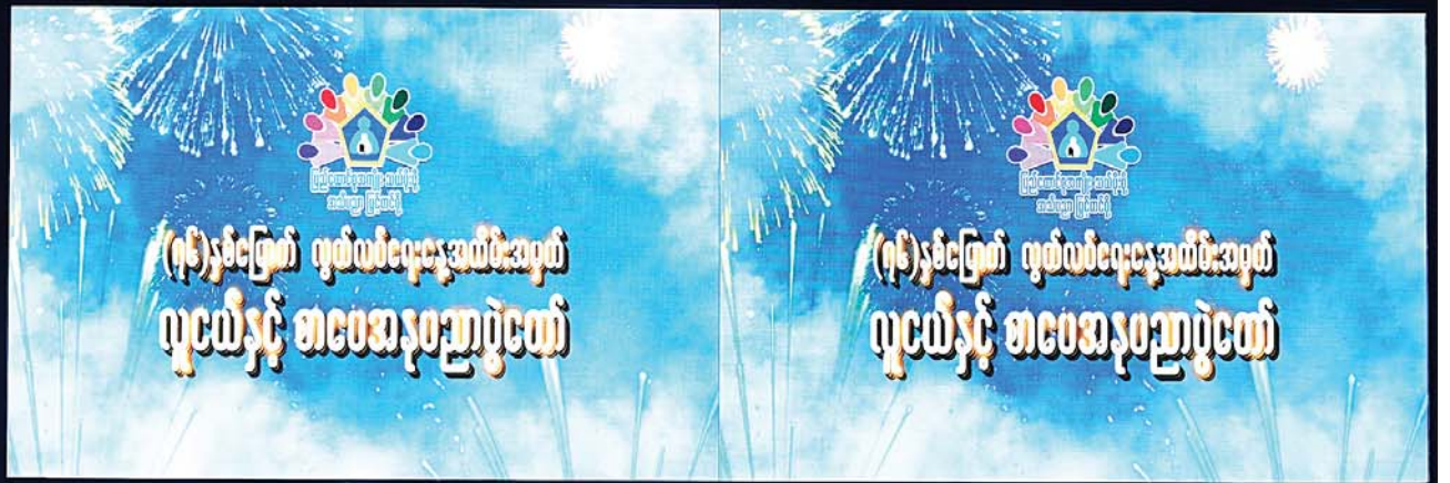
နိုင်ငံတော်စီမံအုပ်ချုပ်ရေးကောင်စီဥက္ကဋ္ဌ နိုင်ငံတော်ဝန်ကြီးချုပ် ဗိုလ်ချုပ်မှူးကြီးမင်းအောင်လှိုင် (၇၆) နှစ်မြောက် လွတ်လပ်ရေးနေ့အထိမ်းအမှတ် လူငယ်နှင့် စာပေအနုပညာပွဲတော်ကို စက်ခလုတ်နှိပ် ဖွင့်လှစ်ပေးစဉ်။