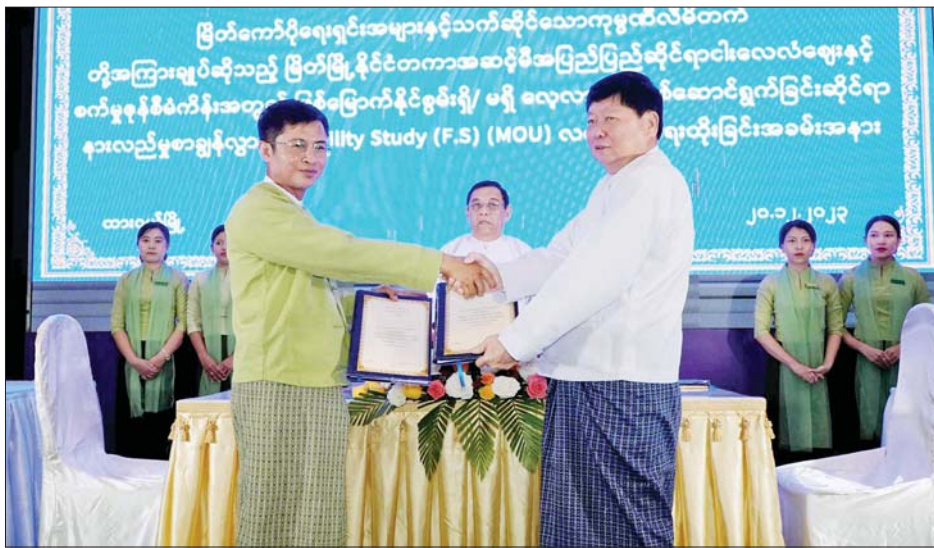
ကောင်းမွန်လာမည်ဖြစ်ကြောင်း၊ ကုန်ချောထုတ်လုပ်ရန် နိုင်ငံတကာလုပ်ငန်းများမှ နည်းပညာနှင့် အရင်းအနှီးများ ဝင်ရောက်လာမည်ဖြစ်၍ နိုင်ငံတော်ဘဏ္ဍာအတွက် နိုင်ငံခြားဝင်ငွေနှင့် အခွန်အခများ တိုးပွား