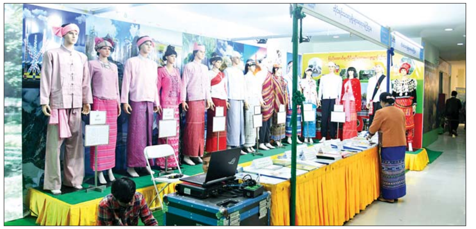
လူငယ်နှင့် စာပေအနုပညာပွဲတော်တွင် ပါဝင်ပြသမည့် ဌာနဆိုင်ရာပြခန်းများ ပြင်ဆင်ထားမှုကို တွေ့ရစဉ်။