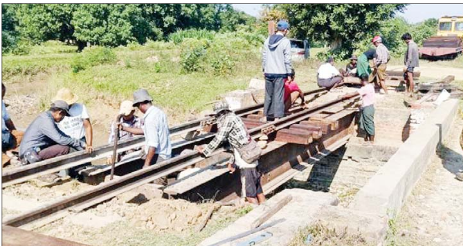
ရထားလမ်း/တံတားပြန်လည်ပြုပြင်နေစဉ်။

အဆိုပါ မိုင်းပေါက်ကွဲသည့် နေရာသို့ လုံခြုံရေးတပ်ဖွဲ့ဝင်များနှင့် တာဝန်ရှိသူများက အချိန်နှင့်တစ်ပြေးညီ သွားရောက်ကာ နယ်မြေလုံခြုံရေးနှင့် မိုင်းရှင်းလင်းခြင်းများ ဆောင်ရွက်ခြင်း၊ မြန်မာ့မီးရထားဝန်ထမ်းများက လမ်းပိုင်းအား စစ်ဆေးပြုပြင်ခြင်းလုပ်ငန်းများ ဆောင်ရွက်ပြီး အစုန်လမ်းအား ပြန်လည်ဖွင့်လှစ်ပေးခဲ့ရာ အမှတ်(၅) အဆန်လူစီးအမြန်ရထားသည် မြစ်သားဘူတာမှ နံနက် ၉ နာရီ ၁၀ မိနစ်တွင် ဆက်လက်ထွက်ခွာနိုင်ခဲ့ကြောင်း၊