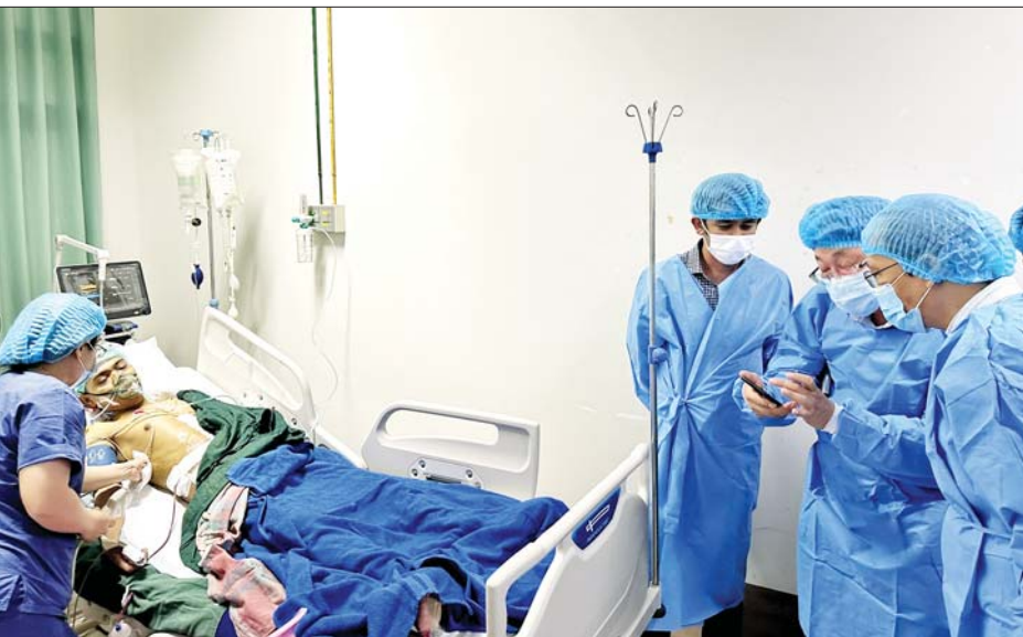
ပြည်ထောင်စုဝန်ကြီး ပါမောက္ခဒေါက်တာသက်ခိုင်ဝင်း အသည်းအစားထိုးခွဲစိတ်ကုသမှု ဆောင်ရွက်ခဲ့သော လူနာနှင့် အသည်းအလျှင်တို့ကို ကြည့်ရှုအားပေးစဉ်။

❖ အထူးကုဆေးရုံကြီးမှ ကျန်းမာရေးဝန်ကြီးဌာန ပြည်ထောင်စုဝန်ကြီး ပါမောက္ခဒေါက်တာသက်ခိုင်ဝင်းသည် ညွှန်ကြားရေးမှူးချုပ်များ၊ တာဝန်ရှိသူများနှင့်အတူ ယမန်နေ့ ညနေပိုင်းတွင် အသည်းအစာထိုး ခွဲစိတ်ကုသမှုဆောင်ရွက်ခဲ့သော လူနာနှင့် အသည်းအလျှင်တို့ကို ကြည့်ရှုအားပေးသည်။ အဆိုပါအသည်းအစားထိုးခွဲစိတ်ကုသမှုကို ကျန်းမာရေးဝန်ကြီးဌာန၏ ကြီးကြပ်လမ်းညွှန်မှုနှင့် ကုသရေးဦးစီးဌာန၏ အနီးကပ်ပံ့ပိုးမှုတို့ဖြင့် ဆေးသုတေသနဦးစီးဌာန ညွှန်ကြားရေးမှူးချုပ် ပါမောက္ခဒေါက်တာဇော်သန်းထွန်း ဦးဆောင်သော ပြည်သူ့ဆေးရုံကြီးများတွင် အသည်းအစားထိုးခွဲစိတ်မှု အောင်မြင်စွာ ပြန်လည်ဆောင်ရွက်နိုင်ရေး လုပ်ငန်းအဖွဲ့၊ ပါမောက္ခ/ဌာနမှူး (အသည်းနှင့် သည်းခြေလမ်းကြောင်းခွဲစိတ်) ပါမောက္ခဒေါက်တာ စိုင်းအောင်ညွှန်ဦး ခေါင်းဆောင်သော အသည်းခွဲစိတ်ကုသမှုဆိုင်ရာလုပ်ငန်းအဖွဲ့၊ ပါမောက္ခ/ဌာနမှူး (အသည်းဆေးကု) ပါမောက္ခဒေါက်တာဝင်းဝင်းဆွေ ခေါင်းဆောင်သော အသည်းဆေးကုသမှုဆိုင်ရာ လုပ်ငန်းအဖွဲ့၊ ပါမောက္ခ/ဌာနမှူး (မေ့ဆေး) ပါမောက္ခ ဒေါက်တာမူမူနိုင် ခေါင်းဆောင်သော မေ့ဆေးဆိုင်ရာ လုပ်ငန်းအဖွဲ့၊ ပါမောက္ခ/ဌာနမှူး (နှလုံးနှင့် သွေးကြောခွဲစိတ်) ပါမောက္ခဒေါက်တာဝင်းဝင်းကျော် ခေါင်းဆောင်သော နှလုံးနှင့် သွေးကြောခွဲစိတ်မှု ဆိုင်ရာလုပ်ငန်းအဖွဲ့၊ ဒုတိယညွှန်ကြားရေးမှူးချုပ် (ဓာတ်ခွဲ) ဒေါက်တာဆွေဆက် ခေါင်းဆောင်သော ရောဂါရှာဖွေရေးဆိုင်ရာ လုပ်ငန်းအဖွဲ့၊ ပါမောက္ခ/ဌာနမှူး (ဓာတ်မှန်) ပါမောက္ခဒေါက်တာအောင်ချို ထွန်း ခေါင်းဆောင်သော ဓာတ်မှန်ပညာဆိုင်ရာ