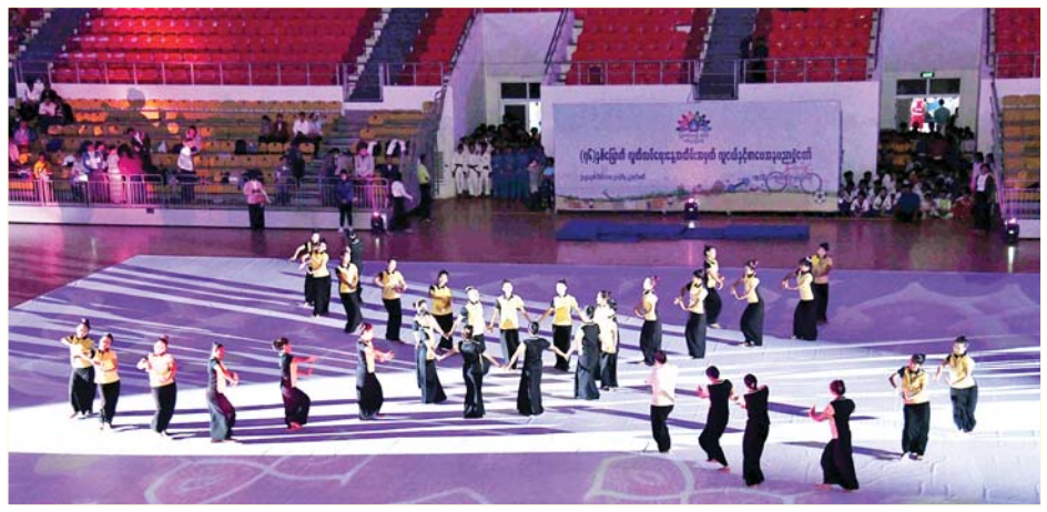
လူငယ်နှင့် စာပေအနုပညာပွဲတော် ဖျော်ဖြေရေးအစီအစဉ်အတွက် လေ့ကျင့်နေမှုကို တွေ့ရစဉ်။