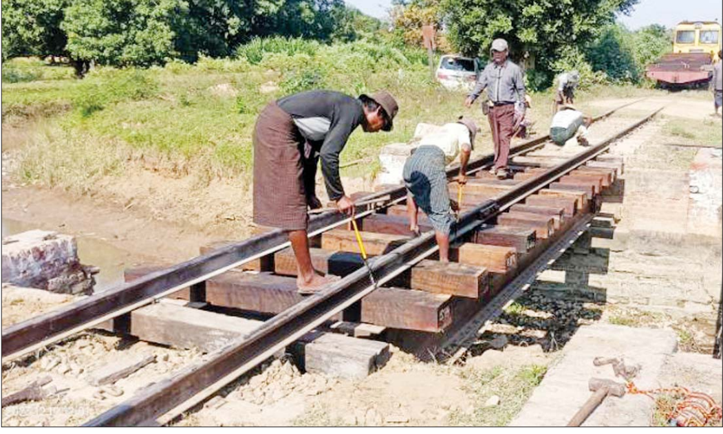
ရထားလမ်း/တံတား ပြန်လည်ပြုပြင်နေစဉ်။

နေပြည်တော် ဒီဇင်ဘာ ၁၉ မန္တလေးတိုင်းဒေသကြီးကျောက်ဆည် မြို့နယ် မင်းစုဘူတာနှင့် ကျောက်ဆည် ဘူတာအကြား မိုင်တိုင်အမှတ် ၃၅၃/၃ နှင့် ၄ အကြား တံတားအမှတ် (၇၃၆) အနီးတွင် PDF အမည်ခံ အကြမ်းဖက် သမားများက မိုင်းခွဲဖျက်ဆီးထားခြင်း ကြောင့် တံတားချဉ်းကပ်လမ်းရှိ ကွန်ကရစ်လီမားတုံးများ ပျက်စီးပြီး သံလမ်းများ နေရာရွေနေမှုကြောင့်မင်းစု နှင့်ကျောက်ဆည်အကြား ရထားလမ်း ပိုင်းများအား ခေတ္တပိတ်ထားရသဖြင့် အမှတ်(၅)အဆန် ရန်ကုန်-မန္တလေး လူစီးအမြန်ရထားသည် ဖြစ်သားဘူတာ သို့ ယနေ့ နံနက် ၇ နာရီ မိနစ် ၂၀ တွင် ရောက်ရှိ ရပ်တန့်ထားခဲ့ရကြောင်း သိရသည်။ စာမျက်နှာ ၁၅ ကော်လံ ၁ သို့*