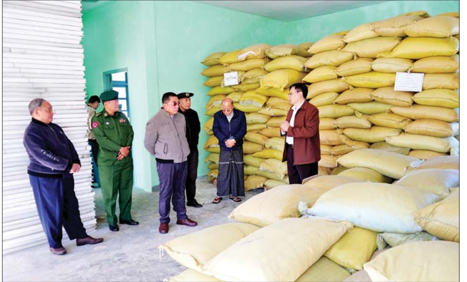
အစီအမံများကို တင်ပြသည်။ ရှင်းလင်းတင်ပြချက်များအပေါ် ပြည်နယ် ဝန်ကြီးချုပ်က လိုအပ်သည်များ ပေါင်းစပ်ညှိနှိုင်း ဆောင်ရွက်ပေးပြီး ချင်းပြည်နယ် စိုက်ပျိုးရေးဦးစီးဌာန ဝန်ထမ်းများအတွက် ပြည်နယ်ဝန်ကြီးချုပ်က ခရစ္စမတ်လက်ဆောင်အဖြစ် ငွေကျပ် ၁၀ သိန်း ပေးအပ်ခဲ့ကြောင်း သိရသည်။ ခရိုင် ( ပြန်/ဆက် )

စိုက်ပျိုးရေးထိခိုက်မှုမရှိဘဲ အချိန်မီစိုက်ပျိုးနိုင်ရေးအတွက် စပါးမျိုးစုံ၊ အစေ့ထုတ်ပြောင်း စသည်မျိုးစေ့များ စုဆောင်းထားရှိမှုအခြေအနေ လာမည့် ၂၀၂၄-၂၀၂၅ ခုနှစ် မိုးရာသီတွင် စိုက်ပျိုးမည့် နှစ်ရှည်ပင်များဖြစ်သော ဝဥ၊ စပျစ်၊ လိမ္မော်၊ ထောပတ်၊ ကော်ဖီပင်များ ပျိုးထောင်ထားရှိမှုအခြေအနေ၊ ချင်းပြည်နယ်အတွင်း ရွှေ့ပြောင်းတောင်ယာစနစ် ပပျောက်ရေးအတွက် ခေတ်မီတောင်စောင်းစနစ် စိုက်ပျိုးထားရှိမှုအခြေအနေ၊ ၂၀၂၁-၂၀၂၂ ခုနှစ်မှ စတင်၍ ချင်းပြည်နယ် စိုက်ပျိုးရေးဦးစီးဌာနနှင့် စိုက်ပျိုးရေးသုတေသနဦးစီးဌာနတို့ ပူးပေါင်း၍ စပါး၊ ဂျုံ၊ အစေ့ထုတ်ပြောင်း၊ လူး၊ ဆပ်၊ ပဲပုပ်၊ ပဲလွမ်းစသည့် သီးနှံမျိုးများ ဒေသနှင့် ကိုက်ညီမှုရှိ မရှိ စမ်းသပ် စိုက်ပျိုးထားရှိမှုအခြေအနေများကို လိုက်လံရှင်းလင်း ပြသပြီး ဆက်လက်အကောင်အထည်ဖော်လိုသည့်