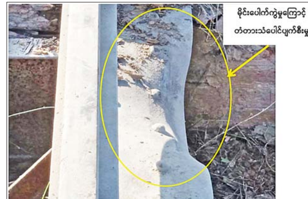
မိုင်းပေါက်ကွဲမှုကြောင့် တံတားသံပေါက်စီးမှု

ရန်ကုန်-မန္တလေးရထားလမ်းပိုင်းအတွင်း မင်းစုဘူတာနှင့် ကျောက်ဆည်ဘူတာကြား မိုင်တိုင်အမှတ် ၃၅၇/၃နှင့် ၄ အကြား၊ တံတားအမှတ် ၇၃၆ အနီး PDF အမည်ခံ အကြမ်းဖက်သမားများက မိုင်းထောင်ဖောက်ခွဲဖျက်ဆီးမှုကြောင့် ရထားလမ်း/တံတား ပျက်စီးမှု။