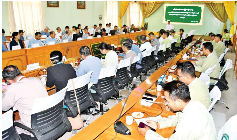
တင်ပြကြသည်။ ဆက်လက်ပြီး တိုင်းဒေသကြီးအတွင်းရှိ ကလေးခရိုင်၊ စစ်ကိုင်းခရိုင်၊ ရေဦးခရိုင်၊ ရွှေဘိုခရိုင် စီမံအုပ်ချုပ်ရေးအဖွဲ့ဥက္ကဋ္ဌများက ဗီဒီယိုကွန်ဖရင့် စနစ်ဖြင့် လည်းကောင်း၊ မုံရွာခရိုင် စီမံအုပ်ချုပ်ရေး အဖွဲ့ဥက္ကဋ္ဌတို့က မိမိတို့ခရိုင်များအတွင်းရှိ မြို့နယ်

မုံရွာ ဒီဇင်ဘာ ၁၉ စစ်ကိုင်းတိုင်းဒေသကြီးအစိုးရအဖွဲ့ ဒေသတည်ငြိမ်အေးချမ်းရေးနှင့် အကောင်အထည်ဖော် ဆောင်ရွက်နေသည့်လုပ်ငန်းများ အောင်မြင်အောင် ဆောင်ရွက်ရေး ညှိနှိုင်းအစည်းအဝေး (၆/၂၀၂၃)ကို ယနေ့ နံနက်ပိုင်းတွင် တိုင်းဒေသကြီး အစိုးရအဖွဲ့ရုံး အစည်းအဝေးခန်းမ၌ ကျင်းပသည်။