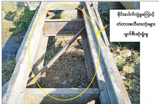
မိုင်းပေါက်ကွဲမှုကြောင့် တံတားလီဖားတုံးများ ပျက်စီးဆုံးရှုံးမှု