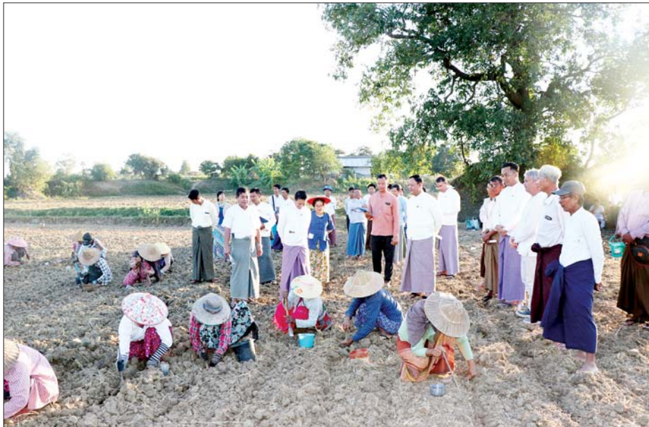
ဖက်ဒရေးရှင်းနိုင်ငံမှ Norma | Bravo | Excellent မျိုးများ စမ်းသပ်စိုက်ပျိုးနေမှုကို တာဝန်ရှိသူများက ရှင်းလင်းတင်ပြကြသည်။

သမဝါယမနှင့် ကျေးလက်ဖွံ့ဖြိုးရေးဝန်ကြီးဌာန ပြည်ထောင်စုဝန်ကြီးဦးလှမိုးသည် ယနေ့နံနက်ပိုင်းတွင် အမြဲတမ်းအတွင်းဝန်၊ ညွှန်ကြားရေးမှူးချုပ်များ၊ တာဝန်ရှိသူများနှင့်အတူ ရှာဖွေဖော်ရွေးရှင်းနိုင်ငံ ရော့စ်ကွန်ကရက် ရင်းနှီးမြှုပ်နှံမှုရန်ပုံငွေအဖွဲ့နှင့် ပူးပေါင်းဆောင်ရွက်လျက်ရှိသော လယ်ဝေးမြို့နယ် မြေရိုးကျောင်းစုကျေးရွာအုပ်စု ရုံးတောကျေးရွာ၌ ရွှေဝါထွန်း(၂) စိုက်ပျိုးထုတ်လုပ်ရေးသမဝါယမ အသင်းလီမိတက်အသင်းပိုင်မြေ ၁၅ ဧကပေါ်တွင် ဆီထွက်သီးနှံနေကြာ စမ်းသပ်စိုက်ပျိုးနေမှုကို ကြည့်ရှုစစ်ဆေးသည်။