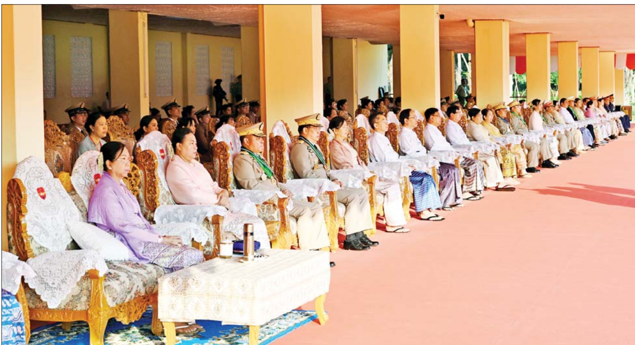
တပ်မတော်ဆေးတက္ကသိုလ် ဗိုလ်လောင်းသင်တန်း အမှတ်စဉ် (၂၄) သင်တန်းဆင်း ဂုဏ်ပြုစစ်ရေးပြအခမ်းအနားသို့ တက်ရောက်လာကြသူများကို တွေ့ရစဉ်။

စာမျက်နှာ ၃ မှ လိုအပ်သည့် ကျန်းမာရေး စောင့်ရှောက်မှု လုပ်ငန်းများကို အချိန်နှင့်တစ်ပြေးညီ ဆောင်ရွက်ပေးနိုင်ခဲ့ကြောင်း၊ ထို့အပြင် ပြန်လည်ထူထောင်ရေး လုပ်ငန်းများအနေဖြင့် ရောဂါကာကွယ် နှိမ်နင်းရေး ဆေးအဖွဲ့ ငါးဖွဲ့ဖြင့် မုန်တိုင်းဒဏ်ဘေးသင့် ဒေသများတွင် သဘာဝဘေးအလွန် ကူးစက် ရောဂါများ ဖြစ်ပွားခြင်းမရှိအောင် ကာကွယ်စောင့်ရှောက်ပေးနိုင်ခဲ့ကြောင်း၊ သဘာဝဘေးအန္တရာယ်များ ကျရောက်လာတိုင်း မိမိတို့ တပ်မတော်သည် ကူညီဆောင်ရွက်ပေးရန် အမြဲအသင့်ရှိနေသောကြောင့် မိခါမုန်တိုင်းဒဏ်ခံခဲ့ရသည့် ပြည်သူများကို ကူညီကယ်ဆယ်ရေးနှင့် ပြန်လည်ထူထောင်ရေး လုပ်ငန်းစဉ်တိုင်းတွင် ဆေးမှူးများ၊ ဆေးဝန်ထမ်းတပ်ဖွဲ့များသည် ရှေ့တန်းမှ တက်တက်ကြွကြွပါဝင်ခဲ့သည်ကို တွေ့မြင်ရမည်ပင်ဖြစ်ကြောင်း။