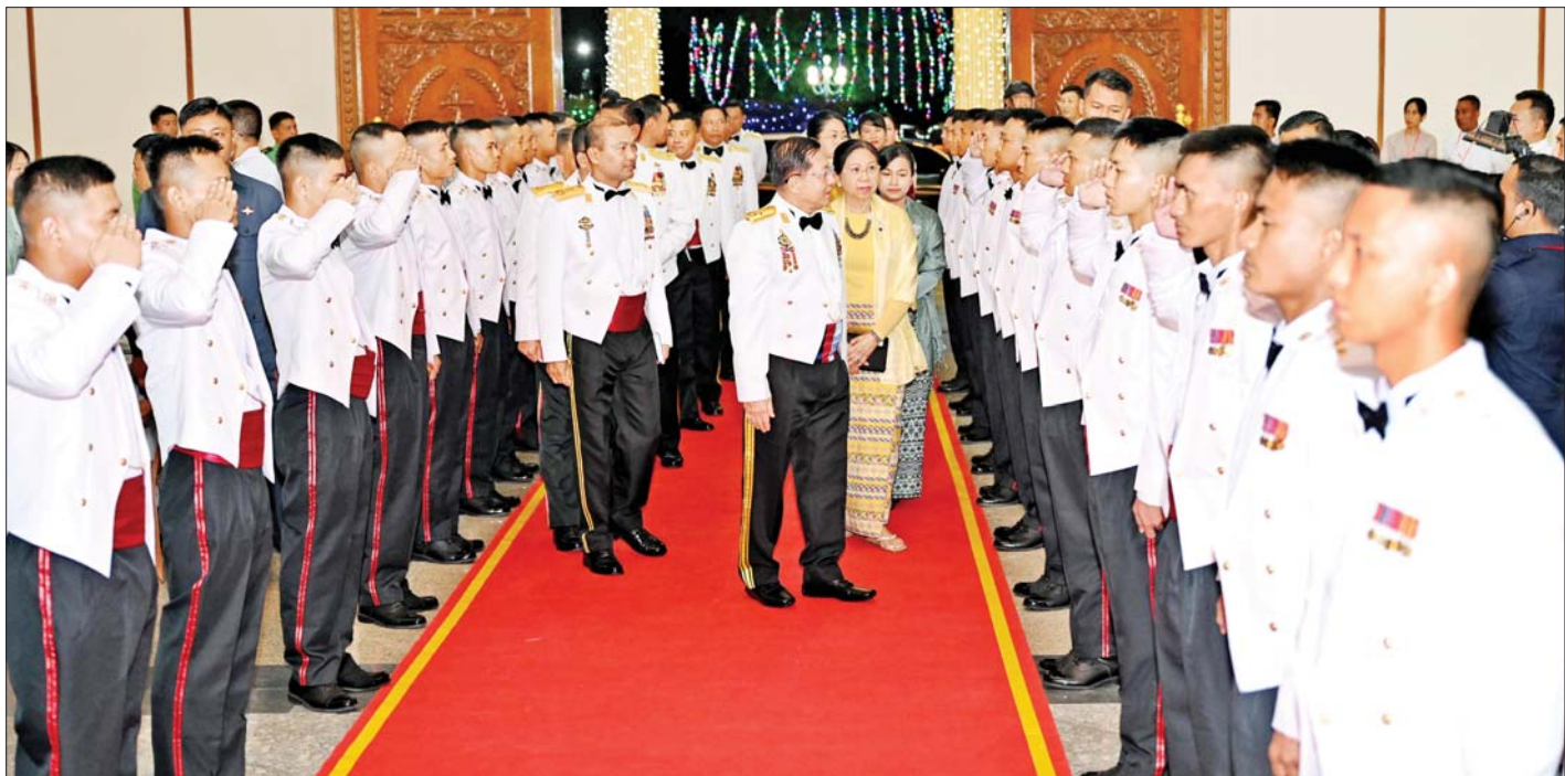
နိုင်ငံတော်စီမံအုပ်ချုပ်ရေးကောင်စီဥက္ကဋ္ဌ တပ်မတော်ကာကွယ်ရေးဦးစီးချုပ် ဗိုလ်ချုပ်မှူးကြီးမင်းအောင်လှိုင် သင်တန်းဆင်းအရာရှိများအား ရင်းရင်းနှီးနှီး နှုတ်ဆက်စဉ်။

ဦးစွာ နိုင်ငံတော်စီမံအုပ်ချုပ်ရေးကောင်စီဥက္ကဋ္ဌ တပ်မတော်ကာကွယ်ရေးဦးစီးချုပ်က သင်တန်းဆင်း