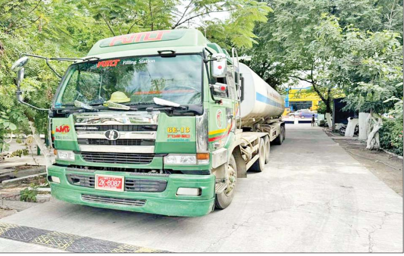
မန္တလေးတိုင်းဒေသကြီး၌ သိမ်းဆည်းရမိမှု။

နေပြည်တော် ဒီဇင်ဘာ ၁၈ တရားမဝင်ကုန်သွယ်မှု တိုက်ဖျက်ရေး ဦးဆောင်ကော်မတီ၏ ကြီးကြပ်ကွပ်ကဲမှုဖြင့် တရားမဝင် ကုန်သွယ်မှုများကို ဥပဒေနှင့်အညီ ထိရောက်စွာ တားဆီးအရေးယူနိုင်ရေး ဆောင် ရွက်လျက်ရှိရာဒီဇင်ဘာ ၁၅ ရက်တွင် မန္တလေး တိုင်းဒေသကြီး တရားမဝင်ကုန်သွယ်မှု တိုက်ဖျက်ရေးအဖွဲ့၏ စီမံခန့်ခွဲမှုဖြင့် တာဝန်ကျပူးပေါင်းအဖွဲ့များက စစ်ဆေးမှုများ ဆောင်ရွက်ခဲ့ရာ (၁၆)မိုင်ကျောက်ချောစစ်ဆေး ရေးစခန်း၌ ပြင်ဦးလွင်မြို့မှ မန္တလေးမြို့သို့ မောင်းနှင်လာသော ယာဉ်တစ်စီးပေါ်မှ စက်သုံးဆီ သယ်ဆောင်ခွင့်မပြုဘဲ တင်ပြနိုင် ခြင်း မရှိသည့် စက်သုံးဆီ ဒီဇယ်ဆီ ဂါလန် ၆၀၀ (ခန့်)မှန်း တန်ဖိုးငွေကျပ် ၆၀၀၀၀၀)နှင့် အဆိုပါ စက်သုံးဆီများ သယ်ဆောင်လာသည့် Isuzu Light Truck တစ်စီး (ခန့်)မှန်း တန်ဖိုး