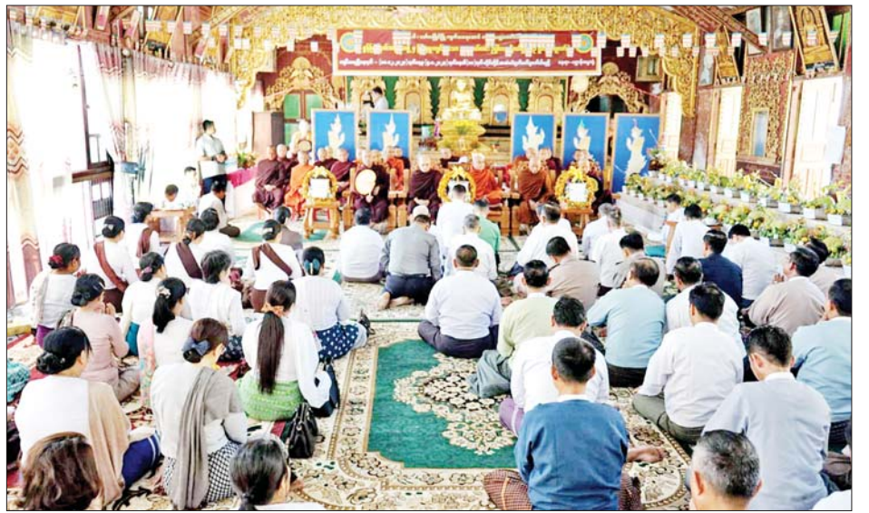
အဆိုပါ အသံမစဲဥပ္ပါတသန္တိပါဠိတော် ရွတ်ဖတ် ပူဇော်ပွဲကို ဒီဇင်ဘာ ၁၈ ရက်မှ ဇန်နဝါရီ ၅ ရက်အထိ ၁၈ ရက်တိုင်တိုင် ရွတ်ဖတ်ပူဇော်သွားမည်ဖြစ်ကြောင်း သိရသည်။ ခရိုင်(ပြန်/ဆက်)

နာယူကြည်ညိုခဲ့ကြသည်။ ဆက်လက်၍ ပြည်နယ်ဝန်ကြီးချုပ်၊ ပြည်နယ် တရားလွှတ်တော်တရားသူကြီးချုပ်၊ ပြည်နယ်အစိုးရ အဖွဲ့ဝင်ဝန်ကြီးများနှင့် အလှူရှင်အပေါင်းတို့က သံဃာတော်အရှင်သူမြတ်များအား လှူဖွယ်ဝတ္ထု ပစ္စည်းများ ဆက်ကပ်လှူဒါန်းခဲ့ကြပြီး ပြည်နယ် သံဃာယကအဖွဲ့ဥက္ကဋ္ဌ မော်လမြိုင်မြို့ ဖက်တန်း ရပ်ကွက် အဘယသုတာရာမစာသင်တိုက်ကြီး၏ ဦးစီးပဓာနနာယကဆရာတော်(ဂန္ထဝါစကပဏ္ဍိတ၊ အဂ္ဂမဟာ သဒ္ဓမ္မဇောတိကဓဇ) ဘဒ္ဒန္တသာသန မထေရ်မြတ်ထံမှ ဩဝါဒကထာ နာယူကြည်ညို၍ လှူဒါန်းမှုအစုစုတို့အတွက် ရေစက်သွန်းချ အမျှ ပေးဝေခဲ့ကြကာ အခမ်းအနားကို “ဗုဒ္ဓသာသန စိရံတိဋ္ဌတု” သုံးကြိမ်ရွတ်ဆိုဆုတောင်း၍ ရုပ်သိမ်းခဲ့ ပြီး ပြည်နယ်ဝန်ကြီးချုပ်နှင့် တာဝန်ရှိသူများက သံဃာတော်အရှင်သူမြတ်များ ဥပ္ပါတသန္တိပါဠိတော် ရွတ်ဖတ်ပူဇော်နေမှုကို ကြည်ညိုခဲ့ကြသည်။