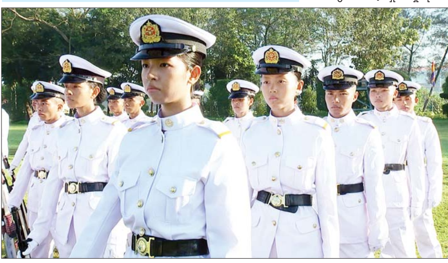
တပ်မတော်ဆေးတက္ကသိုလ် ဗိုလ်လောင်းသင်တန်း အမှတ်စဉ် (၂၄) သင်တန်းဆင်းဂုဏ်ပြုစစ်ရေးပြ အခမ်းအနား၌ နောက်ရံတပ်ခွဲတွင် အမျိုးသမီးဗိုလ်လောင်းများ စစ်ရေးပြပါဝင်လှုပ်ရှားနေမှုကို တွေ့ရစဉ်။

တပ်မတော်က ယုံကြည်အားထား ရသည့် လက်ရုံးရည်၊ နှလုံးရည် ပြည့်ဝသော ဆေးသိပ္ပံပညာရှင် အရာရှိကောင်းများဖြစ်အောင် အစွမ်းကုန် ကြိုးပမ်းဆောင်ရွက် သွားကြရန် မှာကြားလိုကြောင်း ပြောကြားသည်။ ယင်းနောက် နိုင်ငံတော်စီမံ အုပ်ချုပ်ရေးကောင်စီ ဥက္ကဋ္ဌ တပ်မတော်ကာကွယ်ရေးဦးစီးချုပ် ဗိုလ်ချုပ်မှူးကြီး သတိုးမဟာ သရေစည်သူ သတိုးသီရိသုဓမ္မ မင်းအောင်လှိုင်သည် ဗိုလ်လောင်း တပ်ခွဲများ၏ အလေးပြုခြင်းကို ခံယူပြီး စစ်ရေးပြအခမ်းအနားမှ ပြန်လည်ထွက်ခွာသည်။ စစ်ရေးပြအခမ်းအနားအပြီး