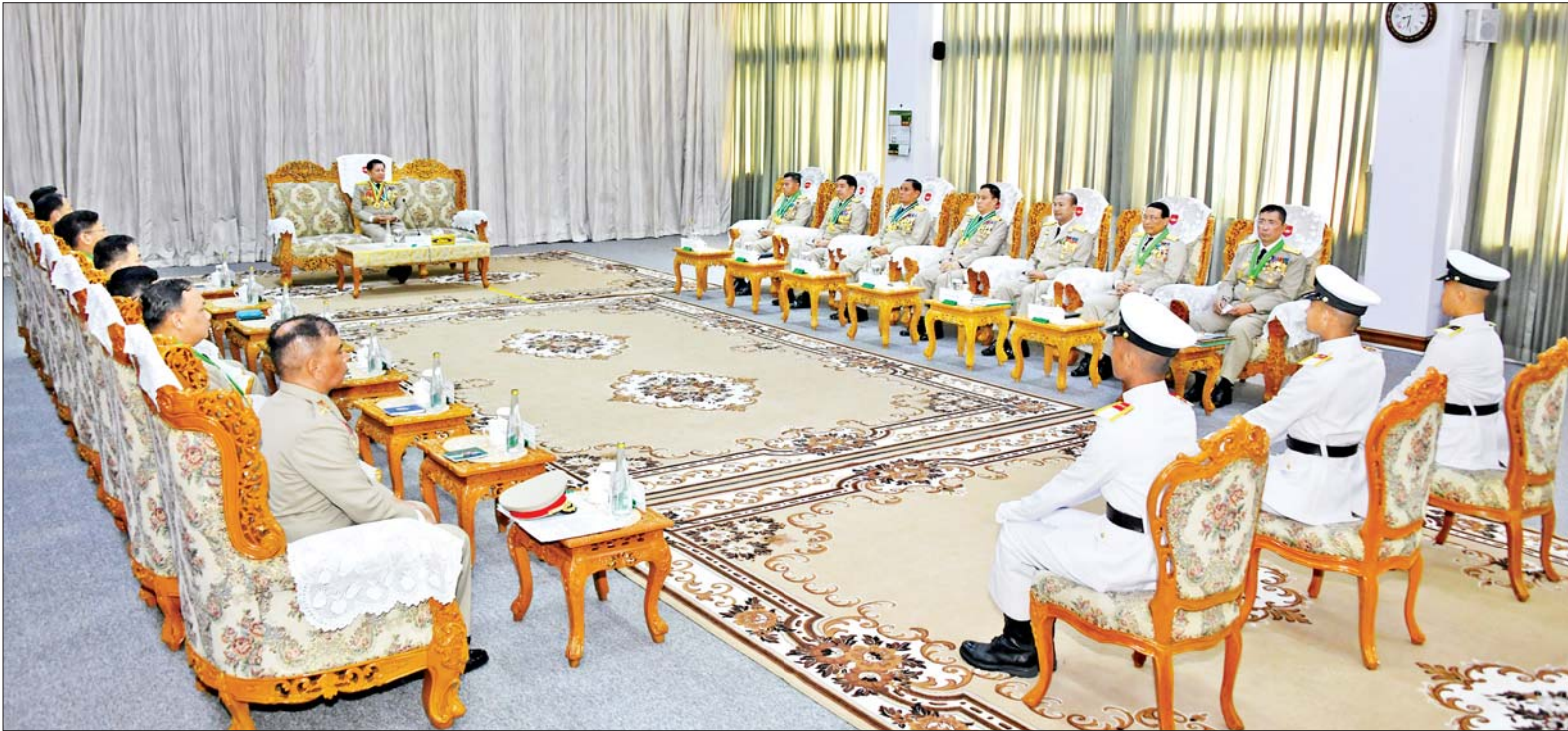
နိုင်ငံတော်စီမံအုပ်ချုပ်ရေးကောင်စီဥက္ကဋ္ဌ တပ်မတော်ကာကွယ်ရေးဦးစီးချုပ် ဗိုလ်ချုပ်မှူးကြီး သတိုးမဟာသရေစည်သူ သတိုးသီရိသုဓမ္မ မင်းအောင်လှိုင် ထူးချွန်ဆုရရှိကြသည့် ဗိုလ်လောင်းများကို တွေ့ဆုံ၍ ဂုဏ်ပြုအမှာစကား ပြောကြားစဉ်။

စာမျက်နှာ ၄ မှ ထို့ပြင် တပ်မတော်သား ဆရာဝန်များဖြစ်သကဲ့သို့ စစ်ဘက် ခေါင်းဆောင်ငယ်များလည်းဖြစ် သည့်အတွက် မိမိကိုယ်ကို ခေါင်းဆောင်မှု အရည်အချင်းနှင့် ပြည့်စုံနေအောင် တည်ဆောက်ကြ ရမည်ဖြစ်ကြောင်း၊ မှန်ကန်သည့် ခေါင်းဆောင်မှုပေးပြီး မိမိတပ်ဖွဲ့ ဝင်များနှင့်အတူ ပေးအပ်လာသည့် ရည်မှန်းချက် တာဝန်များကို ကျေပွန်အောင် ထမ်းဆောင်နိုင်ကြ ရမည်၊ ရဲစွမ်းသတ္တိနှင့်ပြည့်ဝသည့် တပ်မတော်သား ခေါင်းဆောင်ငယ်