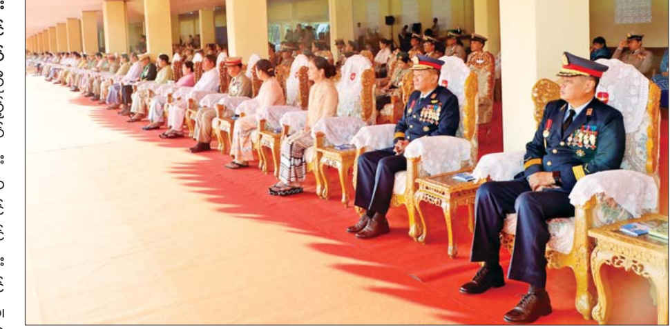
တပ်မတော်ဆေးတက္ကသိုလ် ဗိုလ်လောင်းသင်တန်း အမှတ်စဉ် (၂၄) သင်တန်းဆင်း ဂုဏ်ပြုစစ်ရေးပြ အခမ်းအနားသို့ တက်ရောက်လာကြသူများကို တွေ့ရစဉ်။

ကျန်းမာရေးစောင့် ရှောက်မှုနှင့် အသိပညာမျှဝေပေး မှု ဆေးကုသမှုလုပ်ငန်းများတွင် အကျိုးရှိစွာ အသုံးပြုဆောင်ရွက် သွားကြရန်၊ ခေတ်နှင့်အညီ ပြောင်းလဲ တိုးတက်နေသည့် ဆေးသိပ္ပံပညာရပ်များကို စဉ်ဆက် မပြတ် လေ့လာဆည်းပူး သုတေသနပြုပြီး သက်ဆိုင်ရာ နယ်ပယ်အလိုက် ကျွမ်းကျင် တတ်မြောက်သည့် ဆေးပညာရှင် ဆရာဝန် အရာရှိကောင်းများ ဖြစ်အောင် ကြိုးစားလုပ်ဆောင် သွားကြရန်၊ တာဝန်ကျရာတပ်၊ ဒေသအသီးသီးတွင် တာဝန် ကျေပွန်ပြီး မိမိတို့တတ်ကျွမ်းသည့် ဆေးပညာနှင့် ကျန်းမာရေး ကာကွယ်စောင့်ရှောက်မှုလုပ်ငန်း