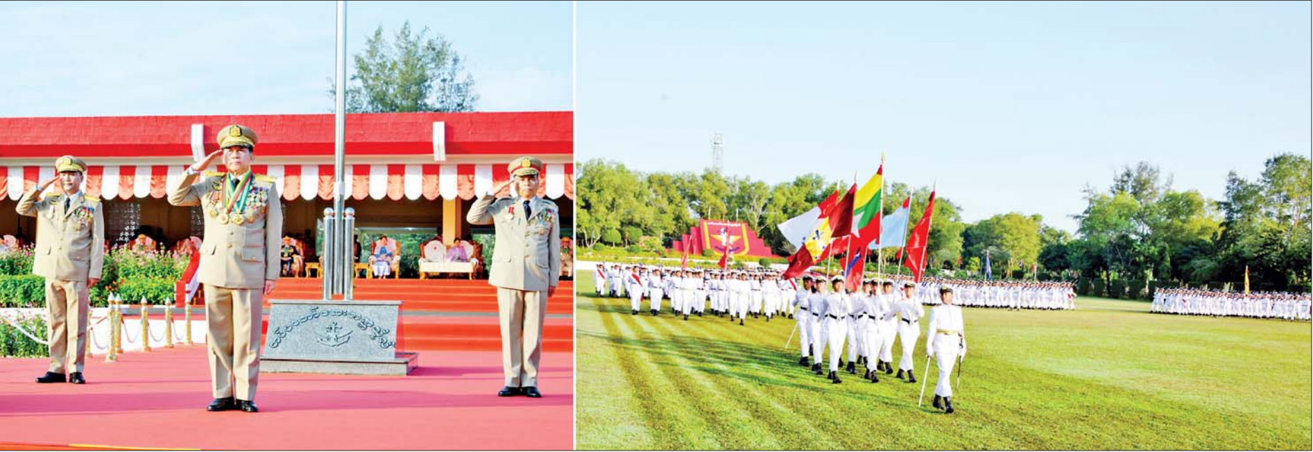
နိုင်ငံတော်စီမံအုပ်ချုပ်ရေးကောင်စီဥက္ကဋ္ဌ တပ်မတော်ကာကွယ်ရေးဦးစီးချုပ် ဗိုလ်ချုပ်မှူးကြီး သတိုးမဟာသရေစည်သူ သတိုးသီရိသုဓမ္မ မင်းအောင်လှိုင်အား ဗိုလ်လောင်းတပ်ခွဲများက အနွေးလျှောက် အမြန်လျှောက်ဖြင့် ချီတက်အလေးပြုကြစဉ်။