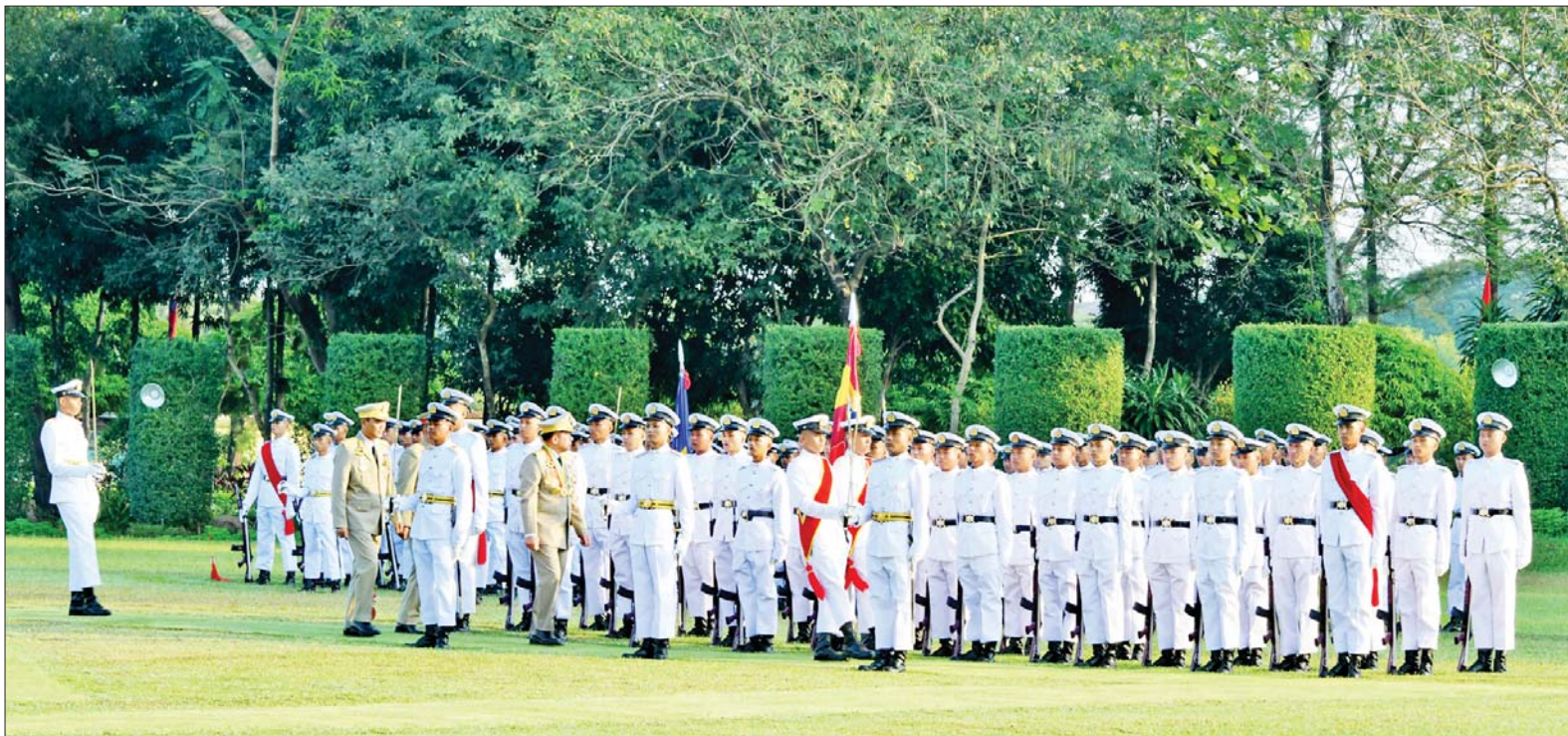
နိုင်ငံတော်စီမံအုပ်ချုပ်ရေးကောင်စီဥက္ကဋ္ဌ တပ်မတော်ကာကွယ်ရေးဦးစီးချုပ် ဗိုလ်ချုပ်မှူးကြီး သတိုးမဟာသရေစည်သူ သတိုးသီရိသုဓမ္မ မင်းအောင်လှိုင် ကျောင်းဆင်း ဗိုလ်လောင်းတပ်ခွဲအား စစ်ဆေးစဉ်။

စာမျက်နှာ ၃ မှ လိုအပ်သည့် ကျန်းမာရေး စောင့်ရှောက်မှု လုပ်ငန်းများကို အချိန်နှင့်တစ်ပြေးညီ ဆောင်ရွက်ပေးနိုင်ခဲ့ကြောင်း၊ ထို့အပြင် ပြန်လည်ထူထောင်ရေး လုပ်ငန်းများအနေဖြင့် ရောဂါကာကွယ် နှိမ်နင်းရေး ဆေးအဖွဲ့ ငါးဖွဲ့ဖြင့် မုန်တိုင်းဒဏ်ဘေးသင့် ဒေသများတွင် သဘာဝဘေးအလွန် ကူးစက် ရောဂါများ ဖြစ်ပွားခြင်းမရှိအောင် ကာကွယ်စောင့်ရှောက်ပေးနိုင်ခဲ့ကြောင်း၊ သဘာဝဘေးအန္တရာယ်များ ကျရောက်လာတိုင်း မိမိတို့ တပ်မတော်သည် ကူညီဆောင်ရွက်ပေးရန် အမြဲအသင့်ရှိနေသောကြောင့် မိခါမုန်တိုင်းဒဏ်ခံခဲ့ရသည့် ပြည်သူများကို ကူညီကယ်ဆယ်ရေးနှင့် ပြန်လည်ထူထောင်ရေး လုပ်ငန်းစဉ်တိုင်းတွင် ဆေးမှူးများ၊ ဆေးဝန်ထမ်းတပ်ဖွဲ့များသည် ရှေ့တန်းမှ တက်တက်ကြွကြွပါဝင်ခဲ့သည်ကို တွေ့မြင်ရမည်ပင်ဖြစ်ကြောင်း။