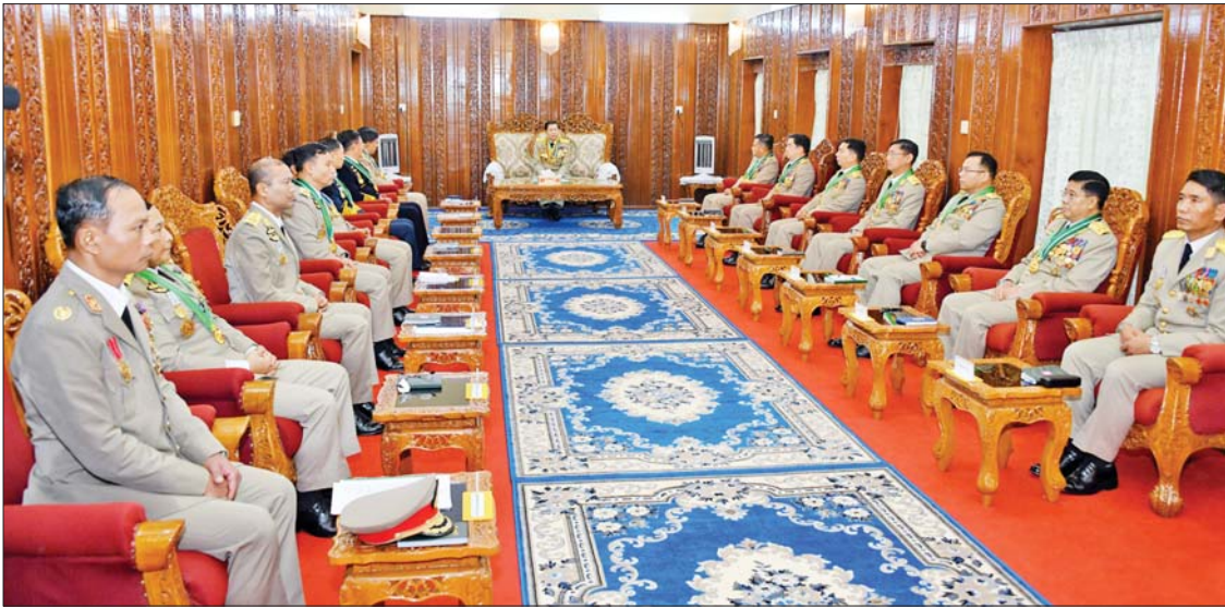
နိုင်ငံတော်စီမံအုပ်ချုပ်ရေးကောင်စီဥက္ကဋ္ဌ တပ်မတော်ကာကွယ်ရေးဦးစီးချုပ် ဗိုလ်ချုပ်မှူးကြီး သတိုးမဟာသရေစည်သူ သတိုးသီရိသုဓမ္မ မင်းအောင်လှိုင်အား ထူးချွန်ဆုရရှိကြသည့် ဗိုလ်လောင်း ငါးဦးကို တွေ့ဆုံ၍ ဂုဏ်ပြုအမှာစကားပြောကြားစဉ်။