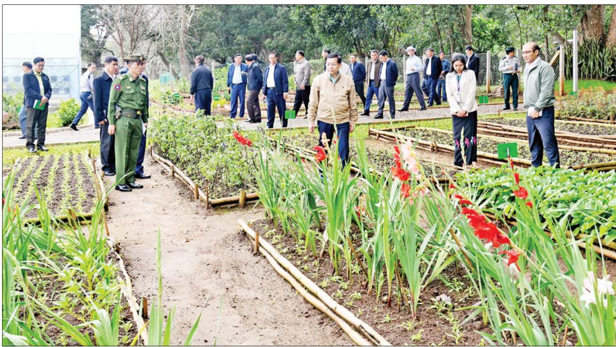
နိုင်ငံတော်စီမံအုပ်ချုပ်ရေးကောင်စီဥက္ကဋ္ဌ နိုင်ငံတော်ဝန်ကြီးချုပ် ဗိုလ်ချုပ်မှူးကြီးမင်းအောင်လှိုင် ပြင်ဦးလွင်မြို့ အမျိုးသားကန်တော်ကြီး ဥယျာဉ်အတွင်း ဒေသပန်းမျိုးများ သုတေသနစင်တာနှင့် စမ်းသပ်စိုက်ခင်းအတွင်း သုတေသနပြုစိုက်ပျိုးစမ်းသပ်ထားရှိမှုများကို ကြည့်ရှု စစ်ဆေးစဉ်။

အမျိုးသား ကန်တော်ကြီး ဥယျာဉ်သည် ပြင်ဦးလွင်မြို့ အတွက်သာမက နိုင်ငံတော် အတွက်လည်း အထိမ်းအမှတ် နေရာ (Land Mark) တစ်ခုဖြစ်ပြီး ၂၀၁၉-၂၀၂၀ ခုနှစ်များတွင် ကန်တော်ကြီးဥယျာဉ်အတွင်းရှိ ကန်များအတွင်းသို့ ရေဝင် ရောက်မှုများ နည်းပါးလာသည့် အတွက် နိုင်ငံတော်စီမံအုပ်ချုပ် ရေးကောင်စီဥက္ကဋ္ဌ နိုင်ငံတော် ဝန်ကြီးချုပ်၏ ၂၀၂၁ ခုနှစ် စက်တင်ဘာလနှင့် ဒီဇင်ဘာလ တို့အတွင်း လာရောက်သည့် ခရီး စဉ်များတွင် လမ်းညွှန်မှုများဖြင့် လိုအပ်သည့် မွမ်းမံပြင်ဆင်မှုများ ပြုလုပ်ခြင်း၊ ရေလမ်းကြောင်း ထိန်းသိမ်းမှုများ ဆောင်ရွက်ခဲ့ ခြင်းကြောင့် ယခုအခါ ကန်တော် ကြီးအတွင်းသို့ ရေဝင်ပေါက်များမှ ရေများ ပြန်လည်စီးဝင်လျက်ရှိပြီး သတ်မှတ် ရေပြည့်ပမာဏထက် ပင် ကျော် လွန် သည် အထိ ထိန်းသိမ်း ဆောင်ရွက်နိုင်ခဲ့ပြီ ဖြစ်ကြောင်း၊ ထို့ပြင် မူလရှိရင်းစွဲ နာမည်ကျော်ကြားမှုကိုဆက်လက် ထိန်းသိမ်း ဆောင်ရွက်နိုင်ရေး၊