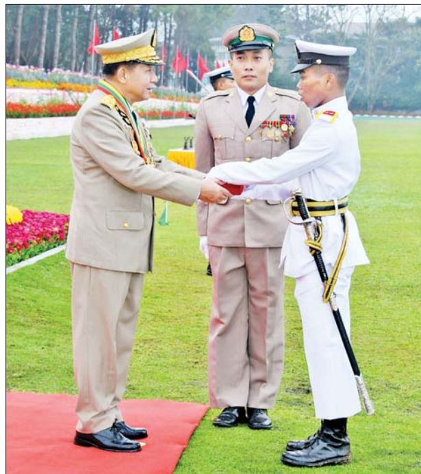
နိုင်ငံတော်စီမံအုပ်ချုပ်ရေးကောင်စီဥက္ကဋ္ဌ တပ်မတော်ကာကွယ်ရေးဦးစီးချုပ် ဗိုလ်ချုပ်မှူးကြီး သတိုးမဟာသရေစည်သူ သတိုးသီရိသုဓမ္မ မင်းအောင်လှိုင် စစ်တက္ကသိုလ် ဗိုလ်လောင်းသင်တန်းအမှတ်စဉ်(၆၅)မှ စာပေထူးချွန်ဆု(ကွန်ပျူတာ)ရရှိသူ ဗိုလ်လောင်း ဟန်ဘုန်းမြတ်အား ဆုပေးအပ်ချီးမြှင့်စဉ်။