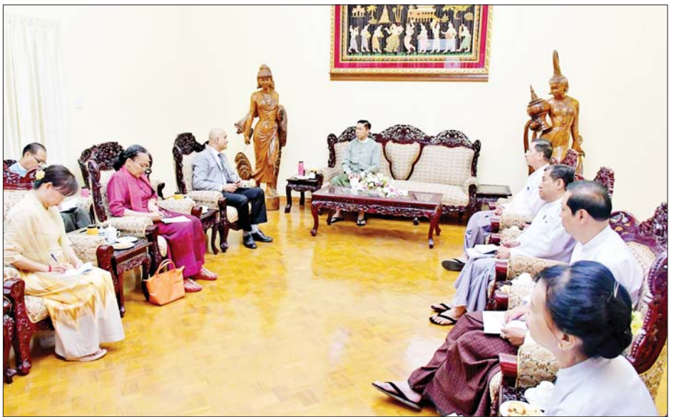
တွေ့ဆုံပွဲသို့ ဒုတိယဝန်ကြီး ဦးစိုးကြည်၊ များချုပ်များနှင့်တာဝန်ရှိသူများ ပါဝင်တက်ရောက် အမြဲတမ်းအတွင်းဝန်၊ ဦးစီးဌာနများမှ ညွှန်ကြားရေး ကြသည်။ သတင်းစဉ်

နိုင်ရေး၊ UNFPA အနေဖြင့် လူမှုဝန်ထမ်းဦးစီးဌာနနှင့် လုပ်ငန်းစီမံချက် (Workplan) လက်မှတ်ရေးထိုး နိုင်ရေးညှိနှိုင်းနေမှုနှင့် နိုင်ငံခြားသားဝန်ထမ်းများ၏ ပြည်ဝင်ဗီဇာကိစ္စများ၊ မိုခါမုန်တိုင်းသင့်ဒေသများ တွင် အကူအညီပေးနိုင်ရေးအတွက် UNOCHA ဝန်ကြီးဌာနတို့နှင့် ပူးပေါင်းဆောင်ရွက်ခဲ့မှုများကို တင်ပြဆွေးနွေးသည်။ ပြည်ထောင်စုဝန်ကြီးက ဝန်ကြီးဌာနနှင့် မိတ်ဖက်အဖွဲ့အစည်းများအကြား လုပ်ငန်းပူးပေါင်း ဆောင်ရွက်မှုသည် လိုအပ်ချက်ရှိသော ပြည်သူများ အတွက် လွန်စွာအရေးပါကြောင်းနှင့် ဝန်ကြီးဌာနနှင့် ပူးပေါင်းဆောင်ရွက်နေသော နိုင်ငံတကာအဖွဲ့ အစည်းများနှင့် ကုလသမဂ္ဂအဖွဲ့အစည်းများ၏ နိုင်ငံ ခြားသားဝန်ထမ်းများအတွက် ဗီဇာထောက်ခံချက် များကို ဝန်ကြီးဌာနက လုပ်ထုံးလုပ်နည်းနှင့်အညီ စိစစ်ထောက်ခံပေးလျက်ရှိကြောင်း ဆွေးနွေး ပြောကြားသည်။