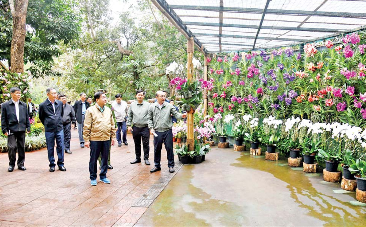
နိုင်ငံတော်စီမံအုပ်ချုပ်ရေးကောင်စီဥက္ကဋ္ဌ နိုင်ငံတော်ဝန်ကြီးချုပ် ဗိုလ်ချုပ်မှူးကြီး မင်းအောင်လှိုင် ပြင်ဦးလွင်မြို့ အမျိုးသားကန်တော်ကြီး ဥယျာဉ်အတွင်း သစ်ခွေဥယျာဉ် ပြသထားရှိမှုကို ကြည့်ရှုစစ်ဆေးစဉ်။

ဆက်မပြတ်ဆောင်ရွက်နေရန်လို ကြောင်း။ ပြင်ဦးလွင်မြို့သည် ပန်းမြို့ တော်ဖြစ်ပြီး ဒေသသို့ လာရောက် ကြသူများအနေဖြင့် မြို့၏သာယာ လှပမှု၊ စည်းကမ်းစနစ်တကျရှိမှု၊ စိတ်ချမ်းမြေ့ဖွယ် ပတ်ဝန်းကျင် ကောင်းကို ဖော်ဆောင်ထားနိုင်မှု များကို အတုယူအားကျသွားစေ သည်အထိ ဖြစ်အောင်ဆောင်ရွက် သွားကြရန်လိုကြောင်း၊ ဒေသခံ များ၏ တစ်ဦးချင်း၊ မိသားစုတစ်စု ချင်း၊ လမ်းများအလိုက်၊ ရပ်ကွက် အလိုက် စည်းကမ်းစနစ်တကျနှင့် နေထိုင်မှုစနစ် သပ်ရပ်သန့်ရှင်း ရေး ပိုင်းဝန်းပူးပေါင်းဆောင် ရွက်ကြရန်လိုကြောင်း၊ ပြင်ဦးလွင် မြို့သာယာလှပမှု၊ စည်းကမ်းစနစ် တကျဖြစ်မှုတို့ကို အားကျအတုယူ ၍ မန္တလေးတိုင်းဒေသကြီးအတွင်း မှ မြို့၊ ရွာများ၊ ၎င်းမှ တစ်နိုင်လုံး အတိုင်းအတာအထိ စည်းကမ်း စနစ်တကျနှင့် သာယာလှပသည့် ပတ်ဝန်းကျင်ကောင်းများ ဖြစ်ပေါ်