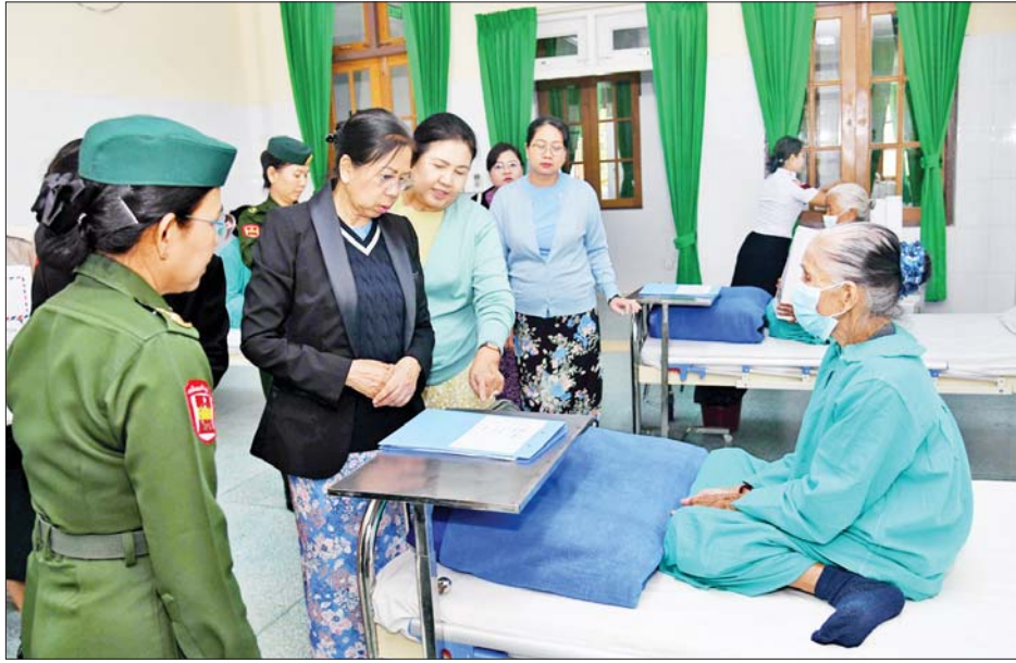
နိုင်ငံတော်စီမံအုပ်ချုပ်ရေးကောင်စီဥက္ကဋ္ဌ တပ်မတော်ကာကွယ်ရေးဦးစီးချုပ် ဗိုလ်ချုပ်မှူးကြီး မင်းအောင်လှိုင်၏ဇနီး ဒေါ်ကြူကြူလှ ပြင်ဦးလွင်မြို့ရှိ နယ်မြေခံတပ်မတော်ဆေးရုံ၌ တက်ရောက်ကုသမှု ခံယူနေသူတစ်ဦးအား ရင်းနှီးနှေးထွေးစွာဖြင့် အားပေးစကားပြောကြားစဉ်။

နေပြည်တော် ဒီဇင်ဘာ ၈ နိုင်ငံတော်စီမံအုပ်ချုပ်ရေးကောင်စီ ဥက္ကဋ္ဌ တပ်မတော်ကာကွယ်ရေးဦးစီးချုပ် ဗိုလ်ချုပ်မှူးကြီး မင်းအောင်လှိုင်သည် ဇနီး ဒေါ်ကြူကြူလှ၊ ညိုနှိုင်းကွပ်ကဲရေးမှူး (ကြည်း၊ ရေလေ) ဗိုလ်ချုပ်ကြီး မောင်မောင်အေးနှင့် ဇနီး၊ ကာကွယ်ရေးဦးစီးချုပ်(ရေ) ဗိုလ်ချုပ်ကြီးမိုးအောင်နှင့် ဇနီး၊ ကာကွယ်ရေးဦးစီးချုပ်(လေ) ဗိုလ်ချုပ်ကြီး ထွန်းအောင်နှင့် ဇနီး၊ တပ်မတော်အရာရှိကြီးများနှင့် ဇနီးများ လိုက်ပါ၍ ယနေ့နေ့လယ်ပိုင်းတွင် ပြင်ဦးလွင်မြို့ရှိ နယ်မြေခံ တပ်မတော်ဆေးရုံ၌ တက်ရောက်ကုသမှုခံယူလျက် ရှိသည့် နိုင်ငံတော်ကာကွယ်ရေးနှင့် လုံခြုံရေးတာဝန် များထမ်းဆောင်စဉ် ထိခိုက်ဒဏ်ရာ ရရှိခဲ့သော အရာရှိ၊ စစ်သည်များ၊ မြန်မာနိုင်ငံရတပ်ဖွဲ့ဝင်များ အား သွားရောက်ကြည့်ရှု အားပေးစကားပြောကြား