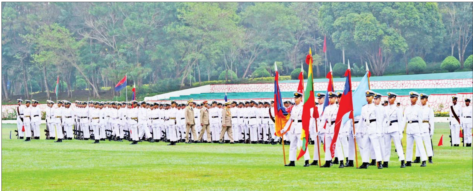
နိုင်ငံတော်စီမံအုပ်ချုပ်ရေးကောင်စီဥက္ကဋ္ဌ တပ်မတော်ကာကွယ်ရေးဦးစီးချုပ် ဗိုလ်ချုပ်မှူးကြီး သတိုးမဟာသရေစည်သူ သတိုးသီရိသုဓမ္မ မင်းအောင်လှိုင် ဗိုလ်လောင်းတပ်ခွဲများအား စစ်ဆေးစဉ်။

○ စာမျက်နှာ ၃ မှ အမိန့်နာခံမှုရှိခြင်းသည် အလွန် အရေးကြီးသကဲ့သို့ စည်းကမ်း ကောင်းမွန်ရန်လည်း လိုအပ်ကြောင်း၊ စည်းကမ်းကောင်းမွန်ခြင်းသည်လည်း အမိန့်နာခံမှုရှိခြင်းပင်ဖြစ်ကြောင်း၊ မိမိတို့ တပ်မတော်အတွင်း၌ စည်းကမ်းများ ချမှတ်ထားခြင်းသည် စနစ်တကျရှိမှုနှင့် စုစည်းညီညွတ်မှုရှိစေရန်ဖြစ်သကဲ့သို့ စစ်မြေပြင်တွင် တစ်ဦးနှင့်တစ်ဦး အသက်ပေးတာဝန်ထမ်းဆောင်ကြရသူများ ဖြစ်သည့်အတွက် အမိန့်နာခံမှုကောင်းပြီး ပေးအပ်သည့်တာဝန်များကို ကျေပွန်စွာထမ်းဆောင်နိုင်ရေး၊ မလိုလားအပ်ဘဲ အသက်အန္တရာယ်ထိခိုက်မှုများ မဖြစ်ပေါ်စေရေးတို့အတွက်ပင် ဖြစ်ကြောင်း၊ ထို့ကြောင့် စည်းကမ်းဆိုသည်မှာ အကြောင်းမဲ့ တင်းကျပ်ထားခြင်း မဟုတ်ဘဲ ကို နားလည်သဘောပေါက်ထားပြီး စည်းကမ်းလိုက်နာခြင်းဖြင့် မိမိကိုယ်ကို မြှင့်တင်သွားရမည် ဖြစ်ကြောင်း။ စံနမူနာပြုလေးစားလိုက်နာ ထို့အပြင် တပ်မတော်သားများ ဖြစ်ရုံသာမက နိုင်ငံသားတစ်ဦးလည်း ဖြစ်သည့်အတွက် တပ်မတော်က ချမှတ်ထားသည့် အမိန့်နှင့်ညွှန်ကြားချက်များ အပါ