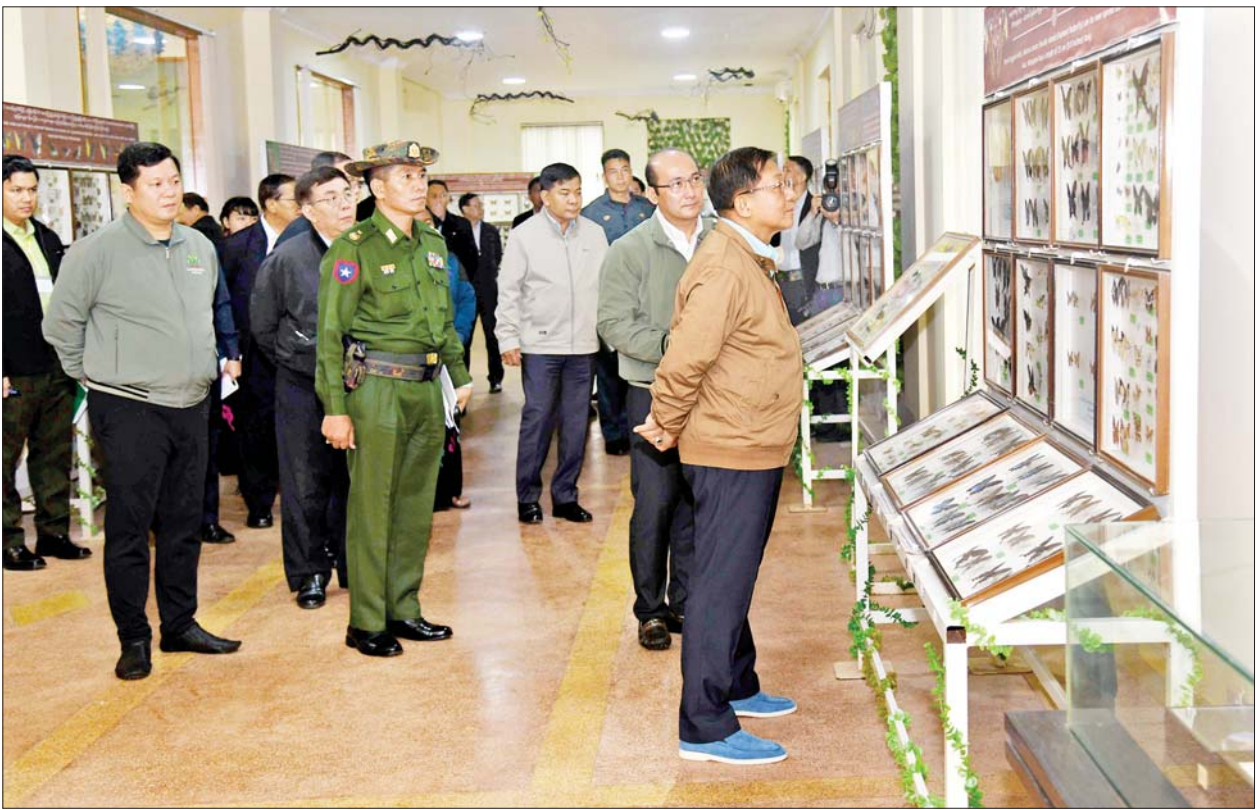
နိုင်ငံတော်စီမံအုပ်ချုပ်ရေးကောင်စီဥက္ကဋ္ဌ နိုင်ငံတော်ဝန်ကြီးချုပ် ဗိုလ်ချုပ်မှူးကြီး မင်းအောင်လှိုင် ပြင်ဦးလွင်မြို့ အမျိုးသားကန်တော်ကြီး ဥယျာဉ်အတွင်း လိပ်ပြာပြတိုက် ပြသထားရှိမှုကို ကြည့်ရှုစစ်ဆေးစဉ်။

နေပြည်တော် ဒီဇင်ဘာ ၈ နိုင်ငံတော်စီမံအုပ်ချုပ်ရေး ကောင်စီဥက္ကဋ္ဌ နိုင်ငံတော်ဝန်ကြီး ချုပ် ဗိုလ်ချုပ်မှူးကြီး မင်းအောင် လှိုင်သည် ယနေ့နံနက်ပိုင်းတွင် ကောင်စီတွဲဖက်အတွင်းရေးမှူး ဒုတိယ ဗိုလ်ချုပ်ကြီး ရဲဝင်းဦး၊ ကောင်စီဝင် ဒုတိယဗိုလ်ချုပ်ကြီး ညိုစော၊ ပြည်ထောင်စုဝန်ကြီး များ၊ မန္တလေးတိုင်းဒေသကြီး ဝန်ကြီးချုပ်၊ ကာကွယ်ရေးဦးစီး ချုပ်ရုံးမှ အဆင့်မြင့်တပ်မတော် အရာရှိကြီးများ၊ အလယ်ပိုင်း တိုင်းစစ်ဌာနချုပ်တိုင်းမှူး၊ မန္တလေး မြို့တော်ဝန်နှင့် တာဝန်ရှိသူများ လိုက်ပါ၍ ပြင်ဦးလွင်မြို့ရှိ အမျိုးသားကန်တော်ကြီးဥယျာဉ် ထိန်းသိမ်းဆောင်ရွက်ထားရှိမှု အခြေအနေများကို သွားရောက် ကြည့်ရှုစစ်ဆေးသည်။ ဦးစွာ ဥယျာဉ်ရှင်းလင်းဆောင် ခန်းမတွင် သစ်တောဦးစီးဌာန ညွှန်ကြားရေးမှူးချုပ် ဒေါက်တာ သောင်းနိုင်ဦးက အမျိုးသား