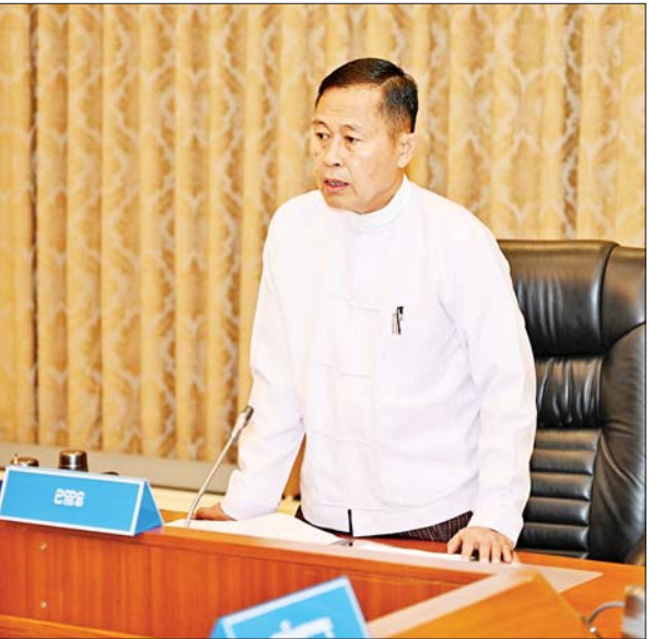
နိုင်ငံတော်စီမံအုပ်ချုပ်ရေးကောင်စီ ဒုတိယဥက္ကဋ္ဌ ဒုတိယဝန်ကြီးချုပ် ဒုတိယဗိုလ်ချုပ်မှူးကြီးစိုးဝင်း (၇၆)နှစ်မြောက် လွတ်လပ်ရေးနေ့ကျင်းပရေးဗဟိုကော်မတီ ဒုတိယအကြိမ် ညှိနှိုင်းအစည်းအဝေးတွင် အမှာစကားပြောကြားစဉ်။