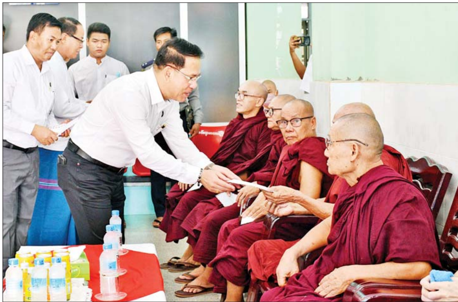
ပြည်ထောင်စုဝန်ကြီး ဦးမောင်မောင်အုန်း နိုင်ငံတော်ဩဝါဒါစရိယ နောင်လုံခြုံမှုပိုင်ကျောင်း ဆရာတော် မဟာဂန္ထဝါစကပဏ္ဍိတ ဘဒ္ဒန္တဝိဇ္ဇာနန္ဒ၊ အမိတာရာမ ရဲကျောင်းဆရာတော် ဘဒ္ဒန္တဂုဏာ လင်္ကာရ အမျိုးပြုသော ထေရ်ကြီးဝါကြီးဆရာတော်ကြီးများအား နဝကမ္မအလှူငွေများ ဆက်ကပ် လှူဒါန်းစဉ်။

ပြန်ကြားရေးဝန်ကြီးဌာန ပြည်ထောင်စုဝန်ကြီး ဦးမောင်မောင်အုန်းသည် ယမန်နေ့ညပိုင်းက ကရင်ပြည်နယ် ဘားအံမြို့ သီရိကွင်းခုံးစင်မြင့်၌ ကျင်းပသည့် (၁၀၃)နှစ်မြောက် အမျိုးသားအောင်ပွဲ နေ့ အထိမ်းအမှတ်ပဒေသာကပွဲကို ကရင်ပြည်နယ် ဝန်ကြီးချုပ် ဦးစောမြင့်ဦးနှင့် ဇနီး၊ ပြည်နယ်တရား လွှတ်တော်တရားသူကြီးချုပ် ဒေါ်ခင်ဆွေထွန်း၊ ပြည်နယ်အစိုးရအဖွဲ့ဝင်များနှင့် ၎င်းတို့၏ ဇနီးများ၊ ဌာနဆိုင်ရာများ၊ ဒေသခံတိုင်းရင်းသားပြည်သူများ နှင့်အတူ တက်ရောက်ကြည့်ရှုအားပေးသည်။