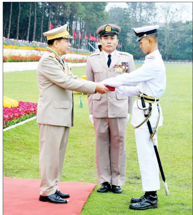
နိုင်ငံတော်စီမံအုပ်ချုပ်ရေးကောင်စီဥက္ကဋ္ဌ တပ်မတော်ကာကွယ်ရေးဦးစီးချုပ် ဗိုလ်ချုပ်မှူးကြီး သတိုးမဟာသရေစည်သူ သတိုးသီရိသုဓမ္မ မင်းအောင်လှိုင် စစ်တက္ကသိုလ် ဗိုလ်လောင်းသင်တန်းအမှတ်စဉ်(၆၅)မှ စာပေထူးချွန်ဆု(သိပ္ပံ)ရရှိသူ ဗိုလ်လောင်း ချမ်းငြိမ်းလွင်အား ဆုပေးအပ်ချီးမြှင့်စဉ်။

သည့် စည်းရုံးရေးနှင့် လက်တွေ့ပါသည့် စည်းရုံးရေးဟူ၍ရှိပြီး ပြုမူဆောင်ရွက်မှု Behaviour အပေါ်တွင် မူတည်ခြင်း ဖြစ်သဖြင့် ညင်သာသိမ်မွေ့စွာ ဆောင်ရွက်ရန်လိုသည့်အတွက် တပ်မတော်စည်းရုံးရေးကော်မတီက ချမှတ်ပေးထားသည့် ရှေ့လုပ်ငန်းစဉ်များနှင့်အညီ စဉ်ဆက်မပြတ် ပီပီပြင်ပြင် ဆောင်ရွက်သွားကြရန်လိုကြောင်း။