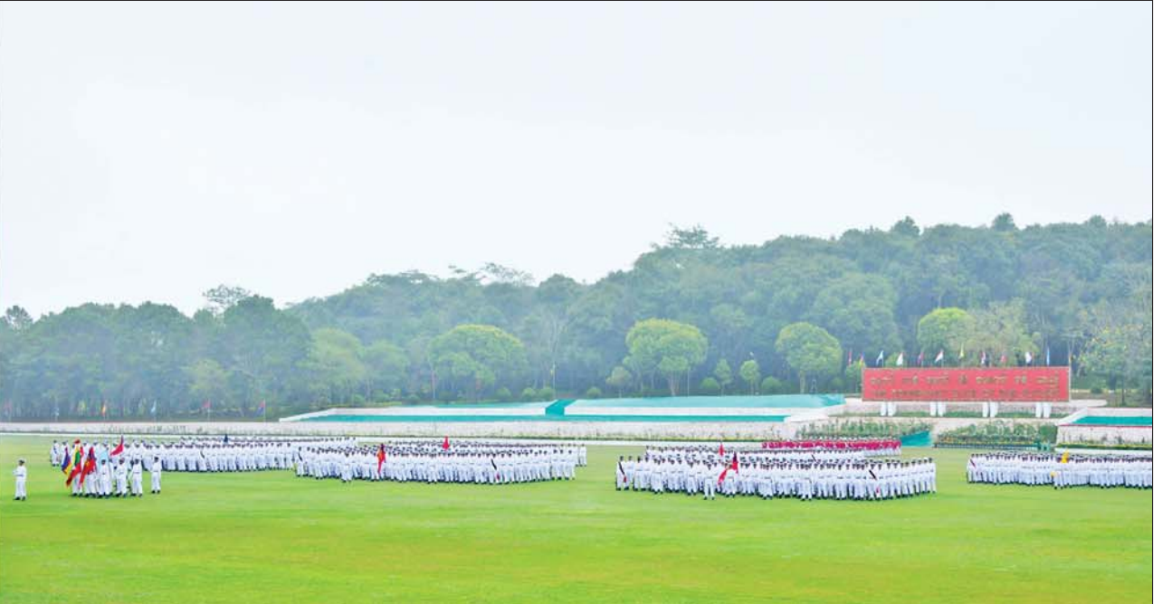
နိုင်ငံတော်စီမံအုပ်ချုပ်ရေးကောင်စီဥက္ကဋ္ဌ တပ်မတော်ကာကွယ်ရေးဦးစီးချုပ် ဗိုလ်ချုပ်မှူးကြီး သတိုးမဟာသရေစည်သူ သတိုးသီရိသုဓမ္မ မင်းအောင်လှိုင် စစ်တက္ကသိုလ် ဗိုလ်လောင်းသင်တန်းအမှတ်စဉ်(၆၅) သင်တန်းဆင်းဂုဏ်ပြုစစ်ရေးပြ အခမ်းအနားတွင် မိန့်ခွန်းပြောကြားစဉ်။