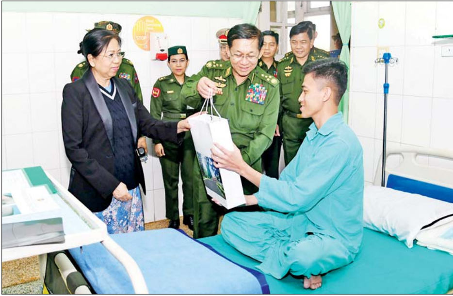
နိုင်ငံတော်စီမံအုပ်ချုပ်ရေးကောင်စီဥက္ကဋ္ဌ တပ်မတော်ကာကွယ်ရေးဦးစီးချုပ် ဗိုလ်ချုပ်မှူးကြီး မင်းအောင်လှိုင်နှင့် ဇနီး ဒေါ်ကြူကြူလှ ပြင်ဦးလွင်မြို့ရှိ နယ်မြေခံတပ်မတော်ဆေးရုံ၌ တက်ရောက် ကုသမှု ခံယူနေသူတစ်ဦးအား ဂုဏ်ပြုချီးမြှင့်ငွေနှင့် လက်ဆောင်ပစ္စည်းများပေးအပ်စဉ်။