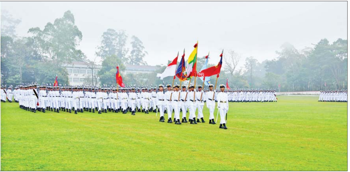
နိုင်ငံတော်စီမံအုပ်ချုပ်ရေးကောင်စီဥက္ကဋ္ဌ တပ်မတော်ကာကွယ်ရေးဦးစီးချုပ် ဗိုလ်ချုပ်မှူးကြီး သတိုးမဟာသရေစည်သူ သတိုးသီရိသုဓမ္မ မင်းအောင်လှိုင်အား ဗိုလ်လောင်းတပ်ခွဲများက အနူးလျှောက်၊ အမြန်လျှောက်ဖြင့် ချီတက်အလေးပြုကြစဉ်။

ဆုများပေးအပ်ချီးမြှင့် ယင်းနောက် နိုင်ငံတော်စီမံအုပ်ချုပ်ရေးကောင်စီ ဥက္ကဋ္ဌ တပ်မတော်ကာကွယ်ရေးဦးစီးချုပ် ဗိုလ်ချုပ်မှူးကြီး သတိုးမဟာသရေစည်သူ သတိုးသီရိသုဓမ္မ မင်းအောင်လှိုင်အား ဗိုလ်လောင်းတပ်ခွဲများက အနူးလျှောက်၊ အမြန်လျှောက်ဖြင့် ချီတက်အလေးပြုကြသည်။ ထို့နောက် နိုင်ငံတော်စီမံအုပ်ချုပ်ရေးကောင်စီ ဥက္ကဋ္ဌ တပ်မတော်ကာကွယ်ရေးဦးစီးချုပ် ဗိုလ်ချုပ်မှူးကြီး သတိုးမဟာသရေစည်သူ သတိုးသီရိသုဓမ္မ မင်းအောင်လှိုင် က စစ်တက္ကသိုလ် ဗိုလ်လောင်းအမှတ်စဉ်(၆၅)မှ အောင်စစ်သည် ဆုရရှိသူ ဗိုလ်လောင်း အမှတ် ၃၅၇၄၃ ဗိုလ်လောင်း သူရိန်ဦး၊ လေ့ကျင့်ရေး ထူးချွန်ဆုရရှိသူ ဗိုလ်လောင်း အမှတ် ၃၅၇၇၈ ဗိုလ်လောင်း ဟိန်းထက်အောင်၊