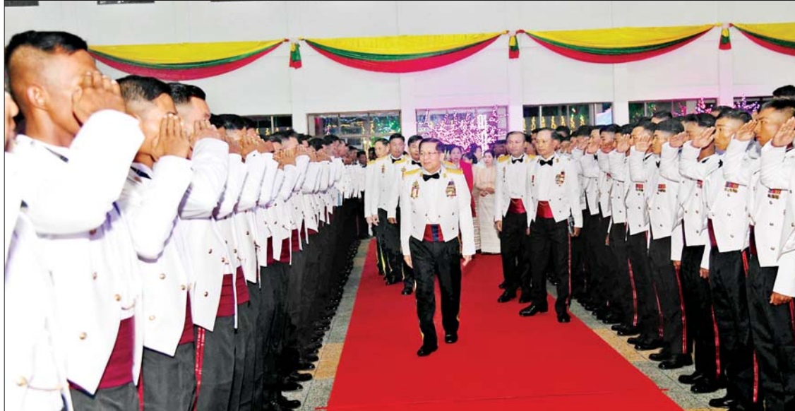
နိုင်ငံတော်စီမံအုပ်ချုပ်ရေးကောင်စီ ဥက္ကဋ္ဌ တပ်မတော်ကာကွယ်ရေးဦးစီးချုပ် ဗိုလ်ချုပ်မှူးကြီး မင်းအောင်လှိုင်နှင့် ဇနီးဒေါ်ကြူကြူလှ စစ်တက္ကသိုလ် ဗိုလ်လောင်းသင်တန်းအမှတ်စဉ်(၆၅) သင်တန်းဆင်း ဂုဏ်ပြုညစာစားပွဲ အခမ်းအနားသို့ တက်ရောက်စဉ်။