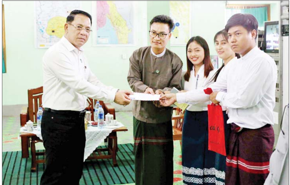
ပြည်ထောင်စုဝန်ကြီး ဦးမောင်မောင်အုန်း မြန်မာ့အသံနှင့် ရုပ်မြင်သံကြား ထပ်ဆင့်လွှင့်စက်ရုံ (ဘားအံ)၌ ဝန်ထမ်းများအား ထောက်ပံ့ငွေပေးအပ်စဉ်။

အတွက် အားထုတ်ကြိုးပမ်းပေး ရန်လိုကြောင်း။ ကူညီပံ့ပိုးပေးထား ကရင်ပြည်နယ်အစိုးရအဖွဲ့က မိမိတို့ရုံးအား လူထုအခြေပြု ဗဟိုဌာနအဆောက်အအုံတစ်ခုကို စီစဉ်တည်ဆောက်၍ လူငယ် ဖွံ့ဖြိုးရေးလုပ်ငန်းများ ဆောင်ရွက် နိုင်ရန် လိုအပ်သည်များ ကူညီပံ့ပိုး ပေးထားသည်ကို တွေ့မြင်ရ၍ လွန်စွာ ကျေးဇူးတင်ဝမ်းမြောက် ပါကြောင်း၊ ပြည်သူများ စာအုပ် စာစောင်ဖတ်ရှုလေ့လာနိုင်ရေးနှင့် အသိပညာ မြှင့်မားလာစေရေး အတွက် စာကြည့်တိုက်များ ဖွင့်လှစ်ပေးရုံဖြင့်မရဘဲ ပြည်သူ များ စာအုပ်စာစောင်များကို လက်လှမ်းတစ် ငှားရမ်းဖတ်ရှုနိုင် ရန် ရွှေလျားစာကြည့်တိုက် ယာဉ်ဖြင့် စာအုပ်၊ စာစောင်များ သွားရောက် ငှားရမ်းပေးကြရမည် ဖြစ်ကြောင်း၊ ယခုအချိန်တွင် နယ်မြေ တည်ငြိမ်အေးချမ်းရေး သည် အဓိကလိုအပ်ချက်ဖြစ်၍ ပြည်သူများအား အကြမ်းဖက် လုပ်ရပ်များကို ဆန့်ကျင်ရုံတင် တိုက်ဖျက်ကြရေး မီဒီယာ နည်းလမ်းများဖြင့် ဆောင်ရွက်ပေး ကြပါဟု ဆွေးနွေးပြောကြားသည်။ ဆက်လက်၍ ပြည်ထောင်စု ဝန်ကြီးသည် မြန်မာ့အသံနှင့် ရုပ်မြင်သံကြား ထပ်ဆင့်လွှင့် စက်ရုံ(ဘားအံ)ကို ကြည့်ရှု စစ်ဆေးပြီး ဝန်ထမ်းများအား ထောက်ပံ့ငွေများ ပေးအပ်ခဲ့သည်။ သတင်းစဉ်