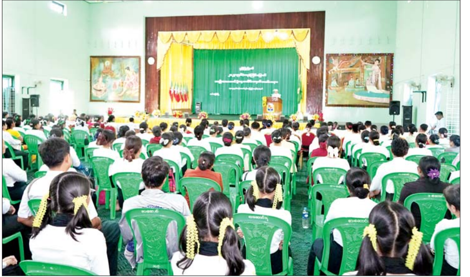
ရုပ်သိမ်းပြီး ပြည်နယ်ဝန်ကြီးချုပ်၊ ပြည်နယ်တရားလွှတ်တော်တရားသူကြီးချုပ်၊ ပြည်နယ်ဝန်ကြီးများက တက်ရောက်လာသော ကျောင်းသားကျောင်းသားများအား ရင်းရင်းနှီးနှီးလိုက်လံနှုတ်ဆက်ကာ ပြန်ကြားရေးနှင့် ပြည်သူ့ဆက်ဆံရေးဦးစီးဌာနက (၁၀၃)နှစ်မြောက် အမျိုးသားအောင်ပွဲနေ့ အထိမ်းအမှတ် သတင်းစကားလက် ကမ်းစာစောင်များကို တက်ရောက်လာသူများအား ဝေငှပေးခဲ့ကြောင်း သိရသည်။ ခရိုင်(ပြန်/ဆက်)

အောင်ပွဲနေ့အထိမ်းအမှတ် အခြေခံပညာ အထက်တန်းအဆင့်၊ အလယ်တန်းအဆင့်၊ မူလတန်းအဆင့် စာစီစာကုံးပြိုင်ပွဲတွင် ဆုရရှိသော ကျောင်းသားကျောင်းသူများအား ပြည်နယ်ဝန်ကြီးချုပ် ဦးအောင်ကြည်သိန်းကလည်းကောင်း၊ အခြေခံပညာအထက်တန်းအဆင့်၊ အလယ်တန်းအဆင့်၊ မူလတန်းအဆင့် ကဗျာပြိုင်ပွဲတွင် ဆုရရှိသော ကျောင်းသားကျောင်းသူများအား ပြည်နယ်တရားလွှတ်တော်တရားသူကြီးချုပ်ဦးညီညီစိုးကလည်းကောင်း၊ အခြေခံပညာအထက်တန်းအဆင့်၊ အလယ်တန်းအဆင့်၊ မူလတန်းအဆင့် ပန်းချီပြိုင်ပွဲတွင် ဆုရရှိသော ကျောင်းသားကျောင်းသူများအား ပြည်နယ်လုံခြုံရေးနှင့် နယ်စပ်ရေးရာဝန်ကြီး ဗိုလ်မှူးကြီးကျော်စွာမြင့်က လည်းကောင်း ဆုများ ပေးအပ်ခဲ့ခြင်းဖြစ်သည်။ ဆက်လက်၍ အမှတ်(၈)အခြေခံပညာအထက်တန်းကျောင်းမှ ကျောင်းသူလေးများက “မြန်မာ့ကျောင်း” သီချင်းဖြင့် သီဆိုဖြေဖျော်၍ အခမ်းအနားကို