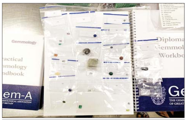
ရန်ကုန်အပြည်ပြည်ဆိုင်ရာလေဆိပ် လေဆိပ်(သွင်းကုန်)၌ သိမ်းဆည်းရမိမှု။

နေပြည်တော် ဒီဇင်ဘာ ၇ တရားမဝင်ကုန်သွယ်မှုတိုက်ဖျက်ရေး ဦးဆောင်ကော်မတီ၏ ကြီးကြပ်ကွပ်ကဲမှုဖြင့် တရားမဝင်ကုန်သွယ်မှုများကို ဥပဒေနှင့်အညီ ထိရောက်စွာ တားဆီးအရေးယူနိုင်ရေး ဆောင်ရွက်လျက်ရှိရာ ဒီဇင်ဘာ ၅ ရက်တွင် မန္တလေးတိုင်းဒေသကြီး တရားမဝင်ကုန်သွယ်မှုတိုက်ဖျက်ရေးအထူးအဖွဲ့၏ စီမံခန့်ခွဲမှုဖြင့် တာဝန်ကျပူးပေါင်းအဖွဲ့က စစ်ဆေးမှုများ ဆောင်ရွက်ခဲ့ရာ ၁၆ မိုင် ကျောက်ချောစစ်ဆေးရေးစခန်း၌ ယာဉ်တစ်စီးပေါ်မှ ပုစွန်တစ်ကောင် စားအုန်းဆီ ၁၈ လီတာပါ ပုံး ၁၅၀၊ ပုစွန်နှစ်ကောင်စားအုန်းဆီ ငါးလီတာပါ ဘူး ၁၆၀၊ ပုစွန်နှစ်ကောင်စားအုန်းဆီ နှစ်လီတာပါ ဘူး ၁၂၀၊ ပုစွန်နှစ်ကောင်စားအုန်းဆီ တစ်လီတာပါ ဘူး ၇၂၀၊ မြတ်ဆိပ် စားအုန်းဆီ ၁၈ လီတာပါ ပုံး ၅၀ (ခန့်မှန်းတန်ဖိုးငွေကျပ် ၁၈၇၆၀၀၀)နှင့် အဆိုပါစားအုန်းဆီများ တင်ဆောင်လာသည့် Mitsubishi Canter တစ်စီး (ခန့်မှန်းတန်ဖိုးငွေကျပ် ၁၈၀၀၀၀၀) (စုစုပေါင်း ခန့်မှန်းတန်ဖိုးငွေကျပ် ၃၆၇၆၀၀၀) ကို သိမ်းဆည်းရမိခဲ့ပြီး အကောက်ခွန်လုပ်ထုံးလုပ်နည်းများနှင့်အညီ အရေးယူဆောင်ရွက်လျက်ရှိသည်။ ထို့အပြင် အကောက်ခွန်ဦးစီးဌာန၏စီမံခန့်ခွဲမှုဖြင့် တာဝန်ကျပူးပေါင်းအဖွဲ့များက စစ်ဆေးမှုများ ဆောင်ရွက်ရာတွင် ဒီဇင်ဘာ ၅ ရက်တွင် မြန်မာ့စက်မှုဆိပ်ကမ်း၌ သွင်းကုန်ကြေညာလွှာတွင် ကြေညာထားခြင်းမရှိသည့် Lebay Baby Wipe တစ်ရုံအထုပ် ၁၅၃၀ အပါအဝင် ကုန်ပစ္စည်းလေးမျိုး (ခန့်မှန်းတန်ဖိုးငွေကျပ် ၁၂၂၄၀၀၀) ကိုလည်းကောင်း၊ အေးရှားဝေါလ်ကုန်သေတ္တာစစ်ဆေးရေးစခန်း၌ ကုန်သေတ္တာ တစ်လုံးအတွင်းမှ သွင်းကုန်ကြေညာလွှာတွင် ကြေညာထားသည်နှင့် ကွဲလွဲစွာပါရှိလာသည့် ယာဉ်အပိုပစ္စည်း T-Bar Clamp ကီလိုဂရမ် ၅၅၀၀ (ခန့်မှန်းတန်ဖိုးငွေကျပ် ၆၉၃၀၀၀)ကိုလည်းကောင်း၊ ဒီဇင်ဘာ