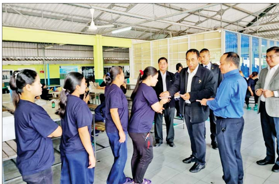
ပြည်ထောင်စုဝန်ကြီး ဦးမြင့်နောင် ထိုင်းနိုင်ငံ ဆူရတ်ဌာနမြို့ရှိ Asian Seafoods စက်ရုံတွင် မြန်မာလုပ်သားများကို တွေ့ဆုံအားပေးစဉ်။

နေပြည်တော် ဒီဇင်ဘာ ၇ အလုပ်သမားရေးရာ ကိစ္စရပ်များ ပူးပေါင်းဆောင်ရွက်နိုင်ရေး မြန်မာ-ထိုင်း နှစ်နိုင်ငံ အလုပ်သမားဝန်ကြီးများ တွေ့ဆုံဆွေးနွေးမှု ပြုလုပ်ရန် ထိုင်းနိုင်ငံသို့ ရောက်ရှိနေသည့် အလုပ်သမားဝန်ကြီးဌာန ပြည်ထောင်စုဝန်ကြီး ဦးမြင့်နောင် ဦးဆောင်သော မြန်မာကိုယ်စားလှယ်အဖွဲ့သည် ထိုင်းနိုင်ငံဆိုင်ရာ မြန်မာသံအမတ်ကြီး ဦးချစ်ဆွေနှင့်အတူ ယနေ့တွင် မြန်မာအလုပ်သမားများ အများဆုံးနေထိုင် အလုပ်လုပ်ကိုင်လျက်ရှိသည့် စက်ရုံ၊ အလုပ်ရုံများသို့ သွားရောက်တွေ့ဆုံအားပေးပြီး မည်သူမည်ဝါ ဖြစ်ကြောင်း သက်သေခံလက်မှတ် (Certificate of Identity- CI) ထုတ်ပေးရေးစခန်း ဖွင့်လှစ်မည့်နေရာများသို့ သွားရောက်ကြည့်ရှုသည်။