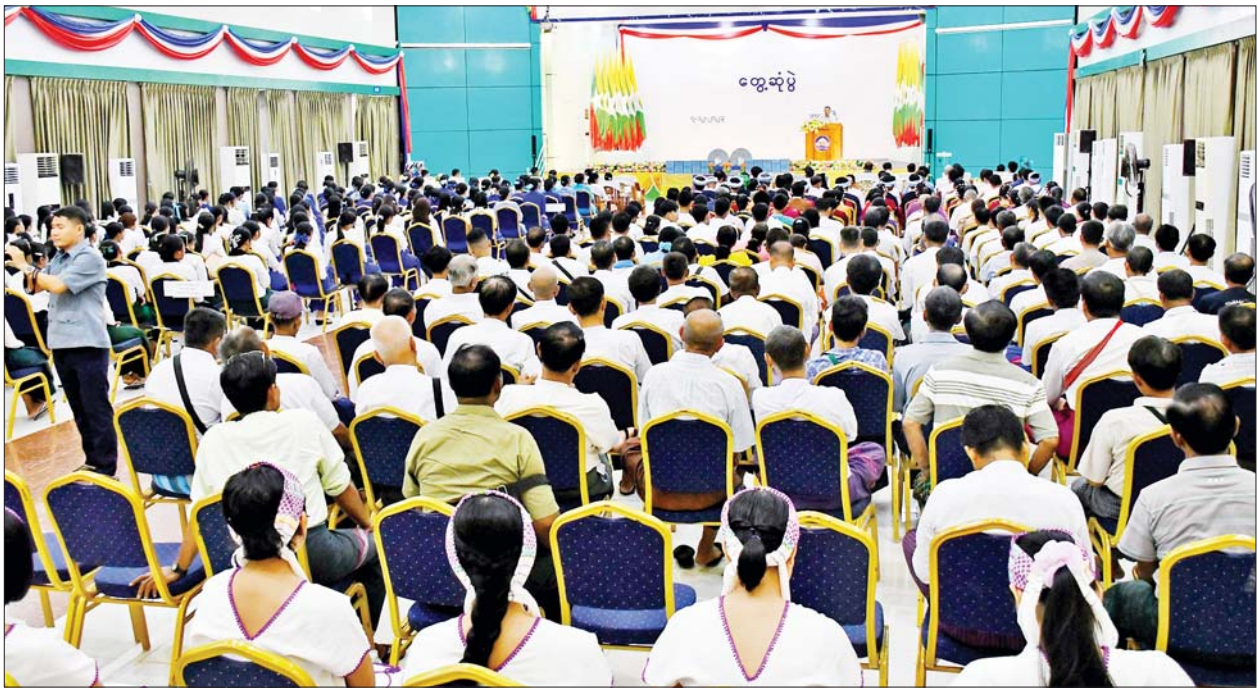
ပြည်ထောင်စုဝန်ကြီး ဦးမောင်မောင်အုန်း ဘားအံမြို့ ဇွဲကပင်ခန်းမ၌ ဘားအံတက္ကသိုလ်နှင့် ပညာရေးဒီဂရီကောလိပ်တို့မှ ဆရာ ဆရာမများ၊ ကျောင်းသား ကျောင်းသူများနှင့် တွေ့ဆုံအမှာစကားပြောကြားစဉ်။

လွှဲမှားအောင်ဆောင်ရွက်နေကြပါ ကြောင်း၊ တစ်နည်းအားဖြင့် နိုင်ငံတော်အစိုးရ၏ လုပ်ဆောင် ချက်များကို သတင်းတုသတင်း မှားများ လွှဲထုတ်ကာ ပြည်သူ များ အထင်အမြင်လွှဲမှားအောင် နည်းမျိုးစုံဖြင့် ဆောင်ရွက်နေ သည်ဟု ပြောလိုပါကြောင်း၊ အဆိုပါ လူမှုကွန်ရက်မီဒီယာများ ပေါ်မှ လွှဲထုတ်ဖော်ပြချက်များကို အမှန်/အမှား ခွဲခြားဝေဖန်ပိုင်းခြား ကာ ရှုမြင်သုံးသပ်နေကြရန် လိုအပ် ပါကြောင်း။