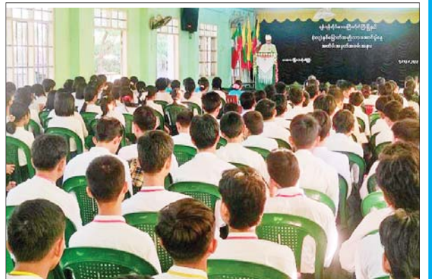
အဖွဲ့ ဥက္ကဋ္ဌနှင့် ဌာနဆိုင်ရာ တာဝန်ရှိသူများက ဆုများ ချီးမြှင့်ကြသည်။ ဉာဏ်ဟိန်း

ရန်ကုန်တိုင်းဒေသကြီး တိုက်ကြီးမြို့နယ်တွင် (၁၀၃)နှစ်မြောက် အမျိုးသားအောင်ပွဲနေ့ အခမ်းအနားကို ဒီဇင်ဘာ ၇ ရက်နံနက် ၇ နာရီက အခြေခံပညာအထက်တန်းကျောင်း (မြို့မ) ပညာရတနာခန်းမ၌ ကျင်းပသည်။ အခမ်းအနားတွင် ပြည်ထောင်စုသမ္မတမြန်မာနိုင်ငံတော် နိုင်ငံတော်စီမံအုပ်ချုပ်ရေးကောင်စီဥက္ကဋ္ဌ နိုင်ငံတော်ဝန်ကြီးချုပ် ဗိုလ်ချုပ်မှူးကြီး သတိုးမဟာသရေစည်သူ သတိုးသီရိသုဓမ္မ မင်းအောင်လှိုင်ထံမှ (၁၀၃)နှစ်မြောက် အမျိုးသားအောင်ပွဲနေ့ သဝဏ်လွှာကို မြို့နယ်စီမံအုပ်ချုပ်ရေးအဖွဲ့ဥက္ကဋ္ဌ ဦးအောင်ကျော်စိုးက ဖတ်ကြားပြီး အမျိုးသား အောင်ပွဲနေ့ အထိမ်းအမှတ် စာစီစာကုံး၊ ကဗျာနှင့် ပန်းချီပြိုင်ပွဲတွင် အထက်တန်း၊ အလယ်တန်း၊ မူလတန်းအဆင့် ပထမ၊ ဒုတိယ၊ တတိယ ဆုရရှိသူများအား မြို့နယ် စီမံအုပ်ချုပ်ရေး