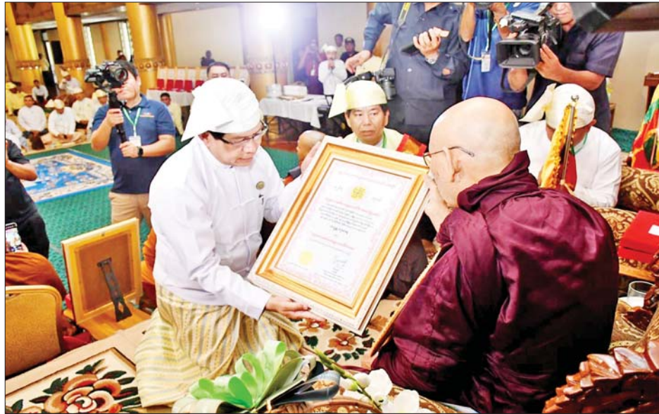
ထို့နောက် ဗုဒ္ဓဘာသာကလျာဏယုဝအသင်း ကြီး၏ ရာသက်ပန်နာယက နိုင်ငံတော်စီမံအုပ်ချုပ် ရေးကောင်စီဥက္ကဋ္ဌ နိုင်ငံတော်ဝန်ကြီးချုပ် ဗိုလ်ချုပ် မျိုးကြီး သတိုးမဟာသရေစည်သူ သတိုးသီရိသုဓမ္မ မင်းအောင်လှိုင်ထံမှ ပေးပို့သော သဝဏ်လွှာကို ဗုဒ္ဓဘာသာကလျာဏယုဝအသင်းကြီး၏ နာယက

ဦးစွာ အခမ်းအနားကို နမောတဿ သုံးကြိမ် ရွတ်ဆို၍ အောင်မောင်း(၉)ချက်တီးကာ ဖွင့်လှစ် သည်။