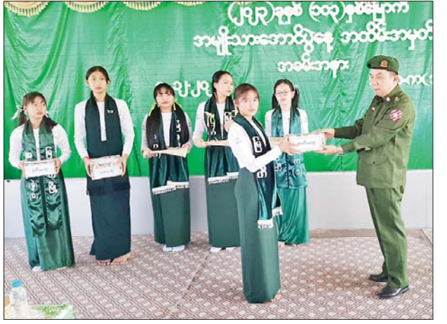
မိုင်းရှူး၌ အမျိုးသားအောင်ပွဲနေ့ အခမ်းအနား ကျင်းပ မိုင်းရှူး ဒီဇင်ဘာ ၇ (၁၀၃)နှစ်မြောက် အမျိုးသားအောင်ပွဲနေ့ အခမ်းအနားကို ယနေ့နံနက် ၉ နာရီက မိုင်းရှူးမြို့ အခြေခံပညာအထက်တန်းကျောင်း ခရေဆောင်ခန်းမ၌ ကျင်းပသည်။ ပေးအပ်ချီးမြှင့် အခမ်းအနားတွင် ပြည်ထောင်စုသမ္မတမြန်မာနိုင်ငံတော် နိုင်ငံတော်စီမံအုပ်ချုပ်ရေးကောင်စီ ဥက္ကဋ္ဌ နိုင်ငံတော်ဝန်ကြီးချုပ် ဗိုလ်ချုပ်မှူးကြီး သတိုးမဟာသရေစည်သူ သတိုးသီရိသုဓမ္မ မင်းအောင်လှိုင်ထံမှ (၁၀၃)နှစ်မြောက် အမျိုးသားအောင်ပွဲနေ့ အခမ်းအနားသို့ ပေးပို့သည့် သဝဏ်လွှာကို မိုင်းရှူးခရိုင် ပညာရေးမှူး ဦးအေးဝင်းက ဖတ်ကြားပြီး အမျိုးသားအောင်ပွဲနေ့ အထိမ်းအမှတ် အခြေခံပညာအထက်တန်း၊ အလယ်တန်း၊ မူလတန်းအဆင့် စာစီစာကုံး၊ ကဗျာနှင့် ပန်းချီပြိုင်ပွဲများတွင် ဆုရကျောင်းသား ကျောင်းသူများအား တာဝန်ရှိသူများက ဂုဏ်ပြုဆုများ ပေးအပ်ချီးမြှင့်ခဲ့ကြောင်း သိရသည်။ မြို့နယ်(ပြန်/ဆက်)

မြဝတီ ဒီဇင်ဘာ ၇ ကရင်ပြည်နယ် မြဝတီမြို့၌ (၁၀၃)နှစ်မြောက် အမျိုးသားအောင်ပွဲနေ့ အထိမ်းအမှတ် အခမ်းအနားနှင့် ဆုချီးမြှင့်ပွဲကို ယနေ့နံနက် ဇွန်ရာသီတွင် အမှတ်(၁) အခြေခံပညာအထက်တန်းကျောင်း ခန်းမဆောင်၌ ကျင်းပသည်။ ဆုများချီးမြှင့် အခမ်းအနားတွင် ပြည်ထောင်စုသမ္မတမြန်မာနိုင်ငံတော် နိုင်ငံတော်စီမံအုပ်ချုပ်ရေးကောင်စီဥက္ကဋ္ဌ နိုင်ငံတော်ဝန်ကြီးချုပ် ဗိုလ်ချုပ်မှူးကြီး သတိုးမဟာသရေစည်သူ သတိုးသီရိသုဓမ္မ မင်းအောင်လှိုင်ထံမှ (၁၀၃)နှစ်မြောက် အမျိုးသားအောင်ပွဲနေ့အခမ်းအနားသို့ ပေးပို့သည့် သဝဏ်လွှာကို ခရိုင်စီမံအုပ်ချုပ်ရေးအဖွဲ့ အဖွဲ့ဝင် (၁) ဒုတိယဗိုလ်မှူးကြီး နိုင်ဝင်းက ဖတ်ကြားပြီး အထက်တန်းအဆင့်နှင့် အလယ်တန်းအဆင့် (စာစီစာကုံး၊ ကဗျာ) ပြိုင်ပွဲများတွင် ဆုရရှိသူများအား တာဝန်ရှိသူများက ဆုများ ချီးမြှင့်ပေးအပ်ခဲ့ကြောင်း သိရသည်။ ဇာဖြူဝင်း(ပြန်/ဆက်)