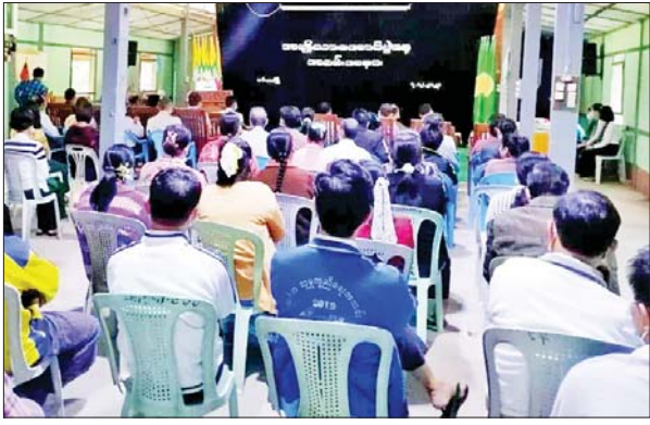
ယင်းမာပင်

စစ်ကိုင်းတိုင်းဒေသကြီး ယင်းမာပင်မြို့၌ (၁၀၃) နှစ်မြောက် အမျိုးသားအောင်ပွဲနေ့အခမ်းအနားကို ဒီဇင်ဘာ ၇ ရက် နံနက် ၇ နာရီက မြို့နယ်အထွေထွေအုပ်ချုပ်ရေးဦးစီးဌာန သာယာအေး ခန်းမ၌ ကျင်းပသည်။