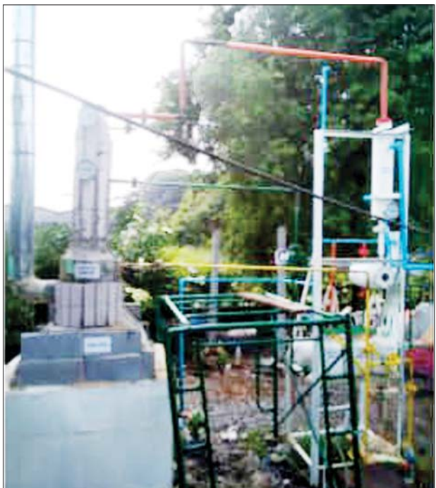
စွန့်ပစ်ပလတ်စတစ်မှ လောင်စာဆီထုတ်လုပ်သည့်စက်ကို တွေ့ရ စဉ်။

“သူ့လုပ်ငန်းစဉ်က နည်းပညာ အရ ပြောမယ်ဆို လောင်စာ ဓာတ်ငွေ့ကို နည်းပညာအရ ပြောင်းထားတာ။ ကျွန်တော်တို့ သုံးမယ့်နည်းပညာက အင်ဂျင်နီယာ နည်းပညာနဲ့ ပြောင်းလဲပြီး လောင်စာဆီအဖြစ် ပြန်ထုတ်တာ မျိုးပါ။ ကျွန်တော်တို့သုံးနိုင်မယ့်