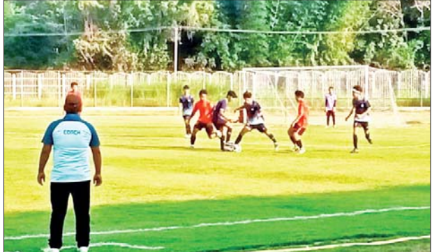
ဘာသာရပ်ဌာနအသီးသီးမှ ပြိုင်ပွဲဝင် ၁၁ သင်း ဝင်ရောက်ယှဉ်ပြိုင်ကြ မည်ဖြစ်ကာ ဗိုလ်လုပွဲကို ဒီဇင်ဘာ ၁၇ ရက်တွင်ကျင်းပ၍ ဆုများ ပေးအပ်ချီးမြှင့်သွားမည်ဖြစ်ကြောင်း သိရသည်။ ခရိုင်(ပြန်/ဆက်)

အားကစားပြိုင်ပွဲကို ပုသိမ်တက္ကသိုလ်ပါမောက္ခချုပ် ဒေါက်တာ သန်းထွန်းက အမှာစကားပြောကြား၍ဖွင့်လှစ်ပေးပြီး ဘော်လီဘော ပြိုင်ပွဲတွင် ပြိုင်ပွဲဝင်အမျိုးသားအသင်း ခုနစ်သင်း၊ အမျိုးသမီးအသင်း ငါးသင်း ဝင်ရောက်ယှဉ်ပြိုင်ကြမည်ဖြစ်ပြီး ဘောလုံးပြိုင်ပွဲတွင်