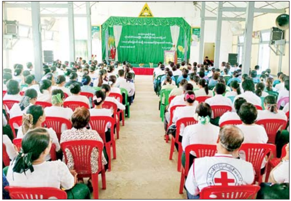
ထန်းတပင်(ရန်ကုန်)

ရန်ကုန်တိုင်းဒေသကြီး ထန်းတပင်မြို့နယ်တွင် (၁၀၃)နှစ်မြောက် အမျိုးသားအောင်ပွဲနေ့ အထိမ်းအမှတ် အခမ်းအနားကို ဒီဇင်ဘာ ၇ ရက် နံနက်ပိုင်းက အထက(ထန်းတပင်) အခြေခံပညာအထက်တန်း ကျောင်း လှိုင်ရတနာခန်းမ၌ ကျင်းပသည်။