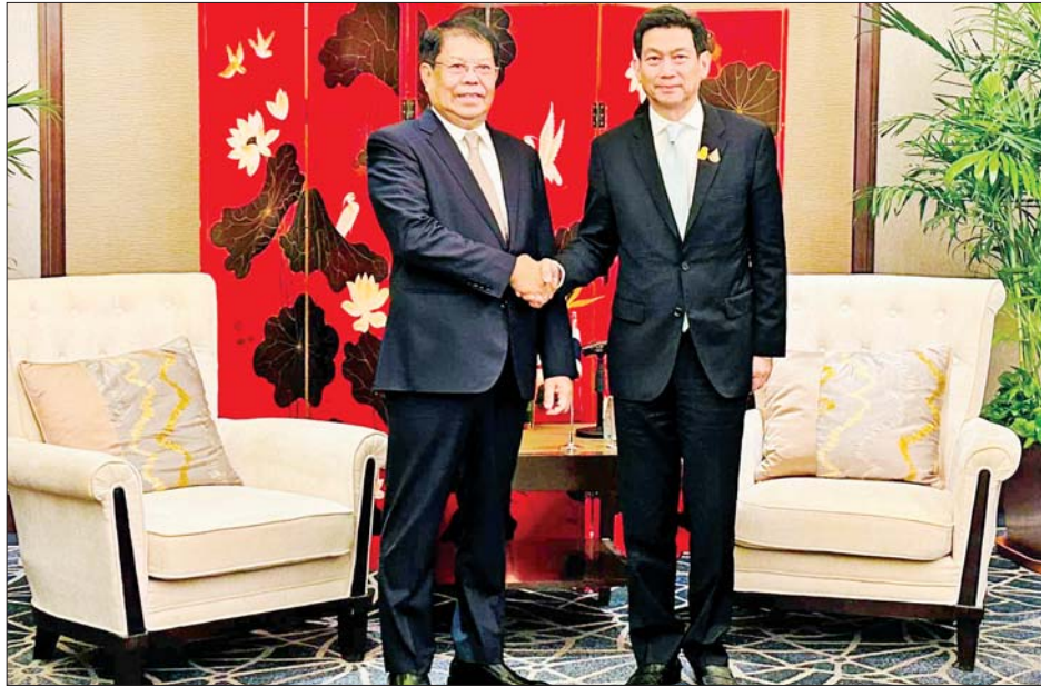
ဒုတိယဝန်ကြီးချုပ်နှင့် နိုင်ငံခြားရေးဝန်ကြီးဌာန ပြည်ထောင်စုဝန်ကြီး ဦးသန်းဆွေနှင့် ထိုင်းနိုင်ငံ ဒုတိယ ဝန်ကြီးချုပ်နှင့် နိုင်ငံခြားရေးဝန်ကြီး မစ္စတာ ပန်ပရီ ဘာဟီဒါ နူကာရာတို့ ရင်းရင်းနှီးနှီး တွေ့ဆုံနှုတ်ဆက်စဉ်။

နေပြည်တော် ဒီဇင်ဘာ ၇ တရုတ်ပြည်သူ့သမ္မတနိုင်ငံ ပေကျင်းမြို့၌ ကျင်းပသည့် (၈) ကြိမ်မြောက် မဲခေါင်-လန်ချန်း ပူးပေါင်းဆောင်ရွက်မှု နိုင်ငံခြားရေးဝန်ကြီးများ အစည်းအဝေးကာလအတွင်း သီးခြားဆွေးနွေးပွဲ အဖြစ် ဒုတိယဝန်ကြီးချုပ်နှင့် နိုင်ငံခြားရေးဝန်ကြီး ဌာန ပြည်ထောင်စုဝန်ကြီး ဦးသန်းဆွေနှင့် ကမ္ဘောဒီးယားနိုင်ငံ ဒုတိယဝန်ကြီးချုပ်၊ နိုင်ငံခြားရေးနှင့် အပြည်ပြည်ဆိုင်ရာ ပူးပေါင်းဆောင်ရွက်ရေးဝန်ကြီး ဌာန ဝန်ကြီး မစ္စတာ ဆုပ်ဂျန်ဒါ ဆိုဖီအာ တို့သည် ယနေ့နံနက် ၉ နာရီတွင် ကျောက်ယွဲတိုင် နိုင်ငံတော် ဧည့်ဂေဟာ၌ တွေ့ဆုံဆွေးနွေးကြသည်။