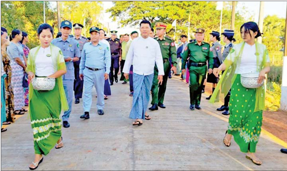
အား ဖဲကြီးဖြတ်ဖွင့်လှစ်ကြသည်။ ရှင်းလင်းပြသ ထို့နောက် ကွန်ကရစ်လမ်းသစ်အား ဧရာဝတီတိုင်းဒေသကြီး ဝန်ကြီးချုပ်နှင့် အစိုးရအဖွဲ့ဝင် ဝန်ကြီးများ၊ ဧည့်သည်တော်များက ကွန်ကရစ်လမ်းသစ်အား လှည့်လည်ကြည့်ရှုကြရာ တာဝန်ရှိသူများက လိုက်လံရှင်းလင်းပြသကြသည်။ အဆိုပါ ဘဲဂရက်ကွန်ကရစ်လမ်းသစ်သည် အလျားပေ ၃၀၀၊ အနံ ၁၄ ပေ၊ ဒုဂျစ်လက်မရှိပြီး မြို့နယ်စည်ပင်သာယာရေးအဖွဲ့၏ ၂၀၂၃-၂၀၂၄ ဘဏ္ဍာနှစ် ငွေလုံးငွေရင်း ရန်ပုံငွေကျပ် ၂၂ ဒသမ ၀၅ သန်းဖြင့် ဆောင်ရွက်ပြီးစီးခဲ့ကြောင်း သိရသည်။ မြို့နယ် (ပြန်/ဆက်)