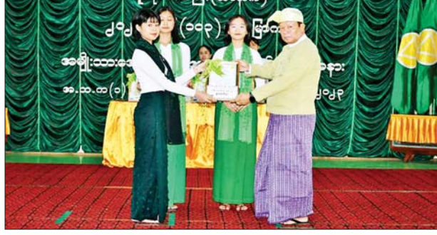
မနက်ဖြန်နံနက်အထိ ခန့်မှန်းချက် နေပြည်တော် ဒီဇင်ဘာ ၇ စစ်ကိုင်းတိုင်းဒေသကြီးအထက်ပိုင်း၊ ကချင်ပြည်နယ်နှင့် ချင်းပြည်နယ်တို့တွင် နေရာအနှံ့အပြား၊ တနင်္သာရီတိုင်းဒေသကြီးနှင့် ရှမ်းပြည်နယ်(တောင်ပိုင်း)တို့တွင် နေရာစိပ်စိပ်၊ စစ်ကိုင်းတိုင်းဒေသကြီး အောက်ပိုင်း၊ မန္တလေးတိုင်းဒေသကြီး၊ ရန်ကုန်တိုင်းဒေသကြီးနှင့် ရှမ်းပြည်နယ်(မြောက်ပိုင်း)နှင့် အရှေ့ပိုင်း)တို့တွင် နေရာကျကျနှင့် ကျန်တိုင်းဒေသကြီးနှင့် ပြည်နယ်တို့တွင် နေရာကွက်ကွား မိုးထစ်ချွန်းရွာမည်။ ရွာရန်ရာနှုန်း ၈၀ ဖြစ်သည်။ မိုး/လေ

ပြည် ဒီဇင်ဘာ ၇ ပဲခူးတိုင်းဒေသကြီး ပြည်မြို့တွင် (၁၀၃)နှစ်မြောက် အမျိုးသားအောင်ပွဲနေ့အထိမ်းအမှတ် တိုင်းဒေသကြီးအဆင့်အခမ်းအနားကို