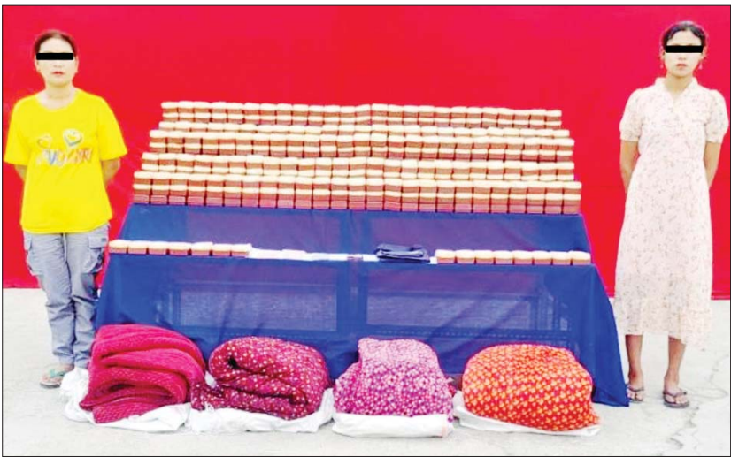
မစက်ညွန့်(ခ)မိချောနှင့် မစုစုမာတို့ကို သိမ်းဆည်းရမိသည့် ဘိန်းဖြူများနှင့်အတူ တွေ့ရစဉ်။

သိမ်းဆည်းရမိ မူးယစ်ဆေးဝါး တားဆီးနှိမ်နင်းရေးရဲတပ်ဖွဲ့မှ တပ်ဖွဲ့ဝင်များပါဝင်သော ပူးပေါင်းအဖွဲ့သည် ဒီဇင်ဘာ ၆ ရက် နံနက် ၈ နာရီ ၄၅ မိနစ်တွင် မိုးညှင်းမြို့နယ် ပင်လုံကျေးရွာအုပ်စု နန်းစီးအောင် ကျေးရွာအနီးတွင် Express ခရီးသည်တင်ယာဉ်ကို ရပ်တန့်စစ်ဆေးရာမှ ရာမယွန်းဝါ(ခ) မဝီထံမှ ဘိန်းဖြူ ၃ ဒဿမ ၃ ကီလိုကိုလည်းကောင်း၊ အလားတူ ယင်းနေ့ နံနက် ၈ နာရီတွင် မူးယစ်ဆေးဝါးတားဆီးနှိမ်နင်းရေးရဲတပ်ဖွဲ့မှ တပ်ဖွဲ့ဝင်များပါဝင်သော ပူးပေါင်းအဖွဲ့သည် ပုသိမ်ကြီးမြို့နယ် ကြာနီကန်ကျေးရွာအနီးတွင် Nissan AD VAN ခရီးသည်တင်ယာဉ်ကို ရပ်တန့် စစ်ဆေးရာမှ ရာမယွန်းဝါ(ခ) မဝီထံမှ ဘိန်းဖြူ ၄ ဒဿမ ၄ ကီလို ကိုလည်းကောင်း၊ ထို့အတူ ဒီဇင်ဘာ ၅ ရက် မွန်းလွဲ ၁ နာရီခွဲတွင် မူးယစ်ဆေးဝါးတားဆီးနှိမ်နင်းရေးရဲတပ်ဖွဲ့မှ တပ်ဖွဲ့ဝင်များပါဝင်သော ပူးပေါင်းအဖွဲ့သည်