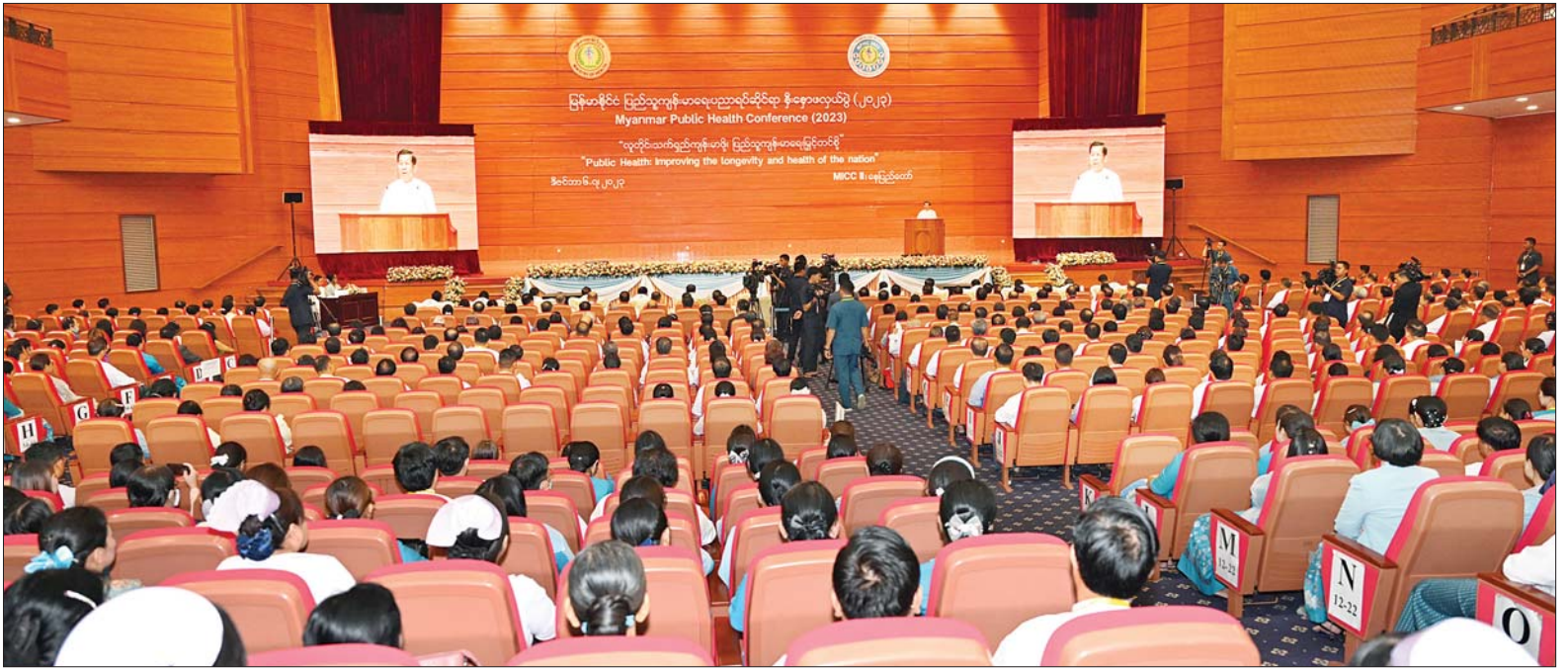
နိုင်ငံတော်စီမံအုပ်ချုပ်ရေးကောင်စီဥက္ကဋ္ဌ နိုင်ငံတော်ဝန်ကြီးချုပ် ဗိုလ်ချုပ်မှူးကြီးမင်းအောင်လှိုင် မြန်မာနိုင်ငံ ပြည်သူ့ကျန်းမာရေးပညာရပ်ဆိုင်ရာ နှီးနှောဖလှယ်ပွဲ(၂၀၂၃) ဖွင့်ပွဲအခမ်းအနားတွင် အမှာစကားပြောကြားစဉ်။

အခမ်းအနားသို့ နိုင်ငံတော်စီမံအုပ်ချုပ်ရေးကောင်စီ တွဲဖက်အတွင်းရေးမှူး ဒုတိယဗိုလ်ချုပ်ကြီး ရဲဝင်းဦး၊ ကောင်စီဝင်များ၊ ပြည်ထောင်စု ဝန်ကြီးများ၊ ပြည်ထောင်စု ရာထူးဝန်အဖွဲ့ ဥက္ကဋ္ဌ၊ နေပြည်တော်ကောင်စီ ဥက္ကဋ္ဌ၊ ကာကွယ်ရေးဦးစီးချုပ်ရုံးမှ တပ်မတော်အဆင့်မြင့်အရာရှိကြီးများ၊ ဒုတိယဝန်ကြီးများ၊ ဌာနဆိုင်ရာ အရာရှိကြီးများ၊ မြန်မာနိုင်ငံဆိုင်ရာ နိုင်ငံခြားသံရုံးများမှ သံတမန်များ၊ ကုလသမဂ္ဂလက်အောက်ခံအဖွဲ့အစည်းများမှဌာနကော်မတီအဖွဲ့ဝင်များ၊ အစိုးရမဟုတ်သော အသင်း/ အဖွဲ့များ၊ နိုင်ငံတကာနှင့် ပြည်တွင်းမှ ပြည်သူ့ကျန်းမာရေးပညာရှင်များ၊ ဆေးပညာရပ်ဆိုင်ရာပါမောက္ခချုပ်များ