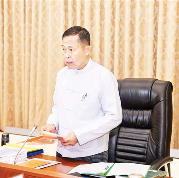
နိုင်ငံတော်စီမံအုပ်ချုပ်ရေးကောင်စီ ဒုတိယဥက္ကဋ္ဌ ဒုတိယဝန်ကြီးချုပ် ဒုတိယ ဗိုလ်ချုပ်မှူးကြီး စိုးဝင်း ၂၀၂၄ ခုနှစ်အတွက် ဂုဏ်ထူးဆောင်ဘွဲ့များ၊ ဂုဏ်ထူးဆောင်တံဆိပ်များ ချီးမြှင့်အပ်နှင်းရန် စိစစ်ရေးအဖွဲ့အစည်းအဝေးတွင် အမှာစကားပြောကြားစဉ်။