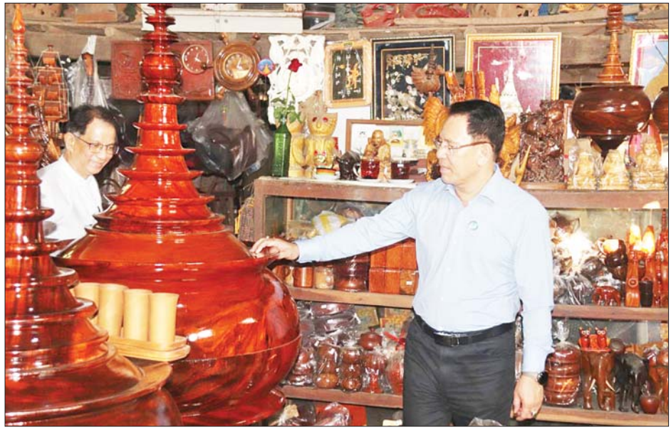
ပြည်ထောင်စုဝန်ကြီး ဦးမောင်မောင်အုန်း ချောင်းဆုံမြို့နယ် မုဒွန်းကျေးရွာရှိ အမှတ်တရပစ္စည်းလုပ်ငန်းအရောင်းဆိုင်ကို ကြည့်ရှုလေ့လာစဉ်။

ဆက်လက်၍ ပြည်ထောင်စု ဝန်ကြီးသည် ချောင်းဆုံမြို့နယ် မုဒွန်းကျေးရွာရှိ ကျောက်သင်ပုန်း နှင့် အမှတ်တရပစ္စည်းလုပ်ငန်း အရောင်းဆိုင်ကို လည်းကောင်း၊ ရွာလွတ်ကျေးရွာရှိ ဆေးတံနှင့် သစ်သားပန်းပုလုပ်ငန်း အရောင်း ဆိုင်များကို လည်းကောင်း လှည့်လည်ကြည့်ရှု လေ့လာ၍ အသေးစား၊ အငယ်စားနှင့် အလတ် စား စက်မှုလုပ်ငန်း(MSME) များ ပိုမိုဖွံ့ဖြိုးတိုးတက်စေရန် နိုင်ငံ တော်အစိုးရက ကူညီပံ့ပိုးဆောင် ရွက်နေမှု အခြေအနေများကို ရှင်းလင်း ပြောကြားခဲ့ကြောင်း သိရသည်။ သတင်းစဉ်