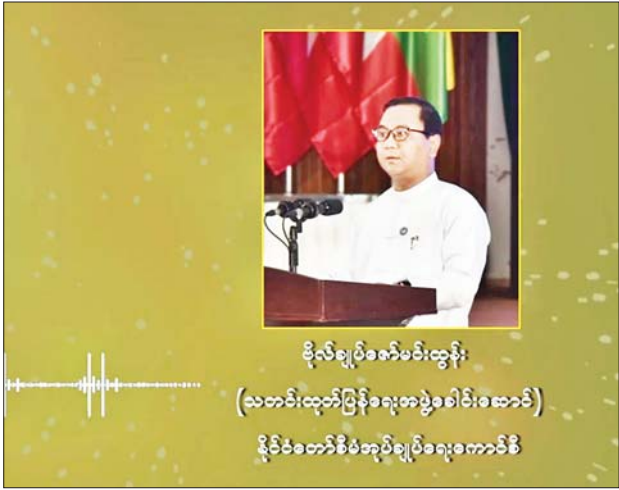
ဗိုလ်ချုပ်ဇော်မင်းထွန်း (သတင်းထုတ်ပြန်ရေးအဖွဲ့ခေါင်းဆောင်) နိုင်ငံတော်စီမံအုပ်ချုပ်ရေးကောင်စီ

မနေ့က ဗဟိုဘဏ်ကထုတ်ပြန်လိုက်တဲ့ နိုင်ငံခြားငွေ သုံးငွေရောင်းဝယ်ဖောက်ကားတဲ့လုပ်ငန်း AD လိုင်စင်ရဘဏ်များမှာ အရောင်းအဝယ် ပြုလုပ်ရာမှာ ငွေလဲလှယ်နှုန်းကို ယခင်ကလို ဗဟိုဘဏ်က သတ်မှတ်မှာမဟုတ်ဘဲနဲ့ ဈေးကွက်အတွင်းမှာ နိုင်ငံခြားငွေရောင်းချလိုသူနဲ့ ဝယ်ယူလိုသူတွေရဲ့ငွေလဲလှယ်နှုန်းအပေါ် မူတည်ပြီး Market Rate အတိုင်းဆောင်ရွက်မယ်ဆိုတဲ့ ထုတ်ပြန်ကြေညာချက်ရှိပါတယ်။ ဒီထုတ်ပြန်ကြေညာချက်နဲ့ ပတ်သက်ပြီးပဲ ဖြစ်ဖြစ်၊ ဆီကိစ္စတွေနဲ့ပတ်သက်ပြီးပဲဖြစ်ဖြစ် မီဒီယာများက မေးမြန်းလာတာ