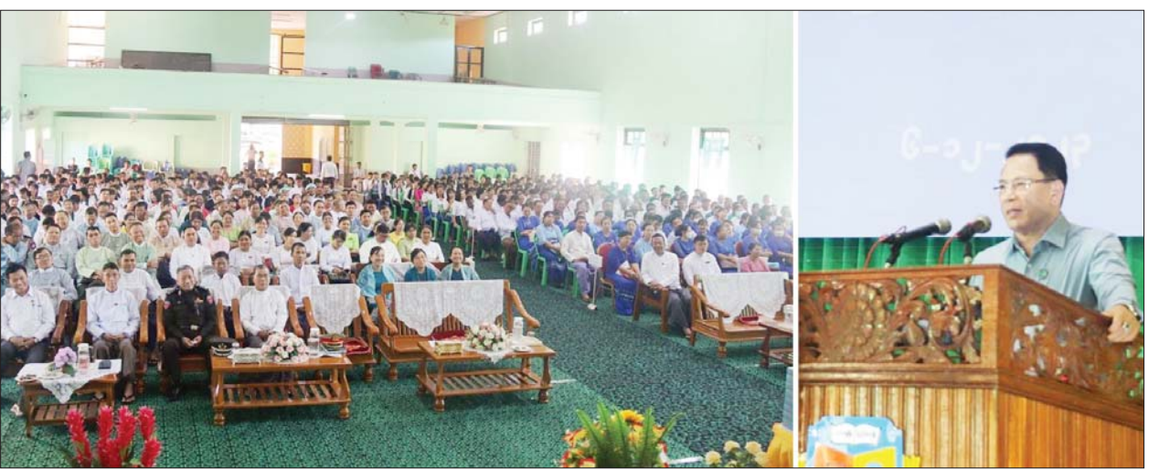
ပြည်ထောင်စုဝန်ကြီး ဦးမောင်မောင်အုန်း မော်လမြိုင် ပညာရေးဒီဂရီကောလိပ် ပညာဦးစီးဌာနခန်းမ၌ ဆရာ ဆရာမများ၊ ကျောင်းသား ကျောင်းသူများနှင့် ဌာနဆိုင်ရာတာဝန်ရှိသူများအား တွေ့ဆုံအမှာစကား ပြောကြားစဉ်။

တော်မီဒီယာ၏ အခန်းကဏ္ဍ၊ တားဆီးကာကွယ် မီဒီယာအဆိပ် သင့်မှုအန္တရာယ် စသည့် Video Clip များကို ပြသသည်။ ထို့နောက်ပြည်ထောင်စုဝန်ကြီး က အမှာစကား ပြောကြားရာတွင် ယနေ့အချိန်တွင်မသမာသူ အဖျက် သမားများက မီဒီယာလုပ်ငန်းများ ကို အသုံးချ၍ သတင်းတု၊ သတင်း မှားများ ထုတ်လွှင့်ကာ ပြည်သူ များအား အသိအမြင်လွဲမှားစေရန် သတင်းအဆိပ်ခတ် ဆောင်ရွက် နေကြပါကြောင်း၊ မိမိတို့နိုင်ငံ၌ ၁၉၈၈ ခုနှစ်တွင် မင်းမဲ့စရိုက်ဆန် သည့် လုပ်ဆောင်ခဲ့မှုများကြောင့် မြန်မာနိုင်ငံနှင့် နိုင်ငံသားများ၏ ဂုဏ်သိက္ခာကျဆင်းကာ ကမ္ဘာ တွင် အရှက်ရစေခဲ့ပါကြောင်း၊ ယခုအခါ အကြမ်းဖက်သမားများ