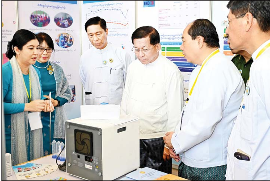
နိုင်ငံတော်စီမံအုပ်ချုပ်ရေးကောင်စီဥက္ကဋ္ဌ နိုင်ငံတော်ဝန်ကြီးချုပ် ဗိုလ်ချုပ်မှူးကြီးမင်းအောင်လှိုင် မြန်မာနိုင်ငံ ပြည်သူ့ကျန်းမာရေးပညာရပ်ဆိုင်ရာ နှီးနှောဖလှယ်ပွဲ(၂၀၂၃) ဖွင့်ပွဲအခမ်းအနားတွင် ခင်းကျင်းပြသထားသည့် ပြခန်းများကို လှည့်လည်ကြည့်ရှုစဉ်။

နှင့် ပါမောက္ခများ၊ ကျန်းမာရေး ဝန်ထမ်းများနှင့် အထူးဖိတ်ကြားထားသည့် ဧည့်သည်တော်များ တက်ရောက်ကြသည်။ ဖဲကြိုးဖြတ်ဖွင့်လှစ် ဦးစွာ နိုင်ငံတော်စီမံအုပ်ချုပ်ရေးကောင်စီဥက္ကဋ္ဌ နိုင်ငံတော်ဝန်ကြီးချုပ်က မြန်မာနိုင်ငံ ပြည်သူ့ကျန်းမာရေး ပညာရပ်ဆိုင်ရာ နှီးနှောဖလှယ်ပွဲ(၂၀၂၃) ဖွင့်ပွဲအထိမ်းအမှတ်မုခ်ဦးကို ဖဲကြိုးဖြတ် ဖွင့်လှစ်ပေးသည်။ ထို့နောက် မြန်မာနိုင်ငံပြည်သူ့ကျန်းမာရေး ပညာရပ်ဆိုင်ရာ နှီးနှောဖလှယ်ပွဲ (၂၀၂၃) ဖွင့်ပွဲဒုတိယပိုင်းကို Plenary Hall ၌ ဆက်လက်ကျင်းပရာ နိုင်ငံတော်စီမံအုပ်ချုပ်ရေးကောင်စီ ဥက္ကဋ္ဌ နိုင်ငံတော်ဝန်ကြီးချုပ်က အမှာစကားပြောကြားရာတွင် ယနေ့ကျင်းပသည့် မြန်မာနိုင်ငံ “ပြည်သူ့ကျန်းမာရေး ပညာရပ်ဆိုင်ရာ နှီးနှောဖလှယ်ပွဲ(၂၀၂၃)”ကို နိုင်ငံတကာနှင့် ပြည်တွင်း၌ဆောင်ရွက်နေကြသည့် ပြည်သူ့ကျန်းမာရေးစောင့်ရှောက်မှု အတွေ့အကြုံများကို ဖလှယ်ရန်၊ နိုင်ငံတကာနှင့် ပြည်တွင်း ပြည်သူ့ကျန်းမာရေး