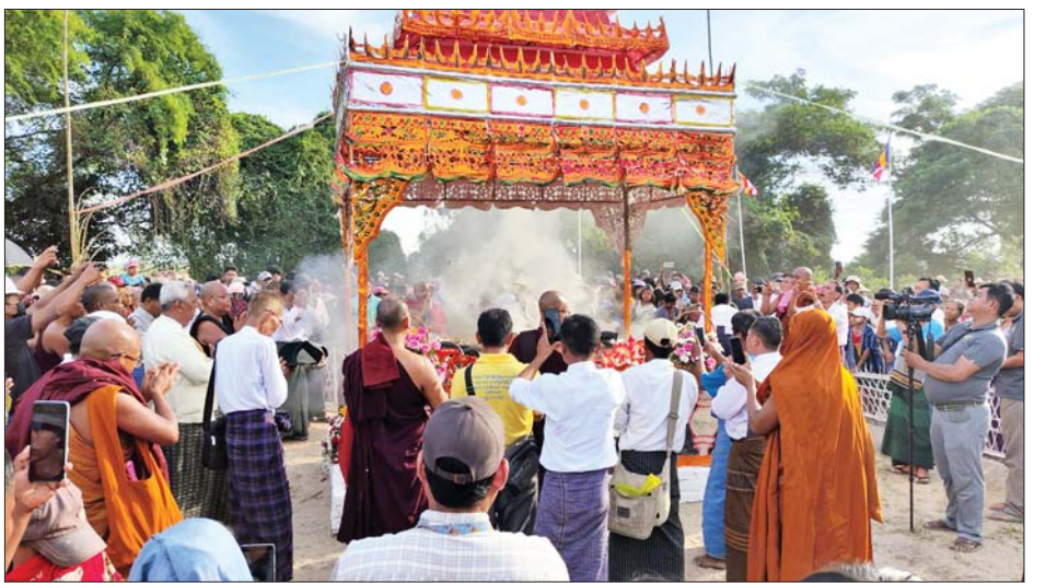
အတိုင်း ပင့်ဆောင်သယ်ယူခဲ့ကြပြီး အနိစ္စဝတ အဂ္ဂိဈာပနအစီအစဉ် ပြီးဆုံးခဲ့ကြောင်း သိရသည်။ သင်္ခါရာစသော ဂါထာတော် သုံးကြိမ်ရွတ်ဆို၍ လပြည့်လင်း(ပြန်/ဆက်)

ထို့နောက် သံဃာတော်အရှင်သူမြတ်များနှင့် တာဝန်ရှိသူများက ဆရာတော်ကြီး၏ ရုပ်ကလာပ် တော်အား မီးပူဇော်ရန်အတွက် အဆိုပါကျောင်း တိုက်မှတစ်ဆင့် လောင်တိုက်အတွင်းသို့ အစီအစဉ်