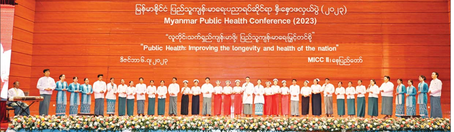
ပြည်သူ့ကျန်းမာရေးဦးစီးဌာနမှ အရာထမ်း၊ အမှုထမ်းများက “မြှင့်တင်အားပေး ပြည်သူ့ကျန်းမာရေး” ဂုဏ်ပြုတေးသီချင်းဖြင့် သီဆိုဖျော်ဖြေကြစဉ်။

ရေးကဏ္ဍကို အထူးအလေးပေးဆောင်ရွက်နိုင်ခဲ့ခြင်းကြောင့် ၁၉၉၀ ပြည့်နှစ်တွင် ရှိခဲ့သည့် မိခင်သေဆုံးမှုနှုန်းကို ၂၀၂၀ ပြည့်နှစ်တွင် ၆၀ ရာခိုင်နှုန်းအထိ ကျဆင်းခဲ့ပြီး အသက်ငါးနှစ်အောက်ကလေးသေဆုံးမှုနှုန်းသည် ၂၀၀၀ ပြည့်နှစ်နှင့် နှိုင်းယှဉ်ပါက ၂၀၂၁ ခုနှစ်တွင် ၅၃ ဒသမ ၂ ရာခိုင်နှုန်းအထိ ကျဆင်းခဲ့သည်ဟု သိရပါကြောင်း။ မွေးကင်းစကလေးသေဆုံးမှုနှုန်းသည်လည်း ၂၀၀၀ ပြည့်နှစ်နှင့် နှိုင်းယှဉ်ပါက ၂၀၂၁ ခုနှစ်တွင် ၄၂ ဒသမ ၁ ရာခိုင်နှုန်းကျဆင်းခဲ့ပြီး တီဘီရောဂါဖြစ်ပွားမှုအနေဖြင့် ၂၀၂၀ ပြည့်နှစ်တွင် ၂၀၁၅ ခုနှစ် ရောဂါဖြစ်ပွားနှုန်း၏ ၂၀ ရာခိုင်နှုန်းအထိ လျော့ချနိုင်ခဲ့သည့်အတွက် အရှေ့တောင်အာရှတွင် မြန်မာနိုင်ငံသည် တီဘီရောဂါအဆုံးသတ်နိုင်ရေး မှတ်တိုင်(End TB milestone)ကို အောင်မြင်စွာ ဆောင်ရွက်နိုင်ခဲ့သည့် တစ်ခုတည်းသော နိုင်ငံဖြစ်သည်ဟု သိရှိရပါကြောင်း။ ထို့အပြင် HIV/AIDS နှင့် ငှက်ဖျားရောဂါများဖြစ်ပွားမှု၊ သေဆုံးမှုကိုလည်း သိသိသာသာလျော့ချနိုင်ခဲ့သည်ကို သိရှိရပါကြောင်း။ ယခုကဲ့သို့ ပြည်သူ့ကျန်းမာရေးကဏ္ဍတွင် ရရှိခဲ့သည့် အောင်မြင်မှုများကို မိမိအနေဖြင့် အထူးပင်အသိအမှတ်ပြုပါကြောင်းနှင့် ပြည်သူများ စာမျက်နှာ ၅ သို့ ☺