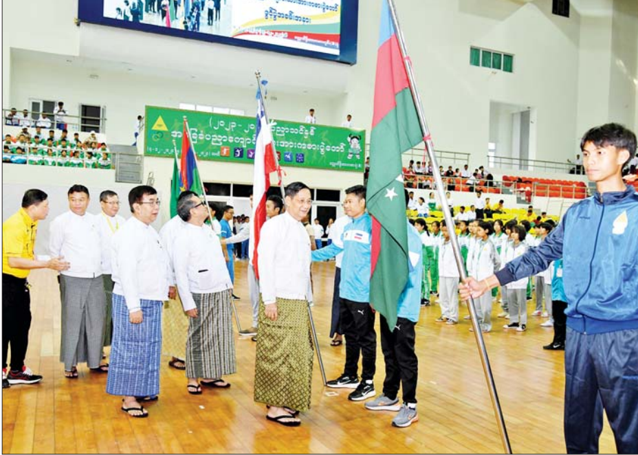
နိုင်ငံတော်စီမံအုပ်ချုပ်ရေးကောင်စီအဖွဲ့ဝင်များနှင့် ပြည်ထောင်စုဝန်ကြီးများ တိုင်းဒေသကြီးနှင့် ပြည်နယ် ပြိုင်ပွဲဝင်အသင်းများမှ အသင်းအုပ်ချုပ်သူ/နည်းပြများနှင့် အားကစားသမားများကို ရင်းရင်းနှီးနှီး နှုတ်ဆက်စဉ်။

ကြည့်ရှုအားပေး ဆက်လက်၍ အခမ်းအနားသို့ တက်ရောက်လာကြသူများက အခြေခံပညာ အထက်တန်း ကျောင်းများမှ ကျောင်းသား ကျောင်းသူများနှင့် မြန်မာနိုင်ငံ ကျွမ်းဘားအဖွဲ့ချုပ်တို့မှ အားကစား သမားများက အေရီးဗစ်အက၊ စုပေါင်း ကိုယ်လက်ကြံ့ခိုင်ရေး အစီအစဉ် အတွဲ (၃/၄)၊ Physical Fitness Dance နှင့် ကျွမ်းဘား အားကစား သရုပ်ပြသမှုတို့ကို ကြည့်ရှုအားပေးကြသည်။