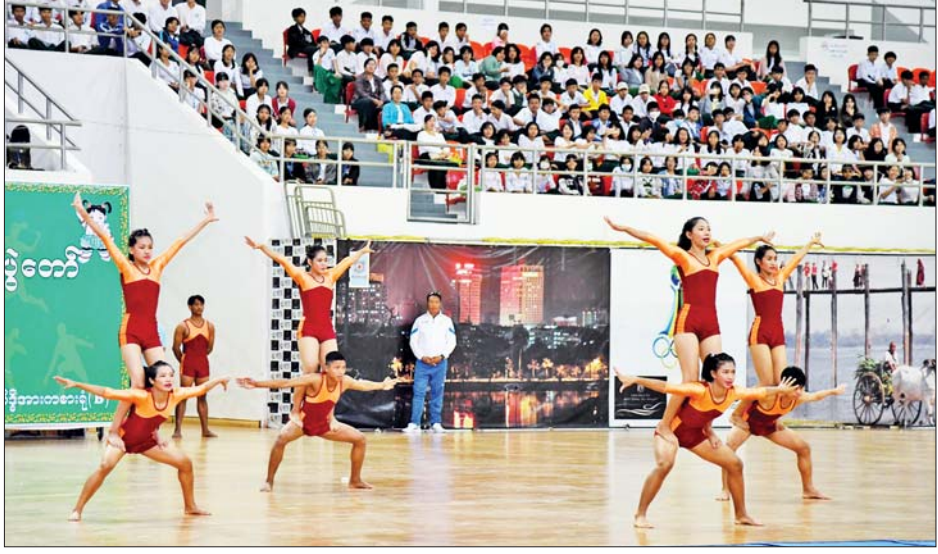
အခြေခံပညာအထက်တန်းကျောင်းများမှ ကျောင်းသား ကျောင်းသူများနှင့် မြန်မာနိုင်ငံကျွမ်းဘားအဖွဲ့ချုပ်တို့မှ အားကစားသမားများက အေရီးဗစ်အက၊ စုပေါင်းကိုယ်လက်ကြံ့ခိုင်ရေးအစီအစဉ် အတွဲ (၃/၄)၊ Physical Fitness Dance နှင့် ကျွမ်းဘားအားကစား သရုပ်ပြသစဉ်။