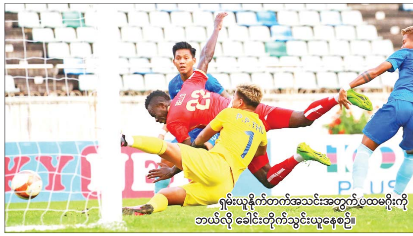
ရှမ်းယူနိုက်တက်အသင်းအတွက် ပထမဂိုးကို ဘယ်လို ခေါင်းတိုက်သွင်းယူနေစဉ်။

ရန်ကုန် ဒီဇင်ဘာ ၄ ၂၀၂၃ MNL အမှတ်ပေးပြိုင်ပွဲ ပွဲစဉ်(၂၁) နောက်ဆုံးနေ့ကို ဒီဇင်ဘာ ၄ ရက်က ဆက်လက် ကျင်းပရာ လက်ရှိချန်ပီယံ ရှမ်းယူနိုက်တက် အသင်း နိုင်ပွဲရယူပြီး ချန်ပီယံဆုကာကွယ်နိုင် ရန် လက်တစ်ကမ်းအကွာ ရောက်ရှိလာသည်။ သုဝဏ္ဏကွင်း၌ ကျင်းပသည့်ပွဲတွင် ရှမ်းယူနိုက်တက်အသင်းက ရတနာပုံအသင်း ကို လေးဂိုး-နှစ်ဂိုးဖြင့် အနိုင်ရခဲ့သည်။ ရှမ်းယူနိုက်တက်အသင်းသည် ယခုပွဲအနိုင်ရခဲ့ သဖြင့် ချန်ပီယံဆုနှင့် အနီးစပ်ဆုံးအနေအထား စာမျက်နှာ ၂၂ ကော်လံ ၁ သို့ ○