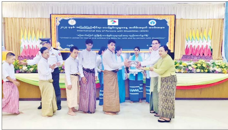
ပါဝင် ဆောင်ရွက်ပေးကြစေလိုကြောင်း ပြောကြားသည့်။ ထို့နောက် တိုင်းဒေသကြီး ဝန်ကြီးချုပ်က မသန်စွမ်းသူများ တည်းခိုနိုင်ရေး ဝန်ဆောင်မှု ဆောင်ရွက်ပေးထားသည့် ဟိုတယ်ပိုင်ရှင်၊ မသန်စွမ်းသူများ ပညာရေးနောက်ကျမှုမရှိစေရေး စောင့်ရှောက်ပညာသင်ကြားပေးနေသည့် အခြေခံပညာအထက်တန်းကျောင်းခွဲ (ဘုရားသုံးဆူ)မှ

ဦးစွာ တိုင်းဒေသကြီး ဝန်ကြီးချုပ် ဦးမျိုးဆွေဝင်းက နိုင်ငံရေး၊ လူမှုရေး၊ စီးပွားရေးနှင့် ယဉ်ကျေးမှု နယ်ပယ်တို့တွင် မသန်စွမ်းသူများ ပါဝင်ဆောင်ရွက်ခြင်းဖြင့် အကျိုးကျေးဇူးများရရှိနိုင်ကာ အသိပညာ မြှင့်တင်နိုင်ရေး ရည်ရွယ်ချက်ပေးခြင်းဖြစ်ကြောင်း၊ မသန်စွမ်းသူများ၏ အခွင့်အရေးများ စဉ်ဆက်မပြတ် ဖွံ့ဖြိုးတိုးတက်စေရန် ဆောင်ရွက်ရာတွင် မည်သူ့တစ်ဦးတစ်ယောက်မျှ နောက်ကျမကျန်ရစ်စေရေး သည် အရေးကြီးကြောင်းနှင့် မသန်စွမ်းသူများ အတွက် အခွင့်အလမ်း၊ အခွင့်အရေးများကို အများနည်းတူ ရရှိခံစားနိုင်စေရန် သက်ဆိုင်ရာဌာန၊ အဖွဲ့အစည်းအသီးသီးက မိမိတို့သက်ဆိုင်ရာ ကဏ္ဍအလိုက် တတ်စွမ်းသရွေ့ ဆက်လက်ပူးပေါင်း