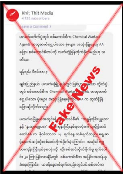
အကြမ်းဖက်မှုချေမှုန်းရေး စစ်ဆင်ရေးများကို ထိရောက်စွာ ဆက်လက်ဆောင်ရွက်သွား မည်ဖြစ်ကြောင်း သိရသည်။

များ၏ ရုပ်ရည်ချွန်ချွန်တိုက်ခိုက်မှုများကြောင့် AA အကြမ်းဖက်အဖွဲ့များသည် အကျအဆုံးများ လာပြီး ၎င်းတို့အဖွဲ့အတွင်း စိတ်ဓာတ်ပျက်ပြား ကာ တိုက်ခိုက်လိုစိတ် မရှိကြတော့သဖြင့် တပ်မတော်မှ ဓာတုဓာတ်ငွေ့ပုံးများ အသုံးပြု သည်ဟု မဟုတ်မမှန်လုပ်ကြံ၍ တရားမဝင် ပြည်ပျက်မီဒီယာများ အားကိုးကာ သတင်းမှား များ ထုတ်လွှင့်ခြင်းသာ ဖြစ်ကြောင်းနှင့် တပ်မတော်မှ လေကြောင်းပစ်ကူရယူရာတွင် ဓာတုဓာတ်ငွေ့ပုံးများအား မည်သည့်တိုက်ပွဲ များတွင်မှ အသုံးပြုတိုက်ခိုက်ခဲ့ခြင်း မရှိ ကြောင်း၊ တပ်မတော်အနေဖြင့် နယ်မြေဒေသ လုံခြုံရေးနှင့် တရားဥပဒေစိုးမိုးရေးအတွက်