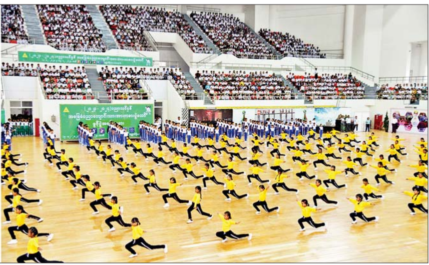
နိုင်ငံတော်စီမံအုပ်ချုပ်ရေးကောင်စီအဖွဲ့ဝင်များနှင့် အခမ်းအနားတက်ရောက်လာကြသူများ၊ အခြေခံပညာအထက်တန်းကျောင်းများမှ ကျောင်းသား ကျောင်းသူများက အေရီးဗစ်အကနှင့် စုပေါင်းကိုယ်လက်ကြံ့ခိုင်ရေးအစီအစဉ် အတွဲ (၃/၄) တို့ဖြင့် သရုပ်ပြသမှုကို ကြည့်ရှုအားပေးစဉ်။

ယှဉ်ပြိုင်ခြင်းဖြင့် ယှဉ်ပြိုင်ကြရ မည်ဖြစ်ကြောင်း၊ အားကစား ဆိုသည်မှာ အနိုင်အရှုံးတစ်ခုတည်း ကို ဦးတည်ယှဉ်ပြိုင်ခြင်းမျိုး မဟုတ်ဘဲ ဇွဲရှိမှု၊ စိတ်ဓာတ်ကြံ့ခိုင် မှု၊ သည်းခံမှု၊ စည်းလုံးညီညွတ်မှု၊ ပူးပေါင်းဆောင်ရွက်မှု၊ စည်းကမ်း