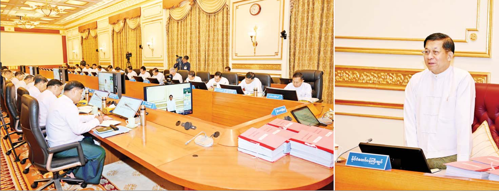
နိုင်ငံတော်စီမံအုပ်ချုပ်ရေးကောင်စီဥက္ကဋ္ဌ နိုင်ငံတော်ဝန်ကြီးချုပ် ဗိုလ်ချုပ်မှူးကြီး မင်းအောင်လှိုင် ပြည်ထောင်စုအစိုးရအဖွဲ့အစည်းအဝေးအမှတ်စဉ်(၇/၂၀၂၃)တွင် အမှာစကားပြောကြားစဉ်။