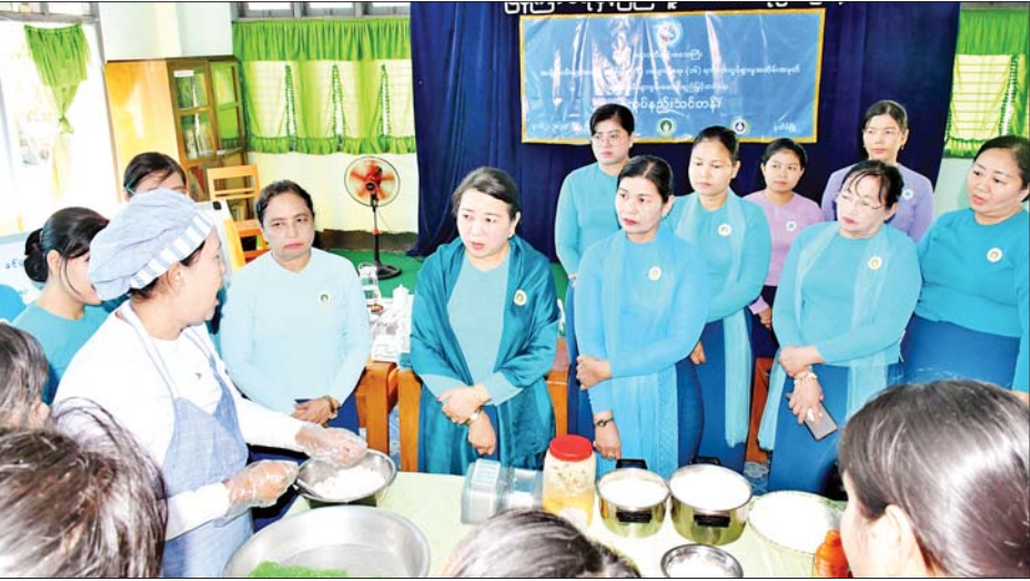
ဖက်မှုမှ ကာကွယ်တားဆီးရေး လုပ်ငန်းစဉ်များကို ဆက်လက် ဖော်ဆောင် လုပ်ကိုင်သွားကြမည် ဖြစ်ပါကြောင်း၊ အိမ်တွင်းမှု သက်မွေး ပညာရပ်များကို ကျောင်းအခြေပြု ရပ်ရွာအခြေပြု သင်တန်းများ ဖွင့်လှစ်သင်ကြား ပေးလျက်ရှိပါကြောင်းနှင့် မည်သည့်ပညာရပ်ကိုမဆို တတ်မြောက်အောင် သင်ကြားပြီး တီထွင် ဆန်းသစ်မှုများဖြင့် မိမိဘဝမြှင့်တင်တိုးတက်အောင် ဆက်လက်ကြိုးစားသွားကြရန် လိုပါကြောင်း အမှာစကား ပြောကြားသည်။ အဆိုပါ မုန့်လုပ်နည်းသင်တန်း ကို တိုင်းဒေသကြီးအမျိုးသမီး ရေးရာအဖွဲ့နှင့် လူမှုဝန်ထမ်း ဦးစီးဌာနတို့ ပူးပေါင်းဖွင့်လှစ် ခြင်းဖြစ်ပြီး သင်တန်းတွင် လေးထပ်ကျောက်ကျောခင်လေး ပူစာမုန့်၊ မုန့်လှည့်နီ ဆွန်းမကင်း၊ မုန့်ဗိုင်းတောင့် ပြုလုပ်နည်း များကို လက်တွေ့သင်ကြား ပြသပေးရာ တိုင်းဒေသကြီး အမျိုးသမီးရေးရာအဖွဲ့ နာယက နှင့် တာဝန်ရှိသူများက ကြည့်ရှု အားပေးကြပြီး အခမ်းအနား တက်ရောက်လာကြသူများနှင့် အမှတ်တရ စုပေါင်းမှတ်တမ်း တင်ဓာတ်ပုံများ ရိုက်ခဲ့ကြ ကြောင်း သိရသည်။

ဧရာဝတီတိုင်းဒေသကြီး ပုသိမ် မြို့တွင် အမျိုးသမီးများအပေါ် အကြမ်းဖက်မှုပျောက်ရေး ၁၆ ရက်တာ လှုပ်ရှားမှုအထိမ်းအမှတ် အမျိုးသမီးများ စွမ်းဆောင်ရည် မြှင့်တင်ရေး မုန့်လုပ်နည်း သင်တန်းဖွင့်ပွဲ အခမ်းအနားကို ယနေ့နံနက်ပိုင်းက ပြန်ကြားရေး နှင့်ပြည်သူ့ဆက်ဆံရေး ဦးစီးဌာန Community Centre ခန်းမ၌ ကျင်းပသည်။