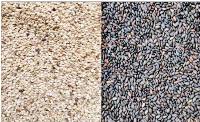
တစ်တင်းလျှင် ကျပ် ၁၃၃၀၀ နှင့် နှမ်းနက်တစ်တင်းလျှင် ကျပ် ၁၃၃၀၀ ဈေးနှုန်း ပိုမို၍ အရောင်းအဝယ်ဖြစ်ခဲ့ကြောင်း သိရသည်။

ရွှေဘို ဒီဇင်ဘာ ၄ စစ်ကိုင်းတိုင်းဒေသကြီး ရွှေဘိုမြို့ ပဲ၊ နှမ်းကုန်စည်ဒိုင်သို့ နိုဝင်ဘာလ တတိယပတ်မှ စတင်၍ နှမ်းဖြူနှင့် နှမ်းနက်များ ဝင်ရောက်ခဲ့ရာ နိုဝင်ဘာလ နောက်ဆုံးပတ်တွင် အရောင်းအဝယ်ဖြစ်သည့် ဈေးနှုန်းများမှာ နှမ်းဖြူ တစ်တင်းလျှင် ကျပ် ၁၁၃၃၀၀ ပေါက်ဈေးရှိပြီး တစ်ပတ်အတွင်း အရောင်း အဝယ်ဖြစ်မှုမှာ တင်း ၉၀၀ (တန်အားဖြင့် ၂၂ တန်) အရောင်းအဝယ်ဖြစ်ခဲ့ကြောင်း၊ နှမ်းနက် တစ်တင်းလျှင် ကျပ် ၁၁၁၆၀၀ ပေါက်ဈေးရှိပြီး တစ်ပတ်အတွင်း အရောင်းအဝယ်ဖြစ်မှုမှာ တင်း ၁၀၀၀ (တန်အားဖြင့် ၂၄ တန်) အရောင်းအဝယ် ဖြစ်ခဲ့ကြောင်း၊ နိုဝင်ဘာလ တတိယပတ်နှင့် နောက်ဆုံးပတ်အတွင်း အရောင်း အဝယ်ဖြစ်သည့် ဈေးနှုန်းများကို နှိုင်းယှဉ်ပါက နိုဝင်ဘာလ တတိယပတ်တွင် နှမ်းဖြူတစ်တင်းလျှင် ကျပ် ၁၁၀၀၀၀နှင့် နှမ်းနက်တစ်တင်းလျှင် ကျပ် ၁၀၈၃၀၀ ပေါက်ဈေးရှိခဲ့သဖြင့် နိုဝင်ဘာလ စတုတ္ထပတ်တွင် နှမ်းဖြူ