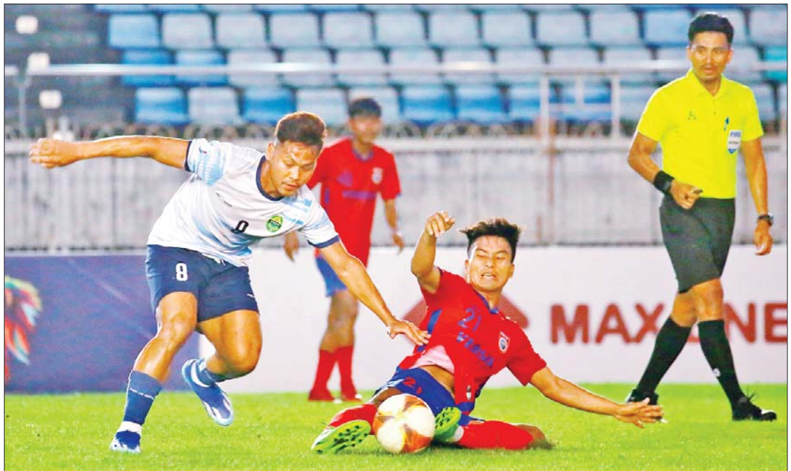
ဒဂုံစတားအသင်းနှင့် GFA အသင်းတို့ ယှဉ်ပြိုင်ကစားကြစဉ်။

ရန်ကုန် ဒီဇင်ဘာ ၃ ၂၀၂၃ ရာသီ MNL အမှတ်ပေးပြိုင်ပွဲ ပွဲစဉ် (၂၁) တတိယနေ့ကို ဒီဇင်ဘာ ၃ ရက်က ဆက်လက်ကျင်းပရာ ဒဂုံစတား အသင်းက GFA အသင်းကို လေးဂိုး-တစ်ဂိုးဖြင့် အနိုင်ရခဲ့သည်။ GFA အသင်းသည် ယခုပွဲဂိုးပြတ် ရှုံးပွဲကြောင့် လက်ကျန်နှစ်ပွဲအလိုတွင် တန်းဆင်းခဲ့ရပြီဖြစ်သည်။ ဒဂုံစတား အသင်းမှာမူ နိုင်ပွဲဆက်ခဲ့သဖြင့် အဆင့် ၄ နေရာအထိ တက်လှမ်းနိုင်ခဲ့ပြီး ရာသီ ကုန်တွင် ထိပ်ဆုံးငါးသင်းစာရင်းဝင်ရန် မျှော်လင့်ချက်ရှိလာသည်။ နှစ်သင်းစလုံး အမှတ်လိုနေသဖြင့် အမာခံကစားသမား အစုံအလင်ဖြင့် ပွဲထွက်ခဲ့ပြီး ဒဂုံစတားအသင်းသည် ပထမပိုင်းမှာပင် သုံးဂိုးပြတ်သွင်းယူထား နိုင်သဖြင့် ပထမပိုင်းကတည်းက အဖြေ စာမျက်နှာ ၁၂ ကော်လံ ၁ သို့ *