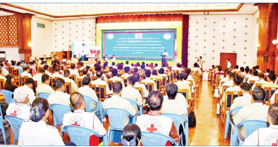
ပေးပို့သည့် သဝဏ်လွှာနှင့် အပြည်ပြည်ဆိုင်ရာ မသန်စွမ်းသူများနေ့ အထိမ်းအမှတ် Video Clip များအား ပြသသည်။ ယင်းနောက် တိုင်းဒေသကြီး ဝန်ကြီးချုပ်၊ တိုင်းမှူးနှင့် တက်ရောက်လာကြသူ

နေပြည်တော် ဒီဇင်ဘာ ၃ ရန်ကုန်တိုင်းဒေသကြီး မသန်စွမ်းသူများ၏ အခွင့်အရေးများဆိုင်ရာကော်မတီက ကြီးမှူးကျင်းပသော ၂၀၂၃ ခုနှစ် အပြည်ပြည်ဆိုင်ရာ မသန်စွမ်းသူများနေ့ကို ယနေ့နံနက်ပိုင်းတွင် ဒဂုံမြို့နယ်ရှိ တိုင်းဒေသကြီးအစိုးရအဖွဲ့ရုံး မင်္ဂလာခန်းမ၌ ကျင်းပရာ တိုင်းဒေသကြီးဝန်ကြီးချုပ် ဦးစိုးသိန်း၊ ရန်ကုန်တိုင်းစစ်ဌာနချုပ် တိုင်းမှူး ဗိုလ်ချုပ် ဇော်ဟိန်းနှင့် တိုင်းဒေသကြီး ဝန်ကြီးများနှင့် တာဝန်ရှိသူများ၊ တိုင်းဒေသကြီး လူမှုဝန်ထမ်းဦးစီးဌာနမှ တာဝန်ရှိသူများ၊ တိုင်းဒေသကြီးအတွင်းရှိ မသန်စွမ်းသင်တန်းကျောင်းမှ လူငယ်မောင်မယ်များ တက်ရောက်ကြသည်။ ဦးစွာ တိုင်းဒေသကြီးဝန်ကြီးချုပ်က အမှာစကားပြောကြားသည်။ ထို့နောက် ကုလသမဂ္ဂမှ