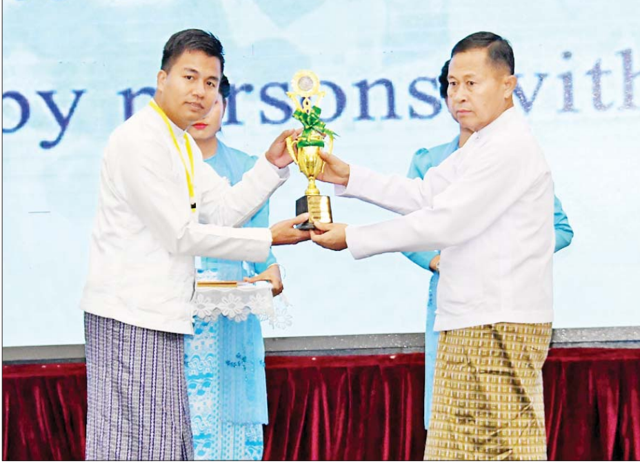
နိုင်ငံတော်စီမံအုပ်ချုပ်ရေးကောင်စီ ဒုတိယဥက္ကဋ္ဌ ဒုတိယဝန်ကြီးချုပ် ဒုတိယဗိုလ်ချုပ်မှူးကြီးစိုးဝင်း ၂၀၂၃ ခုနှစ် အပြည်ပြည်ဆိုင်ရာ မသန်စွမ်းသူများနေ့ အထိမ်းအမှတ် အလွတ်တန်းဆောင်းပါး ပြိုင်ပွဲတွင် ဂုဏ်ပြုဆုရရှိသူတစ်ဦးအား ဆုချီးမြှင့်ပေးအပ်စဉ်။

ကြောင်း၊ စဉ်ဆက်မပြတ်ဖွံ့ဖြိုးမှု ပန်းတိုင် Sustainable Development Goals (၁၇)ချက်ကို ၂၀၁၅ ခုနှစ်တွင် ကုလသမဂ္ဂအထွေထွေညီလာခံက ချမှတ်ခဲ့ပြီး ကမ္ဘာတစ်ဝန်း ရင်ဆိုင်ကြုံတွေ့နေရသည့် လူမှုရေး၊ စီးပွားရေးနှင့် သဘာဝ ပတ်ဝန်းကျင်ဆိုင်ရာ စိန်ခေါ်မှုများကို ကျော်လွှားနိုင်ရန် ရည်ရွယ်ချက် ထားရှိကြောင်း၊ စဉ်ဆက်မပြတ် ဖွံ့ဖြိုးမှုပန်းတိုင်များအနက် ပန်းတိုင်အမှတ် (၁)