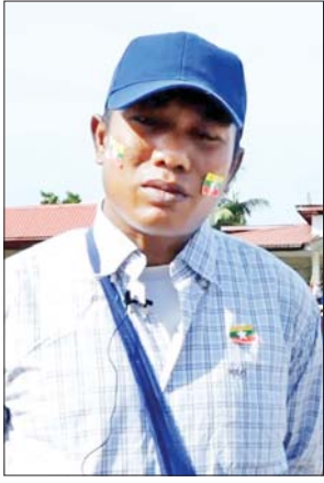
ဦးလှဖြိုး

ထောက်ခံပွဲကို လာရတဲ့အကြောင်း ရင်းကတော့ တပ်မတော်သားတွေ ကို အားပေးချင်တာလည်းပါ တယ်။ အမျိုးဘာသာသာသနာကို ဖျက်ဆီးနေတဲ့ KIA၊ TNLA၊ MNDAA နဲ့ အကြမ်းဖက် PDF တွေ ကို တိုက်ခိုက်နေတဲ့အတွက် ထောက်ခံချင်လို့လည်း ပါပါတယ်။ အခုဖြစ်နေတဲ့ နိုင်ငံရေးအခင်း အကျင်းမှာဆိုရင် ပြည်သူတွေ အသုံးပြုနေတဲ့ လမ်းတံတားတွေ ကို ဖျက်ဆီးတာလည်း PDF တွေ ပဲဖြစ်ပါတယ်။ သတင်းတွေ လည်း ကြားကြမှာပါ။ ဒါတွေကို လူတိုင်းက သိကြတာပါပဲ။ အခု ကုန်ဈေးနှုန်းတွေ တက်လာတာ လည်း ဒီ PDF တွေက လမ်းတံတား တွေကို ဖျက်ဆီးပစ်ကြလို့ကုန်ဈေး နှုန်းတွေ တက်လာကြတာ။ လမ်း ပန်းဆက်သွယ်ရေး မကောင်းဖြစ် ကြတာ။ အဲဒီတော့ ကျွန်တော်တို့ က တပ်မတော်ကိုပဲ အားပေး တယ်။ အမြဲတမ်းလည်း အားပေး ပြီးတော့ ရင်ထဲမှာ ထာဝရ တပ်မတော်ကိုပဲ အားပေးနေဦး မှာပါ။