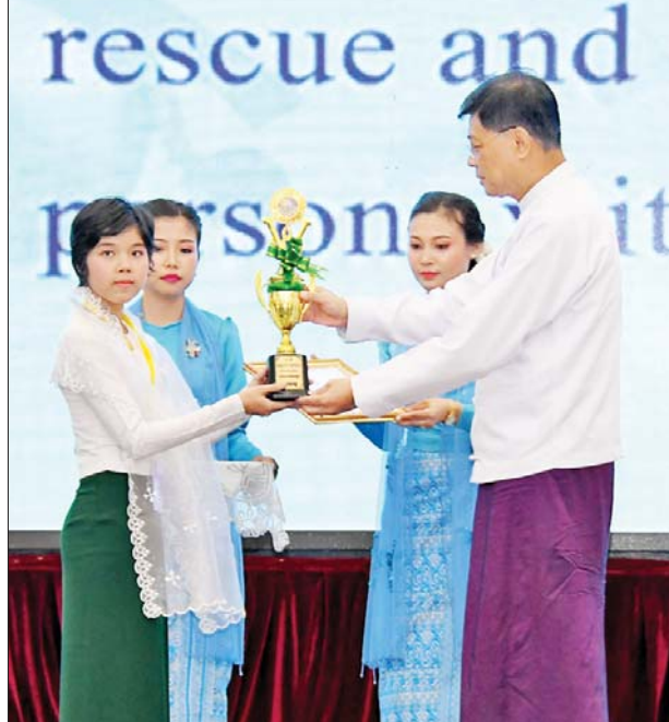
ပြည်ထောင်စုဝန်ကြီး ဗိုလ်ချုပ်ကြီးမြထွန်းဦး အခြေခံပညာ အထက်တန်းအဆင့် စာစီစာကုံးပြိုင်ပွဲတွင် ဆုရရှိသူတစ်ဦးအား ဂုဏ်ပြုဆု ပေးအပ်ချီးမြှင့်စဉ်။

(၄)၊ (၈)၊ (၁၀)၊ (၁၁) နှင့် (၁၇) တို့သည် မသန်စွမ်းသူများနှင့် ဆက်စပ်နေသည့် ပန်းတိုင်များ ဖြစ်ကြောင်း။ ဆင်းရဲနွမ်းပါးမှုအဆုံးသတ်ရေး “ပန်းတိုင်အမှတ်(၁)” အနေဖြင့် ဆင်းရဲနွမ်းပါးမှုကို နေရာတိုင်းတွင် အဆုံးသတ်ရေးပင်ဖြစ်ကြောင်း၊ မသန်စွမ်းသူများအနေဖြင့် ပညာရေး၊ အလုပ်အကိုင် ရရှိရေး၊ ကျန်းမာရေးစောင့်ရှောက်မှုနှင့် လူမှုကာကွယ်စောင့်ရှောက်မှုများ ရရှိရေးအတွက် အခက်အခဲများ ကြုံတွေ့နေရပြီး ဆင်းရဲနွမ်းပါးမှုနှင့် ရင်ဆိုင်ကြုံတွေ့ကြောင်း၊ သတ်စေရေး ဆောင်ရွက်ရာတွင် အားလုံးပါဝင်သည့် ဖွံ့ဖြိုးမှု မဟာဗျူဟာ Inclusive Development Strategies ကို ချမှတ်ဆောင်ရွက်ရန် လိုအပ်မည်ဖြစ်ပြီး မသန်စွမ်းသူများ၏ အခွင့်အရေး၊ လိုအပ်ချက်နှင့် စွမ်းဆောင်နိုင်မှုများကို ဖြစ်ကြောင်း။ ရည်ရွယ်ချက်အနေဖြင့် အားလုံးအကျိုးဝင်ပြီး အရည်အသွေးမီ ညီမျှသည့် ပညာရေးကို ရရှိစေရေးနှင့် အစဉ်လေ့လာသင်ယူနိုင်ရေးပင်ဖြစ်ကြောင်း၊ မသန်စွမ်းသူ ကျောင်းသား ကျောင်းသူများအနေဖြင့် မိမိတို့ စွမ်းဆောင်ရည်ရှိသလောက် ဖွံ့ဖြိုးတိုးတက်စေရေးနှင့် အမှီအခိုကင်းစွာ ဘဝရပ်တည် နေထိုင်နိုင်စေရေးအတွက် အားလုံး အကျိုးဝင်ပညာရေး Inclusive Education ပေါ်ပေါက်လာစေရေး ဆောင်ရွက်ရမည် ဖြစ်သကဲ့သို့ အသက်မွေးဝမ်းကျောင်းပညာ သင်ကြားနိုင်ရေး၊ ဘဝသက်တမ်းတစ်လျှောက် သင်ယူလေ့လာနိုင်စေရေး စီစဉ်ဆောင်ရွက်ပေးရမည်ဖြစ်ကြောင်း။ “ပန်းတိုင်အမှတ်(၈)” သည် သင့်လျော်သည့် အလုပ်အကိုင်ရရှိရေးနှင့် စီးပွားရေးဖွံ့ဖြိုးတိုးတက်စေရေးကို ရည်ရွယ်ထားခြင်းဖြစ်ကြောင်း၊ ထုတ်လုပ်နိုင်စွမ်းရှိသည့် လုပ်သားအင်အားစုမှာ မသန်စွမ်းသူများကိုလည်း နိုင်ငံ၏ လူ့စွမ်းအား စာမျက်နှာ ၄ သို့ ★ “ပန်းတိုင်အမှတ်(၄)” ၏