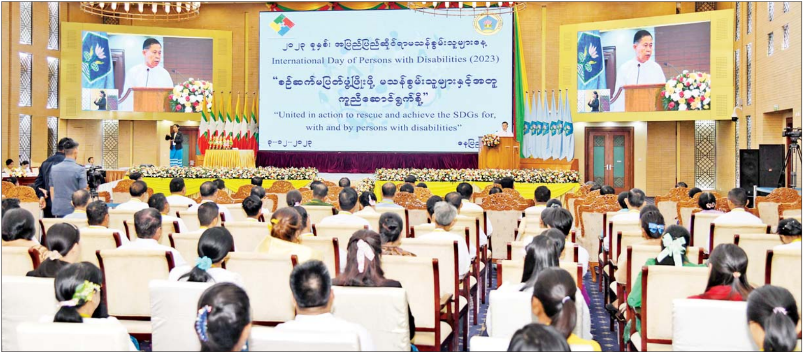
နိုင်ငံတော်စီမံအုပ်ချုပ်ရေးကောင်စီ ဒုတိယဥက္ကဋ္ဌ ဒုတိယဝန်ကြီးချုပ် ဒုတိယဗိုလ်ချုပ်မှူးကြီးစိုးဝင်း ၂၀၂၃ ခုနှစ် အပြည်ပြည်ဆိုင်ရာ မသန်စွမ်းသူများနေ့ အထိမ်းအမှတ်အခမ်းအနားတွင် အမှာစကားပြောကြားစဉ်။

၂၀၂၃ ခုနှစ် အပြည်ပြည်ဆိုင်ရာ မသန်စွမ်းသူများနေ့ အတွက် ကုလသမဂ္ဂအဖွဲ့ကြီးက သတ်မှတ်ပေးသည့် ဦးတည်ဆောင်ပုဒ်အနေဖြင့် “United in action to rescue and achieve the SDGs for, with and by persons with disabilities” “စဉ်ဆက်မပြတ် ဖွံ့ဖြိုးမှု မသန်စွမ်းသူများနှင့်အတူ ကူညီဆောင်ရွက်စို့” ပင်ဖြစ်