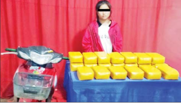
မနာဖွေအား သိမ်းဆည်းရမိသည့်စိတ်ကြွရှားသွပ်ဆေးပြားများနှင့်အတူ တွေ့ရစဉ်။

နေပြည်တော် ဒီဇင်ဘာ ၃ ကျိုင်းတုံနှင့် မိုင်းဆတ်မြို့နယ်တို့တွင် စိတ်ကြွရှားသွပ်ဆေးပြားများ သိမ်းဆည်းရမိခဲ့ကြောင်း မြန်မာနိုင်ငံရဲတပ်ဖွဲ့မှ သိရသည်။ မူးယစ်ဆေးဝါးတားဆီးနှိမ်နင်းရေးရဲတပ်ဖွဲ့မှ တပ်ဖွဲ့ဝင်များ ပါဝင်သော ပူးပေါင်းအဖွဲ့သည် ဒီဇင်ဘာ ၂ ရက် ည ၈ နာရီတွင် ကျိုင်းတုံမြို့နယ် မိုင်းပန်လယ်အုပ်စု ပန်မတ်ကျေးရွာအနီးတွင် မနာဖွေအား စိတ်ကြွရှားသွပ်ဆေးပြား ၂၀၀၀၀၀၊ ဆိုင်ကယ်တစ်စီးနှင့်လည်းကောင်း၊ အလားတူ ယင်းနေ့ ည ၈ နာရီ ၄၅ မိနစ်တွင် မူးယစ်ဆေးဝါး တားဆီးနှိမ်နင်းရေးရဲတပ်ဖွဲ့မှ တပ်ဖွဲ့ဝင်များပါဝင်သော ပူးပေါင်းအဖွဲ့သည် မိုင်းဆတ်မြို့နယ် မယ်ပုလုံကျေးရွာအုပ်စု ဂျူးလုကျေးရွာအနီးတွင် လော်ကျား မောင်းနှင်ပြီး လီမာလိုက်ပါလာသည့် ဆိုင်ကယ်ကို ရပ်တန့် စစ်ဆေးရာမှ စိတ်ကြွရှားသွပ်ဆေးပြား ၂၀၂၀၀ ကိုလည်းကောင်း သိမ်းဆည်းရမိခဲ့သဖြင့် ၎င်းတို့အား မူးယစ်ဆေးဝါးနှင့် စိတ်ကိုပြောင်းလဲစေသော ဆေးဝါးများဆိုင်ရာဥပဒေအရ အရေးယူထားကြောင်း သိရသည်။