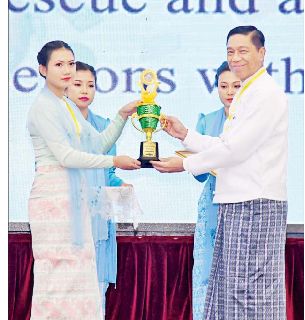
ပြည်ထောင်စုဝန်ကြီး ဒေါက်တာစိုးဝင်း မသန်စွမ်းသူများအတွက် အလုပ်အကိုင် အခွင့်အလမ်း ဖန်တီးပေးရေး ဂုဏ်ပြုဆုရရှိသူ တစ်ဦးအား ဆုပေးအပ်ချီးမြှင့်စဉ်။