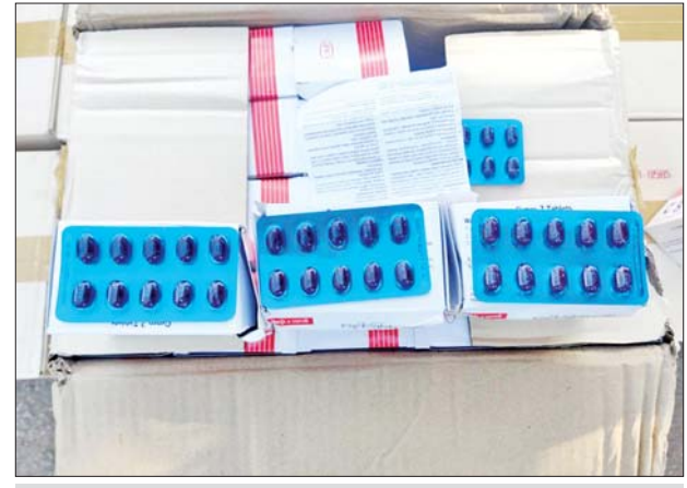
မရမ်းချောင်းအမြဲတမ်းစစ်ဆေးရေးစခန်း၌ သိမ်းဆည်းရမိမှု။

နေပြည်တော် ဒီဇင်ဘာ ၃ တရားမဝင်ကုန်သွယ်မှုတိုက်ဖျက်ရေး ဦးဆောင်ကော်မတီ၏ ကြီးကြပ်ကွပ်ကဲမှုဖြင့် တရားမဝင်ကုန်သွယ်မှုများကို ဥပဒေနှင့်အညီ ထိရောက်စွာ တားဆီးအရေးယူနိုင်ရေး ဆောင်ရွက်လျက်ရှိရာ ဒီဇင်ဘာ ၂ ရက်တွင် အကောက်ခွန်ဦးစီးဌာန၏ စီမံခန့်ခွဲမှုဖြင့် တာဝန်ကျပေါင်း အဖွဲ့များက စစ်ဆေးမှုများဆောင်ရွက်ရာတွင် မရမ်းချောင်းအမြဲတမ်း စစ်ဆေးရေးစခန်း၌ မြိတ်မြို့မှ ရန်ကုန်မြို့သို့ မောင်းနှင်လာသော ယာဉ်တစ်စီးပေါ်မှ တရားဝင်စာရွက်စာတမ်း အထောက်အထားတင်ပြနိုင်ခြင်း မရှိသည့် ဆေးဝါး CYPROHEPTADINE ယားနာပျောက်ဆေးဘူး ၄၈၀၀ (ခန့်)မှန်းတန်ဖိုးငွေကျပ် ၃၀၀၀၀၀၀)နှင့် အဆိုပါပစ္စည်းများ တင်ဆောင်လာသည့် KIA PREGIO MINI BUS တစ်စီး (ခန့်)မှန်းတန်ဖိုးငွေကျပ် ၂၀၀၀၀၀၀) စုစုပေါင်းခန့်မှန်းတန်ဖိုးငွေကျပ် ၅၀၀၀၀၀၀ ကို သိမ်းဆည်းရမိခဲ့ပြီး အကောက်ခွန်လုပ်ထုံးလုပ်နည်းများနှင့်အညီ အရေးယူဆောင်ရွက်လျက်ရှိသည်။