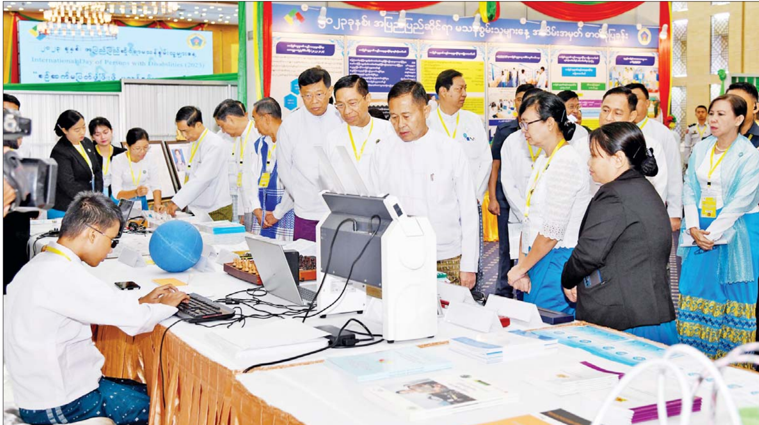
နိုင်ငံတော်စီမံအုပ်ချုပ်ရေးကောင်စီ ဒုတိယဥက္ကဋ္ဌ ဒုတိယဝန်ကြီးချုပ် ဒုတိယဗိုလ်ချုပ်မှူးကြီးစိုးဝင်း ၂၀၂၃ ခုနှစ် အပြည်ပြည်ဆိုင်ရာမသန်စွမ်းသူများနေ့ အထိမ်း အမှတ်အခမ်းအနားတွင် ခင်းကျင်းပြသထားသည့်ပြခန်းများကို ကြည့်ရှုစဉ်။

နေပြည်တော် ဒီဇင်ဘာ ၃ ၂၀၂၃ ခုနှစ် အပြည်ပြည်ဆိုင်ရာ မသန်စွမ်းသူများနေ့ အထိမ်းအမှတ် အခမ်းအနားကို ယနေ့နံနက် ၁၀ နာရီ တွင် နေပြည်တော်ရှိ မြန်မာအပြည်ပြည် ဆိုင်ရာ ကွန်ဗင်းရှင်းဗဟိုဌာန-၂ (MICC-II) ၌ ကျင်းပရာ မသန်စွမ်းသူများ၏ အခွင့်အရေးများဆိုင်ရာ အမျိုးသား ကော်မတီဥက္ကဋ္ဌ နိုင်ငံတော်စီမံအုပ်ချုပ် ရေးကောင်စီ ဒုတိယဥက္ကဋ္ဌ ဒုတိယ ဝန်ကြီးချုပ် ဒုတိယဗိုလ်ချုပ်မှူးကြီးစိုးဝင်း တက်ရောက်အမှာစကားပြောကြားသည်။ တက်ရောက် အခမ်းအနားသို့ နိုင်ငံတော်စီမံ အုပ်ချုပ်ရေးကောင်စီဝင်များ၊ ပြည်ထောင်စု ဝန်ကြီးများ၊ တပ်မတော်မှအဆင့်မြင့် အရာရှိကြီးများ၊ နေပြည်တော်ကောင်စီ ဥက္ကဋ္ဌ ဒုတိယဝန်ကြီးများ၊ အမြဲတမ်း အတွင်းဝန်များ၊ ညွှန်ကြားရေးမှူးချုပ်များ၊ နိုင်ငံတကာအဖွဲ့အစည်းများမှ ကိုယ်စား လှယ်များ၊ မြန်မာနိုင်ငံ မသန်စွမ်းသူများ အသင်းချုပ်မှ တာဝန်ရှိသူများ၊ မသန်စွမ်း သူများ ဖိတ်ကြားထားသူများနှင့် တာဝန် ရှိသူများ တက်ရောက်ကြသည်။ စာမျက်နှာ ၃ ကော်လံ ၁ သို့ ။