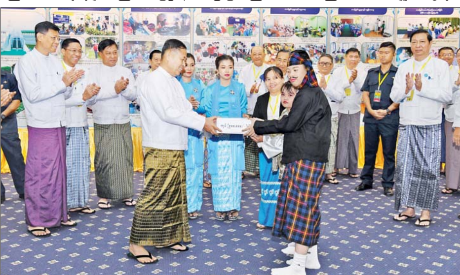
နိုင်ငံတော်စီမံအုပ်ချုပ်ရေးကောင်စီဒုတိယဥက္ကဋ္ဌ ဒုတိယဝန်ကြီးချုပ် ဒုတိယဗိုလ်ချုပ်မှူးကြီး စိုးဝင်း ဦးရွှေရိုးနှင့် ဒေါ်မိုးအကဖြင့် ကပြဖျော်ဖြေခဲ့သည့် မသန်စွမ်းသက်ငယ်သင်တန်းကျောင်း(ရန်ကုန်)မှ မသန်စွမ်းကလေးများအား ဆုတော်ငွေဂုဏ်ပြုချီးမြှင့်ပေးအပ်စဉ်။

“ပန်းတိုင်အမှတ်(၁၇)” သည် လူ့ဘောင်၏ ယဉ်ကျေးမှုနှင့် လူမှုဆက်ဆံရေးတွင် ကြီးသူကို ရိုသေ၊ ရွယ်တူကို လေးစား၊ ငယ်သူကို သနား၊ အားနည်းသူကို ဖေးမကူညီ ဆိုသည့် စိတ်နေစိတ်ထားများရှိပြီး ဖြစ်သည်နှင့်အညီ မသန်စွမ်းသူများကို လူမှုအသိုင်းအဝိုင်းထဲက ပစ်ပယ်ထားဘဲ အားပေးကူညီပေးလျက်ရှိကြောင်း၊ မသန်စွမ်းသူများကို စိတ်ပိုင်းဆိုင်ရာသာမက ရုပ်ပိုင်းဆိုင်ရာပါ ကျန်းမာကြံ့ခိုင်လာပြီး မသန်သော်လည်း စွမ်းသူများအဖြစ် ရောက်ရှိအောင် ကူညီပေးမသွားကြရမည်ဖြစ်ကြောင်း၊ ထို့ကြောင့် မသန်စွမ်းသူများ၏ အခွင့်အရေးများကို သိရှိနားလည်စေရေး အသိပညာပေးဆောင်ရွက်သွားရမည် ဖြစ်သကဲ့သို့ မသန်စွမ်းသူများအတွက် ဆောင်ရွက်ပေးနေသည့် ဝန်ဆောင်မှုများကို မသန်စွမ်းသူများ ကိုယ်တိုင်သိရှိစေရေးနှင့် လက်လှမ်းမီ ရယူအသုံးပြုနိုင်ရေးအတွက်လည်း စီစဉ်ဆောင်ရွက်ပေးသွားကြရန်လိုကြောင်း။