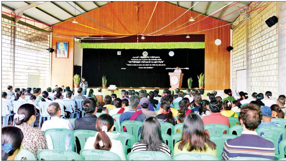
နှင့် ပြုပြင်ပြောင်းလဲနိုင်သည့် နည်းလမ်းများကို ရှာဖွေဖော်ထုတ်၍ လက်လှမ်းမီ ရယူအသုံးပြုနိုင်ပြီး ညီမျှသည့် လူ့အသိုင်းအဝိုင်းဖြစ်ပေါ်လာစေရေး ဆောင်ရွက်ပေးကြရန် ပြောကြားသည်။

အထိမ်းအမှတ်အခမ်းအနားတွင် ရှမ်းပြည်နယ် ဝန်ကြီးချုပ် ဦးအောင်ဇော်အေးက မြန်မာနိုင်ငံအနေဖြင့် အပြည်ပြည်ဆိုင်ရာ မသန်စွမ်းသူများနေ့အထိမ်းအမှတ်အခမ်းအနားကို ၁၉၉၄ ခုနှစ်မှစတင်၍ အစဉ်အလာမပျက် ကျင်းပခဲ့ကြောင်း၊ မသန်စွမ်းသူများအတွက် ဘက်ပေါင်းစုံ ဖွံ့ဖြိုးတိုးတက်အောင်ဆောင်ရွက်ရာတွင် မသန်စွမ်းသူများကိုယ်တိုင် ပူးပေါင်းပါဝင်ဆောင်ရွက်နေမှုကို အသိအမှတ်ပြု ကျေးဇူးတင်ရှိကြောင်း၊ မသန်စွမ်းသူများ၏ ဘဝအခြေအနေ မြင့်မားတိုးတက်စေရေး၊ နောက်ကျမကျန်စေရေးအတွက် တီထွင်ဆန်းသစ်မှုနည်းပညာ