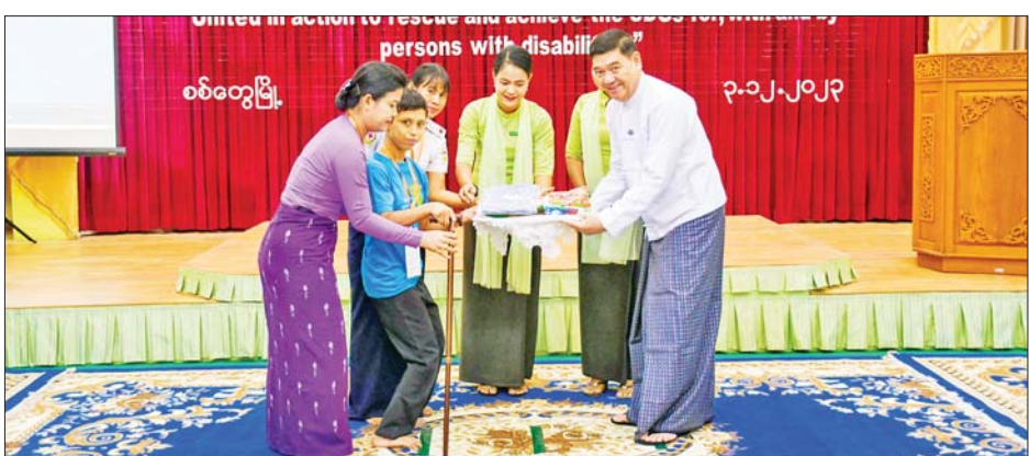
တစ်ယောက်မျှ နောက်ကျမကျန်ရစ်စေရေး (Leaving no one behind) မှုကို လက်ကိုင်ထားပြီး မသန်စွမ်းသူများ၏အခွင့်အရေးကို မသန်စွမ်းသူများနှင့် အတူ ပူးပေါင်းကူညီဆောင်ရွက်ပေးကြရန် တိုက်တွန်းပြောကြားသည်။

ဖွံ့ဖြိုးတိုးတက်မှုစီမံချက်၊ အာဆီယံမဟာဗျူဟာ လုပ်ငန်းစဉ်(၂၀၁၅)တို့နှင့်အညီ မသန်စွမ်းသူများ၏ အခွင့်အရေးဆိုင်ရာ မဟာဗျူဟာ (၅)နှစ်စီမံကိန်း ၂၀၂၂-၂၀၂၇ ကို အတည်ပြုပြဋ္ဌာန်း အကောင်အထည်ဖော်ဆောင်ရွက်နေပြီဖြစ်ကြောင်း၊ မဟာဗျူဟာ(၅) နှစ်စီမံကိန်းမှာ မသန်စွမ်းသူများအတွက် ကျန်းမာရေး၊ ပညာရေး၊ လုပ်ငန်းနှင့် အလုပ်အကိုင်၊ လူမှုကာကွယ်စောင့်ရှောက်ရေး၊ သဘာဝဘေးနှင့် အခြားအရေးပေါ်အခြေအနေ၊ အလွယ်တကူလက်လှမ်းမီ ရယူအသုံးပြုနိုင်မှုစသည့် ကဏ္ဍစုံပါရှိကြောင်း၊ ထို့ကြောင့် မဟာဗျူဟာ(၅)နှစ်စီမံကိန်းကို အကောင်အထည်ဖော်ဆောင်ရွက်ခြင်းသည် စဉ်ဆက်မပြတ်ဖွံ့ဖြိုးမှုပန်းတိုင်များ (Sustainable Development Goals)ကို အကောင်အထည်ဖော်ဆောင်ရွက်နေခြင်းဖြစ်ကြောင်းနှင့် ယခုနှစ်တွင် ကျရောက်သည့် အပြည်ပြည်ဆိုင်ရာမသန်စွမ်းသူများနေ့၏ ဦးတည်ဆောင်ပုဒ်နှင့်အညီ စဉ်ဆက်မပြတ်ဖွံ့ဖြိုးမှုပန်းတိုင်များ (Sustainable Development Goals)ရရှိစေရေး ဦးတည်ဆောင်ရွက်ကြရာတွင် မည်သူတစ်ဦး