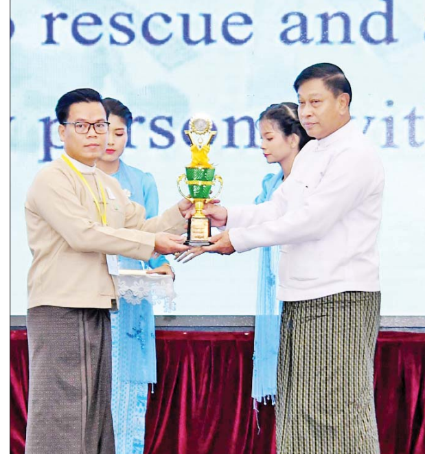
ပြည်ထောင်စုဝန်ကြီး ဗိုလ်ချုပ်ကြီးတင်အောင်စန်း မသန်စွမ်းသူများအတွက် အတားအဆီးမဲ့ ခရီးသွားလာရေး ဂုဏ်ပြုဆုရရှိသူ တစ်ဦးအား ဆုပေးအပ်ချီးမြှင့်စဉ်။