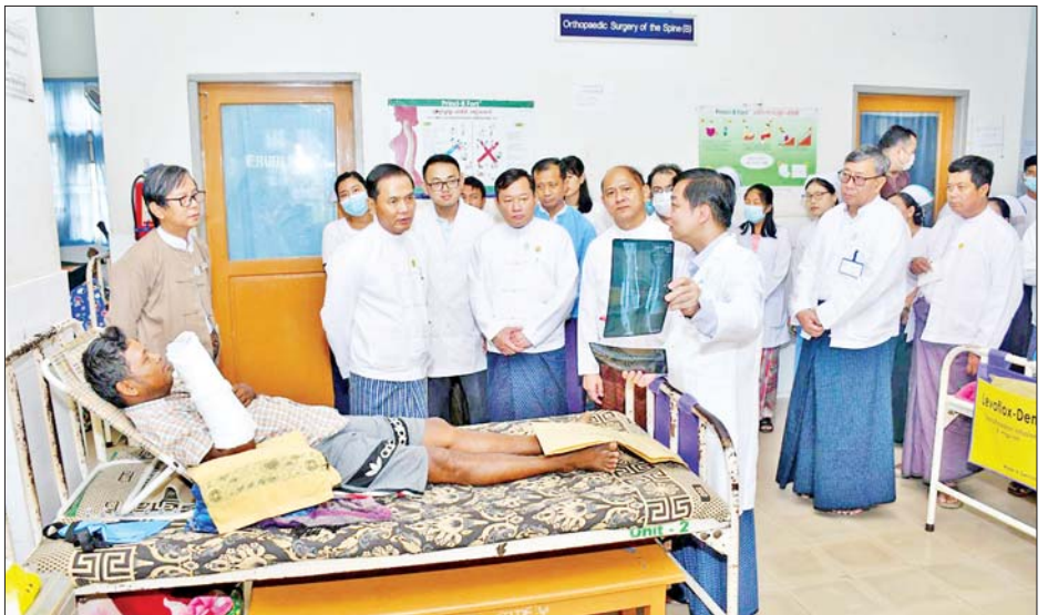
ဓာတ်ခွဲဌာန၊ ဓာတ်မှန်ဌာနတို့ကို လှည့်လည်ကြည့်ရှု တာဝန်ခံများ၊ ဝန်ထမ်းများနှင့်တွေ့ဆုံ၍ လိုအပ်သည် ပြီး ဆေးရုံကြီးရှိ အထူးကုဆရာဝန်ကြီးများ၊ အရိုးများကို ဖြည့်ဆည်းပေးခဲ့ကြောင်း သိရသည်။ ရောဂါပညာဌာနမှ အထူးကုဆရာဝန်ကြီးများ၊ ဌာန သတင်းစဉ်

Lab များ၊ တက္ကသိုလ်စာကြည့်တိုက်နှင့် ခုတင် ၅၀ ဆံ့ ခံတွင်း၊ မျက်နှာ၊ မေးရိုး ခွဲစိတ်ဆေးရုံတို့ကို ကြည့်ရှုစစ်ဆေးရာ သက်ဆိုင်ရာတာဝန်ခံများက ရှင်းလင်းပြသပြီး ဒုတိယဝန်ကြီးက လိုအပ်သည်များကို ပေါင်းစပ်ညှိနှိုင်းဆောင်ရွက်ပေးသည်။ ကြည့်ရှုအားပေး ယင်းနောက် ဒုတိယဝန်ကြီးနှင့်အဖွဲ့သည် မန္တလေးမြို့ အရိုးရောဂါအထူးကုဆေးရုံကြီးသို့ ရောက်ရှိပြီး ဆေးရုံကြီးရှိ လူနာကုသဆောင်များသို့ လှည့်လည်ကြည့်ရှု၍ ဆေးရုံတက်လူနာများကို ကြည့်ရှုအားပေးစကား ပြောကြားသည်။ ထို့နောက် အသစ်ဖွင့်လှစ်မည့် တိုးချဲ့လေးထပ် လူနာကုသဆောင် ဆောက်လုပ်ခြင်းလုပ်ငန်း ဆောင်ရွက်ပြီးစီးမှုနှင့် အကြောအဆစ်အထူးကုဌာန၊