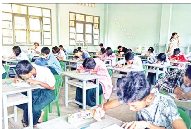
ပြင်ပအလင်းရောင်ကို အသုံးပြုပါ။ မလိုအပ်သော အိမ်တွင်းလျှပ်စစ်မီးများကို လျှော့သုံးပါ။

ပေါက်ခေါင်း ဒီဇင်ဘာ ၃ ပဲခူးတိုင်းဒေသကြီး ပေါက်ခေါင်းမြို့နယ်၌ (၁၀၃) နှစ်မြောက် အမျိုးသားအောင်ပွဲနေ့အထိမ်းအမှတ် အခြေခံပညာကျောင်းပေါင်းစုံ အထက်တန်းနှင့်အလယ်တန်းအဆင့် စာစီစာကုံးနှင့်ကဗျာပြိုင်ပွဲကို ယနေ့နံနက် ၉ နာရီက အ.ထ.က(ပေါက်ခေါင်း)ကျောင်း၌ ကျင်းပသည်။ အခြေခံပညာဦးစီးဌာန၏လမ်းညွှန်မှုဖြင့် မျိုးဆက်သစ် ကျောင်းသား ကျောင်းသူများ အမျိုးဂုဏ်၊ ဇာတိဂုဏ်မြင့်မားရေး၊ ဇာတိသွေး၊ ဇာတိမာန် အမျိုးသားရေးစိတ်ဓာတ်များ ရှင်သန်တိုးတက်လာစေရန် ရည်ရွယ်၍ (၁၀၃) နှစ်မြောက် အမျိုးသားအောင်ပွဲနေ့အထိမ်းအမှတ် အဖြစ် အခြေခံပညာကျောင်းပေါင်းစုံ အထက်တန်းနှင့် အလယ်တန်းအဆင့် စာစီစာကုံးနှင့် ကဗျာပြိုင်ပွဲတွင် မြို့နယ်အတွင်းရှိ အထက(ပေါက်ခေါင်း)၊ အထက(အိုးတိုကုန်း)၊ အထက(ကြို့ပင်ကန်)၊ အထက(ဓမ္မသော်)၊ အထက(ခွဲ)အမှတ်-၁ နှင့် အလက(အုတ်ပုံ)ကျောင်းတို့မှ အထက်တန်းအဆင့်စာစီစာကုံးပြိုင်ပွဲတွင် “အမျိုးသားနေ့နှင့် မျိုးဆက်သစ်တို့၏တာဝန်”ခေါင်းစဉ်ဖြင့်လည်းကောင်း၊ အလယ်တန်းအဆင့် စာစီစာကုံးပြိုင်ပွဲတွင် “အမျိုးသားနေ့အဓိဋ္ဌာန်”ခေါင်းစဉ်ဖြင့်လည်းကောင်း၊ အထက်တန်းအဆင့်ကဗျာပြိုင်ပွဲတွင် “အမျိုးသားရေးအားမာန်” ခေါင်းစဉ်နှင့် အလယ်တန်းအဆင့်ကဗျာပြိုင်ပွဲတွင် “အမျိုးသားနေ့မြတ်မမေ့အပ်” ခေါင်းစဉ်တို့ဖြင့် အထက်တန်းနှင့် အလယ်တန်းအဆင့် ကျောင်းသား ကျောင်းသူ ၅၉ ဦး ဝင်ရောက်ယှဉ်ပြိုင်ခဲ့ကြောင်း မြို့နယ်ပညာရေးမှူးရုံးမှ သိရသည်။ သန်းထွန်းအောင်(ပြန်/ဆက်)