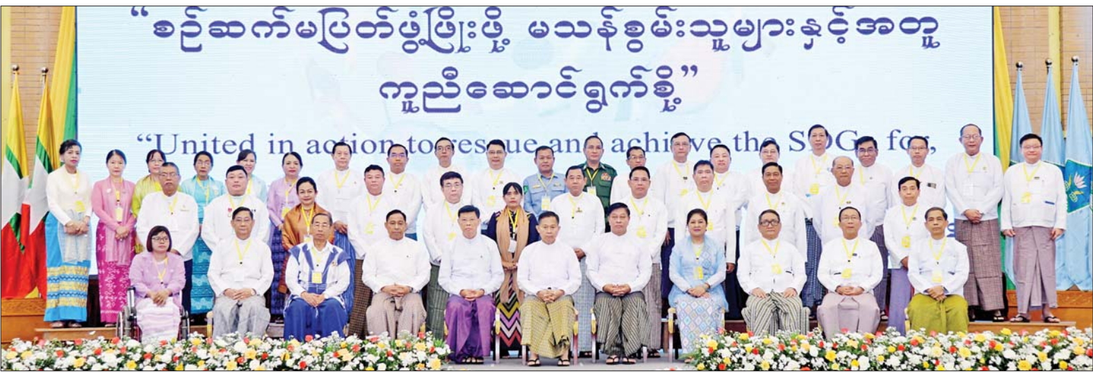
နိုင်ငံတော်စီမံအုပ်ချုပ်ရေးကောင်စီဒုတိယဥက္ကဋ္ဌ ဒုတိယဝန်ကြီးချုပ် ဒုတိယဗိုလ်ချုပ်မှူးကြီး စိုးဝင်း ၂၀၂၃ ခုနှစ် အပြည်ပြည်ဆိုင်ရာ မသန်စွမ်းသူများနေ့ အထိမ်းအမှတ် အခမ်းအနားသို့ တက်ရောက်လာကြသူများနှင့်အတူ စုပေါင်းမှတ်တမ်းတင် ဓာတ်ပုံရိုက်စဉ်။

မညီမျှမှုလျှော့ချရေး “ပန်းတိုင်အမှတ်(၁၀)” ၏ ရည်ရွယ်ချက်သည် နိုင်ငံတွင်းနှင့် နိုင်ငံများအကြား မညီမျှမှုလျှော့ချရေးပင်ဖြစ်ကြောင်း၊ မသန်စွမ်းသူများအနေနှင့် လူ့အဖွဲ့အစည်းအတွင်းတွင် ပါဝင်ဆောင်ရွက်ခွင့် နည်းပါးခြင်း၊ ခွဲခြားဆက်ဆံခြင်းတို့ကို ယနေ့အထိ ကြုံတွေ့နေရဆဲပင်ဖြစ်ကြောင်း၊ မြန်မာ့လူ့ဘောင်၏ ယဉ်ကျေးမှုနှင့် လူမှုဆက်ဆံရေးတွင် ကြီးသူကို ရိုသေ၊ ရွယ်တူကို လေးစား၊ ငယ်သူကို သနား၊ အားနည်းသူကို ဖေးမကူညီ ဆိုသည့် စိတ်နေစိတ်ထားများရှိပြီး ဖြစ်သည်နှင့်အညီ မသန်စွမ်းသူများကို လူမှုအသိုင်းအဝိုင်းထဲက ပစ်ပယ်ထားဘဲ အားပေးကူညီပေးလျက်ရှိကြောင်း၊ မသန်စွမ်းသူများကို စိတ်ပိုင်းဆိုင်ရာသာမက ရုပ်ပိုင်းဆိုင်ရာပါ ကျန်းမာကြံ့ခိုင်လာပြီး မသန်သော်လည်း စွမ်းသူများအဖြစ် ရောက်ရှိအောင် ကူညီပေးမသွားကြရမည်ဖြစ်ကြောင်း၊ ထို့ကြောင့် မသန်စွမ်းသူများ၏ အခွင့်အရေးများကို သိရှိနားလည်စေရေး အသိပညာပေးဆောင်ရွက်သွားရမည် ဖြစ်သကဲ့သို့ မသန်စွမ်းသူများအတွက် ဆောင်ရွက်ပေးနေသည့် ဝန်ဆောင်မှုများကို မသန်စွမ်းသူများ ကိုယ်တိုင်သိရှိစေရေးနှင့် လက်လှမ်းမီ ရယူအသုံးပြုနိုင်ရေးအတွက်လည်း စီစဉ်ဆောင်ရွက်ပေးသွားကြရန်လိုကြောင်း။