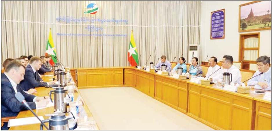
တွေ့ဆုံပွဲသို့ ရင်းနှီးမြှုပ်နှံမှုနှင့် နိုင်ငံခြားစီးပွား အဆင့်မြှင့်အရာရှိကြီးများ တက်ရောက်ကြကြောင်း ဆက်သွယ်ရေးဝန်ကြီးဌာနမှ ဒုတိယဝန်ကြီးနှင့် သိရသည်။ သတင်းစဉ်

နေပြည်တော် ဒီဇင်ဘာ ၁ ရင်းနှီးမြှုပ်နှံမှုနှင့် နိုင်ငံခြားစီးပွားဆက်သွယ်ရေးဝန်ကြီးဌာန ပြည်ထောင်စုဝန်ကြီး ဒေါက်တာကံဇော်သည် Aquarius နည်းပညာကုမ္ပဏီမှ မစ္စတာ ဗလာဒီမာ စတပ်ပါနော့ပဲ ဦးဆောင်သည့် ကိုယ်စားလှယ်အဖွဲ့အား ယနေ့နံနက်ပိုင်းတွင် နေပြည်တော်ရှိ ရင်းနှီးမြှုပ်နှံမှုနှင့် နိုင်ငံခြားစီးပွားဆက်သွယ်ရေးဝန်ကြီးဌာန ရုံးအမှတ်(၁)၌ လက်ခံ