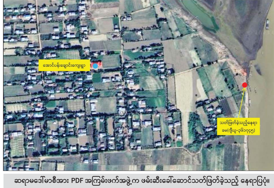
ဆရာမခေါ်ဆောင်သတ်ဖြတ်ခံခဲ့ရသည့် ဆရာမရုပ်ပုံ။

နေပြည်တော် ဒီဇင်ဘာ ၁ နိုင်ငံတော်အစိုးရအကြမ်းဖက် အုပ်စုအဖြစ် ကြေညာထားသည့် NUG၊ CRPH နှင့် ၎င်းတို့၏ လက်ဝေခံ PDF အမည်ခံ အကြမ်းဖက်သမားများသည် ရဟန်း သံဃာများ၊ နိုင်ငံ့ဝန်ထမ်းများ၊ အုပ်ချုပ်ရေးပိုင်းဆိုင်ရာ တာဝန် ရှိသူများနှင့် အေးချမ်းစွာနေထိုင် လျက်ရှိသော ပြည်သူများ အကြောက်တရားလွှမ်းမိုးစေရန် ၎င်းတို့နှင့် အမြင်အယူအဆမတူ သူများအား “သူလျှို၊ သတင်းပေး၊ ဒလန်” ဟု စွပ်စွဲ၍ ရက်စက်စွာ လုပ်ကြံသတ်ဖြတ်ခြင်းများကို ဥပဒေမဲ့ ကျူးလွန်လျက်ရှိသည်။