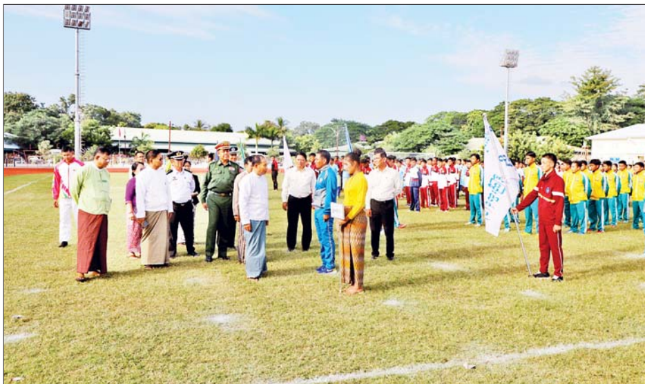
အားကစားသမားအစုအဖွဲ့ ရွတ်ဆိုကြပြီး တိုင်းဒေသ ကြီးဝန်ကြီးချုပ်နှင့် တာဝန်ရှိသူများက ပြိုင်ပွဲဝင် အသင်းများအား ရင်းရင်းနှီးနှီး လိုက်လံနှုတ်ဆက်