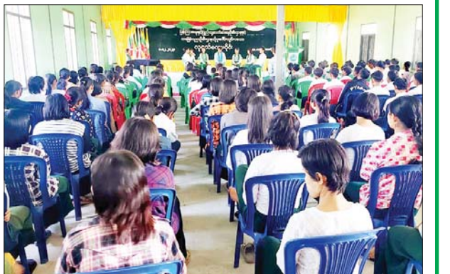
နိုးကြားထက်သန်ရေး ဟောပြောသည်။ ဆက်လက်၍ အလယ်တန်း၊ အထက်တန်း အဆင့် ကျောင်းသား ကျောင်းသူများက (၁၀၃) နှစ်မြောက် အမျိုးသားအောင်ပွဲနေ့ အထိမ်းအမှတ် စာစီစာကုံးပြိုင်ပွဲတွင် ပါဝင်ယှဉ်ပြိုင်ကြကြောင်း သိရသည်။