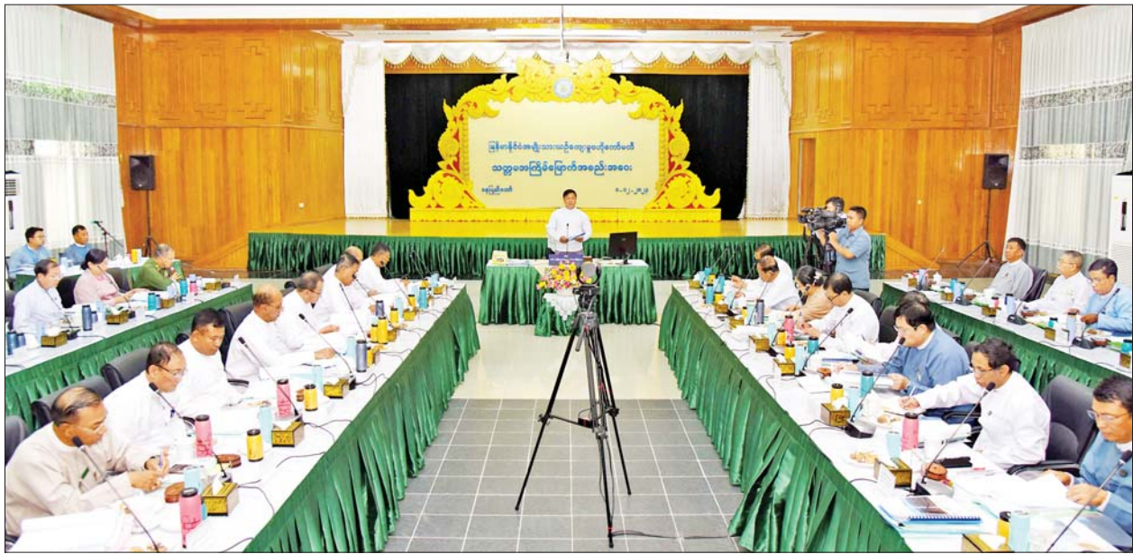
နိုင်ငံတော်စီမံအုပ်ချုပ်ရေးကောင်စီအဖွဲ့ဝင် ဒုတိယဝန်ကြီးချုပ်နှင့် ပြည်ထောင်စုဝန်ကြီး ဗိုလ်ချုပ်ကြီးတင်အောင်စန်း မြန်မာနိုင်ငံ အမျိုးသားယဉ်ကျေးမှုဗဟိုကော်မတီ သတ္တမအကြိမ်အစည်းအဝေးတွင် အမှာစကား ပြောကြားစဉ်။

နေပြည်တော် ဒီဇင်ဘာ ၁ မြန်မာနိုင်ငံ အမျိုးသား ယဉ်ကျေးမှုဗဟိုကော်မတီ သတ္တမ အကြိမ်အစည်းအဝေးကို ယနေ့ မွန်းလွဲပိုင်းတွင် နေပြည်တော်ရှိ သာသနာရေးနှင့် ယဉ်ကျေးမှု ဝန်ကြီးဌာန ယဉ်ကျေးမှုရတနာ ခန်းမ၌ ကျင်းပရာ မြန်မာနိုင်ငံ အမျိုးသား ယဉ်ကျေးမှုဗဟို ကော်မတီဥက္ကဋ္ဌ နိုင်ငံတော်စီမံ အုပ်ချုပ်ရေးကောင်စီ အဖွဲ့ဝင် ဒုတိယဝန်ကြီးချုပ်နှင့် ကာကွယ် ရေးဝန်ကြီးဌာန ပြည်ထောင်စု ဝန်ကြီး ဗိုလ်ချုပ်ကြီးတင်အောင်စန်း တက်ရောက် အမှာစကား ပြောကြားသည်။