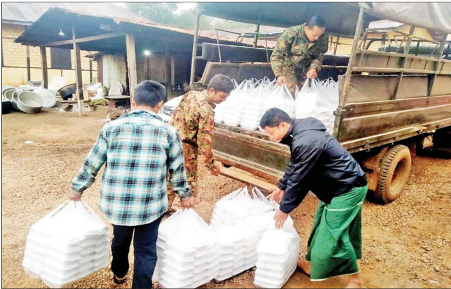
ရဟတ်ယာဉ်များဖြင့် လုံခြုံရေး လှူဒါန်းသည့် ဒံပေါက်ထမင်းဘူး တပ်ဖွဲ့ဝင်များ၏ လက်ဝယ် များနှင့်အတူ ရဟန်းသံဃာများ တပ်ဖွဲ့ဝင်များ၏ လက်ဝယ် အရောက် လိုက်လံပို့ဆောင်ပေး နှင့် ပြည်သူများက ရေးသားပေးပို့ သည့် "ရှေ့တန်းရောက်တပ်မတော် သားအားလုံး တိုက်ပွဲတိုင်း အောင်မြင်ပါစေ၊ ရေလိုအေးပြီး ပန်းလိုမွှေးပါစေ၊ တရားသော စစ် အောင်မြင်ပါစေ" စသည့် ဆုတောင်းမေတ္တာစာလွှာများပါရှိ ကြောင်း သိရသည်။ သတင်းစဉ်

နေပြည်တော် ဒီဇင်ဘာ ၁ - နိုင်ငံတော် ကာကွယ်ရေးနှင့် လုံခြုံရေးတာဝန်များကို စွမ်းစွမ်းတမ်းဆောင်ရွက်ရုံသော လုံခြုံရေး တပ်ဖွဲ့ဝင်များအတွက် စေတနာရှင်အလှူရှင် ပြည်သူများက အလှူငွေများ ပေးအပ် လှူဒါန်းလျက်ရှိသည့် အပြင် စားသောက်ဖွယ်ရာများကိုလည်း ပေးပို့လှူဒါန်းလျက်ရှိပါသည်။