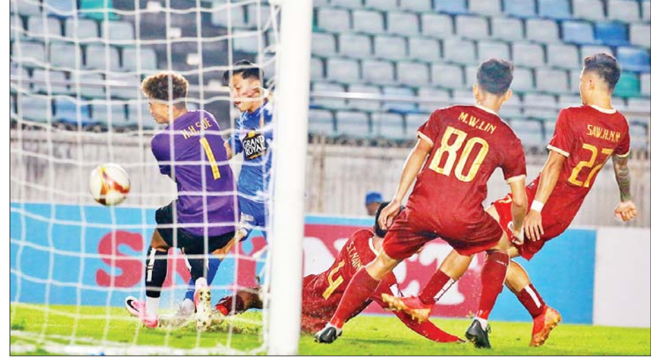
ရော့တီယူနိုက်တက်အသင်းနှင့် ဟံသာဝတီယူနိုက်တက်အသင်းတို့ ယှဉ်ပြိုင်ကစားကြစဉ်။

ရန်ကုန် ဒီဇင်ဘာ ၁ ၂၀၂၃ ရာသီ MNL အမှတ်ပေး ပြိုင်ပွဲ ပွဲစဉ် (၂၁) ပထမနေ့ကို ဒီဇင်ဘာ ၁ ရက်က ဆက်လက်ကျင်းပရာ ရော့တီအသင်းနှင့် ရန်ကုန်အသင်း နိုင်ပွဲဆက်ခဲ့သည်။ တစ်ဂိုး-ဂိုးမရှိဖြင့် အနိုင်ရ သုဝဏ္ဏတွင်း၌ ကျင်းပသည့်ပွဲတွင် ရော့တီအသင်းက ဟံသာဝတီအသင်းကို တစ်ဂိုး-ဂိုးမရှိဖြင့် အနိုင်ရခဲ့သည်။ ရော့တီအသင်းသည် တတိယနေရာမှ ဟံသာဝတီအသင်းကို အနိုင်ယူပြီး တန်းဆင်းဇုန်မှ ရုန်းထွက်နိုင်ခဲ့သည်။ စာမျက်နှာ ၁၂ ကော်လံ ၅ သို့ ❖