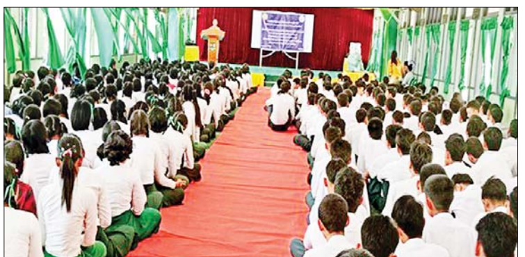
ခရိုင်(ပြန်/ဆက်)

ဟောပြောပွဲတွင် အမှတ်(၇)အခြေခံပညာအထက်တန်း ကျောင်း ကျောင်းအုပ်ချုပ်သူအရာရှိ ဗိုလ်မှူးသန်းဇော်က အဖွင့် အမှာစကားပြောကြားပြီး ဧရာဝတီတိုင်းဒေသကြီး ပြည်သူ့ ကျန်းမာရေးဦးစီးဌာနက ခုခံကျ/ကာလသားရောဂါအကြောင်း သိကောင်းစရာများအား အသိပညာပေးဟောပြောခဲ့ရာ ဆရာမများနှင့် ကျောင်းသား ကျောင်းသူများ တက်ရောက်ခဲ့ကြ ကြောင်း သိရသည်။