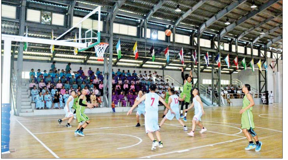
ယှဉ်ပြိုင်ကစားခဲ့ကြကြောင်းနှင့် တရုတ်ပြည်သူ့ လွတ်မြောက်ရေးတပ်မတော်(ရေ)မှ အရာရှိ၊ စစ်သည် များအနေဖြင့် ရန်ကုန်မြို့ရှိ အထင်ကရနေရာများသို့ လေ့လာရေးခရီး သွားရောက်လည်ပတ်ခြင်းများ ဆောင်ရွက်ခဲ့ကြကြောင်း သိရသည်။