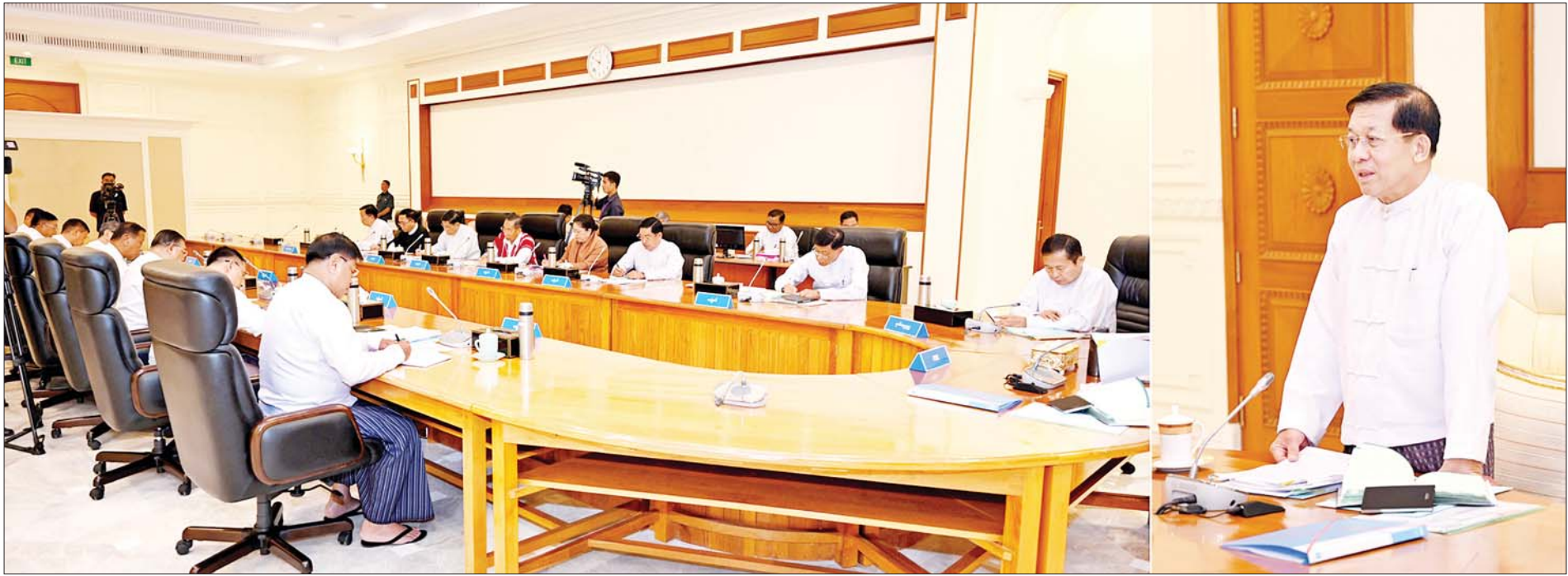
နိုင်ငံတော်စီမံအုပ်ချုပ်ရေးကောင်စီဥက္ကဋ္ဌ နိုင်ငံတော်ဝန်ကြီးချုပ် ဗိုလ်ချုပ်မှူးကြီးမင်းအောင်လှိုင် နိုင်ငံတော်စီမံအုပ်ချုပ်ရေးကောင်စီ အစည်းအဝေး (၆/၂၀၂၃)တွင် အမှာစကားပြောကြားစဉ်။