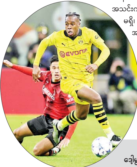
အေစီမီလန်အသင်းနှင့် ဒေါ့မွန်အသင်းတို့ ယှဉ်ပြိုင်ကစားစဉ်။

ဘာစီလိုနာအသင်းဟာ ပေါ်တိုအသင်းကို နှစ်ဂိုး-တစ်ဂိုး၊ ဒေါ့မွန်အသင်းက အေစီမီလန်အသင်းကို သုံးဂိုး-တစ်ဂိုး၊ လာဇီယိုအသင်းက ဆဲလ်တစ်အသင်းကို နှစ်ဂိုး-ဂိုးမရှိ၊ အက်သလက်တီကိုမက်ဒရစ်အသင်းက ဖီယင်နူအသင်းကို သုံးဂိုး-တစ်ဂိုးတို့ဖြင့် အသီးသီးအနိုင်ရရှိခဲ့ပြီး နောက်တစ်ဆင့် တက်လှမ်းခဲ့တာဖြစ်ပါတယ်။ ချန်ပီယံလိဂ် ဖလားကို ငါးကြိမ် ဆွတ်ခူးထားတဲ့ ဘာစီလိုနာအသင်းဟာ ၂၀၂၀-၂၀၂၁ ဘောလုံးရာသီနောက်ပိုင်း စာမျက်နှာ ၁၂ ကော်လံ ၁ သို့ ❖