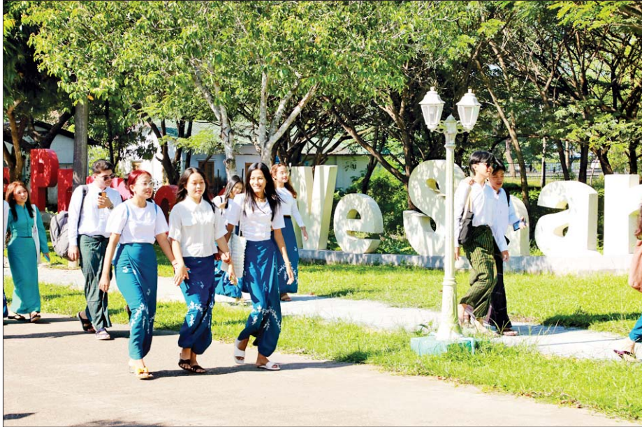
အမျိုးသားယဉ်ကျေးမှုနှင့် အနုပညာတက္ကသိုလ်(ရန်ကုန်) ၂၀၂၃-၂၀၂၄ ပညာသင်နှစ် သင်တန်းများ အားလုံး နိုဝင်ဘာ ၂၃ ရက်တွင် စတင်ဖွင့်လှစ်ရာ ကျောင်းတက်ရောက်လာသည့် ကျောင်းသား ကျောင်းသူများကို တွေ့ရစဉ်။