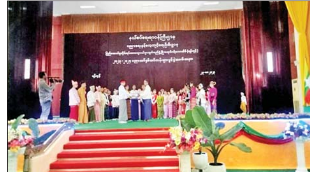
ပြည်ထောင်စုတိုင်းရင်းသားလူငယ်များ စွမ်းရည်ဖွံ့ဖြိုးရေး ဒီဂရီကောလိပ်(ရန်ကုန်)၌ ၂၀၂၃- ၂၀၂၄ ပညာသင်နှစ် မောင်မယ် သစ်လွင်ကြိုဆိုပွဲအခမ်းအနား ကျင်းပစဉ်။