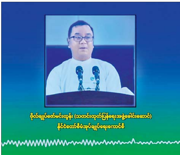
ပိုလ်ချုပ်ဇော်မင်းထွန်း (သတင်းထုတ်ပြန်ရေးအဖွဲ့ခေါင်းဆောင်) နိုင်ငံတော်စီမံအုပ်ချုပ်ရေးကောင်စီ

ဒီနေ့မှာတော့ မနက် ၉ နာရီ ၄၅ မိနစ်လောက်မှာ မူဆယ်မြို့နယ် ကောင်းခံကျေးရွာအနီးမှာရှိတဲ့ Seven ဟွာကျင့်ကုန်တင်ကုန်ချ ကားကြီးဝင်း MNDA နဲ့ TNLA ပူးပေါင်းအဖွဲ့ သောင်းကျန်းသူအဖွဲ့က ကောင်းခံရွာရဲ့ တောင်ဘက်ကနေ Drone တွေနဲ့ကားတွေပေါ် Drop Bomb များ ကြဲချခဲ့တာရှိပါတယ်။ အဲဒီမှာ ကျွန်တော်တို့ တရုတ်နိုင်ငံ ဘက်မှ မြန်မာနိုင်ငံဘက်ကို Export တင်သွင်းလာတဲ့ကား ၂၅၈ စီး ရှိပါတယ်။ အဲဒီကတော့ လူသုံးကုန်ပစ္စည်းတွေ၊ ဆေးဝါးပစ္စည်းတွေ၊ အဝတ်အထည်တွေ၊ ဆောက်လုပ်ရေးသုံးပစ္စည်းတွေ တင်ထားတဲ့ ကားတွေဖြစ်ပါတယ်။ ဒီကားတွေဟာ လမ်းမှာ ကျွန်တော်တို့ မူဆယ်-မန္တလေး လမ်းမကြီးတစ်လျှောက်မှာ TNLA နဲ့ MNDA အဖွဲ့တွေက ကားလမ်းတွေဖျက်ဆီးပြီး တံတားတွေချိုးထားတဲ့အတွက် ဒီနေရာမှာ ရပ်တန့်ထားတဲ့ကားတွေဖြစ်ပါတယ်။ အဲဒီ ၂၅၈ စီးထဲက အစီး ၁၂၀ လောက် မီးလောင်ပျက်စီးခဲ့ပါတယ်။ ဒါကိုကျွန်တော်တို့ မူဆယ် မှာရှိတဲ့ မီးသတ်တပ်ဖွဲ့က မီးသတ်ကားလေးစီး၊ လုံခြုံရေးဆောင်ရွက် ပေးနေတဲ့ တပ်မတော်သားတွေ၊ ပြည်သူ့စစ်တပ်ဖွဲ့ဝင်တွေ ပူးပေါင်းပြီး မီးငြိမ်းသတ်ခဲ့ရပါတယ်။ မီးလောင်လွယ်တဲ့ပစ္စည်းတွေဖြစ်တဲ့အတွက် ကြောင့်မလို့ မီးအရှိန်ပြင်းပါတယ်။ ဒီညနေပိုင်း ၄ နာရီလောက်မှာ မီးငြိမ်းသတ်နိုင်ခဲ့ပါတယ်။ ကားအစီး ၁၂၀ လောက် မီးလောင်ပျက်စီး