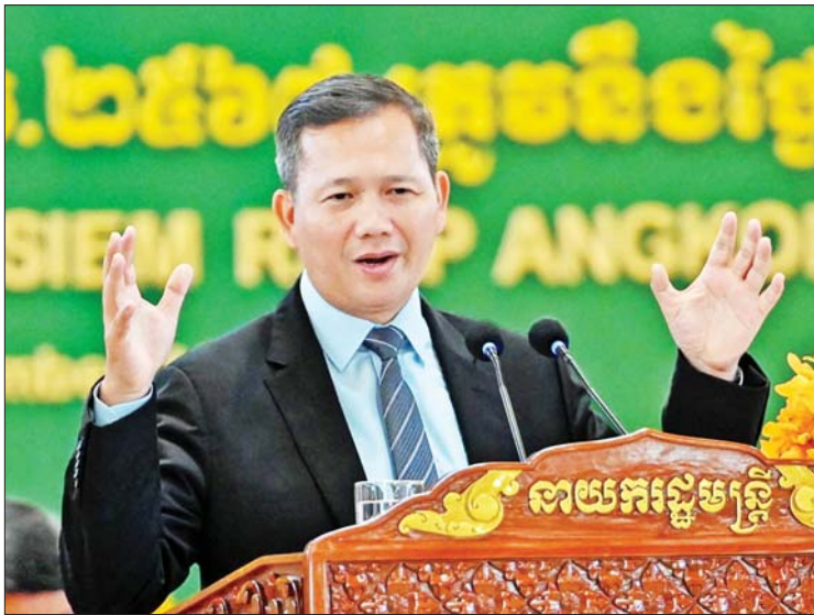
အခြေခံအဆောက်အအုံ ရင်းနှီးမြှုပ်နှံမှု သဘောတူညီချက်များ၏ အကျိုးကျေးဇူး နှင့် ဒေသတွင်း လွတ်လပ်သော ကုန်သွယ်မှု များကြောင့် ကမ္ဘောဒီးယားနိုင်ငံ၏

၂၀၂၅ ခုနှစ်အတွက် အစောင့်အရှောက် ဝန်ကြီးဌာနက ဝန်ကြီးချုပ် ဖော့ဆွတ်ဝင်းက နိုင်ငံတော်အစည်းအဝေးတွင် ပြောကြားခဲ့သည်။ ဝန်ကြီးချုပ်က နိုင်ငံတော်အစည်းအဝေးတွင် ပြောကြားခဲ့သည်။