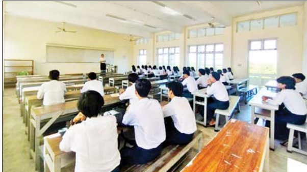
ကွန်ပျူတာတက္ကသိုလ်(ပုသိမ်)၌ ကျောင်းသား ကျောင်းသူများ အေးချမ်းပျော်ရွှင်စွာ ပညာသင်ကြားလျက်ရှိသည်ကို တွေ့ရစဉ်။