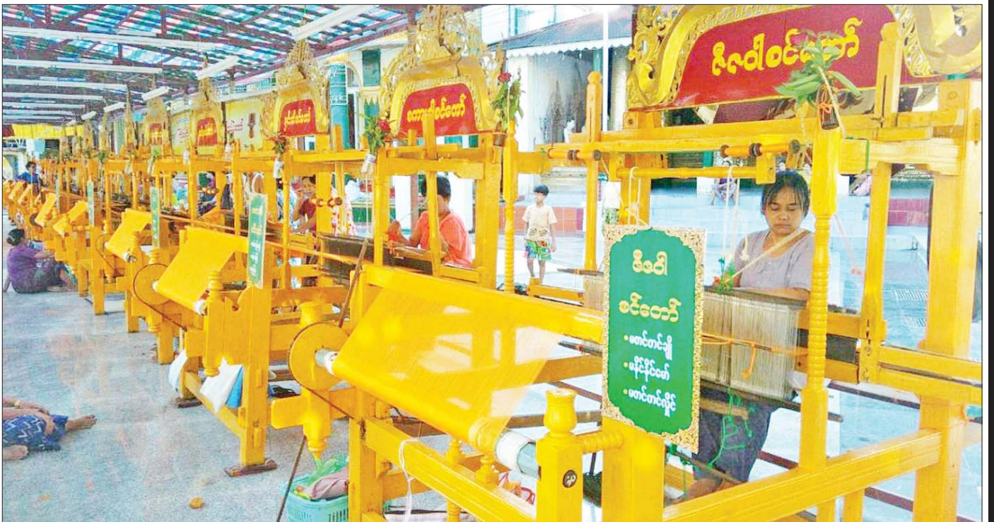
ပုသိမ်မြို့၊ ရွှေမုဋ္ဌောစေတီတော်မြတ်ကြီးတွင် (၃၁)ကြိမ်မြောက် မသိုးသင်္ကန်းကပ်လှူပွဲ ကျင်းပစဉ်။

ကထိန်ပွဲပေါ်ပေါက်လာပုံမှာ ဗုဒ္ဓဘုရားရှင် သက်တော်ထင်ရှားရှိစဉ်အခါက ဘဒ္ဒဝဂ္ဂိုဠ်နောင် သုံးကျိပ်တို့ဟာ ပုထုဇဉ်များပီပီ မိဂဒါဝုန်တောမှာ ဇနီးမယားတို့နဲ့ ပျော်ပါးနေကြရာ အမျိုးသမီးတစ်ဦး ဟာ လက်ဝတ်ရတနာတွေကို ခိုးယူထွက်ပြေးပါ တယ်။ မင်းသားတို့က လိုက်လံရှာဖွေရာ ဥရုဝေလ တောရဲ့ သစ်ပင်အောက်တွင် သီတင်းသုံးနေတော်မူ တဲ့ ဘုရားရှင်ကို တွေ့မြင်ခဲ့ပါတယ်။ မင်းသားတို့က “အရှင်ဘုရား၊ ဤအနီးအနားတွင် မိန်းမတစ်ဦးကို တွေ့မိပါသလား”လို့ မေးမြန်းတဲ့အခါ မြတ်စွာ ဘုရားက “မင်းသားတို့၊ မည်သည့်အကြောင်းကြောင့် မိန်းမတစ်ဦးကို လိုက်လံရှာဖွေနေသနည်း”ဟု ပြန်လည်မေးမြန်းတော်မူပါတယ်။ ရှာဖွေရခြင်းရဲ့ အကြောင်းစုံကို လျှောက်တင်လိုက်ရာ မြတ်စွာ ဘုရားက “ပျောက်နေသောမိန်းမကို ရှာဖွေခြင်းနှင့် မိမိကိုယ်ကိုရှာဖွေခြင်းဟူသော ရှာဖွေခြင်းနှစ်မျိုး တွင် မည်သည့်အရာက သင်တို့အတွက် ပို၍