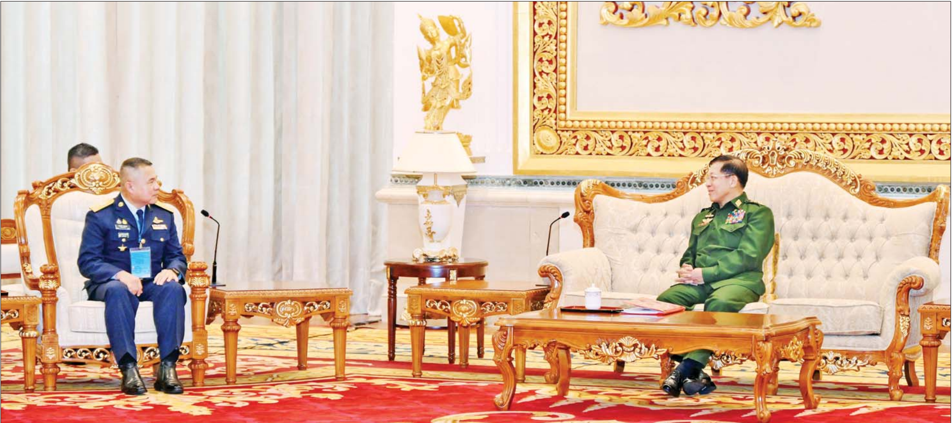
နိုင်ငံတော်စီမံအုပ်ချုပ်ရေးကောင်စီဥက္ကဋ္ဌ တပ်မတော်ကာကွယ်ရေးဦးစီးချုပ် ဗိုလ်ချုပ်မှူးကြီး မင်းအောင်လှိုင် ထိုင်းဘုရင့်လေတပ်ဦးစီးချုပ် Air Chief Marshal Punpakdee Pattanakul အား လက်ခံတွေ့ဆုံ စဉ်။