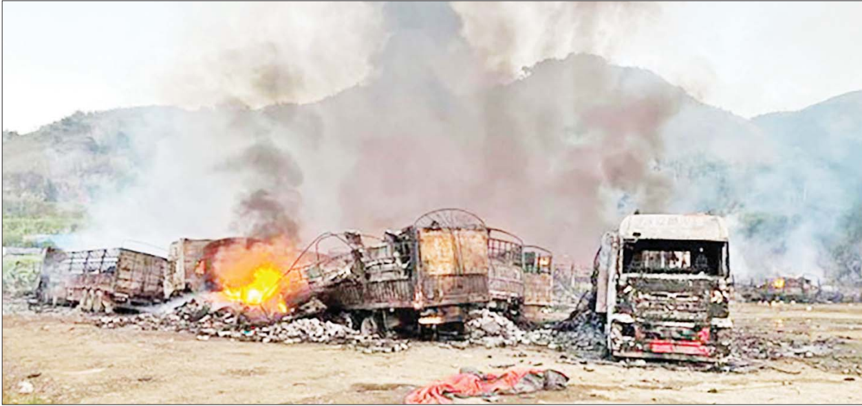
MNDAA ၊ TNLA အဖွဲ့နှင့် PDF အမည်ခံပူးပေါင်းအကြမ်းဖက်သမားများက မြန်မာ-တရုတ် နှစ်နိုင်ငံကုန်သွယ်ဂိတ် ကျင်စန်းကျောအတွင်းရှိ ဆဲပင်းဟွာကျင့်ကုမ္ပဏီ သွင်းကုန်ကားဝင်းအတွင်းသို့ Drop Bomb များဖြင့် ပစ်ချတိုက်ခိုက်မှုကြောင့် မော်တော်ယာဉ်များ မီးလောင်ပျက်စီးမှုကို တွေ့ရစဉ်။

နေပြည်တော် နိုဝင်ဘာ ၂၃ MNDAA၊ TNLA အဖွဲ့နှင့် PDF အမည်ခံ ပူးပေါင်းအကြမ်းဖက်သမားများအနေဖြင့် ရှမ်းပြည်နယ် (မြောက်ပိုင်း)ဒေသအတွင်း ကုန်စည်စီးဆင်းမှုများ ရပ်တန့်စေရန်နှင့် ဒေသတွင်းတည်ငြိမ်အေးချမ်းမှုပျက်ပြားစေရန်ရည်ရွယ်၍ စစ်ရေးပစ်မှတ်မဟုတ်သည့် အရပ်သားများနေထိုင်ရာ ရပ်ကွက်များ၊ မြို့ရွာများ၊ ပညာရေးကျောင်းများ၊ သာသနိက အဆောက်အအုံများကို လက်နက်ကြီးများဖြင့် ပစ်ခတ်တိုက်ခိုက်ခြင်း၊ Drop Bomb များဖြင့် ပစ်ချတိုက်ခိုက်ခြင်း စသည့် အကြမ်းဖက်လုပ်ရပ်များကို လုပ်ဆောင်လျက်ရှိသည်။ စာမျက်နှာ ၁၅ ကော်လံ ၁၁၅