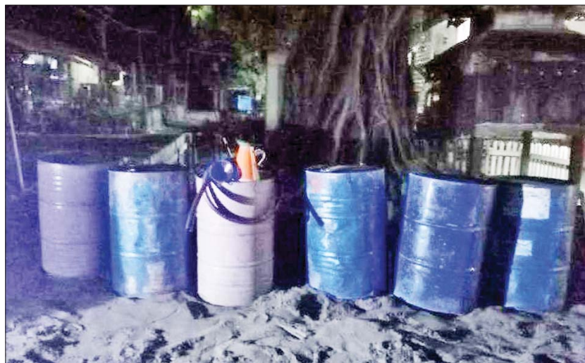
စစ်ကိုင်းတိုင်းဒေသကြီး၌ သိမ်းဆည်းရမိမှု။

နေပြည်တော် နိုဝင်ဘာ ၂၃ တရားမဝင် ကုန်သွယ်မှုတိုက်ဖျက်ရေး ဦးဆောင်ကော်မတီ၏ ကြီးကြပ်ကွပ်ကဲမှုဖြင့် တရားမဝင်ကုန်သွယ်မှုများကို ဥပဒေနှင့်အညီ ထိရောက်စွာ တားဆီးအရေးယူနိုင်ရေး ဆောင်ရွက်လျက်ရှိရာ နိုဝင်ဘာ ၂၀ ရက်တွင် ကချင်ပြည်နယ် တရားမဝင်ကုန်သွယ်မှု တိုက်ဖျက်ရေးအထူးအဖွဲ့၏ စီမံခန့်ခွဲမှုဖြင့် တာဝန်ကျပူးပေါင်းအဖွဲ့က စစ်ဆေးမှုများ ဆောင်ရွက်ခဲ့ရာ ဝိုင်းမော်မြို့နယ် စန်းကား ကျေးရွာအုပ်စု ဧရာဝတီမြစ်ကမ်းစပ်၌ တရားမဝင် ရွှေတူးဖော်ရာတွင် အသုံးပြုသည့် လေးလုံးထိုးအင်ဂျင်တပ်စက်လှေ လေးစင်း (ခန့်မှန်းတန်ဖိုးငွေကျပ် ၄၀၀၀၀၀)ကို သိမ်းဆည်းရမိခဲ့ပြီး မြန်မာ့သတ္တုတွင်းဥပဒေနှင့် အညီ အရေးယူဆောင်ရွက်လျက်ရှိသည်။