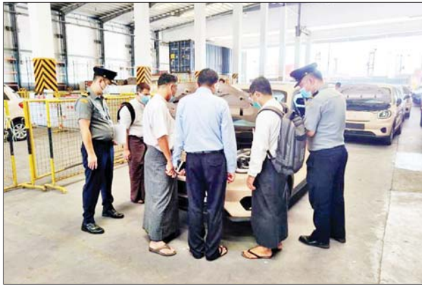
Essential Motors Co., Ltd. မှ တင်သွင်းလာသော တရုတ်နိုင်ငံ ထုတ် BYD Atto3 အမျိုးအစား လျှပ်စစ်သုံးယာဉ်များ၊ Myanmar

နေပြည်တော် နိုဝင်ဘာ ၂၃ အမျိုးသားအဆင့် လျှပ်စစ်သုံး ယာဉ်နှင့် ဆက်စပ်လုပ်ငန်းများ ဖွံ့ဖြိုးတိုးတက်ရေး ဦးဆောင် ကော်မတီ၏ ခွင့်ပြုချက်ဖြင့် Grand Sirius Co., Ltd. မှ တင်သွင်းလာသော တရုတ်နိုင်ငံ ထုတ် NETA U နှင့် NETA V အမျိုးအစား လျှပ်စစ်သုံးယာဉ်များ၊ N.P.K Motors Co., Ltd. မှ တင်သွင်းလာသော တရုတ်နိုင်ငံ ထုတ် Leapmotor T03 (Luxury) အမျိုးအစား လျှပ်စစ်သုံးယာဉ်များ၊