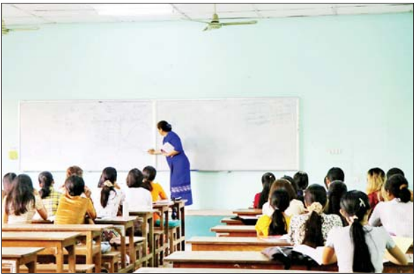
မိတ္ထီလာစီးပွားရေးတက္ကသိုလ်၌ ကျောင်းသား ကျောင်းသူများ အေးချမ်းပျော်ရွှင်စွာ ပညာသင်ကြားလျက်ရှိသည်ကို တွေ့ရစဉ်။ သိန်းမြင့်ကျော်(မိတ္ထီလာ)