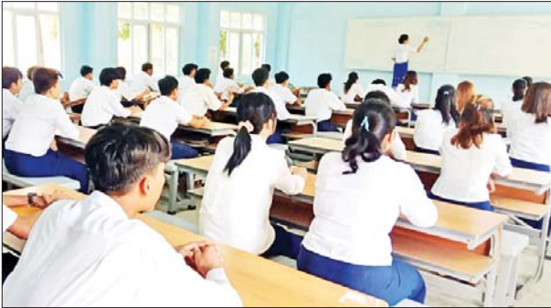
နည်းပညာတက္ကသိုလ်(ပုသိမ်)၌ ကျောင်းသား ကျောင်းသူများ အေးချမ်းပျော်ရွှင်စွာ ပညာသင်ကြားလျက်ရှိသည်ကို တွေ့ရစဉ်။ ခရိုင်(ပြန်/ဆက်)