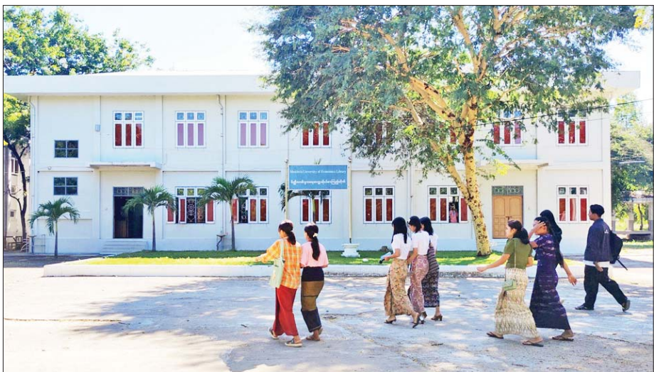
မိတ္ထီလာစီးပွားရေးတက္ကသိုလ်သို့ ကျောင်းတက်ရောက်လာသည့် ကျောင်းသား ကျောင်းသူများကို တွေ့ရစဉ်။ သိန်းမြင့်ကျော်(မိတ္ထီလာ)