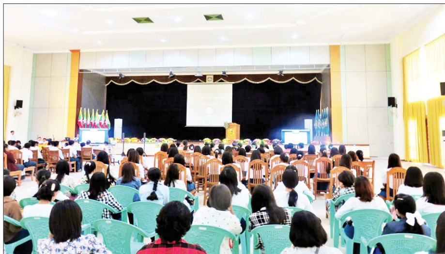
ကွန်ပျူတာတက္ကသိုလ်(မကွေး)၌ မောင်မယ်သစ်လွင်ကြိုဆိုပွဲ အခမ်းအနားကို နိုဝင်ဘာ ၂၃ ရက် နံနက်ပိုင်းက ကျင်းပစဉ်။ ဇော်ဘီ