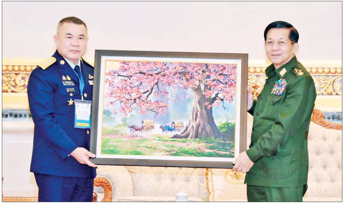
နိုင်ငံတော်စီမံအုပ်ချုပ်ရေးကောင်စီဥက္ကဋ္ဌ တပ်မတော်ကာကွယ်ရေးဦးစီးချုပ် ဗိုလ်ချုပ်မှူးကြီးမင်းအောင်လှိုင် ထိုင်းဘုရင့်လေတပ်ဦးစီးချုပ် Air Chief Marshal Punpakdee Pattanakul အား အမှတ်တရလက်ဆောင်ပစ္စည်းပေးအပ်စဉ်။