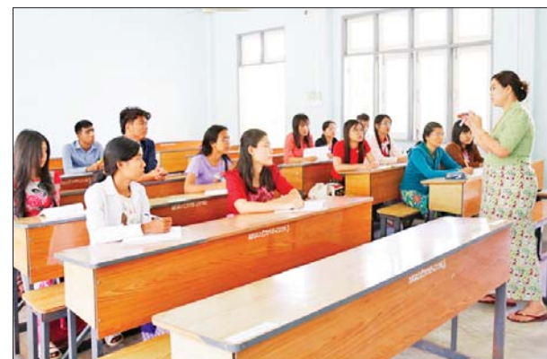
မကွေးတက္ကသိုလ်၌ ကျောင်းသား ကျောင်းသူများ အေးချမ်းပျော်ရွှင်စွာ ပညာသင်ကြားလျက်ရှိသည်ကို တွေ့ရစဉ်။