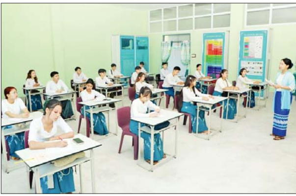
အမျိုးသားယဉ်ကျေးမှုနှင့် အနုပညာတက္ကသိုလ်(ရန်ကုန်)၌ ကျောင်းသား ကျောင်းသူများ အေးချမ်းပျော်ရွှင်စွာ ပညာသင်ကြားလျက်ရှိသည်ကို တွေ့ရစဉ်။ မျိုးယဉ်နု(ရန်ကုန်)