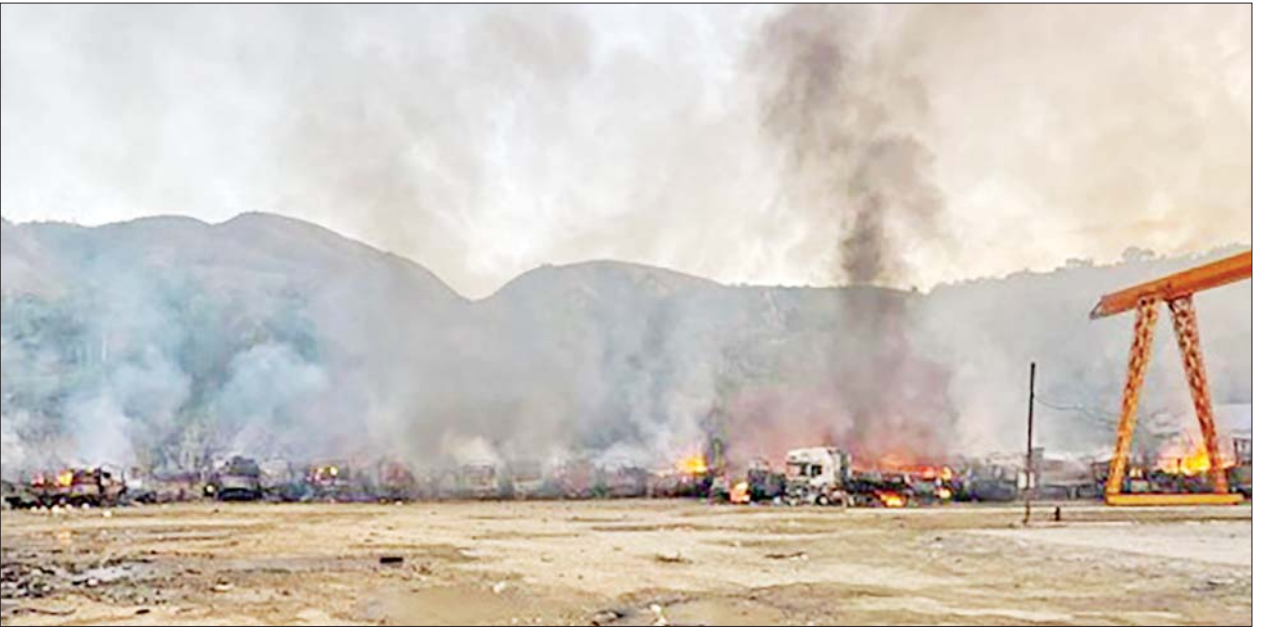
MNDA၊ TNLA အဖွဲ့နှင့် PDF အမည်ခံပူးပေါင်းအကြမ်းဖက် သမားများက မြန်မာ-တရုတ် နှစ်နိုင်ငံကုန်သွယ်ကိတ် ကျင်စန်း ကျောအတွင်းရှိ ဆဲဗင်းဟွာကျင့် ကုမ္ပဏီ သွင်းကုန်ကားဝင်း အတွင်းသို့ Drop Bomb များ ဖြင့် ပစ်ချတိုက်ခိုက်မှုကြောင့် မော်တော်ယာဉ်များ မီးလောင် ပျက်စီးမှု(အပေါ်ပုံ)နှင့် မြို့နယ် မီးသတ်တပ်ဖွဲ့ဝင်များ၊ ပြည်သူ့ စစ်ဌာနတပ်ဖွဲ့ဝင်များ၊ ဒေသခံ ပြည်သူများ ပူးပေါင်း၍ မီးငြိမ်း သတ်စဉ်။(ယာဝုံ)

ထိုကဲ့သို့ မီးလောင်ကျွမ်းမှုများ ဖြစ်ပေါ်ခဲ့သဖြင့် မြို့နယ်မီးသတ် တပ်ဖွဲ့ဝင်များ၊ ပြည်သူ့စစ်ဌာန တပ်ဖွဲ့ဝင်များ၊ ဒေသခံပြည်သူများ နှင့် ပူးပေါင်း၍ မီးသတ်ယာဉ်များ အသုံးပြုကာ မီးငြိမ်းသတ်နိုင်ရေး ကြိုးပမ်း ဆောင်ရွက်ခဲ့ကြပြီး အနီးဝန်းကျင်ရှိ လုံခြုံရေးတပ်ဖွဲ့