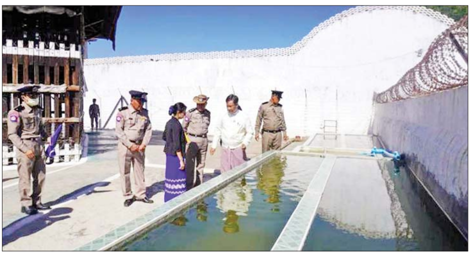
အချုပ်သူများ လေ့လာဖတ်ရှုနိုင်ရန်အတွက် ဗဟု သုတ ရှယ်ရာ စာအုပ်စာပေ ၁၀၀ ကို ကော်မရှင် ကလျာဒါန်းခွဲရာ မိတ္တီလာအကျဉ်းထောင် တာဝန်ခံ အရာရှိက လက်ခံရယူသည်။ အဆိုပါအဖွဲ့၏ စစ်ဆေးတွေ့ရှိချက်နှင့် အကြံပြု ချက်များကို အရေးယူ ဆောင်ရွက်ပေး နိုင်ရေးအတွက် သက်ဆိုင်ရာသို့ အကြံပြုပေးပို့သွားမည် ဖြစ်ကြောင်း သိရသည်။ သတင်းစဉ်

ထောင်ဝင်စာပစ္စည်းများ စုံလင်စွာရရှိခြင်း ရှိ၊ မရှိ၊ ရသင့်ရထိုက်သော အသုံးအဆောင်ပစ္စည်းများ ရရှိ ခြင်း ရှိ၊ မရှိနှင့် ညည်းပန်းနှိပ်စက်မှု ရှိ၊ မရှိ စသည် တို့ကို မေးမြန်းခဲ့ပြီး သီးခြားလွတ်လပ်စွာ တွေ့ဆုံခွင့် တောင်းခံသူ အကျဉ်းသားများကိုလည်း သီးခြား တွေ့ဆုံမေးမြန်း မှတ်တမ်းတင်ခဲ့သည်။ ယင်းနောက် ကော်မရှင်အဖွဲ့သည် အကျဉ်းသား အကျဉ်းသူ၊ အချုပ်သား အချုပ်သူများ၏ အိပ်ဆောင် များ၊ ဆေးခန်း၊ စာကြည့်တိုက်၊ စားဖိုကြီး၊ ရိက္ခာ ဂိုဒေါင်၊ ရေသန့်စက်၊ သုံးရေ ကန်များ၊ အတွင်း/ အပြင်မိလ္လာများ သန့်ရှင်းမှု ရှိ၊ မရှိ စသည်တို့ကို ကြည့်ရှုစစ်ဆေးသည်။ ထို့နောက် အကျဉ်းသား အကျဉ်းသူ၊ အချုပ်သား