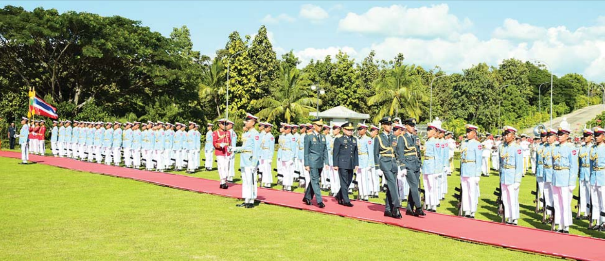
ကာကွယ်ရေးဦးစီးချုပ်(လေ) ဗိုလ်ချုပ်ကြီး ထွန်းအောင်နှင့် ထိုင်းဘုရင့်လေတပ်ဦးစီးချုပ် Air Chief Marshal Punpakdee Pattanakul တို့ ဂုဏ်ပြုတပ်ဖွဲ့၏ အလေးပြုခြင်းကိုခံယူပြီး ဂုဏ်ပြုတပ်ဖွဲ့အား ကြည့်ရှုစစ်ဆေးစဉ်။

လေတပ်ဦးစီးချုပ်နှင့် ထိုင်းဘုရင့် လေတပ်မှ အရာရှိကြီးများ တက်ရောက်ကြသည်။ ညနေပိုင်းတွင် ကာကွယ်ရေး ဦးစီးချုပ်(လေ) ဗိုလ်ချုပ်ကြီး ထွန်းအောင်က တည်ခင်းဧည့်ခံ သော ဂုဏ်ပြုဥပဒေစာစားပွဲကို Jasmine ဟိုတယ်ရှိ ပုဂံဆောင် ကစွပဒီခန်းမ၌ ပြုလုပ်ရာ ထိုင်းဘုရင့် လေတပ်ဦးစီးချုပ်နှင့် ဇနီးဦးဆောင်သော ကိုယ်စားလှယ် အဖွဲ့ဝင်များနှင့် တပ်မတော်(လေ) မှ အရာရှိကြီးများ တက်ရောက်ကာ ညစာကိုအတူတကွ ရင်းရင်းနှီးနှီး သုံးဆောင်ခဲ့ကြပြီး ညစာမသုံး ဆောင်မီနှင့် သုံးဆောင်နေစဉ် အတွင်း ဖျော်ဖြေရေးအဖွဲ့များက တေးသံသဘာများဖြင့် ဖျော်ဖြေကြ သည်။ ထို့ပြင် ထိုင်းဘုရင့်လေတပ်ဦးစီး ချုပ်နှင့်ဇနီး ဦးဆောင်သော ကိုယ်စားလှယ် အဖွဲ့ဝင်များသည် ယနေ့ညနေပိုင်းတွင် ပြည်ထောင်စု နယ်မြေ နေပြည်တော် ပဗ္ဗသီရိ မြို့နယ်ရှိ ဥပုတသန္တီစေတီတော် မြတ်ကြီးအား ဖူးမြော်ကြည့်ညှိပြီး ဆင်ဖြူတော်များအား သွားရောက် လေ့လာကြည့်ရှုခြင်းနှင့် ဒက္ခိဏ သီရိမြို့နယ်ရှိ ဗုဒ္ဓဥယျာဉ် ဝတ္ထု ကံတော်တွင် တည်ထားပူဇော် အောင်မြင်ခဲ့သည့် ကမ္ဘာပေါ်ရှိ ထိုင်တော်မူကျောက်ဆစ်ဗုဒ္ဓရုပ်ပွား တော်များအနက် ဉာဏ်တော်အမြင့် ဆုံးဖြစ်သည့် မာရင်ဇယဗုဒ္ဓရုပ်ပွား တော်မြတ်ကြီးအား ပန်း၊ ရေချမ်း၊ ဆီမီးများ ကပ်လှူပူဇော် ဖူးမြော် ကြည့်ညှိခဲ့ပြီး ကျောက်စာရုံစေတီ တော်များနှင့် သာသနိကအဆောက် အအုံများအား လှည့်လည်ကြည့်ရှု လေ့လာ ရာ တာဝန်ရှိသူများက လိုက်လံ ရှင်းလင်းပြသခဲ့ကြ ကြောင်း သိရသည်။ သတင်းစဉ်