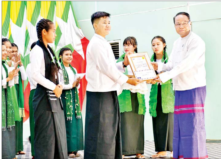
ထို့နောက် အခြေခံပညာအဆင့် စကားရည်လုပ်ငန်းပြုလုပ်ပွဲတွင် အကဲဖြတ်ခိုင်အဖြစ်ဆောင်ရွက်မည့် ခိုင်အဖွဲ့များနှင့် မိတ်ဆက်တင်ပြပြီး စကားရည်လုပ်ငန်းပြုလုပ်ပွဲကို ကျင်းပရာ ဘားအံ၊ လှိုင်းဘွဲ့၊ ကော့ကရိတ်၊ မြဝတီ၊ သံတောင်ကြီး၊ ဖာပွန်မြို့နယ်များရှိ အခြေခံပညာကျောင်းများမှ ကျောင်းသား ကျောင်းသူများက ကျောင်းတွင် ကျောင်းသား ကျောင်းသူများအား Cell Phone ကိုင်ဆောင်ခွင့်ပြုသင့်သည်၊ တစ်ဦးချင်း ခရီးသွားခြင်းသည် အဖွဲ့လိုက်ခရီးသွားခြင်းထက် ပိုကောင်းသည်၊ Social Media သည်စိတ်ကျန်းမာရေး

ပြိုင်ပွဲတွင် ကရင်ပြည်နယ်ဝန်ကြီးချုပ် ဦးစောမြင့်ဦးက စကားပြောနည်းအမျိုးမျိုးအနက် စကားရည်လုပ်ငန်းပြုလုပ်ခြင်းသည် အခြားပြောဆိုခြင်း များထက်ပိုမိုခက်ခဲပြီး စကားလုံးပြောင်းရွှေ့ခြင်း၊ စကားအသုံးအနှုန်း ကောင်းမွန်ခြင်း၊ လှုပ်ရှား တက်ကြွသော ဟန်အမူအရာရှိခြင်း၊ အင်အား ကောင်းသောစကားလုံးများနှင့် ချက်ကျလက်ကျ ပီပီပြင်ပြင် ပြောဆိုနိုင်ခြင်းအပြင် ပရိသတ်၏ ခံစားချက်နှင့်အတွေးကို မိမိဘက်သို့ပါအောင် ဆွဲဆောင် ပြောဆိုနိုင်စွမ်း ရှိရမည်ဖြစ်ကြောင်း၊ စကားပြောစွမ်းရည် ထက်မြက်လာရန် စကားရည်လုပ်ငန်းများကျင်းပခြင်းဖြင့် မြန်မာစာပေကို ချစ်မြတ်နိုးကာ မြန်မာစာအခြေခံခိုင်မာပြီး ကျွမ်းကျင်စွာ တတ်မြောက်၍ လက်တွေ့ဘဝတွင်လည်း ပိုမို အကျိုးဖြစ်ထွန်းစေမည့် အပြောစွမ်းရည်ရရှိစေရန် ကျောင်းသားလူငယ်များ၏ လေ့လာသင်ယူမှုကို မြှင့်တင်ပေးကြစေလိုကြောင်း ပြောကြားသည်။