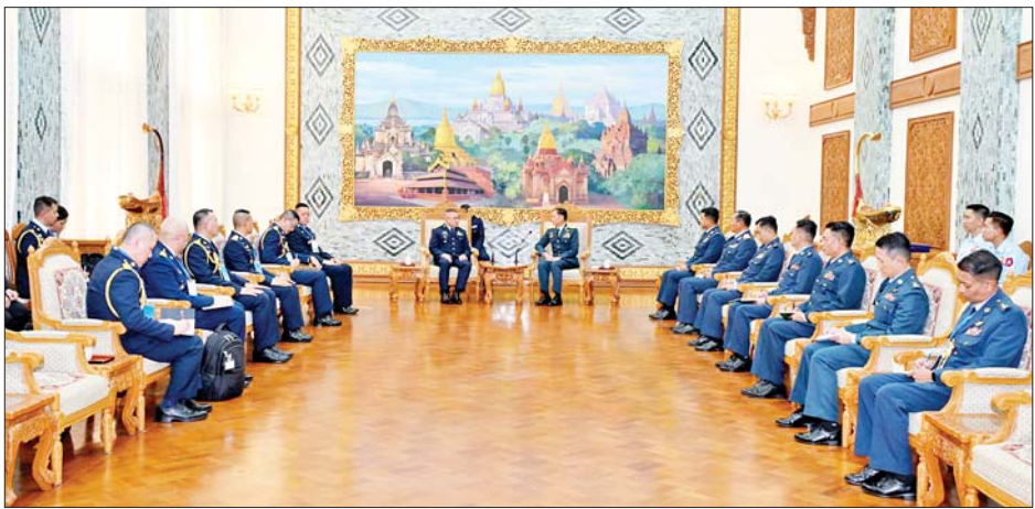
ကာကွယ်ရေးဦးစီးချုပ်(လေ) ဗိုလ်ချုပ်ကြီး ထွန်းအောင်နှင့် ထိုင်းဘုရင့်လေတပ်ဦးစီးချုပ် Air Chief Marshal Punpakdee Pattanakul ဦးဆောင်သော ချစ်ကြည်ရေးကိုယ်စားလှယ်အဖွဲ့တို့ တွေ့ဆုံ ဆွေးနွေးစဉ်။

အတွက် အသက်စွန့်ခဲ့ကြသူများ အား အလေးပြုကြပြီး ထိုင်းဘုရင့် လေတပ်ဦးစီးချုပ်က ဧည့်သည် တော် မှတ်တမ်းစာအုပ်တွင် မှတ်တမ်းတင် လက်မှတ်ရေးထိုး သည်။ အဆိုပါ ထိုင်းဘုရင့်လေတပ် ဦးစီးချုပ် Air Chief Marshal Punpakdee Pattanakul အား ကာကွယ်ရေးဦးစီးချုပ် (လေ) ဗိုလ်ချုပ်ကြီး ထွန်းအောင်က ယနေ့ မွန်းလွဲပိုင်းတွင် နေပြည်တော်ရှိ ဘုရင့်နောင်ရိပ်သာ၌ ဂုဏ်ပြု တပ်ဖွဲ့ဖြင့် ဂုဏ်ပြုကြိုဆိုသည်။ ဦးစွာ ကာကွယ်ရေးဦးစီးချုပ် (လေ) ဗိုလ်ချုပ်ကြီး ထွန်းအောင် နှင့် ထိုင်းဘုရင့်လေတပ်ဦးစီးချုပ် တို့သည် ဂုဏ်ပြုတပ်ဖွဲ့၏အလေးပြု ခြင်းကိုခံယူပြီး ဂုဏ်ပြုတပ်ဖွဲ့အား လိုက်လံကြည့်ရှုစစ်ဆေးသည်။ ယင်းနောက် အခမ်းအနားသို့ တက်ရောက်လာကြသည့် နှစ်နိုင်ငံ လေတပ်အရာရှိများအား အပြန် အလှန် မိတ်ဆက်ပေးကြပြီး