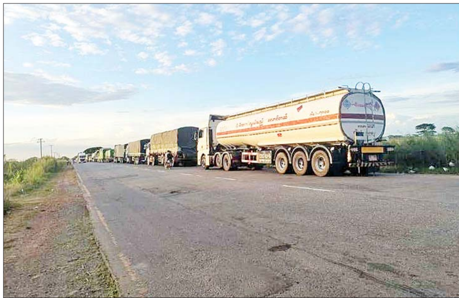
သီလဝါ Terminal များမှ မွန်ပြည်နယ်သို့ စက်သုံးဆီသယ်ယူပို့ဆောင်ပေးစဉ်။