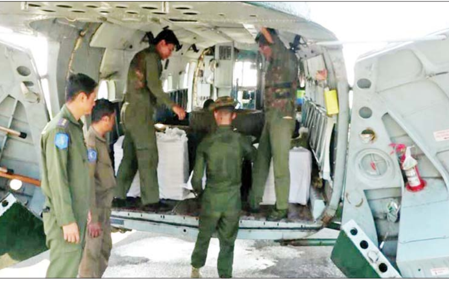
များက ရေးသားပေးပို့သည့် “တပ်မတော်သားများ ကြောင်း” စသည့် ဆုတောင်း မေတ္တာစာလွှာများပါရှိ ကြောင်း၊ ကျန်းမာ ကြောင်း သိရသည်။

နေပြည်တော် နိုဝင်ဘာ ၂၂ နိုင်ငံတော်ကာကွယ်ရေးနှင့် လုံခြုံရေးတာဝန် များကို စွမ်းစွမ်းတမ်းတမ်းဆောင်လျက်ရှိသော လုံခြုံ ရေးတပ်ဖွဲ့ဝင်များအတွက် စေတနာရှင်အလှူရှင် ပြည်သူများက အလှူငွေများ ပေးအပ်လှူဒါန်း လျက်ရှိသည့်အပြင် စားသောက်ဖွယ်ရာများကိုလည်း ပေးပို့လှူဒါန်းလျက်ရှိသည်။ ပေးအပ်လှူဒါန်း ယနေ့တွင်လည်း စေတနာရှင်အလှူရှင် ပြည်သူ များက အရှေ့မြောက်တိုင်းစစ်ဌာနချုပ် နယ်မြေ အတွင်း နိုင်ငံတော်ကာကွယ်ရေးနှင့် လုံခြုံရေးတာဝန် များ ထမ်းဆောင်နေသည့် လုံခြုံရေးတပ်ဖွဲ့ဝင်များ အတွက် ထောပတ်ထမင်းဘူးများကို ပေးအပ်လှူဒါန်း ကြရာ တာဝန်ရှိသူများက လက်ခံရယူပြီး လားရှိုးမြို့မှ တစ်ဆင့် တပ်မတော်မော်တော်ယာဉ်များ၊ ရဟတ် ယာဉ်များဖြင့် လုံခြုံရေးတပ်ဖွဲ့ဝင်များ၏ လက်ဝယ် အရောက် လိုက်လံပို့ဆောင်ပေးကြသည်။ စေတနာရှင်ပြည်သူများ လှူဒါန်းသည့် ထောပတ် ထမင်းဘူးများနှင့်အတူ ရဟန်းသံဃာများနှင့် ပြည်သူ