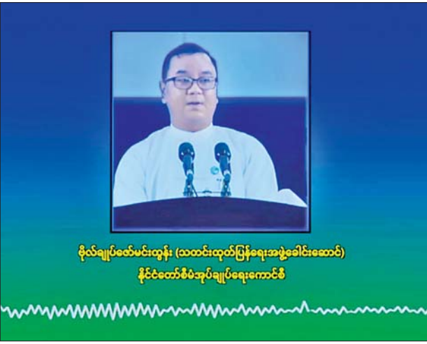
ဗိုလ်ချုပ်ဇော်မင်းထွန်း (သတင်းထုတ်ပြန်ရေးအဖွဲ့ခေါင်းဆောင်) နိုင်ငံတော်စီမံအုပ်ချုပ်ရေးကောင်စီ

ကျွန်တော်တို့မြန်မာနိုင်ငံအစိုးရအနေနဲ့ နယ်စပ်ဒေသတွေမှာ တရားမဝင် ဝင်ရောက်လာတဲ့ နိုင်ငံခြားသားတွေကို စစ်ဆေးပြီး နေရပ် ပြန်လွှတ်တာတွေ လုပ်ဆောင်ပေးလျက်ရှိပါတယ်။ ဒီလိုလုပ်ဆောင် ရမှာ ဒီနေ့ နိုဝင်ဘာလ ၂၂ ရက်မှာတော့ နယ်စပ်ဒေသအသီးသီးမှာ ဝင်ရောက်နေတဲ့ တရုတ်အမျိုးသား ၁၀၉၁ ဦး၊ အမျိုးသမီး ၁၉၇ ဦး စုစုပေါင်း ၁၂၈၈ ဦးကို တရုတ်ပြည်သူ့သမ္မတနိုင်ငံအစိုးရကို ပြန်လည် လွှဲပြောင်းပေးခဲ့ပါတယ်။ နိုဝင်ဘာလ ၂၂ ရက်နေ့ ဒီနေ့ထိ စုစုပေါင်း ၅၂၀၆ ဦး ရှိပြီးဖြစ်ပါတယ်။ ဒါ့ပြင် တခြားနိုင်ငံခြားသားတွေကိုလည်း သက်ဆိုင်ရာနိုင်ငံတွေနဲ့ ဆက်သွယ်ပြီး ပြန်လည်အပ်နှံတာတွေ၊ တရုတ်နိုင်ငံဘက်က တစ်ဆင့်ပြန်လည်အပ်နှံတာတွေ ဆောင်ရွက် လျက်ရှိပါတယ်။ ကျွန်တော်တို့အစိုးရအနေနဲ့ နယ်စပ်ဒေသ တရား ဥပဒေစိုးမိုးရေး၊ တည်ငြိမ်ရေးနဲ့ နယ်စပ်ဒေသမှာ တရားမဝင်လုပ်ငန်း များ ပပျောက်စေရေးအတွက် တရုတ်နိုင်ငံအစိုးရနဲ့ တက်ကြွစွာ ပူးပေါင်းဆောင်ရွက်လျက်ရှိပါတယ်။ ဒီလိုဆောင်ရွက်လျက်ရှိတဲ့နေရာ မှာတော့ မနေ့က ကျွန်တော်ပြောသလိုပဲ အနောက်နိုင်ငံအားပေး ပြည်ပျက်မီဒီယာတချို့အနေနဲ့ကတော့ ဒီလုပ်ငန်းတွေအပေါ်မှာ နှစ်နိုင်ငံဆက်ဆံရေးကို ထိခိုက်အောင် အကြောင်းအမျိုးမျိုးဖန်တီး ပြီး ရေးနေတာတွေတွေ့ရပါလိမ့်မယ်။ ကျွန်တော်တို့မြန်မာနိုင်ငံအစိုးရ အနေနဲ့ နယ်စပ်ဒေသ တည်ငြိမ်အေးချမ်းရေး၊ တရားဥပဒေစိုးမိုးရေး လုပ်ငန်းများကို သက်ဆိုင်ရာနိုင်ငံတွေနဲ့ လက်တွဲပြီး တက်ကြွစွာ ပူးပေါင်းပါဝင်ဆောင်ရွက်သွားမှာဖြစ်ပါတယ်။