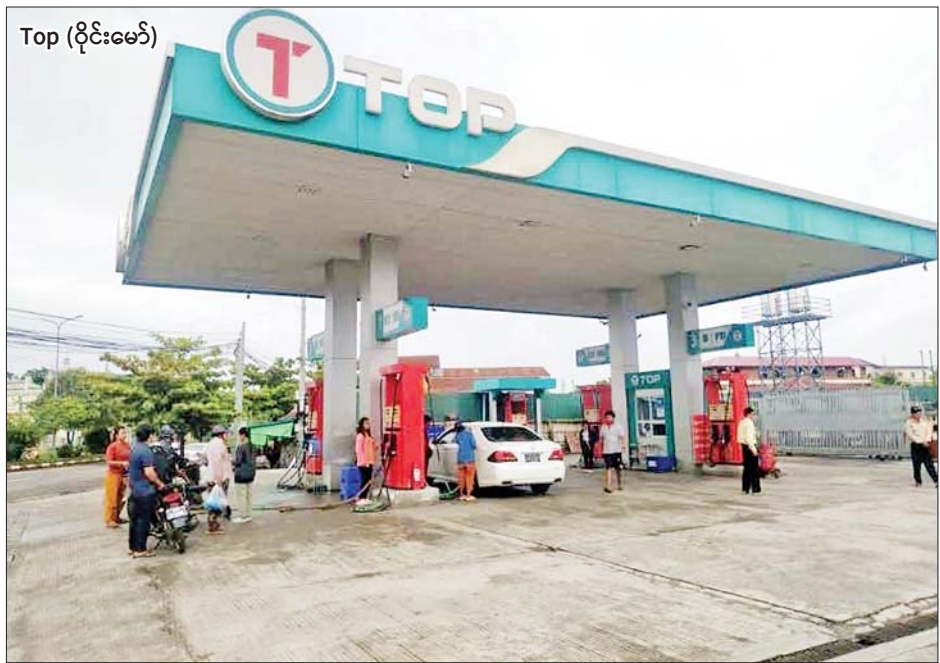
Top (ဝိုင်းမော်)