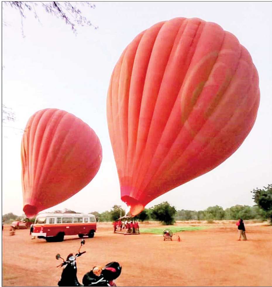
ပြည်တွင်း၊ ပြည်ပခရီးသွားများ ပုဂံဒေသ၏အလှကို ကြည့်ရှုခံစားနိုင်ရန် မိုးပျံပူဖောင်းဖြင့် ဝန်ဆောင်မှုပေးနေစဉ်။

ပုဂံ နိုင်ငံသာ ၂၂ မြန်မာတို့၏ အသံနှလုံးဟု တင်စားထားသည့် ရှေးဟောင်း ယဉ်ကျေးမှုအမွေအနှစ်တို့ စုဝေး တည်ရှိရာ ပုဂံဒေသ၌ ဆောင်း ရာသီသို့ ဝင်ရောက်လာချိန်တွင် သဘာဝအလှတို့ဖြင့် လှပလျက် ရှိရာ ပုဂံသို့လာရောက်လည်ပတ် ကြသည့် နိုင်ငံခြားသားခရီးသွား အများစုမှာ မိုးပျံပူဖောင်းစီး၍ ပုဂံရှေးဟောင်းယဉ်ကျေးမှုအလှ ကို ဝေဟင်မှ ကြည့်ရှုခံစားမှုများ လာကြောင်း သိရသည်။