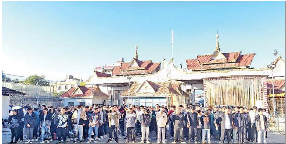
နယ်စပ်ဒေသများမှတစ်ဆင့် မြန်မာနိုင်ငံအတွင်းသို့ တရားမဝင် ဝင်ရောက်နေထိုင်လျက်ရှိသည့် တရုတ်နိုင်ငံသားများအား တွေ့ရစဉ်။