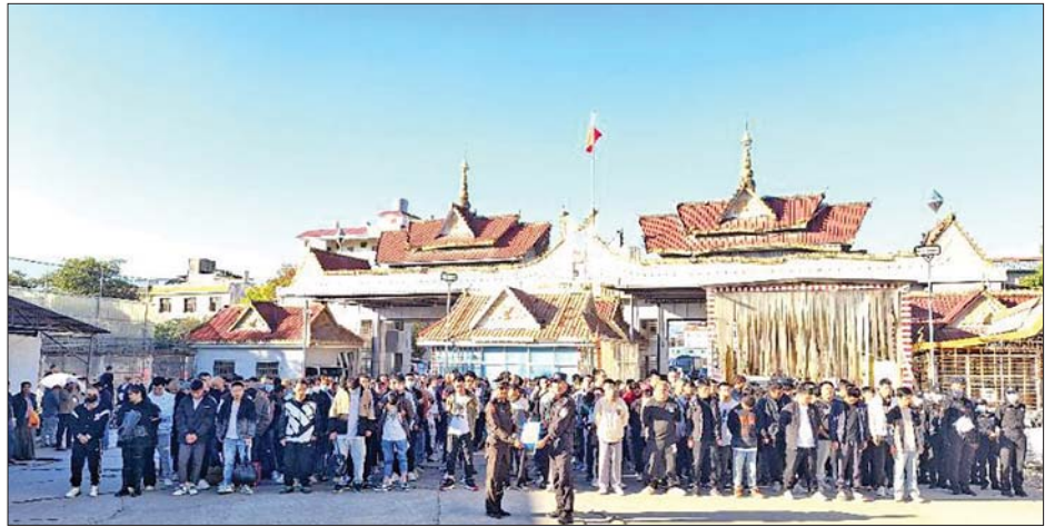
နယ်စပ်ဒေသများမှတစ်ဆင့် မြန်မာနိုင်ငံအတွင်းသို့ တရားမဝင် ဝင်ရောက်နေထိုင်လျက်ရှိသည့် တရုတ်နိုင်ငံသားများအား တရုတ်ပြည်သူ့သမ္မတနိုင်ငံမှ တာဝန်ရှိသူများထံ ပြန်လည်လွှဲပြောင်းပေးအပ်စဉ်။

လွှဲပြောင်းပေးအပ်ခြင်းများ ဆောင်ရွက်နိုင်ခဲ့သည်။ နိုင်ငံတော်အစိုးရအနေဖြင့် နယ်စပ်ဒေသများမှ တရားမဝင် ဝင်ရောက်နေထိုင်လျက်ရှိသည့် ပြည်ပ နိုင်ငံသားများအား စိစစ်ဖော်ထုတ်ခြင်းနှင့် ပြန်လည် လွှဲပြောင်းခြင်းလုပ်ငန်းစဉ်များကို ဆက်လက် ဆောင်ရွက်သွားမည်ဖြစ်ကြောင်း သိရသည်။ သတင်းစဉ်