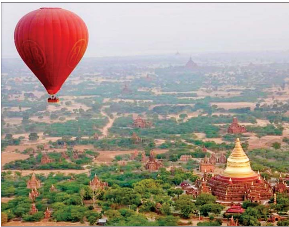
ပြည်တွင်း၊ ပြည်ပခရီးသွားများ ပုဂံဒေသ၏အလှကို ဝေဟင်မှကြည့်ရှုခံစားကြစဉ်။

★ ရှေးဦးစွာ “ကျွန်တော်တို့ ပထမဆုံး အကြိမ်ရောက်ပြီး ပထမဆုံး မိုးပျံပူဖောင်း စီးဖြစ်တာပါ။ ကြောက်ဖို့မကောင်းဘူး၊ စီးလို့ ကောင်းတယ်။ စီးရတာလွယ်တယ်။ အံ့ဩဖို့လည်းကောင်းတယ်။ ပုဂံကဘုရား၊ စေတီတွေ သပ္ပာယ်တယ်။ မြန်မာပြည်က ချစ်ဖို့ကောင်းပြီး မြန်မာလူမျိုးတွေကို ချစ်ပါတယ်”ဟု အိန္ဒိယ နိုင်ငံသားတစ်ဦးက မိုးပျံပူဖောင်း စီးနင်းရသောခံစားမှုကို ပြောသည်။