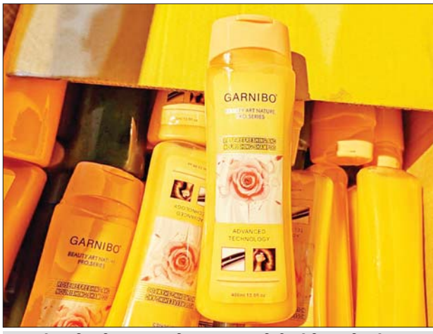
သီလဝါကုန်သွယ်မှုစစ်ဆေးရေးစခန်း၌ သိမ်းဆည်းရမိမှု။

ထို့အတူ နိုဝင်ဘာ ၂၁ ရက်တွင် အကောက်ခွန်ဦးစီးဌာန၏ စီမံခန့်ခွဲမှုဖြင့် တာဝန်ကျပူးပေါင်းအဖွဲ့များက စစ်ဆေးမှုများ ဆောင်ရွက်ခဲ့ရာ မြန်မာ့စက်မှုဆိပ်ကမ်း၌ ကုန်သွယ်မှုအတွင်းမှ ပိုင်ရှင်မှထုတ်ယူလိုသောဆန္ဒမရှိသည့် Electric Drill အုတ်ဖောက်စက် (Used) တစ်လုံး အပါအဝင် ကုန်ပစ္စည်းလေးမျိုး (ခန့်မှန်းတန်ဖိုးငွေကျပ် ၂၉၀၀၀၀)နှင့် သွင်းကုန်ကြေညာလွှာတွင် ကြေညာထားခြင်းမရှိသည့် Toilet Seat Cover ၄၅၅ ခု (ခန့်မှန်းတန်ဖိုးငွေကျပ် ၄၀၉၅၀၀)ကိုလည်းကောင်း၊ သီလဝါကုန်သွယ်မှုစစ်ဆေးရေးစခန်း၌ သွင်းကုန်ကြေညာလွှာတွင် ကြေညာထားခြင်းမရှိသည့် GU Sport တီရှပ် ၂၃၂ ထည်၊ GARNIBO ခေါင်းလျှော်ရည် ၂၄၈ ဘူးအပါအဝင် ကုန်ပစ္စည်း ၁၇ မျိုး (ခန့်မှန်းတန်ဖိုးငွေကျပ် ၃၂၈၀၀၀၀)ကိုလည်းကောင်း၊ မရမ်းချောင်းအမြဲတမ်းစစ်ဆေးရေးစခန်း၌ သထုံမြို့မှ ပဲခူးမြို့သို့ မောင်းနှင်လာသည့် ယာဉ်တစ်စီးပေါ်မှ တရားဝင်စာရွက်စာတမ်းစာတမ်းစာတမ်း တင်ပြနိုင်ခြင်းမရှိသည့် ပုစွန်တစ်ကောင် စားအုန်းဆီ ၁၈ လီတာပါ ပုံး ၁၀၀ (ခန့်မှန်းတန်ဖိုးငွေကျပ် ၅၀၀၀၀၀)နှင့် အဆိုပါပစ္စည်းများ တင်ဆောင်လာသည့် Mitsubishi Canter တစ်စီး (ခန့်မှန်းတန်ဖိုးငွေကျပ် ၂၀၀၀၀၀၀)ကိုလည်းကောင်း၊ ကော့ကရိတ်(တံတားကျိုး) စုပေါင်းစစ်ဆေးရေးစခန်း၌ တရားဝင်စာရွက်စာတမ်းအထောက်အထား တင်ပြနိုင်ခြင်းမရှိသည့် Ballpen အချောင်း ၁၂၀၀၊ Coat Rack Steel အင်္ကျီချိတ် အခု ၂၀ နှင့် Vee Rubber ဆိုင်ကယ်တာယာ အလုံး ၅၀ (ခန့်မှန်းတန်ဖိုးငွေကျပ် ၄၃၀၀၀၀)ကိုလည်းကောင်း စုစုပေါင်း ခန့်မှန်းတန်ဖိုးငွေကျပ် ၆၅၅၆၅၀၀ ကို သိမ်းဆည်းရမိခဲ့ပြီး အကောက်ခွန်လုပ်ထုံးလုပ်နည်းများနှင့်အညီ