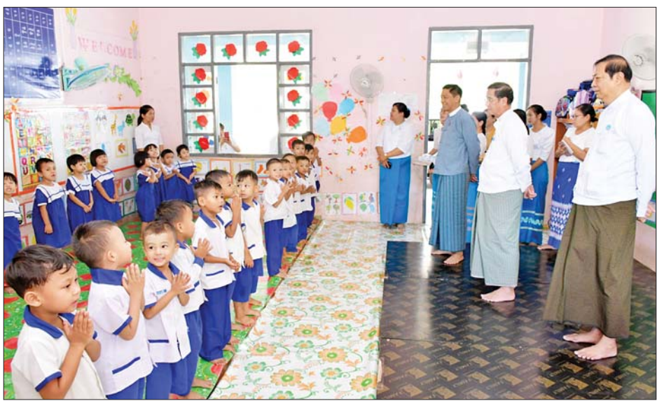
ဆောင်ရွက်ပေးစေလိုကြောင်း မှာကြားသည်။ ထို့နောက်ကလေးများ မူကြိုပညာရေးသင်ကြား နေမှု ကျွေးမွေးစောင့်ရှောက်မှု၊ ကျောင်းနှင့် ကျောင်း ပတ်ဝန်းကျင် အခြေအနေများကို ကြည့်ရှုစစ်ဆေး ပြီး လိုအပ်သည်များ ဖြည့်ဆည်းဆောင်ရွက်ပေးကာ ကလေးများကို ရင်းရင်းနှီးနှီးတွေ့ဆုံနှုတ်ဆက်၍ မုန့်များ ပေးဝေသည်။ ဆက်လက်၍ ပြည်ထောင်စုနယ်မြေ

နေပြည်တော် နိုဝင်ဘာ ၂၂ လူမှုဝန်ထမ်း၊ ကယ်ဆယ်ရေးနှင့် ပြန်လည် နေရာချထားရေးဝန်ကြီးဌာန ပြည်ထောင်စုဝန်ကြီး ဒေါက်တာစိုးဝင်းသည် ဒုတိယဝန်ကြီး၊ တာဝန်ရှိ သူများနှင့်အတူ ယနေ့မုန်းလွဲပိုင်းက ပြည်ထောင်စု နယ်မြေ နေပြည်တော်အတွင်းရှိ သီရိရတနာမူလ တန်းကြိုကျောင်းသို့ သွားရောက်ပြီး ကျောင်းအုပ်နှင့် ဆရာမများအား တွေ့ဆုံသည်။ တွေ့ဆုံစဉ်ပြည်ထောင်စုဝန်ကြီးက မူကြိုဆရာ ဖြစ်သင်တန်းတွင် သင်ကြားခဲ့ရသော ကလေးစိတ် ပညာနှင့် အခြေခံလိုအပ်ချက်၊ ဘက်စုံဖွံ့ဖြိုးမှုအတွက် ပံ့ပိုးပေးသောပတ်ဝန်းကျင်၊ ကလေးများ၏ကာယ လှုပ်ရှားမှုနှင့် သိမှုဖွံ့ဖြိုးမှု ကျန်းမာရေးနှင့် အာဟာရ အရေးကြီးပုံ၊ ဘာသာစကားဖွံ့ဖြိုးမှု၊ ကစားခြင်း အရေးကြီးပုံ၊ မသန်စွမ်း ကလေးများအကြောင်း၊ သင်ထောက်ကူပစ္စည်းများပြုလုပ်ခြင်း၊ မိဘရပ်ရွာ အသိပညာပေးခြင်းနှင့် ကလေးများသိသင့်သည့် အကြောင်းအရာများကို ပုံပြင်၊ သီချင်းများဖြင့် သင်ကြားပေးခြင်းများကို စေတနာထား၍ စနစ်တကျ