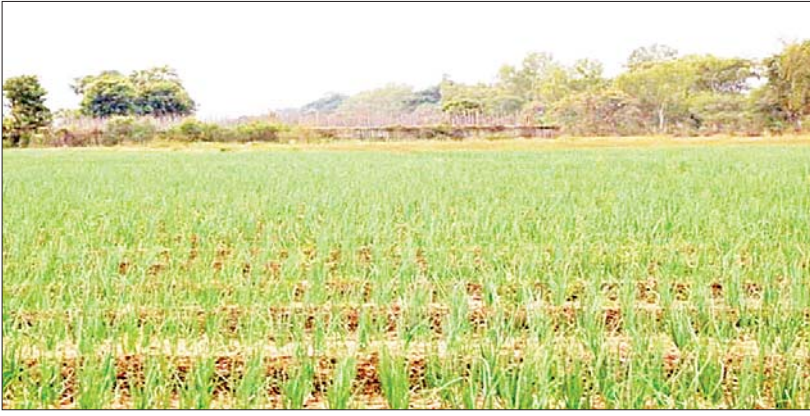
စာရင်းများအရ သိရသည်။

မြင်းခြံ နိုဝင်ဘာ ၁၅ မန္တလေးတိုင်းဒေသကြီး မြင်းခြံခရိုင် အတွင်း ဆောင်းကြက်သွန်နီ(ခေါ်) နေ့ကြက်သွန်နီကို နိုဝင်ဘာလ၊ ဒီဇင်ဘာလနှင့် ဇန်နဝါရီလတို့တွင် စတင်စိုက်ပျိုးကြပြီး ဖေဖော်ဝါရီလ၊ မတ်လနှင့် ဧပြီလတို့တွင် ရိတ်သိမ်းထွက်ပေါ်လေ့ရှိကြောင်း၊ ဆောင်းကြက်သွန်နီ စိုက်ပျိုးမှုအနေဖြင့် ယခင်နှစ်၌ ကြက်သွန်နီစိုက်ဧက ၂၅၄၁ ဧကစိုက်ပျိုးခဲ့ပြီး ယခုနှစ်၌ မြင်းခြံမြို့နယ်တွင် ၁၅၉၁ ဧက၊ နွားထိုးကြီးမြို့နယ်တွင် ၁၁၅၉ ဧက စုစုပေါင်း ကြက်သွန်နီစိုက်ဧက ၂၇၅၀ စတင်စိုက်ပျိုးနေပြီ ဖြစ်ကြောင်း၊ တောင်သာမြို့နယ်တွင် နိုဝင်ဘာလကုန်မှ စတင်စိုက်ပျိုးမည်ဖြစ်ကြောင်း၊ ကြက်သွန်နီစိုက်ပျိုးမှု ကာလတူနှိုင်းယှဉ်ချက်အရ ဆောင်းကြက်သွန်နီများကို ယခုနှစ်တွင် ယခင်နှစ်ထက် ၂၀၈ ဧက ပိုမိုစိုက်ပျိုးထားကြောင်း ခရိုင်စိုက်ပျိုးရေးဌာန၏