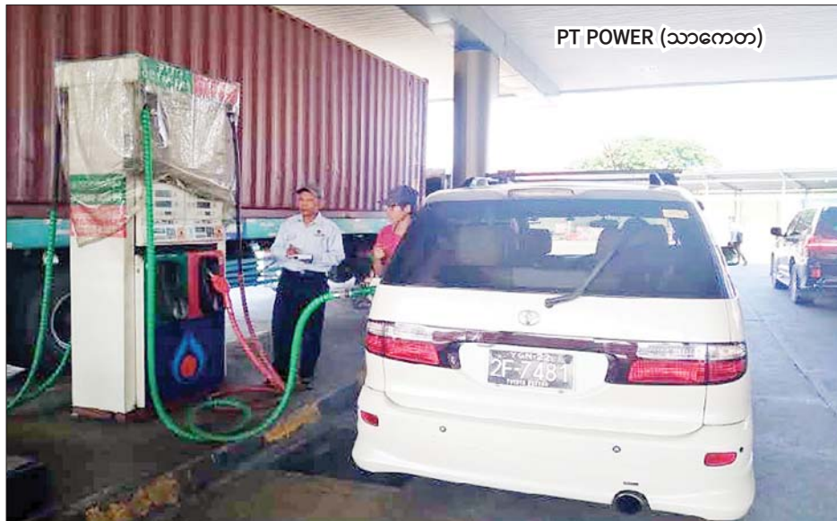
PT POWER (သာကေတ)