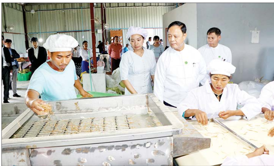
ဆောင်ရွက်ထားရှိမှု၊ လက်ရှိ ဝါးစိုက်ခင်း ထူထောင် ခြင်းလုပ်ငန်းများ ဆောင်ရွက်နေမှု၊ ပျဉ်းမနားမြို့နယ်အတွင်းရှိ ဝါးစိုက်တောင်သူများအား ဝါးတောထိန်းသိမ်းနည်း သင်တန်းပို့ချမှုနှင့် ကုန်ကြမ်းရရှိမှု

နေပြည်တော် နိုဝင်ဘာ ၁၅ သမဝါယမနှင့် ကျေးလက်ဖွံ့ဖြိုးရေးဝန်ကြီးဌာန ပြည်ထောင်စုဝန်ကြီး ဦးလှမိုးသည် တာဝန်ရှိသူများနှင့်အတူ ယနေ့မုန့်လှုပ်ပိုင်းတွင် လေယာသိရိမြို့နယ် စက်ကုန်းကျေးရွာသို့ ရောက်ရှိပြီး စိမ်းလွင်မြေ သမဝါယမအသင်းနှင့် နရီန္ဒြာကုမ္ပဏီတို့ အကျိုးတူပူးပေါင်းဆောင်ရွက်လျက်ရှိသော စီးပွားဖြစ် အသေးစား မျှစ်ခြောက်ကုန်ထုတ်စက်ရုံ လည်ပတ်နေမှုအခြေအနေများကို ကြည့်ရှုစစ်ဆေးသည်။