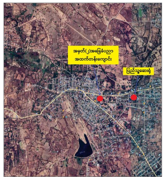
PDF အမည်ခံအကြမ်းဖက်သမားများက မြိုင်မြို့ပေါ်ရပ်ကွက် များအတွင်းသို့ လက်လုပ်စီနီပြောင်းများ၊ Drop Bomb များဖြင့် ပစ်ချတိုက်ခိုက်ခဲ့သည့် နေရာပြပုံ။