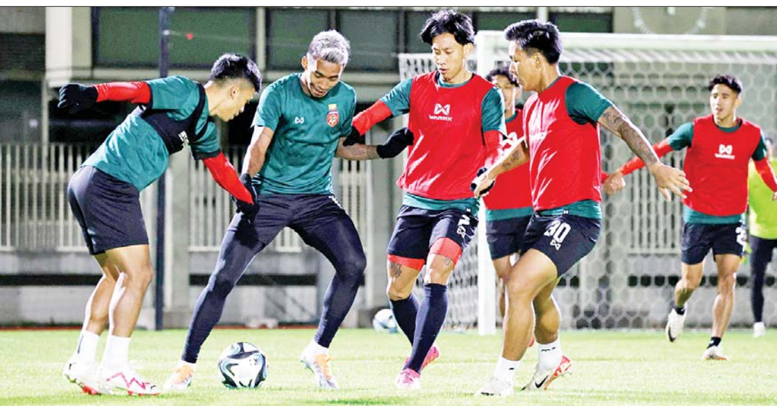
မြန်မာ့လက်ရွေးစင်အသင်း အားကစားသမားများ လေ့ကျင့်နေကြစဉ်။

ဂျပန်အသင်းနှင့် မြန်မာအသင်းတို့၏ ပွဲကြိုသတင်းစာရှင်းလင်းပွဲကို နိုဝင်ဘာ ၁၅ ရက်က ကျင်းပရာ နှစ်ဖက်အသင်း နည်းပြချုပ်များနှင့် အသင်းခေါင်းဆောင် တို့တက်ရောက်သည်။ မြန်မာ့လက်ရွေးစင် အသင်းနည်းပြချုပ် ဖိုက်အွန်တိုင်နာက “ကျွန်တော်တို့အုပ်စုမှာ ဂျပန်၊ မြောက် ကိုရီးယား၊ ဆီးရီးယားတို့နဲ့ ဆုံတွေ့နေပြီး လက်ရှိအခြေအနေ ကမ္ဘာ့အဆင့်သတ်မှတ် ချက်တွေအရ ကျွန်တော်တို့က အောက် အသင်းတစ်သင်းပါ။ ဒါကလည်း ကျွန်တော် တို့ကို အခွင့်အရေးတွေ ဖန်တီးနိုင်စွမ်း ရှိလာပါလိမ့်မယ်။ မနက်ဖြန်ပွဲစဉ်မှာ အတတ်နိုင်ဆုံး ပထမပိုင်းရဲ့ အစောပိုင်း မိနစ်တွေမှာ လုံးဝဂိုးမပေးရဖို့ ကြိုးစား ရပါမယ်။ စာမျက်နှာ ၉ ကော်လံ ၆ သို့ ❖