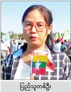
ပြည်သူတစ်ဦး

ဦးစွာ မန္တလေးမြို့အတွင်းရှိ ငြိမ်းချမ်းရေးကို လိုလားသည့် သံဃာတော်များနှင့် ပြည်သူ အင်အား ၂၀၀၀ ကျော်သည် စုရပ် နေရာဖြစ်သည့် မန္တလေးတိုင်း ဒေသကြီး အောင်မြေသာစံမြို့နယ် ကျောက်တော်ကြီး ဘုရားရှေ့ ၆၆ လမ်းပေါ်တွင် စုစည်း၍ ၎င်းမှ တစ်ဆင့် နန်းမြို့ ကျေးဘေး ၁၂လမ်း တစ်လျှောက်၊ ထိုမှတစ်ဆင့် ၇၃ လမ်းအတိုင်း၊ ၎င်းမှတစ်ဆင့် မန္တလေးတောင်ခြေရှိရွှေမန်းတောင် လူငယ် အားကစားလေ့ကျင့်ရေး စခန်းကွင်းအတွင်းသို့ ချီတက်၍ လမ်းတစ်လျှောက် အကြမ်းဖက် လက်နက်ကိုင် သောင်းကျန်းသူ များအား ဆန့်ကျင် ရှုတ်ချပြီး