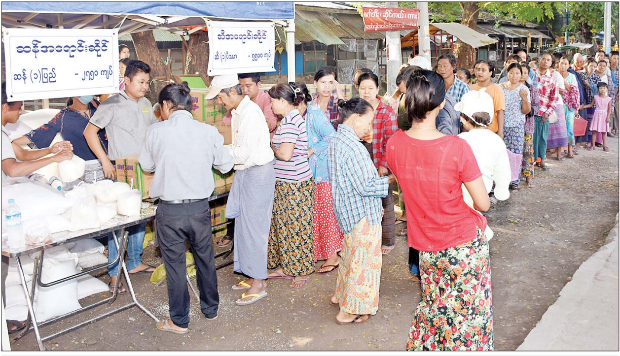
မန္တလေးတိုင်းဒေသကြီးအစိုးရအဖွဲ့ ဆန်/ဆီ အခြေခံစားသောက်ကုန်သက်သာအရောင်းဆိုင် ရောင်းချခြင်း ရက် ၁၀၀ ပြည့် အထူး ဈေးရောင်းပွဲတော်တွင် ပြည်သူများ ဝယ်ယူအားပေးနေမှုကို တွေ့ရစဉ်။

မန္တလေး နိုဝင်ဘာ ၁၄ မန္တလေးတိုင်းဒေသကြီး အစိုးရ အဖွဲ့၏ စီစဉ်ကြီးကြပ်မှုဖြင့် မန္တလေးမြို့တော်စည်ပင်သာယာ ရေးကော်မတီ၊ စားသုံးသူရေးရာ ဦးစီးဌာန၊ မန္တလေးတိုင်းဒေသကြီး ကုန်သည်များနှင့် စက်မှုလက်မှု လုပ်ငန်းရှင်များအသင်း၊ မန္တလေး တိုင်းဒေသကြီး ဆီကုန်သည်များ နှင့် ဆီလုပ်ငန်းရှင်များအသင်း၊ မြန်မာနိုင်ငံ ဆန်စက်လုပ်ငန်းရှင် များအသင်းတို့ပူးပေါင်း၍ ကုန်ဈေး နှုန်းတည်ငြိမ်ရေးနှင့် ပြည်သူများ သက်သာသော ဈေးနှုန်းဖြင့် ဝယ်ယူ စားသုံးနိုင်ရေးအတွက် မန္တလေးမြို့တော် စည်ပင်သာယာ ရေးကော်မတီပိုင် ဈေးများနှင့် အခြေခံစားသောက်ကုန် အရောင်း ဆိုင်များ လှည့်လည်ဖွင့်လှစ်၍ ပြည်သူများထံသို့ တိုက်ရိုက် ရောင်းချပေးလျက်ရှိသည်။ စာမျက်နှာ ၃ ကော်လံ ၁ သို့ ၁