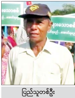
ပြည်သူတစ်ဦး