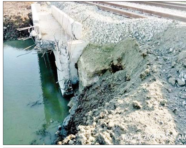
ဒိုက်ဦး - ပြန်တန်ဆာဘူတာအကြား မိုင်းထောင်ဖောက်ခွဲ ခံထားရမှုကြောင့် တံတားအမှတ်(၁၁၆/A) ၏ Wing Wall ကွန်ကရစ်ခုံ ထိခိုက်ပျက်စီးမှု မှတ်တမ်းဓာတ်ပုံ။

လမ်း အဆင့်မြှင့်တင်ရေး စီမံကိန်း ပတ်စက်သော ရည်ရွယ်ချက်များ လုပ်ငန်းများ အချိန်ပိုမိုကြန့်ကြာ ဖြင့် အကြိမ်ကြိမ် ကျူးလွန်နေကြ စေရေးတို့အတွက် ယုတ်မာ သောကြောင့်အဆိုပါအကြမ်းဖက်