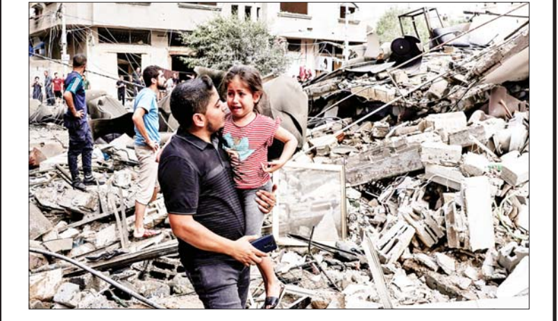
ဆောင်းပါး စာမျက်နှာ » ၆

လူမှုဘဝဖွံ့ဖြိုးမှု စာတတ်မြောက်ရေး ပိုင်းကူစို့