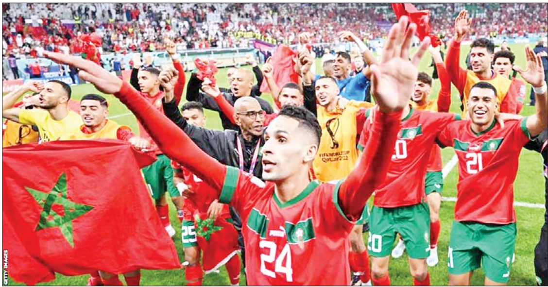
၂၀၂၂ ခုနှစ် ကာတာကမ္ဘာ့ဖလားပြိုင်ပွဲတွင် ဆီမီးဖိုင်နယ်အဆင့် တက်လှမ်းခွင့်ရရှိခဲ့သော ပထမဆုံးအာဖရိကအသင်းဖြစ်လာ သည့် မော်ရိုကိုအသင်း အောင်ပွဲခံနေစဉ်။