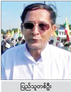
ပြည်သူတစ်ဦး