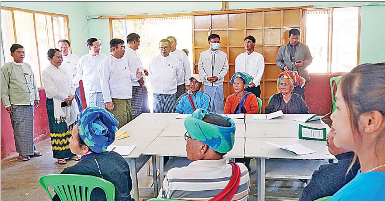
ရမ်းပြည်နယ်(တောင်ပိုင်း) တောင်ကြီးမြို့၊ ကလေးမြို့နှင့် တိုပုံးမြို့နယ်တို့တွင် အခြေခံစာတတ်မြောက်ရေးလုပ်ငန်းကို ဇန်နဝါရီ ၂၂ ရက်မှစ၍ ရက် ၄၀ တိုင် ဆောင်ရွက်နေမှုကို တာဝန်ရှိသူများ ကြည့်ရှုအားပေးစဉ်။

ဘုန်းတော်ကြီးကျောင်းပညာရေး မြန်မာနိုင်ငံ၏ပညာရေးအစသည် ဘုန်းတော်ကြီးကျောင်းပညာရေးသာဖြစ်သည်။ အရေး၊ အဖတ်၊ အတွက်ပညာများကို ဘုန်းတော်ကြီးကျောင်းများက သင်ကြားပေးရုံမျှသာမက စာရိတ္တပညာ၊ လူမှုရေးပညာ၊ အုပ်ချုပ်ရေးပညာအစရှိသည့် အဋ္ဌာရသ (၁၈) ရပ်ကို သင်ကြားပေးနိုင်ခဲ့သည်။ မြန်မာဘုရင်အဆက်ဆက်သည် ဘုန်းတော်ကြီးကျောင်းမှ ပညာသင်ပေးလိုက်သူများဖြစ်သည်။ ပုဂံခေတ်မှသည် ကုန်းဘောင်ခေတ်နှောင်း သီပေါမင်းလက်ထက် တိုင်အောင် တိုင်းပြည်အုပ်ချုပ် မင်းလုပ်နိုင်ခဲ့သော ပညာရပ်များဖြင့် ပြည့်စုံကုန်ကြွယ်ဝခဲ့သည်။