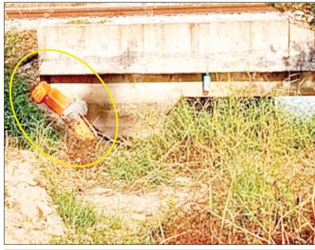
ဒိုက်ဦး- ပြန်တန်ဆာဘူတာအကြား တံတား အမှတ်(၁၁၆/A) အား ဖောက်ခွဲဖျက်ဆီး၍ မိုင်းထောင်ထားမှုမှတ်တမ်းဓာတ်ပုံ။

နိုင်ငံတော် အစိုးရအနေဖြင့် အများပြည်သူ ခရီးသွားလာမှုနှင့် ကုန်စည်ပို့ဆောင်မှု အဆင်ပြေ ချောမွေ့မြန်ဆန်စေရေးအတွက် ရထားလမ်း အခြေခံအဆောက် အအုံများ ပိုမိုကောင်းမွန်လာ စေရေး၊ ရထားပို့ဆောင်ရေးစနစ် ကို အဆင့်မြှင့်တင်နေသည့် စီမံကိန်းလုပ်ငန်းများကို ရည်မှန်း ချက်ထားရှိ၍ စီမံဆောင်ရွက် ပေးလျက်ရှိသော်လည်း အကြမ်း ဖက် သောင်းကျန်းသူများကမူ နိုင်ငံတော်ပိုင် ရထားစက်ခေါင်း၊ တွဲများနှင့်ခရီးသည်များ၊ ကုန်စည် များ ထိခိုက်ပျက်စီးစေရေး၊ ပြည်သူများ အသက်အန္တရာယ် ထိခိုက်ပြီး စိတ်မချမ်းမြေ့စေရေး၊ ရထားဖြင့် ခရီးသွားလာမှုမပြု ရဲအောင် ခြိမ်းခြောက်ခြင်းတို့ အပြင် ရန်ကုန်-မန္တလေး ရထား