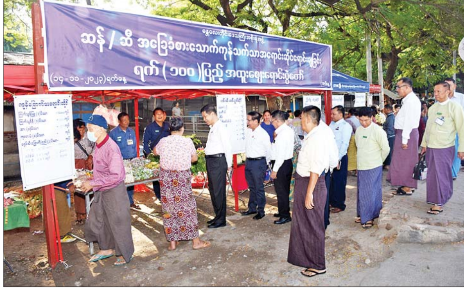
မန္တလေးတိုင်းဒေသကြီးဝန်ကြီးချုပ် ဦးမျိုးအောင် မန္တလေးတိုင်းဒေသကြီးအစိုးရအဖွဲ့ ဆန်/ဆီ အခြေခံစားသောက်ကုန်သက်သာအရောင်းဆိုင် ရောင်းချခြင်း ရက် ၁၀၀ ပြည့် အထူးဈေးရောင်း ပွဲတော်တွင် ကြည့်ရှုစစ်ဆေးစဉ်။

နှင့် မြို့ဟောင်းဘူတာအနီးရှိ မြို့ဟောင်းဈေးတို့တွင် ပြည်သူများအား အထူးသက်သာသောဈေးနှုန်းဖြင့် တိုက်ရိုက် ရောင်းချပေးလျက်ရှိပြီး တိုင်းဒေသကြီး ဝန်ကြီးချုပ် ဦးမျိုးအောင်နှင့်အဖွဲ့သည် ယနေ့နံနက် ပိုင်းက ညောင်ပင်ဈေးအနီးနှင့် မနော်ရမ္မဈေးအနီး တို့တွင် အခြေခံစားသောက်ကုန် အရောင်းဆိုင်များ ဖွင့်လှစ်ရောင်းချပေးနေမှုများကို လိုက်လံကြည့်ရှု အားပေးခဲ့ကြောင်း သိရသည်။ သတင်းစဉ်