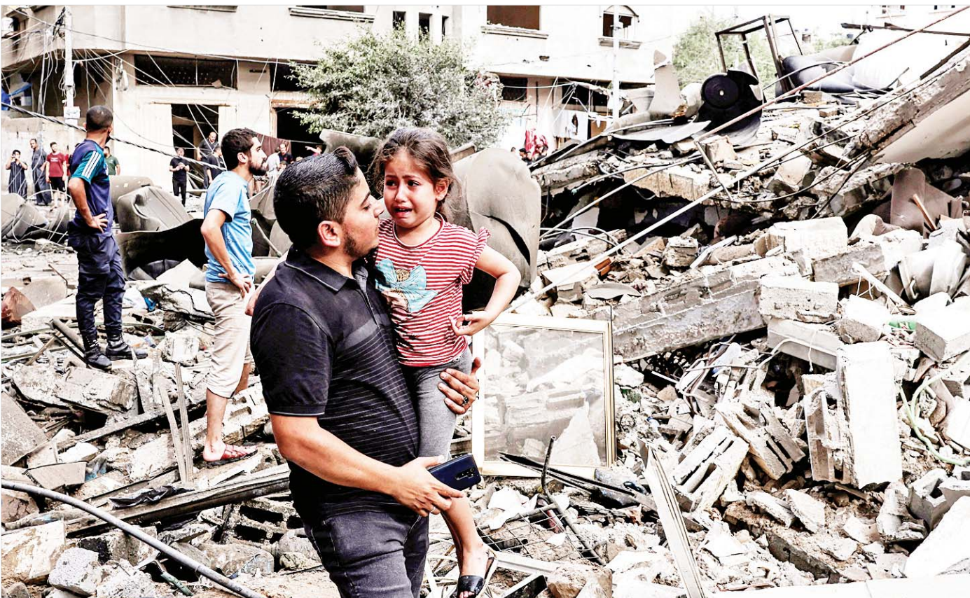
ဂါဇာကမ်းမြောက်ဒေသတွင် အစွဲအစား၏ လေကြောင်းတိုက်ခိုက်မှုကြောင့် ပျက်စီးခဲ့သော အဆောက်အအုံရှေ့တွင် ကလေးငယ်တစ်ဦးအား ကယ်ဆယ် နေသည်ကို တွေ့ရစဉ်။

ယနေ့ အစွဲအစား-ဟားမားစစ်စစ်မှာလည်း ထိုနည်းအတိုင်းပါပဲ။ မီဒီယာချင်း အသည်းအသန် စစ်ခင်းနေကြတာ တွေ့ရပါတယ်။ လက်နက်ချင်း ယှဉ်ပြိုင်တိုက်ခိုက်ခြင်းက စစ်တပ်တစ်ခု၊ ဒေသ တစ်ခုကိုသာ အနိုင်ရနိုင်ပေမယ့် မီဒီယာနဲ့ ဝါဒဖြန့် အားသာချက်က လူ့အဖွဲ့အစည်းကြီး တစ်ခုလုံးအပေါ် ဂယက်ရိုက်သွားနိုင်ပါတယ်။