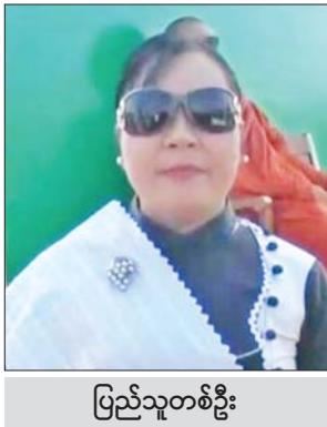
ပြည်သူတစ်ဦး