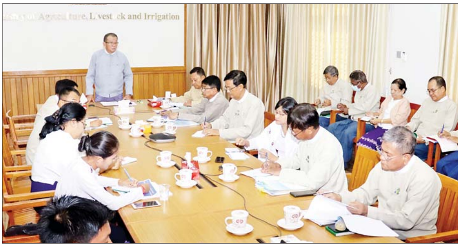
ဆွေးနွေးပွဲများ ကျင်းပပေးလျက်ရှိရာ ယနေ့ဆွေးနွေး ပွဲတွင် စိုက်ပျိုးရေး၊ မွေးမြူရေးနှင့် ဆည်မြောင်း ဝန်ကြီးရုံးဝန်ထမ်းများ အတွင်းနိုင်ငံတွင် ကျင်းပခဲ့သည့် မြေအောက်ရေစီမံခန့်ခွဲရေး အဆင့်-၄ အစည်းအဝေး အတွေ့အကြုံများ၊ တရုတ်ပြည်သူ့သမ္မတနိုင်ငံတွင်

နေပြည်တော် နိုဝင်ဘာ ၁၄ လယ်ယာကဏ္ဍအတွက် အဓိကလိုအပ်ချက် တစ်ခုဖြစ်သည့် ရေအရင်းအမြစ်များ စီမံခန့်ခွဲခြင်း ဆိုင်ရာ ပြည်ပဆွေးနွေးပွဲများနှင့် သင်တန်းအတွေ့ အကြုံများ နှီးနှောဖလှယ်ဆွေးနွေးခြင်းကို ယနေ့ မွန်းလွဲပိုင်းက စိုက်ပျိုးရေး၊ မွေးမြူရေးနှင့် ဆည်မြောင်းဝန်ကြီးဌာန ပြည်ထောင်စုဝန်ကြီးရုံး အစည်းအဝေးခန်းမ၌ ကျင်းပရာ အခမ်းအနားတွင် ဒုတိယဝန်ကြီး ဦးဗိုလ်ဗိုလ်ကျော် တက်ရောက်၍ ဆွေးနွေးအမှာစကား ပြောကြားသည်။ အတွေ့အကြုံများဆွေးနွေး နိုင်ငံဝန်ထမ်းများအနေဖြင့် နည်းပညာအသစ် များ စဉ်ဆက်မပြတ် လေ့လာနိုင်ရေးနှင့် လုပ်ငန်း အတွေ့အကြုံများ အပြန်အလှန် မျှဝေဖလှယ်နိုင်ရေး အတွက် ကဏ္ဍအလိုက် ပြည်တွင်း ပြည်ပသင်တန်း များ၊ ဆွေးနွေးပွဲအတွေ့အကြုံများ နှီးနှောဖလှယ်