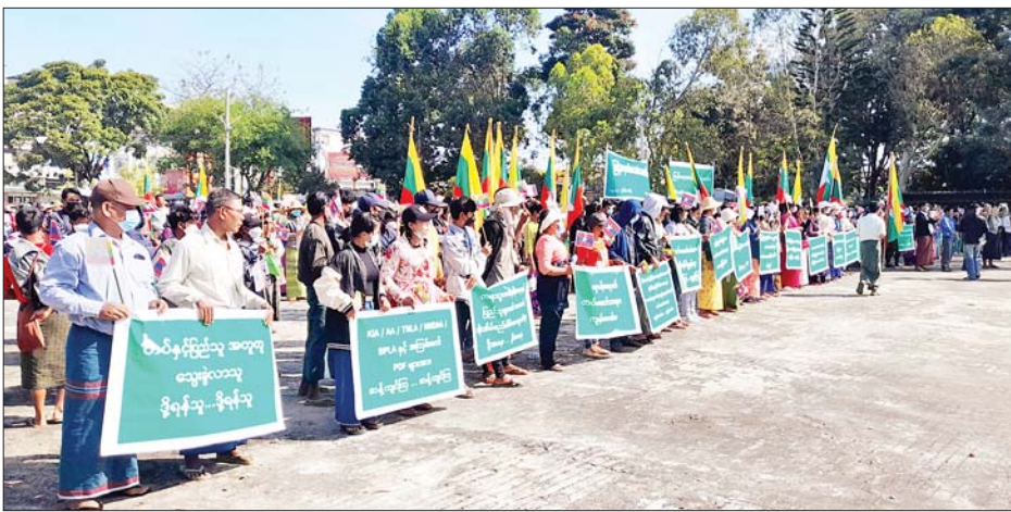
မကွေးမြို့၌ နိုင်ငံတော်ကာကွယ်ရေးနှင့် လုံခြုံရေးတာဝန် ထမ်းဆောင်နေကြသည့် တပ်မတော်သား များအား ထောက်ခံပွဲကျင်းပစဉ်။

နေပြည်တော် နိုဝင်ဘာ ၁၄ နိုင်ငံတော် ကာကွယ်ရေးနှင့် လုံခြုံရေးတာဝန်များကို စွမ်းစွမ်း တမ်းဆောင်နေကြသည့် တပ်မတော်သားများ၊ မြန်မာနိုင်ငံ ရဲတပ်ဖွဲ့ဝင်များ၊ ပြည်သူ့စစ်များ နှင့် ၎င်းတို့၏မိသားစုဝင်များ အားလုံးကို ငြိမ်းချမ်းရေးလိုလား သည့် ပြည်သူများက အားပေး ထောက်ခံလျက်ရှိကြသည်။