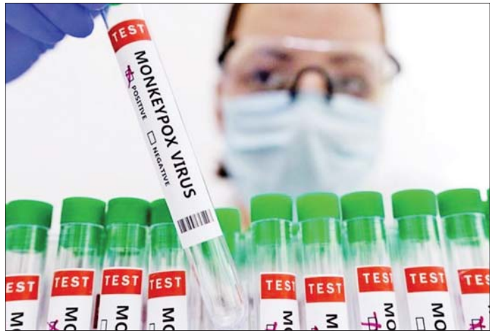
ဆွေးနွေးမှုများပြုလုပ်ရန် ကျန်းမာရေးစောင့်ရှောက်မှုဌာနများ၊ နယ်စပ်များနှင့် ရပ်ရွာများရှိ ဒေသန္တရ ကျန်းမာရေးစောင့်ရှောက်မှု အေဂျင်စီများကို ကျန်းမာရေးဝန်ကြီးဌာနက ညွှန်ကြားထားသည်။ ရောဂါကူးစက်မှုကို ထိန်းချုပ်နိုင်ရန် နည်းလမ်းများ ချမှတ်လုပ်ဆောင်ရန် ကျန်းမာရေးဝန်ကြီးဌာနက ကြိုးပမ်းလျက်ရှိသည်။

ဟနွိုင်း နိုဝင်ဘာ ၉ ဗီယက်နမ်နိုင်ငံ၌ အောက်တိုဘာ ၃၁ ရက်အထိ ပြည်နယ်နှင့် မြို့ကြီး ခုနစ်ခုတွင် မျောက်ကျောက်ရောဂါကူးစက်ခံရသူ ၅၆ ဦးရှိကြောင်း ကျန်းမာရေးဝန်ကြီးဌာန၏ နောက်ဆုံးသတင်းထုတ်ပြန်ချက်အရ သိရသည်။ ရောဂါကူးစက်ခံရသူ ၆၃ ရာခိုင်နှုန်းခန့်သည် ခုခံအားကျဆင်းသည့် (HIV) ရောဂါရှိကြောင်း စစ်ဆေးတွေ့ရှိရကြောင်း ဒေသတွင်းမီဒီယာများက နိုဝင်ဘာ ၉ ရက်တွင် သတင်းဖော်ပြသည်။ အဆိုပါရောဂါကူးစက်ခံရသူများအနက် နှစ်ဦးသည် ပြည်ပနိုင်ငံများမှ ဖြစ်သည်။ ဟိုချီမင်းမြို့ တောင်ပိုင်းတွင် သာမက အခြားမြို့ကြီးများတွင်လည်း မျောက်ကျောက်ရောဂါကူးစက်ခံရသူများ ဆက်လက် စစ်ဆေးတွေ့ရှိနိုင်သည်ဟု ကျန်းမာရေးဝန်ကြီးဌာနက ခန့်မှန်းထားသည်။ ရောဂါကူးစက်မှုကို စောစီးစွာသိရှိနိုင်စေရန်နှင့် ကုသမှုဆိုင်ရာ တိုင်ပင်