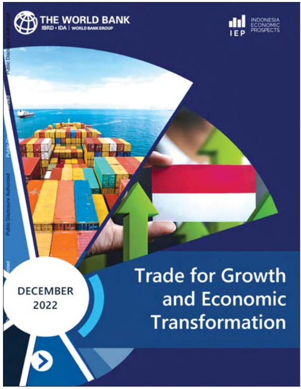
အင်ဒိုနီးရှားနိုင်ငံ၏ စီးပွားရေးအလားအလာနှင့်ပတ်သက်၍ ကမ္ဘာ့ဘဏ်က ယမန်နှစ်ဒီဇင်ဘာလတွင် ထုတ်ဝေခဲ့သည့်အစီရင်ခံစာ။

ကျေးလက်ဒေသစိုက်ပျိုးစီးပွားဖွံ့ဖြိုးရေး(Rural Agribusiness Development-PUAP)အစီအစဉ်သည် လုပ်ကွက်ငယ်တောင်သူများ အတွက် အရင်းအနှီးထောက်ပံ့ပေးသည့် အစီအစဉ်တစ်ခုဖြစ်ပြီး ရရှိလာသော ရန်ပုံငွေများကို လယ်ယာထွက်ကုန်လုပ်ငန်းများ ရောင်းဝယ်ဖောက်ကားရေးနှင့် အခြားစိုက်ပျိုးရေးအခြေခံ စီးပွားရေး လုပ်ငန်းများအတွက် အချိုးကျခွဲဝေပေးခြင်းဖြစ်သည်။ ယင်းမှတစ်ဆင့် သမဝါယမအသင်းအဖြစ်သို့ အသွင်ကူးပြောင်းဖွဲ့စည်းကာ ဒေသဆိုင်ရာ အစိုးရများက ယင်းအစီအစဉ်ကို ယနေ့အချိန်အထိ ဆောင်ရွက်နေဆဲ ဖြစ်သည်။ မြန်မာနိုင်ငံတွင်လည်း နိုင်ငံတော်စီမံအုပ်ချုပ်ရေး ကောင်စီ၏ ဦးဆောင်မှုဖြင့် နိုင်ငံစီးပွားမြှင့်တင်ရေးရန်ပုံငွေဖြင့် မိုး/ နွေစပါး၊ ပဲနှင့် ဆီထွက်သီးနှံများအတွက် လိုအပ်သော သွင်းအားစု များကို သက်သာသောအတိုးနှုန်းဖြင့် ထောက်ပံ့လျက်ရှိပါသည်။