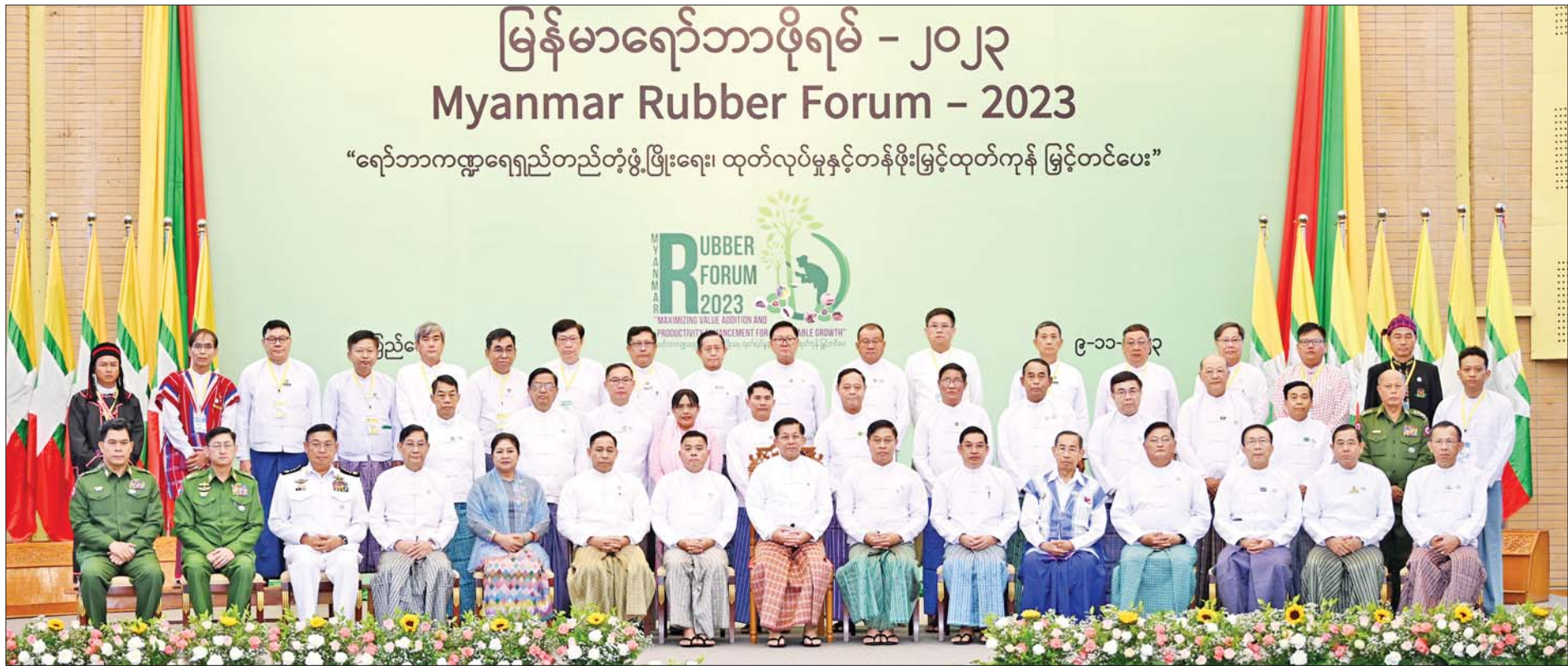
နိုင်ငံတော်စီမံအုပ်ချုပ်ရေးကောင်စီဥက္ကဋ္ဌ နိုင်ငံတော်ဝန်ကြီးချုပ် ဗိုလ်ချုပ်မှူးကြီးမင်းအောင်လှိုင်နှင့် တာဝန်ရှိသူများ၊ မြန်မာနိုင်ငံ ရော်ဘာစိုက်ပျိုးထုတ်လုပ်မှုဆိုင်ရာ အသင်းအဖွဲ့များမှ တာဝန်ရှိသူများ၊ ရော်ဘာစိုက် တောင်သူများနှင့်အတူ စုပေါင်းမှတ်တမ်းတင် ဓာတ်ပုံရိုက်စဉ်။

»» စာမျက်နှာ ၃ မှ စီးပွားရေးအရ တွက်ခြေကိုက်မှုအပေါ် ချိန်ဆပြီး ရော်ဘာမျိုးကောင်းများ ပြောင်းလဲစိုက်ပျိုးရေး၊ တိုးချဲ့စိုက်ပျိုးရေးကို အလေးထားဆောင်ရွက်ရန်သင့်ပါကြောင်း၊ မြန်မာနိုင်ငံတွင် ရော်ဘာစိုက်ပျိုးရေးအတွက် သင့်တော်သည့် ရာသီဥတုနှင့် မြေနေရာများစွာရှိသည့် အတွက် ရော်ဘာ တိုးချဲ့စိုက်ပျိုးရေးကိုလည်း အားပေးကြရမည်ဖြစ်ကြောင်း၊ တစ်ဖက်မှလည်း မိမိတို့ ရေမြေသာသာနှင့် ကိုက်ညီပြီး ရောဂါဒဏ်ခံနိုင်ရည်ရှိသည့် ရော်ဘာအထွက်ကောင်းမျိုးများ မွေးမြူထုတ်လုပ်နိုင်ရန် လိုအပ်သည့်သုတေသနများကို နှစ်ရှည်ပင်များ သုတေသနနှင့် နည်းပညာဖွံ့ဖြိုးရေးဌာနက စဉ်ဆက်မပြတ် သုတေသနပြု ဆောင်ရွက်ရန် တိုက်တွန်းပြောကြားလိုပါကြောင်း။ မှန်ကန်သည့်နည်းစနစ်ကျင့်သုံးရော်ဘာတစ်ဧက အထွက်နှုန်း တိုးတက်ရုံတင်မက အရည်အသွေး ကောင်းမွန်စေရေးအတွက်လည်း ရော်ဘာအစေးခဲလုပ်ငန်းစဉ်၌ မှန်ကန်သည့်နည်းစနစ်ကျင့်သုံးရေး၊ မှန်ကန်သည့် ဓာတုပစ္စည်းများသုံးစွဲရေး ပညာပေးခြင်း၊ အရည်အသွေးအာမခံချက်ရှိသည့် ရော်ဘာများ ထုတ်လုပ်နိုင်ရေး ရော်ဘာတောင်သူ အစုအဖွဲ့များ စုဖွဲ့လုပ်ဆောင်ခြင်းစသည့် လုပ်ငန်းများကို သက်ဆိုင်ရာဌာနများ၊ ပုဂ္ဂလိကလုပ်ငန်းရှင်များ၊ အသင်းအဖွဲ့များအားလုံး ပူးပေါင်းပါဝင်ဆောင်ရွက်ပေးရန် လိုအပ်ပါကြောင်း၊ မြန်မာ့ရော်ဘာ၏ အရည်အသွေးနှင့် အဆင့်အတန်းအာမခံချက်ရှိမှသာလျှင် ဈေးကွက်ရရှိနိုင်မည် ဖြစ်သည့်အတွက် စိုက်ပျိုးရေး၊ မွေးမြူရေးနှင့်