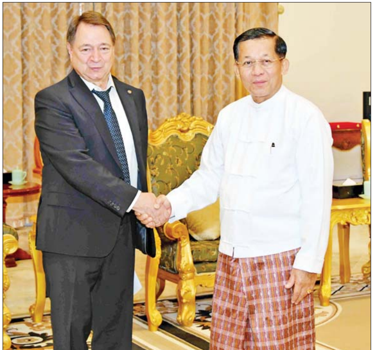
နိုင်ငံတော်စီမံအုပ်ချုပ်ရေးကောင်စီဥက္ကဋ္ဌ နိုင်ငံတော်ဝန်ကြီးချုပ် ဗိုလ်ချုပ်မှူးကြီးမင်းအောင်လှိုင် ရှုရှားဖက်ဒရေးရှင်းနိုင်ငံ ရော့စ်ကွန်ဂရက်ရင်းနှီးမြှုပ်နှံမှု ရန်ပုံငွေအဖွဲ့မှ အမှုဆောင်အရာရှိချုပ် Mr. Alexander Sergeevich SHATIROV အား ရင်းရင်းနှီးနှီး နှုတ်ဆက်စဉ်။