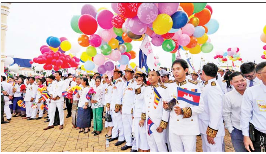
ကို ထွန်းညှိ၍ ပြင်သစ်ကိုလိုနီတွင် အခမ်းအနားကျင်းပပြီးနောက် ဘုရင်နှင့် ဝန်ကြီးချုပ်တို့သည် တော်ဝင်နန်းတော် ရှေ့ဘက်သို့ မော်တော်ယာဉ်များဖြင့် ချီတက်ခဲ့ကြပြီး လွတ်လပ်ရေးနေ့အထိမ်း

ဖနောင့်ပင် နိုဝင်ဘာ ၉ ကမ္ဘောဒီးယားနိုင်ငံ လွတ်လပ်ရေးရရှိသည့် နှစ်(၇၀)ပြည့် အထိမ်းအမှတ်အခမ်းအနားကို နိုဝင်ဘာ ၉ ရက်က မြို့တော်ဖနောင့်ပင်တွင် ကျင်းပခဲ့ရာ နိုင်ငံ၏ ငြိမ်းချမ်းရေး၊ လုံခြုံရေး၊ တည်ငြိမ်ရေးနှင့် ဖွံ့ဖြိုးတိုးတက်ရေးတို့ကို ကာကွယ်စောင့်ရှောက်ရန် စည်းလုံးညီညွတ်စွာ နေထိုင်သွားမည်ဖြစ်ကြောင်း ကမ္ဘောဒီးယား နိုင်ငံသားများက ကတိပြုခဲ့သည်။ တက်ရောက် အဆိုပါ အခမ်းအနားကို နိုင်ငံ၏ဘုရင် နိရိုဒွန်ဆီဟာမိုနီ ဦးဆောင်၍ ကျင်းပခဲ့ပြီး အမျိုးသားလွှတ်တော်ဥက္ကဋ္ဌ ခွန်ဆုဒရီ၊ အထက်လွှတ်တော်ဥက္ကဋ္ဌ ဆေခွန်နှင့် ဝန်ကြီးချုပ် ဟွန်မာနက်တို့ တက်ရောက်ခဲ့သည်။ အဆိုပါ အခမ်းအနားတွင် ဘုရင်ဆီဟာမိုနီက လွမ်းသူ့ပန်းခွေချကာ လွတ်လပ်ရေးကျောက်တိုင်၌ အောင်ပွဲခံမီးတိုင်