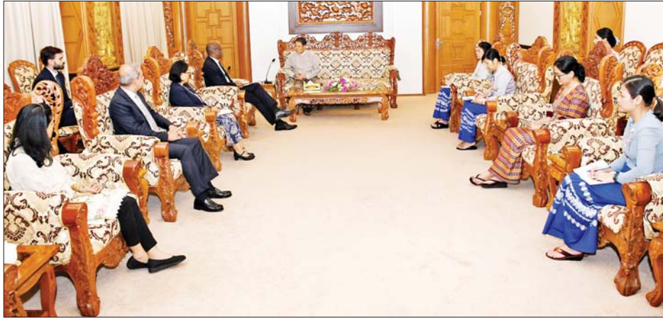
UNHCR ၏ အရာရှိ၊ ရန်ကုန်မြို့အခြေစိုက် UNHCR ရုံး၏ မြန်မာ ညွှန်ကြားရေးမှူး၊ နယူးယောက်မြို့အခြေစိုက် UNHCR ဆက်ဆံရေးရုံး၏ ညွှန်ကြားရေးမှူး၊ ဗန်ကောက်မြို့အခြေစိုက် UNHCR ၏ အရာရှိနှင့် ပစ်ဖိတ်ဒေသဆိုင်ရာရုံး၏ အကြီးတန်းနိုင်ငံရေးရာ သတင်းစဉ်

နေပြည်တော် နိုဝင်ဘာ ၉ ဒုတိယဝန်ကြီးချုပ်နှင့် နိုင်ငံခြားရေးဝန်ကြီးဌာန ပြည်ထောင်စုဝန်ကြီး ဦးသန်းဆွေသည် ကုလသမဂ္ဂ ဒုက္ခသည်များဆိုင်ရာ မဟာမင်းကြီးရုံး (United Nations High Commissioner for Refugees - UNHCR) ၏ လုပ်ငန်းလည်ပတ်မှုဆိုင်ရာ လက်ထောက် မဟာမင်းကြီး Mr. Raouf Mazou ဦးဆောင်သည့် ကိုယ်စားလှယ်အဖွဲ့အား ယနေ့နံနက် ၁၀ နာရီတွင် နေပြည်တော်ရှိ နိုင်ငံခြားရေးဝန်ကြီးဌာန၌ လက်ခံ တွေ့ဆုံသည်။