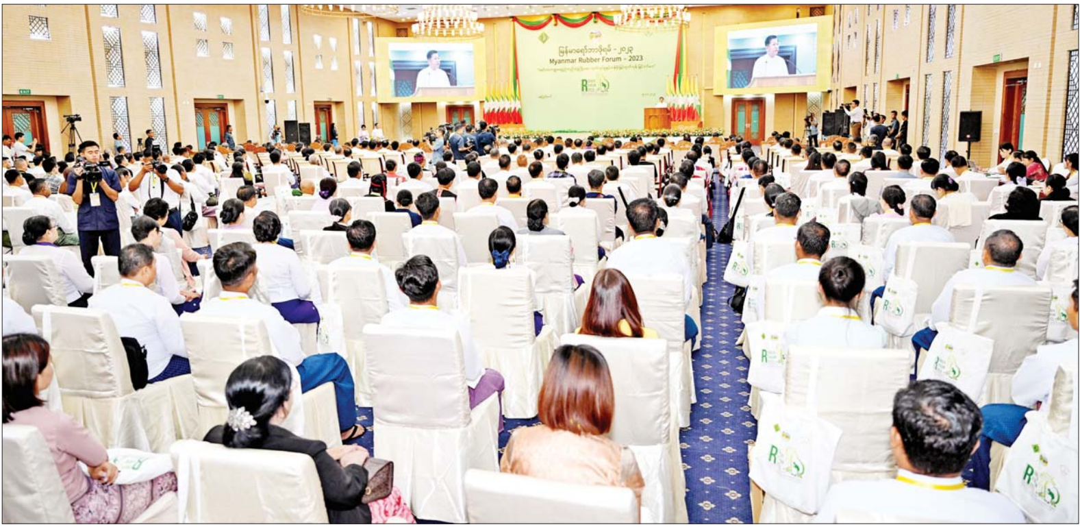
နိုင်ငံတော်စီမံအုပ်ချုပ်ရေးကောင်စီဥက္ကဋ္ဌ နိုင်ငံတော်ဝန်ကြီးချုပ် ဗိုလ်ချုပ်မှူးကြီးမင်းအောင်လှိုင် မြန်မာရော်ဘာဖိုရမ် - ၂၀၂၃ ဖွင့်ပွဲအခမ်းအနားတွင် အမှာစကားပြောကြားစဉ်။

❖ ရှေ့ဖို့မှ ထုတ်ကုန်ပစ္စည်း ထုတ်လုပ်သူများ၊ တိုင်းဒေသကြီးနှင့် ပြည်နယ်များမှ ရော်ဘာစိုက်ပျိုးထုတ်လုပ်သူများ၊ စိုက်ပျိုးရေးဦးစီးဌာနမှ ကိုယ်စားလှယ်များနှင့် ဖိတ်ကြားထားသူများ တက်ရောက်ကြသည်။ ရည်ရွယ်ချက်(၃)ရပ်ဖြင့် ကျင်းပဦးစွာ နိုင်ငံတော်စီမံအုပ်ချုပ်ရေးကောင်စီဥက္ကဋ္ဌ နိုင်ငံတော်ဝန်ကြီးချုပ်က အမှာစကားပြောကြားရာတွင် ယနေ့ကျင်းပပြုလုပ်သည့် “မြန်မာရော်ဘာဖိုရမ် - ၂၀၂၃” ကို ရော်ဘာထုတ်လုပ်မှုနှင့် အရည်အသွေး တိုးတက်မြှင့်တင်ရေး၊ ယှဉ်ပြိုင်နိုင်စွမ်းရှိသော ရော်ဘာအခြေခံ တန်ဖိုးမြှင့်ထုတ်ကုန်များ ထုတ်လုပ်သည့်လုပ်ငန်းများ ဖွံ့ဖြိုးတိုးတက်လာစေရေးနှင့် ရော်ဘာကဏ္ဍ ဖွံ့ဖြိုးတိုးတက်ရေးအတွက် လိုအပ်သော အဖွဲ့အစည်းများ၊ မူဝါဒ၊ ဥပဒေနှင့် လုပ်ထုံးလုပ်နည်းများ ထွက်ပေါ်လာစေရေးဆိုသည့် ရည်ရွယ်ချက်(၃)ရပ်ဖြင့် ကျင်းပခြင်းဖြစ်ပြီး ဆောင်ပုဒ်မှာ “ရော်ဘာကဏ္ဍ ရေရှည်တည်တံ့ဖွံ့ဖြိုးရေး၊ ထုတ်လုပ်မှုနှင့် တန်ဖိုးမြှင့်ထုတ်ကုန်မြှင့်တင်ပေး”ဟု သတ်မှတ်ထားပါကြောင်း။ မိမိတို့နိုင်ငံတွင် ဆန်စပါး၊ ပဲမျိုးစုံ၊ ဆီထွက်သီးနှံများ စသည့် သီးနှံအမျိုးပေါင်း ၆၁ မျိုး၊ စုစုပေါင်း သီးနှံစိုက်ဧရိယာဧက ၄၉ ဒသမ ၃၉ သန်း စိုက်ပျိုးထုတ်လုပ်လျက် ရှိပါကြောင်း၊ စက်မှုကုန်ကြမ်းသီးနှံဖြစ်သည့် ရော်ဘာကို တိုင်းဒေသကြီးနှင့် ပြည်နယ် ကိုးခုတွင် ဧက ၁ ဒသမ ၆၄ သန်း စိုက်ပျိုးထားရှိပြီး အစေးဖြစ်စေ တစ်သန်းနီးပါးမှ ရော်ဘာတန်ချိန် သုံးသိန်းကျော်