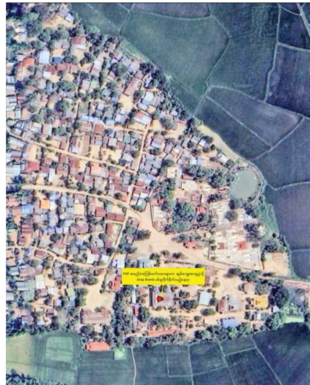
PDF အမည်ခံအကြမ်းဖက်သမားများက သီးလုံးကျေးရွာရှိ ဆွမ်းကျွေးအလှူပွဲကို Drop Bomb များ ပစ်ချတိုက်ခိုက်ခဲ့သည့် နေရာပြပုံ။