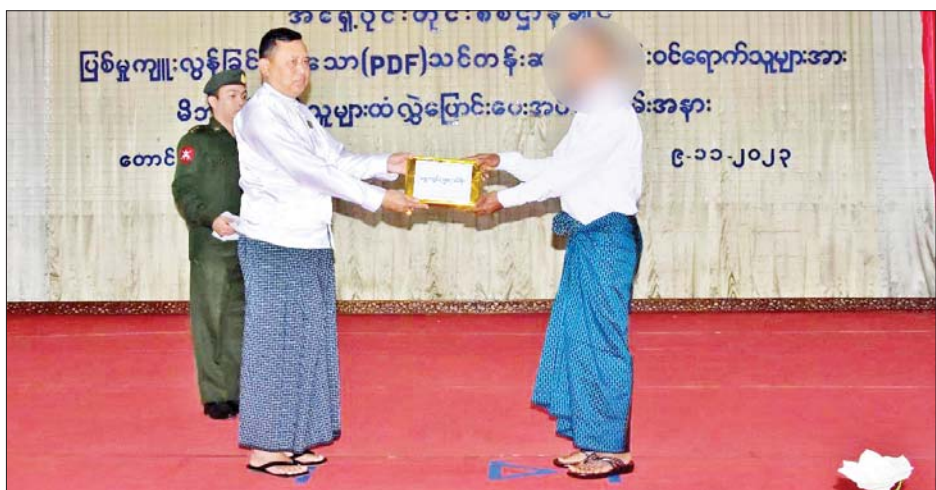
မိဘအုပ်ထိန်းသူများထံသို့ လွှဲပြောင်းပေးအပ်သည်။ ထိုသို့ နိုင်ငံတော်စီမံအုပ်ချုပ်ရေးကောင်စီမှ ဥပဒေဘောင်အတွင်း ဝင်ရောက်လာသူများအား ပြန်လည်ကြိုဆိုလက်ခံ၍ လက်နက်/ခဲယမ်းများ ပါရှိမှုအတွက် ဆုကြေးငွေများ ပေးအပ်လျက်ရှိခြင်းနှင့် လိုအပ်သည့် ကူညီပံ့ပိုးမှုများ ဆောင်ရွက်ပေးလျက် ရှိခြင်းတို့ကြောင့် ဥပဒေဘောင်အတွင်းသို့ ပြန်လည်

နယ်မြေဒေသတည်ငြိမ်အေးချမ်းရေးနှင့် တရားဥပဒေဆိုင်ရာပုဒ်မများကို ရှင်းလင်းဆွေးနွေးပြောကြားသည်။ ထို့နောက် ဥပဒေဘောင်အတွင်း ပြန်လည်ဝင်ရောက်လာသည့် ပြစ်မှုကျူးလွန်ခြင်း မရှိသော ရှမ်းပြည်နယ်(တောင်ပိုင်း) ရွာငံမြို့နယ်မှ PDF အဖွဲ့ဝင် အမျိုးသား ခုနစ်ဦးသည် ၎င်းတို့နှင့်အတူ ပါလာသည့် ကာဘိုင် တစ်လက်၊ ၎င်းကျည် ၁၀ တောင့်၊ M-22 တစ်လက်နှင့် ၎င်းကျည် ငါးတောင့်တို့ကို အပ်နှံရာ တိုင်းမှူးက လက်ခံရယူခဲ့သည်။ ယင်းနောက် ပြည်နယ်ဝန်ကြီးချုပ်၊ တိုင်းမှူးနှင့် တာဝန်ရှိသူများက လက်နက်ပါရှိသူ နှစ်ဦးအတွက် သေနတ်တစ်လက် လျှင် ဆုကြေးငွေကျပ်သိန်း ၅၀ နှုန်းဖြင့် သေနတ် နှစ်လက်အတွက် ဆုကြေးငွေကျပ်သိန်း ၁၀၀ နှင့် တစ်ဦးလျှင် ထောက်ပံ့ငွေကျပ် ငါးသိန်းစီ ထောက်ပံ့ပေးအပ်ရာ ဥပဒေဘောင်အတွင်း ပြန်လည်ဝင်ရောက်လာသူများက လက်ခံရယူပြီး ဥပဒေဘောင်အတွင်း ပြန်လည်ဝင်ရောက်လာသူတစ်ဦးက ကျေးဇူးတင်စကား ပြန်လည်ပြောကြားသည်။ ထို့နောက် ဥပဒေဘောင်အတွင်း ပြန်လည်ဝင်ရောက်လာသူများအား ဝန်ခံကတိ လက်မှတ်ရေးထိုးစေကာ ၎င်းတို့၏