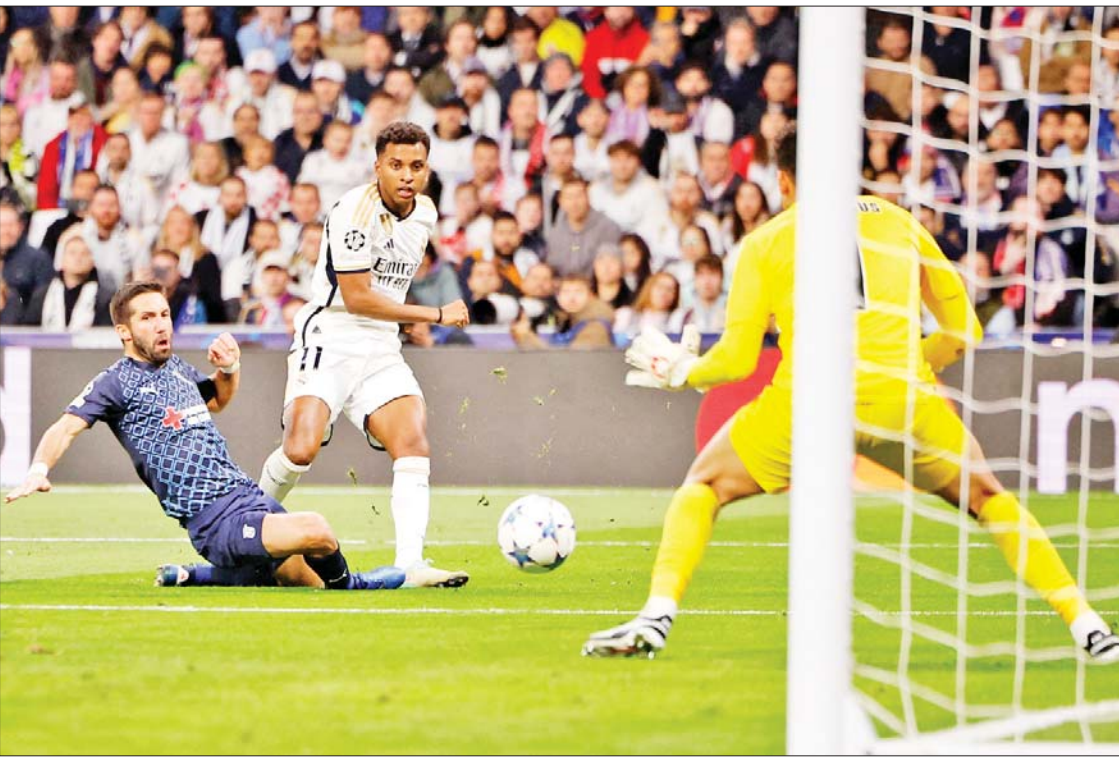
ရီးယဲလ်မက်ဒရစ်အသင်းနှင့် စပို့တင်းဘရာဂါအသင်းတို့ ယှဉ်ပြိုင်ကစားကြစဉ်။