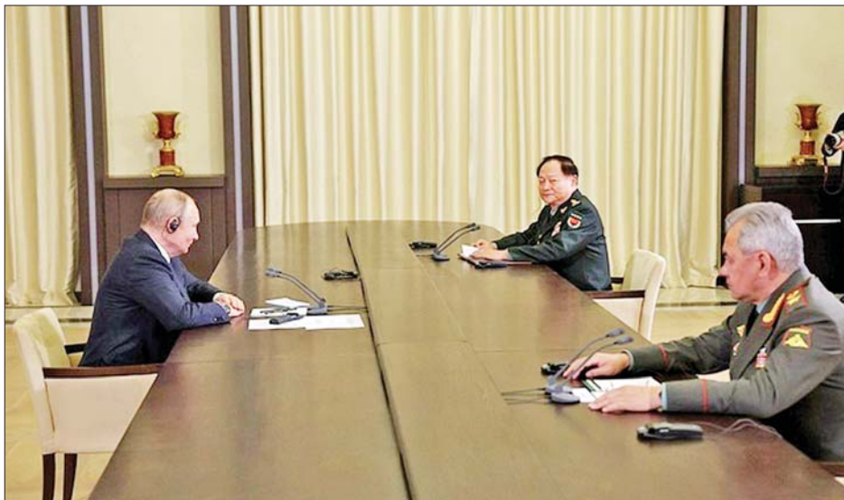
တရုတ်နိုင်ငံနှင့် ရုရှားနိုင်ငံတို့ကြား ချစ်ကြည်ရင်းနှီးမှုသည် အချိန်နှင့်အမျှ စဉ်ဆက်မပြတ် တိုးတက်ဆိုင်ရာလောကကြောင်း Zhang က မှတ်ချက်ပြုခဲ့သည်။ ယခုနှစ်တွင် နှစ်နိုင်ငံခေါင်းဆောင်များသည်

မော်စကို နိုဝင်ဘာ ၉ တရုတ်-ရုရှား နှစ်နိုင်ငံအကျိုးစီးပွားဖြစ်ထွန်းရေး၊ ဒေသတွင်းနှင့် ကမ္ဘာကြီး၏ သယံဇာတပြောရေး၊ တည်ငြိမ်ရေးတို့အတွက် ရုရှားနိုင်ငံနှင့် လက်တွဲကြိုးပမ်းဆောင်ရွက်သွားမည်ဖြစ်ကြောင်း ရုရှား သမ္မတ ဗလာဒီမီာပူတင်နှင့် နိုဝင်ဘာ ၈ ရက်၌ မော်စကို မြို့တွင် တွေ့ဆုံစဉ် တရုတ်နိုင်ငံ ဗဟိုစစ်ကော်မရှင် ဒုတိယဥက္ကဋ္ဌ Zhang Youxia က ပြောကြားသည်။ မိမိတို့နှစ်နိုင်ငံ၏ မိတ်ဆွေအဖြစ် တည်ရှိနေမှုသည် ဒေသတွင်းနှင့် ကမ္ဘာကြီး၏ ငြိမ်းချမ်းရေးနှင့် တည်ငြိမ်ရေးတို့အတွက် အထောက်အကူပြုကြောင်း ပူတင်က မှတ်ချက်ပြုပြောကြားသည်။ တရုတ်-ရုရှား နှစ်နိုင်ငံအကြား ပြီးခဲ့သည့်နှစ်များအတွင်း ကုန်သွယ်ရေးနှင့် စီးပွားရေး ကူးလူးဆက်ဆံရေးများတွင် တိုးတက်မှုများရှိခဲ့ပြီး ရန်ပုံငွေပူးပေါင်းဆောင်ရွက်ရေးအဖွဲ့၊ BRICS နှင့် ကုလသမဂ္ဂတို့မှတစ်ဆင့် အပြည်ပြည်ဆိုင်ရာ ပူးပေါင်းဆောင်ရွက်မှုများကို ဆောင်ရွက်နိုင်ခဲ့ကြောင်း ပူတင်က ထပ်လောင်းပြောကြားသည်။ ထို့ပြင် မိမိတို့နှစ်နိုင်ငံအကြား