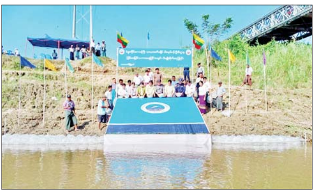
အဖွဲ့အတွင်းရေးမှူး ဒုတိယရဲမှူး ဦး၊ ခရိုင်ငါးမျိုးစိုက်ထည့်ခြင်းကြီးဉာဏနှင့်အဖွဲ့ဝင်များ၊ ဒုတိယကြီးကြပ်ကွပ်ကဲရေးကော်မတီအဖွဲ့ဝင်များ၊ ခရိုင်ငါးလုပ်ငန်း

ပဲခူးတိုင်းဒေသကြီး သာယာဝတီခရိုင်ငါးလုပ်ငန်းဦးစီးဌာနက သာယာဝတီမြို့ ဖိုးခေါင်-စံရွေး ဆက်သွယ်ထားသော မြစ်မမြစ်ကူးတံတားအနီးရှိ မြစ်မမြစ်သာဘာဝရေပြင်အတွင်းသို့ ယနေ့နံနက် ၉ နာရီက ငါးမြစ်ချင်းနှင့် ငါးခုံးမကြီးသားပေါက်ကောင်ရေ ၁၀၀၀၀၀ ကို ငါးမျိုးစိုက်ထည့်ကြသည်။ အဆိုပါ အခမ်းအနားသို့ သာယာဝတီခရိုင် စီမံအုပ်ချုပ်ရေး