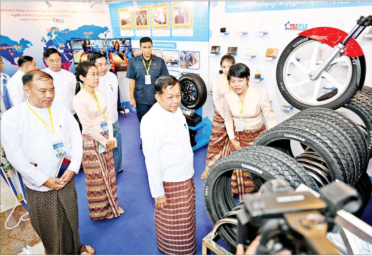
နိုင်ငံတော်စီမံအုပ်ချုပ်ရေးကောင်စီဥက္ကဋ္ဌ နိုင်ငံတော်ဝန်ကြီးချုပ် ဗိုလ်ချုပ်မှူးကြီးမင်းအောင်လှိုင် ပြည်တွင်းမှထုတ်လုပ်ထားရှိသည့် ရော်ဘာထုတ်ကုန်ပြခန်းများကို ကြည့်ရှုစဉ်။

နေပြည်တော် နိုဝင်ဘာ ၉ မြန်မာရော်ဘာဖိုရမ်-၂၀၂၃ ဖွင့်ပွဲ အခမ်းအနားကို ယနေ့နံနက်ပိုင်းတွင် နေပြည်တော်ရှိ မြန်မာအပြည်ပြည်ဆိုင်ရာ ကွန်ဗင်းရှင်းဗဟိုဌာန - ၂ (MICC-II)၌ ကျင်းပရာ နိုင်ငံတော်စီမံအုပ်ချုပ်ရေး ကောင်စီဥက္ကဋ္ဌ နိုင်ငံတော်ဝန်ကြီးချုပ် ဗိုလ်ချုပ်မှူးကြီး မင်းအောင်လှိုင် တက်ရောက်အမှာစကားပြောကြားသည်။ တက်ရောက် အခမ်းအနားသို့ နိုင်ငံတော်စီမံအုပ်ချုပ် ရေးကောင်စီ တွဲဖက်အတွင်းရေးမှူးနှင့် ကောင်စီဝင်များ၊ ပြည်ထောင်စုဝန်ကြီးများ၊ နေပြည်တော်ကောင်စီဥက္ကဋ္ဌ၊ ကာကွယ်ရေး ဦးစီးချုပ်ရုံးမှ အဆင့်မြင့်တပ်မတော် အရာရှိကြီးများ၊ နေပြည်တော်တိုင်း စစ်ဌာနချုပ်တိုင်းမှူး၊ ဒုတိယဝန်ကြီးများ၊ အမြဲတမ်းအတွင်းဝန်များ၊ ဌာနဆိုင်ရာ အကြီးအကဲများ၊ တိုင်းဒေသကြီးနှင့် ပြည်နယ်ဦးစီးမှူးများ၊ အမျိုးသားပို့ကုန် မဟာဗျူဟာ ရော်ဘာလုပ်ငန်းကဏ္ဍ ပို့ကုန်မဟာဗျူဟာ အကောင်အထည် ဖော်ရေး ကော်မတီဝင်များ၊ ပြည်တွင်း Development Partner များ၊ ပညာရှင် များ၊ မြန်မာနိုင်ငံ ရော်ဘာစိုက်ပျိုး ထုတ်လုပ်သူများအသင်း၊ မြန်မာ့သဘာဝ ရော်ဘာရေရှည်တည်တံ့မှုဖော်ဆောင်ရေး အသင်း၊ ရော်ဘာအဝယ်ခိုင်များ၊ ပြုပြင် ထုတ်လုပ်သည့်စက်ရုံများ၊ ရော်ဘာအခြေခံ စာမျက်နှာ ၃ ကော်လံ ၁ သို့ ✦