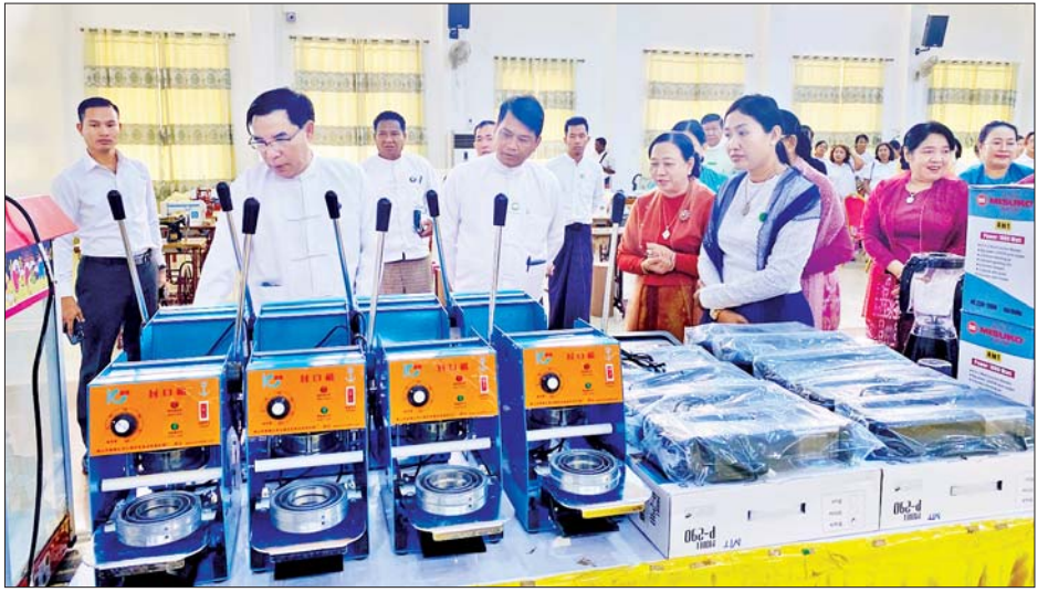
ခွဲကြသည်။

ယင်းနောက် ထူးချွန်သင်တန်းသား သင်တန်းသူ များနှင့် အမှတ်တရ စုပေါင်းမှတ်တမ်းတင်ဓာတ်ပုံ ရိုက်ကူးခဲ့ကြပြီး တိုင်းဒေသကြီးဝန်ကြီးချုပ်နှင့် ဇနီးတို့က ခင်းကျင်းပြသထားသည့် ဒေသဖွံ့ဖြိုးရေး လုပ်ငန်းသုံးပစ္စည်းများအား လှည့်လည်ကြည့်ရှု