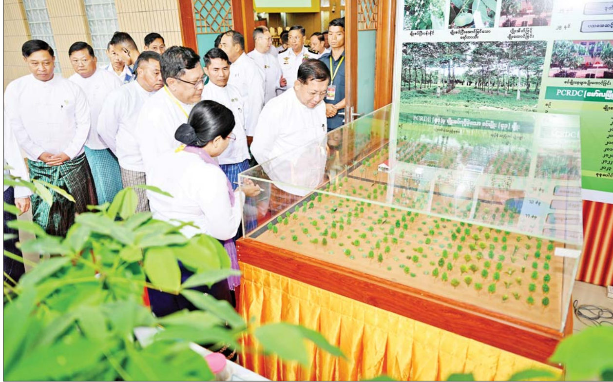
နိုင်ငံတော်စီမံအုပ်ချုပ်ရေးကောင်စီဥက္ကဋ္ဌ နိုင်ငံတော်ဝန်ကြီးချုပ် ဗိုလ်ချုပ်မှူးကြီးမင်းအောင်လှိုင် စိုက်ပျိုးရေးဦးစီးဌာန မြန်မာရော်ဘာစိုက်ပျိုးမှုဆိုင်ရာပြခန်းကို ကြည့်ရှုစဉ်။

စိုက်ပျိုးထားသည့် အထွက်နှုန်းနည်းသည့် မျိုးပေါင်းများကြောင့် ဖြစ်သည့်အတွက် ပင်အိတ်ပင်ပေါင်းများကို အစားထိုးစိုက်ပျိုးရန် လိုအပ်သည်ကို တွေ့ရှိပါကြောင်း၊ ဒေသအလိုက်ထောက်ခံထားသည့် မျိုးများအနက် တစ်ဧကလျှင်ပေါင် ၁၃၅၀ ခန့် ထွက်ရှိနိုင်သည့် မျိုးကောင်းမျိုးသန့် စိုက်ပျိုးပြီးစီးမှုသည် စိုက်ဧကအားလုံး၏ ၂၆ ဒသမ ၈၃ ရာခိုင်နှုန်းခန့်သာ ရှိသေးသည့်အတွက် နောင်စိုက်ခင်းသစ်များ ဆက်လက်ထူထောင်ရာတွင် အထွက်ကောင်းမျိုးများ စိုက်ပျိုးနိုင်ရေးနှင့် ဖူးဆက်ပျိုးပင်များ သုံးစွဲစိုက်ပျိုးရေးကို အလေးပေးဆောင်ရွက်ရန် လိုအပ်ပါကြောင်း၊ စာမျက်နှာ ၄ သို့ >>>