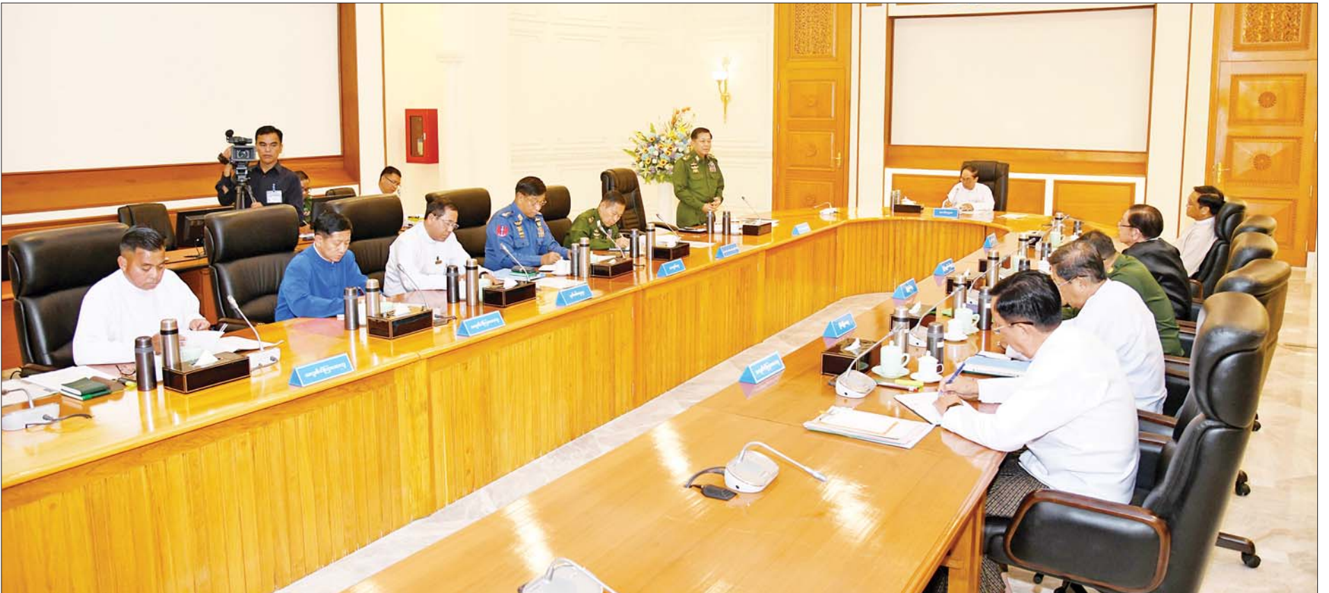
ပြည်ထောင်စုသမ္မတမြန်မာနိုင်ငံတော် အမျိုးသားကာကွယ်ရေးနှင့် လုံခြုံရေးကောင်စီအစည်းအဝေး(၃/၂၀၂၃) ကျင်းပစဉ်။