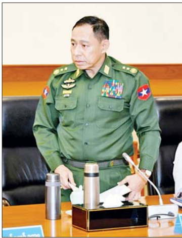
ပြည်ထောင်စုဝန်ကြီး ဒုတိယဗိုလ်ချုပ်ကြီးရာပြည့် တင်ပြစဉ်။

ပြန်လည်ရှင်းလင်းဆွေးနွေးတင်ပြမှုများနှင့် စပ်လျဉ်း၍ တပ်မတော်ကာကွယ်ရေးဦးစီးချုပ်က ပြန်လည် ရှင်းလင်းဆွေးနွေးရာတွင် အဓိကကျသည့် အချက် ၂ ချက်ကို ဦးစွာ ထောက်ပြလိုကြောင်း၊ မူးယစ်ဆေးဝါး နှိမ်နင်းရေးနှင့် မြန်မာနိုင်ငံ ရဲတပ်ဖွဲ့ စွမ်းရည်မြှင့်တင်ရေး ဖြစ်ကြောင်း၊ ယနေ့ ရှမ်းပြည်နယ်(မြောက်ပိုင်း)တွင် ဖြစ်ပွားနေသည့် ပြဿနာ၏ အစမှ မူးယစ်ဆေးဝါး ပြဿနာပင်ဖြစ်ကြောင်း၊ မူးယစ်ဆေးဝါးမှ ရရှိသော ငွေများဖြင့် အာဏာရရှိရေးကို လက်နက်ကိုင်လမ်းစဉ်ဖြင့် အသက်ဆက်ခဲ့ကြောင်း၊ ၎င်းလမ်းစဉ်ဖြင့် မူးယစ်ဆေးထုတ်လုပ်၊ သယ်ဆောင်ရောင်းချမှုကို ကာကွယ်ခဲ့ကြောင်း၊ လောင်းကစားကဲ့သို့ တရားမဝင် လုပ်ငန်းများကိုလည်း လုပ်ဆောင်ခဲ့ကြောင်း၊ ထို့ကြောင့် ပြဿနာ၏ အရင်းအမြစ်ဖြစ်သည့် မူးယစ်ဆေးဝါးအဖြစ် ပြတ်နှိမ်နင်းရေးကို ထိထိရောက်ရောက် ဆောင်ရွက်သွားရမည်ဖြစ်