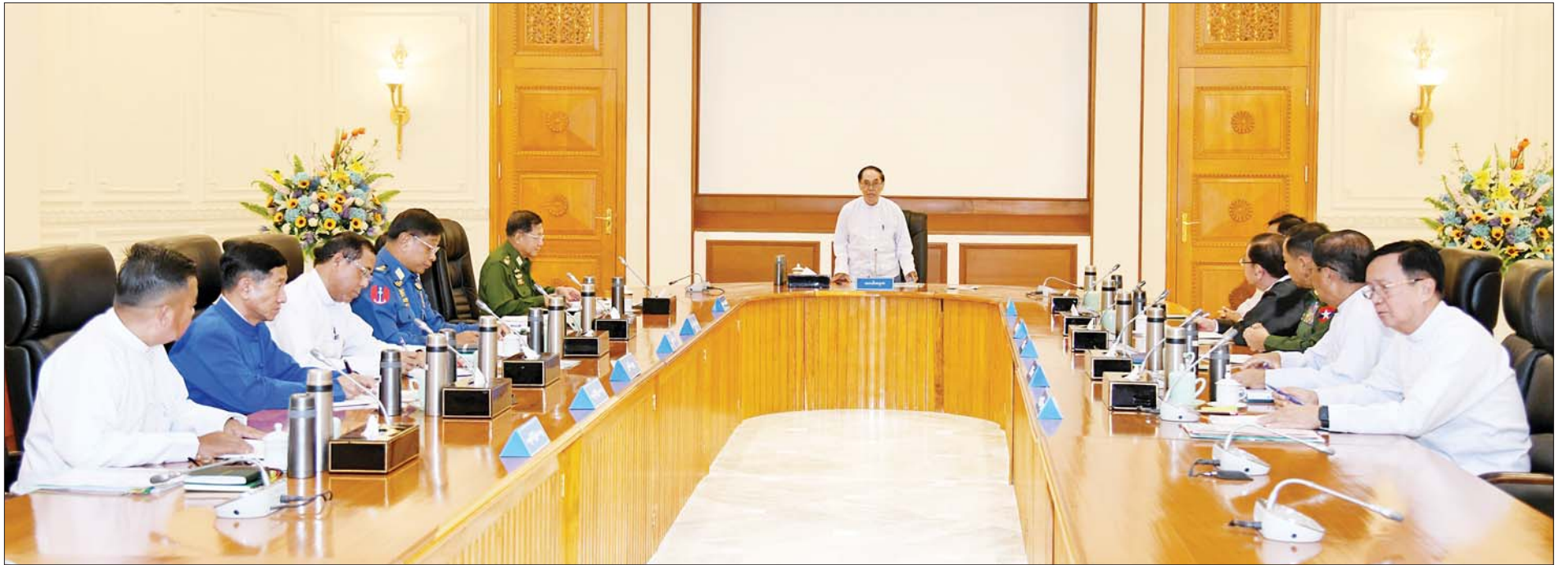
ပြည်ထောင်စုသမ္မတမြန်မာနိုင်ငံတော် အမျိုးသားကာကွယ်ရေးနှင့်လုံခြုံရေးကောင်စီအစည်းအဝေး(၃/၂၀၂၃) ကျင်းပစဉ်။

○ ရှေ့ဖို့မှ ဦးစွာ တပ်မတော်ကာကွယ်ရေးဦးစီးချုပ်က လတ်တလောဖြစ်ပွားလျက်ရှိသည့် ရှမ်းပြည်နယ်(မြောက်ပိုင်း)ဖြစ်စဉ်များနှင့် ဆက်စပ်လျက်ရှိသည့် အခြေအနေများကို ရှင်းလင်းတင်ပြလိုကြောင်း၊ အောက်တိုဘာ ၂၇ ရက်တွင် လောက်ကိုင်ဒေသ ချင်းရွှေဟော်ကို အဓိကထား၍ MNDA အသင်းကျန်းသို့ အဖွဲ့များက တိုက်ခိုက်ခဲ့ကြောင်း၊ အဆိုပါဖြစ်စဉ်သည် သာမန်အားဖြင့် MNDA မှတိုက်ခိုက်ခြင်းဖြစ်သော်လည်း သမိုင်းအရဆက်စပ်မှုများ ရှိကြောင်း၊ ၂၀၀၉ ခုနှစ်တွင် လောက်ကိုင်ဒေသ၌ ဖုန်ကြားရှင် ဦးစီးသည့် အထူးဒေသ(၁)ရှိကြောင်း၊ အဆိုပါ ဒေသတွင် မူးယစ်ဆေးဝါးများ ထုတ်လုပ်ရောင်းချခြင်း၊ လက်နက်ခဲယမ်းများထုတ်လုပ်ခြင်းများ လုပ်ဆောင်လျက်ရှိကြောင်း သတင်းရရှိသဖြင့် တပ်မတော်အနေဖြင့် ဆောင်ရွက်ခြင်းမပြုရန် တားဆီးခဲ့ကြောင်း၊ သို့သော် လိုက်နာဆောင်ရွက်ခြင်းမရှိသဖြင့် မိမိကိုယ်တိုင်ဦးစီး၍ မူးယစ်ဆေးဝါး တားဆီးနိုင်ရေး လုပ်ငန်းများကို ဆောင်ရွက်ခဲ့ကြောင်း၊ ထိုသို့ဆောင်ရွက်ချိန်တွင် မူးယစ်ဆေးဝါး ထုတ်လုပ်သည့် စက်ရုံများ၊ လက်နက်ခဲယမ်းထုတ်လုပ်သည့် စက်ရုံများကို သိမ်းဆည်းရမိခဲ့ပြီး မူးယစ်ဆေးဝါးမြောက်မြားစွာ ဖမ်းဆီးရမိခဲ့ကြောင်း၊ ထိုသို့ တပ်မတော်အနေဖြင့် မူးယစ်ဆေးဝါး နှိမ်နင်းရေး လုပ်ငန်းများ ဆောင်ရွက်ခဲ့ခြင်းကြောင့် ဖုန်ကြားရှင်နှင့်အဖွဲ့သည် အဆိုပါနေရာမှ ဆုတ်ခွာသွားကြောင်း၊ ၎င်းတို့နေရာတွင် ဦးပယ်ဆောက်ချိန်ဦးဆောင်သည့်အဖွဲ့ကို