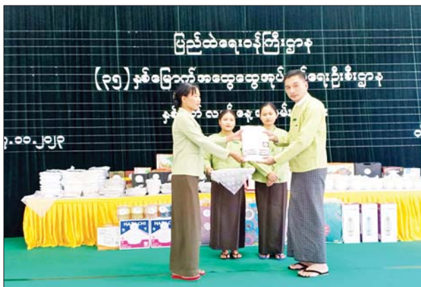
ကျော်သူရ (ပြန်/ဆက်)