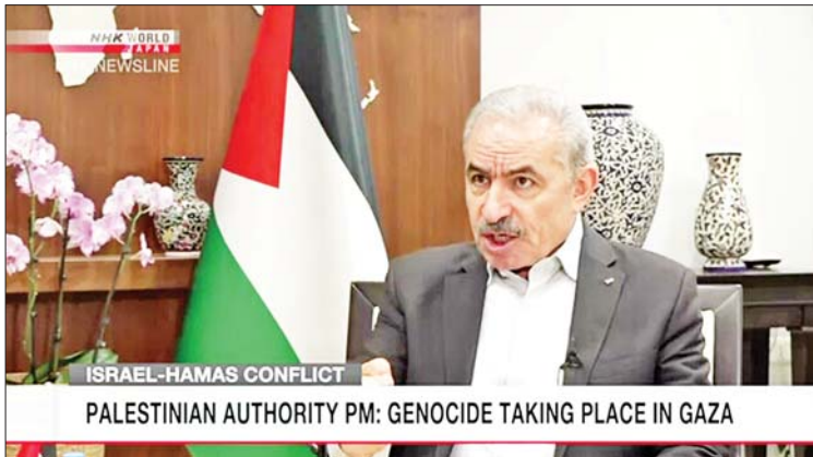
၎င်းက ပြောကြားသည်။ ဂါဇာကမ်းမြောင်ဒေသတွင် ခိုလှုံ့သူ များကို အစားအစာဝေမျှပေးရန်နှင့် အမိုး အကာနှင့် သောက်သုံးရေများ ပံ့ပိုးပေးရန် နေ့စဉ် ထရပ်ကားအစီး ၅၀၀ လိုအပ် ကြောင်း ၎င်းက ထပ်လောင်းပြောကြား ခဲ့သည်။ ထို့ပြင် ရာဖာနယ်စပ်ဖြတ်ကျော်ဂိတ်

ဂျေရုဆလင် နိုဝင်ဘာ ၈ အစွဲအလှူ၏ လူမျိုးတုံးသတ်ဖြတ်မှုကို ရပ်တန့်ရန် နိုင်ငံတကာခေါင်းဆောင်များ က အစွဲအလှူကို ချက်ချင်းတောင်းဆိုရမည် ဟု ပါလက်စတိုင်းဝန်ကြီးချုပ် မိုဟာမက် ရှာတေရက်က ပြောကြားခဲ့သည်။ ၎င်းသည် လက်ရှိဖြစ်ပွားနေသည့် ပဋိပက္ခ အဆုံးသတ်ရေးကိုလည်း တောင်းဆိုခဲ့သည်။ ၎င်းက နိုဝင်ဘာ ၆ ရက်တွင် အင်န်အိတ်ချ်ကော သတင်းဌာနနှင့် သီးသန့်တွေ့ဆုံမေးမြန်းခန်းတွင် ယခု ကဲ့သို့ မှတ်ချက်ပြု ပြောကြားခဲ့ခြင်း ဖြစ်သည်။ ၎င်းက အစွဲအလှူ၏ တိုက်ခိုက်မှုသည် နိုင်ငံတကာဥပဒေကို ချိုးဖောက်ခြင်း ဖြစ်သည်ဟု ထပ်လောင်းပြောကြားခဲ့ သည်။ ဂါဇာကမ်းမြောင်ဒေသ၏ လက်ရှိ အခြေအနေသည် အလွန်ဆိုးရွားသည်ဟု