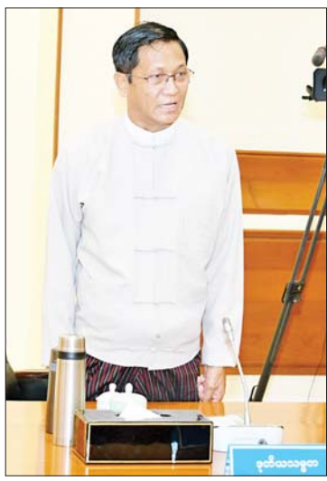
ဒုတိယသမ္မတ ဦးဟင်နရီ ဗန်ထီးယူ ဆွေးနွေးတင်ပြစဉ်။

၎င်းတို့အနေဖြင့် တစ်ဖက်မှ ချင်းရွှေဟော်အားတိုက်ခိုက်ပြီး တစ်ပြိုင် တည်းတွင် ကွမ်းလုံကို စိမ့်ဝင်လာသည့် အဖွဲ့များဖြင့် ထိုးဖောက်တိုက်ခိုက်ခဲ့ ကြောင်း၊ TNLA ကလည်း သိန္နီကို ဆက်သွယ်ရေးလမ်းကြောင်းဖြတ်တောက် နိုင်အောင် တိုက်ခိုက်ခဲ့ကြောင်း၊ လားရှိုး မြို့ကိုလည်း နှောင့်ယှက်ပစ်ခတ်ခဲ့ ကြောင်း၊ နောင်ချိုအနီး မန္တလေး-လားရှိုး ဆက်သွယ်ရေးလမ်းကြောင်း ပြတ် တောက်အောင် ပိတ်ဆို့တိုက်ခိုက်ခဲ့ ကြောင်း၊ ထိုသို့ MNDAA မှတိုက်ခိုက်လျက် ရှိချိန်တွင် KIA အနေဖြင့် ကချင်ပြည်နယ် အတွင်း ဆက်သွယ်ရေးလမ်းကြောင်း ပေါ်ရှိ စခန်းငယ်တစ်ခုကို အင်အားအလုံး အရင်းဖြင့် တိုက်ခိုက်ခဲ့ကြောင်း၊ ထို့ကြောင့် မိမိတို့အနေဖြင့် တုံ့ပြန်မှု များ ဆောင်ရွက်ခဲ့ကြောင်း၊ ယခုအခါ မိမိတို့အနေဖြင့် ပြန်လည်ထိန်းချုပ်နိုင်ပြီ ဖြစ်ကြောင်း၊ MNDAA အဖွဲ့ အနေဖြင့် လည်း ထိုခိုက်ကျဆုံးမှုများစွာဖြစ်ပေါ် လျက်ရှိကြောင်း၊ မိမိတို့အနေဖြင့် လိုအပ် သော ပြန်လည်တုံ့ပြန်မှုများ ဆောင်ရွက်