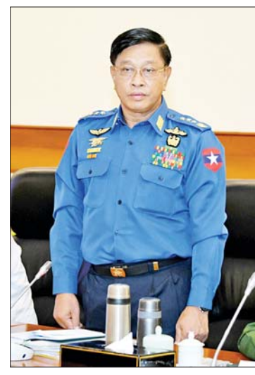
ပြည်ထောင်စုဝန်ကြီး ဗိုလ်ချုပ်ကြီး တင်အောင်စန်း ရှင်းလင်းတင်ပြစဉ်။

သွားမည်ဖြစ်ကြောင်း။ ဖြေရှင်းဆောင်ရွက်လျက်ရှိ မှုဆယ်နှင့် ချင်းရွှေဟော်ဒေသသည် မြန်မာနိုင်ငံနှင့် တရုတ်နိုင်ငံတို့၏ နယ်စပ် ကုန်သွယ်ရေးတွင် အဓိကကျသည့် လမ်းကြောင်းဖြစ်သည်ကို MNDAA အနေ ဖြင့် သိရှိပြီးဖြစ်ကြောင်း၊ လာမည့်နှစ်ဝင်ဘာ ၁၁ ရက်တွင် တရုတ်နိုင်ငံ၏ အကူ အညီဖြင့် တည်ဆောက်ခဲ့သော ကွမ်းလုံ တံတားသစ်ဖွင့်လှစ်ရန်အတွက် စီစဉ်ပြီး ဖြစ်ကြောင်း၊ ယခုကဲ့သို့ အခြေအနေနှင့် အချိန်အခါ၌ MNDAA က ၎င်းဒေသကို တိုက်ခိုက်လာသည်မှာ များစွာသတိပြု သင့်သောအချက်ဖြစ်ကြောင်း၊ ယခုဖြစ်စဉ် သည် မြန်မာနိုင်ငံနှင့် တရုတ်နိုင်ငံတို့၏ ဆက်ဆံရေးကို ထိခိုက်စေနိုင်ကြောင်း၊ ဖြစ်စဉ်တွင် မိမိတို့နိုင်ငံမှ ကျည်ဆန်များ တရုတ်နိုင်ငံအတွင်း ကျရောက်သည်ဟု ပြောဆိုမှုများကြောင့် နှစ်ဖက်တာဝန်ရှိ သူများက ဖြေရှင်းဆောင်ရွက်လျက်ရှိ ကြောင်း၊ မိမိတို့အနေဖြင့် နယ်စပ်ဒေသ ဖြစ်သဖြင့် စစ်ဆင်ရေးဆောင်ရွက်ရာတွင် အထူးပင်ကန့်သတ်ထိန်းသိမ်း ဆောင် ရွက်ခဲ့ရကြောင်း၊ သို့သော် တစ်ဖက်အဖွဲ့ အစည်းများအနေဖြင့် လက်လွတ်စပယ် လုပ်ဆောင်ခဲ့မှုနှင့် နှစ်နိုင်ငံအထင်အမြင် လွှဲအောင် လုပ်ဆောင်နေမှုများရှိကြောင်း။