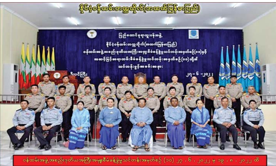
ပြည်ထောင်စုရာထူးဝန်အဖွဲ့ ဥက္ကဋ္ဌနှင့် ဝန်ထမ်းအဖွဲ့အစည်း ဒုတိယအကြီးအမှူး စီမံခန့်ခွဲမှုသင်တန်း အမှတ်စဉ် (၁၀) မှ သင်တန်းသား သင်တန်းသူများ။

အချို့ဝန်ထမ်းများသည် သင်တန်းတက်ရောက်ရန် ငြင်းဆန်လိုကြသည်။ မိမိမရှိလျှင် လုပ်ငန်းတာဝန်များ အခက်အခဲဖြစ်ပေါ်နိုင်သည်ကို စိုးရိမ်၍ လည်းကောင်း၊ အချို့မှာ ဝန်ထမ်းမှ သင်တန်းတက်ရောက်လိုသော်လည်း ဌာနကအကြောင်းကြောင်းကြောင့် စေလွှတ်မှုမရှိ၍လည်းကောင်း သင်တန်းတက်ရောက်ရန် အခွင့်အရေး မရသည်များလည်း ကြားသိရပါသည်။ မည်သည့်ဌာန၊ မည်သည့်လုပ်ငန်းခွင်တွင်မဆို ဝန်ထမ်းတစ်ဦးသည် ရုတ်တရက် ကွယ်လွန်ခြင်း၊ လုပ်ငန်းဆောင်ရွက်နိုင်မှု မရှိသည့်အခြေအနေအထိ ကျန်းမာရေး ဆိုးရွားသွားခြင်း၊ ပင်စင်ယူခြင်းတို့ ကြုံတွေ့ရမည်ဖြစ်သဖြင့် ဤသို့သော အခြေအနေများတွင် လုပ်ငန်းခွင်တွင် ကျန်ရှိသူနှင့်သာ အလုပ်ဖြစ်အောင်ဆောင်ရွက်ရမည်ဖြစ်ပါသည်။ သို့ဖြစ်၍ မိမိလုပ်ငန်းတာဝန်ဆောင်ရွက်မှုကို အထောက်အကူဖြစ်စေမည့် သင်တန်းများ တက်ရောက်ခြင်းကို ကိုယ်တိုင် ကျေနပ်စွာ လက်ခံနိုင်ရမည်ဖြစ်သကဲ့သို့ မိမိလက်အောက်လုပ်ဖော်ကိုင်ဖက်၊ မိမိအထက် ဝန်ထမ်းများ သင်တန်းတက်ရောက်ရေးကို အားပေးပေး ကူညီရမည်ဖြစ်ပါသည်။ သို့ဖြစ်၍ ကျွန်ုပ်တို့ ဝန်ထမ်းဘဝတစ်လျှောက် တက်ရောက်ခဲ့ဖူးသော သင်တန်းများနှင့် လုပ်ငန်းခွင်တွင် ပြန်လည်အသုံးချနိုင်ပုံ၊ အကျိုးရှိပုံတို့ကို မျှဝေလို၍ ဤဆောင်းပါးကို