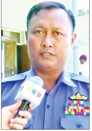
ဒုတိယဗိုလ်မှူးကြီးထွန်းသူရ

တဲ့ ဒေသခံပြည်သူတွေကို သွားရေးလာရေးကိုအကြံအပို့လုပ်ပေးတဲ့အပြင် ထမင်းလည်း ကျွေးတယ်။ ဆေးလည်းအလကားပေးတယ်။ ခွဲစိတ်တဲ့လူနာတွေအတွက်လည်း မေတ္တာစေတနာနဲ့ ကုသပေးတဲ့အတွက် ကျွန်မအနေနဲ့ ဝမ်းသာပီတိဖြစ်ရပါတယ်။ ကျွန်မရဲ့ ရောဂါက အပြင်မှာကုမယ်ဆိုရင် ပိုက်ဆံအများကြီးကုန်မှာ ကျွန်မအနေနဲ့လည်း မတတ်နိုင်ဘူး။ အခုလို နယ်လှည့်ဆေးကုသရေးအဖွဲ့နဲ့ အောင်မြင်စွာ ကုသပေးတဲ့အတွက် ကျွန်မအနေနဲ့ ဝမ်းမြောက်ဝမ်းသာ ကြည့်နူးမိပါတယ်။ အခုလို ကျွန်မလိုရောဂါတွေပျောက်အောင် စေလွှတ်ပြီးစီစဉ်ပေးတဲ့ နိုင်ငံတော်အကြီးအကဲနဲ့ တာဝန်ရှိသူတွေကို အလွန်ကျေးဇူးတင်မိပါတယ်။ တပ်မတော်နယ်လှည့်ဆေးကုသရေးအဖွဲ့ဟာ ဆေးကုသပေးတဲ့အပြင် နောက်ထပ်ဒေသခံပြည်သူတွေအားလုံးကိုလည်း မကြာမကြာလာရောက် ဆေးကုသပေးပါလို့ ကျွန်မအနေနဲ့ ပြောချင်ပါတယ်။ သတင်းစဉ်