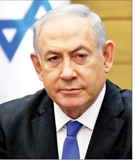
သည် စစ်ဆင်ရေးအတွင်း နိုင်ငံသားများ လက်ရှိရှိနေ သော နိုင်ငံတကာ အထောက်အပံ့ကိုဆုံးရှုံးနိုင်သည် ဟု ဝန်ကြီးချုပ်နေတန်ယာဟုက ဘိုင်ဒင်အား ပြောကြား သည်။ ကိုးကား - အင်န်အိတ်ချ်ကော ဘာသာပြန် - အောင်ကျော်ကျော်