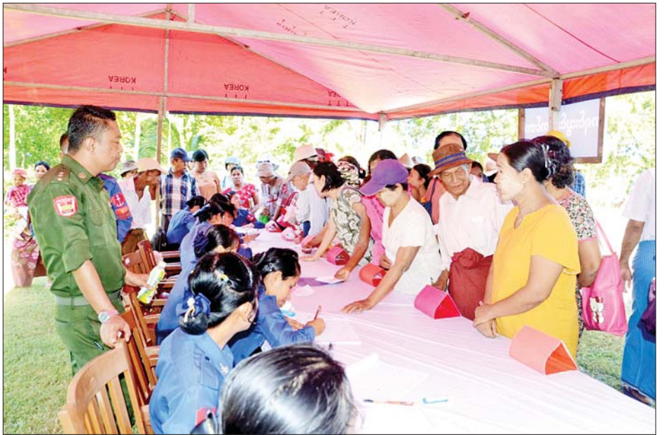
နယ်လှည့်အထူးကုဆေးအဖွဲ့များ တပ်မတော်ပင်လယ်သွားဆေးရုံရေယာဉ်(သံလွင်)ဖြင့် ငပုတောမြို့နယ်ရှိ ဒေသခံပြည်သူများအား ကျန်းမာရေးစောင့်ရှောက်မှုလုပ်ငန်းများ ဆောင်ရွက်ပေးစဉ်။

ချိန်မှာ သက်သက်သာသာနဲ့ နေထိုင်နိုင်ဖို့ နေရာထိုင်ခင်းတွေ ပြင်ဆင်ခြင်းနဲ့ နေ့စဉ်လာရောက်ဆေးကုသတဲ့သူတွေကိုလည်း ဌာနချုပ်အနေနဲ့ လူ ၅၀၀ စာလောက်ကို အခမဲ့ ကျွေးမွေးဆောင်ရွက်လျက်ရှိပါတယ်။ ဒါတင်မကပါဘူး ဆေးလာကုသတဲ့သူတွေ သွားရေးလာရေး အဆင်ပြေစေရေးအတွက် ဌာနချုပ်အနေနဲ့ ကားများစီစဉ်ပြီးတော့ သယ်ယူပို့ဆောင်ရေးစီစဉ်ဆောင်ရွက်ပေးလျက်ရှိပါတယ်။ ဒါ့အပြင် ဆေးရုံဆင်းလူနာများ ပြန်ဖို့အတွက် အခက်အခဲရှိတယ်ဆိုရင်လည်း မိမိတို့ဌာနချုပ်အနေနဲ့ သင်္ဘော၊ လှေများစီစဉ်ပြီး ရပ်ရွာအရောက်ပြန်လည် ပို့ဆောင်စီစဉ်ပေးလျက်ရှိပါတယ်။ ကျွန်တော်တို့ဟိုင်းကြီးကျွန်း ဒေသဟာ လမ်းပန်းဆက်သွယ်ရေးအရ ခက်ခဲတဲ့အတွက် ဒေသခံပြည်သူများအနေနဲ့ ရောဂါတစ်ခုခုဖြစ်ပြီဆိုလို့ရှိရင် ဆေးရုံတက်ရောက်ကုသဖို့အတွက် သွားရေးလာရေးမှာများစွာ အခက်အခဲ ရှိပါတယ်။ အခုလိုတပ်မတော်နယ်လှည့်ဆေးကုသရေးအဖွဲ့ (သံလွင်)နဲ့ ကျွန်တော်တို့ ဟိုင်းကြီးကျွန်းဒေသကိုလာရောက် ဆေးကုသပေးတဲ့အတွက် ဒေသခံပြည်သူများ ကိုယ်စား တပ်မတော်