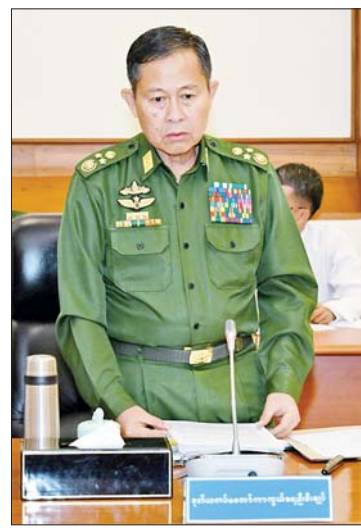
ဒုတိယတပ်မတော် ကာကွယ်ရေး ဦးစီးချုပ် ကာကွယ်ရေးဦးစီးချုပ် (ကြည်း) ဒုတိယဗိုလ်ချုပ်မှူးကြီး စိုးဝင်း ရှင်းလင်း တင်ပြစဉ်။