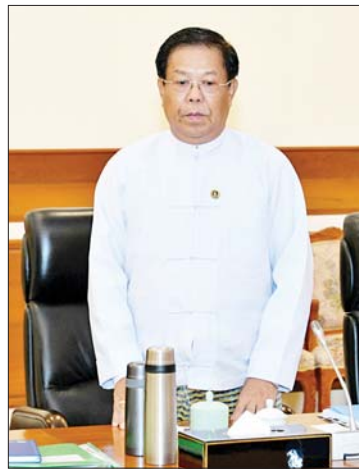
ပြည်ထောင်စုဝန်ကြီး ဦးသန်းဆွေ ရှင်းလင်းတင်ပြစဉ်။