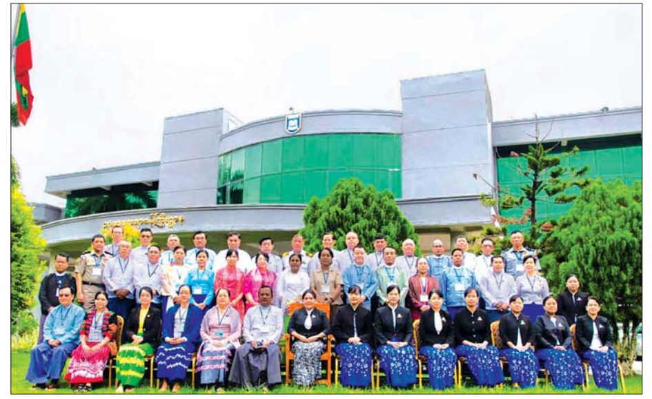
ဥပဒေအသိပညာပြန့်ပွားရေးသင်တန်းအမှတ်စဉ်(၃)မှ သင်တန်းသား သင်တန်းသူများ။

ဥပဒေမူကြမ်းရေးဆွဲခြင်းဘာသာရပ်ကို ပို့ချသောအခါ မိမိတို့ဌာန ကျေးလက်ဒေသဖွံ့ဖြိုးတိုးတက်ရေးဥပဒေ ရေးဆွဲချိန်ကို အထူးသတိရ