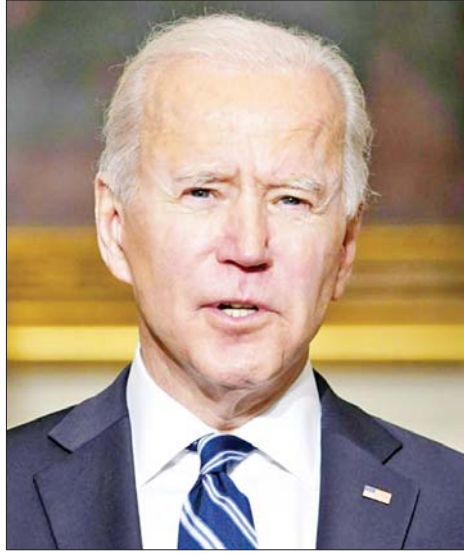
အစွဲအလှူအတန်းကြီးချုပ် ဟားမတ်စ်၏ ရည်ရွယ်ချက်ကို မယုံကြည်ကြောင်း ဘိုင်ဒင်အား ပြောကြားခဲ့သည်ဟု အမေရိကန်နှင့် အစွဲအလှူတာဝန်ရှိသူများက ဆိုသည်။ တိုက်ပွဲများ သုံးရက်ကြာရပ်သွားပါက အစွဲအလှူ

က ဆိုသည်။ အမေရိကန်၊ အစွဲအလှူနှင့် ကာတာနိုင်ငံတို့သည် ဓားစာခံများ လွတ်ပေးရေးနှင့် ပတ်သက်၍ အဆိုပြု ချက်တစ်ရပ်ကို ဆွေးနွေးလျက်ရှိကြောင်း သိရသည်။ ကာတာနိုင်ငံသည် ဓားစာခံများ လွတ်ပေးရေး နှင့်ပတ်သက်ပြီး ဟားမတ်စ်နှင့် အခြားအဖွဲ့အစည်း များအကြား စေ့စပ်ညှိနှိုင်းမှုများ လုပ်ဆောင်လျက် ရှိသည်။ အဆိုပြုချက်အရ ဟားမတ်စ်သည် ဓားစာခံ ၁၀ ဦးမှ ၁၅ ဦးကို လွတ်ပေးခဲ့ပြီး ကျန်ဓားစာခံ အားလုံး၏ အထောက်အထားများကို အတည်ပြုရန် သုံးရက်ကြာစစ်ဆင်နွှဲမှုများကို ခေတ္တရပ်နားထားမည် ဖြစ်သည်။ ထို့ပြင် ဖမ်းဆီးထိန်းသိမ်းခံရသူများ၏ အမည် စာရင်းကိုလည်း ထုတ်ဖော်ပြောကြားမည်ဖြစ်သည်။