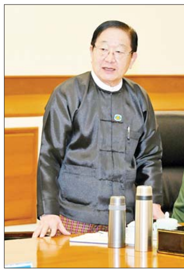
ပြည်သူ့လွှတ်တော် ဥက္ကဋ္ဌ ဦးတီခွန်မြတ် ဆွေးနွေးတင်ပြစဉ်။