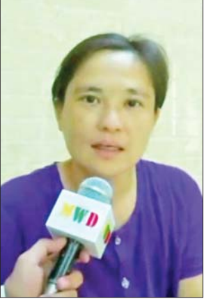
မစန်းစန်းအေး