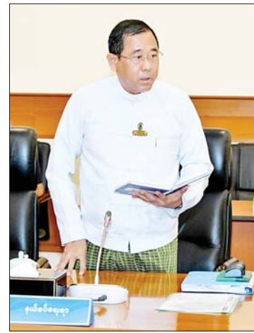
ပြည်ထောင်စုဝန်ကြီး ဒုတိယဗိုလ်ချုပ်ကြီး ထွန်းထွန်းနောင် ရှင်းလင်းတင်ပြစဉ်။