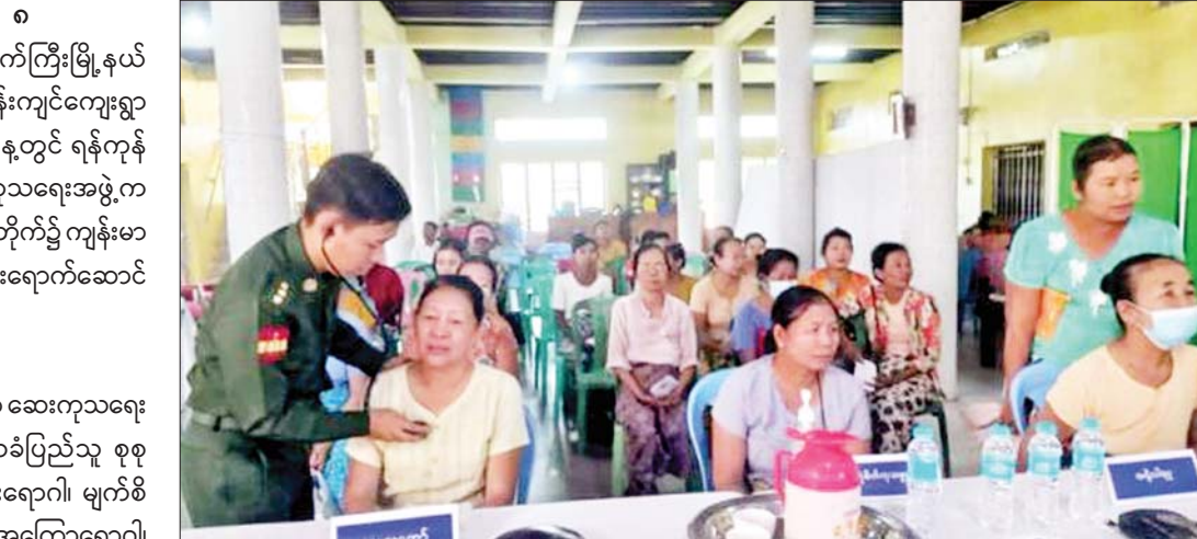
ရန်ကုန်တိုင်းစစ်ဌာနချုပ် နယ်မြေခံဆေးကုသရေးအဖွဲ့ ဥက္ကံမြို့ ကံကုန်းကျေးရွာနှင့် ပတ်ဝန်းကျင်ကျေးရွာများမှ ဒေသခံပြည်သူများအား ကျန်းမာရေးစောင့်ရှောက်မှုလုပ်ငန်းများ ဆောင်ရွက်ပေးစဉ်။

နေပြည်တော် နိုဝင်ဘာ ၈ ရန်ကုန်တိုင်းဒေသကြီး တိုက်ကြီးမြို့နယ် ဥက္ကံမြို့ ကံကုန်းကျေးရွာနှင့် ပတ်ဝန်းကျင်ကျေးရွာများမှ ဒေသခံပြည်သူများအား ယနေ့တွင် ရန်ကုန်တိုင်းစစ်ဌာနချုပ် နယ်မြေခံဆေးကုသရေးအဖွဲ့က အဆိုပါကျေးရွာရှိ ရွှေဟင်္သာကျောင်းတိုက်၌ ကျန်းမာရေးစောင့်ရှောက်မှုလုပ်ငန်းများ သွားရောက်ဆောင်ရွက်ပေးသည်။ စစ်ဆေးကုသပေး ထိုသို့ဆောင်ရွက်ပေးလျက်ရှိရာ ဆေးကုသရေးအဖွဲ့က သံဃာတော်များနှင့် ဒေသခံပြည်သူ စုစုပေါင်း ၈၉ ဦးတို့ကို သွားနှင့်ခံတွင်းရောဂါ၊ မျက်စိရောဂါ၊ သားဖွားမီးယပ်ရောဂါ၊ အရိုးအကြောရောဂါ၊ နား၊ နှာခေါင်း၊ လည်ချောင်းရောဂါ၊ ကလေးရောဂါ၊ အထွေထွေရောဂါတို့နှင့် ပတ်သက်၍ လိုအပ်သည့် ကျန်းမာရေး စစ်ဆေးကုသပေးခြင်းများ ဆောင်ရွက်ပေးသည်။ အလားတူ မန္တလေးတိုင်းဒေသကြီး ပြင်ဦးလွင်