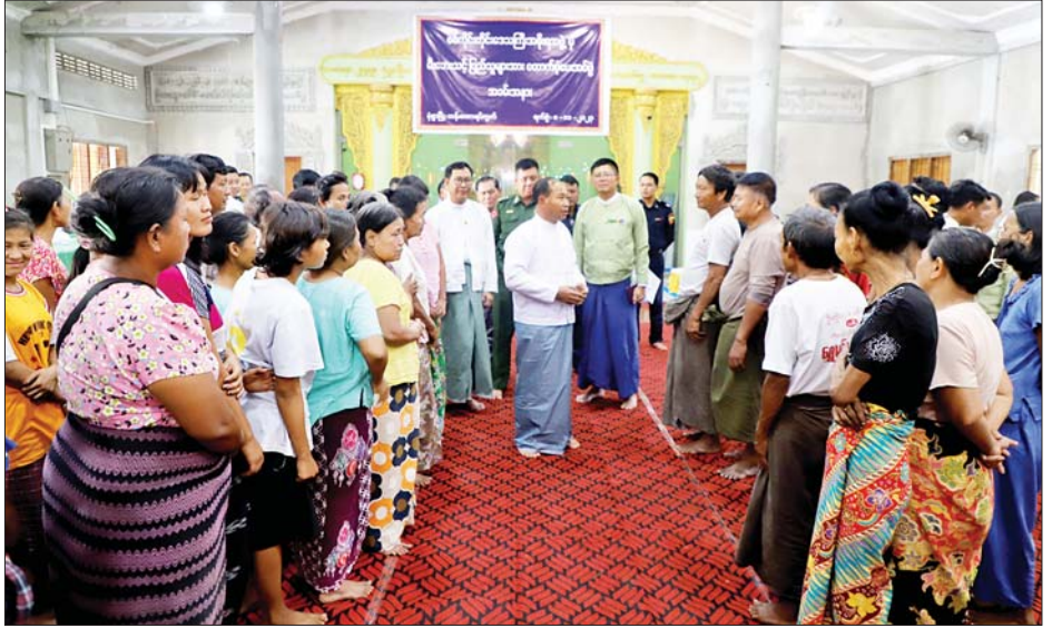
မီးဘေးသင့်ပြည်သူများအား ရင်းရင်းနှီးနှီးလိုက်လံ နှုတ်ဆက်အားပေးကာ အခမ်းအနားကို ရုပ်သိမ်းခဲ့သည်။ အဆိုပါမုံရွာမြို့ထန်းတောရပ်ကွက်ရှိမီးဘေးသင့်အိမ်ထောင်စု ၃၂ စု၊ လူဦးရေ ၁၆၁ ဦးအတွက် တိုင်းဒေသကြီးအစိုးရအဖွဲ့က တစ်အိမ်ထောင်လျှင် ကျပ်သုံးသိန်းနှုန်းဖြင့် ငွေကျပ် ၉၆၀၀၀၀ နှင့် နှစ်ပတ်စာ ဆန်၊ ဆီ၊ ဆား၊ ပဲ စုစုပေါင်းတန်ဖိုးငွေကျပ် ၄၃၂၅၅၆၀ နှင့် ဘေးအန္တရာယ်ဆိုင်ရာ စီမံခန့်ခွဲမှုဦးစီးဌာနက အိမ်ဆောက်ပစ္စည်းနှင့် ဆန်ရိက္ခာဖိုး ငွေကျပ် ၃၆၃၀၀၀ နှင့် ပစ္စည်း ၁၆ မျိုးပါ Family Kits ၃၂ ပုံ၊ ကြက်ခြေနီအသင်းက Family Kits ၃၂ ပုံတို့ကို ထောက်ပံ့ပေးအပ်ခဲ့ကြောင်း သိရသည်။ တိုင်းဒေသကြီး(ပြန်/ဆက်)

ရှိသူများနှင့် ပေါင်းစပ်ဖြည့်ဆည်းဆောင်ရွက်ပေးသွားမည်ဖြစ်ကြောင်း အားပေးစကား ပြောကြားသည်။ ယင်းနောက် တိုင်းဒေသကြီးဝန်ကြီးချုပ်နှင့် တာဝန်ရှိသူများက မီးဘေးသင့်ပြည်သူများထံ ထောက်ပံ့ငွေများ၊ ဆန်ရိက္ခာဖိုးငွေများ၊ စားသောက်ဖွယ်ရာများနှင့် ဘေးအန္တရာယ်ဆိုင်ရာ စီမံခန့်ခွဲမှုဦးစီးဌာနက မိသားစုသုံးပစ္စည်းများ၊ ကြက်ခြေနီအသင်းက ထောက်ပံ့ပစ္စည်းများကို ထောက်ပံ့ပေးအပ်ခဲ့ပြီး မီးဘေးသင့်အိမ်ထောင်စုများက ပညာရေး၊ ကျန်းမာရေး၊ ပြန်လည်ထူထောင်ရေးဆိုင်ရာလုပ်ငန်းများနှင့် ပတ်သက်၍ လိုအပ်သည်များ ဆွေးနွေးတင်ပြကြသည်။ ဆက်လက်ပြီး တိုင်းဒေသကြီးဝန်ကြီးချုပ်က တင်ပြချက်များအပေါ် လိုအပ်သည်များကို တာဝန်ရှိသူများနှင့် ဖြည့်ဆည်းပေါင်းစပ် ဆောင်ရွက်ပေးပြီး