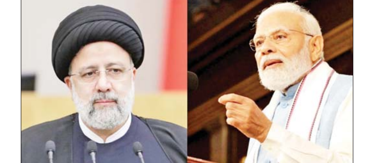
စာမျက်နှာ » ၁၃

ဂါဇာဒေသ၌ တိုက်ခိုက်မှုများရပ်စဲရေး အီရန်သမ္မတနှင့်အိန္ဒိယဝန်ကြီးချုပ်တို့ တောင်းဆို