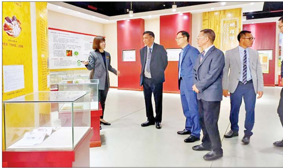
ပြည်သူ့သမ္မတနိုင်ငံ ချုံချင့်နည်းပညာတက္ကသိုလ်နှင့် ပူးပေါင်းဆောင်ရွက်သော ချုံချင့်မြို့ရှိ လျှပ်စစ်ကား နှင့်ပတ်သက်၍ စမ်းသပ်ထုတ်လုပ်နေသည့်စက်ရုံ (Modern Industrial College of New Energy Vehicles)၊ တိုကျူမြင့်မားသောပစ္စည်းများ

နေပြည်တော် နိုဝင်ဘာ ၇ သိပ္ပံနှင့်နည်းပညာဝန်ကြီးဌာန ပြည်ထောင်စု ဝန်ကြီး ဒေါက်တာမျိုးသိန်းကျော်သည် ယနေ့တွင် တရုတ်ပြည်သူ့သမ္မတနိုင်ငံ အိုင်ချိုင်မြို့ဒီယာ (i-chongqing media) နှင့် ချုံချင့်ရုပ်မြင်သံကြား တို့နှင့် အင်တာဗျူးဆောင်ရွက်သည်။ အင်တာဗျူးတွင် တရုတ်ပြည်သူ့သမ္မတနိုင်ငံ ချုံချင့်မြို့တွင် ကျင်းပခဲ့သော The Belt and Road Conference on Science and Technology Exchange မှ မြန်မာနိုင်ငံအတွက် ရရှိလာသော အကျိုးကျေးဇူးများအကြောင်း၊ လက်ရှိတရုတ်-မြန်မာ ပူးပေါင်းဆောင်ရွက်နေသော သိပ္ပံနှင့် နည်းပညာ ဆိုင်ရာ လုပ်ငန်းများအကြောင်းနှင့် The Belt and Road Conference on Science and Technology Exchange မှ ရှေ့ဆက်ဆောင်ရွက်သွားမည့် တရုတ်-မြန်မာ သိပ္ပံ၊ နည်းပညာနှင့် တီထွင်ဆန်းသစ်မှုဆိုင်ရာ နယ်ပယ်များတွင် ပိုမိုပူးပေါင်းဆောင်ရွက်နိုင်မည့် အခွင့်အလမ်းများနှင့်စပ်လျဉ်း၍ ပြန်လည်ရှင်းလင်း ဖြေကြားသည်။ ထို့အပြင် ပြည်ထောင်စုဝန်ကြီးသည် တရုတ်