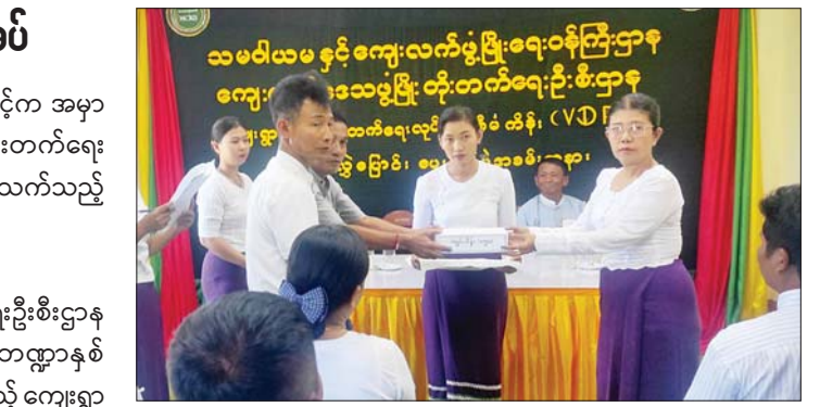
များအလိုက် ကျေးရွာအုပ်ချုပ်ရေးမှူးများနှင့် ကော်မတီဝင်များထံသို့ လွှဲပြောင်းပေးအပ်ခဲ့ကြောင်း သိရသည်။ မြို့နယ်(ပြန်/ဆက်)

✦ စာမျက်နှာ ၆ မှ သို့သော် အစွဲအနား၏ ဒေါမာန်ဟုန်ကို အစဉ်အလာမဟာမိတ် အမေရိကန်နှင့် အနောက်နိုင်ငံများသာမက ကုလသမဂ္ဂအဖွဲ့ကြီး ကလည်း မတားဆီးနိုင်တော့ပါ။ စစ်ဘေးဒဏ်ခံနေရသည့် ဂါဇာ ပြည်သူများအတွက် လူသားချင်းစာနာမှုအကူအညီများ ထောက်ပံ့ ပေးနိုင်ရေးပင်လျှင် ကျားသနားမှ နွားချမ်းသာရမည့်အခြေအနေ ဖြစ်နေသည်။ ဂါဇာကမ်းမြောက်ဒေသအတွင်း လူသားချင်းစာနာမှုအကူအညီများ ဝင်ခွင့်ပြုရန်နှင့် အပစ်အခတ်ရပ်စဲရေးအတွက် တောင်းဆို မည့် ကုလသမဂ္ဂလုံခြုံရေးကောင်စီ၏ ဆုံးဖြတ်ချက်ကို အမေရိကန် ပြည်ထောင်စုက အောက်တိုဘာလ ၁၈ ရက်နေ့တွင် ဗီတိုအာဏာ သုံး၍ ပယ်ချခဲ့ပြန်ပါသည်။ သို့ဖြင့် နိုင်ငံတကာတရားဥပဒေစိုးမိုးရေး၊ လုံခြုံရေး၊ စီးပွားရေး ဖွံ့ဖြိုးတိုးတက်ရေး၊ အပြည်ပြည်ဆိုင်ရာ လူ့အခွင့်အရေးနှင့် ကမ္ဘာ့ ငြိမ်းချမ်းရေးတို့အတွက် ဖွဲ့စည်းထားသည့် ကုလသမဂ္ဂအဖွဲ့ကြီး၏ လက်ရှိအခန်းကဏ္ဍကို ကမ္ဘာ့ပြည်သူအပေါင်းက မေးခွန်းထုတ်စရာ ဖြစ်လာခဲ့သည်။