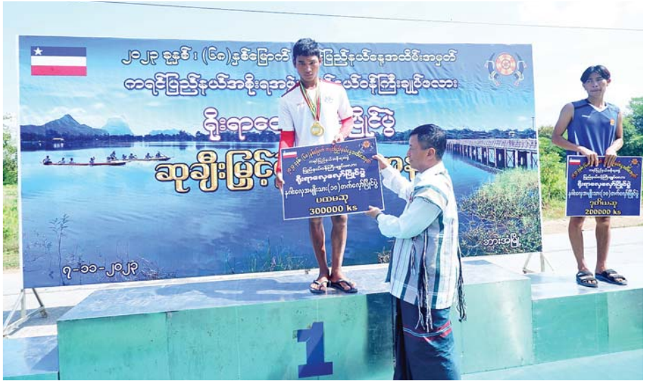
နိုင်ငံတော်စီမံအုပ်ချုပ်ရေးကောင်စီအဖွဲ့ဝင် ခွန်စုံလွင် ကရင်ပြည်နယ်ဝန်ကြီးချုပ်ဖလား ရိုးရာလှေလှော် ပြိုင်ပွဲ နဂါးလှေအမျိုးသား(၁၀)တက်လှော်ပြိုင်ပွဲတွင် ပထမဆုရရှိသူအား ဆုပေးအပ်ချီးမြှင့်စဉ်။