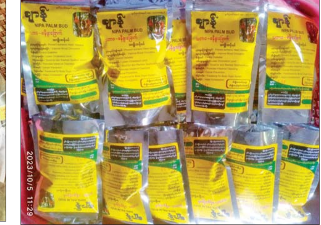
ထုပ်ပိုးပြီးသော ဓနိဖူးခြောက်များကို တွေ့ရစဉ်။