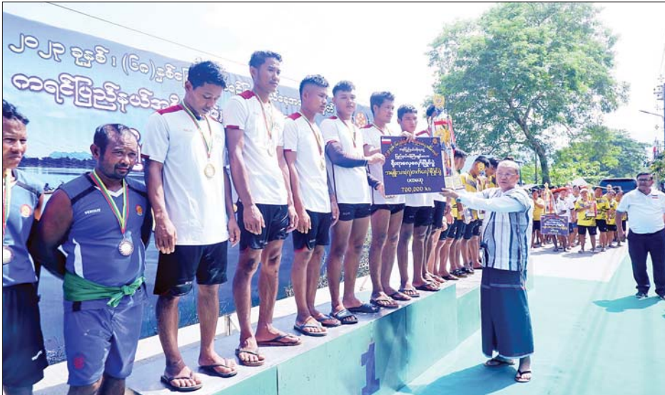
ပြည်ထောင်စုဝန်ကြီး Jeng Phang နော်တောင် ကရင်ပြည်နယ်ဝန်ကြီးချုပ်ဖလား ရိုးရာလှေလှော်ပြိုင်ပွဲ အမျိုးသား(၇)တက်လှော်ပြိုင်ပွဲတွင် ပထမဆုရရှိသောအသင်းကို ဆုပေးအပ်ချီးမြှင့်စဉ်။