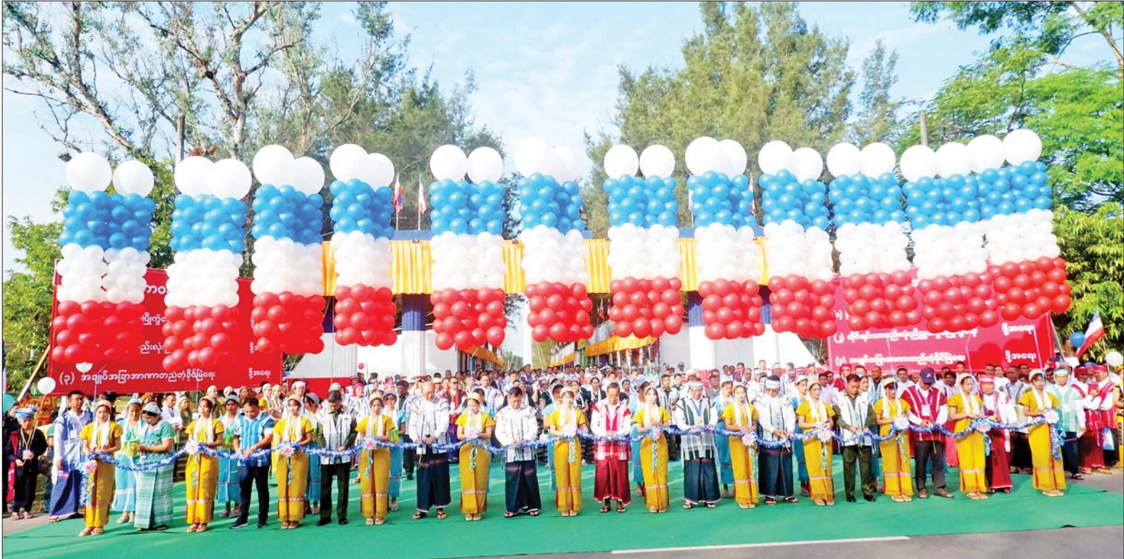
နိုင်ငံတော်စီမံအုပ်ချုပ်ရေးကောင်စီဝင် မန်းငြိမ်းမောင်၊ ခွန်စံလွင်၊ ပြည်ထောင်စုဝန်ကြီး Jeng Phang နော်တောင်၊ ကရင်ပြည်နယ်ဝန်ကြီးချုပ် ဦးစောမြင့်ဦး၊ မွန်ပြည်နယ်ဝန်ကြီးချုပ် ဦးအောင်ကြည်သိန်းနှင့် တာဝန်ရှိသူများက (၆၈)နှစ်မြောက် ကရင်ပြည်နယ်နေ့ အခမ်းအနားအမှတ်တံဆိပ်နှင့် ပြခန်းများကို ဖဲကြိုးဖြတ်ဖွင့်လှစ်ပေးကြစဉ်။