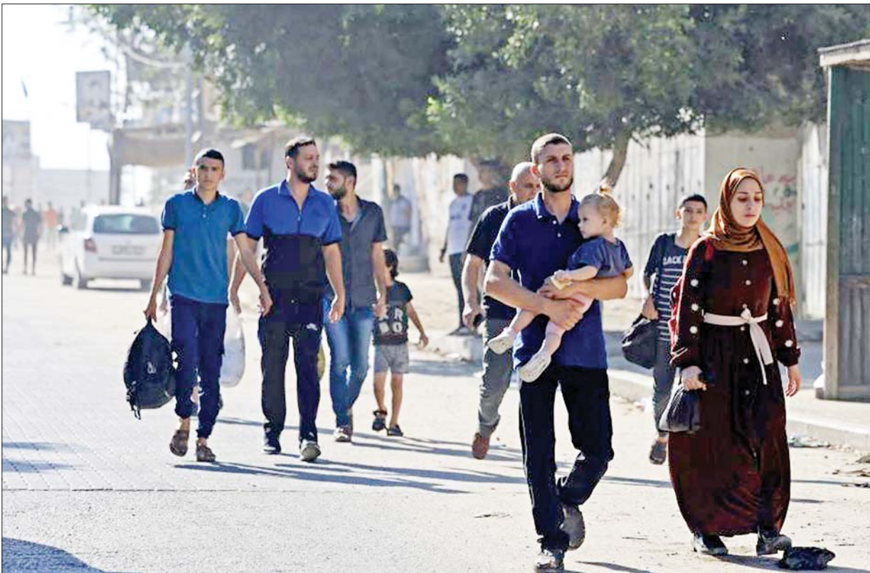
အစ္စရေးနှင့် ဟားမားစ်တို့အကြား ပဋိပက္ခများကြောင့် အစ္စရေးနယ်စပ်အနီးမှ ဂါဇာဒေသခံများ အိုးအိမ်စွန့်ခွာလာကြစဉ်။

သို့ဖြင့် အစ္စရေးပြည်သူအများစုသည် အော်စလိုသဘောတူညီ ချက်ကြောင့် အကြမ်းဖက်တိုက်ခိုက်မှုများ ပိုမိုများပြားလာခြင်း ဖြစ်သည်ဟု ယူဆလာကြပြီး ဝန်ကြီးချုပ် ယစ်ဇက်ရာဘင်ကို ဆန့်ကျင်ဆန္ဒပြမှုများ ပိုမိုပြင်းထန်လာခဲ့သည်။ အဆုံးမှာတော့ ဝန်ကြီးချုပ်ရာဘင်သည် ၁၉၉၅ ခုနှစ် နိုဝင်ဘာလတွင် တဲလ်အဗစ်မြို့ Kings of Isreal ရင်ပြင်တွင် ကျင်းပသည့် ငြိမ်းချမ်းရေးလူထု အစည်းအဝေးပွဲကြီး၌ မိန့်ခွန်းပြောကြားပြီးအပြန် ကားရှိရာသို့