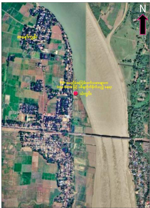
PDF အမည်ခံ အကြမ်းဖက်သမားများက စစ်တောင်းမြစ်ကမ်းဘေးရှိ သဲကွင်း၌ အလုပ်လုပ်ကိုင်နေသည့် ဒေသခံပြည်သူများကို Drop Bomb များဖြင့် ပစ်ချတိုက်ခိုက်ခဲ့သည့် နေရာပြပုံ။

နေပြည်တော် နိုဝင်ဘာ ၇ ပဲခူးတိုင်းဒေသကြီး ဝေါမြို့နယ် တနော်ကျွန်းကျေးရွာအနီး စစ်တောင်း မြစ်ကမ်းဘေးရှိ သဲကွင်း၌ အလုပ်လုပ်နေသည့် ဒေသခံပြည်သူများကို PDF အမည်ခံ အကြမ်းဖက်သမားများက Drop Bomb များဖြင့် ပစ်ချတိုက်ခိုက်ခဲ့ကြောင်း သိရသည်။ ဖြစ်စဉ်မှာ ယနေ့ မွန်းလွဲ ၂ နာရီ ၁၅ မိနစ်ခန့်တွင် ဝေါမြို့နယ် တနော်ကျွန်း ကျေးရွာအနီး စစ်တောင်း မြစ်ကမ်းဘေးရှိ ဒေသခံပြည်သူများ အလုပ်လုပ်ကိုင်နေသည့် သဲကွင်းနေရာသို့ PDF အမည်ခံ အကြမ်းဖက်သမားများက အမြင့်မီတာ ၅၀၀ ခန့်အကွာမှ Drop Bomb များဖြင့် အကြောင်းမဲ့ ပစ်ချတိုက်ခိုက်ခဲ့သဖြင့် အေးချမ်းစွာ အလုပ်လုပ်ကိုင်လျက်ရှိသော အပြစ်မဲ့ဒေသခံပြည်သူအမျိုးသားလေးဦး သေဆုံးပြီး အမျိုးသားငါးဦးနှင့် အမျိုးသမီးတစ်ဦး ပေါင်း ခြောက်ဦးတို့ ထိခိုက်ဒဏ်ရာများ ရရှိခဲ့ကြောင်း သိရသည်။ အဆိုပါ ဖြစ်စဉ်တွင် ထိခိုက်ဒဏ်ရာရရှိသူများအား လုံခြုံရေးတပ်ဖွဲ့ဝင်များက လိုအပ်သော ဆေးဝါးကုသမှုများ ဆောင်ရွက်ပေးကာ ဝေါမြို့နယ် တိုက်နယ်