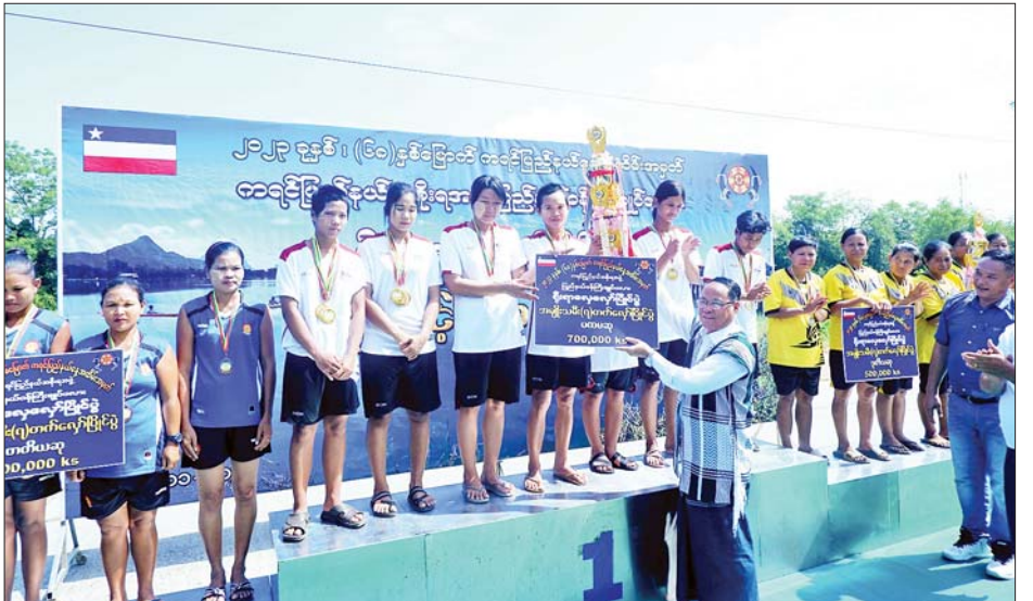
ကရင်ပြည်နယ်ဝန်ကြီးချုပ် ဦးစောမြင့်ဦး ကရင်ပြည်နယ်ဝန်ကြီးချုပ်ဖလား ရိုးရာလှေလှော်ပြိုင်ပွဲ အမျိုးသမီး(၇)တက်လှော်ပြိုင်ပွဲတွင် ပထမဆုရရှိသောအသင်းကို ဆုပေးအပ်ချီးမြှင့်စဉ်။

ရေဖုံးမှ ဦးစွာ သဘာပတိအဖွဲ့ဝင်များ နေရာယူကြပြီး ပြည်ထောင်စု သမ္မတ မြန်မာနိုင်ငံတော် အလံ၊ ကျဆုံးလေပြီးသော အာဇာနည် ခေါင်းဆောင်ကြီးများနှင့် ရဲဘော် အပေါင်းတို့ကို အလေးပြုကြ သည်။ ထို့နောက်ပြည်ထောင်စုသမ္မတ မြန်မာနိုင်ငံတော် နိုင်ငံတော်စီမံ အုပ်ချုပ်ရေးကောင်စီဥက္ကဋ္ဌ နိုင်ငံ တော်ဝန်ကြီးချုပ် သတိုးမဟာ သရေစည်သူ၊ သတိုးသီရိသုဓမ္မ ဗိုလ်ချုပ်မှူးကြီး မင်းအောင်လှိုင်