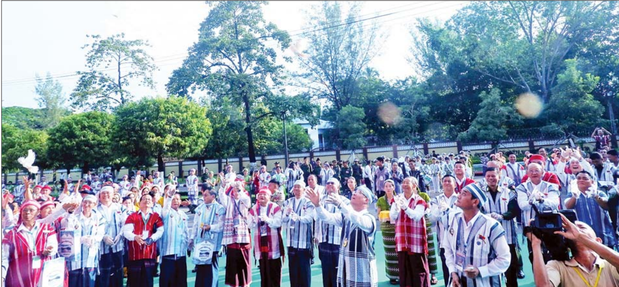
နိုင်ငံတော်စီမံအုပ်ချုပ်ရေးကောင်စီအဖွဲ့ဝင်များနှင့် တက်ရောက်လာကြသူများက (၆၈)နှစ်မြောက် ကရင်ပြည်နယ်နေ့အထိမ်းအမှတ်အဖြစ် ငြိမ်းချမ်းရေးချိုးဖြူငှက် (၆၈) ကောင်ကို လွှတ်ပေးကြစဉ်။

ကျင်းပသည့် ဟင်းသီးဟင်းရွက် နှင့် သစ်သီးဝလံပန်းမန်ပြိုင်ပွဲသို့ တက်ရောက်ပြီး ငှက်ပျော၊ သင်္ဘော၊ မာလက၊ ကျောက်ဖရုံ၊ နာနတ်၊ ဘူးသီး၊ ကွမ်းသီးသီးနံ့များတွင် ပထမ၊ ဒုတိယ၊ တတိယဆုများ ရရှိခဲ့ကြသည့် တောင်သူများကို ဂုဏ်ပြုဆုများ ပေးအပ်ချီးမြှင့်ကြ သည်။ ထို့နောက် နိုင်ငံတော်စီမံ အုပ်ချုပ်ရေးကောင်စီအဖွဲ့ဝင်များ နှင့် တာဝန်ရှိသူများသည် ကရင် ပြည်နယ်ဝန်ကြီးချုပ်ဖလား ရိုးရာ လှေလှော်ပြိုင်ပွဲ ဗိုလ်လုပွဲများ ယှဉ်ပြိုင်နေမှုကို တက်ရောက် ချီးမြှင့်အားပေးကြသည်။