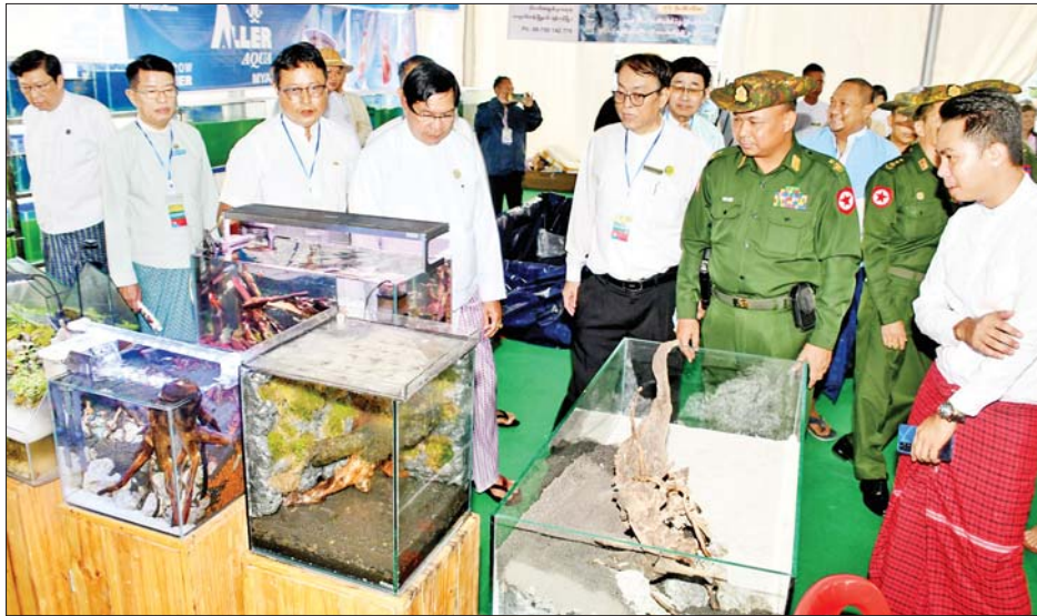
ရန်ကုန်တိုင်းဒေသကြီး ဝန်ကြီးချုပ် ဦးစိုးသိန်းနှင့် တာဝန်ရှိသူများ “၂၀၂၂ ခုနှစ် စက်မှုထုတ်ကုန်နှင့် ရေထွက်ကုန်ပစ္စည်း သီတင်းကျွတ်ပွဲတော်” တွင် အရောင်းပြခန်းများကို ကြည့်ရှုအားပေးစဉ်။

ထို့နောက် ရန်ကုန်တိုင်းဒေသကြီး ဝန်ကြီးချုပ် ဦးစိုးသိန်းက ဖွင့်ပွဲအထိမ်းအမှတ်အဖြစ် အမှာစကားပြောကြားရာ နိုင်ငံတော်ဝန်ကြီးချုပ်၏ လမ်းညွှန်ချက်နှင့်အညီ နိုင်ငံတော်၏စီးပွားရေးကို ဖွံ့ဖြိုးတိုးတက်အောင် စီးပွားရေးဦးတည်ချက်များချမှတ်၍ ဆောင်ရွက်ပြီး MSME စက်မှုလုပ်ငန်းရှင်များကို လိုအပ်သော ငွေကြေးအရင်းအနှီး၊ နည်းပညာရရှိရေး၊ လူ့စွမ်းအားအရင်းအမြစ် ဖွံ့ဖြိုးတိုးတက်ရေး၊ ဈေးကွက်ရရှိရေး စသဖြင့် လိုအပ်သော အထောက်အပံ့များဆောင်ရွက်ပေးခဲ့ခြင်းကြောင့် “တိုးတက်ကောင်းမွန်လာသည့် နိုင်ငံတော်၏ စီးပွားရေးမောင်းနှင်အားကို မထွေပြဲပြု၍ ပြည်တွင်းထုတ်ကုန်များကို အားပေးမြှင့်တင်ရန်၊ ပြည်ပသွင်းကုန်အစားထိုး ထုတ်ကုန်များကို အားပေးမြှင့်တင်ရန်၊ ပို့ကုန်ကဏ္ဍမြှင့်တင်ရေး” အတွက် ပြည်တွင်းထုတ်ကုန်များကို ပြည်ပသို့ တင်ပို့ရောင်းချနိုင်ရေးဆောင်ရွက်ရန် လမ်းညွှန်မှာကြားခဲ့ခြင်း။ အဆိုပါ လမ်းညွှန်ချက်များအပေါ် အထောက်အကူဖြစ်စေမည့် ကဏ္ဍတစ်ရပ်အနေဖြင့် ရန်ကုန်တိုင်းဒေသကြီးအတွင်း စက်မှုထုတ်ကုန်များ၊ MSME ထုတ်ကုန်ပြသရောင်းချပွဲများကျင်းပခဲ့ရာ (၂၀၂၂) ခုနှစ် သီတင်းကျွတ်ပွဲတော်” “တန်ဆောင်တိုင်ပွဲတော်” (၇၆)နှစ်မြောက် ပြည်ထောင်စုနေ့ အထိမ်း