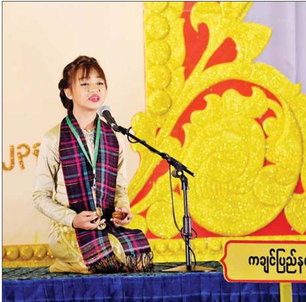
အခြေခံပညာအဆင့်(အသက် ၁၀ နှစ်မှ ၁၅ နှစ်အတွင်း) အမျိုးသမီး(မဟာဂီတ)အဆိုပြိုင်ပွဲတွင် ကချင်ပြည်နယ်မှ ပြိုင်ပွဲဝင် တစ်ဦး ယှဉ်ပြိုင်စဉ်။

အကပြိုင်ပွဲကို မြန်မာ အပြည်ပြည်ဆိုင်ရာကွန်ဗင်းရှင်း ဗဟိုဌာန(၂) Plenary Hall ၌ ကျင်းပရာ ဝါသနာရှင်အဆင့် (ဒုတိယတန်း) အမျိုးသမီးပြိုင်ပွဲ တွင် မွန်ပြည်နယ်၊ မန္တလေးတိုင်း ဒေသကြီး၊ ရန်ကုန်တိုင်းဒေသကြီး၊ ကရင်ပြည်နယ်၊ စစ်ကိုင်းတိုင်း ဒေသကြီး၊ ချင်းပြည်နယ်၊ ဧရာဝတီ တိုင်းဒေသကြီး၊ ပဲခူးတိုင်းဒေသ ကြီး၊ ကယားပြည်နယ်၊ မကွေး တိုင်းဒေသကြီး၊ ကချင်ပြည်နယ်၊ ရှမ်းပြည်နယ်နှင့် တနင်္သာရီတိုင်း ဒေသကြီးတို့မှ ပြိုင်ပွဲဝင်များက ခေါင်းခါး၊ ခြေလက်အချိုးအဆစ် ညီညာစွာအသုံးပြု၍ ကကြီး