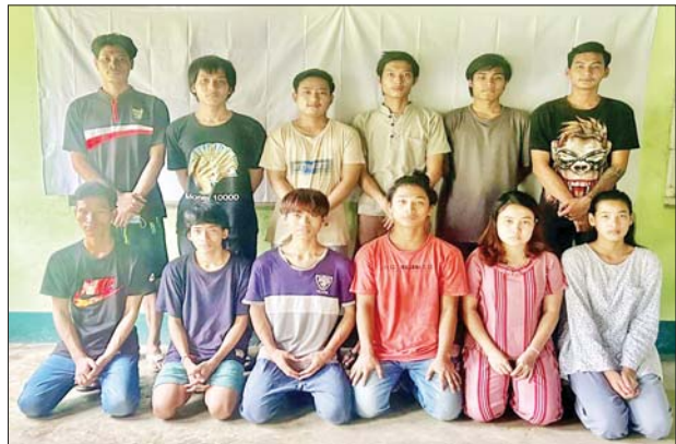
Team (A) တွင် ပါဝင်သော ဝန်ထမ်း ၁၂ ဦး၏ မှတ်တမ်းဓာတ်ပုံ။