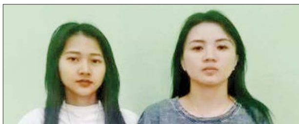
ဖမ်းဆီးရမိတရားခံများ၏ မှတ်တမ်းဓာတ်ပုံ။