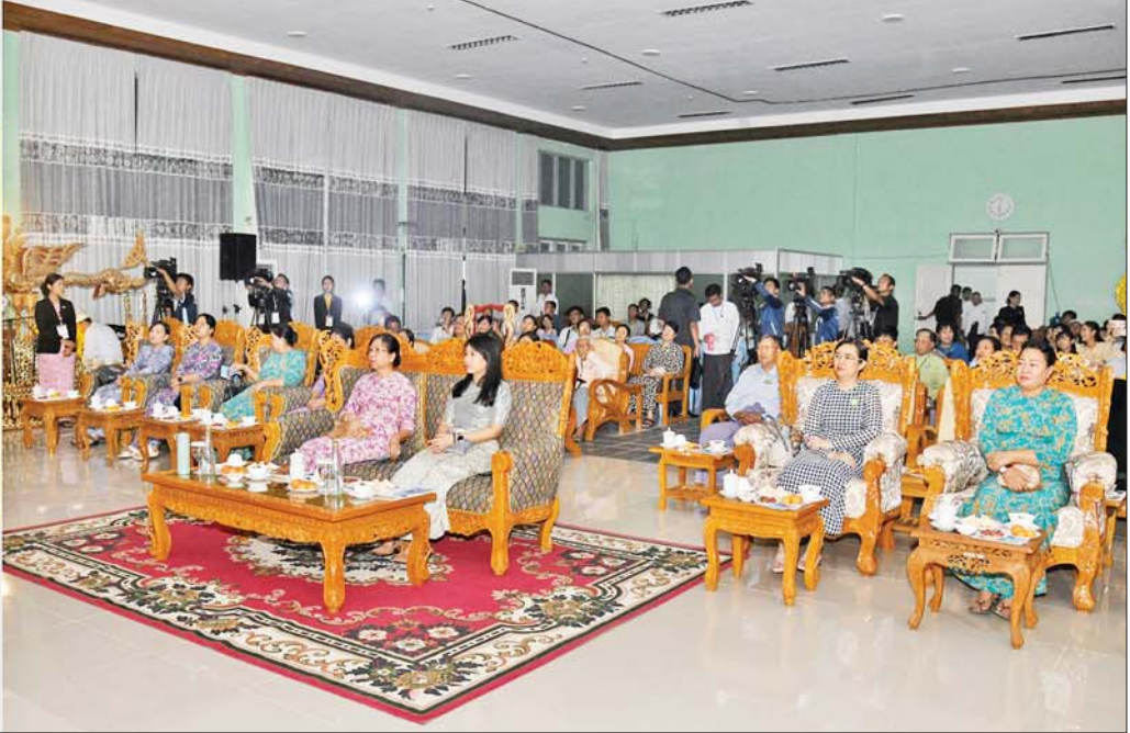
နိုင်ငံတော်စီမံအုပ်ချုပ်ရေးကောင်စီဥက္ကဋ္ဌ နိုင်ငံတော်ဝန်ကြီးချုပ်၏ဇနီး ဒေါ်ကြူကြူလှ ရုပ်စုံသဘင်အဖွဲ့လိုက် ဝါသနာရှင်အဆင့်(ပထမတန်း)ပြိုင်ပွဲတွင် “ပညာရွှေအိုး”ဇာတ်တော်ကြီးဖြင့် ရန်ကုန်တိုင်းဒေသကြီး ကိုယ်စားပြုတော်ဝင်ရုပ်စုံအမြင့်သဘင်အဖွဲ့က သရုပ်ဖော်ယှဉ်ပြိုင်နေမှုကို ကြည့်ရှုအားပေးစဉ်။