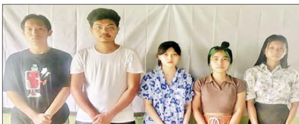
ရုံးအဖွဲ့ဝန်ထမ်းငါးဦး၏ မှတ်တမ်းဓာတ်ပုံ။