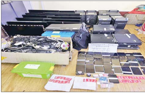
Supportfix Co.,Ltd ရုံးခန်းမှ သိမ်းဆည်းရမိသည့် ကွန်ပျူတာ၊ လက်ကိုင်ဖုန်းနှင့် ဆက်စပ်ပစ္စည်းများ မှတ်တမ်းဓာတ်ပုံ။