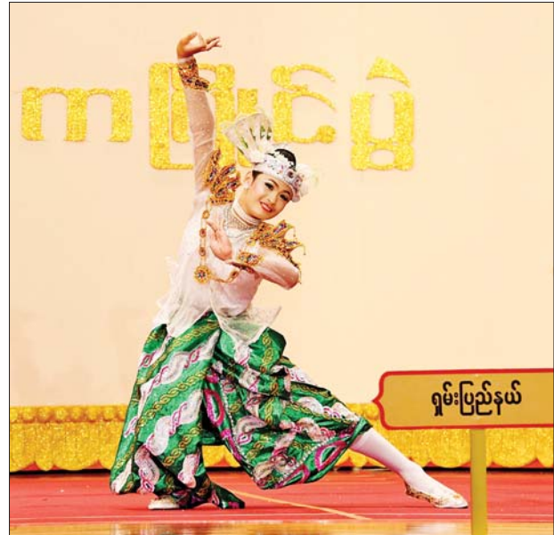
အခြေခံပညာအဆင့်(အသက် ၁၀ နှစ်မှ ၁၅ နှစ်အတွင်း) အမျိုးသား အကပြိုင်ပွဲတွင် ရှမ်းပြည်နယ်မှ ပြိုင်ပွဲဝင်တစ်ဦး ယှဉ်ပြိုင် စဉ်။