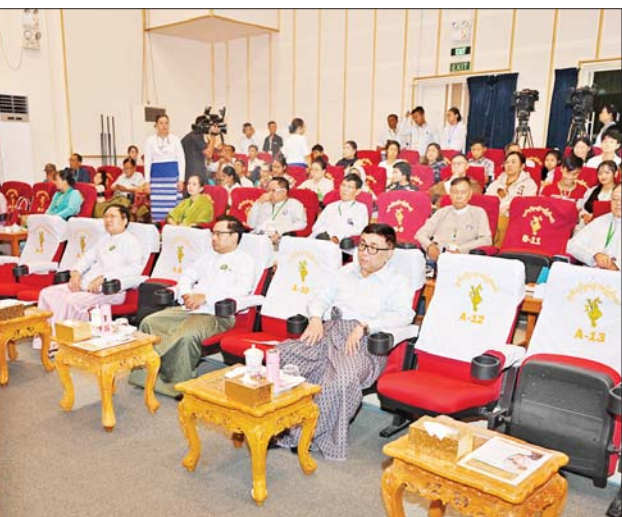
ပြည်ထောင်စုအဆင့်ပုဂ္ဂိုလ်များနှင့် တာဝန်ရှိသူများ ဇာတ်တော်ကြီးအဖွဲ့လိုက်ဝါသနာရှင်အဆင့်(ပထမတန်း)ပြိုင်ပွဲတွင် “မဟော်သဓာ”ဇာတ်တော်ကြီးဖြင့် ဧရာဝတီတိုင်း ဒေသကြီးကိုယ်စားပြု ဧရာဝတီတိုင်းဒေသကြီး မဟော်သဓာဇာတ်တော်ကြီးအဖွဲ့ တင်ဆက်ကပြယှဉ်ပြိုင်မှုကို ကြည့်ရှုအားပေးစဉ်။

ဒေသကြီး၊ ရန်ကုန်တိုင်းဒေသ ကြီး၊ မကွေးတိုင်းဒေသကြီး၊ ရှမ်းပြည်နယ်၊ ချင်းပြည်နယ်၊ ကချင်ပြည်နယ်၊ ရခိုင်ပြည်နယ်၊ မွန်ပြည်နယ်၊ ကရင်ပြည်နယ်၊ ကယားပြည်နယ်နှင့် ဧရာဝတီ တိုင်းဒေသကြီးတို့မှ ပြိုင်ပွဲဝင်များ က “ခင်မွန်ရွာသူ” သီချင်းဖြင့် လည်းကောင်း၊ အခြေခံပညာ အဆင့်(အသက် ၁၅ နှစ်မှ ၂၀ နှစ် အတွင်း) အမျိုးသားပြိုင်ပွဲတွင် ဧရာဝတီတိုင်းဒေသကြီး၊ တနင်္သာရီ တိုင်းဒေသကြီး၊ ရခိုင်ပြည်နယ်၊ ကယားပြည်နယ်၊ မွန်ပြည်နယ်၊ ကချင်ပြည်နယ်၊ ကရင်ပြည်နယ်၊ ပဲခူးတိုင်းဒေသကြီး၊ ရှမ်းပြည်နယ်၊ စစ်ကိုင်းတိုင်းဒေသကြီး၊ မကွေး တိုင်းဒေသကြီး၊ မန္တလေးတိုင်း ဒေသကြီးနှင့် ရန်ကုန်တိုင်း ဒေသကြီးတို့မှ ပြိုင်ပွဲဝင်များက “မောင်းမကန်ကေသီဦး” သီချင်း ဖြင့်လည်းကောင်း၊ အခြေခံပညာ အဆင့် (အသက် ၁၅ နှစ်မှ ၂၀ နှစ် အတွင်း) အမျိုးသမီးပြိုင်ပွဲတွင် ကချင်ပြည်နယ်၊ ကရင်ပြည်နယ်၊ မွန်ပြည်နယ်၊ ပဲခူးတိုင်းဒေသကြီး၊ ရခိုင်ပြည်နယ်၊ စစ်ကိုင်းတိုင်း ဒေသကြီး၊ မကွေးတိုင်းဒေသကြီး၊ မန္တလေးတိုင်း ဒေသကြီးနှင့် ရန်ကုန်တိုင်း ဒေသကြီးတို့မှ ပြိုင်ပွဲဝင်များက “ဆောင်ဝဇီယာ”(ပတ်ပျိုး) သီချင်းဖြင့် လည်းကောင်း၊ အခြေခံပညာအဆင့် (အသက် ၁၀ နှစ်မှ ၁၅ နှစ်အတွင်း) အမျိုးသမီး ပြိုင်ပွဲတွင် တနင်္သာရီတိုင်းဒေသ ကြီး၊ မန္တလေးတိုင်းဒေသကြီး၊ စစ်ကိုင်းတိုင်းဒေသကြီး၊ ကရင် ပြည်နယ်၊ ပဲခူးတိုင်းဒေသကြီး၊ ချင်း ပြည်နယ်၊ မွန်ပြည်နယ်၊ ကယား ပြည်နယ်၊ ရန်ကုန်တိုင်းဒေသကြီး၊ ဧရာဝတီတိုင်းဒေသကြီး၊ ရှမ်း ပြည်နယ်၊ ကချင်ပြည်နယ်၊ မကွေး တိုင်းဒေသကြီးနှင့် ရခိုင်ပြည်နယ် တို့မှ ပြိုင်ပွဲဝင်များက “ဩဘာ မင်္ဂလာ”(ဘွဲ့) သီချင်းဖြင့် လည်း ကောင်း ယှဉ်ပြိုင်ကြသည်။