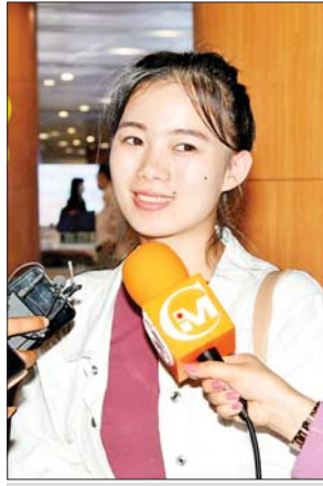
မလမိုင်မိုင်းရာ