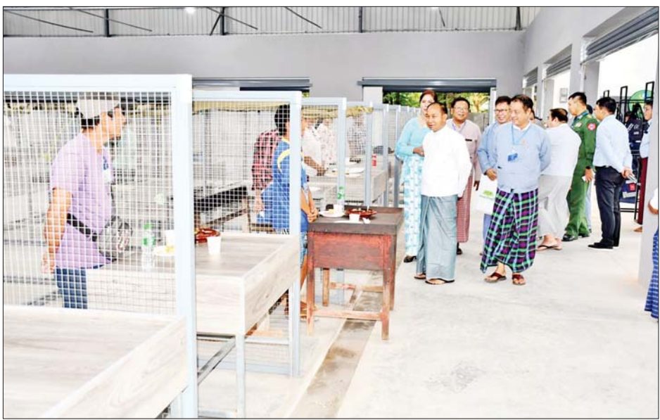
ခွဲသည်။ ၂၄၆၀၀ အကျယ်တွင် ဆိုင်ခန်းပေါင်း ၃၀၀ ကျော်ဖြင့် စစ်ကိုင်းမြို့ ပတ္တမြားရပ်ကွက်ရှိ မင်္ဂလာစစ်ကိုင်း ရောင်းချလျက်ရှိကြောင်း သိရသည်။ ကျောက်မျက်ရတနာဈေးသည် ဧရိယာ စတုရန်းပေ တိုင်းဒေသကြီး(ပြန်/ဆက်)

ထို့နောက် တိုင်းဒေသကြီးဝန်ကြီးချုပ်နှင့် တာဝန်ရှိသူများက မင်္ဂလာစစ်ကိုင်းကျောက်မျက်ရတနာဈေးကြီးအတွင်းရှိ ဆိုင်ခန်းများအား လိုက်လံကြည့်ရှုစစ်ဆေးခဲ့ကြပြီး လိုအပ်သည်များကို တာဝန်ရှိသူများနှင့် ဖြည့်ဆည်းပေါင်းစပ်ဆောင်ရွက်ပေး