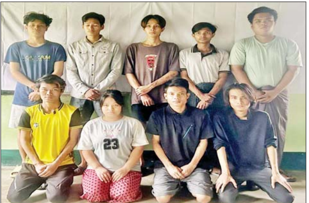
Team (F) တွင် ပါဝင်သော ဝန်ထမ်း ကိုးဦး၏ မှတ်တမ်းဓာတ်ပုံ။

ဥပဒေဘောင်တွင်း နေထိုင်ခြင်း ဘေးကင်းရန်ကွာ လွန်ချမ်းသာ