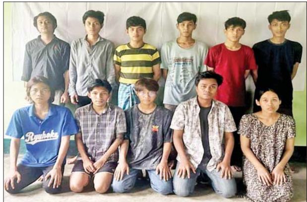
Team (D) တွင် ပါဝင်သော ဝန်ထမ်း ၁၁ ဦး၏ မှတ်တမ်းဓာတ်ပုံ။