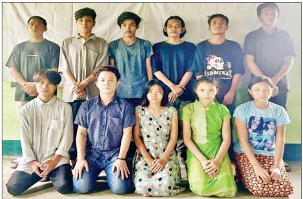
Team (B) တွင် ပါဝင်သော ဝန်ထမ်း ၁၁ ဦး၏ မှတ်တမ်းဓာတ်ပုံ။