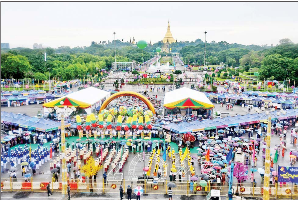
ရန်ကုန်တိုင်းဒေသကြီး၏ ၂၀၂၃ ခုနှစ် စက်မှုထုတ်ကုန်နှင့် ရေထွက်ကုန်ပစ္စည်း သီတင်းကျွတ်ဈေးရောင်းပွဲတော် ဖွင့်ပွဲအခမ်းအနားကျင်းပစဉ်။