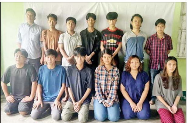
Team (C) တွင် ပါဝင်သော ဝန်ထမ်း ၁၃ ဦး၏ မှတ်တမ်းဓာတ်ပုံ။