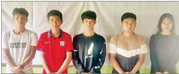
Team Training တွင် ပါဝင်သော ဝန်ထမ်းငါးဦး၏ မှတ်တမ်းဓာတ်ပုံ။