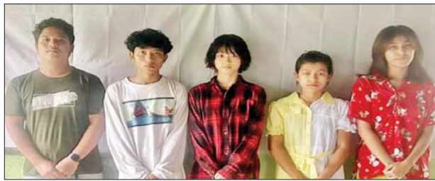
Team Arfu တွင် ပါဝင်သော ဝန်ထမ်းငါးဦး၏ မှတ်တမ်းဓာတ်ပုံ။