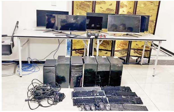
Spring Line ကွန်ပျူတာမှ သိမ်းဆည်းရမိသည့် ကွန်ပျူတာနှင့် ဆက်စပ်ပစ္စည်းများ မှတ်တမ်းဓာတ်ပုံ။