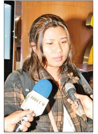
မခင်နင်းအိ

အားလုံးကို ကျေးဇူးတင်ပါတယ်”ဟု ဝမ်းမြောက်ပီတိစကားပြောကြားသည်။