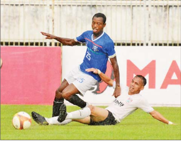
GFA အသင်းနှင့် ကချင်ယူနိုက်တက်အသင်းတို့ ယှဉ်ပြိုင်ကစားကြစဉ်။

နှစ်သင်းစလုံး အမာခံကစားသမားအစုံအလင်ဖြင့် ပွဲထွက်ခဲ့ပြီး ပွဲစကတည်းက တိုက်စစ်အားပြုကစားခဲ့သည်။ ခြေစွမ်းပိုင်းအရ ကွာခြားမှုမရှိဘဲ ဂိုးသွင်းခွင့်အပြန်အလှန်ရသော်လည်း GFA အသင်းက အသုံးချနိုင်သဖြင့် နိုင်ပွဲရခဲ့ခြင်းဖြစ်သည်။ GFA အသင်းအတွက် အနိုင်ဂိုးကို ၃၆ မိနစ်တွင် စာမျက်နှာ ၂၂ ကော်လံ ၁ သို့ ၀