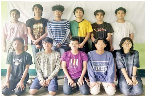
Team (E) တွင် ပါဝင်သော ဝန်ထမ်း ၁၁ ဦး၏ မှတ်တမ်းဓာတ်ပုံ။