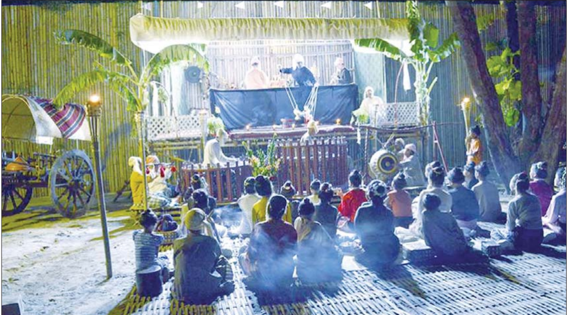
ရတနာပုံခေတ်နှောင်းပိုင်းဟန် ရုပ်သေးသဘင်ပွဲ။

ထို့ပြင် အင်းဝခေတ်တွင် ဇာတ်ပြဇာတ်အနုပညာ (Art of Drama) မှာလည်း ကြိုးဆွဲရုပ်သေးဖြင့်ပင် ထွန်းပေါ်လာခဲ့သည်ဟု တိကျသေချာစွာ ယူဆဖွယ်ဖြစ်သည်။ ဘုရင်မင်းခေါင်သည် သက္ကရာဇ် ၈၆၁ ခုနှစ် (အေဒီ