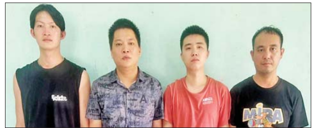
ဖမ်းဆီးရမိတရားခံများ၏ မှတ်တမ်းဓာတ်ပုံ။