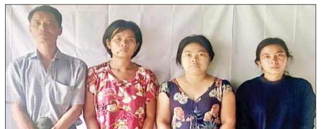
ဖမ်းဆီးရမိတရားခံများ၏ မှတ်တမ်းဓာတ်ပုံ။