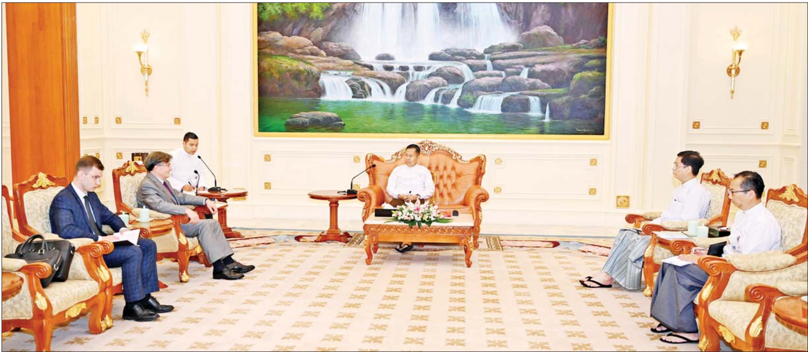
နိုင်ငံတော်စီမံအုပ်ချုပ်ရေးကောင်စီ ဒုတိယဥက္ကဋ္ဌ ဒုတိယဝန်ကြီးချုပ် ဒုတိယဗိုလ်ချုပ်မှူးကြီးစိုးဝင်း မြန်မာနိုင်ငံဆိုင်ရာ ရုရှားဖက်ဒရေးရှင်းနိုင်ငံ သံအမတ်ကြီး H.E.Mr. Iskander Azizov အား လက်ခံတွေ့ဆုံစဉ်။

နေပြည်တော် အောက်တိုဘာ ၂၆ နိုင်ငံတော် စီမံအုပ်ချုပ်ရေးကောင်စီဒုတိယဥက္ကဋ္ဌ ဒုတိယဝန်ကြီးချုပ် ဒုတိယဗိုလ်ချုပ်မှူးကြီးစိုးဝင်းသည် ယနေ့ ညနေပိုင်းတွင် မြန်မာနိုင်ငံဆိုင်ရာ ရုရှားဖက်ဒရေးရှင်းနိုင်ငံသံအမတ်ကြီး H.E.Mr. Iskander Azizov အား နိုင်ငံတော်စီမံအုပ်ချုပ်ရေးကောင်စီဥက္ကဋ္ဌရုံး သံတမန်ဆောင်ဧည့်ခန်းမ၌ လက်ခံတွေ့ဆုံသည်။ အပြန်အလှန် ပေးအပ်တွေ့ဆုံစဉ် မြန်မာ-ရုရှားနှစ်နိုင်ငံဆက်ဆံရေးနှင့် ပူးပေါင်းဆောင်ရွက်မှုများ တိုးမြှင့်ရေးဆိုင်ရာကိစ္စရပ်များ၊ ခရီးသွားလာမှုကဏ္ဍနှင့် ပညာရေးကဏ္ဍအပါအဝင် ဆောင်ရွက်ဆဲ စာမျက်နှာ ၅ ကော်လံ ၁ သို့ ၀