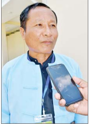
မွန်ပြည်နယ် အောင်နိုင်