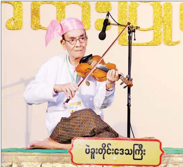
ဝါသနာရှင်အဆင့်(ဒုတိယတန်း) တယောအတီးပြိုင်ပွဲတွင် ပဲခူး တိုင်းဒေသကြီးမှ ပြိုင်ပွဲဝင်တစ်ဦး ယှဉ်ပြိုင်စဉ်။

ဒေသကြီး၊ ကရင်ပြည်နယ်၊ ကချင်ပြည်နယ်နှင့် ရန်ကုန်တိုင်း ဒေသကြီးတို့မှ ပြိုင်ပွဲဝင်များက ခေါင်း၊ ခါး၊ ခြေ၊ လက်အချိုးအဆစ် ညီညာစွာအသုံးပြု၍ ငြိမ်ညောင်း သည့် ကကွက်ကမာန်များဖြင့် လည်းကောင်း၊ အခြေခံပညာ အဆင့် (အသက် ၁၀ နှစ်မှ ၁၅ နှစ်အတွင်း) အမျိုးသမီးပြိုင်ပွဲတွင် ချင်းပြည်နယ်၊ ရန်ကုန်တိုင်း ဒေသကြီး၊ မွန်ပြည်နယ်၊ ကယား ပြည်နယ်၊ မန္တလေးတိုင်းဒေသကြီး၊ ဧရာဝတီ တိုင်းဒေသကြီး၊ တနင်္သာရီ တိုင်းဒေသကြီး၊ စစ်ကိုင်းတိုင်းဒေသကြီး၊ ရှမ်း ပြည်နယ်၊ မကွေးတိုင်းဒေသကြီး၊ ရခိုင်ပြည်နယ်၊ ပဲခူးတိုင်းဒေသ ကြီး၊ ကချင်ပြည်နယ်နှင့် ကရင် ပြည်နယ်တို့မှ ပြိုင်ပွဲဝင်များက ကြည့်ရှုသူများ ရင်သပ်ရှုမော ဖြစ်စေမည့် ကကြိုးကကွက်များ ဖြင့်လည်းကောင်း၊ အခြေခံပညာ အဆင့် (အသက် ၁၅ နှစ်မှ ၂၀ နှစ်အတွင်း) အမျိုးသားပြိုင်ပွဲတွင် မန္တလေးတိုင်းဒေသကြီး၊ ရှမ်း ပြည်နယ်၊ မွန်ပြည်နယ်၊ ကရင် ပြည်နယ်၊ ဧရာဝတီတိုင်းဒေသ ကြီး၊ ပဲခူးတိုင်းဒေသကြီး၊ မကွေး တိုင်းဒေသကြီး၊ ရန်ကုန်တိုင်း ဒေသကြီး၊ စစ်ကိုင်းတိုင်းဒေသ ကြီး၊ ကချင်ပြည်နယ်၊ တနင်္သာရီ တိုင်းဒေသကြီးနှင့် ရခိုင်ပြည်နယ် တို့မှ ပြိုင်ပွဲဝင်များက ကကြိုး ကကွက် စုံလင်စွာဖြင့်လည်း ကောင်း အားကြိုးမာန်တက် ယှဉ်ပြိုင်ကြသည်။