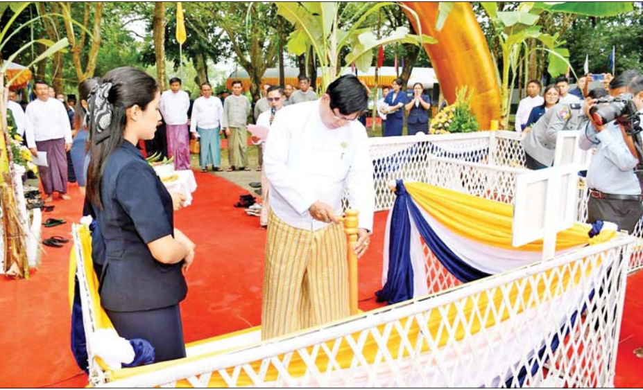
ဖိတ်ကြားထားသူများ တက်ရောက်ကြသည်။ ဦးစွာ တိုင်းဒေသကြီးဝန်ကြီးချုပ်၊ တိုင်းမှူးနှင့် တက်ရောက်လာကြသူများက ရန်ကုန်တိုင်းဒေသကြီး သံဃနာယကအဖွဲ့ဥက္ကဋ္ဌ ဆရာတော်

နေပြည်တော် အောက်တိုဘာ ၂၆ ရန်ကုန်တိုင်းဒေသကြီးအစိုးရအဖွဲ့၏ ကြီးကြပ်မှုဖြင့် ရန်ကုန်မြို့တော် စည်ပင်သာယာရေးကော်မတီ (လမ်း/တံတား)မှ တာဝန်ယူတည်ဆောက်မည့် ရွှေတိဂုံစေတီတော်(အနောက်ဘက်မုခ်နှင့် ပြည်သူ့ရင်ပြင်ပန်းခြံကြား) မြေအောက်လမ်းကူး လူသွားဥမင်(Underpass)အဆောက်အအုံ ရတနာပန္နက်တော် တင်မင်္ဂလာအခမ်းအနားကို ယနေ့ နံနက်ပိုင်းတွင် ရန်ကုန်တိုင်းဒေသကြီး ဒဂုံမြို့နယ် ဦးဝိစာရလမ်း၌ ပြုလုပ်ရာ အခမ်းအနားသို့ နိုင်ငံတော်ဗဟိုသံဃာ့ဝန်ဆောင် တိပိဋက ဩဝါဒါစရိယ အဂ္ဂမဟာပဏ္ဍိတ အဂ္ဂမဟာဂန္ထဝါစကပဏ္ဍိတ၊ စေတီယင်္ဂဏ ပဝရ သီရိမဟာ ဓမ္မာဂုရု သ.စ. အ ဓမ္မာစရိယ (ဝဋံသကာ) ပါဠိပါရဂူ လှရတနာဆရာတော် ဘဒ္ဒန္တနာရဒါဘိဝံသ အမှူးပြုသော သံဃာတော်များ ကြွရောက်တော်မူကြပြီး ရန်ကုန်တိုင်းဒေသကြီးဝန်ကြီးချုပ် ဦးစိုးသိန်း၊ ရန်ကုန်တိုင်းစစ်ဌာနချုပ်တိုင်းမှူး ဗိုလ်ချုပ်ဇော်ဟိန်း၊ တိုင်းဒေသကြီးဝန်ကြီးများ၊ ရန်ကုန်မြို့တော် စည်ပင်သာယာရေးကော်မတီမှ တာဝန်ရှိသူများနှင့်