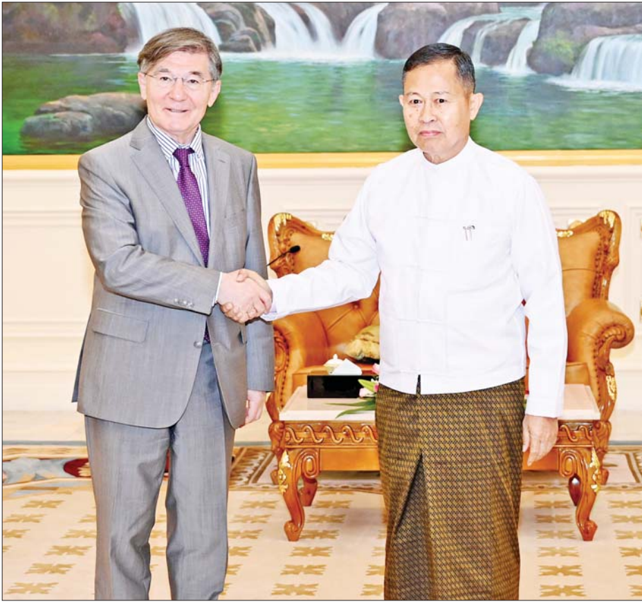
နိုင်ငံတော်စီမံအုပ်ချုပ်ရေးကောင်စီ ဒုတိယဥက္ကဋ္ဌ ဒုတိယဝန်ကြီးချုပ် ဒုတိယဗိုလ်ချုပ်မှူးကြီးစိုးဝင်း မြန်မာနိုင်ငံဆိုင်ရာ ရုရှားဖက်ဒရေးရှင်းနိုင်ငံ သံအမတ်ကြီး H.E.Mr. Iskander Azizov အား ရင်းရင်း နှီးနှီး တွေ့ဆုံနှုတ်ဆက်စဉ်။

○ ကျောမိုးမှ ကဏ္ဍအလိုက် လုပ်ငန်းများ ဆက်လက်ပူးပေါင်းဆောင်ရွက် ရေးဆိုင်ရာကိစ္စရပ်များ၊ တစ် နိုင်ငံလုံးပစ်ခတ်တိုက်ခိုက်မှုရပ်စဲ ရေးသဘောတူစာချုပ်(NCA)နှင့် ဆက်စပ်၍ ထာဝရငြိမ်းချမ်းရေး ရရှိရေးနှင့်စပ်လျဉ်းပြီး ရှေးနိုငံ မှ ကူညီဆောင်ရွက်ပေးနိုင်မည့် ကိစ္စရပ်များ၊ စွမ်းအင်နှင့် နည်း ပညာဆိုင်ရာ ပူးပေါင်းဆောင်ရွက် ရေးကိစ္စရပ်များနှင့် စပ်လျဉ်း၍ ရင်းနှီးပွင့်လင်းစွာ ဆွေးနွေးကြပြီး အမှတ်တရလက်ဆောင်ပစ္စည်း များ အပြန်အလှန်ပေးအပ်ကြ သည်။