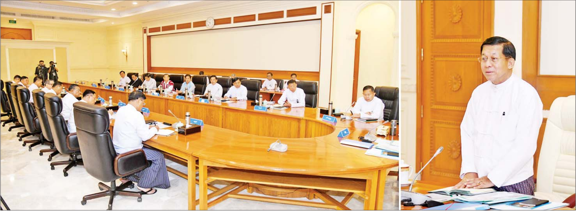
နိုင်ငံတော်စီမံအုပ်ချုပ်ရေးကောင်စီဥက္ကဋ္ဌ နိုင်ငံတော်ဝန်ကြီးချုပ် ဗိုလ်ချုပ်မှူးကြီးမင်းအောင်လှိုင် နိုင်ငံတော်စီမံအုပ်ချုပ်ရေးကောင်စီ အစည်းအဝေး(၅/၂၀၂၃)တွင် အမှာစကားပြောကြားစဉ်။