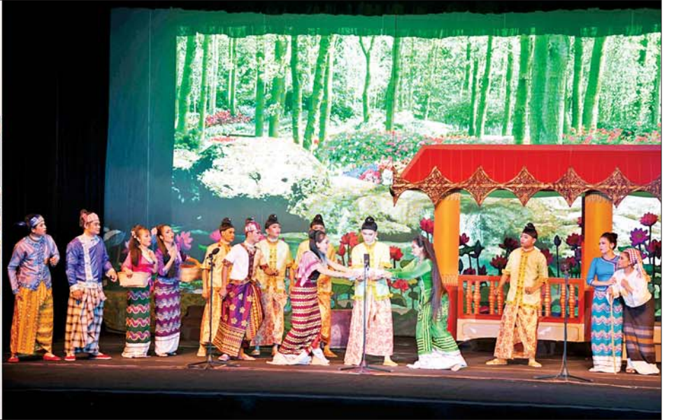
နိုင်ငံတော်စီမံအုပ်ချုပ်ရေးကောင်စီဥက္ကဋ္ဌ နိုင်ငံတော်ဝန်ကြီးချုပ်၏ဇနီး ဒေါ်ကြူကြူလှ ဝါသနာရှင်အဆင့်(ပထမတန်း) “မဟော်သခာ” ဇာတ်တော်ကြီးပြိုင်ပွဲတွင် မန္တလေးတိုင်းဒေသကြီးကိုယ်စားပြု စိန်မြန်မာအနုပညာအင်အားစု မဟော်သခာဇာတ်တော်ကြီးအဖွဲ့ ယှဉ်ပြိုင်မှုကို ကြည့်ရှုအားပေးစဉ်။