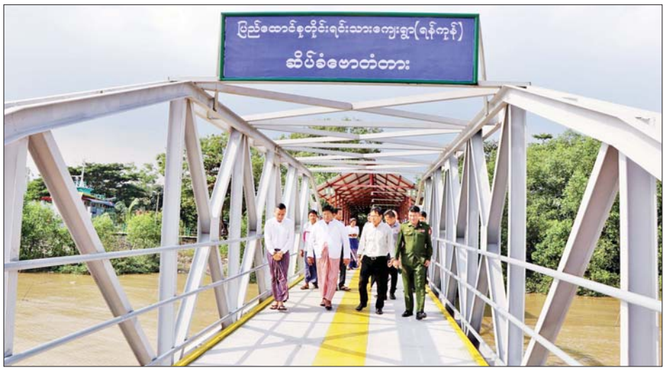
ဆိုင်ကယ်ဘေးတွဲများ ရပ်နားမှုမရှိစေရေးအတွက် မြို့နယ်စီမံအုပ်ချုပ်ရေးအဖွဲ့နှင့် ပေါင်းစပ်ညှိနှိုင်း

အဆောက်အအုံများအား ဆေးသုတ်ထားရန်၊ ကပွဲခန်းမနှင့် အစည်းအဝေးခန်းမအား နိုင်ငံတော်အဆင့်မီ ပြုပြင်ဆောင်ရွက်ထားရန် မှာကြားသည်။ ကြည့်ရှုစစ်ဆေး ယင်းနောက် ဒုတိယဝန်ကြီးသည် ဆိပ်ခံဗေတံတားတည်ဆောက်ပြီးစီးမှုနှင့် နန်းမြင့်မျှော်စင်တို့ကို ကြည့်ရှုစစ်ဆေးပြီး နန်းမြင့်မျှော်စင်မျက်နှာကြက်များ ပြုပြင်ဆောင်ရွက်ရန်၊ နန်းမြင့်မျှော်စင်ဆေး သုတ်ခြင်းလုပ်ငန်းများ ဆောင်ရွက်ရန်၊ ပြည်ထောင်စုတိုင်းရင်းသားကျေးရွာသို့ စည်ပင်အောင်လမ်းပလက်ဖောင်းကပ်တုံးများဖြန့်ကျားဆေးသုတ်ရန်၊ လမ်းနံဘေးရှိဈေးဆိုင်များ၊ အငှားယာဉ်နှင့်