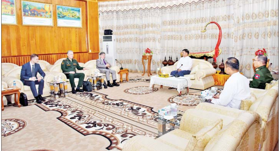
ပွင့်လင်းစွာ အမြင်ချင်းဖလှယ် ဆွေးနွေးခဲ့ကြသည်။ တာဝန်ရှိသူများ တက်ရောက်ကြကြောင်း သိရသည်။ တွေ့ဆုံပွဲသို့ ပြည်ထောင်စုဝန်ကြီးနှင့်အတူ သတင်းစဉ်

နေပြည်တော် အောက်တိုဘာ ၂၆ နိုင်ငံတော်စီမံအုပ်ချုပ်ရေးကောင်စီအဖွဲ့ဝင် ဒုတိယဝန်ကြီးချုပ်နှင့် ကာကွယ်ရေးဝန်ကြီးဌာန ပြည်ထောင်စုဝန်ကြီး ဗိုလ်ချုပ်ကြီးတင်အောင်စန်း သည် မြန်မာနိုင်ငံဆိုင်ရာ ရုရှားဖက်ဒရေးရှင်းနိုင်ငံ သံအမတ်ကြီး H.E. Mr. Iskander Azizov ကို ယနေ့ ညနေပိုင်းတွင် ပြည်ထောင်စုဝန်ကြီးရုံး ဧည့်ခန်းမ၌ လက်ခံတွေ့ဆုံသည်။ တွေ့ဆုံစဉ် တပ်မတော်နှစ်ရပ်အကြား စစ်ဘက်- နည်းပညာ ပူးပေါင်းဆောင်ရွက်ရေးဆိုင်ရာကိစ္စရပ် များ၊ လေ့ကျင့်ရေးဆိုင်ရာကိစ္စရပ်များနှင့် မြန်မာနိုင်ငံ နှင့် ရုရှားဖက်ဒရေးရှင်းနိုင်ငံတို့အကြား ကာကွယ်ရေး ဆိုင်ရာ ပူးပေါင်းဆောင်ရွက်မှုများကို ဆက်လက်တိုးမြှင့် ဆောင်ရွက်သွားနိုင်မည့် အခြေအနေများကို ရင်းနှီး