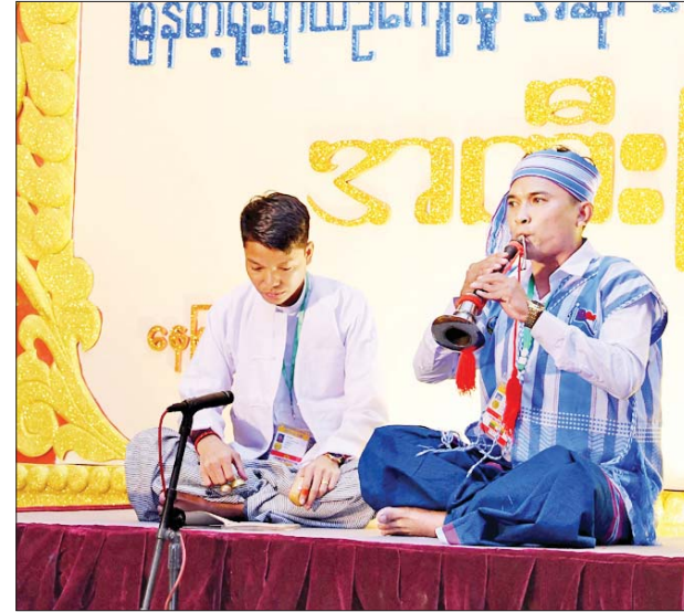
ဝါသနာရှင်အဆင့်(ပထမတန်း) နှိုပြိုင်ပွဲတွင် ကရင်ပြည်နယ် မှ ပြိုင်ပွဲဝင်တစ်ဦး ယှဉ်ပြိုင်စဉ်။

နယ်၊ စစ်ကိုင်းတိုင်းဒေသကြီး၊ တနင်္သာရီတိုင်းဒေသကြီး၊ ကရင် ပြည်နယ်၊ ကယားပြည်နယ်၊ မန္တလေးတိုင်းဒေသကြီး၊ ပဲခူး တိုင်းဒေသကြီး၊ ရန်ကုန်တိုင်း ဒေသကြီး၊ မကွေးတိုင်းဒေသကြီး၊ မွန်ပြည်နယ်၊ ရှမ်းပြည်နယ်၊ ကချင်ပြည်နယ်နှင့် ဧရာဝတီတိုင်း ဒေသကြီးတို့မှ ပြိုင်ပွဲဝင်များက “မြန်မာ” သီချင်းဖြင့်လည်းကောင်း ဖော်ကျူးသီဆို ယှဉ်ပြိုင်ကြ သည်။