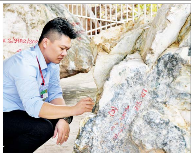
ကျောက်စိမ်းအတွဲ ၆၂၃ တွဲကို ကျောက်စိမ်းခန်းမ၌ အောက်တိုဘာ ၂၈ လည်းကောင်း ရောင်းချပေးနိုင်ခဲ့ပြီး ကျန်ရှိသည့် ကျောက်စိမ်းအတွဲ ၁၇၉၂ တွဲကို နေပြည်တော်ရှိ မဏိရတနာ

၂၀၂၃ ခုနှစ် နှစ်လယ် မြန်မာ့ကျောက်မျက်ရတနာပြပွဲတွင် ပုလဲအတွဲ ၃၀၀ နှင့် ကျောက်မျက်အတွဲ ၇၃ တွဲကို ပြည်တွင်း၊ ပြည်ပရတနာကုန်သည်များအား ဈေးနှုန်းပိုမိုစွာဖြင့် ရောင်းချနိုင်ခဲ့သည်။ ထို့ပြင် ပြပွဲတွင်ကျောက်စိမ်းအတွဲပေါင်း ၄၀၄၅ တွဲကို နေ့ရက် အလိုက် ပြည်တွင်း၊ ပြည်ပရတနာကုန်သည်များအား အိတ်ဖွင့်တင်ဒါစနစ်ဖြင့် ရောင်းချပေးခဲ့ရာ ပြပွဲပဉ္စမနေ့တွင် ကျောက်စိမ်းအတွဲပေါင်း ၇၅၀ အနက် ကျောက်စိမ်းအတွဲ ၇၅၀ တွဲကို လည်းကောင်း၊ ပြပွဲဆဋ္ဌမနေ့တွင် ကျောက်စိမ်းအတွဲပေါင်း ၇၅၀ အနက် ကျောက်စိမ်းအတွဲ ၆၀၀ တွဲကိုလည်းကောင်း၊ ပြပွဲသတ္တမနေ့တွင် ကျောက်စိမ်းအတွဲပေါင်း ၇၅၃ တွဲအနက်