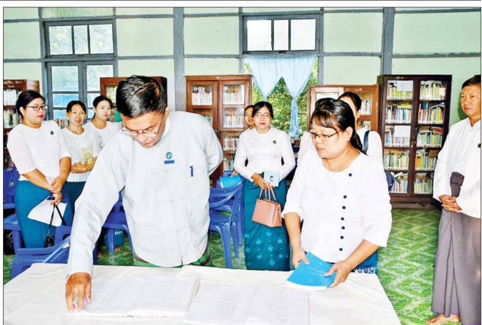
ဒုတိယဝန်ကြီးဦးရဲတင့် ပြန်ကြားရေးနှင့် ပြည်သူ့ဆက်ဆံရေးဦးစီးဌာန ပြည်ခရိုင်ရုံးစာကြည့်တိုက်ကို ကြည့်ရှုစစ်ဆေးစဉ်။

ဒုတိယဝန်ကြီးက ဝန်ထမ်းများနှင့် တွေ့ဆုံစဉ် မိမိတို့၏ အဓိကတာဝန်ဖြစ်သည့် ပြန်ကြားရေးနှင့် အသိပညာပေးလုပ်ငန်းများကို ထိရောက်အောင်မြင် အောင် ဆောင်ရွက်ကြရန်၊ ကျေးရွာစာကြည့်တိုက် များ ရှင်သန်တိုးတက်ရေးညှိနှိုင်း ဆောင်ရွက်ကြရန်၊ လူငယ်များ ဗလင်းတန်ဖွံ့ဖြိုးရေးနှင့် အသိပညာ ဗဟုသုတပြန့်ပွားစေရေးကို အလေးထားဆောင်ရွက် ကြရန်၊ လူငယ်များအကြား မိမိတို့နိုင်ငံ၏ ယဉ်ကျေးမှု ဓလေ့ထုံးစံများကို အလေးထားပြီး နိုင်ငံခြား ယဉ်ကျေးမှုများ ထိုးဖောက်ဝင်ရောက်လာမှုကို တားဆီးကာကွယ်ရေး အသိပညာပေးရန်။ မကြာမီကျရောက်မည့် အမျိုးသားနေ့၊ လွတ်လပ် ရေးနေ့၊ ပြည်ထောင်စုနေ့တို့တွင် ဦးတည်ချက်များ နှင့် အညီကျင်းပနိုင်ရေး၊ အထိမ်းအမှတ်ပြပွဲ၊ ပြိုင်ပွဲ