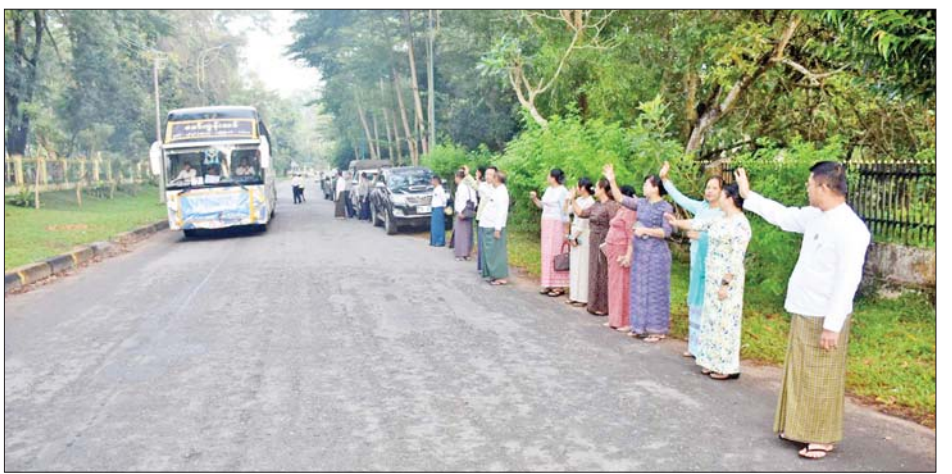
နှုတ်ဆက်ခဲ့ကြောင်း သိရသည်။

တစ်ဦးချင်းပြိုင်ပွဲများတွင် မိမိတို့၏ ပြိုင်ပွဲဝင် ဘာသာရပ်အား ကျွမ်းကျင်ပိုင်နိုင်စွာ ယှဉ်ပြိုင်နိုင်ရေး၊ အဖွဲ့လိုက်ပြိုင်ပွဲများတွင် စည်းလုံးညီညွတ်မှု၊ အပေးအယူမျှတမှုရှိစေရေး၊ ပံ့ပိုးရေးအဖွဲ့များအနေ ဖြင့်လည်း မိမိတို့ပြိုင်ပွဲဝင်အတွက် အကောင်းဆုံး ဖြစ်စေရေး ကြိုးစားဆောင်ရွက်ပေးကြရန်၊ သွားလာ နေထိုင်စားသောက်မှုများ ဂရုတစိုက်ဆောင်ရွက်ရန်၊ ကျန်းမာရေးကိစ္စရပ်များကိုလည်း အထူးဂရုစိုက် ဆောင်ရွက်ရန်၊ မော်တော်ယာဉ်များကိုလည်း ယာဉ်စည်းကမ်း လမ်းစည်းကမ်းများအတိုင်း မောင်းနှင် ရန်၊ အုပ်ချုပ်မှုယာဉ်များ စနစ်တကျလိုက်ပါ ဆောင်ရွက်ရန်နှင့် တိုင်းဒေသကြီးဂုဏ်ဆောင် အောင်မြင်မှုရရှိစေရေး ကြိုးစားကြရန် ပြောကြားခဲ့ပြီး ပြိုင်ပွဲဝင်တစ်ဦးချင်းအား ရင်းရင်းနှီးနှီးတွေ့ဆုံ