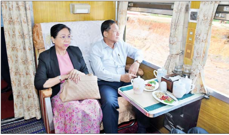
နိုင်ငံတော်စီမံအုပ်ချုပ်ရေးကောင်စီဥက္ကဋ္ဌ နိုင်ငံတော်ဝန်ကြီးချုပ်ဗိုလ်ချုပ်မှူးကြီး မင်းအောင်လှိုင်နှင့် ဇနီး ဒေါ်ကြူကြူလှ တောင်ကြီးဘူတာမှ ပေါမူဘူတာသို့ ပြေးဆွဲထွက်ခွာမည့် ရထားတွဲဆိုင်းပေါ်တွင် လိုက်ပါစီးနင်းကြစဉ်။

တောင်ကြီးမြို့သည် ရှမ်းပြည် နယ်၏ မြို့တော်ဖြစ်ပြီး ကုန်သွယ် စီးပွားလုပ်ငန်း၊ ခရီးသွားလုပ်ငန်း၊ စိုက်ပျိုးရေးနှင့် စက်မှုလုပ်ငန်းများ ဖွံ့ဖြိုးတိုးတက်သည့် အချက်အချာ ဒေသဖြစ်ပါကြောင်း။ ထို့ပြင် တိုင်း ရင်းသားပေါင်းစုံလူဦးရေလေးသိန်း ကျော် မှီတင်းနေထိုင်သည့် မြို့တော်ကြီးလည်း ဖြစ်ပါကြောင်း။ တောင်ကြီးဒေသကို ဗဟိုပြုပြီး ရှမ်းပြည်နယ် ဖွံ့ဖြိုးတိုးတက်ရေး အတွက် ယခုရထားလမ်းပိုင်း အဆင့်မြှင့်တင်ခြင်းနှင့် အသစ် တည်ဆောက်ခြင်းတို့ကို ပြည့်စုံ အောင်မြင်အောင် ကြိုးပမ်းစွမ်း