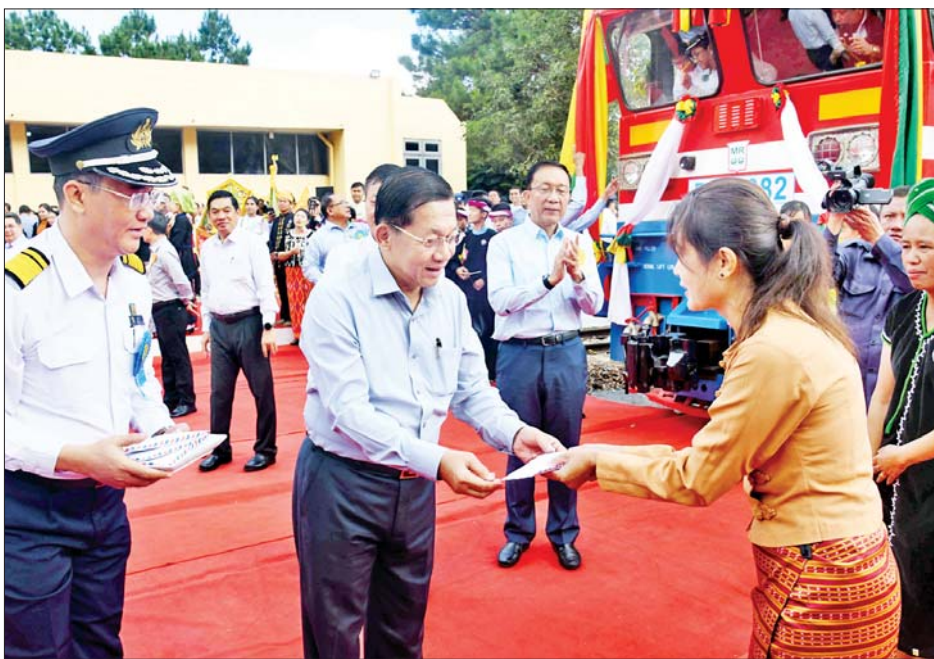
နိုင်ငံတော်စီမံအုပ်ချုပ်ရေးကောင်စီဥက္ကဋ္ဌ နိုင်ငံတော်ဝန်ကြီးချုပ် ဗိုလ်ချုပ်မှူးကြီးမင်းအောင်လှိုင် ဒေသခံတိုင်းရင်းသားရိုးရာအကအလှအဖွဲ့များအား ဂုဏ်ပြုချီးမြှင့်ငွေများ ပေးအပ်ချီးမြှင့်စဉ်။

အဆိုပါ လမ်းပိုင်းအဆင့်မြှင့် တင်ခြင်းနှင့် လမ်းပိုင်းအသစ် တည်ဆောက်ဖွင့်လှစ်ခြင်းများ ဆောင်ရွက်ပြီးချိန်၌ ပင်းပက် သံမဏိစက်ရုံမှ သံရိုင်းကုန်ကြမ်း များကို လိုရာအရောက် သက်သာ လွယ်ကူစွာ သယ်ယူပို့ဆောင်ပေး နိုင်မည်ဖြစ်သည့်အပြင် ဒေသခံ ပြည်သူများ အလုပ်အကိုင်အခွင့် အလမ်းများရရှိစေခြင်း၊ ဒေသတွင်း မှ ကုန်စည်များကို ရထားဖြင့် ကုန်ကျစရိတ်သက်သာစွာပို့ဆောင် နိုင်ခြင်း၊ စက်မှုကုန်ကြမ်းများကို ကုန်ချောထုတ်လုပ်ရာ ဒေသ အရောက်လွယ်ကူစွာပို့ဆောင်ပေး နိုင်သည့်အတွက် စက်မှုလုပ်ငန်း များ ဖွံ့ဖြိုးတိုးတက်ရေးကို အထောက်အကူ ပြုနိုင်ခြင်း။