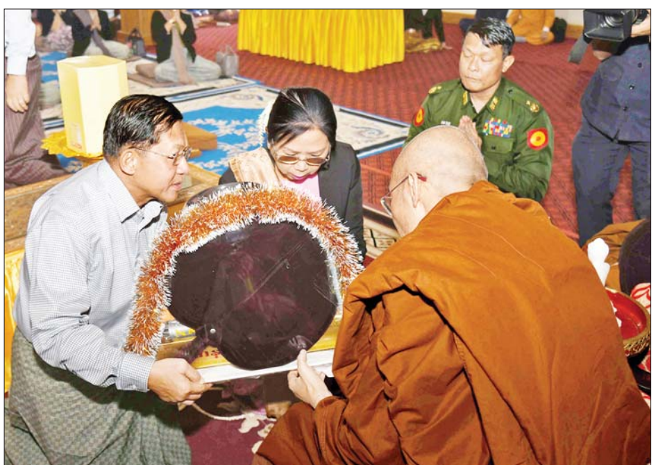
နိုင်ငံတော်စီမံအုပ်ချုပ်ရေးကောင်စီဥက္ကဋ္ဌ နိုင်ငံတော်ဝန်ကြီးချုပ် ဗိုလ်ချုပ်မှူးကြီးမင်းအောင်လှိုင် နှင့်ဇနီး ဒေါ်ကြူကြူလှ ကမ္ဘာ့ဗုဒ္ဓသာသနာပြု(အောက်စဖို့ဒ်) ဆရာတော်အား လှူဖွယ်ပစ္စည်းများ ဆက်ကပ်လှူဒါန်းစဉ်။

ထို့နောက် ကောင်စီတွဲဖက် အတွင်းရေးမှူးနှင့် ကောင်စီဝင် များက ဆရာတော်၊ သံဃာတော် များထံသို့ လှူဖွယ်ပစ္စည်းများကို ပေးအပ်လှူဒါန်းရာ (အောက်စဖို့ဒ်) ဆရာတော်က ဓမ္မလက်ဆောင် စာအုပ်များ ပြန်လည်ချီးမြှင့်သည်။ ယင်းနောက် နိုင်ငံတော်စီမံ