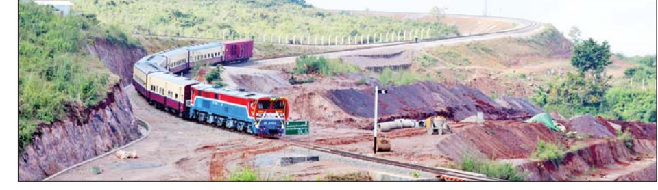
ရွှေညောင်-တောင်ကြီး-နောင်ကားလမ်းခွဲ-ပင်းပက် ရထားလမ်းပိုင်းတစ်နေရာကို တွေ့မြင်ရစဉ်။

ထို့နောက် နိုင်ငံတော်စီမံ အုပ်ချုပ်ရေးကောင်စီဥက္ကဋ္ဌ နိုင်ငံ တော်ဝန်ကြီးချုပ်နှင့် ဇနီးဦးဆောင် သည့်အဖွဲ့ဝင်များ၊ ဒေသခံ တိုင်းရင်းသား ပြည်သူများသည် တောင်ကြီးဘူတာမှ ပေါမူဘူတာ သို့ ပြေးဆွဲထွက်ခွာမည့် ရထား တွဲဆိုင်းပေါ်တွင် အတူတကွ လိုက်ပါစီးနင်းခဲ့ကြပြီး တောင်ကြီး မြို့အား ရထားပေါ်မှ မြင်တွေ့ရ သည့် အလှအပများ၊ တောင်ကြား လမ်းများ၊ ရထားလမ်းကြောင်း တစ်လျှောက် မြင်တွေ့ရသည့်