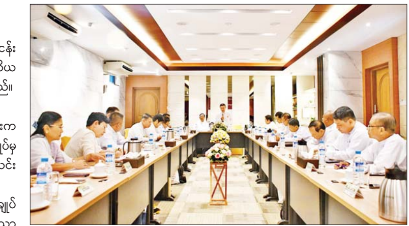
အမျိုးသား အားကစားပွဲတွင်လည်း ကျင်းပရန် ဆောင်ရွက်နေကြောင်း ယနေ့ ပြည်နယ်နှင့်တိုင်းဒေသကြီး၊ တက္ကသိုလ်၊ ပြုလုပ်သည့် အခမ်းအနားမှ သိရသည်။ ဒီဂရီကောလိပ်၊ ဌာနဆိုင်ရာပြိုင်ပွဲများ လင်းရာမ

ယ်ကြာလာတာနဲ့အမျှ အကြောင်းအမျိုး မျိုးကြောင့် အမှုဆောင်တွေ လျော့နည်း သွားလို့ အခုလို နာယကတစ်ဦး၊ အမှု ဆောင် ၂၆ ဦးပါဝင်တဲ့အဖွဲ့အစည်းအသစ်ကို ဖွဲ့စည်းရခြင်းဖြစ်ပါတယ်။ မြန်မာ့ရိုးရာ ခြင်းလုံးအားကစား တိုးတက်မြှင့်မား အောင် အရည်တည်တံ့အောင် လုပ်ဆောင် ရမှာ တက်ညီလက်ညီဆောင်ရွက်နိုင်တဲ့ အင်အားအများအပြားလိုအပ်တာကြောင့် အခုလိုအသစ်ဖွဲ့စည်းရခြင်းဖြစ်ပါတယ်” ဟု ပြောသည်။ ထို့နောက် အဖွဲ့ချုပ်နာယက ဦးစိုးတင့်က ရိုးရာခြင်းလုံးနှင့်ပတ်သက်၍