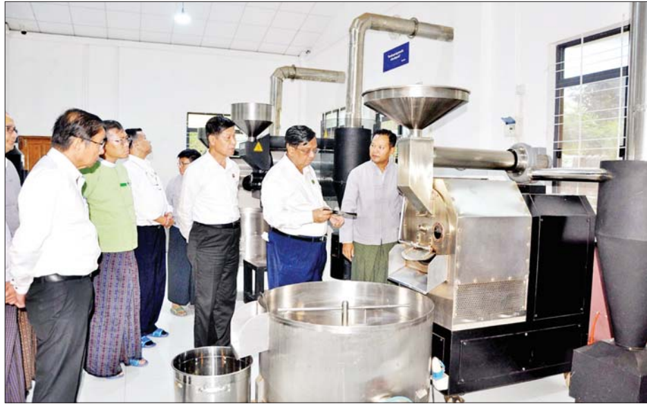
ပြည်ထောင်စုဝန်ကြီး ဒေါက်တာချာလီသန်းနှင့် မန္တလေးတိုင်းဒေသကြီးဝန်ကြီးချုပ် ဦးမျိုးအောင် တို့ May Myo Fresh Coffee ထုတ်လုပ်နေမှုအား ကြည့်ရှုစစ်ဆေးစဉ်။

မြန်မာ့ကော်ဖီလုပ်ငန်းရှင်များနှင့် တွေ့ဆုံပွဲ အခမ်းအနားကို ယမန်နေ့ မွန်းလွဲပိုင်းတွင် မန္တလေး တိုင်းဒေသကြီး ပြင်ဦးလွင်မြို့ရှိ မြို့တော်ခန်းမ၌ ကျင်းပရာ အသေးစား၊ အငယ်စားနှင့် အလတ်စား စီးပွားရေးလုပ်ငန်းများ ဖွံ့ဖြိုးတိုးတက်ရေးလုပ်ငန်း ကော်မတီဒုတိယဥက္ကဋ္ဌ စက်မှုဝန်ကြီးဌာန ပြည်ထောင်စုဝန်ကြီး ဒေါက်တာချာလီသန်း၊ မန္တလေး တိုင်းဒေသကြီး အသေးစား၊ အငယ်စားနှင့် အလတ် စား စီးပွားရေးလုပ်ငန်းများ ဖွံ့ဖြိုးတိုးတက်ရေး အေဂျင်စီနာယက၊ မန္တလေးတိုင်းဒေသကြီး ဝန်ကြီးချုပ် ဦးမျိုးအောင်၊ မန္တလေးတိုင်းဒေသကြီးဝန်ကြီးများ၊ အေဂျင်စီအဖွဲ့ဝင်များ၊ ဆက်စပ်ဝန်ကြီးဌာနများနှင့် စက်မှုဝန်ကြီးဌာနတို့မှ တာဝန်ရှိသူများ၊ ကော်ဖီ စိုက်ပျိုးထုတ်လုပ်သည့် လုပ်ငန်းရှင်များနှင့် ကော်ဖီ စိုက်တောင်သူများတက်ရောက်သည်။