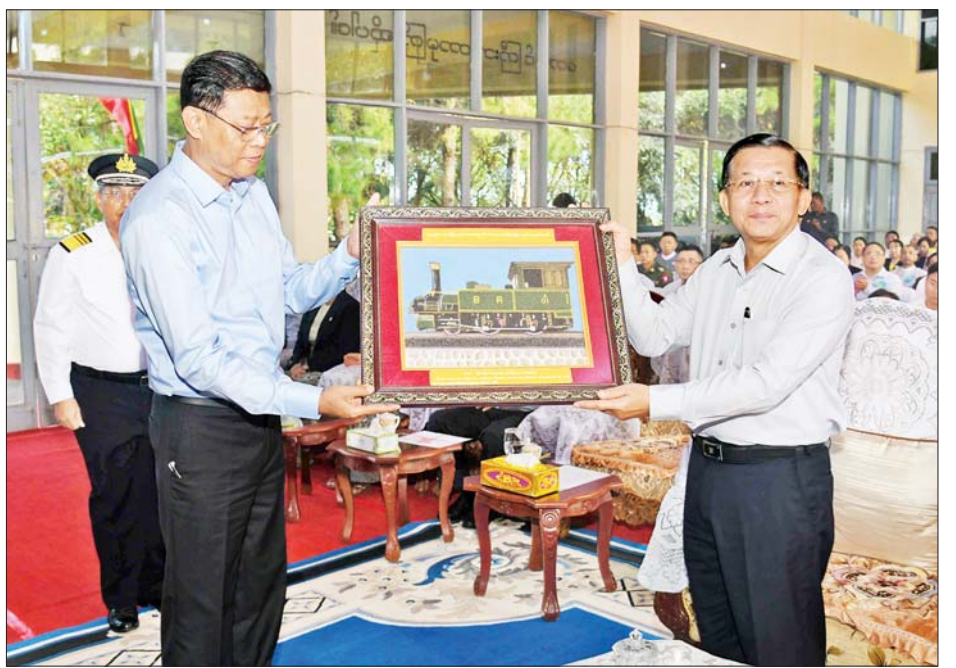
နိုင်ငံတော်စီမံအုပ်ချုပ်ရေးကောင်စီဥက္ကဋ္ဌ နိုင်ငံတော်ဝန်ကြီးချုပ် ဗိုလ်ချုပ်မှူးကြီးမင်းအောင်လှိုင် ထံသို့ နိုင်ငံတော်စီမံအုပ်ချုပ်ရေးကောင်စီအဖွဲ့ဝင် ဒုတိယဝန်ကြီးချုပ်နှင့် ပြည်ထောင်စုဝန်ကြီး ဗိုလ်ချုပ်ကြီး မြထွန်းဦး ရွှေညောင်-တောင်ကြီး-နောင်ကား လမ်းခွဲ-ပင်းပက် ရထားလမ်းပိုင်း ဖွင့်လှစ်ခြင်း အထိမ်းအမှတ် လက်ဆောင်ကို ဂါရဝပြု လေးအပ်စဉ်။

နိုင်ငံတစ်နိုင်ငံကို ခေတ်မီဖွံ့ဖြိုးတိုးတက်အောင် ဆောင်ရွက်ရာတွင် လမ်းပန်းဆက်သွယ်ရေးနှင့် သယ်ယူပို့ဆောင်ရေးကဏ္ဍသည် အလွန်အရေးပါသည့် ကဏ္ဍကြီးတစ်ခုဖြစ်ပါကြောင်း၊ ဒီထက်ပိုပြီး ပြောရမည်ဆိုပါက အခြေခံလူတန်းစား ပြည်သူအများစုကြီးအားကိုးအားထား အသုံးပြုနေရသည့် ရထားသယ်ယူပို့ဆောင်ရေးလုပ်ငန်းသည် အခြေခံအကျဆုံး နှင့် အရေးကြီးဆုံးဖြစ်သည်ဟု