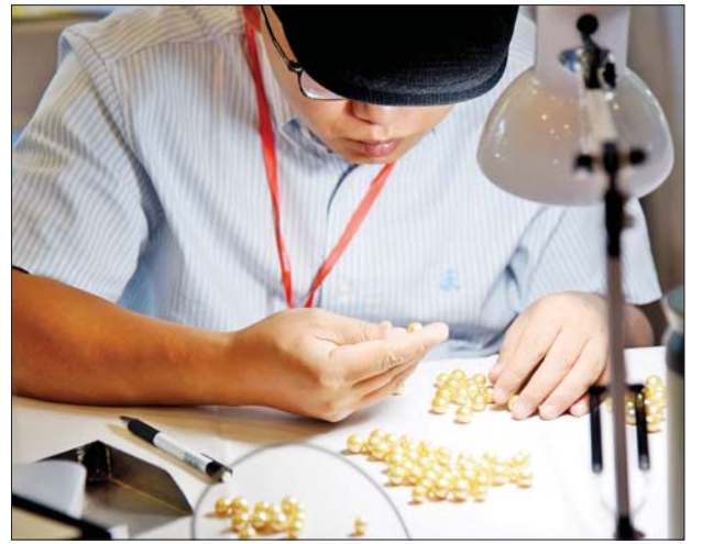
ပုလဲအတွဲများကို ပြည်တွင်း ပြည်ပရတနာကုန်သည်များက ကြည့်ရှုစစ်ဆေးကြစဉ်။