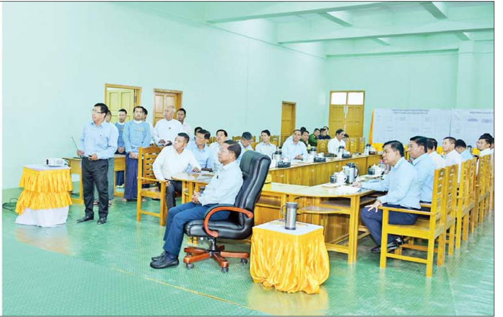
နိုင်ငံတော်စီမံအုပ်ချုပ်ရေးကောင်စီဥက္ကဋ္ဌ နိုင်ငံတော်ဝန်ကြီးချုပ် ဗိုလ်ချုပ်မှူးကြီး မင်းအောင်လှိုင်အား ရှမ်းပြည်နယ်တိုင်းရင်းသားရေးရာနှင့် သက်မွေးပညာသင်တန်းစင်တာ တည်ဆောက်နေမှုနှင့်ပတ်သက်၍ ဒုတိယဝန်ကြီး ဦးဇော်အေးမောင် ရှင်းလင်းတင်ပြစဉ်။

နေပြည်တော် အောက်တိုဘာ ၂၂ နိုင်ငံတော် စီမံအုပ်ချုပ်ရေး ကောင်စီဥက္ကဋ္ဌ နိုင်ငံတော် ဝန်ကြီးချုပ် ဗိုလ်ချုပ်မှူးကြီး မင်းအောင်လှိုင်သည် ခရီးစဉ်တွင် လိုက်ပါလာသည့် အဖွဲ့ဝင်များ၊ ရှမ်းပြည်နယ်ဝန်ကြီးချုပ်၊ အရှေ့ပိုင်းတိုင်းစစ်ဌာနချုပ် တိုင်းမှူးနှင့် တာဝန်ရှိသူများ လိုက်ပါ၍ ယနေ့ နံနက်ပိုင်းတွင် ရှမ်းပြည်နယ် တောင်ကြီးမြို့နယ် အေးသာယာ မြို့ရှိ ရှမ်းပြည်နယ် တိုင်းရင်းသား ရေးရာနှင့် သက်မွေးပညာသင်တန်း စင်တာ တည်ဆောက်နေမှုကို