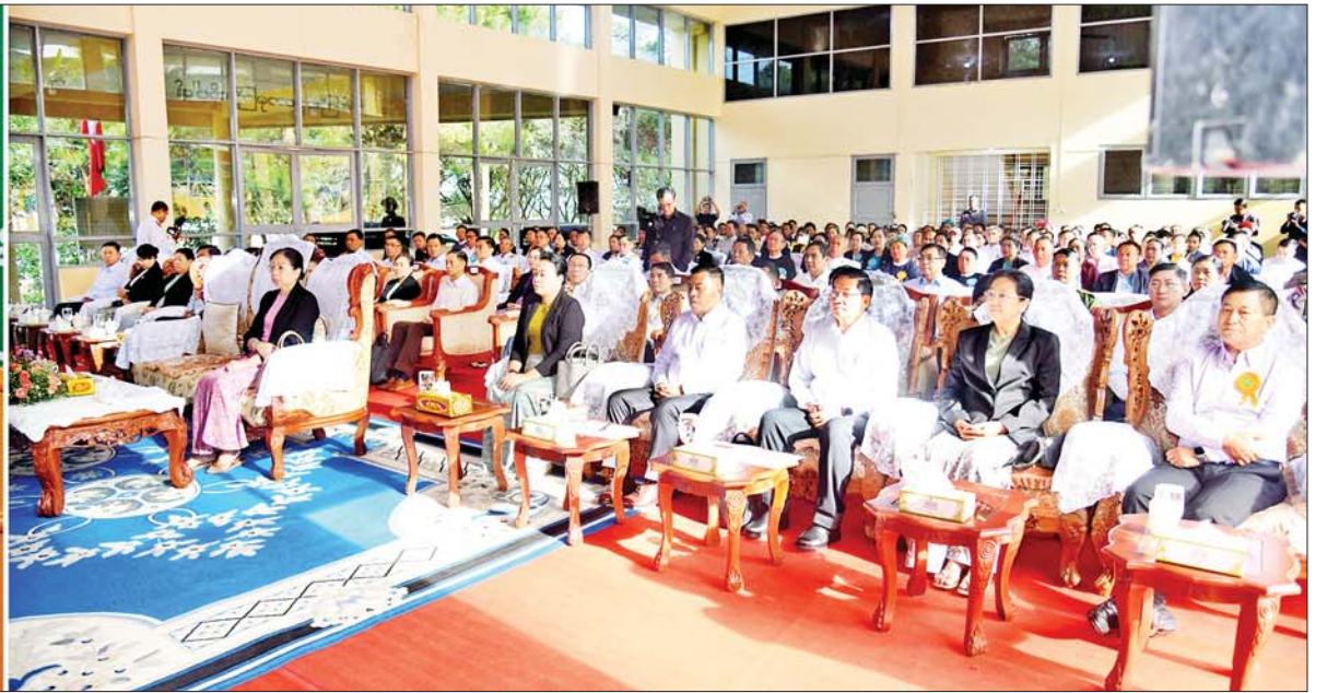
နိုင်ငံတော်စီမံအုပ်ချုပ်ရေးကောင်စီဥက္ကဋ္ဌ နိုင်ငံတော်ဝန်ကြီးချုပ် ဗိုလ်ချုပ်မှူးကြီးမင်းအောင်လှိုင် ရွှေညောင် - တောင်ကြီး - နောင်ကားလမ်းခွဲ - ပင်းပက် ရထားလမ်းပိုင်းဖွင့်လှစ်ခြင်း အခမ်းအနားတွင် အမှာစကားပြောကြားစဉ်။

ရှေ့ဖုံးမှ ဦးစွာနိုင်ငံတော်စီမံအုပ်ချုပ်ရေးကောင်စီဥက္ကဋ္ဌ နိုင်ငံတော်ဝန်ကြီးချုပ်နှင့်ဇနီး၊ အခမ်းအနားတက်ရောက်လာကြသူများသည် အခမ်းအနား ကျင်းပပြုလုပ်မည့် တောင်ကြီးဘူတာသို့ ရောက်ရှိကြရာ တာဝန်ရှိသူများနှင့် ဒေသခံတိုင်းရင်းသား ပြည်သူတို့က လှိုက်လှဲနှေးထွေးစွာ ကြိုဆိုနှုတ်ဆက်ကြသည်။