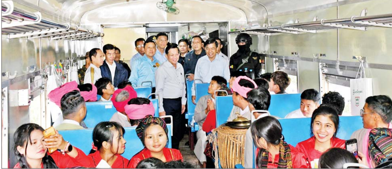
နိုင်ငံတော်စီမံအုပ်ချုပ်ရေးကောင်စီဥက္ကဋ္ဌ နိုင်ငံတော်ဝန်ကြီးချုပ်ဗိုလ်ချုပ်မှူးကြီး မင်းအောင်လှိုင်နှင့် အဖွဲ့ဝင်များ ရထားတွဲဆိုင်းပေါ်တွင် စီးနင်းလိုက်ပါလာသည့် ပြည်နယ်အဆင့်ဌာနဆိုင်ရာဝန်ထမ်းများ၊ ဒေသခံတိုင်းရင်းသားပြည်သူများကို ရင်းရင်းနှီးနှီး လိုက်လံနှုတ်ဆက်ကြစဉ်။

တောင်ကြီး-နောင်ကားလမ်းခွဲ- ပင်းပက်ရထားလမ်းပိုင်းကိုလည်း နိုင်ငံတော်အကြီးအကဲ၏လမ်းညွှန် ချက်အရ တောင်ကြီး-ဆိုက်ခေါင် ရထားလမ်းပိုင်းအတွင်းရှိ နောင် ကားလမ်းခွဲဘူတာမှ တစ်ဆင့် ပင်းပက်သို့ အရှည် ၁၀ ဒသမ ၇၈ မိုင်ကို တိုးချဲ့ဖောက်လုပ်ခဲ့ခြင်း ဖြစ်ပြီး လမ်းပိုင်းအတွင်း အဓိကကျ သည့် ရွှေညောင်-တောင်ကြီး အကြား ရထားလမ်းပိုင်းကို ရထား လမ်းကွေ့နှင့် ဆင်ခြေလျှောပြေပြစ် ပြီး ပိုမိုကြံ့ခိုင်မှုရှိစေရေးနှင့် ခရီးသည်နှင့် ကုန်စည်များ လုံခြုံ စိတ်ချစွာ ဝန်ချိန်ပြည့်သယ်ယူပို့ ဆောင်နိုင်ရန် ရထားလမ်းအဆင့် မြှင့်တင်ခြင်း လုပ်ငန်းများကို ဆောင်ရွက်ခဲ့ခြင်းဖြစ်ကြောင်း၊ ရွှေညောင်-တောင်ကြီး-နောင် ကားလမ်းခွဲ-ပင်းပက် ရထားလမ်း ပိုင်းတွင် ခရီးမိုင် ၄၁ ဒသမ ၁၆ မိုင် တံတားကြီး၊ တံတားငယ် ၁၂၉ စင်းနှင့် ဘလောက်ဘူတာ ကိုးဘူတာ ပါဝင်ကြောင်း၊ ယခုကဲ့ သို့ ရထားလမ်းပိုင်း အဆင့် မြှင့်တင်ခြင်းနှင့် တိုးချဲ့ဖောက်လုပ် နိုင်ခဲ့သည့်အတွက် မီးရထားလမ်း ကြောင်းမှ ဒေသထွက်ကုန်စည် များကို ကျန်ကျစရိတ်သက်သာစွာ၊ အဆင်ပြေချောမွေ့စွာ သယ်ယူ ပို့ဆောင်ပေးနိုင်မည့်အပြင် သဘာဝ ပတ်ဝန်းကျင်ထိခိုက်မှုအနည်းဆုံး ဖြစ်သော ရထားပို့ဆောင်ရေးကို အသုံးပြုခြင်းဖြင့် တောင်တန်း ဒေသ၏ သဘာဝပတ်ဝန်းကျင် ရေရှည်တည်တံ့ရေးနှင့် ဒေသ တွင်း လူမှုစီးပွားဘဝများလည်း ပိုမိုဖွံ့ဖြိုးတိုးတက်လာနိုင်မည် ဖြစ်ကြောင်း သိရသည်။