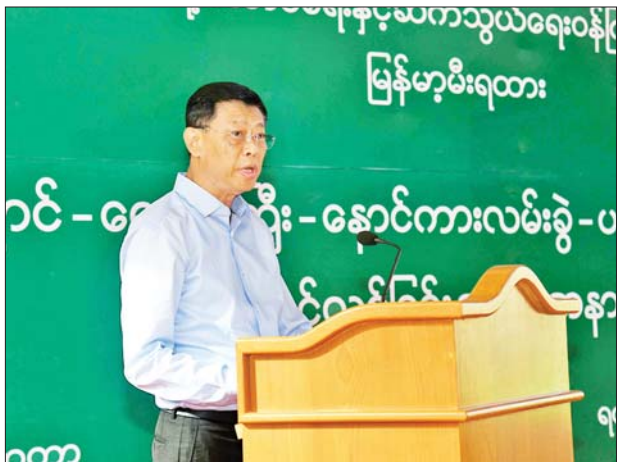
နိုင်ငံတော်စီမံအုပ်ချုပ်ရေးကောင်စီအဖွဲ့ဝင် ဒုတိယဝန်ကြီးချုပ်နှင့် ပြည်ထောင်စုဝန်ကြီး ဗိုလ်ချုပ်ကြီးမြထွန်းဦး ရှင်းလင်းတင်ပြစဉ်။

ပြည်သူများအတွက် လိုအပ်မည့် စီမံကိန်း အသစ်များကိုလည်း ဖြည့်ဆည်းဆောင်ရွက်ပေးလျက် ရှိပါကြောင်း၊ မိမိကိုယ်တိုင် တာဝန်ရှိသူများနှင့် မကြာခဏတွေ့ဆုံပြီး ရထားလုပ်ငန်း ဖွံ့ဖြိုးတိုးတက်ရေးအတွက် လိုအပ်သည့် ပံ့ပိုးဖြည့်ဆည်းမှုကြားမှုများ စဉ်ဆက်မပြတ် ဆောင်ရွက်လျက်ရှိပါကြောင်း၊ ရထားလမ်းများကြိုခိုင်ကောင်းမွန်အောင် ပြုပြင်ထိန်းသိမ်းဆောင်ရွက်ရာ၌ သတ်မှတ်ထားသည့် စံချိန်စံညွှန်းများအတိုင်း တိကျစွာလိုက်နာပြီး ရေရှည်အတွက် မျှော်မှန်းစဉ်းစားဆောင်ရွက်ရန်၊ ပြည်တွင်းအင်ဂျင်နီယာ ပညာရှင်များကို အဓိက အားထားအသုံးပြုပြီး နည်းပညာများ တိုးတက်လာအောင်ဆောင်ရွက်ရန်၊ အနာဂတ်တွင် လျှပ်စစ်ရထားပြေးဆွဲနိုင်ရေး ကြိုတင်ပြင်ဆင်မှု လုပ်ငန်းများ ဆောင်ရွက်ရန်၊ စက်ခေါင်းနှင့် တွဲများတည်ဆောက်ရေးအတွက် စာမျက်နှာ ၄ သို့ >>>