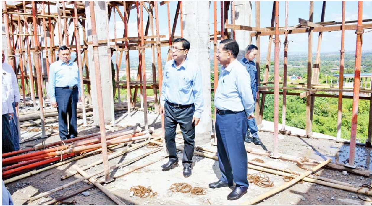
နိုင်ငံတော်စီမံအုပ်ချုပ်ရေးကောင်စီဥက္ကဋ္ဌ နိုင်ငံတော်ဝန်ကြီးချုပ် ဗိုလ်ချုပ်မှူးကြီး မင်းအောင်လှိုင် ရှမ်းပြည်နယ် တိုင်းရင်းသားရေးရာနှင့် သက်မွေးပညာသင်တန်းစင်တာ ဆောက်လုပ်နေမှုအခြေအနေများကို လှည့်လည်ကြည့်ရှုစစ်ဆေးစဉ်။

❖ ရှမ်းပြည်နယ် တိုင်းရင်းသားရေးရာနှင့် သက်မွေးပညာသင်တန်းစင်တာကို ရှမ်းပြည်နယ်အတွင်း မှီတင်းနေထိုင်ကြသော တိုင်းရင်းသားလူမျိုးများ၏ လူမှုစီးပွားဘဝတိုးတက်မြှင့်တင်ရေးအတွက် အသက်မွေးဝမ်းကျောင်းသင်တန်းများ ဖွင့်လှစ်ပို့ချပေးရန်၊ တိုင်းရင်းသားလူမျိုးများ၏ ရိုးရာယဉ်ကျေးမှုလေ့ထုံးတမ်းများကို အချင်းချင်းဖလှယ်နိုင်ရန်၊ တိုင်းရင်းသားများ၏ ဒေသအတွင်းတည်ငြိမ်အေးချမ်းရေး၊ တရားဥပဒေစိုးမိုးရေးနှင့် ဖွံ့ဖြိုးတိုးတက်ရေးတို့ကို အထောက်အကူပြုစေရန်နှင့် မဲခေါင်ဒေသတွင်း နိုင်ငံများအကြား ဖွံ့ဖြိုးတိုးတက်မှုကွာဟချက် ကို လျော့ချရန်ရည်ရွယ်၍ ၂၀၂၂ ခုနှစ်တွင် စတင်တည်ဆောက်ခဲ့ခြင်းဖြစ်