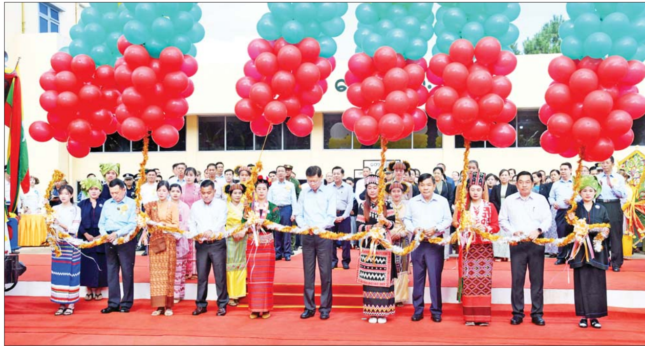
နိုင်ငံတော်စီမံအုပ်ချုပ်ရေးကောင်စီတွဲဖက်အတွင်းရေးမှူး ဒုတိယဗိုလ်ချုပ်ကြီး ရဲဝင်းဦး၊ နိုင်ငံတော်စီမံအုပ်ချုပ်ရေးကောင်စီဝင် ဒုတိယ ဝန်ကြီးချုပ်နှင့် ပြည်ထောင်စုဝန်ကြီး ဗိုလ်ချုပ်ကြီး မြထွန်းဦး၊ ကောင်စီဝင်ဗိုလ်ချုပ်ကြီး မောင်မောင်အေး၊ ဒုတိယဗိုလ်ချုပ်ကြီး ညိုစောနှင့် ရှမ်းပြည်နယ်ဝန်ကြီးချုပ် ဦးအောင်ဇော်အေးတို့က ရွှေညောင်-တောင်ကြီး-နောင်ကားလမ်းခွဲ-ပင်းပက် ရထားလမ်းပိုင်းကို ဖဲကြိုးဖြတ် ဖွင့်လှစ်ပေးကြစဉ်။

ထို့ပြင် ခရီးသည်နှင့် ကုန်စည် ပို့ဆောင်သူများ စိတ်ချမ်းမြေ့ အဆင်ပြေရေး၊ မတော်တဆမှုများ လျော့နည်းပျောက်ရေး၊ ရထား များ အချိန်မှန်ကန်ရေး၊ ရထားလမ်း များ စာမျက်နှာ ၅ သို့ »»