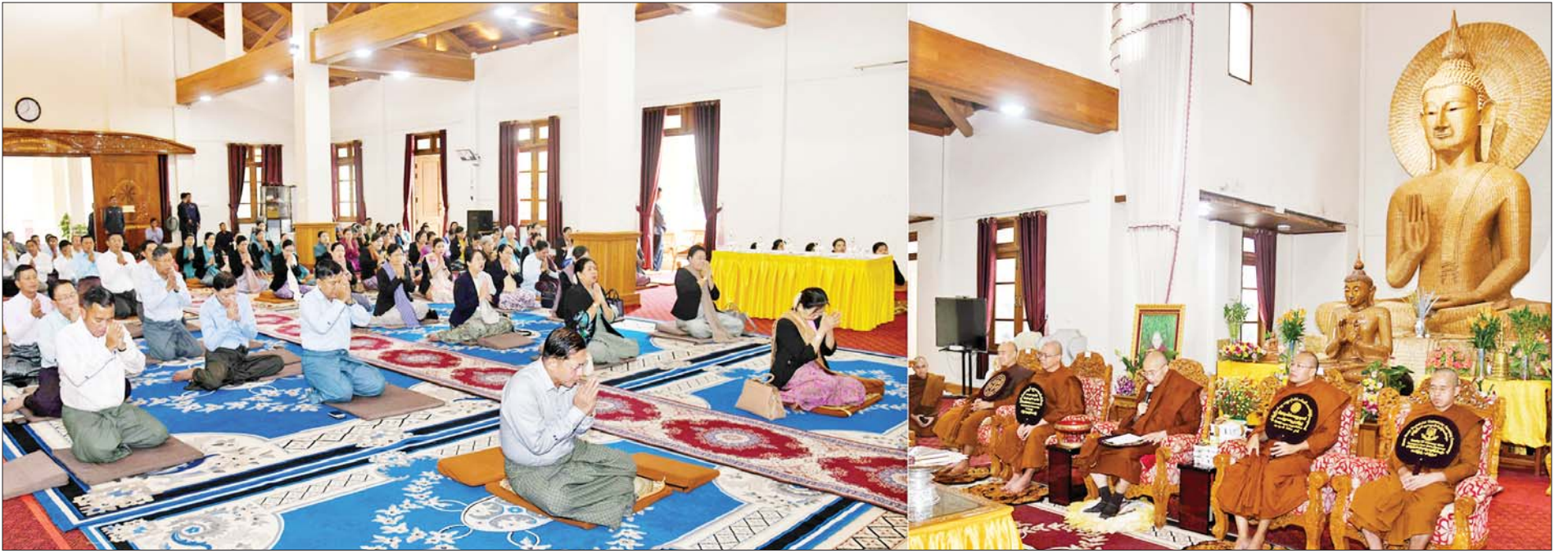
နိုင်ငံတော်စီမံအုပ်ချုပ်ရေးကောင်စီဥက္ကဋ္ဌ နိုင်ငံတော်ဝန်ကြီးချုပ် ဗိုလ်ချုပ်မှူးကြီးမင်းအောင်လှိုင်၊ ဇနီး ဒေါ်ကြူကြူလှနှင့် အဖွဲ့ဝင်များ ကမ္ဘာ့ဗုဒ္ဓသာသနာပြု (အောက်စဖို့ဒ်) ဆရာတော်ထံမှ လှူဒါန်းမှုအစုအတွက် အနုမောဒနာတရား နာယူကြည်ညိုကြစဉ်။