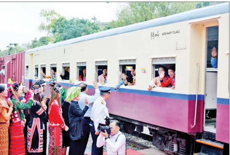
နိုင်ငံတော်စီမံအုပ်ချုပ်ရေးကောင်စီဥက္ကဋ္ဌ နိုင်ငံတော်ဝန်ကြီးချုပ် ဗိုလ်ချုပ်မှူးကြီးမင်းအောင်လှိုင်၊ ဇနီး ဒေါ်ကြူကြူလှနှင့် အဖွဲ့ဝင်များ တောင်ကြီးဘူတာမှ ပင်းပက်ဘူတာသို့ ပြေးဆွဲထွက်ခွာမည့်ရထားပေါ်တွင် စီးနင်းလိုက်ပါသွားကြသည့် ဒေသခံတိုင်းရင်းသားပြည်သူများအား လက်ဝှေ့ယမ်းပြန့်တံဆက်စဉ်။

လုပ်ငန်းများကို တစ်ပါတည်း ဆောင်ရွက်ပြီးစီးခဲ့ခြင်း ဖြစ်ပါ ကြောင်း။