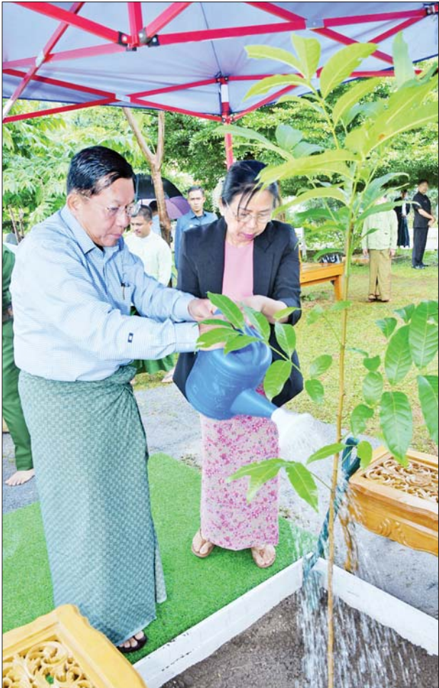
နိုင်ငံတော်စီမံအုပ်ချုပ်ရေးကောင်စီဥက္ကဋ္ဌ နိုင်ငံတော်ဝန်ကြီးချုပ် ဗိုလ်ချုပ်မှူးကြီးမင်းအောင်လှိုင်နှင့်ဇနီး ဒေါ်ကြူကြူလှတို့က ရှမ်းပြည်နယ် ဗုဒ္ဓတက္ကသိုလ်အတွင်း မဟော်ဂနီပင်ကို အမှတ်တရ စိုက်ပျိုးပေးစဉ်။

Buddhist University) ကို ၂၀၁၆ ခုနှစ် ဖေဖော်ဝါရီ ၇ ရက်တွင် တည်ထောင်ဖွင့်လှစ်ခဲ့ပြီး မြန်မာ နိုင်ငံအတွင်း ဗုဒ္ဓဘာသာပညာ ရေးကဏ္ဍကို ကမ္ဘာ့တက္ကသိုလ်ကြီး များကဲ့သို့ ဗုဒ္ဓဘာသာအတွေး အခေါ်များ၊ တရားဓမ္မများကို နိုင်ငံတကာအဆင့်မီ သုတေသန ပြုလေ့လာသင်ကြားပို့ချနိုင်သည့် တက္ကသိုလ်ကြီးအဖြစ် ဖြစ်ထွန်း လာစေရေး အားသွန်ခွန်စိုက် ကြိုးပမ်းတော်မူလျက်ရှိကြောင်း နှင့် ဗုဒ္ဓသာသနာတော် ထွန်းကား ပြန့်ပွားရေးဆိုင်ရာ စာပေများကို အင်အားစုကာလက မြန်မာဘာသာ၊ ရှမ်းဘာသာတို့ဖြင့် ရေးသားပြုစု ထုတ်ဝေခြင်း၊ ဘာသာပြန်ဆိုခြင်း ကိုလည်း လုပ်ဆောင်ကာ ဘာသာ သာသနာတော်အကျိုးကို ကြီးပမ်း အားထုတ် ဖော်ဆောင်တော်မူ လျက်ရှိကြောင်း သိရသည်။ သတင်းစဉ်