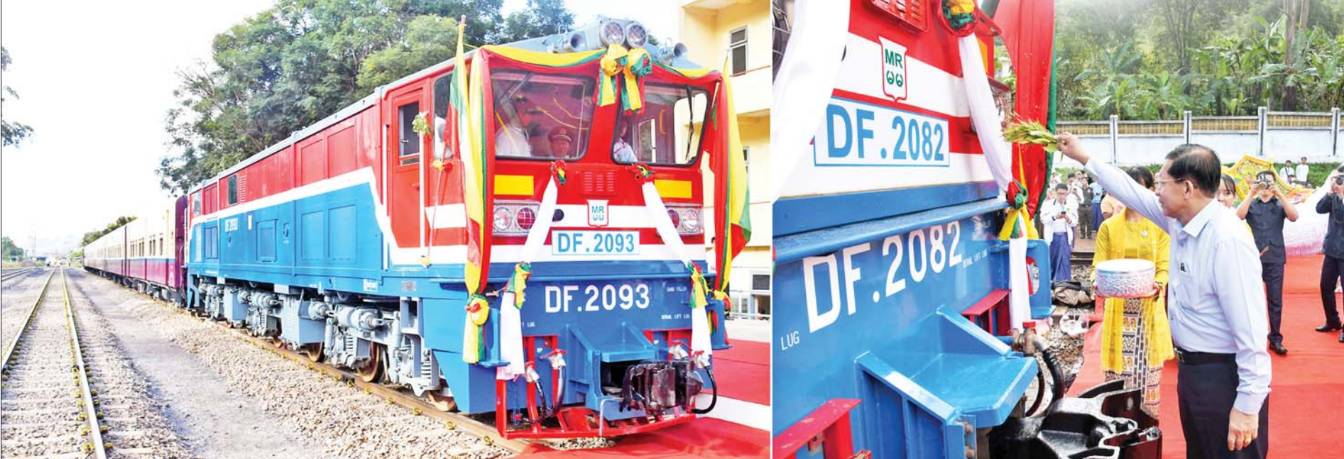
နိုင်ငံတော်စီမံအုပ်ချုပ်ရေးကောင်စီဥက္ကဋ္ဌ နိုင်ငံတော်ဝန်ကြီးချုပ် ဗိုလ်ချုပ်မှူးကြီးမင်းအောင်လှိုင် တောင်ကြီးဘူတာမှ ပင်းပက်ဘူတာသို့ ပြေးဆွဲထွက်ခွာမည့် ရထားစက်ခေါင်းနှင့် တောင်ကြီးဘူတာမှ ပေါမူဘူတာသို့ ပြေးဆွဲထွက်ခွာမည့် ရထားစက်ခေါင်းတို့အား အမွှေးနံ့သာရည်များဖြင့် ပက်ဖျန်းပေးစဉ်။