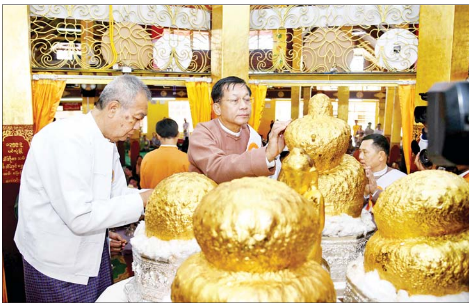
နိုင်ငံတော်စီမံအုပ်ချုပ်ရေးကောင်စီဥက္ကဋ္ဌ နိုင်ငံတော်ဝန်ကြီးချုပ် ဗိုလ်ချုပ်မှူးကြီးမင်းအောင်လှိုင် အင်းလေးဖောင်တော်ဦးမြတ်စွာဘုရားအား ရွှေသင်္ကန်းများ ကပ်လှူပူဇော်စဉ်။

ယင်းနောက် နိုင်ငံတော်စီမံအုပ်ချုပ်ရေးကောင်စီ ဥက္ကဋ္ဌ နိုင်ငံတော် ဝန်ကြီးချုပ်ထံသို့ ရှမ်းပြည်နယ် ဝန်ကြီးချုပ်က အင်းသားရိုးရာ လှေလှော်ပြိုင်ပွဲ အထိမ်းအမှတ် လက်ဆောင်ကို