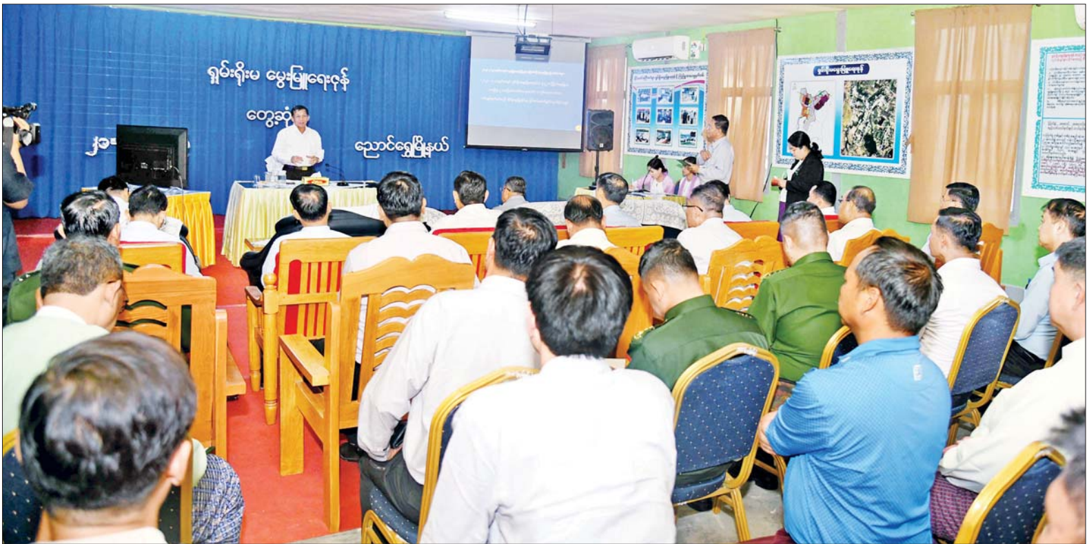
နိုင်ငံတော်စီမံအုပ်ချုပ်ရေးကောင်စီဥက္ကဋ္ဌ နိုင်ငံတော်ဝန်ကြီးချုပ် ဗိုလ်ချုပ်မှူးကြီးမင်းအောင်လှိုင် အေးသာယာစက်မှုဇုန်အတွင်းရှိ ရှမ်းရိုးမမွေးမြူရေးဇုန် ရှင်းလင်းဆောင်ညှိ တာဝန်ရှိသူများအား ဆွေးနွေးပြောကြားစဉ်။

နေပြည်တော် အောက်တိုဘာ ၂၁ နိုင်ငံတော် စီမံအုပ်ချုပ်ရေး ကောင်စီဥက္ကဋ္ဌ နိုင်ငံတော် ဝန်ကြီးချုပ် ဗိုလ်ချုပ်မှူးကြီး မင်းအောင်လှိုင်သည် ခရီးစဉ်တွင် လိုက်ပါလာသည့် အဖွဲ့ဝင်များ၊ ရှမ်းပြည်နယ်ဝန်ကြီးချုပ်၊ အရှေ့ ပိုင်းတိုင်းစစ်ဌာနချုပ် တိုင်းမှူးနှင့် တာဝန်ရှိသူများ လိုက်ပါ၍ ယနေ့ မွန်းလွဲပိုင်းတွင် တောင်ကြီးမြို့ အေးသာယာစက်မှုဇုန် အတွင်းရှိ ရှမ်းရိုးမမွေးမြူရေးဇုန် လုပ်ငန်း ဆောင်ရွက်ထားရှိမှု အခြေအနေ များကို သွားရောက်ကြည့်ရှု အားပေးသည်။