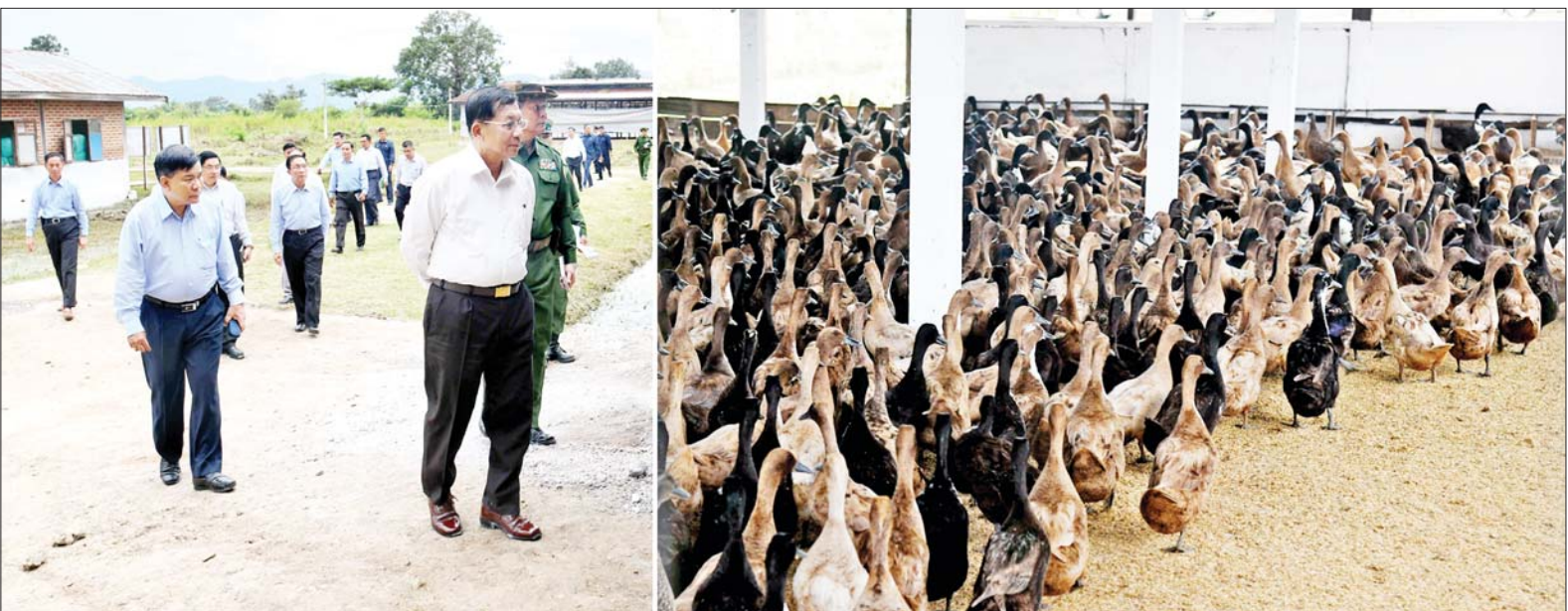
နိုင်ငံတော်စီမံအုပ်ချုပ်ရေးကောင်စီဥက္ကဋ္ဌ တပ်မတော်ကာကွယ်ရေးဦးစီးချုပ် ဗိုလ်ချုပ်မှူးကြီးမင်းအောင်လှိုင် အရှေ့ပိုင်းတိုင်းစစ်ဌာနချုပ် နန်းသီတာဘက်စုံစိုက်ပျိုး မွေးမြူရေးစခန်းတွင် ဥစားဘဲများ မွေးမြူထားရှိမှုကို ကြည့်ရှုစစ်ဆေးစဉ်။

နေပြည်တော် အောက်တိုဘာ ၂၁ နိုင်ငံတော် စီမံအုပ်ချုပ်ရေး ကောင်စီဥက္ကဋ္ဌ တပ်မတော် ကာကွယ်ရေးဦးစီးချုပ် ဗိုလ်ချုပ် မှူးကြီး မင်းအောင်လှိုင်သည် ယနေ့ မွန်းလွဲပိုင်းတွင် ခရီးစဉ်တွင် လိုက်ပါလာသည့် အဖွဲ့ဝင်များ၊ ရှမ်းပြည်နယ်ဝန်ကြီးချုပ်၊ အရှေ့ ပိုင်းတိုင်းစစ်ဌာနချုပ် တိုင်းမှူးနှင့် တာဝန်ရှိသူများ လိုက်ပါ၍ အရှေ့ပိုင်းတိုင်း စစ်ဌာနချုပ် နန်းသီတာဘက်စုံစိုက်ပျိုးမွေးမြူ ရေးစခန်းသို့ သွားရောက်ကြည့်ရှု စစ်ဆေးသည်။