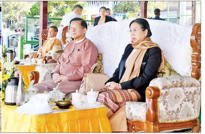
နိုင်ငံတော်စီမံအုပ်ချုပ်ရေးကောင်စီဥက္ကဋ္ဌ နိုင်ငံတော်ဝန်ကြီးချုပ် ဗိုလ်ချုပ်မှူးကြီးမင်းအောင်လှိုင်နှင့်ဇနီး ဒေါ်ကြာကြာလှ တိုင်းရင်းသားရိုးရာအကအဖွဲ့များ၏ ယဉ်ကျေးမှုပဒေသာကပွဲ ဖျော်ဖြေနေမှုကို ကြည့်ရှုအားပေးစဉ်။

★ ရှေ့ဖုံးမှ ဦးစွာ နိုင်ငံတော်စီမံအုပ်ချုပ်ရေးကောင်စီဥက္ကဋ္ဌ နိုင်ငံတော်ဝန်ကြီးချုပ်နှင့်ဇနီး၊ အခမ်းအနားတက်ရောက်လာကြသူများသည် ဖောင်တော်ပြန် ဧည့်ရိပ်သာသို့ ရောက်ရှိကြရာ တာဝန်ရှိသူများနှင့် ဒေသခံတိုင်းရင်းသားပြည်သူတို့က လှိုက်လှဲနွေးထွေးစွာ ကြိုဆိုနှုတ်ဆက်ကြသည်။ ယင်းနောက် နိုင်ငံတော် စီမံအုပ်ချုပ်ရေးကောင်စီဥက္ကဋ္ဌ နိုင်ငံတော်ဝန်ကြီးချုပ်နှင့်ဇနီး၊ အဖွဲ့ဝင်များသည် တိုင်းရင်းသား ရိုးရာအကအဖွဲ့များ၏ ကိန္နရီကိန္နရာအက၊ ရှမ်းတိုင်းရင်းသားရိုးရာအက၊ တိုးနယားအက၊ အင်းတိုင်းရင်းသား မီးဆုခံအက၊ ဓားသိုင်းအက၊ ပအိုဝ်းတိုင်းရင်းသားအက၊ ရှမ်းကြီးအက စသည့် ယဉ်ကျေးမှုပဒေသာကပွဲ ဖျော်ဖြေနေမှုများကို ကြည့်ရှုအားပေးကြသည်။