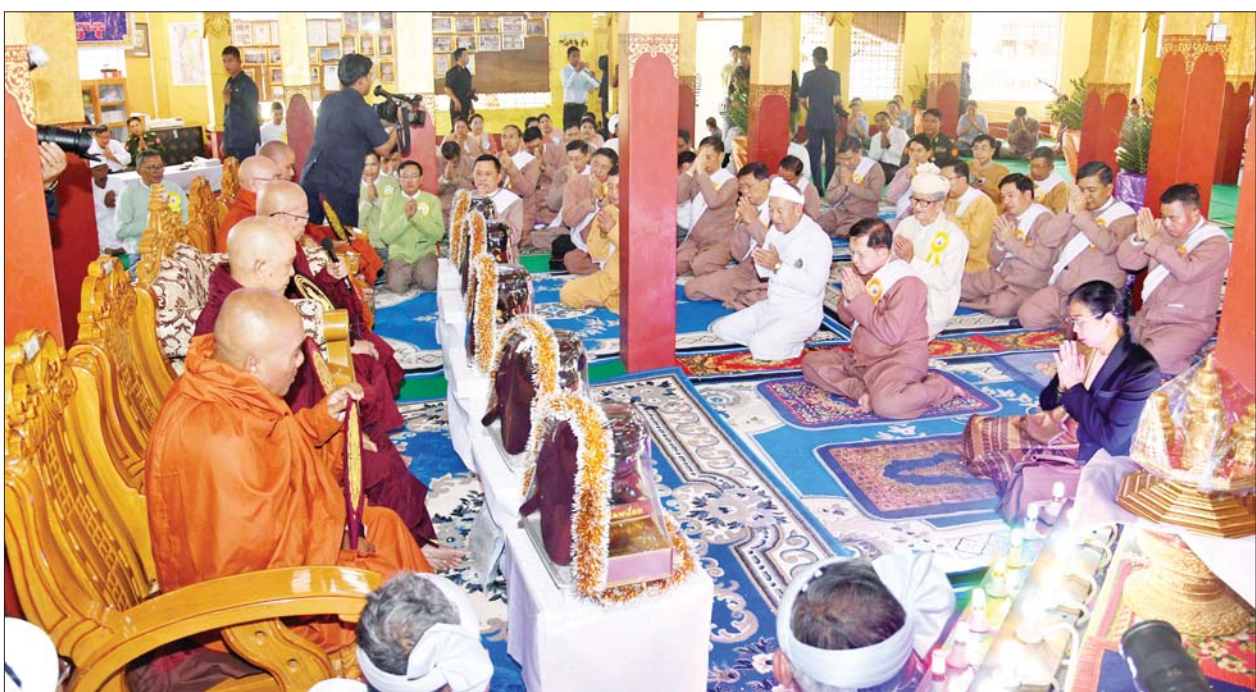
နိုင်ငံတော်စီမံအုပ်ချုပ်ရေးကောင်စီဥက္ကဋ္ဌ နိုင်ငံတော်ဝန်ကြီးချုပ် ဗိုလ်ချုပ်မှူးကြီးမင်းအောင်လှိုင်နှင့်ဇနီး ဒေါ်ကြူကြူလှ၊ အဖွဲ့ဝင်များနှင့် ဒေသခံတိုင်းရင်းသားပြည်သူတို့က ညောင်ရွှေမြို့ ကန်ကြီးကျောင်းတိုက်ဦးစီးပဓာန နာယကဆရာတော် အဂ္ဂမဟာဂန္ထဝါစကပဏ္ဍိတ ဘဒ္ဒန္တပညာဝံသထံမှ ငါးပါးသီလ ခံယူဆောက်တည်ကြစဉ်။

ကြိုဆိုဖူးမြော် ထို့နောက် နိုင်ငံတော်စီမံအုပ်ချုပ်ရေးကောင်စီ ဥက္ကဋ္ဌ နိုင်ငံတော်ဝန်ကြီးချုပ်နှင့် ဇနီးဦးဆောင်သည့် အဖွဲ့ဝင်များသည် အင်းလေးဖောင်တော်ဦး မြတ်စွာဘုရားခေတ္တကိန်းဝပ် စံပယ်တော်မူမည့် အဋ္ဌဒိသာဓမ္မဝိဟာရကျောင်းတော်ကြီးသို့ ရောက်ရှိကြပြီး အင်းလေးဖောင်တော်ဦးမြတ်စွာဘုရား ရောက်ရှိလာမှုများအား ကြိုဆိုဖူးမြော်၍ သံဃာတော်များက အင်းလေးဖောင်တော်ဦးမြတ်စွာဘုရားအား ရွှေသင်္ကန်းများ ကပ်လှူပူဇော်ကြသည်။ ယင်းနောက် နိုင်ငံတော်စီမံ