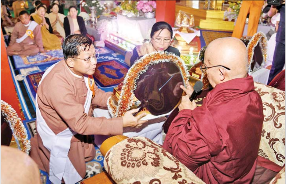
နိုင်ငံတော်စီမံအုပ်ချုပ်ရေးကောင်စီဥက္ကဋ္ဌ နိုင်ငံတော်ဝန်ကြီးချုပ် ဗိုလ်ချုပ်မှူးကြီးမင်းအောင်လှိုင်နှင့်ဇနီး ဒေါ်ကြူကြူလှတို့က ဆရာတော်ထံ လှူဖွယ်ပစ္စည်းများ ဆက်ကပ်လှူဒါန်းစဉ်။