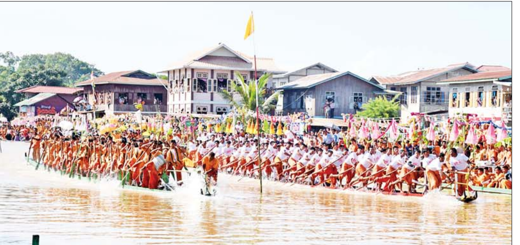
နိုင်ငံတော်စီမံအုပ်ချုပ်ရေးကောင်စီဥက္ကဋ္ဌ နိုင်ငံတော်ဝန်ကြီးချုပ် ဗိုလ်ချုပ်မှူးကြီးမင်းအောင်လှိုင်နှင့်ဇနီး ဒေါ်ကြာကြာလှ၊ အခမ်းအနားတက်ရောက်လာကြသူများက အင်းသားရိုးရာလှေလှော်ပြိုင်ပွဲ ယှဉ်ပြိုင်လှော်ခတ်မှုအား ကြည့်ရှုအားပေးစဉ်။