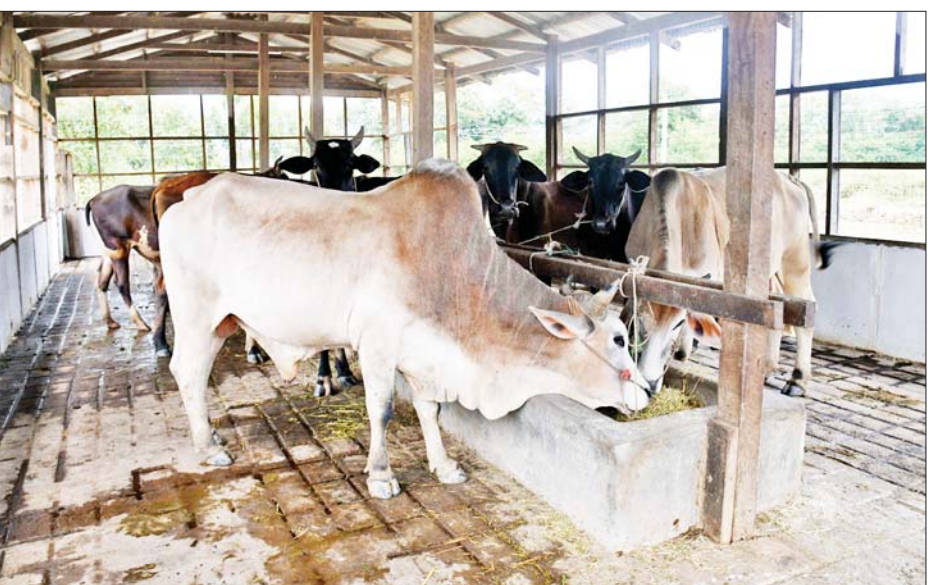
အရှေ့ပိုင်းတိုင်းစစ်ဌာနချုပ် နန်းသီတာ ဘက်စုံစိုက်ပျိုးမွေးမြူရေးစခန်းတွင် နွားများ မွေးမြူ ထားရှိမှုကို တွေ့ရစဉ်။

ထက် ပိုမိုတိုးချဲ့မွေးမြူနိုင်ရေး ဆောင်ရွက်ရန်လိုကြောင်း၊ မွေးမြူ ရေး လုပ်ငန်းများအတွက် လိုအပ် သည့်အစာများ ရရှိနိုင်ရေး ဒေသ တွင်းရရှိနိုင်သည့် ကုန်ကြမ်းများ အသုံးပြုကာ အဆင့်မီအစာ ထုတ်လုပ်နိုင်ရေး ဆောင်ရွက်သွား ရန်လိုကြောင်း။ နွားနို့နှင့် အသားထွက်နှုန်း ကောင်းမွန်ရေး ဆောင်ရွက်ရန် အတွက် အစာစပ်သည့်စနစ်တွင် ပါဝင်ရမည့်ပစ္စည်းများ အချိုး အစားမှန်ကန်ရန်နှင့် ရေပေးဝေမှု စနစ်ကျန ဖူလုံရန်လိုကြောင်း၊ စိုက်ပျိုးမွေးမြူရေး လုပ်ငန်းများမှ အထွက်နှုန်းတိုးအောင် ဆောင် ရွက်ပြီး မိမိတို့၏ တပ်ဖွဲ့ဝင်များနှင့် မိသားစုဝင်များအားလုံး ပြည့်ပြည့်