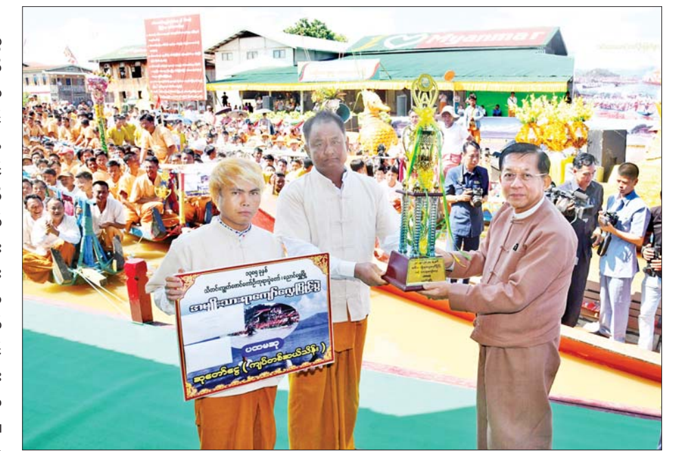
နိုင်ငံတော်စီမံအုပ်ချုပ်ရေးကောင်စီဥက္ကဋ္ဌ နိုင်ငံတော်ဝန်ကြီးချုပ် ဗိုလ်ချုပ်မှူးကြီးမင်းအောင်လှိုင် အမျိုးသားရာကျော်လှေပြိုင်ပွဲတွင် ပထမဆုရရှိသည့် ကေလာကျေးရွာအသင်းအား ဂုဏ်ပြုဆုနှင့် ချီးမြှင့်ငွေများ ပေးအပ်ချီးမြှင့်စဉ်။

အင်းသားရိုးရာ လှေလှော်ပြိုင်ပွဲတွင် ပြိုင်ပွဲဝင် အင်းလေးသား၊ အင်းလေးသူတို့သည် ပြိုင်ပွဲအမျိုးအစားအလိုက် အနိုင်မခံအရှုံးမပေးသည့် စိတ်ဓာတ်များဖြင့် ခြေထောက်ကို အသုံးပြု၍ လှေကိုလှော်ခတ်ကြပြီး အားကြီးမာန်တက် ယှဉ်ပြိုင်ခဲ့ကြရာ နိုင်ငံတော် စီမံအုပ်ချုပ်ရေးကောင်စီဥက္ကဋ္ဌ နိုင်ငံတော်ဝန်ကြီးချုပ်နှင့်ဇနီး၊ အခမ်းအနားတက်ရောက် လာကြသူများ၊ ဒေသခံတိုင်းရင်းသားပြည်သူများ၊ ပြည်တွင်း ပြည်ပမှ လာရောက်လည်ပတ်သူများက လက်ခုပ်လက်ဝါးများတီး၍ တစ်ခဲနက်အားပေးခဲ့ကြသည်။