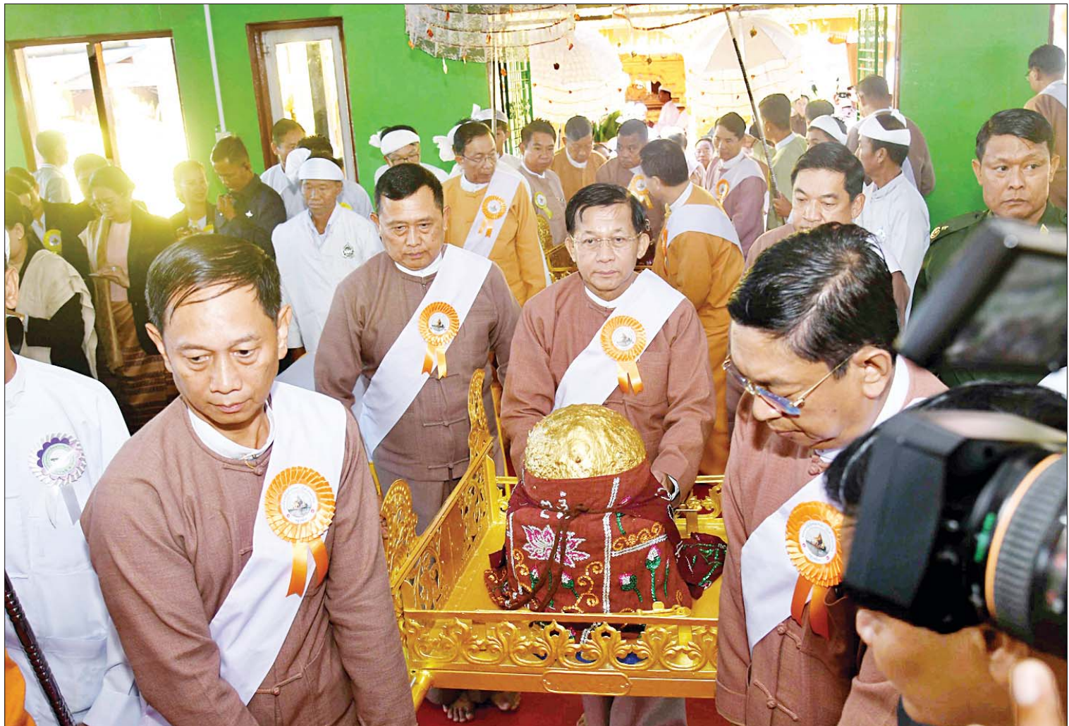
နိုင်ငံတော်စီမံအုပ်ချုပ်ရေးကောင်စီဥက္ကဋ္ဌ နိုင်ငံတော်ဝန်ကြီးချုပ် ဗိုလ်ချုပ်မှူးကြီးမင်းအောင်လှိုင် ဦးဆောင်သည့်အဖွဲ့ဝင်များ အင်းလေးဖောင်တော်ဦးမြတ်စွာဘုရား ညောင်ရွှေမြို့ရှိ အဋ္ဌဒိသာဓမ္မဝိဟာရကျောင်းတော်ကြီးသို့ ပင့်ဆောင်မည့် ဘော်ယာဉ်ပေါ်သို့ ပင့်ဆောင်ပူဇော်ကြစဉ်။

ကြည့်ရှုဖူးမြော် အဆိုပါ အခမ်းအနားသို့ နိုင်ငံတော် စီမံအုပ်ချုပ်ရေးကောင်စီဥက္ကဋ္ဌ နိုင်ငံတော် ဝန်ကြီးချုပ်နှင့်အတူ ဇနီး ဒေါ်ကြူကြူလှ၊ ကောင်စီတွဲဖက်အတွင်းရေးမှူးနှင့် ဇနီး၊ ကောင်စီဝင်များနှင့်ဇနီးများ၊ ပြည်ထောင်စု ဝန်ကြီးများနှင့် ဇနီးများ၊ ရှမ်းပြည်နယ် ဝန်ကြီးချုပ်၊ ကာကွယ်ရေးဦးစီးချုပ်ရုံးမှ အဆင့်မြင့်တပ်မတော် အရာရှိကြီးများ၊ အရှေ့ပိုင်းတိုင်းစစ်ဌာနချုပ် တိုင်းမှူး၊ ဖိတ်ကြားထားသည့် ဧည့်သည်တော်များ၊ ဒေသခံ တိုင်းရင်းသားပြည်သူများနှင့် ပြည်တွင်း ပြည်ပခရီးသွားဧည့်သည်များ စည်ကားသိုက်မြိုက်စွာ တက်ရောက် ကြည့်ရှုဖူးမြော်ကြသည်။ စာမျက်နှာ ၃ ကော်လံ ၁ သို့ ။