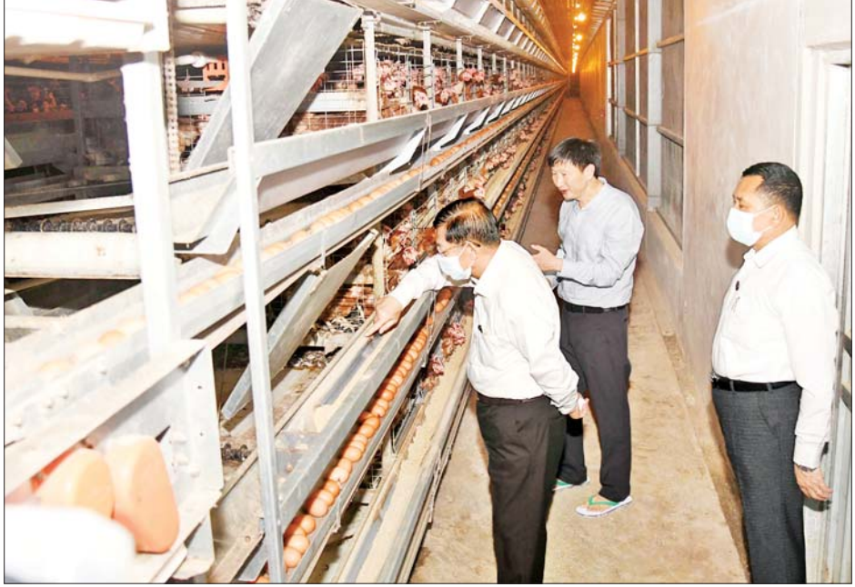
နိုင်ငံတော်စီမံအုပ်ချုပ်ရေးကောင်စီဥက္ကဋ္ဌ နိုင်ငံတော်ဝန်ကြီးချုပ် ဗိုလ်ချုပ်မှူးကြီးမင်းအောင်လှိုင် ရှမ်းရိုးမမွေးမြူရေးဇုန်အတွင်းရှိ ဒေါက်တာစိုင်းလုံ၏ အလုပ်ဝတ်အအေးခန်းစနစ်ဖြင့် အဆင့်မြင့် ကြက် မွေးမြူရေး ဆောင်ရွက်ထားရှိမှုကို ကြည့်ရှုအားပေးစဉ်။

မွန်ခြင်း၊ အရည်အသွေးမြင့် ကြက်ဥများ ရရှိနိုင်ခြင်းအပြင် အခြားအကျိုးကျေးဇူးများစွာ ရရှိ နိုင်မည်ဖြစ်ကြောင်း၊ အေးသာယာ စက်မှုဇုန် ဖွံ့ဖြိုးတိုးတက်ရေး အတွက် လိုအပ်သည်များကို နိုင်ငံတော်မှ ဖြည့်ဆည်းပေးမည် ဖြစ်သဖြင့် သက်ဆိုင်ရာဦးစီးဌာန များ၊ ဝန်ကြီးဌာနများနှင့် ပြည်နယ် အဆင့်တို့မှတစ်ဆင့် ဆက်သွယ် ဆောင်ရွက်နိုင်ပါကြောင်း ဆွေးနွေး ပြောကြားသည်။ ထို့နောက် နိုင်ငံတော်စီမံအုပ်ချုပ် ရေးကောင်စီဥက္ကဋ္ဌ နိုင်ငံတော် ဝန်ကြီးချုပ်နှင့် အဖွဲ့ဝင်များသည် ရှမ်းရိုးမမွေးမြူရေးဇုန်အတွင်းရှိ ဒေါက်တာစိုင်းလုံ၏ အလုပ်ဝတ် အအေးခန်းစနစ် (Evaporated Cooling System)ဖြင့် အဆင့်မြင့် ကြက်မွေးမြူရေး ဆောင်ရွက် ထားရှိမှုကို သွားရောက်ကြည့်ရှု အားပေးခဲ့ပြီး မွေးမြူရေးကဏ္ဍ ဖွံ့ဖြိုးတိုးတက်ရေး အတွက် လုပ်ဆောင်နိုင်မည့် အခြေအနေ များနှင့်ပတ်သက်၍ လိုအပ်သည် များ ဆွေးနွေးမှာကြားခဲ့ကြောင်း သိရသည်။ သတင်းစဉ်