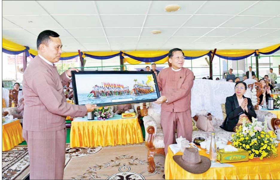
နိုင်ငံတော်စီမံအုပ်ချုပ်ရေးကောင်စီဥက္ကဋ္ဌ နိုင်ငံတော်ဝန်ကြီးချုပ် ဗိုလ်ချုပ်မှူးကြီးမင်းအောင်လှိုင် ထံ ရှမ်းပြည်နယ်ဝန်ကြီးချုပ်က အင်းသားရိုးရာလှေလှော်ပြိုင်ပွဲ အထိမ်းအမှတ်လက်ဆောင်ကို ဂါရဝပြုပေးအပ်စဉ်။

တာဝန်ရှိသူများက လက်ခံရယူခဲ့ကြသည်။ ထို့ပြင် နိုင်ငံတော်စီမံအုပ်ချုပ်ရေးကောင်စီဥက္ကဋ္ဌ နိုင်ငံတော်ဝန်ကြီးချုပ်နှင့်ဇနီး၊ ဦးဆောင်သည့် အဖွဲ့ဝင်များသည် ယမန်နေ့ညနေပိုင်းတွင်လည်း တောင်ကြီးမြို့ စာမျက်နှာ ၅ သို့ ★