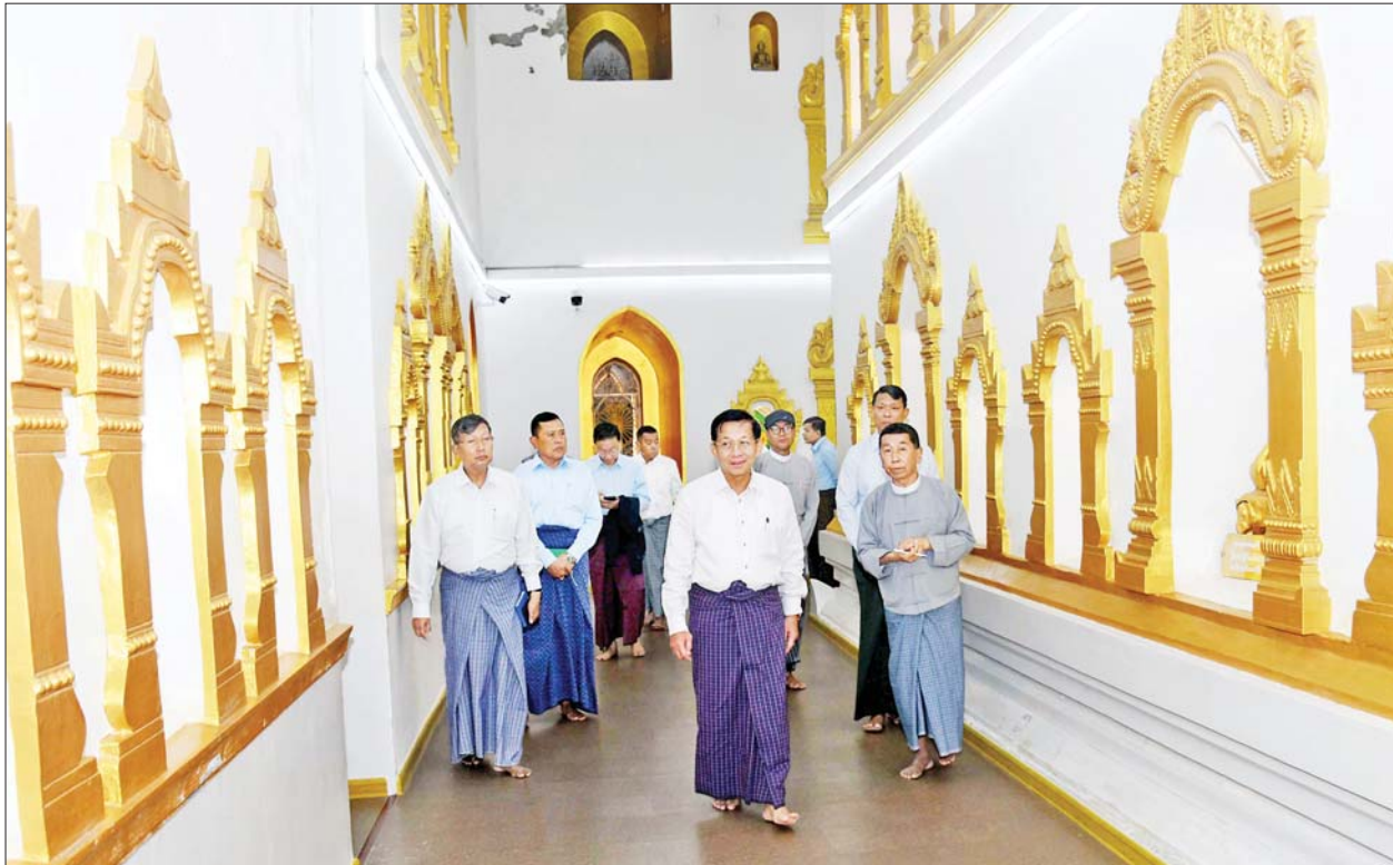
နိုင်ငံတော်စီမံအုပ်ချုပ်ရေးကောင်စီဥက္ကဋ္ဌ နိုင်ငံတော်ဝန်ကြီးချုပ် ဗိုလ်ချုပ်မှူးကြီးမင်းအောင်လှိုင် တောင်ကြီးမြို့ ကျက်သရေဆောင် စုဠာမုနိလောကချမ်းသာစေတီတော်ကြီးအား လှည့်လည်ဖူးမြော်ကြည့်ပါသည်။