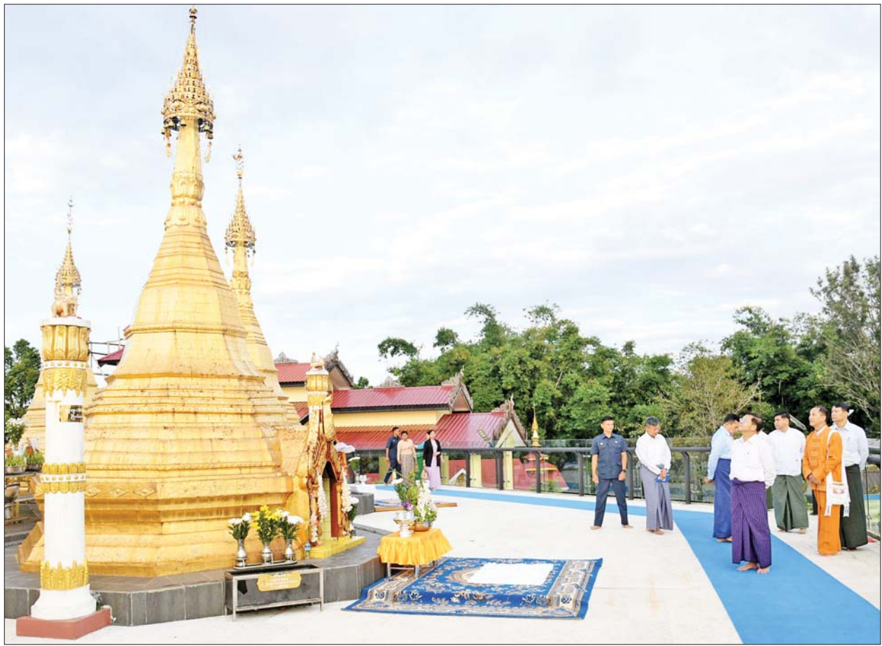
နိုင်ငံတော်စီမံအုပ်ချုပ်ရေးကောင်စီဥက္ကဋ္ဌ နိုင်ငံတော်ဝန်ကြီးချုပ် ဗိုလ်ချုပ်မှူးကြီးမင်းအောင်လှိုင် တောင်ကြီးမြို့ ကျက်သရေဆောင် ရွှေဘုန်းပွင့်စေတီမြတ်ကြီးအား လက်ယာရစ်လှည့်လည်ဖူးမြော်ကြည့်ပါသည်။

ယင်းနောက် နိုင်ငံတော်စီမံအုပ်ချုပ်ရေးကောင်စီ ဥက္ကဋ္ဌ နိုင်ငံတော် ဝန်ကြီးချုပ်သည် ရွှေဘုန်းပွင့်စေတီမြတ်ကြီး ဧည့်သည်တော် မှတ်တမ်းစာအုပ်တွင် လက်မှတ်ရေးထိုး ပူဇော်ခဲ့