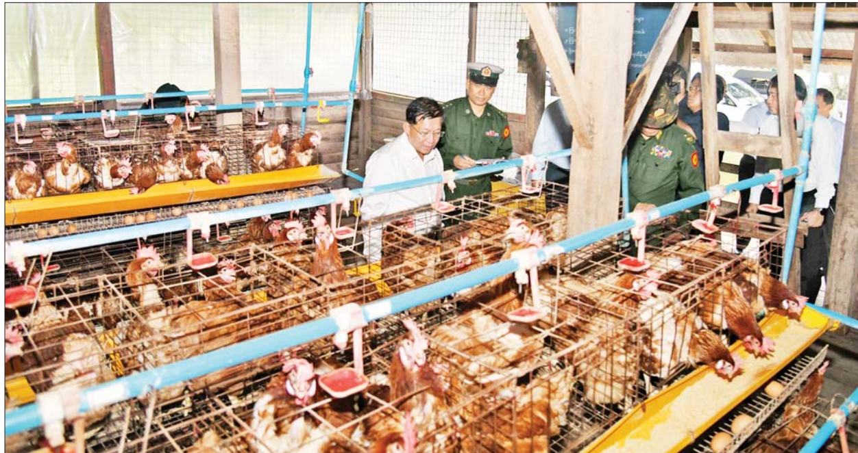
နိုင်ငံတော်စီမံအုပ်ချုပ်ရေးကောင်စီဥက္ကဋ္ဌ တပ်မတော်ကာကွယ်ရေးဦးစီးချုပ် ဗိုလ်ချုပ်မှူးကြီးမင်းအောင်လှိုင် အရှေ့ပိုင်းတိုင်းစစ်ဌာနချုပ် နန်းသီတာဘက်စုံစိုက်ပျိုးမွေးမြူရေးစခန်းတွင် ဥစားကြက်မွေးမြူထားရှိမှုကို ကြည့်ရှုစစ်ဆေးစဉ်။

ကြောင်း၊ တိုင်းစစ်ဌာနချုပ်အဆင့် စိုက်ပျိုး မွေးမြူရေးစခန်း ဖြစ်သဖြင့် မှန်ကန်ကောင်းမွန် သည့် လုပ်ငန်းဆောင်ရွက်မှုစနစ် ရှိရမည်ဖြစ်ကာ မြေကို အကျိုးရှိရှိ အသုံးချနိုင်ရမည် ဖြစ်ကြောင်း၊ ရေကိုအကျိုးရှိရှိ အသုံးချနိုင်ရေး အတွက် စနစ်ကျသည့်ရေသုံးစွဲမှု စနစ်ရှိရန်လိုကြောင်းနှင့် အခြား လိုအပ်သည်များကို မှာကြားသည်။