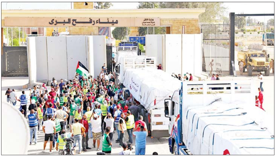
အဆိုပါအခြေအနေများကြောင့် ယခုထောက်ပံ့ဆက်လက်စောင့်ကြည့်ရမည်ဖြစ်သည်။ ကိုးကား - အင်န်အိတ်ချီကေဘာသာပြန် - အောင်ကျော်ကျော်

အစွဲရေးတပ်ဖွဲ့များသည် လွန်ခဲ့သည့် နှစ်ပတ်အတွင်း နယ်စပ်စစ်ဆေးရေးဂိတ်ကို လေးကြိမ် တိုင်တိုင် တိုက်ခိုက်ခဲ့ပြီး ထောက်ပံ့ရေးပစ္စည်းများကို ဖြတ်သန်းခွင့်မပြုဟု ငြင်းဆိုခဲ့ကြောင်း အီဂျစ်နိုင်ငံခြားရေးဝန်ကြီးဌာန ပြောရေးဆိုခွင့်ရှိသူတစ်ဦးက ဆိုသည်။ အစွဲရေးတပ်မတော်သည် ဂါဇာနှင့် အီဂျစ်ကြား နယ်နိမိတ်ကို တင်းကျပ်စွာ ထိန်းချုပ်ထားသည်။ ဂါဇာကမ်းမြောင်းသို့ လက်နက်များ ခိုးသွင်းခြင်းမှ ကာကွယ်ရန်အတွက် နယ်စပ်ဒေသရှိ ဥမင်လိုက်ခေါင်းများကို ဖျက်ဆီးရန်ရည်ရွယ်၍ လေကြောင်း တိုက်ခိုက်မှုများ ပြုလုပ်လျက်ရှိကြောင်း ၎င်းက ဆက်လက်ပြောကြားသည်။ လက်ရှိတွင် ထရပ်ကားများကို လက်နက်များ သယ်ဆောင်လာခြင်းရှိ မရှိ စစ်ဆေးရန်နှင့် ပတ်သက်ပြီး အစွဲရေးနှင့် အီဂျစ်တို့သည် သဘောထားကွဲလွဲမှုများရှိကြောင်း သတင်းများထွက်ပေါ်နေသည်။