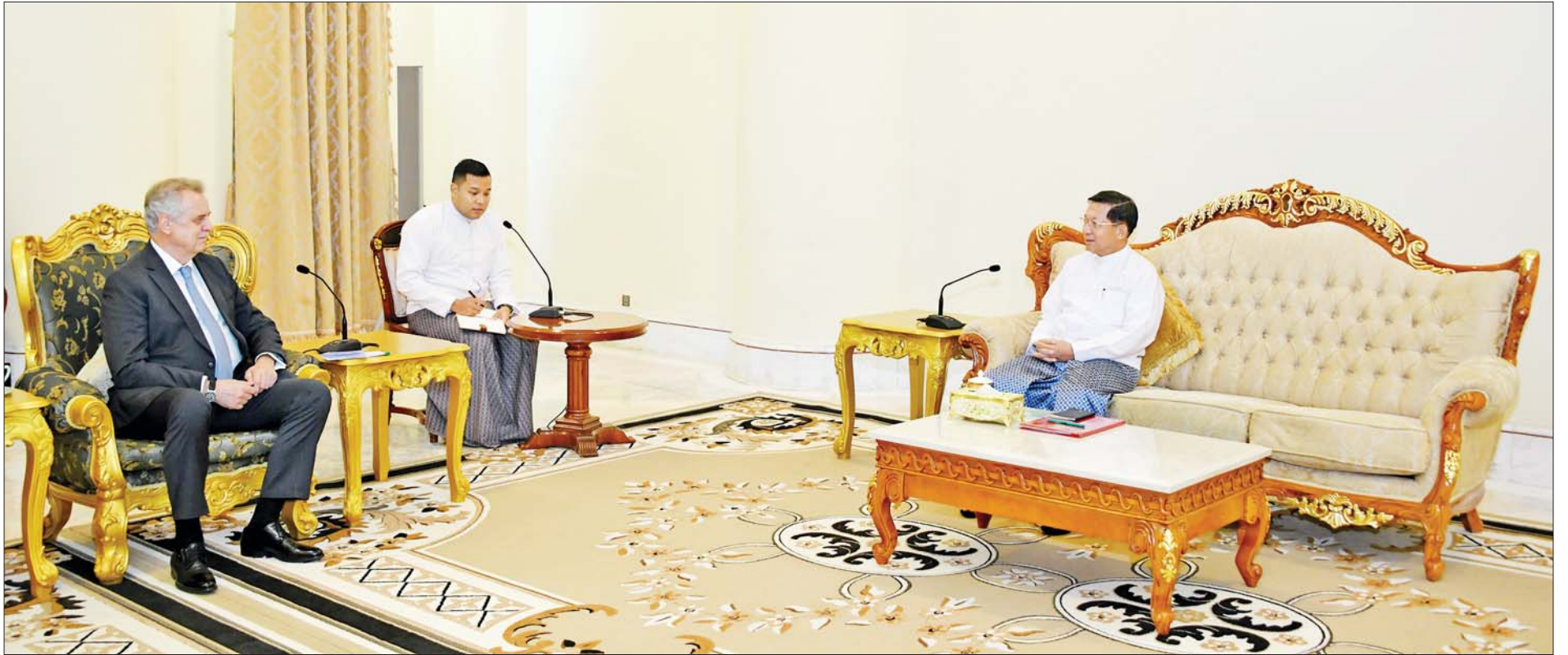
နိုင်ငံတော်စီမံအုပ်ချုပ်ရေးကောင်စီဥက္ကဋ္ဌ နိုင်ငံတော်ဝန်ကြီးချုပ် ဗိုလ်ချုပ်မှူးကြီးမင်းအောင်လှိုင် ရှုရှားဖက်ဒရေးရှင်းနိုင်ငံ စီနိုပီတာစဘတ်အစိုးရအဖွဲ့ဝင် ပြည်ပဆက်ဆံရေးကော်မတီဥက္ကဋ္ဌ Mr. Grigoriev Evgeny Dmitrievich အား လက်ခံတွေ့ဆုံစဉ်။

★ ရှေးဖုံးမှ ရှုရှားဖက်ဒရေးရှင်းနိုင်ငံ စီနိုပီတာစဘတ်အစိုးရအဖွဲ့ဝင် ပြည်ပဆက်ဆံရေးကော်မတီဥက္ကဋ္ဌ Mr. Grigoriev Evgeny Dmitrievich နှင့်အတူ ကိုယ်စားလှယ်အဖွဲ့ဝင်များ၊ မြန်မာနိုင်ငံဆိုင်ရာ ရှုရှားဖက်ဒရေးရှင်းနိုင်ငံသံရုံးမှ တာဝန်ရှိသူများ တက်ရောက်ကြသည်။