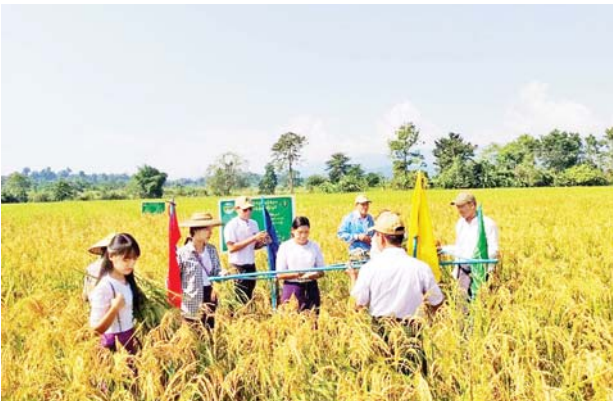
ခန္တီးမြို့နယ်၌ နာဂဒေသအတွက်ပြန်လည်ဖြန့်ဖြူးရန် စိုက်ပျိုးထားသော ယာစပါးမျိုးသန့်မျိုးပွားစံပြကွက်များ ရိတ်သိမ်း

ဤသို့လျှင် ဗုဒ္ဓသာသနာအကျိုးကို ထက်သန် သော ဝီရိယဖြင့် သယ်ပိုးဆောင်ရွက်တော်မူခဲ့သော သာသနဓဇရာဝဟဂုဏ်၊ ရတ္တညူမဟာ နာယကဂုဏ်၊ ပိဋကတ္တယဆေကဂုဏ်၊ ပရဟိတာဝဟဂုဏ်၊ သာသန ဟိတရဂုဏ်၊ ခမာဇာဂရိယဂုဏ်၊ လန္ထိပေသလ သိက္ခာ ကာမဂုဏ် စသည်တို့နှင့် ပြည့်စုံတော်မူခြင်းတို့ကြောင့် နိုင်ငံတော်အစိုးရက ဆရာတော်ကြီးအား ၂၀၂၃ ခုနှစ် တွင် “အဂ္ဂမဟာပဏ္ဍိတ” ဘွဲ့တံဆိပ်တော်မြတ်ကို