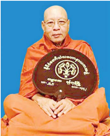
ဆက်ကပ်လှူဒါန်းခဲ့ပါသည်။ ဘဝနတ်ထံပျံလွန်တော်မူခြင်း ဆရာတော်ကြီးသည် သာသနာတော်အကျိုး ကို သယ်ပိုးဆောင်ရွက်တော်မူရင်း သက်တော် (၆၈)နှစ် သိက္ခာတော်(၄၈)ဝါအရ ၁၉၈၅ ခုနှစ် သီတင်းကျွတ်လဆန်း ၄ ရက် (၁၈-၁၀-၂၀၂၃) ဗုဒ္ဓဟူးနေ့ ၂ နာရီ ၄၅ မိနစ်အချိန်တွင် ဘဝ နတ်ထံ ပျံလွန်တော်မူကြောင်း သာသနာရေးဦးစီး ဌာနမှ သိရသည်။ သတင်းစဉ်