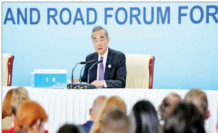
ရေးလမ်းကြောင်းဆီသို့ အရှိန်မြှင့်ချိတ်က ရန် ကူညီပေးခဲ့ကြောင်း သိရသည်။ ၎င်းဖိုရမ်အတွင်း စုစုပေါင်း ရလဒ် ၄၅၈ ခုရရှိ အောင်မြင်ခဲ့ပြီး ဒုတိယအကြိမ် ကျင်းပခဲ့သည့် ဖိုရမ်ထက် ရလဒ်များ အဆပေါင်းများစွာ ပိုများခဲ့ကြောင်း

တွင် ထပ်လောင်း ပြောကြားခဲ့သည်။ မှတ်ချက်ပြုပြောကြား ထိုပြင် ကမ္ဘာ့စီးပွားရေးအတွက် အခွင့်အလမ်းသစ်များ ဖန်တီးပေးပြီး ကမ္ဘာ့နိုင်ငံများအတွက် ကောင်းကျိုးဖြစ် လာမည်ဟု ၎င်းက မှတ်ချက်ပြုပြောကြား ခဲ့သည်။ “ဒီဖိုရမ်ရဲ့ အကြီးမားဆုံး မျှော်မှန်း ချက်ကတော့ ကမ္ဘာကြီးကို ခေတ်မီအောင် နိုင်ငံတွေ အတူတကွလုပ်ဆောင်ဖို့ပါပဲ” ဟု ၎င်းက ပြောကြားသည်။ ရုပ်ဝန်းနှင့် ပိုးလမ်းမစီမံကိန်းသည် နိုင်ငံပေါင်းစုံ ဘုံဖွံ့ဖြိုးတိုးတက်မှုအတွက် ပူးပေါင်း ဆောင်ရွက်ရေးပလက်ဖောင်းကို ဖန်တီး ခဲ့ပြီး ဖွံ့ဖြိုးဆဲနိုင်ငံများအား ခေတ်မီတိုးတက်