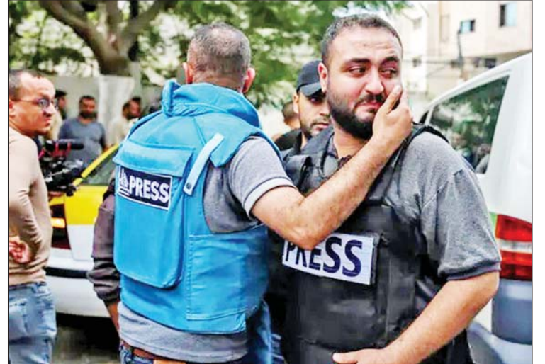
ခြင်း၊ ဒဏ်ရာရခြင်း သို့မဟုတ် ခြိမ်းခြောက် ခံရခြင်း စသည့် အတည်မပြုနိုင်သော အစီရင်ခံစာများစွာကိုလည်း စုံစမ်းစစ်ဆေး လျက်ရှိသည်ဟု အဆိုပါ ကော်မတီက ဆိုသည်။ သတင်းထောက်များသည် စစ်ပွဲများ အတွင်း ခက်ခဲပင်ပန်းစွာဖြင့် သက်စွန့် ဆံဖျား သတင်းရယူလျက်ရှိသည့်အတွက် ၎င်းတို့ကို ပစ်မှတ်မထားသင့်ကြောင်း ဆက်လက်ပြောကြားသည်။ ကိုးကား - အင်န်အိတ်ချ်ကော တာသာပြန် - အောင်ကျော်ကျော်

ဂျေရုဗလင် အောက်တိုဘာ ၁၉ အစွဲအစားအစိုးရနှင့် ပါလက်စတိုင်း စစ်သွေးကြွအဖွဲ့ ဟားမတ်စ်တို့ကြား ဖြစ်ပွားလျက်ရှိသည့် တိုက်ပွဲများအတွင်း လက်ရှိအချိန်အထိ သေဆုံးခဲ့သည့် သတင်းထောက်ပေါင်း ၁၉ ဦးထက်မနည်း ရှိကြောင်း နယူးယောက်အခြေစိုက် သတင်းထောက်များ ကာကွယ် စောင့်ရှောက်ရေးကော်မတီက ပြောကြား သည်။ သေဆုံးခဲ့သည့် သတင်းထောက်များ အနက် ပါလက်စတိုင်း ၁၅ ဦး၊ အစွဲအစား သုံးဦး၊ လက်ဘနွန်နိုင်ငံသား တစ်ဦးဖြစ် သည်ဟု အဆိုပါကော်မတီက ဆိုသည်။ ထို့ပြင် သတင်းထောက် ရှစ်ဦး ထိခိုက်ဒဏ်ရာရရှိခဲ့ကြောင်းနှင့် သုံးဦး ပျောက်ဆုံး သို့မဟုတ် ထိန်းသိမ်းခံထားရ ကြောင်း သိရသည်။ အခြားသတင်းထောက်များ အသတ် ခံရခြင်း၊ ပျောက်ဆုံးခြင်း၊ ထိန်းသိမ်းခံရ