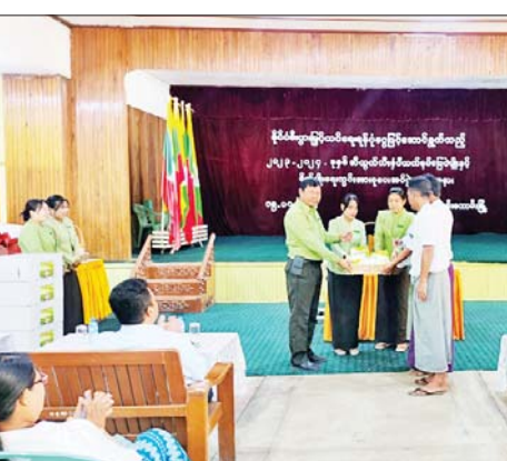
လပြည့်လင်း(ပြန်/ဆက်)

ထို့နောက် မြို့နယ်စီမံအုပ်ချုပ်ရေးအဖွဲ့ဝင်များ၊ မြို့နယ်စိုက်ပျိုးရေးမြှေးမြှားကြီးကြပ်မှု ကော်မတီအဖွဲ့ဝင်များနှင့် သမာဓိကုမ္ပဏီ တာဝန်ရှိသူတို့က ဆီထွက်သီးနှံ (ဗီယက်နမ်မြေပဲမျိုး)နှင့် စိုက်ပျိုးရေးသွင်းအားစုများအား တောင်သူများထံသို့ လွှဲပြောင်းပေးအပ်ခဲ့ကြောင်း သိရသည်။