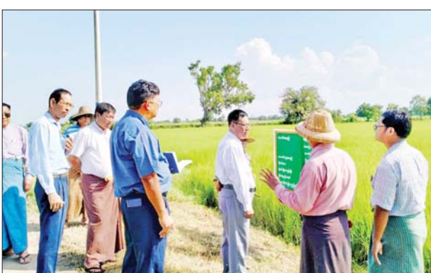
မန္တလေးတိုင်းဒေသကြီး သမဝါယမအသင်းစုချုပ် ရန်ပုံငွေဖြင့် တမုတ်ဆိုးကျေးရွာ တမုတ်ဆိုး(လယ်/ထွေ) သမဝါယမအသင်းမှ အသင်းသား ၂၄ ဦး စိုက်ဧက ၁၂၅ ဧက၊ မိုင်လေးဆယ်ကျေးရွာရှိ မိုင် လေးဆယ်(စိုက်/ထွေ) သမဝါယမအသင်းသား ခုနစ်ဦး စိုက်ဧက ၄၇၊ မန်ကျည်းကိုင်းကျေးရွာရှိ မန်ကျည်းကိုင်း (လယ်/ထွေ) သမဝါယမအသင်းသား ၈၀ စိုက်ဧက ၃၉၆၊ တောင်ကိုင်းကျေးရွာရှိ ဒို့ခေတ်(လယ်/ထွေ) သမဝါယမအသင်းသား ၁၀ ဦး စိုက်ဧက ၅၀၊ ဂျီရွာကျေးရွာရှိ ဂျီရွာ(စိုက်/ထွေ) သမဝါယမအသင်းသား ၃၃ ဦး

မန္တလေး အောက်တိုဘာ ၁၆ မန္တလေးတိုင်းဒေသကြီး သမဝါယမအသင်းစုချုပ် ရန်ပုံငွေဖြင့် အမရပူရမြို့နယ် အတွင်း ကန်ထရိုက်လယ်ယာစနစ်ဖြင့် စိုက်ပျိုးထားသည့် (စိုက်/ထွေ) သမဝါယမအသင်းသားများ၏ မိုးစပါးစိုက်ခင်းများနှင့် မန်ကျည်းကိုင်းကျေးရွာအုပ်စုရှိ မန်ကျည်းကိုင်း(လယ်/ထွေ) သမဝါယမအသင်းသားများ၏ မိုးစပါးစိုက်ခင်းများကို ယမန်နေ့က မန္တလေးတိုင်းဒေသကြီး သမဝါယမဦးစီးဌာနက ညွှန်ကြားရေးမှူး ဦးထွန်းဇော်ဦးနှင့် တာဝန်ရှိသူများက ကွင်းဆင်းကြည့်ရှုစစ်ဆေးခဲ့သည်။ အမရပူရမြို့နယ် အနေဖြင့်