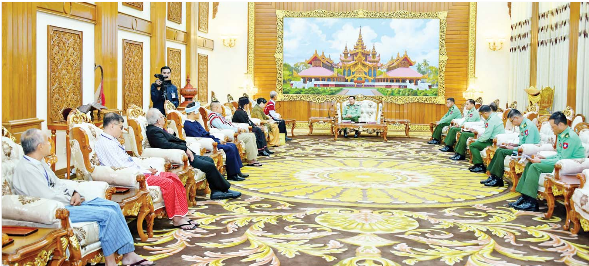
နိုင်ငံတော်စီမံအုပ်ချုပ်ရေးကောင်စီဥက္ကဋ္ဌ တပ်မတော်ကာကွယ်ရေးဦးစီးချုပ် ဗိုလ်ချုပ်မှူးကြီး မင်းအောင်လှိုင် တစ်နိုင်ငံလုံးပစ်ခတ်တိုက်ခိုက်မှုရပ်စဲရေးသဘောတူစာချုပ် (NCA) (၈)နှစ်မြောက် နှစ်ပတ်လည်နေ့ အခမ်းအနားသို့တက်ရောက်ခဲ့သော တိုင်းရင်းသားလက်နက်ကိုင်ကိုယ်စားလှယ်အဖွဲ့များအား လက်ခံတွေ့ဆုံစဉ်။