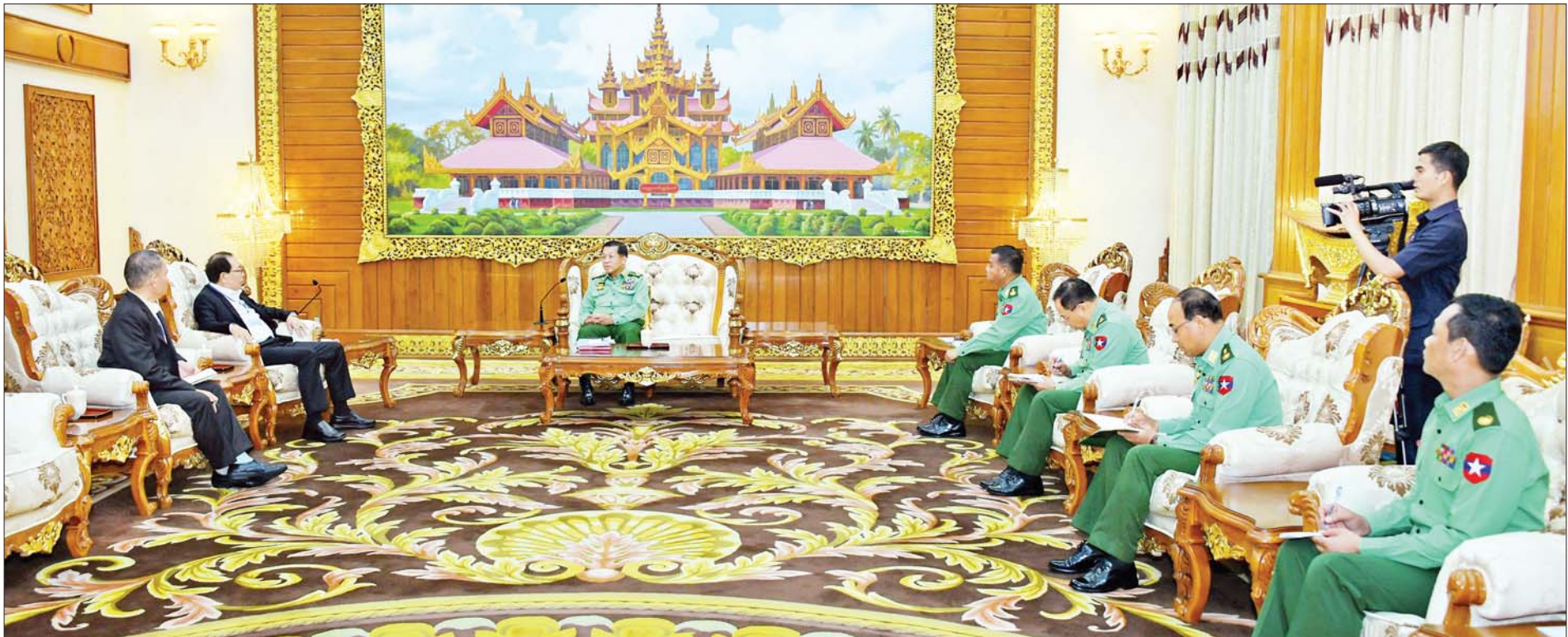
နိုင်ငံတော်စီမံအုပ်ချုပ်ရေးကောင်စီဥက္ကဋ္ဌ တပ်မတော်ကာကွယ်ရေးဦးစီးချုပ် ဗိုလ်ချုပ်မှူးကြီး မင်းအောင်လှိုင် တစ်နိုင်ငံလုံးပစ်ခတ်တိုက်ခိုက်မှုရပ်စဲရေးသဘောတူစာချုပ် (NCA) (၈)နှစ်မြောက် နှစ်ပတ်လည်နေ့အခမ်းအနားသို့ တက်ရောက်ခဲ့သော ရှမ်းပြည်ပြန်လည်ထူထောင်ရေးကောင်စီ(RCSS) ဥက္ကဋ္ဌ ဗိုလ်ချုပ်ကြီးယွက်စစ် ဦးဆောင်သည့်အဖွဲ့အား လက်ခံတွေ့ဆုံစဉ်။