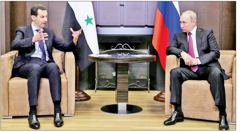
ရုရှားသမ္မတ ဗလာဒီမာပူတင်နှင့် ဆီးရီးယားသမ္မတ ဘာရှားအယ်လ်အာဆတ်တို့ ၂၀၁၇ ခုနှစ် အတွင်းက ဆိုချိမြို့၌ တွေ့ဆုံခဲ့စဉ်။