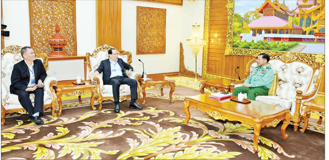
နိုင်ငံတော်စီမံအုပ်ချုပ်ရေးကောင်စီဥက္ကဋ္ဌ တပ်မတော်ကာကွယ်ရေးဦးစီးချုပ် ဗိုလ်ချုပ်မှူးကြီးမင်းအောင်လှိုင် တစ်နိုင်ငံလုံးပစ်ခတ် တိုက်ခိုက်မှုရပ်စဲရေးသဘောတူစာချုပ် (NCA) (၈)နှစ်မြောက် နှစ်ပတ်လည်နေ့အခမ်းအနားသို့ တက်ရောက်ခဲ့သော ရှမ်းပြည်ပြန်လည် ထူထောင်ရေးကောင်စီ(RCSS) ဥက္ကဋ္ဌ ဗိုလ်ချုပ်ကြီးယွက်စစ် ဦးဆောင်သည့်အဖွဲ့အား လက်ခံတွေ့ဆုံစဉ်။

❖ ရှေ့ဖိုးမှ အဆိုပါ တွေ့ဆုံဆွေးနွေးပွဲသို့ နိုင်ငံတော်စီမံအုပ်ချုပ်ရေးကောင်စီ ဥက္ကဋ္ဌ တပ်မတော်ကာကွယ်ရေးဦးစီးချုပ်နှင့်အတူ ကာကွယ်ရေးဦးစီးချုပ် ရုံးမှ ဒုတိယဗိုလ်ချုပ်ကြီးရဲဝင်းဦး၊ အမျိုးသားစည်းလုံးညီညွတ်ရေးနှင့် ငြိမ်းချမ်းရေးဖော်ဆောင်မှုညှိနှိုင်းရေးကော်မတီဥက္ကဋ္ဌ ဒုတိယ ဗိုလ်ချုပ်ကြီးရာပြည့်နှင့် တပ်မတော်အရာရှိကြီးများ တက်ရောက်ကြပြီး ရှမ်းပြည်ပြန်လည်ထူထောင်ရေးကောင်စီ(RCSS)ဥက္ကဋ္ဌနှင့် တာဝန် ရှိသူများ တက်ရောက်ကြသည်။ ရင်းရင်းနှီးနှီး ဆွေးနွေး ထိုသို့ တွေ့ဆုံရာတွင် ဒေသတွင်းနှင့်နိုင်ငံတော်ပြည်ငြိမ်အေးချမ်းရေး အတွက် ဆောင်ရွက်ရာ၌ တွေ့ဆုံဆွေးနွေးမှုများဖြင့် ဆောင်ရွက် သွားရန်လိုအပ်မှု၊ နိုင်ငံတော်နှင့် တပ်မတော်အနေဖြင့် NCA လမ်းကြောင်းပေါ်၌ ခိုင်မာစွာလျှောက်လှမ်းလျက်ရှိမှုနှင့် ပါတီစုံဒီမို ကရေစီစနစ်ခိုင်မာစေရေး ဆောင်ရွက်လျက်ရှိမှု၊ ယခုနှစ်တွင် စမ်းသပ် သန်းခေါင်စာရင်းကောက်ယူနေမှုနှင့် လာမည့်နှစ်တွင် ပြည်လုံးကျွတ် သန်းခေါင်စာရင်းကောက်ယူပြီး ရွေးကောက်ပွဲပြုလုပ်ရန် ပြင်ဆင် ဆောင်ရွက်နေမှု၊ နိုင်ငံတော်ပြည်ငြိမ်အေးချမ်းရေးအတွက် NCA လမ်းကြောင်းအတိုင်း ဆက်လက်ဆောင်ရွက်သွားရန် လိုအပ်သည့် အခြေအနေများနှင့်ပတ်သက်၍ ရင်းရင်းနှီးနှီး ဆွေးနွေးခဲ့ကြောင်း သတင်းရရှိသည်။ သတင်းစဉ်