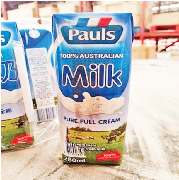
ရန်ကုန်တိုင်းဒေသကြီး ဖမ်းဆီးရမိမှု မှတ်တမ်းဓာတ်ပုံ။

တရားမဝင်ကုန်သွယ်မှုတိုက်ဖျက်ရေးဦးဆောင်ကော်မတီ၏ ကြီးကြပ်ကွပ်ကဲမှုဖြင့် တရားမဝင်ကုန်သွယ်မှုများကို ဥပဒေနှင့်အညီ ထိရောက်စွာ တားဆီးအရေးယူနိုင်ရေး ဆောင်ရွက်လျက်ရှိရာ အောက်တိုဘာ ၁၁ ရက်က ရန်ကုန်တိုင်းဒေသကြီး တရားမဝင်ကုန် သွယ်မှုတိုက်ဖျက်ရေးအထူးအဖွဲ့၏ စီမံခန့်ခွဲမှုဖြင့် တာဝန်ကျ ပူးပေါင်း အဖွဲ့က စစ်ဆေးမှုများ ဆောင်ရွက်ရာတွင် Dry Port (ရွာသာကြီး) ကုန်သွယ်ရေးစခန်းအစားအစာစခန်း၌ သက်ဆိုင်ရာကုမ္ပဏီမှ စွန့်လွှတ် ကြောင်း လျှောက်ထားလာသည့် UHT Full Cream Milk လီတာ ၂၀၄၀၊ Pure Full Cream Milk ၂၁၆ လီတာ အပါအဝင် ကုန်ပစ္စည်းခုနစ် မျိုး (စုစုပေါင်း ခန့်မှန်းတန်ဖိုး ၁၀၅၇၃၀၉၁ ကျပ်) ကို သိမ်းဆည်းရမိ ခဲ့ပြီး အကောက်ခွန် လုပ်ထုံးလုပ်နည်းများနှင့်အညီ အရေးယူဆောင်ရွက် လျက်ရှိသည်။