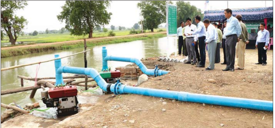
ပွင့်ဖြူမြို့နယ် ကုလားဟောင်းကျေးရွာအုပ်စု ရွာသစ်ကလေးကျေးရွာ စပါးစိုက်ခင်းများအား ရေတင်စနစ်ဖြင့် အောင်ရေပေးဝေနေပုံ။

မင်းဘူးမြို့မြောက်ဘက် ၁၀ မိုင်အကွာမှာ စကုမြို့ရှိမည်။ စကုမှ အရှေ့ဘက် ကိုးမိုင်ခန့်အကွာ တွင် ရှေးမြန်မာမင်းများ လက်ထက်ကတည်းက တည်ဆောက်ခဲ့သော အိုင်မည်နှင့် ဆည်တော် ရှင်မနတ်ကွန်းရှိမည်။ ထိုမှ ရှေ့သို့ ခရီးအနည်းငယ် ဆက်လျှင် ရွှေစက်တော်ဘုရားဖူးကားများ အနား ယူရာ မန်းချောင်းဆည်တော်စခန်းသို့ ရောက်မည်။