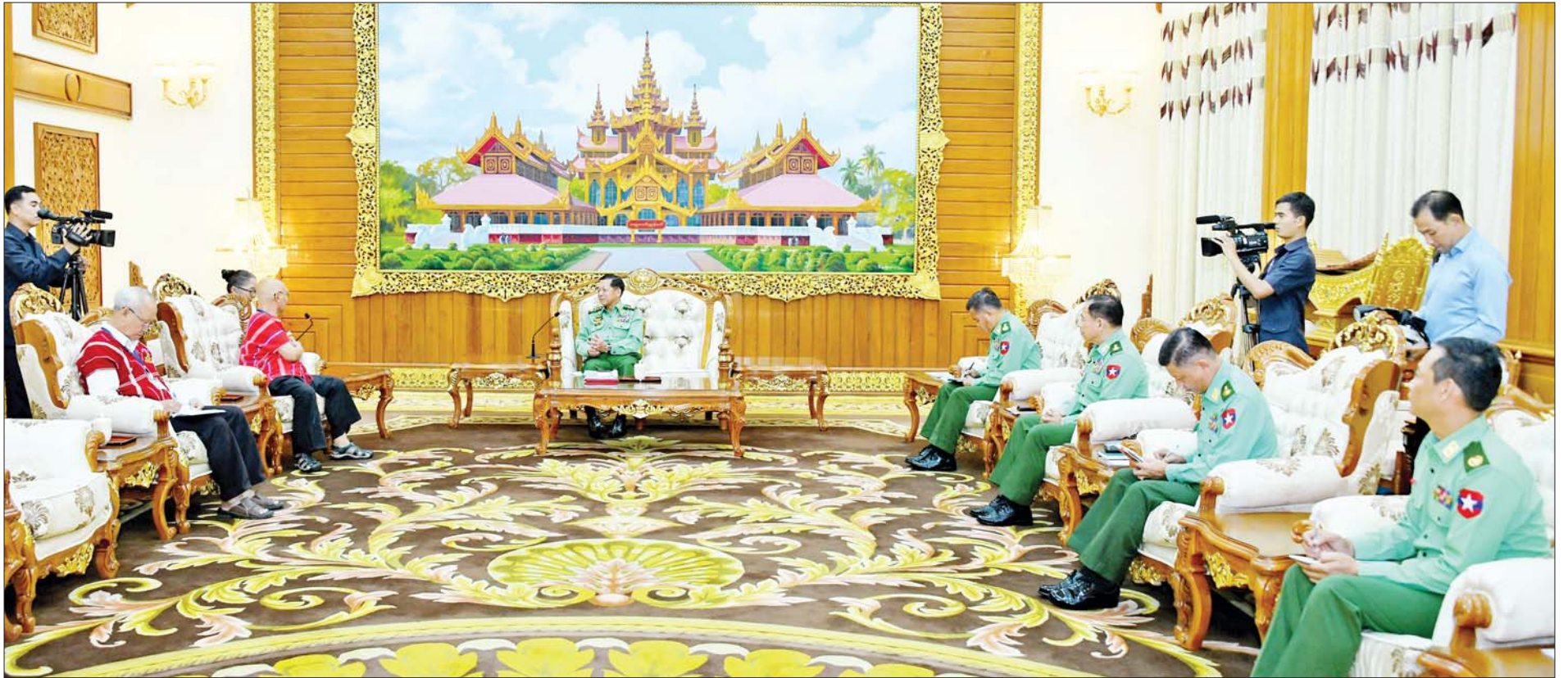
နိုင်ငံတော်စီမံအုပ်ချုပ်ရေးကောင်စီဥက္ကဋ္ဌ တပ်မတော်ကာကွယ်ရေးဦးစီးချုပ် ဗိုလ်ချုပ်မှူးကြီးမင်းအောင်လှိုင် တစ်နိုင်ငံလုံးပစ်ခတ်တိုက်ခိုက်မှုရပ်စဲရေးသဘောတူစာချုပ် (NCA) (၈)နှစ်မြောက် နှစ်ပတ်လည်နေ့ အခမ်းအနားသို့ တက်ရောက်ခဲ့သော ကရင်တိုင်းရင်းသားခေါင်းဆောင် စောမူတူးစေးဖိုး ဦးဆောင်သည့်အဖွဲ့အား လက်ခံတွေ့ဆုံစဉ်။