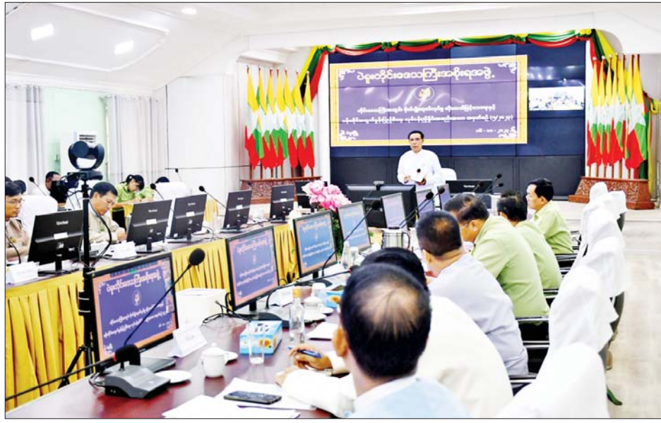
ထို့နောက် တက်ရောက်လာသည့် ခရိုင် ခြောက်ခုမှ ခရိုင်စိုက်ပျိုးရေးဦးစီးမှူးများက ၂၀၂၃-၂၀၂၄ ခုနှစ်