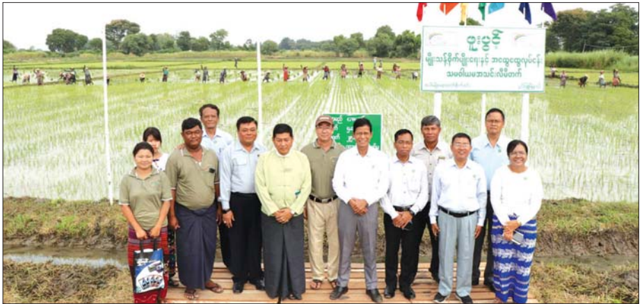
ပွင့်ဖြူမြို့နယ် ဖူးပွင့်မျိုးသန့်စိုက်ပျိုးရေးနှင့် အထွေထွေလုပ်ငန်း သမဝါယမအသင်းလီမိတက်၏ မျိုးစေ့ကုန်ထုတ်စိုက်ခင်းများရှေ့တွင် အမှတ်တရဓာတ်ပုံရိုက်စဉ်။

စိတ်ကူးမှသည် လက်တွေ့အကောင်အထည် ဖော်နိုင်ရေးသို့ ပြီးခဲ့သည့် ဩဂုတ်လ ၂၈၊ ၂၉၊ ၃၀ ရက်နေ့ များ