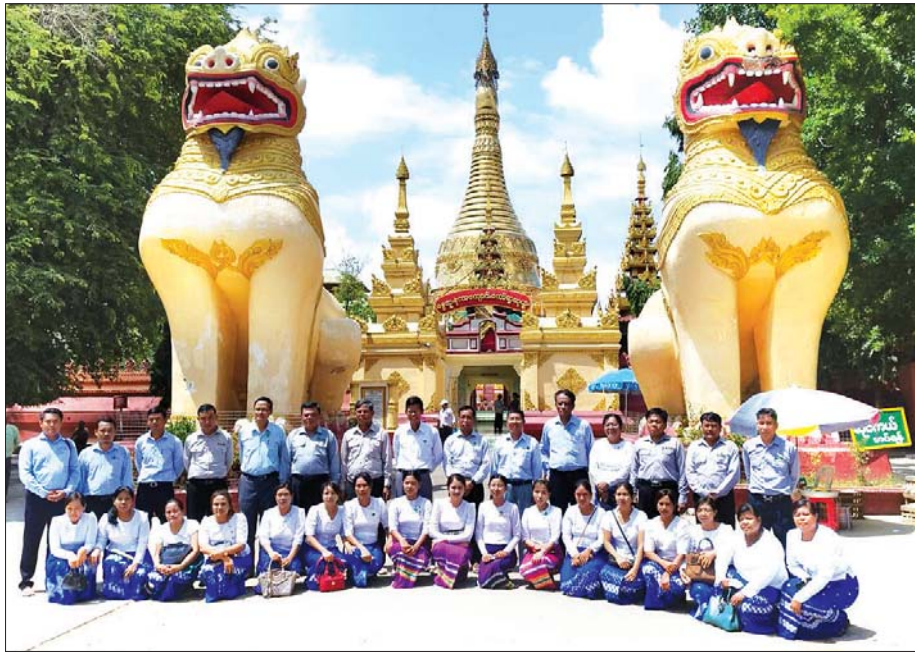
စန္ဒကူးနံ့သာကျောင်းတော်ရာစေတီတော်ရှေ့တွင် ဝန်ထမ်းများနှင့် အမှတ်တရ။

မုန်းချောင်းရေအလျဉ် ရစ်ခွေဆင်းသို့ ကျား ရင်ထဲမှာနေ ... အသည်းလွှာအပေါင်း ချမ်းဆောင်းမြေမြေ တုန်ယင်ကာလေ နှလုံးသားမျက်ရည် မိုးသို့စွေခဲ့ပေ မ ရင်ထဲမှာနေ ... အသည်းလွှာအပေါင်း ချမ်းဆောင်းမြေမြေ တုန်ယင်ကာလေ နှလုံးသားမျက်ရည် မိုးသို့မစွေနဲ့လေ ကျား ဘယ်လိုပင် ဝေးကွာဝေးအောင် ပြေးကာပြေးလို့ တိုမှာမဖြေနိုင် အသည်းလေးခွေယိုင် နှလုံးသားတွေကမခိုင် မ ဘယ်လိုပင် ဝေးကွာဝေးအောင် ပြေးကာမပြေးကွဲ့ မေ့အသည်းညှာပိုင် အသည်းလေးတူပြိုင် သစ္စာပန္နက်ဖူးအခိုင်