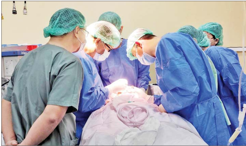
နှုတ်ခမ်းကွဲ၊ အာခေါင်ကွဲလူနာများ ခွဲစိတ်ကုသ မှုများကို ရန်ကုန်ပြည်သူ့ဆေးရုံကြီး၊ မန္တလေး ပြည်သူ့ဆေးရုံကြီး၊ နေပြည်တော်ပြည်သူ့ဆေးရုံကြီး (ခုတင်-၁၀၀၀)၊ သွားနှင့်ခံတွင်း အထူးကုဆေးရုံ (နေပြည်တော်)၊ မော်လမြိုင်မြို့၊ လွိုင်လင်မြို့၊ လှိုင်သာယာမြို့၊ ပြည်သူ့ဆေးရုံကြီးများတွင် ဆောင်ရွက်ပေးလျက်ရှိပြီး ရွှေဘိုမြို့၊ မြိတ်မြို့၊ မကွေးမြို့၊ ပြည်သူ့ဆေးရုံကြီးများတွင် တိုးချဲ့ ဆောင်ရွက်နိုင်ရေး စီစဉ်ဆောင်ရွက်လျက်ရှိကာ ပြည်တွင်းရှိ မျက်နှာမေးရိုးနှင့်ခံတွင်းခွဲစိတ်ကုသမှု ဆိုင်ရာဆေးပညာရှင်များအပြင် ပြည်ပညာရှင်များ နှင့်ပါ တွဲဖက်၍ ကွင်းဆင်းကုသမှုများကိုလည်း ဆောင်ရွက်ပေးလျက်ရှိကြောင်း သိရသည်။ သတင်းစဉ်

ခွဲစိတ်ကုသပေးနိုင်ခဲ့ပါသည်။ အောက်တိုဘာ ၁၃ ရက် နံနက်ပိုင်းက ဧရာဝတီ တိုင်းဒေသကြီးဝန်ကြီးချုပ် ဦးတင်မောင်ဝင်းသည် တိုင်းဒေသကြီးအစိုးရအဖွဲ့ဝင် ဝန်ကြီးများနှင့်အတူ ခွဲစိတ်ကုသမှုများကို ကြည့်ရှု၍ အထူးကုဆရာဝန်ကြီး များအား အမှတ်တရလက်ဆောင်များပေးအပ်ပြီး နှုတ်ခမ်းကွဲ၊ အာခေါင်ကွဲလူနာများနှင့် မိသားစုများကို ရင်းရင်းနှီးနှီး တွေ့ဆုံအားပေးစကားများ ပြောကြား ကာ အာဟာရပြည့်စားသောက်ဖွယ်ရာများ ထောက်ပံ့ ပေးအပ်ပါသည်။ မြန်မာနိုင်ငံ သွားဘက်ဆိုင်ရာဆေးပညာ ညီလာခံ (Myanmar Dental Health Science Conference) ကို နေပြည်တော်ရှိ မြန်မာအပြည်ပြည် ဆိုင်ရာ ကွန်ဗင်းရှင်းဗဟိုဌာန-၂ (MICC-2) ၌ ဆောင်ရွက်မည်ဖြစ်ပြီး ညီလာခံအကြိုလှုပ်ရှားမှုအဖြစ် သက်ကြီးရွယ်အိုများအတွက် သွားတု(အံကပ်/အံပုံ) များ တပ်ဆင်ပေးခြင်းနှင့် နှုတ်ခမ်းကွဲ၊ အာခေါင်ကွဲ လူနာများ ခွဲစိတ်ကုသမှုကို ၂၀၂၃ ခုနှစ် အောက်တိုဘာ လအတွင်း နေပြည်တော်ရှိ သွားနှင့် ခံတွင်း အထူးကု ဆေးရုံ၌ ဆောင်ရွက်ပေးရန် စီစဉ်ထားရှိပါသည်။