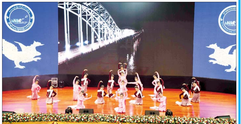
မွန်ပြည်နယ်မှ တိုင်းရင်းသား/ တိုင်းရင်းသူများက “ဝန်းရံကြမည် အိမ်မြန်ပြည်”တေးသီချင်းဖြင့် သရုပ်ဖော်ကပြ ဖျော်ဖြေတင်ဆက်ကြစဉ်။