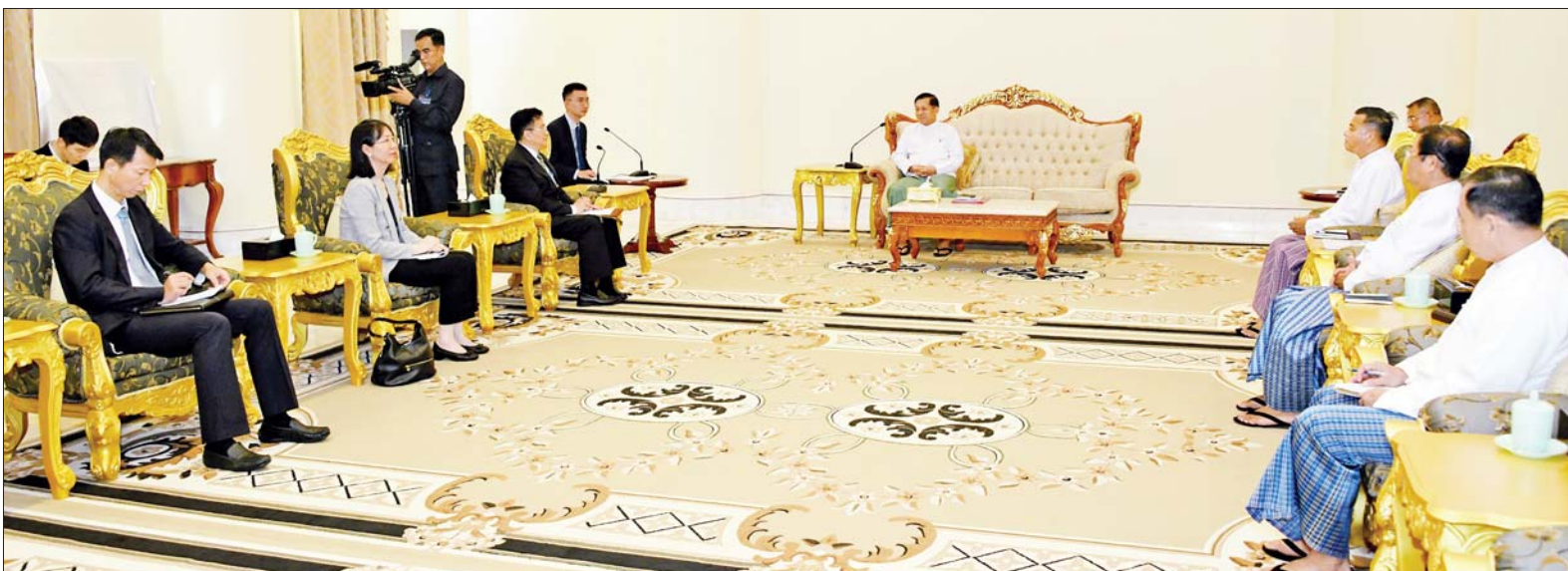
နိုင်ငံတော်စီမံအုပ်ချုပ်ရေးကောင်စီဥက္ကဋ္ဌ နိုင်ငံတော်ဝန်ကြီးချုပ် ဗိုလ်ချုပ်မှူးကြီးမင်းအောင်လှိုင် တရုတ်နိုင်ငံခြားရေးဝန်ကြီးဌာန အာရှရေးရာ အထူးကိုယ်စားလှယ် Mr. Deng Xijun ဦးဆောင်သည့် ကိုယ်စားလှယ်အဖွဲ့အား လက်ခံတွေ့ဆုံစဉ်။

နေပြည်တော် အောက်တိုဘာ ၁၅ နိုင်ငံတော်စီမံအုပ်ချုပ်ရေးကောင်စီဥက္ကဋ္ဌ နိုင်ငံတော်ဝန်ကြီးချုပ် ဗိုလ်ချုပ်မှူးကြီးမင်းအောင်လှိုင်ထံသို့ ယနေ့နံနက်ပိုင်းတွင် ကျင်းပပြုလုပ်ခဲ့သည့် တစ်နိုင်လုံး ပစ်ခတ်တိုက်ခိုက်မှုရပ်စဲရေးသဘောတူစာချုပ်(NCA) (၈)နှစ်မြောက် နှစ်ပတ်လည်နေ့အခမ်းအနားသို့ တက်ရောက်ခဲ့သော တရုတ်နိုင်ငံခြားရေးဝန်ကြီးဌာန အာရှရေးရာအထူးကိုယ်စားလှယ် Mr. Deng Xijun ဦးဆောင်သည့် ကိုယ်စားလှယ်အဖွဲ့က ယနေ့ မွန်းလွဲပိုင်းတွင် နေပြည်တော်ရှိ နိုင်ငံတော်စီမံအုပ်ချုပ်ရေးကောင်စီဥက္ကဋ္ဌရုံး ဧည့်ခန်းမ၌ လာရောက်ဂါရဝပြုတွေ့ဆုံသည်။