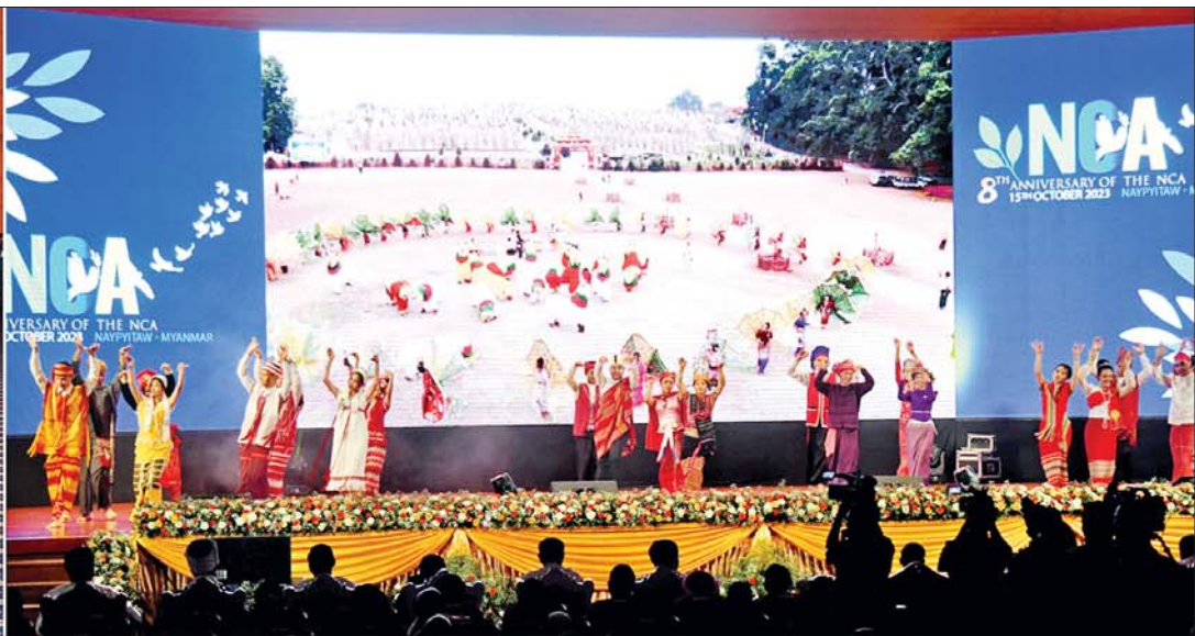
နိုင်ငံတော်စီမံအုပ်ချုပ်ရေးကောင်စီဥက္ကဋ္ဌ နိုင်ငံတော်ဝန်ကြီးချုပ် အမျိုးသားစည်းလုံးညီညွတ်ရေးနှင့် ငြိမ်းချမ်းရေးဖော်ဆောင်မှု ဗဟိုကော်မတီဥက္ကဋ္ဌ တပ်မတော်ကာကွယ်ရေးဦးစီးချုပ် ဗိုလ်ချုပ်မှူးကြီး မင်းအောင်လှိုင်နှင့် ဧည့်သည်တော်များ မြန်မာ့အသံနှင့်ရုပ်မြင်သံကြားမှ တိုင်းရင်းသား တိုင်းရင်းသူများက “ငြိမ်းချမ်းရေးလက် မြဲမြဲဆက်” တေးသီချင်းဖြင့် ဖျော်ဖြေတင်ဆက်မှုကို ကြည့်ရှုအားပေးစဉ်။