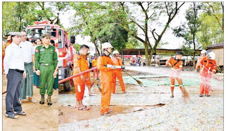
များ တပ်ဆင်နိုင်ရေး ဖြည့်ဆည်းဆောင်ရွက်ပေးသည်။ ထို့နောက် တိုင်းဒေသကြီးဝန်ကြီးချုပ်နှင့်အဖွဲ့သည် ခေါင်းဆေးကျွန်းရပ်ကွက် အဝေရာလမ်း၌ သမဝါယမနှင့် ကျေးလက်ဖွံ့ဖြိုးရေးဝန်ကြီးဌာနနှင့် ပဲခူးတိုင်းဒေသကြီးအစိုးရအဖွဲ့တို့၏ အစီအစဉ်ဖြင့် ရေသန့်စင်စက်တပ်ဆင်ထားသည့် မော်တော်ယာဉ်များဖြင့် ရေသန့် အခမဲ့ ဖြန့်ဝေပေးနေမှုအခြေအနေများကို ကြည့်ရှုအားပေးပြီး ဒေသခံပြည်သူများနှင့် တွေ့ဆုံ၍ ရင်းရင်းနှီးနှီးအားပေးစကား ပြောကြားသည်။

ဦးစွာ တိုင်းဒေသကြီးဝန်ကြီးချုပ် ဦးမျိုးဆွေဝင်းနှင့်အဖွဲ့သည် ကျွန်းသာယာရပ်ကွက်ရှိ အမှတ်(၅) အခြေခံပညာအထက်တန်းကျောင်း(ခွဲ)နှင့် ဥဿာမြို့သစ် ရပ်ကွက်ကြီး(၇) အမှတ်(၁၀) အခြေခံပညာ အထက်တန်းကျောင်းများသို့ ရောက်ရှိပြီး တပ်မတော်သားများ၊ ရဲတပ်ဖွဲ့ဝင်များ၊ မီးသတ်တပ်ဖွဲ့ဝင်များ၊ ဌာနဆိုင်ရာများ၊ ဒေသခံပြည်သူများ စုပေါင်းအားဖြင့် သန့်ရှင်းရေးပြုလုပ်နေမှုများကို ကြည့်ရှုအားပေး၍ ကျောင်းတွင်းရှိ ရေသန့်စင်စက်များ ပြန်လည်ပြင်ဆင်သွားရန်နှင့် လျှပ်စစ်မီးအန္တရာယ် ကင်းရှင်းစေရေး စစ်ဆေးဆောင်ရွက်ရန် တာဝန်ရှိသူများအား လမ်းညွှန်မှာကြားကာ ခေတ်မီကလေးကစားကွင်း