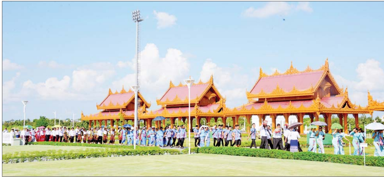
ယဉ်ကျေးမှုအကအဖွဲ့နှင့် တိုင်းရင်းသားရိုးရာယဉ်ကျေးမှုအကအဖွဲ့များ မာရဝိဇယဗုဒ္ဓရုပ်ပွားတော်မြတ်ကြီးသို့ သွားရောက်ဖူးမြော်ကြည်ညိုကြစဉ်။

ဦးစွာ ယဉ်ကျေးမှုအကအဖွဲ့နှင့် တိုင်းရင်းသားရိုးရာယဉ်ကျေးမှုအကအဖွဲ့များသည် နေပြည်တော် ဒက္ခိဏသီရိမြို့နယ်၌ တည်ထား