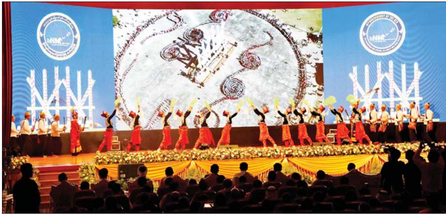
ကချင်ပြည်နယ်မှ တိုင်းရင်းသား/ တိုင်းရင်းသူများက “ပြည်ထောင်စုရဲ့ မြောက်ဘက်ဆီသို့ အလည်လာပါ” တေးသီချင်းဖြင့် သရုပ်ဖော်ကပြ ဖျော်ဖြေတင်ဆက်ကြစဉ်။