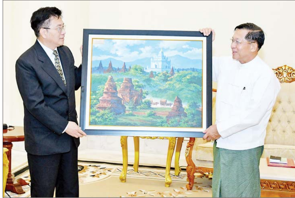
နိုင်ငံတော်စီမံအုပ်ချုပ်ရေးကောင်စီဥက္ကဋ္ဌ နိုင်ငံတော်ဝန်ကြီးချုပ် ဗိုလ်ချုပ်မှူးကြီးမင်းအောင်လှိုင် တရုတ်နိုင်ငံခြားရေးဝန်ကြီးဌာန အာရှရေးရာအထူးကိုယ်စားလှယ် Mr. Deng Xijun အား အမှတ်တရ လက်ဆောင်ပစ္စည်း ပေးအပ်စဉ်။

အားဖြင့် မြန်မာနိုင်ငံ၏ ငြိမ်းချမ်းရေးလုပ်ငန်းစဉ်အပေါ် ခိုင်မာစွာ ရပ်တည်ထောက်ခံလျက်ရှိသည့် အခြေအနေနှင့် နိုင်ငံပြိုကွဲစေမည့် လုပ်ဆောင်မှုများကို လက်ခံမှု မရှိသည့်အခြေအနေ၊ မြန်မာနိုင်ငံအနေဖြင့်လည်း တရုတ်နိုင်ငံနှင့် နယ်စပ်ဒေသတည်ငြိမ်ရေးနှင့် ဖွံ့ဖြိုးတိုးတက်ရေးကို အလေးထား ဆောင်ရွက်သွားမည့်အခြေအနေ၊