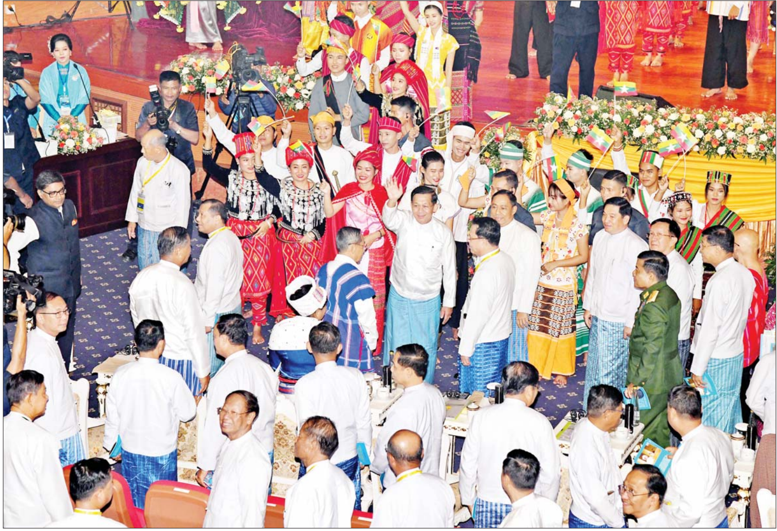
နိုင်ငံတော်စီမံအုပ်ချုပ်ရေးကောင်စီဥက္ကဋ္ဌ နိုင်ငံတော်ဝန်ကြီးချုပ် အမျိုးသားစည်းလုံးညီညွတ်ရေးနှင့် ငြိမ်းချမ်းရေးဖော်ဆောင်မှု ဗဟိုကော်မတီဥက္ကဋ္ဌ တပ်မတော် ကာကွယ်ရေးဦးစီးချုပ် ဗိုလ်ချုပ်မှူးကြီး မင်းအောင်လှိုင် တစ်နိုင်ငံလုံးပစ်ခတ်တိုက်ခိုက်မှုရပ်စဲရေးသဘောတူစာချုပ်(NCA) (၈)နှစ်မြောက် နှစ်ပတ်လည်နေ့အခမ်းအနားမှ အခမ်းအနား တက်ရောက်လာကြသူများကို ရင်းရင်းနှီးနှီးနှုတ်ဆက်စဉ်။

တက်ရောက် အခမ်းအနားသို့ နိုင်ငံတော်စီမံအုပ်ချုပ် ရေးကောင်စီ ဒုတိယဥက္ကဋ္ဌ ဒုတိယ ဝန်ကြီးချုပ် ဒုတိယဗိုလ်ချုပ်မှူးကြီး စိုးဝင်း၊ ကောင်စီအတွင်းရေးမှူး၊ တွဲဖက် အတွင်းရေးမှူးနှင့်ကောင်စီအဖွဲ့ဝင်များ၊ ပြည်ထောင်စုအဆင့် ပုဂ္ဂိုလ်များနှင့် ပြည်ထောင်စုဝန်ကြီးများ၊ နေပြည်တော် ကောင်စီဥက္ကဋ္ဌ၊ ကာကွယ်ရေးဦးစီးချုပ်ရုံး (ကြည်း)မှ အဆင့်မြင့် တပ်မတော်အရာရှိ ကြီးများ၊ နေပြည်တော်တိုင်းစစ်ဌာနချုပ် တိုင်းမှူး၊ ဒုတိယဝန်ကြီးများ၊ နိုင်ငံရေး ပါတီများမှ ဥက္ကဋ္ဌများနှင့် ကိုယ်စားလှယ် များ၊ တိုင်းရင်းသားလက်နက်ကိုင်အဖွဲ့ အစည်းများမှ ခေါင်းဆောင်များနှင့် ကိုယ်စားလှယ်များ၊ NCA လက်မှတ်ရေးထိုး ရာတွင် စာမျက်နှာ ၃ ကော်လံ ၁ သို့ ။