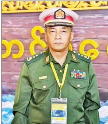
ဗိုလ်မှူးကြီး ဝဏ္ဏအောင်

တစ်နိုင်ငံလုံးပစ်ခတ်တိုက်ခိုက်မှုရပ်စဲရေးသဘောတူစာချုပ် (NCA) (၈) နှစ်မြောက် နှစ်ပတ်လည်နေ့အခမ်းအနားကို နေပြည်တော်ရှိ မြန်မာအပြည်ပြည်ဆိုင်ရာ ကွန်ဗင်းရှင်းဗဟိုဌာန(MICC II) ၌ ကျင်းပခဲ့ရာ အခမ်းအနားတက်ရောက်လာကြသူများ၏ ငြိမ်းချမ်းရေးနှင့်စပ်လျဉ်းသည့် စကားသံများကို စုစည်းဖော်ပြလိုက်ရပါသည်။