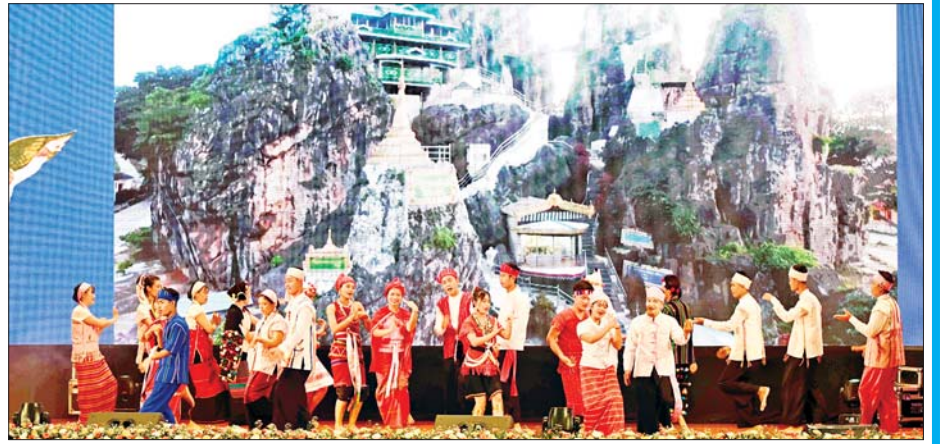
ကယားပြည်နယ်မှ တိုင်းရင်းသား/ တိုင်းရင်းသူများက “ကယားတို့၏သဘာဝအလှနှင့် စုပေါင်းအက” တေးသီချင်းဖြင့် သရုပ်ဖော်ကပြ ဖျော်ဖြေတင်ဆက်ကြစဉ်။