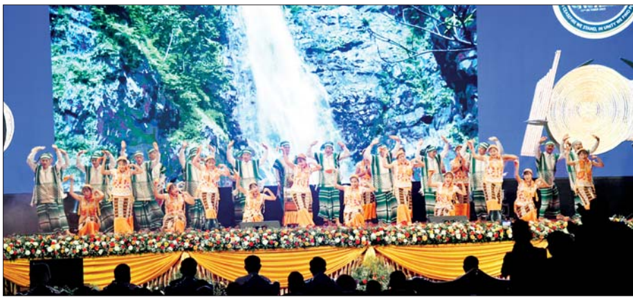
ကရင်ပြည်နယ်မှ တိုင်းရင်းသား/ တိုင်းရင်းသူများက “ငြိမ်းချမ်းဝေဆာ ပြည်မြန်မာ” တေးသီချင်းဖြင့် သရုပ်ဖော်ကပြ ဖျော်ဖြေတင်ဆက်ကြစဉ်။