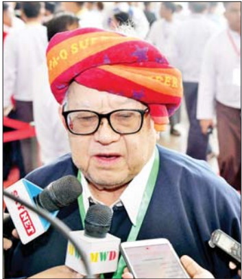
ခွန်ဥက္ကဋ္ဌ

အခု နိုင်ငံတော်စီမံအုပ်ချုပ်ရေး ကောင်စီ အစိုးရလက်ထက်မှာ ငြိမ်းချမ်း ရေးလုပ်ငန်းစဉ်တွေကို အရှိန်အဟုန် မပြတ် ဆက်လက်အကောင်အထည်ဖော် ဆောင်ရွက်နိုင်ရေးအတွက် ၂၀၂၁ ခုနှစ် ဖေဖော်ဝါရီ ၁၇ ရက်မှာ နိုင်ငံတော် ဝန်ကြီးချုပ်၊ တပ်မတော်ကာကွယ်ရေး ဦးစီးချုပ် ဗိုလ်ချုပ်မှူးကြီး မင်းအောင်လှိုင် ဥက္ကဋ္ဌအဖြစ် ပါဝင်တဲ့ အမျိုးသားစည်းလုံး ညီညွတ်ရေးနှင့် ငြိမ်းချမ်းရေးဖော်ဆောင် မှုဗဟိုကော်မတီ၊ ဒုတိယဝန်ကြီးချုပ်၊ ဒုတိယတပ်မတော် ကာကွယ်ရေးဦးစီး ချုပ် ဒုတိယဗိုလ်ချုပ်မှူးကြီး စိုးဝင်း ဥက္ကဋ္ဌအဖြစ် ပါဝင်တဲ့ အမျိုးသားစည်းလုံး ညီညွတ်ရေးနှင့် ငြိမ်းချမ်းရေးဖော်ဆောင် မှုလုပ်ငန်းကော်မတီ၊ ဒုတိယဗိုလ်ချုပ်ကြီး