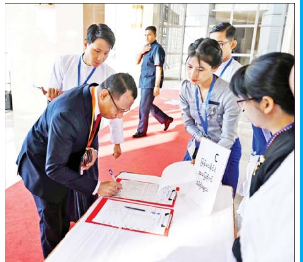
တစ်နိုင်ငံလုံးပစ်ခတ်တိုက်ခိုက်မှုရပ်စဲရေး သဘောတူစာချုပ် (NCA) (၈)နှစ်မြောက် နှစ်ပတ်လည်နေ့အထိမ်းအမှတ် အခမ်းအနား တက်ရောက်လာသူတစ်ဦး မှတ်တမ်းတင်လက်မှတ်ရေးထိုးစဉ်။