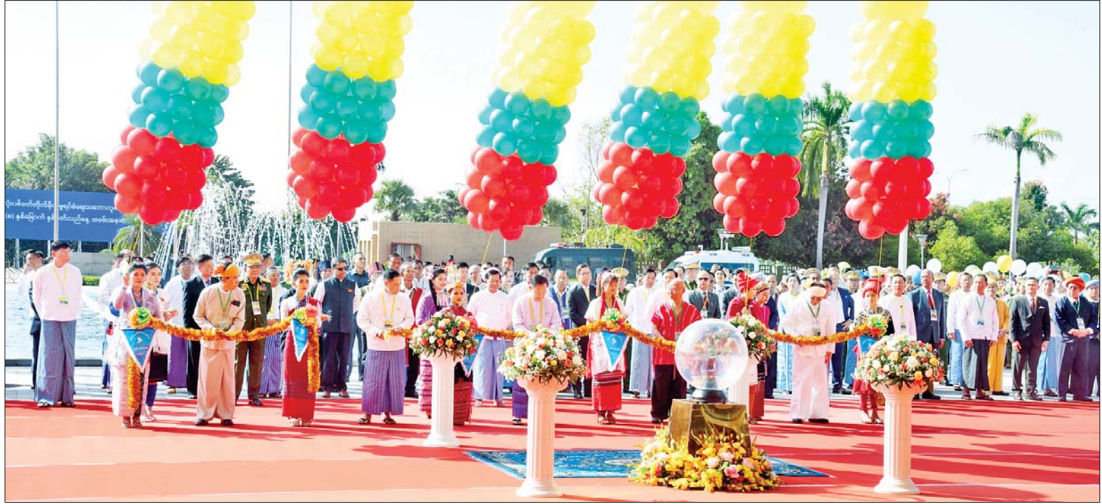
နိုင်ငံတော်စီမံအုပ်ချုပ်ရေးကောင်စီ ဒုတိယဥက္ကဋ္ဌ ဒုတိယဝန်ကြီးချုပ် ဒုတိယဗိုလ်ချုပ်မှူးကြီး စိုးဝင်း၊ နိုင်ငံတော်စီမံအုပ်ချုပ်ရေးကောင်စီအဖွဲ့ဝင် ပြည်ထောင်စုဝန်ကြီး အမျိုးသားစည်းလုံးညီညွတ်ရေးနှင့် ငြိမ်းချမ်းရေးဖော်ဆောင်မှု ညှိနှိုင်းရေးကော်မတီဥက္ကဋ္ဌ ဒုတိယဗိုလ်ချုပ်ကြီး ရာပြည့်၊ တိုင်းရင်းသားခေါင်းဆောင်များဖြစ်သည့် စောမူတူးစေးဖိုး၊ ဗိုလ်ချုပ်ကြီးယွက်စစ်နှင့် ပစ်ခတ်တိုက်ခိုက်မှုရပ်စဲရေးဆိုင်ရာ ပူးတွဲစောင့်ကြည့်ရေးကော်မတီ (JMC) မှ ကိုယ်စားလှယ် စိုင်းမျိုးသန့်တို့ တိုင်းရင်းသားများနှင့်အတူ တစ်နိုင်လုံး ပစ်ခတ်တိုက်ခိုက်မှုရပ်စဲရေးသဘောတူစာချုပ် (NCA) (၈) နှစ်မြောက် နှစ်ပတ်လည်နေ့အခမ်းအနားကို ဖဲကြိုးဖြတ် ဖွင့်လှစ်ပေးကြစဉ်။

ထို့နောက် နိုင်ငံတော်စီမံ အုပ်ချုပ်ရေးကောင်စီ ဥက္ကဋ္ဌ နိုင်ငံတော်ဝန်ကြီးချုပ် အမျိုးသား စည်းလုံးညီညွတ်ရေးနှင့် ငြိမ်းချမ်း ရေးဖော်ဆောင်မှု ဗဟိုကော်မတီ ဥက္ကဋ္ဌ ဗိုလ်ချုပ်မှူးကြီး မင်းအောင်လှိုင်က တစ်နိုင်လုံး ပစ်ခတ်တိုက်ခိုက်မှု ရပ်စဲရေး သဘောတူစာချုပ် (NCA) (၈) နှစ် မြောက် နှစ်ပတ်လည်နေ့ဆိုင်ရာ မိန့်ခွန်းပြောကြားသည်။ ထိုသို့ မိန့်ခွန်း ပြောကြားရာတွင် တစ်နိုင်လုံး ပစ်ခတ်တိုက်ခိုက်မှု ရပ်စဲရေး သဘောတူစာချုပ် (NCA) ဖြစ်ပေါ်လာပုံ သမိုင်းအကျဉ်း၊ လက်နက်ကိုင် ပဋိပက္ခများ ဖြစ်ပေါ်လာမှု၊ တပ်မတော်အစိုးရ လက်ထက် ငြိမ်းချမ်းရေးဆောင် ရွက်မှုများ၊ ဖွဲ့စည်းပုံအခြေခံ ဥပဒေနှင့် NCA ဆက်စပ်မှု၊ ပါတီစုံ ဒီမိုကရေစီစနစ်နှင့် ဖက်ဒရယ် စနစ်ဆိုင်ရာများ၊ PR စနစ်နှင့် တိုင်းရင်းသားပြည်သူ အားလုံး အကျိုးဝင်မှု၊ နိုင်ငံတော်စီမံအုပ်ချုပ် ရေးကောင်စီနှင့် တပ်မတော်၏ ငြိမ်းချမ်းရေးကြိုးပမ်းမှု၊ နိုင်ငံတော် စီမံအုပ်ချုပ်ရေးကောင်စီ၏ အမျိုး သားရေး မျှော်မှန်းချက်များနှင့် နိုင်ငံရေးမျှော်မှန်းချက်များ ချမှတ် အကောင်အထည်ဖော်လျက်ရှိမှု စသည်တို့နှင့်ပတ်သက်၍ ကဏ္ဍ အလိုက် ပြည့်ပြည့်စုံစုံ ထည့်သွင်း ပြောကြားသည်။ (နိုင်ငံတော်စီမံ အုပ်ချုပ်ရေးကောင်စီဥက္ကဋ္ဌ နိုင်ငံ တော်ဝန်ကြီးချုပ်၏ မိန့်ခွန်းကို စာမျက်နှာ ၇ တွင် ဖော်ပြထား ပါသည်။) စာမျက်နှာ ၄ သို့ ○