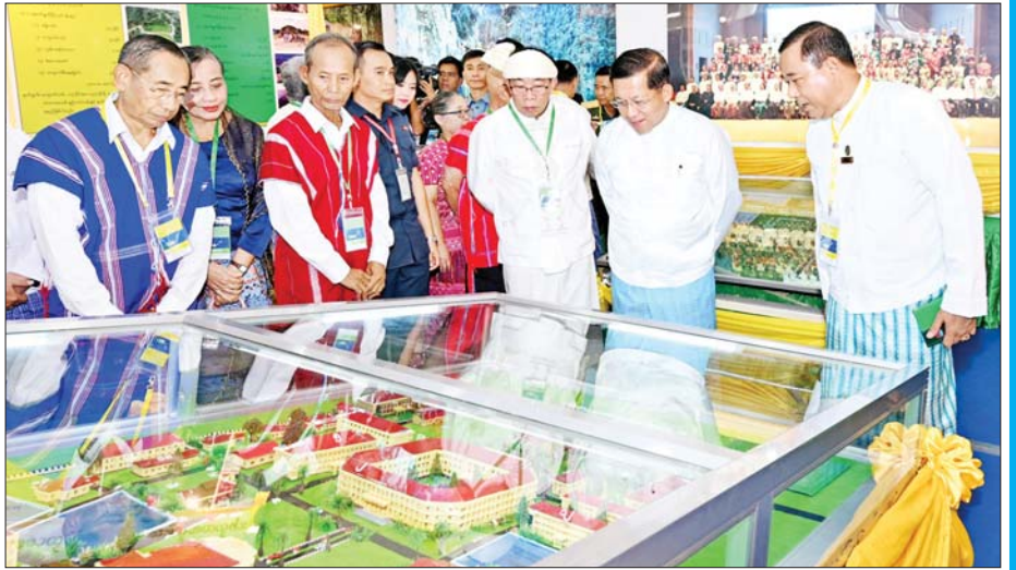
နိုင်ငံတော်စီမံအုပ်ချုပ်ရေးကောင်စီဥက္ကဋ္ဌ နိုင်ငံတော်ဝန်ကြီးချုပ် အမျိုးသားစည်းလုံးညီညွတ်ရေးနှင့် ငြိမ်းချမ်းရေးဖော်ဆောင်မှုဗဟိုကော်မတီဥက္ကဋ္ဌ တပ်မတော်ကာကွယ်ရေးဦးစီးချုပ် ဗိုလ်ချုပ်မှူးကြီးမင်းအောင်လှိုင်နှင့် ဧည့်သည်တော်များ တစ်နိုင်ငံလုံးပစ်ခတ်တိုက်ခိုက်မှုရပ်စဲရေးသဘောတူစာချုပ်(NCA) (၈)နှစ်မြောက် နှစ်ပတ်လည်နေ့ အထိမ်းအမှတ်ပြခန်းများကို လှည့်လည်ကြည့်ရှုကြစဉ်။