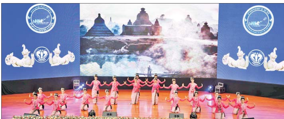
ရခိုင်ပြည်နယ်မှ တိုင်းရင်းသား/ တိုင်းရင်းသူများက “လည်စောင်လာပါ ပြည်ညော” တေးသီချင်းဖြင့် သရုပ်ဖော်ကပြ ဖျော်ဖြေတင်ဆက်ကြစဉ်။