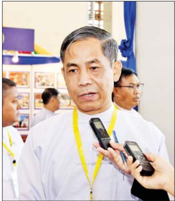
ဦးကိုကိုလှိုင် ပြည်ထောင်စုဝန်ကြီး

NCA လက်မှတ်ရေးထိုးပြီးနောက်မှာ NCA မှာပါတဲ့ ပြဋ္ဌာန်းချက်တွေအတိုင်း တစ်နိုင်ငံလုံး ပစ်ခတ်တိုက်ခိုက်မှု ရပ်စဲ ရေးသဘောတူစာချုပ်အကောင်အထည်