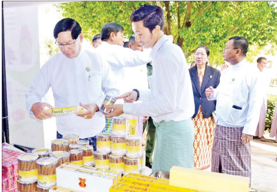
အစားထိုးပစ္စည်းများကိုပြည်သူများသုံးစွဲလာနိုင်စေရန်အသေးစားစက်မှုထုတ်ကုန်ပစ္စည်းပြပွဲနှင့် ဈေးရောင်းပွဲတော်(ရန်ကုန်)ကို ကျင်းပခြင်းဖြစ်ကြောင်း ပြောကြားသည်။

ထို့ပြင် နိုင်ငံတော်အနေဖြင့် အသေးစားစက်မှုလက်မှုလုပ်ငန်းများနှင့် ထုတ်ကုန်များကိုပြည်သူများ ပိုမိုသိရှိလာစေရန်၊ အသေးစားစက်မှုလက်မှုထုတ်ကုန်များကို အရည်အသွေးပိုမိုကောင်းမွန်အောင် ထုတ်လုပ်လာနိုင်စေခြင်းဖြင့် သွင်းကုန်