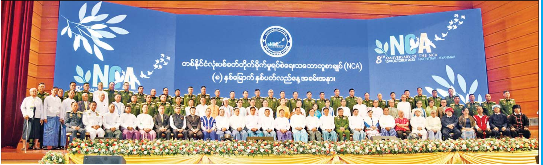
နိုင်ငံတော်စီမံအုပ်ချုပ်ရေးကောင်စီဥက္ကဋ္ဌ နိုင်ငံတော်ဝန်ကြီးချုပ်နှင့်အဖွဲ့ဝင်များ ပြည်ထောင်စုအဆင့်အဖွဲ့အစည်းများ၊ ကော်မတီ၊ ကော်မရှင်များမှပုဂ္ဂိုလ်များ၊ တပ်မတော်အရာရှိကြီးများ၊ အမျိုးသားစည်းလုံးညီညွတ်ရေးနှင့် ငြိမ်းချမ်းရေးဖော်ဆောင်မှုလုပ်ငန်းကော်မတီနှင့် ညှိနှိုင်းရေးကော်မတီတို့မှ ကော်မတီဝင်များ၊ နိုင်ငံတော်စီမံအုပ်ချုပ်ရေးကောင်စီ ဗဟိုအကြံပေးအဖွဲ့ဝင်များ၊ နိုင်ငံတော်စီမံအုပ်ချုပ်ရေးကောင်စီဥက္ကဋ္ဌ၏ အကြံပေးအဖွဲ့ဝင်များနှင့်အတူ စုပေါင်းမှတ်တမ်းတင် ဓာတ်ပုံရိုက်ကြစဉ်။