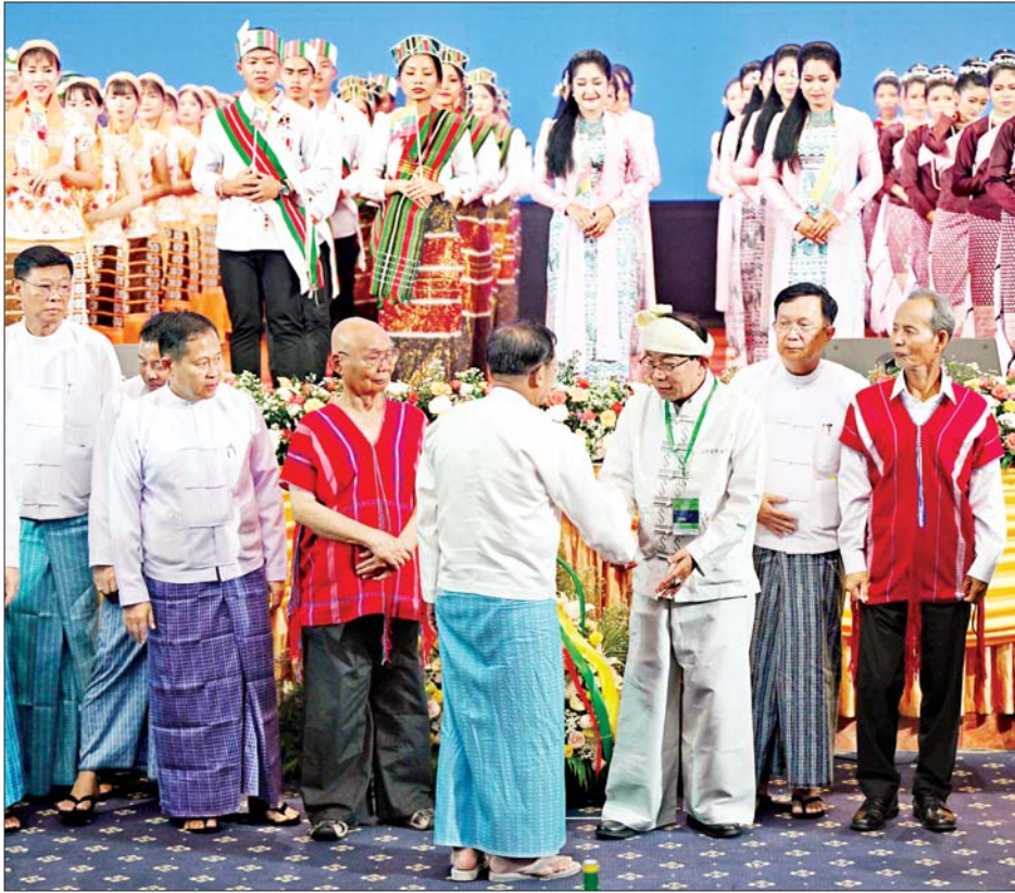
နိုင်ငံတော်စီမံအုပ်ချုပ်ရေးကောင်စီဥက္ကဋ္ဌ နိုင်ငံတော်ဝန်ကြီးချုပ် အမျိုးသားစည်းလုံးညီညွတ်ရေးနှင့် ငြိမ်းချမ်းရေးဖော်ဆောင်မှုဗဟိုကော်မတီဥက္ကဋ္ဌ တပ်မတော်ကာကွယ်ရေးဦးစီးချုပ် ဗိုလ်ချုပ်မှူးကြီး မင်းအောင်လှိုင် တစ်နိုင်လုံးပစ်ခတ်တိုက်ခိုက်မှုရပ်စဲရေးသဘောတူစာချုပ်(NCA) (၈)နှစ်မြောက် နှစ်ပတ်လည်နေ့အခမ်းအနား တက်ရောက်လာကြသူများကို ရင်းရင်းနှီးနှီးနှုတ်ဆက်စဉ်။