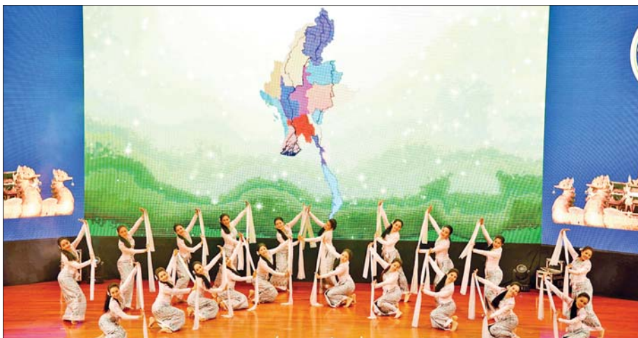
သာသနာရေးနှင့် ယဉ်ကျေးမှုဝန်ကြီးဌာန အနုပညာဦးစီးဌာနမှ အနုပညာရှင်များက “အ အကွာရအောင်ပါစေ” တေးသီချင်းဖြင့် သရုပ်ဖော်ကပြ ဖျော်ဖြေတင်ဆက်ကြစဉ်။