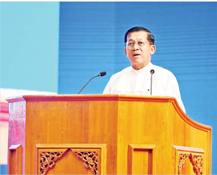
နိုင်ငံတော်စီမံအုပ်ချုပ်ရေးကောင်စီဥက္ကဋ္ဌ နိုင်ငံတော်ဝန်ကြီးချုပ် အမျိုးသားစည်းလုံးညီညွတ်ရေးနှင့် ငြိမ်းချမ်းရေးဖော်ဆောင်မှုပဟိုကော်မတီဥက္ကဋ္ဌ တပ်မတော်ကာကွယ်ရေးဦးစီးချုပ် ဗိုလ်ချုပ်မှူးကြီး မင်းအောင်လှိုင် တစ်နိုင်လုံးပစ်ခတ်တိုက်ခိုက်မှုရပ်စဲရေးသဘောတူစာချုပ်(NCA) ချုပ်ဆိုခြင်း (၈)နှစ်မြောက် နှစ်ပတ်လည်နေ့တွင် မိန့်ခွန်းပြောကြားစဉ်။

ကျွန်တော်တို့နိုင်ငံဟာ လွတ်လပ်ရေးနဲ့အတူ လက်နက်ကိုင်ပဋိပက္ခတွေ ဖြစ်ပေါ်လာခဲ့တာ