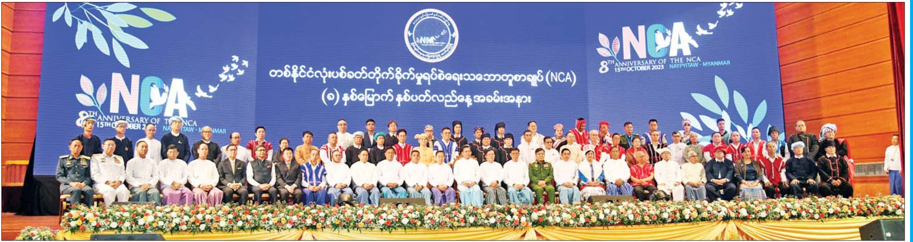
နိုင်ငံတော်စီမံအုပ်ချုပ်ရေးကောင်စီဥက္ကဋ္ဌ နိုင်ငံတော်ဝန်ကြီးချုပ် အမျိုးသားစည်းလုံးညီညွတ်ရေးနှင့် ငြိမ်းချမ်းရေးဖော်ဆောင်မှု ဗဟိုကော်မတီဥက္ကဋ္ဌ တပ်မတော်ကာကွယ်ရေးဦးစီးချုပ် ဗိုလ်ချုပ်မှူးကြီး မင်းအောင်လှိုင်နှင့်အဖွဲ့ဝင်များ၊ NCA-S-EAO တိုင်းရင်းသားလက်နက်ကိုင်အဖွဲ့အစည်းများမှပုဂ္ဂိုလ်များ၊ ဂုဏ်ထူးဆောင်ဘွဲ့ ချီးမြှင့်ခံရသည့် ငြိမ်းချမ်းရေးအကျိုးတော်ဆောင်များ၊ အိမ်နီးချင်းနိုင်ငံများ၏ အထူးကိုယ်စားလှယ်များ၊ EAOအထောက်အကူပြုမှုများနှင့်အတူ စုပေါင်းမှတ်တမ်းတင် ဓာတ်ပုံရိုက်ကြစဉ်။