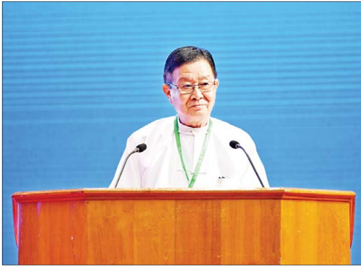
၂၀၂၃ ခုနှစ်၊ အောက်တိုဘာလ (၁၅) ရက်

တစ်နိုင်ငံလုံးပစ်ခတ်တိုက်ခိုက်မှု ရပ်စဲရေး သဘောတူစာချုပ် (NCA) လက်မှတ်ရေးထိုးခြင်း (၈)နှစ်မြောက် နှစ်ပတ်လည်နေ့ အခမ်းအနားကို တက်ရောက်လာကြသော နိုင်ငံတော် စီမံအုပ်ချုပ်ရေးကောင်စီ ဥက္ကဋ္ဌ နိုင်ငံတော်ဝန်ကြီးချုပ်နှင့်တကွ နိုင်ငံ တော်စီမံအုပ်ချုပ်ရေးကောင်စီ အဖွဲ့ဝင် များ၊ အစိုးရအဖွဲ့ဝင် ပြည်ထောင်စု ဝန်ကြီးများ၊ ဒုတိယဝန်ကြီးများ၊ အမျိုးသား စည်းလုံးညီညွတ်ရေးနှင့် ငြိမ်းချမ်းရေးဖော်ဆောင်မှုညွှန်ကြားရေး ကော်မတီ (NSPNC) ဥက္ကဋ္ဌ ဒုတိယ ဗိုလ်ချုပ်ကြီးရာပြည့်နှင့် အဖွဲ့ဝင်များ၊ ကရင်တိုင်းရင်းသား ခေါင်းဆောင်ကြီး စောမူတူးစေးဖိုးနှင့်တကွ တိုင်းရင်း သား ကိုယ်စားလှယ်များ၊ NCA စာချုပ် ကို လက်မှတ်ရေးထိုးခဲ့သည့် ကိုယ်စား လှယ်များ၊ နိုင်ငံရေးပါတီများမှ ကိုယ်စားလှယ်များ၊ လူထုလူတန်းစား အသီးသီးမှ ကိုယ်စားလှယ်များနှင့် တက်ရောက်လာကြသော ဧည့်သည် တော်ကြီးများအားလုံးကို မင်္ဂလာပါလို့ နှုတ်ခွန်းဆက်သပါတယ်။