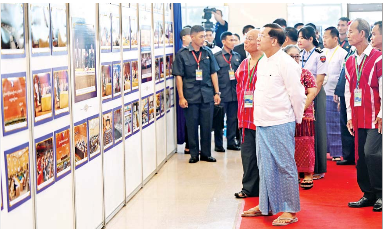
နိုင်ငံတော်စီမံအုပ်ချုပ်ရေးကောင်စီဥက္ကဋ္ဌ နိုင်ငံတော်ဝန်ကြီးချုပ် အမျိုးသားစည်းလုံးညီညွတ်ရေးနှင့် ငြိမ်းချမ်းရေးဖော်ဆောင်မှု ဗဟိုကော်မတီဥက္ကဋ္ဌ တပ်မတော်ကာကွယ်ရေးဦးစီးချုပ် ဗိုလ်ချုပ်မှူးကြီး မင်းအောင်လှိုင်နှင့် ဧည့်သည်တော်များ တစ်နိုင်လုံးပစ်ခတ် တိုက်ခိုက်မှုရပ်စဲရေးသဘောတူစာချုပ်(NCA) (၈)နှစ်မြောက် နှစ်ပတ်လည်နေ့အထိမ်းအမှတ်ပြခန်းများကို လှည့်လည်ကြည့်ရှုကြစဉ်။

ဂုဏ်ပြုစကားများပြောကြား ယင်းနောက် NCA လက်မှတ် ရေးထိုးခဲ့သည့် နိုင်ငံတကာ အသိ သက်သေများ၏ ကိုယ်စားလှယ် တရုတ်နိုင်ငံခြားရေးဝန်ကြီးဌာန အာရှရေးရာအထူးကိုယ်စားလှယ် Mr. Deng Xijun၊ အိန္ဒိယနိုင်ငံ ဒုတိယအမျိုးသားလုံခြုံရေးဆိုင်ရာ အကြံပေးပုဂ္ဂိုလ် H.E. Mr. Vikram Misri၊ ထိုင်းနိုင်ငံ နိုင်ငံခြားရေး ဝန်ကြီးဌာန ဒုတိယဝန်ကြီး H. E. Sihasak Phuangketkeow နှင့် NCA လက်မှတ်ရေးထိုးခဲ့သည့် ပြည်တွင်းအသိသက်သေများ၏ ကိုယ်စားလှယ် ပြည်ထောင်စု ဝန်ကြီး(အငြိမ်းစား)ဦးအောင်မင်း တို့က တစ်နိုင်လုံး ပစ်ခတ် တိုက်ခိုက်မှုရပ်စဲရေး သဘောတူ စာချုပ်(NCA) (၈)နှစ်မြောက်