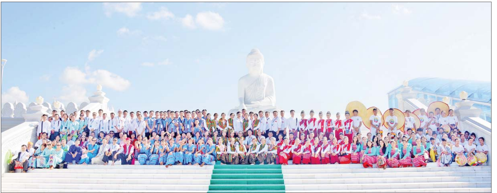
ယဉ်ကျေးမှုအကအဖွဲ့နှင့် တိုင်းရင်းသားရိုးရာယဉ်ကျေးမှုအကအဖွဲ့များ မာရဝိဇယဗုဒ္ဓရုပ်ပွားတော်မြတ်ကြီးသို့ သွားရောက်ဖူးမြော်ကြည်ညိုကာ အမှတ်တရဓာတ်ပုံရိုက်ကြစဉ်။

နေပြည်တော် အောက်တိုဘာ ၁၅ တစ်နိုင်ငံလုံး ပစ်ခတ်တိုက်ခိုက်မှုရပ်စဲရေးသဘောတူစာချုပ် (NCA) (၈) နှစ်မြောက် နှစ်ပတ်လည်နေ့ အခမ်းအနားတွင် ရိုးရာယဉ်ကျေးမှုအကများဖြင့် ဖျော်ဖြေတင်ဆက်ခဲ့ကြသည့် ယဉ်ကျေးမှုအကအဖွဲ့နှင့် တိုင်းရင်းသားရိုးရာယဉ်ကျေးမှုအကအဖွဲ့များသည် ယနေ့ မွန်းလွဲပိုင်းတွင် နေပြည်တော်ရှိ မာရဝိဇယဗုဒ္ဓရုပ်ပွားတော်မြတ်ကြီးအား ဖူးမြော်ကြည်ညိုကြပြီး နိုင်ငံတော်ဝန်ကြီးချုပ်က စီစဉ်ချီးမြှင့်သည့် ဂုဏ်ပြုညစာစားပွဲသို့ တက်ရောက်ကြသည်။