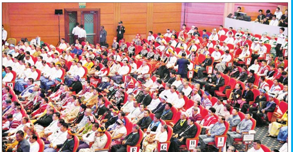
တစ်နိုင်ငံလုံးပစ်ခတ်တိုက်ခိုက်မှုရပ်စဲရေး သဘောတူစာချုပ် (NCA) (၈)နှစ်မြောက် နှစ်ပတ်လည်နေ့အထိမ်းအမှတ်အခမ်းအနား တက်ရောက်လာသူများကို တွေ့ရစဉ်။