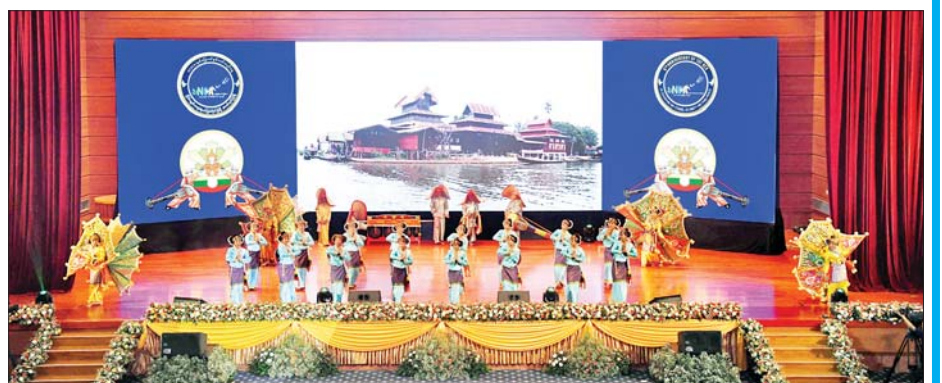
ရှမ်းပြည်နယ်မှ တိုင်းရင်းသား/ တိုင်းရင်းသူများက “ရှမ်းတောင်တန်းအလှနှင့် ရှမ်းတို့ရိုးရာအက” တေးသီချင်းဖြင့် သရုပ်ဖော်ကပြ ဖျော်ဖြေတင်ဆက်ကြစဉ်။