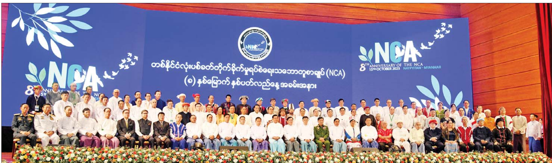
နိုင်ငံတော်စီမံအုပ်ချုပ်ရေးကောင်စီဥက္ကဋ္ဌ နိုင်ငံတော်ဝန်ကြီးချုပ် အမျိုးသားစည်းလုံးညီညွတ်ရေးနှင့် ငြိမ်းချမ်းရေးဖော်ဆောင်မှု ဗဟိုကော်မတီဥက္ကဋ္ဌ တပ်မတော်ကာကွယ်ရေးဦးစီးချုပ် ဗိုလ်ချုပ်မှူးကြီး မင်းအောင်လှိုင်နှင့် အဖွဲ့ဝင်များ နိုင်ငံရေးပါတီများမှ ဥက္ကဋ္ဌများနှင့် ကိုယ်စားလှယ်များ၊ အစိုးရဘက်မှ NCA လက်မှတ်ရေးထိုးထားသူများ၊ ပြည်တွင်းအသိသက်သေများ၊ ငြိမ်းချမ်းရေးလုပ်ငန်းစဉ်များတွင် ပါဝင် ဆောင်ရွက်ခဲ့သူများနှင့်အတူ စုပေါင်းမှတ်တမ်းတင်ဓာတ်ပုံရိုက်စဉ်။

○ စာမျက်နှာ ၃ မှ ဆက်လက်၍ NCA လက်မှတ် ရေးထိုးခဲ့ကြသော ကရင်တိုင်းရင်း သားခေါင်းဆောင် စောမူတူးစေးဖိုး နှင့် ရှမ်းပြည်ပြန်လည်ထူထောင်ရေးကောင်စီ RCSS(SSA) အဖွဲ့ ဥက္ကဋ္ဌ ဗိုလ်ချုပ်ကြီး ယွက်စစ်တို့က တစ်နိုင်လုံး ပစ်ခတ်တိုက်ခိုက်မှု ရပ်စဲရေးသဘောတူစာချုပ် (NCA) (၈)နှစ်မြောက် နှစ်ပတ်လည်နေ့ အထိမ်းအမှတ် ဂုဏ်ပြုစကားများ ပြောကြားကြသည်။ (ဂုဏ်ပြု စကားများကို စာမျက်နှာ ၁၀ တွင် ဖော်ပြထားပါသည်။)