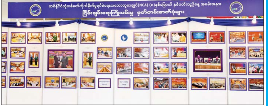
တစ်နိုင်ငံလုံးပစ်ခတ်တိုက်ခိုက်မှုရပ်စဲရေးသဘောတူစာချုပ် (NCA) (၈)နှစ်မြောက် နှစ်ပတ်လည်နေ့ အထိမ်းအမှတ်အခမ်းအနားတွင် ခင်းကျင်းပြသထားသည့် ပြည်ထောင်စုနေ့။