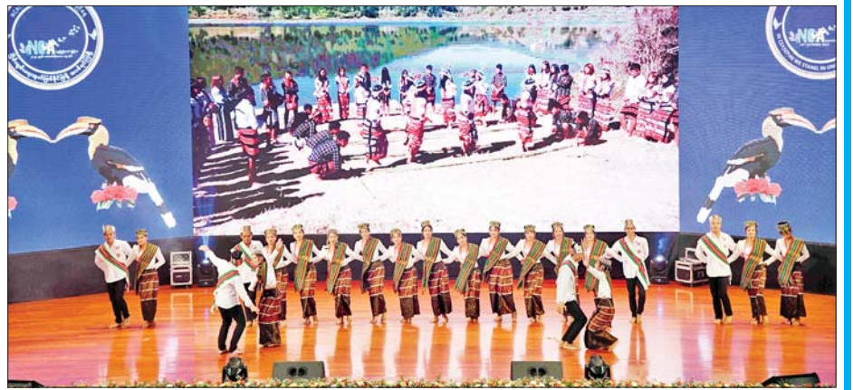
ချင်းပြည်နယ်မှ တိုင်းရင်းသား/ တိုင်းရင်းသူများက “စည်းလုံးခြင်း” တေးသီချင်းဖြင့် သရုပ်ဖော်ကပြ ဖျော်ဖြေတင်ဆက်ကြစဉ်။