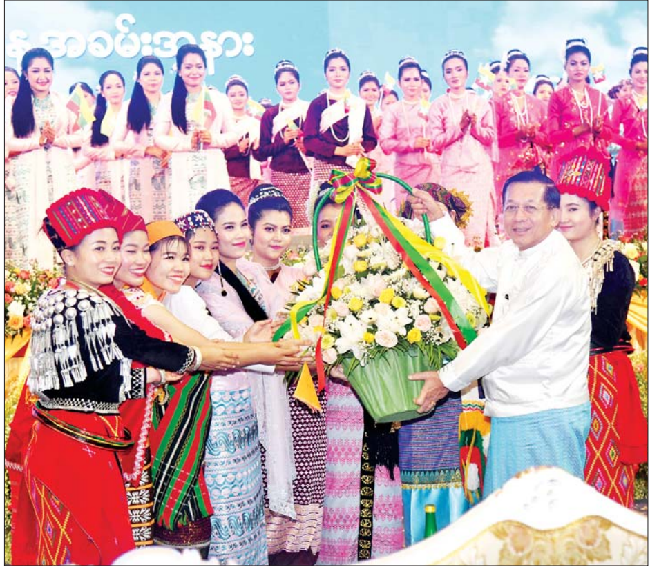
နိုင်ငံတော်စီမံအုပ်ချုပ်ရေးကောင်စီဥက္ကဋ္ဌ နိုင်ငံတော်ဝန်ကြီးချုပ် အမျိုးသားစည်းလုံးညီညွတ်ရေးနှင့် ငြိမ်းချမ်းရေးဖော်ဆောင်မှုဗဟိုကော်မတီဥက္ကဋ္ဌ တပ်မတော်ကာကွယ်ရေးဦးစီးချုပ် ဗိုလ်ချုပ်မှူးကြီး မင်းအောင်လှိုင် တစ်နိုင်လုံးပစ်ခတ်တိုက်ခိုက်မှုရပ်စဲရေးသဘောတူစာချုပ်(NCA) (၈)နှစ်မြောက် နှစ်ပတ်လည် နေ့အခမ်းအနားတွင် ဖျော်ဖြေတင်ဆက်ခဲ့သည့် အကအဖွဲ့များကို ငြိမ်းချမ်းရေးဂုဏ်ပြုပန်းခြင်း ပေးအပ်စဉ်။

ဝ စာမျက်နှာ ၄ မှ ရှမ်းပြည်နယ်တို့မှ တိုင်းရင်းသား/ တိုင်းရင်းသူများက “ဝန်းရံကြမည် အမိမြန်ပြည်”၊ “လည်စောင် လာပါ ပြည်စည်” “ရှမ်းတောင်တန်း အလှနှင့် ရှမ်းတို့ရိုးရာအက” တေးသီချင်းတို့ဖြင့် လည်းကောင်း၊ ပြန်ကြားရေးဝန်ကြီးဌာန မြန်မာ့ အသံနှင့် ရုပ်မြင်သံကြား၊ သာသနာရေးနှင့် ယဉ်ကျေးမှုဝန်ကြီးဌာန၊ အနုပညာဦးစီးဌာနတို့မှ အကအဖွဲ့ များနှင့် တိုင်းရင်းသားရိုးရာအက အဖွဲ့များ စုပေါင်း၍ “သွေးရင်း များပီပီ” တေးသီချင်းဖြင့် လည်းကောင်း သရုပ်ဖော်ကပြ ဖျော်ဖြေတင်ဆက်ကြသည်။ စုပေါင်းမှတ်တမ်းတင် ဓာတ်ပုံရိုက်