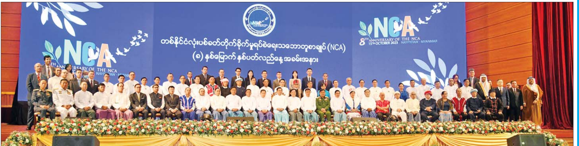
နိုင်ငံတော်စီမံအုပ်ချုပ်ရေးကောင်စီဥက္ကဋ္ဌ နိုင်ငံတော်ဝန်ကြီးချုပ် အမျိုးသားစည်းလုံးညီညွတ်ရေးနှင့် ငြိမ်းချမ်းရေးဖော်ဆောင်မှု ဗဟိုကော်မတီဥက္ကဋ္ဌ တပ်မတော်ကာကွယ်ရေးဦးစီးချုပ် ဗိုလ်ချုပ်မှူးကြီး မင်းအောင်လှိုင်နှင့် အဖွဲ့ဝင်များ၊ ပြည်ထောင်စုဝန်ကြီးများ၊ မြန်မာနိုင်ငံ အခြေစိုက်သံရုံးများမှသံတမန်များနှင့်အတူ စုပေါင်းမှတ်တမ်းတင် ဓာတ်ပုံရိုက်ကြစဉ်။