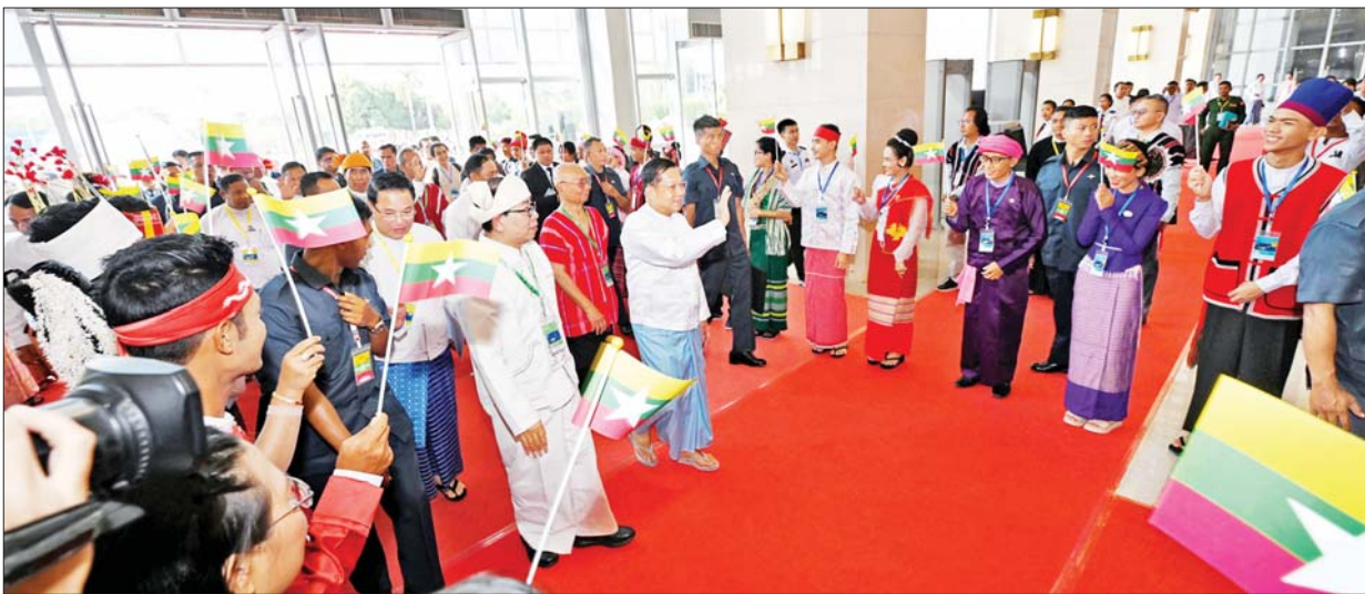
နိုင်ငံတော်စီမံအုပ်ချုပ်ရေးကောင်စီဥက္ကဋ္ဌ နိုင်ငံတော်ဝန်ကြီးချုပ် အမျိုးသားစည်းလုံးညီညွတ်ရေးနှင့် ငြိမ်းချမ်းရေးဖော်ဆောင်မှု ဗဟို ကော်မတီဥက္ကဋ္ဌ တပ်မတော်ကာကွယ်ရေးဦးစီးချုပ် ဗိုလ်ချုပ်မှူးကြီး မင်းအောင်လှိုင် တစ်နိုင်ငံလုံးပစ်ခတ်တိုက်ခိုက်မှုရပ်စဲရေး သဘောတူ စာချုပ်(NCA) (၈)နှစ်မြောက် နှစ်ပတ်လည်နေ့အထိမ်းအမှတ် အခမ်းအနားတက်ရောက်လာကြသူများကို ရင်းရင်းနှီးနှီးနှုတ်ဆက်စဉ်။