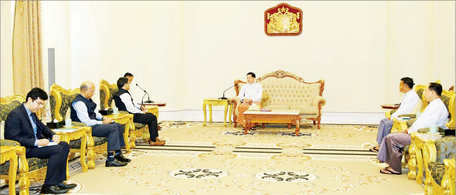
နိုင်ငံတော်စီမံအုပ်ချုပ်ရေးကောင်စီဥက္ကဋ္ဌ နိုင်ငံတော်ဝန်ကြီးချုပ် ဗိုလ်ချုပ်မှူးကြီးမင်းအောင်လှိုင် အိန္ဒိယနိုင်ငံ ဒုတိယအမျိုးသားလုံခြုံရေးဆိုင်ရာအကြံပေးပုဂ္ဂိုလ် H.E. Mr. Vikram Misri ဦးဆောင်သော ကိုယ်စားလှယ်အဖွဲ့အား လက်ခံတွေ့ဆုံစဉ်။