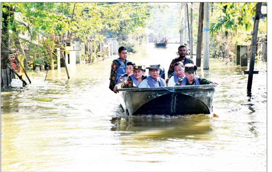
မျိုးစုံ ပိသာ ၁၃၀၀၊ မြန်မာနိုင်ငံ မိခင်နှင့် ကလေး စောင့်ရှောက်ရေးအသင်းက ငွေကျပ်သိန်း ၁၀၀ နှင့် မန္တလေးတိုင်းဒေသကြီး လမ်းပန်းဆက်သွယ်ရေးဝန်ကြီး မိသားစုက ငွေကျပ် သိန်း ၈၀ တန်ဖိုးရှိ ဆန်အိတ် ၁၀၀ တို့ကို ထောက်ပံ့လှူဒါန်းရာ တိုင်းဒေသကြီး ဝန်ကြီးချုပ်က လက်ခံရယူပြီး ဂုဏ်ပြုမှတ်တမ်းလွှာများ ပြန်လည်ပေးအပ်ခဲ့ကြောင်း သိရသည်။ တိုင်းဒေသကြီး(ပြန်/ဆက်)

ဆက်လက်၍ ပဲခူးမြို့ ရေဘေးအတွက် တိုင်းဒေသကြီး သဘာဝဘေးကွပ်ကဲမှုရုံးသို့ မန္တလေး တိုင်းဒေသကြီးအစိုးရအဖွဲ့က ငွေကျပ် သိန်း ၁၀၀၀၊ မန္တလေးတိုင်းဒေသကြီးအစိုးရအဖွဲ့၊ ရခိုင်ပြည်နယ် အစိုးရအဖွဲ့က ငွေကျပ်သိန်း ၁၅၀ တန်ဖိုးရှိ ငါးခြောက်