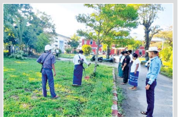
ကျိုက်လတ်မြို့ အမှတ်(၃)ရပ်ကွက် (၅ x ၆) ဦးပြုံးချိုလမ်းရှိ မြို့နယ်ပြည်သူ့ဆေးရုံ၌ မြို့နယ်အထွေထွေအုပ်ချုပ်ရေးဦးစီးဌာန နှင့် မြို့နယ်စည်ပင်သာယာရေးအဖွဲ့မှ ဝန်ထမ်းများ၊ ဌာနဆိုင်ရာ ဝန်ထမ်းများနှင့် မြို့နယ်ရဲတပ်ဖွဲ့ဝင်များ၊ လုံခြုံရေးတပ်ဖွဲ့ဝင်များ၊ မြို့နယ်မီးသတ်တပ်ဖွဲ့ဝင်များ၊ ရပ်ကွက်အုပ်ချုပ်ရေးမှူးနှင့် မိဘ ပြည်သူများ၊ လူမှုရေးအသင်းအဖွဲ့များစုပေါင်း၍ အောက်တိုဘာ ၁၄ ရက် နံနက်ပိုင်းက သန့်ရှင်းရေးဆောင်ရွက်စဉ်။ ၂၀၇

ယင်းသို့ ဆောင်ရွက်ပေးနေမှု များကို သက်ဆိုင်ရာ တိုင်းဒေသ ကြီးနှင့် ပြည်နယ်များမှ ဝန်ကြီး ချုပ်များ၊ တိုင်းစစ်ဌာနချုပ်များမှ တိုင်းမှူးများနှင့် တာဝန်ရှိသူများ က လိုက်လံကြည့်ရှုအားပေးပြီး လိုအပ်သည်များ ညှိနှိုင်းဆောင်ရွက် ပေးခဲ့ကြောင်း သိရသည်။ သတင်းစဉ်