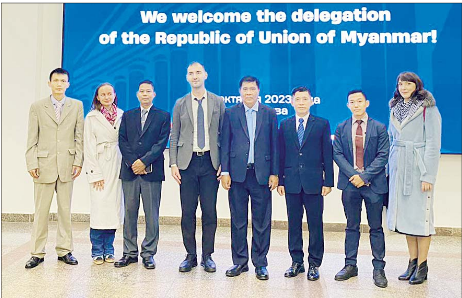
tom Technical Academy (မော်စကိုကျောင်းခွဲ) သို့ရောက်ရှိရာ Rosatom Technical Academy အုပ်ချုပ်မှုဒါရိုက်တာက သင်တန်းဆိုင်ရာ အချက်အလက်များကို ရှင်းလင်းပြသခဲ့ပြီး လူ့စွမ်းအားအရင်းအမြစ် ဖွံ့ဖြိုးတိုးတက်ရေးအတွက် ပူးပေါင်းဆောင်ရွက်မည့် ကိစ္စများကို ရင်းနှီးပွင့်လင်းစွာ ဆွေးနွေးခဲ့ကြသည်။

ထိုသို့လေ့လာကြည့်ရှုစဉ်ပြည်ထောင်စုဝန်ကြီးသည် အဆိုပါတက္ကသိုလ်များတွင် ပညာသင်ကြားလျက်ရှိသော မြန်မာကျောင်းသားများနှင့် တွေ့ဆုံ၍ လိုအပ်သည်များကို ကူညီဖြည့်ဆည်းဆောင်ရွက်ပေးပြီး ယင်းတက္ကသိုလ်မှ တာဝန်ရှိသူများနှင့်တွေ့ဆုံကာ Moscow Power Engineering Institute၊ National Research Nuclear University၊ RUDN တက္ကသိုလ်များနှင့် မြန်မာနိုင်ငံမှ တက္ကသိုလ်များ သင်ကြားသင်ယူမှုနှင့် သုတေသနပူးပေါင်းဆောင်ရွက်မည့် အခြေအနေများကို ညှိနှိုင်းဆွေးနွေးခဲ့ကြသည်။ ထို့နောက် ပြည်ထောင်စုဝန်ကြီးသည် Rosa-