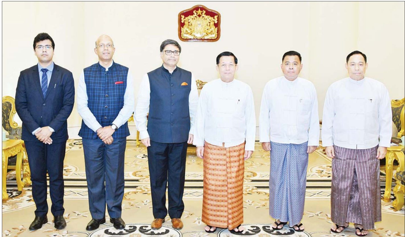
နိုင်ငံတော်စီမံအုပ်ချုပ်ရေးကောင်စီဥက္ကဋ္ဌ နိုင်ငံတော်ဝန်ကြီးချုပ် ဗိုလ်ချုပ်မှူးကြီး မင်းအောင်လှိုင် ဦးဆောင်သော အဖွဲ့နှင့် အိန္ဒိယနိုင်ငံ ဒုတိယအမျိုးသားလုံခြုံရေးဆိုင်ရာအကြံပေးပုဂ္ဂိုလ် H.E. Mr. Vikram Misri ဦးဆောင်သော ကိုယ်စားလှယ်အဖွဲ့တို့ စုပေါင်းမှတ်တမ်းတင်ဓာတ်ပုံရိုက်စဉ်။

အမြင်ချင်းဖလှယ်ဆွေးနွေး ထိုသို့တွေ့ဆုံရာတွင် ဦးစွာ နိုင်ငံတော်စီမံအုပ်ချုပ်ရေးကောင်စီဥက္ကဋ္ဌ နိုင်ငံတော်ဝန်ကြီးချုပ်က မြန်မာနိုင်ငံအတွက် အရေးကြီးသည့် ငြိမ်းချမ်းရေးနှစ်ပတ်လည်နေ့အခမ်းအနားကို အိန္ဒိယနိုင်ငံကိုယ်စား လာရောက်တက်ရောက်သည့်အတွက် ကျေးဇူးတင်ရှိကြောင်း ပြောကြားပြီး နိုင်ငံဖွံ့ဖြိုးတိုးတက်ရေးနှင့် တည်ငြိမ်အေးချမ်းရေးအတွက် ဆောင်ရွက်လျက်ရှိမှု၊ ဒီမိုကရေစီနှင့်ဖက်ဒရယ်ကို အခြေခံသည့် ပြည်ထောင်စုတည်ဆောက်ရေးဆောင်ရွက်လျက်ရှိမှု၊ နိုင်ငံတော်အစိုးရနှင့် တပ်မတော်အနေဖြင့် ပြည်တွင်းငြိမ်းချမ်းရေးရရှိအောင် ကြိုးပမ်းဆောင်ရွက်လျက်ရှိမှု၊ မြန်မာနိုင်ငံငြိမ်းချမ်းရေးအတွက် အိန္ဒိယနိုင်ငံအနေဖြင့် တစ်ဖက်တစ်လမ်းမှ ကူညီဆောင်ရွက်ပေးလျက်ရှိမှု၊ နယ်စပ်ဒေသတည်ငြိမ်အေးချမ်းရေးအတွက် ပူးပေါင်းဆောင်ရွက်လျက်ရှိမှု၊ နှစ်နိုင်ငံချစ်ကြည်ရေးနှင့် ပူးပေါင်းဆောင်ရွက်မှုများ တိုးတက်ကောင်းမွန်လျက်ရှိမှု၊ နှစ်နိုင်ငံ အပြန်အလှန်ကုန်သွယ်မှုများနှင့် ရင်းနှီးမြှုပ်နှံမှုများ ယခုထက် ပိုမိုတိုးတက်ကောင်းမွန်စေရေး ဆောင်ရွက်ရန် လိုအပ်လျက်ရှိမှု၊ နိုင်ငံတော်အစိုးရနှင့်တပ်မတော်အနေဖြင့် NCA လမ်းကြောင်းပေါ်၌ ခိုင်မာစွာရပ်တည်လျှောက်လှမ်းလျက်ရှိမှုနှင့် ပါတီစုံဒီမိုကရေစီလမ်းကြောင်းပေါ်၌ ခိုင်ခိုင်မာမာဖြင့် ဆက်လက်လျှောက်လှမ်းလျက်ရှိမှု၊ အိန္ဒိယနိုင်ငံ