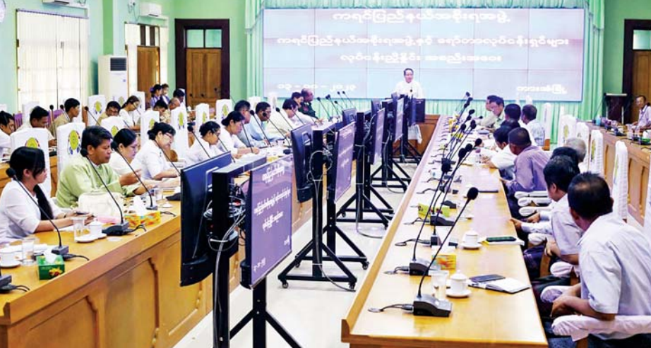
ကရင်ပြည်နယ်အစိုးရအဖွဲ့ရုံး အစည်းအဝေး

ရော်ဘာမျိုးကွဲပေါင်း ၁၅ မျိုးခန့် စိုက်ပျိုးကြပြီး တစ်ဧကလျှင် ၆၉၅ ဒသမ ၅၆ ပေါင် ထွက်ရှိသည့်အတွက် အထွက်နှုန်းလျော့နည်းပြီး ဒေသနှင့်ကိုက်ညီသည့်မျိုးများကို စိုက်ပျိုးကြမှသာ အထွက်နှုန်းတိုးတက်ကာ စိုက်ပျိုးတောင်သူများ တွက်ခြေကိုက်နိုင်မည်ဖြစ်ကြောင်း၊ ပြည်နယ်အတွင်းစက်ရုံအင်အားနည်းသည့်အတွက် မိုင်းခံရော်ဘာစက်ရုံ၊ အဆင့်မြင့် ရော်ဘာစက်ရုံများကို တိုးချဲ့တည်ဆောက်မှသာလျှင် ပြည်နယ်၏ ရော်ဘာထုတ်လုပ်မှုတိုးတက်ပြီး MSMEs လုပ်ငန်းများ ဖွံ့ဖြိုးတိုးတက်လာမည်ဖြစ်ကြောင်း၊ သက်တမ်းလွန်ရော်ဘာပင်အိုင်ပင်ဟောင်းများကို ကြိတ်ခွဲနိုင်သည့်စက်ရုံ မရှိသေးသည့်အတွက် ရော်ဘာသစ်ကုန်ချောထုတ်လုပ်သည့်စက်ရုံများ တည်ထောင်ရန်လိုကြောင်း ပြောကြားသည်။ ညှိနှိုင်းဖြည့်ဆည်းဆောင်ရွက်ပေး ထို့နောက်တက်ရောက်လာသော ရော်ဘာလုပ်ငန်းရှင်များက မြေယာကိစ္စရပ်များ၊ အသင်းအဖွဲ့ကိစ္စရပ်များ၊ သယ်ယူပို့ဆောင်ရေးဆိုင်ရာ အခက်အခဲများ၊ ချေးငွေဆိုင်ရာကိစ္စရပ်များ၊ ရော်ဘာစက်ရုံမြေနေရာ