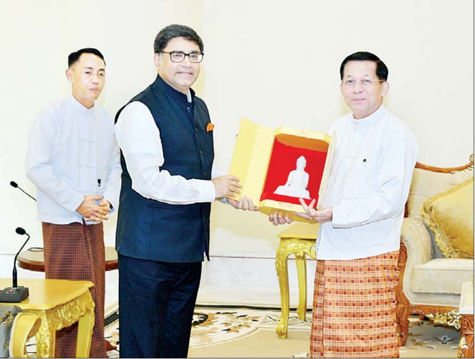
နိုင်ငံတော်စီမံအုပ်ချုပ်ရေးကောင်စီဥက္ကဋ္ဌ နိုင်ငံတော်ဝန်ကြီးချုပ် ဗိုလ်ချုပ်မှူးကြီး မင်းအောင်လှိုင် အိန္ဒိယနိုင်ငံ ဒုတိယအမျိုးသားလုံခြုံရေးဆိုင်ရာအကြံပေးပုဂ္ဂိုလ် H.E. Mr. Vikram Misri အား အမှတ်တရလက်ဆောင်ပစ္စည်းပေးအပ်စဉ်။

အနေဖြင့်လည်း မြန်မာနိုင်ငံငြိမ်းချမ်းရေးအတွက် ဆက်လက်ကူညီဆောင်ရွက်သွားမည့် အခြေအနေများနှင့် NCA အပေါ် အပြည့်အဝယုံကြည်လျက်ရှိမှုနှင့် မြန်မာနိုင်ငံ၏ နိုင်ငံရေးဖြစ်ပေါ်ပြောင်းလဲမှုများနှင့်ပတ်သက်၍ ရင်းနှီးပွင့်လင်းစွာဖြင့် အမြင်ချင်းဖလှယ် ဆွေးနွေးခဲ့ကြသည်။ တွေ့ဆုံပွဲအပြီးတွင် နိုင်ငံတော်စီမံအုပ်ချုပ်ရေးကောင်စီဥက္ကဋ္ဌ နိုင်ငံတော်ဝန်ကြီးချုပ်နှင့် အိန္ဒိယနိုင်ငံဒုတိယအမျိုးသားလုံခြုံရေးဆိုင်ရာ အကြံပေးပုဂ္ဂိုလ်တို့သည် အမှတ်တရလက်ဆောင်ပစ္စည်းများ အပြန်အလှန်ပေးအပ်ကြပြီး စုပေါင်းမှတ်တမ်းတင်ဓာတ်ပုံရိုက်ခဲ့ကြကြောင်း သိရသည်။ သတင်းစဉ်