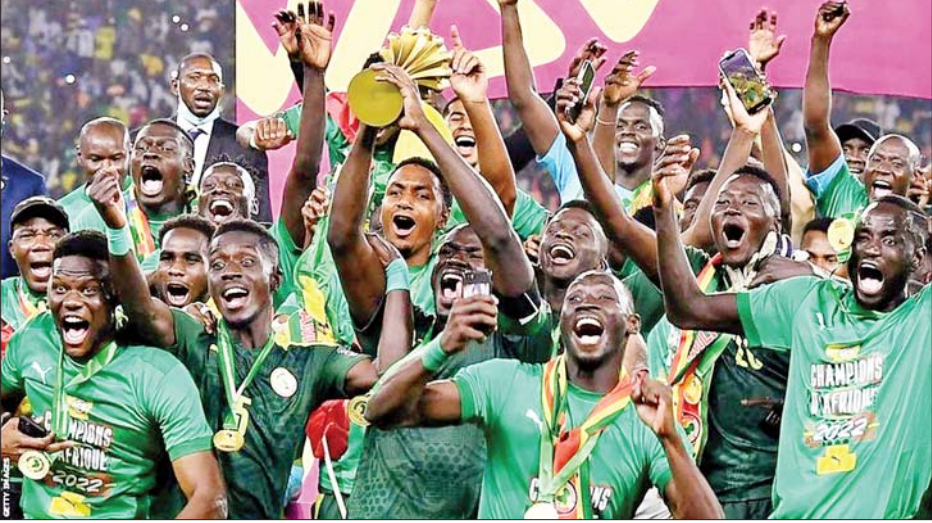
ဆီနီဂေါအသင်း ၂၀၂၁ ခုနှစ်က အာဖရိကနိုင်ငံများဖလားနှင့်အတူ အောင်ပွဲခံစဉ်။

KKO (ခွဲထွက်) အဖွဲ့နှင့် PDF အမည်အကြမ်းဖက် သမားများက ကော့ကရိတ် မြို့ရှိ အခြေခံပညာအထက် တန်းကျောင်း(ခွဲ) ပေါ်သို့ Drop ဗုံးများ ပစ်ချခဲ့မှု ကြောင့် ကျောင်းသူတစ်ဦး သေဆုံးပြီး သုံးဦး ဗုံးစ ထိမှန်ဒဏ်ရာများရရှိ စာမျက်နှာ » ၁၄