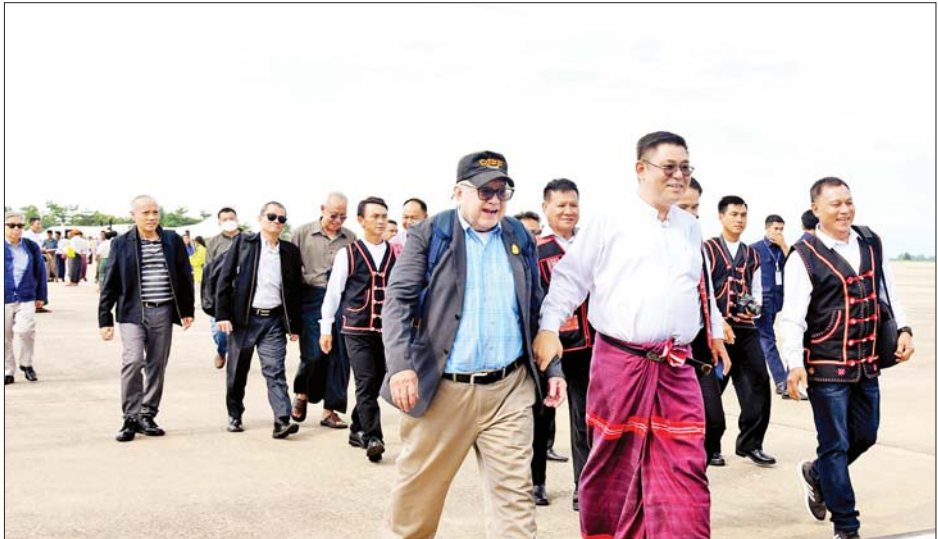
တစ်နိုင်ငံလုံးပစ်ခတ်တိုက်ခိုက်မှုရပ်စဲရေးသဘောတူစာချုပ် NCA (၈)နှစ်မြောက် နှစ်ပတ်လည်နေ့အခမ်းအနားသို့ တက်ရောက်ရန်ရောက်ရှိလာသည့် တိုင်းရင်းသားလက်နက်ကိုင်အဖွဲ့အစည်းများမှ ခေါင်းဆောင်များအား နေပြည်တော်လေဆိပ်၌ တာဝန်ရှိသူများ၊ ဌာနဆိုင်ရာဝန်ထမ်းများနှင့် ဒေသခံပြည်သူများက ကြိုဆိုကြစဉ်။