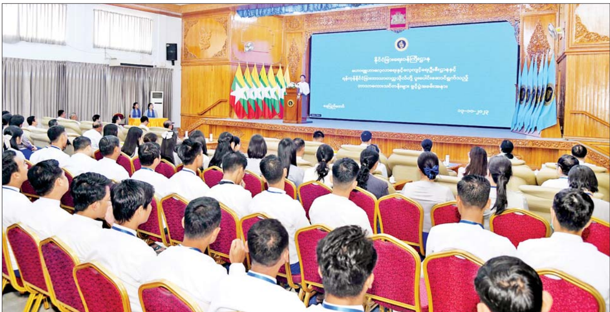
In-person စနစ်ဖြင့်လည်းကောင်း ဖွင့်လှစ်သင်ကြား ပို့ချသွားမည် ဖြစ်ပြီး နိုင်ငံခြားရေးဝန်ကြီးဌာနမှ ဝန်ကြီးရုံးနှင့် ဦးစီးဌာနအသီးသီးရှိ အရာထမ်း/အမှုထမ်း စုစုပေါင်း ၁၉၄ ဦး တက်ရောက်ကြမည်ဖြစ်ရာ ဘာသာစကားအသီးသီးကို ကျွမ်းကျင်တတ်မြောက်နိုင်ရန်နှင့် ထိရောက်ပိုင်နိုင်စွာအသုံးပြုနိုင်ရန်အတွက် လေ့ကျင့်သင်ကြားပို့ချပေးသွားမည် ဖြစ်ကြောင်း သိရသည်။ သတင်းစဉ်

အဆိုပါဘာသာစကားသင်တန်းများကို ရန်ကုန်နိုင်ငံခြားဘာသာတက္ကသိုလ်၌ ယနေ့မှစတင်၍ အွန်လိုင်းစနစ်ဖြင့်လည်းကောင်း