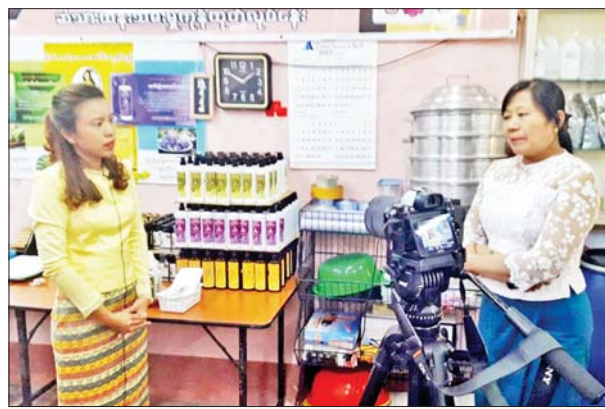
လုပ်ငန်းရှင်တွေအချင်းချင်း Group တွေ ဖွဲ့ပြီးတော့ ကိုယ့်ရဲ့ထုတ်ကုန် တွေကို ပြည်တွင်းနဲ့ နိုင်ငံတကာကို ထိုးဖောက်နိုင်မယ့် နည်းလမ်းတွေကို မကြာမကြာ Zoom Meeting နဲ့ သင်တန်းလုပ်ပေးတာတို့ ဒီလိုအခွင့်အရေး တွေရပါတယ်။

ဖြေ။ ။ အခုဆိုရင် ထုတ်ကုန်အားလုံးကို တရားဝင်မှတ်ပုံတင်ပြီး ထုတ်လုပ်ခွင့်လိုင်စင် ရရှိထားပြီးပါပြီ။ ဒီလိုရထားပြီးတဲ့ အတွက်ကြောင့် MSME ဈေးရောင်းပွဲတော်တွေမှာ ဖိတ်ခေါ်ခြင်းခံရ တယ်။ ဈေးရောင်းပွဲတော်ရဲ့ ဆိုင်ခန်းတွေမှာ အခွန်လွှတ်ဈေးရောင်းရတယ်။ ဒီလိုအခွင့်အရေးတွေရသလို အခြားအွန်လိုင်းစနစ်နဲ့သွားတဲ့ စီးပွားရေး