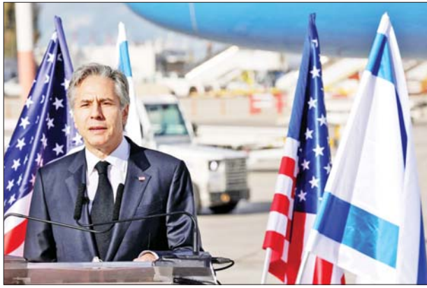
ပူးပေါင်းပါဝင်မှုကို ရယူသွားမည်ဖြစ်ကြောင်း ဘလင်ကန်က ဆိုသည်။ ဟားမတ်စ်စစ်သွေးကြွအဖွဲ့က အစွရေးနိုင်ငံကို ကြီးမားသော

ပဋိပက္ခ မပြန်ပွားစေရန်အတွက် အာရပ်ခေါင်းဆောင်များကို တိုက်တွန်းမည်ဖြစ်ပြီး ဟားမတ်စ်အဖွဲ့က ဖမ်းဆီးထားသည့် ဓားစာခံ များ ပြန်လည်လွတ်မြောက်ရေးအတွက် အာရပ်ခေါင်းဆောင်များ၏