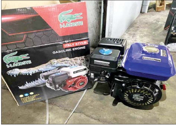
အေးရှားဝေါလ်ကုန်သေတ္တာ စစ်ဆေးရေးစခန်း၌ သိမ်းဆည်းရမိမှု။

ထို့ပြင် အောက်တိုဘာ ၇ ရက်က ရန်ကုန်တိုင်းဒေသကြီးတရားမဝင်ကုန်သွယ်မှုတိုက်ဖျက်ရေးအဖွဲ့၏ စီမံခန့်ခွဲမှုဖြင့် တာဝန်ကျပူးပေါင်းအဖွဲ့က စစ်ဆေးမှုများဆောင်ရွက်ခဲ့ရာ ရန်ကုန်-မန္တလေးအမြန်လမ်း (၀)မိုင်အနီး၌ မြဝတီမြို့မှ ရန်ကုန်မြို့သို့ မောင်းနှင်လာသော ယာဉ်နှစ်စီးပေါ်မှ သွင်းကုန်ကြေညာလွှာတွင် ကြေညာထားခြင်း