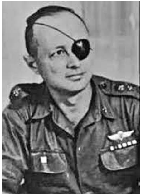
ဒေးဗစ်စခန်းသဘောတူညီချက် ငြိမ်းချမ်းရေးစာချုပ်တွင် အဓိကဗိသုကာ အခန်းကဏ္ဍမှ ပါဝင်ပုံဖော်ပေးသူ အစ္စရေးကာကွယ်ရေးဝန်ကြီး မိုရှေဒါယန်

စာရေးသူတို့ နယ်စပ်အခါကလည်း ကမ္ဘာ့ ခေတ်ပြိုင်ခေါင်းဆောင်များဖြစ်ကြသည့် အမေရိကန် သမ္မတ ရီဂင်၊ အစ္စရေးဝန်ကြီးချုပ် ဘီဂင်၊ ရုရှားယား၊ အေရီယယ်ရှာရွန်၊ ကာကွယ်ရေးဝန်ကြီး မိုရှေဒါယန်နှင့် အီဇာဂိုဏ်းမင်းစသော သဘောထား တင်းမာသည့် ရှေးရိုးစွဲ ကွန်ဆာဗေးတစ်ဝါဒီ ခေါင်းဆောင်များနှင့် တစ်ချက်ထိလျှင် နှစ်ချက်ပြန် ပြီး လက်တုံ့ပြန် တိုက်ခိုက်တတ်သည့် စစ်ခေါင်းဆောင်များကို ပို၍သဘောကျပါသည်။