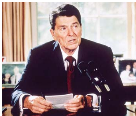
သဘောထားတင်းမာသည့် ရှေးရိုးစွဲ ကွန်ဆာဗေးတစ်ဝါဒီတစ်ဦးဖြစ်သည့် အမေရိကန်သမ္မတ ရီဂင်

၁၉၈၂ ခုနှစ် ဇွန်လ ၃ ရက်နေ့တွင် ဗြိတိန်နိုင်ငံ ဆိုင်ရာ အစ္စရေးသံအမတ်ကြီး ရှလိုမိုအာဂျေကို လက်နက်ကိုင်တစ်စုက ပစ်ခတ်လုပ်ကြံခဲ့ရာမှ ဒဏ်ရာအပြင်းအထန်ရရှိခဲ့မှုအပေါ် အစ္စရေးက