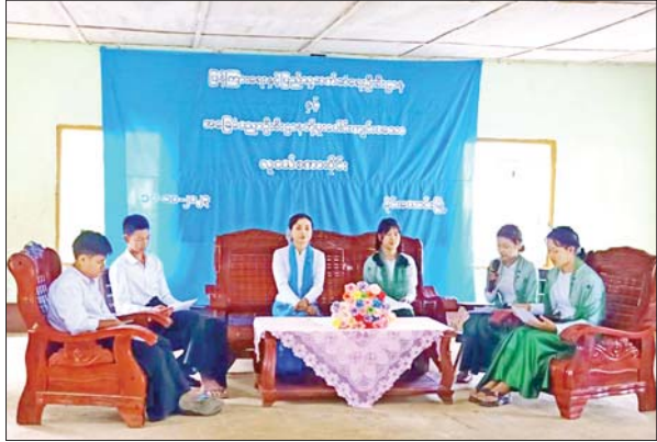
မိုင်းယောင်းမြို့နယ်

ရှမ်းပြည်နယ်(အရှေ့ပိုင်း) မိုင်းယောင်းမြို့နယ်တွင် လူငယ်များ ဗလငါးတန်နှင့် ပြည့်စုံစေရန်နှင့် အသိပညာ ဗဟုသုတဖွံ့ဖြိုးတိုးတက်စေရန် လူငယ်ရေးရာ စကားဝိုင်းကို အောက်တိုဘာ ၁၀ ရက် နံနက် ၉ နာရီက အလက (တပ်တွင်း)၌ ကျင်းပခဲ့ကြောင်း သိရသည်။