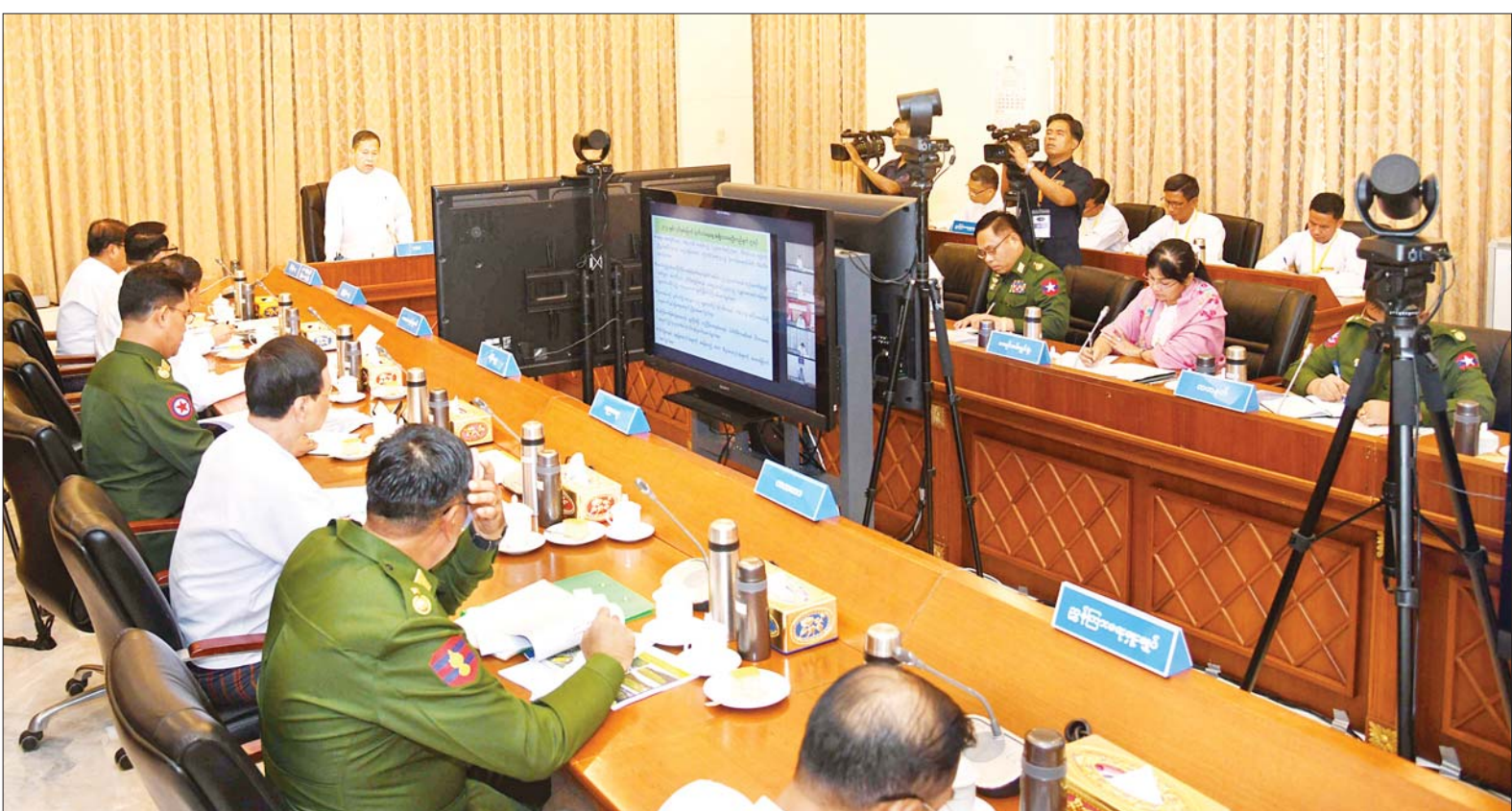
နိုင်ငံတော်စီမံအုပ်ချုပ်ရေးကောင်စီဒုတိယဥက္ကဋ္ဌ ဒုတိယဝန်ကြီးချုပ် ဒုတိယဗိုလ်ချုပ်မှူးကြီးစိုးဝင်း ၂၀၂၄ ခုနှစ် (၇၆) နှစ်မြောက် လွတ်လပ်ရေးနေ့ကျင်းပရေး ဗဟိုကော်မတီ ပထမအကြိမ် ညှိနှိုင်းအစည်းအဝေးတွင် အမှာစကားပြောကြားစဉ်။

နေပြည်တော် အောက်တိုဘာ ၁၀ ၂၀၂၄ ခုနှစ် (၇၆) နှစ်မြောက် လွတ်လပ်ရေးနေ့ ကျင်းပရေး ဗဟိုကော်မတီ ပထမအကြိမ် ညှိနှိုင်းအစည်းအဝေးကို ယနေ့ မွန်းလွဲ ၂ နာရီတွင် နေပြည်တော်ရှိ နိုင်ငံတော် စီမံအုပ်ချုပ်ရေး ကောင်စီဥက္ကဋ္ဌရုံး အစည်းအဝေး ခန်းမ၌ကျင်းပရာ ၂၀၂၄ ခုနှစ် (၇၆)နှစ်မြောက် လွတ်လပ်ရေးနေ့ ကျင်းပရေး ဗဟိုကော်မတီဥက္ကဋ္ဌ နိုင်ငံတော်စီမံအုပ်ချုပ်ရေးကောင်စီ ဒုတိယဥက္ကဋ္ဌ ဒုတိယဝန်ကြီးချုပ် ဒုတိယဗိုလ်ချုပ်မှူးကြီး စိုးဝင်း တက်ရောက် အမှာစကား ပြောကြားသည်။ တက်ရောက် အစည်းအဝေးသို့ ဗဟိုကော်မတီ ဝင် ပြည်ထောင်စုဝန်ကြီးများ၊ နေပြည်တော်ကောင်စီ ဥက္ကဋ္ဌ၊ နေပြည်တော် တိုင်းစစ်ဌာနချုပ် တိုင်းမှူး၊ ဒုတိယဝန်ကြီးများ၊ ကာကွယ်ရေးဦးစီးချုပ်ရုံး (ကြည်း) မှ တပ်မတော်အရာရှိကြီးများနှင့် စာမျက်နှာ ၃ ကော်လံ ၁ သို့