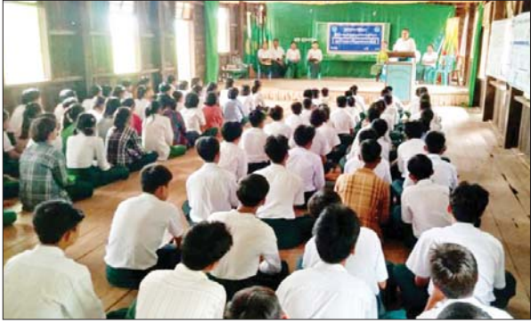
ဇီးကုန်းမြို့နယ်

ပဲခူးတိုင်းဒေသကြီး နတ်တလင်းခရိုင် ဇီးကုန်းမြို့နယ် ပြန်ကြားရေးနှင့် ပြည်သူ့ဆက်ဆံရေးဦးစီးဌာနမှ လူမှုဝန်ထမ်းဦးစီးဌာနနှင့် စားသုံးသူရေးရာဦးစီးဌာနတို့ပူးပေါင်း၍ လူငယ်စကားဝိုင်းအသိပညာပေး ဟောပြောပွဲကို အောက်တိုဘာ ၁၀ ရက် နံနက် ၉ နာရီခွဲက သစ်နဖားကျေးရွာ အခြေခံပညာအလယ်တန်းကျောင်း ခန်းမဆောင်၌ ပြုလုပ်သည်။