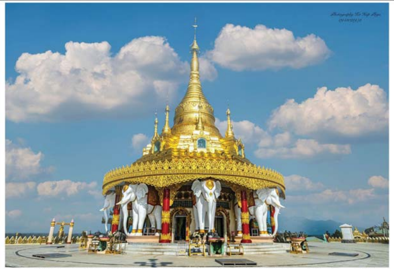
ကချင်ပြည်နယ်၊ ဝိုင်းမော်မြို့နယ်ရှိ ရွှေမိုးတောင်စေတီတော်မြတ်ကြီး လုံးတော်ပြည့် ရွှေသင်္ကန်း ပြန်လည်ကပ်လျှူပူဇော်နိုင်ရေး ပါဝင်လှူဒါန်းနိုင်

ကချင်ပြည်နယ်၊ မြစ်ကြီးနားခရိုင်၊ ဝိုင်းမော်မြို့နယ်၊ ဝိုင်းမော်ကျေးရွာတွင် ကိန်းဝပ်တည်ရှိသည့် ရဟန္တာတစ်ထောင် ရှင်ပင်မြတ်စွာ ဆုတောင်းပြည့်စေတီတော်မြတ်ကြီးကို မြစ်ကြီးနားမြို့ မေဗုရက္ခိတ ဝန်းသိုကျောင်းတိုက်ဆရာတော် နိုင်ငံတော်ဩဝါဒါစရိယ ဘဒ္ဒန္တ သီလဝံသ (ပျံလွန်)၏ ဦးဆောင် ဩဝါဒပြုမှုဖြင့် (၂၀၁၄) ခုနှစ်တွင် မြေသန့်မင်္ဂလာ အခမ်းအနားပြုလုပ်၍ စတင်ခဲ့ရာ နိုင်ငံတော်စီမံအုပ်ချုပ်ရေးကောင်စီ ဥက္ကဋ္ဌ ၊ နိုင်ငံတော်ဝန်ကြီးချုပ်၊ တပ်မတော်ကာကွယ်ရေးဦးစီးချုပ် ဗိုလ်ချုပ်မှူးကြီး မင်းအောင်လှိုင် အမှူးပြုသော တပ်မတော် ( ကြည်း ၊ ရေ ၊ လေ) မိသားစုများ ပြည်နယ်အစိုးရအဖွဲ့၊ မြစ်ကြီးနားမြို့နယ်၊ ဝိုင်းမော်မြို့နယ် နှင့် ရပ်ဝေးရပ်နီးမှ စေတနာရှင် အလှူရှင်များ၏ ပါဝင်လှူဒါန်းမှုဖြင့် (၁၉-၉-၂၀၁၈)ရက်နေ့၌ ရွှေထီးတော်တင်လှူပူဇော် တည်ထား ကိုးကွယ်ခဲ့ပါသည်။ ရွှေထီးတော် တင်လှူချိန်တွင် စေတီတော်ကြီးကို လုံးတော်ပြည့် ရွှေသင်္ကန်း၊ ရွှေစင်၊ ရွှေသင်္ကန်း တော်များ ကပ်လှူပူဇော်နိုင်ခဲ့ပါသည်။