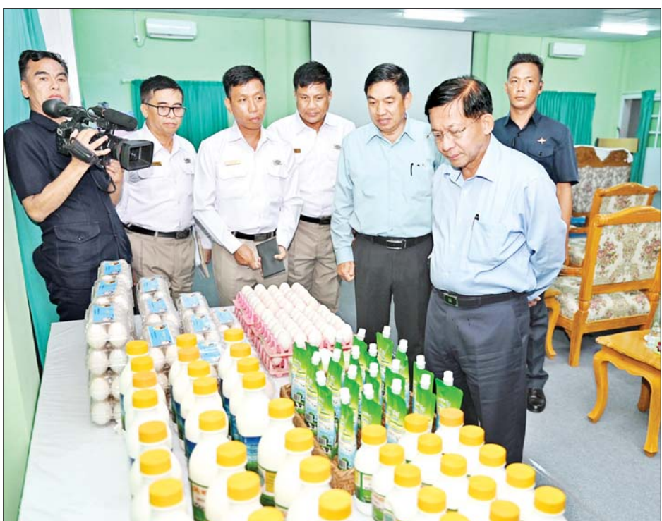
နိုင်ငံတော်စီမံအုပ်ချုပ်ရေးကောင်စီဥက္ကဋ္ဌ နိုင်ငံတော်ဝန်ကြီးချုပ် ဗိုလ်ချုပ်မှူးကြီးမင်းအောင်လှိုင် သီလဝါဘက်စုံစိုက်ပျိုးမွေးမြူရေးဇုန်မှ ထွက်ရှိသည့် ကြက်ဥ၊ ဘဲဥ၊ နို့ထွက်ပစ္စည်းများ ခင်းကျင်းပြသ ထားမှုကို ကြည့်ရှုစဉ်။

ဇုန်များ၌ အစာစပ်လုပ်ငန်းနှင့် အစာတောင့်စက်များ ထုတ်လုပ် လျက်ရှိမှု၊ နို့ထွက်ပစ္စည်းများ ထုတ်လုပ် ရောင်းချလျက်ရှိမှု အခြေအနေများ၊ မွေးမြူရေး လုပ်ငန်း ဖွံ့ဖြိုးတိုးတက်ရေး အတွက် ဘိုးဘွားမျိုးရင်း ကြက်၊ ဝက် GP Farm များ တည်ထောင် နိုင်ရေး ဆောင်ရွက်လျက်ရှိမှု အခြေအနေများ၊ စိုက်ပျိုးမွေးမြူ ရေးဆိုင်ရာများနှင့် ပတ်သက်၍ ပြည်ပနိုင်ငံများသို့ လေ့လာရေး ခရီးစဉ်များ သွားရောက်၍ ၎င်းတို့ ၏ လုပ်ငန်းဆောင်ရွက်မှုအဆင့် ဆင့်ကို လေ့လာခဲ့မှုနှင့် မိမိတို့ နိုင်ငံနှင့်ကိုက်ညီသည့် စိုက်ပျိုး မွေးမြူရေးနည်းစနစ်များ၊ နည်း ပညာများနှင့် လူ့စွမ်းအားအရင်း အမြစ် လိုအပ်ချက်များကို သုံးသပ် တွေ့ရှိခဲ့မှု အခြေအနေများ၊ ပြည်ပနိုင်ငံများနှင့် မိမိတို့နိုင်ငံ ၏ ပြောင်းစိုက်ပျိုးထုတ်လုပ်မှု နှိုင်းယှဉ်တင်ပြချက်များ၊ စိုက်ပျိုး ရေးနှင့် မွေးမြူရေးလုပ်ငန်းများ ဆက်လက် တိုးချဲ့ဆောင်ရွက် သွားနိုင်ရေး စီမံဆောင်ရွက်လျက် ရှိသည့်အခြေအနေများ၊ ရန်ကုန် တိုင်းဒေသကြီးအတွင်း ခရိုင် အလိုက် မြေယာအသုံးချမှုနှင့် စိုက်ပျိုးမွေးမြူရေးလုပ်ငန်းများ ဆောင်ရွက်ထားရှိမှု အခြေအနေ များ၊ တိုင်းဒေသကြီးအတွင်း