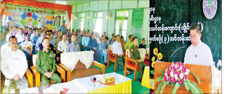
ကယားပြည်နယ်ဝန်ကြီးချုပ် ဦးဇော်မျိုးတင် အမှာစကားပြောကြားစဉ်။

နေပြည်တော် အောက်တိုဘာ ၆ နယ်စပ်ရေးရာဝန်ကြီးဌာန ပညာရေးနှင့် လေ့ကျင့်ရေးဦးစီး ဌာန ကွပ်ကဲမှုအောက်ရှိ အမျိုးသမီး အိမ်တွင်းမှု သက်မွေးလုပ်ငန်း ပညာသင်တန်းကျောင်း ၂၄ ကျောင်းတို့၌ အဆင့်မြင့်အိမ်တွင်း မှု စက်ချုပ်သင်တန်း၊ ရိုးရာ ဂျပန်စားသုံးပစ္စည်း၊ အခြေခံလက် ရက်ကန်းသင်တန်း၊ သင်တန်းဆင်းပွဲ များအား ယနေ့နံနက်ပိုင်းတွင် ကျင်းပခဲ့ရာ လွိုင်ကော်မြို့ သင်တန်း ကျောင်းတွင် ကယားပြည်နယ် ဝန်ကြီးချုပ် ဦးဇော်မျိုးတင်၊ ဘားအံမြို့ သင်တန်းကျောင်းတွင် ကရင်ပြည်နယ် ဝန်ကြီးချုပ် ဦးစောမြင့်ဦး၊ မုဒုံမြို့ သင်တန်း ကျောင်းတွင် မွန်ပြည်နယ် ဝန်ကြီးချုပ် ဦးအောင်ကြည်သိန်း၊ ပုသိမ်မြို့ သင်တန်းကျောင်း