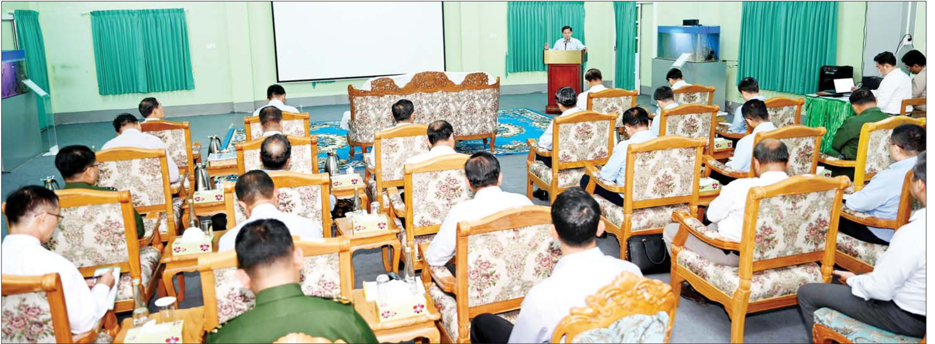
နိုင်ငံတော်စီမံအုပ်ချုပ်ရေးကောင်စီဥက္ကဋ္ဌ နိုင်ငံတော်ဝန်ကြီးချုပ် ဗိုလ်ချုပ်မှူးကြီး မင်းအောင်လှိုင် ရန်ကုန်တိုင်းဒေသကြီးအတွင်း စိုက်ပျိုးမွေးမြူရေးလုပ်ငန်းများ အကောင်အထည်ဖော်ဆောင်ရွက်နေမှု အခြေအနေများနှင့်ပတ်သက်၍ အမှာစကားပြောကြားစဉ်။

စာမျက်နှာ ၅ မှ ရန်ကုန်တိုင်းဒေသကြီးအတွင်း ရှိ လူဦးရေ၏ တစ်နေ့တာပျမ်းမျှ အသား၊ ငါး စားသုံးမှုလိုအပ်ချက် ပမာဏကိုတွက်ချက်၍ အတတ် နိုင်ဆုံး ဖြည့်ဆည်းပေးနိုင်အောင် မွေးမြူ ထုတ်လုပ်သွားရမည် ဖြစ်ကြောင်း၊ ဥစားကြက်၊ ဘဲ မွေးမြူရေးနှင့်ပတ်သက်၍ ဥထွက် ရှိမှုပမာဏ၊ ဥသည့် အချိန်ကာလ တို့ကို စနစ်တကျတွက်ချက် ချိန်ညှိ၍ အသုတ်လိုက် မွေးမြူ သည့်စနစ်ဖြင့် စဉ်ဆက်ပြတ်မှု မရှိ စေရေး ဆောင်ရွက်ကြရမည် ဖြစ်ကြောင်း၊ အလားတူ အခြား မွေးမြူရေး လုပ်ငန်းများတွင် လည်း စဉ်ဆက်မပြတ် မွေးမြူမှု ဖြစ်စေရေး တွက်ချက်ဆောင်ရွက် ကြရန်လိုကြောင်း၊ အသားစား နွားများကို အောင်မြင်ဖြစ်ထွန်း အောင် မွေးမြူရန်လိုပြီး မွေးမြူ ရေးနွား၊ စပ်မျိုးနွားနှင့် ဒေသနွား များကို သုတေသနပြုဆောင်ရွက် ကာ အထွက်နှုန်းကောင်းမွန်သည့် နွားမျိုးများရရှိရေး ဆောင်ရွက်ရန် လိုကြောင်း၊ နွားစာမြက်များ စိုက်ပျိုးရာတွင် စဉ်ဆက်မပြတ် ထုတ်ယူအသုံးပြုနိုင်ရေး စနစ် ကျနသည့် ရိတ်သိမ်းမှုစနစ်ရှိ ရန်နှင့် နွားချေးများကိုလည်း မြေဩဇာအဖြစ် ပြန်လည်သုံးစွဲ သွားရန်လိုကြောင်း။