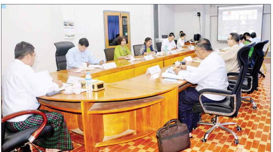
ပတ်သက်သည့် ဈေးကွက်မြှင့်တင်ရေး ဆွေးနွေးပွဲ အောင်မြင်စွာကျင်းပနိုင်ရေး ပူးပေါင်းဆောင်ရွက်ပေး များကို ကျင်းပပြုလုပ်သွားမည်ဖြစ်ကြောင်း၊ ပြပွဲ ကြရန် ပြောကြားသည်။ သတင်းစဉ်

အသင်းနှင့် ညီနောင်အသင်းအဖွဲ့များမှ ကိုယ်စား လှယ်များ တက်ရောက်ကြသည်။ အစည်းအဝေးတွင် ဒုတိယဝန်ကြီးက တရုတ် ပြည်သူ့သမ္မတနိုင်ငံ မဲခေါင်-လန်ချန်း ဒေသခွဲ စီးပွားရေးနှင့် ကုန်သွယ်မှုဖွံ့ဖြိုးတိုးတက်ရေးစင်တာ နှင့် ပူးပေါင်း၍ မြန်မာနိုင်ငံမှ သစ်သီးဝလံများအား တရုတ်နိုင်ငံဈေးကွက်သို့ ပိုမိုတင်ပို့ရောင်းချနိုင်မည့် အကျိုးကျေးဇူးရရှိမည်ဖြစ်ကြောင်း၊ ပြပွဲသို့ မြန်မာ နိုင်ငံမှထွက်ရှိသောထောပတ်၊ နာနတ်၊ မက္ကဒေးမီးယား၊ ကျွဲကော၊ ဖရသီး၊ သခွားသီး၊ သရက်သီး၊ မင်းကွတ် သီး၊ ကြက်မောက်သီး၊ ခူးရင်းသီး၊ ပင်မှည့်သီး၊ သစ်ကြားသီးများအပြင် ဝဥ၊ လက်ဖက်၊ ကော်ဖီနှင့် ရှောက်ကောပါကောများပါ ထည့်သွင်းပြသနိုင်ရန် စီစဉ်ဆောင်ရွက်သွားမည်ဖြစ်ကြောင်း၊ မဲခေါင်- လန်ချန်း သစ်သီးပွဲတော် ပထမနေ့တွင် မြန်မာနိုင်ငံ ၏ အလားအလာရှိသည့် သစ်သီးဝလံများနှင့်