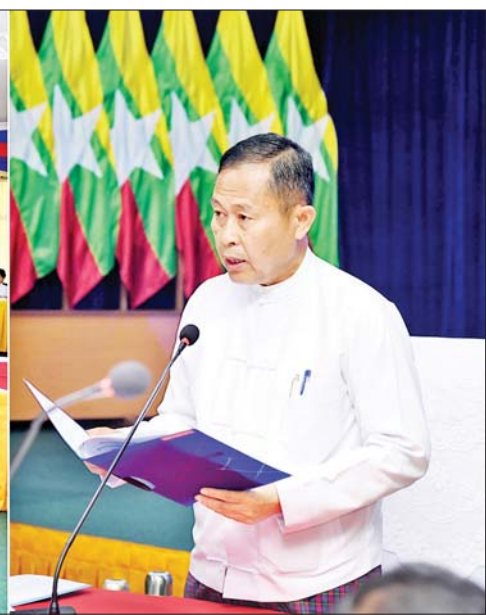
နိုင်ငံတော်စီမံအုပ်ချုပ်ရေးကောင်စီ ဒုတိယဥက္ကဋ္ဌ ဒုတိယဝန်ကြီးချုပ် ဒုတိယဗိုလ်ချုပ်မှူးကြီး စိုးဝင်း National Database စနစ်တည်ဆောက်ရေး ဦးဆောင်ကော်မတီ ပထမအကြိမ် လုပ်ငန်းညှိနှိုင်းအစည်းအဝေးတွင် အမှာစကားပြောကြားစဉ်။