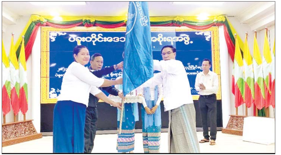
ဦးမြင့်ခိုင်က ပြင်ပွဲဝင်ရောက်ယှဉ်ပြိုင်မည့် အခြေ လိုအပ်သည်များ ဖြည့်စွက်လမ်းညွှန်မှာကြားခဲ့ အနေနှင့် စုစည်းလေ့ကျင့်နေမှု အခြေအနေများအား ကြောင်း သိရသည်။ ရှင်းလင်းတင်ပြခဲ့ရာ တိုင်းဒေသကြီးဝန်ကြီးချုပ်က တိုင်းဒေသကြီး(ပြန်/ဆက်)

ထို့နောက် တိုင်းဒေသကြီးဝန်ကြီးချုပ်က ပဲခူးတိုင်းဒေသကြီးကိုယ်စားပြုရိုးရာခြင်းလုံးအသင်း အား အောင်နိုင်ရေးအလံနှင့် ထောက်ပံ့ငွေကျပ် ၂၂ သိန်း ထောက်ပံ့ပေးအပ်ခဲ့ပြီး ပဲခူးတိုင်းဒေသကြီး အားကစားနှင့် ကာယပညာဦးစီးဌာန ညွှန်ကြားရေးမှူး