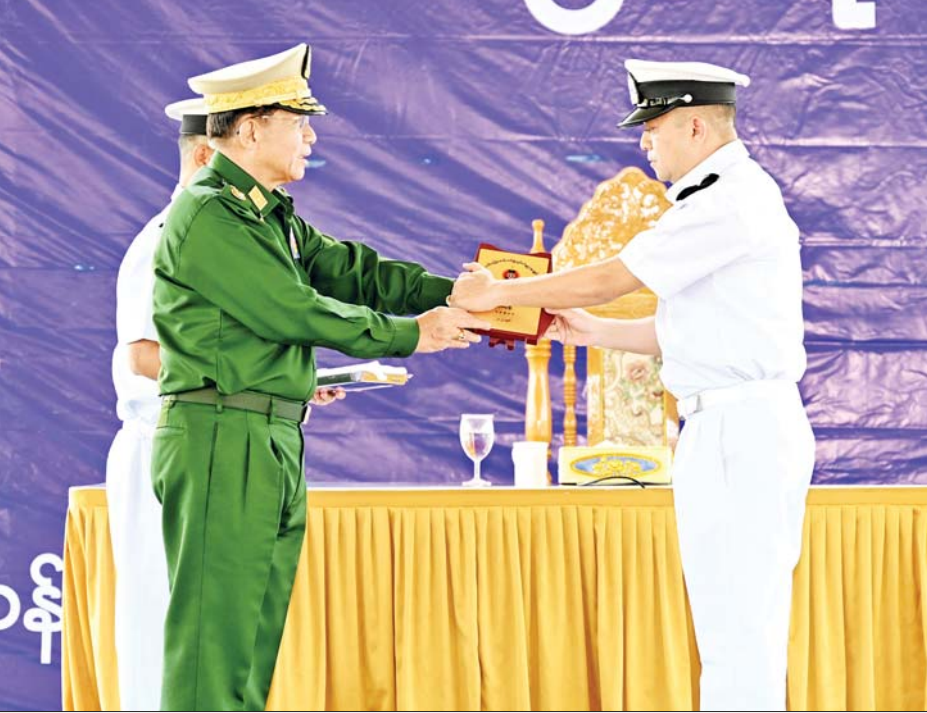
နိုင်ငံတော်စီမံအုပ်ချုပ်ရေးကောင်စီဥက္ကဋ္ဌ တပ်မတော်ကာကွယ်ရေးဦးစီးချုပ် ဗိုလ်ချုပ်မှူးကြီး မင်းအောင်လှိုင် ကမ်းခြေစောင့်တပ်ဖွဲ့ တာဝန်ထမ်းဆောင်မှု နှစ်နှစ်တာကာလအတွင်း ပင်လယ်ပြင် တရားဥပဒေစိုးမိုးရေးလုပ်ငန်းတာဝန်များနှင့် ရှာဖွေကယ်ဆယ်ရေးတာဝန်များကို စွမ်းစွမ်းတစ် ထမ်းဆောင်နိုင်ခဲ့သည့် အရာရှိတစ်ဦးအား ဂုဏ်ပြုဆုပေးအပ်ချီးမြှင့်စဉ်။

ဦးစွာ နိုင်ငံတော်စီမံအုပ်ချုပ်ရေးကောင်စီဥက္ကဋ္ဌ တပ်မတော်ကာကွယ်ရေးဦးစီးချုပ်က မြန်မာနိုင်ငံ ကမ်းခြေစောင့်တပ်ဖွဲ့ ဖွဲ့စည်းခြင်း (၂)နှစ်မြောက် နှစ်ပတ်လည်နေ့ အထိမ်းအမှတ်တွေ့ဆုံပွဲ အရာရှိ၊ စစ်သည်များအား အမှာစကားပြောကြားရာတွင် ယနေ့သည် ကမ်းခြေစောင့်တပ်ဖွဲ့၏ (၂)နှစ်မြောက် နှစ်ပတ်လည်နေ့ အခမ်းအနားပင်ဖြစ်ပြီး မိမိ ကိုယ်တိုင် ဖွဲ့စည်းဖွင့်လှစ်ပေးခဲ့သည့် ပထမဦးဆုံး သောနိုင်ငံ၏ ကမ်းခြေစောင့်တပ်ဖွဲ့ဖြစ်ကြောင်း၊ နှစ်နှစ်တာကာလအတွင်း တပ်ဖွဲ့၏ ရုပ်ပိုင်းဆိုင်ရာနှင့် ဖွဲ့စည်းပုံပိုင်းဆိုင်ရာများတွင် တတ်နိုင်သမျှပြည့်စုံ အောင် နိုင်ငံတော်မှ ဖြည့်ဆည်းဆောင်ရွက်ပေးခဲ့ပြီး ဆက်လက်၍လည်း ဖြည့်ဆည်းပေးသွားမည်ဖြစ် ကြောင်း၊ မိမိတို့နိုင်ငံသည် ကျယ်ဝန်းသည့် ပိုင်နက် ပင်လယ်ပြင်နှင့် ရှည်လျားသည့် ကမ်းရိုးတန်းပိုင်ဆိုင် သော ကမ်းရိုးတန်းနိုင်ငံတစ်နိုင်ငံဖြစ်ပြီး ကမ်းရိုးတန်း တစ်လျှောက်တွင်လည်း ကျွန်းပေါင်းများစွာရှိကာ သဘာဝကပေးအပ်သည့် အရင်းအမြစ်များ၊ စီးပွားရေး အခွင့်အလမ်းများ များစွာရှိကြောင်း၊ ထို့ကြောင့် နိုင်ငံတော်၏ ပိုင်နက်ပင်လယ်ပြင်နှင့် ကမ်းရိုးတန်းကို