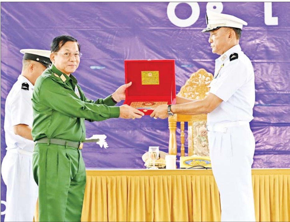
နိုင်ငံတော်စီမံအုပ်ချုပ်ရေးကောင်စီဥက္ကဋ္ဌ တပ်မတော်ကာကွယ်ရေးဦးစီးချုပ် ဗိုလ်ချုပ်မှူးကြီးမင်းအောင်လှိုင် ကမ်းခြေစောင့်တပ်ဖွဲ့တာဝန်ထမ်းဆောင်မှုဂုဏ်ပြုတံဆိပ်ကို ကမ်းခြေစောင့်တပ်ဖွဲ့ ညွှန်ကြားရေးမှူးချုပ် ဗိုလ်ချုပ်ကိုကိုကျော်အား ပေးအပ်စဉ်။

တပ်မတော်သားများ၊ မြန်မာနိုင်ငံရဲတပ်ဖွဲ့ဝင်များ၊ ကမ်းခြေစောင့်တပ်ဖွဲ့ဝင်များအနေဖြင့် နိုင်ငံတော်နှင့် တပ်မတော်ကို ကာကွယ်မည်၊ နိုင်ငံသူ၊ နိုင်ငံသားတို့၏ အသက်အိုးအိမ်စည်းစိမ်ကို ကာကွယ်မည်ဟူသည့် နဂိုအရင်းခံစိတ်ဓာတ်ကောင်းဖြင့် ဝင်ရောက်အမှုထမ်းခဲ့သူများဖြစ်ကြောင်း၊ မိမိတို့ တစ်ဦးတစ်ယောက်ချင်းစီ၏ ရှိရင်းစွဲစိတ်ဓာတ်ကောင်းများကို ဆက်လက်ထိန်းသိမ်း၍ မိမိတို့ကို ပေးအပ်လာသည့်တာဝန်များကို ကျေပွန်စွာ ထမ်းဆောင်ရန်လိုကြောင်း၊ စိတ်ဓာတ်ကောင်းမွန်မှသာလျှင် စည်းကမ်းကောင်းမွန်မည်ဖြစ်ပြီး စွမ်းရည်ထက်မြက်သည့် တပ်ဖွဲ့တစ်ရပ်ဖြစ်စေရေးအတွက်