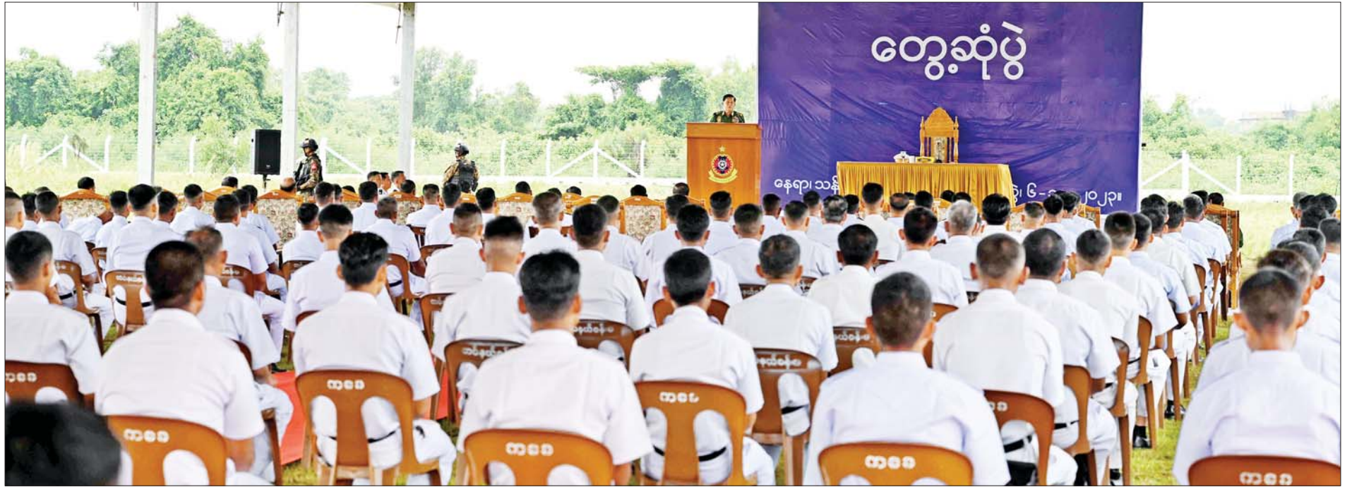
နိုင်ငံတော်စီမံအုပ်ချုပ်ရေးကောင်စီဥက္ကဋ္ဌ တပ်မတော်ကာကွယ်ရေးဦးစီးချုပ် ဗိုလ်ချုပ်မှူးကြီးမင်းအောင်လှိုင် မြန်မာနိုင်ငံကမ်းခြေစောင့်တပ်ဖွဲ့ ဖွဲ့စည်းခြင်း (၂)နှစ်မြောက် နှစ်ပတ်လည်တွေ့ဆုံပွဲအခမ်းအနားတွင် ဂုဏ်ပြုအမှာစကားပြောကြားစဉ်။