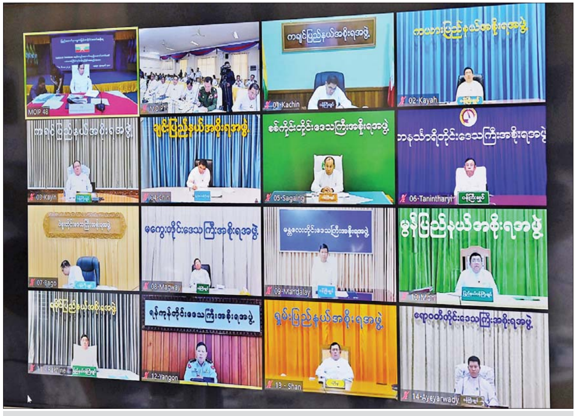
National Database စနစ်တည်ဆောက်ရေးဦးဆောင်ကော်မတီ ပထမအကြိမ် လုပ်ငန်းညှိနှိုင်းအစည်းအဝေးသို့ တိုင်းဒေသကြီးနှင့် ပြည်နယ်ဝန်ကြီးချုပ်များက ဗီဒီယိုကွန်ဖရင့်စနစ်ဖြင့် တက်ရောက်ကြစဉ်။

လုပ်ငန်းတာဝန်များ National Database စနစ် တည်ဆောက်ရေးဦးဆောင်ကော်မတီ၏ လုပ်ငန်းတာဝန်များသည် e-ID စနစ် အကောင်အထည်ဖော် ဆောင်ရွက်ရန်