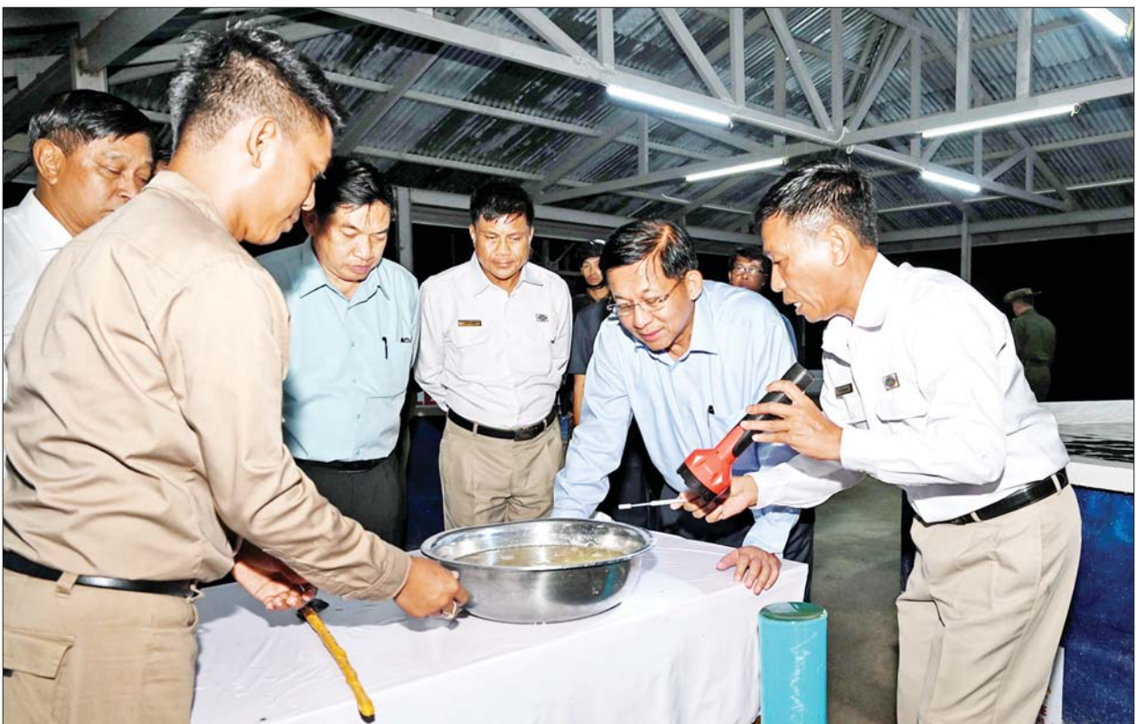
နိုင်ငံတော်စီမံအုပ်ချုပ်ရေးကောင်စီဥက္ကဋ္ဌ နိုင်ငံတော်ဝန်ကြီးချုပ် ဗိုလ်ချုပ်မှူးကြီး မင်းအောင်လှိုင် သီလဝါဘက်စိုက်ပျိုးမွေးမြူရေး ဇုန်တွင် မွေးမြူထားရှိသည့် ငါးအမျိုးအစားနမူနာပြသထားရှိမှုများကို ကြည့်ရှုစဉ်။

သည့် စိုက်ပျိုးမွေးမြူရေးဆိုင်ရာ အတွေ့အကြုံများနှင့် နည်းစနစ် များကို အသုံးချ၍လည်း မိမိတို့ နိုင်ငံ၌ စိုက်ပျိုးမွေးမြူရေးလုပ်ငန်း များ ဖွံ့ဖြိုးတိုးတက်အောင် ကြိုးပမ်းဆောင်ရွက်သွားကြရန် တိုက်တွန်း မှာကြားလိုကြောင်း ပြောကြားသည်။