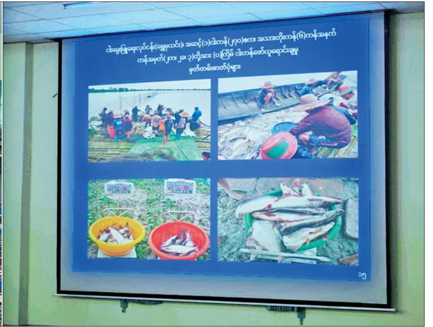
နိုင်ငံတော်စီမံအုပ်ချုပ်ရေးကောင်စီဥက္ကဋ္ဌ နိုင်ငံတော်ဝန်ကြီးချုပ် ဗိုလ်ချုပ်မှူးကြီးမင်းအောင်လှိုင်အား ရန်ကုန်တိုင်းဒေသကြီးအတွင်း စိုက်ပျိုးမွေးမြူရေးလုပ်ငန်းများ အကောင်အထည်ဖော် ဆောင်ရွက်နေမှု အခြေအနေများကို တာဝန်ရှိသူတစ်ဦးက ရှင်းလင်းတင်ပြစဉ်။