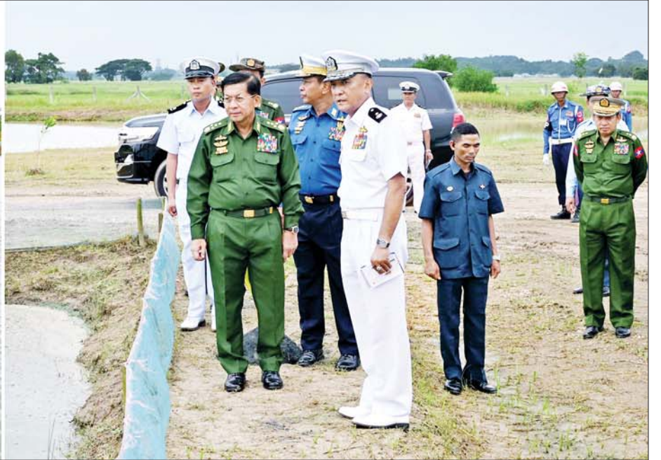
နိုင်ငံတော်စီမံအုပ်ချုပ်ရေးကောင်စီဥက္ကဋ္ဌ တပ်မတော်ကာကွယ်ရေးဦးစီးချုပ် ဗိုလ်ချုပ်မှူးကြီးမင်းအောင်လှိုင် ကမ်းခြေစောင့်တပ်ဖွဲ့ဌာနချုပ်အတွင်း မွေးမြူရေးလုပ်ငန်းများဆောင်ရွက်ထားရှိမှုကို ကြည့်ရှု စစ်ဆေးစဉ်။