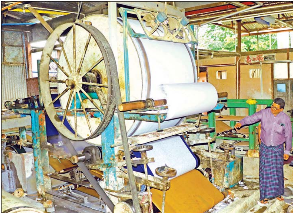
စက္ကူထုတ်လုပ်မှုနှင့်ပတ်သက်၍ လုပ်ငန်းရှင်က ရှင်းလင်းပြောကြားစဉ်။

စက္ကူနှင့်စာအုပ်ထုတ်လုပ်ရေးလုပ်ငန်း အဆိုပါ စက္ကူနှင့်စာအုပ်ထုတ်လုပ်ရေးလုပ်ငန်းကို ၂၀၁၄ ခုနှစ်က စတင်လုပ်ကိုင်ခဲ့ခြင်းဖြစ်ပြီး ဖခင်ဖြစ်သူ တည်ထောင်ခဲ့သည့် စက်မှုလုပ်ငန်းကို အမြတ်တွေ့ခဲ့ခြင်း၊ မန္တလေးမြို့ရှိ စက်မှုဇုန်များသို့ ရောက်ရှိမြင်တွေ့ခဲ့ခြင်း တို့ကြောင့် ဒေသတွင် စက်မှုလုပ်ငန်းရန်ကြီးစားဆောင်ရွက်ခဲ့ခြင်း ဖြစ်ကြောင်း သိရသည်။ ကချင်ပြည်နယ်အတွင်း ဒေသဖွံ့ဖြိုးရေး အထောက်အကူဖြစ်စေရန် ဆောင်ရွက်ခြင်းဖြစ်ကြောင်း၊ အထူးသဖြင့် ပတ်ဝန်းကျင်ထိန်းသိမ်းရေးအတွက်ပါ ရည်ရွယ်ပြီး ဆောင်ရွက်ခဲ့ခြင်း ဖြစ်သည်။ စက္ကူများထုတ်လုပ်ရာတွင် လိုအပ်သည့် ပျော့ဖတ်အတွက် စွန့်ပစ်ပစ္စည်းများကို Recycle နည်းဖြင့် အသုံးပြုပြီး ထုတ်လုပ်ခြင်းဖြစ်ကြောင်း၊ ပြည်သူများ အသုံးပြုပြီး ပြန်လည်အသုံးပြု၍ မရသည့် ပစ္စည်းများကို ပြန်လည်အသုံးပြုနိုင်အောင် ဆောင်ရွက်ခဲ့ခြင်းဖြစ်ကြောင်း တည်ထောင်သူက ပြောပြသည်။ ယင်းလုပ်ငန်း စတင်လည်ပတ်ချိန်တွင် စက္ကူအနေဖြင့် ဘားဖြူ၊ ဘားပြာ အမျိုးအစားဖြစ်သည့် စက္ကူအကြမ်းများ