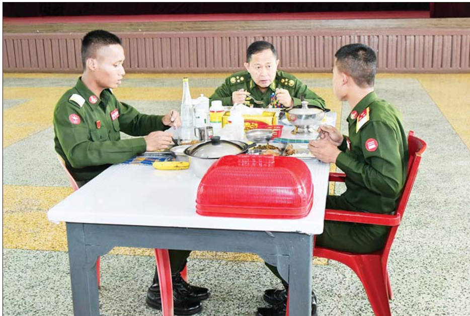
နိုင်ငံတော်စီမံအုပ်ချုပ်ရေးကောင်စီ ဒုတိယဥက္ကဋ္ဌ ဒုတိယတပ်မတော်ကာကွယ်ရေးဦးစီးချုပ် ကာကွယ်ရေးဦးစီးချုပ်(ကြည်း) ဒုတိယဗိုလ်ချုပ်မှူးကြီးစိုးဝင်း တပ်မတော်နည်းပညာတက္ကသိုလ် ဗိုလ်လောင်းသင်တန်းအမှတ်စဉ်(၂၆) သင်တန်းသားဗိုလ်လောင်းများနှင့်အတူ နေ့လယ်စာ အတူတကွ သုံးဆောင်စဉ်။