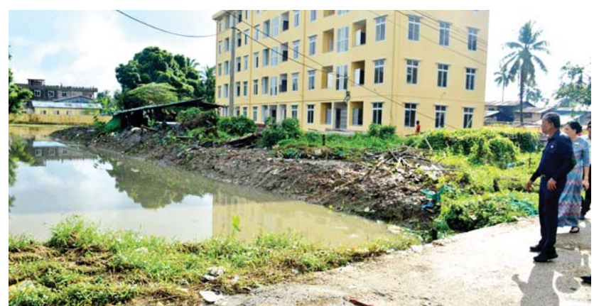
ဝင်းအတွင်း စုပေါင်းသန့်ရှင်းရေးဆောင်ရွက်နေမှု၊ မြောက်ဥက္ကလာပမြို့နယ် ရတနာသီရိဈေး သန့်ရှင်းသာယာသပ်ရပ်ရေးဆောင်ရွက်မှု၊ တောင်ဥက္ကလာပမြို့နယ် ပတ္တမြားဈေး

ထို့နောက် ဒုတိယမြို့တော်ဝန်နှင့် အဖွဲ့သည် မြောက်ဥက္ကလာပ ပြည်သူ့ဆေးရုံကြီး