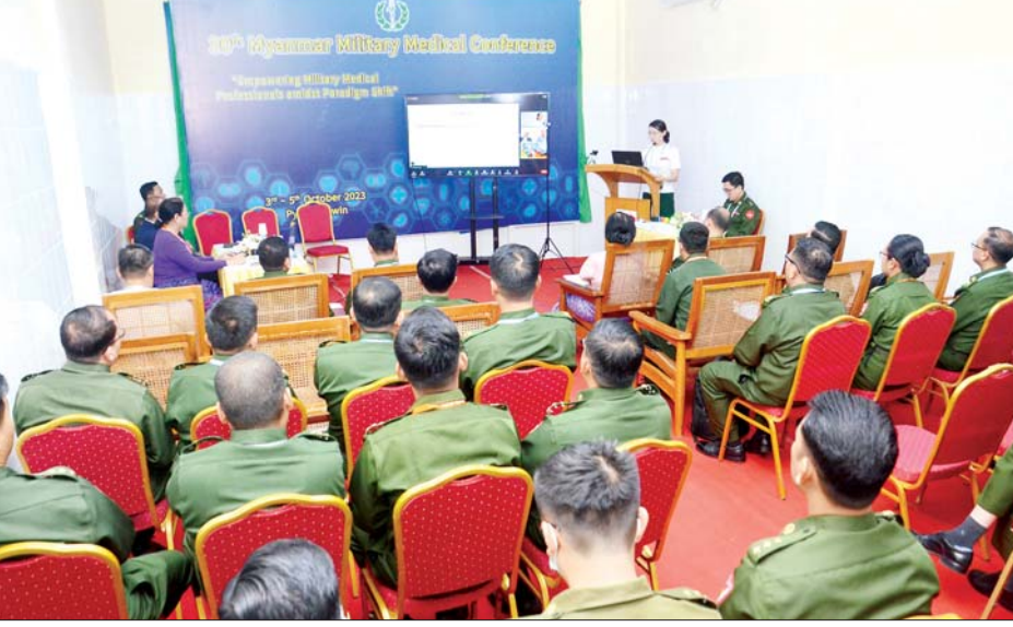
ဆွေးနွေးခဲ့ကြသည်။ ထို့ပြင် သုတေသနစာတမ်းများအဖြစ် သူနာပြု ပညာ၊ မှုခင်းဆေးပညာ၊ ဆေးပညာသင်ကြားရေး၊ ဆေးဝါးဗေဒ၊ အရိုးအထူးကုပညာ၊ ကိုယ်လက်အင်္ဂါ

နေပြည်တော် အောက်တိုဘာ ၄ အကြိမ်(၃၀)မြောက် မြန်မာ့တပ်မတော် ဆေးပညာရပ်ဆိုင်ရာ နီးနှောဖလှယ်ပွဲ ဒုတိယနေ့ကို ယနေ့နံနက်ပိုင်းတွင် ပြင်ဦးလွင်ရှိ အမှတ်(၁) တပ်မတော်ဆေးရုံ(၃တင်-၇၀၀)၊ ဇီဝကခန်းမနှင့် ဓာတ်ရောင်ခြည်နှင့်ကင်ဆာကုသဆောင်၌ ဆက်လက် ကျင်းပရာ တပ်မတော်ဆေးသုတေသနနှင့် ဖွံ့ဖြိုး တိုးတက်ရေးကော်မတီဥက္ကဋ္ဌ ဆေးဝန်ထမ်း ညွှန်ကြားရေးမှူး ဗိုလ်ချုပ်ကိုကိုလွင်၊ တပ်မတော် အရာရှိကြီးများ၊ ပါရဂူများ၊ ဆေးမှူးများ၊ သူနာပြု/ ကျွမ်းကျင်သူ(အရာရှိ)များ၊ သူနာပြု/ကျွမ်းကျင်သူ များ၊ ကျန်းမာရေးဝန်ကြီးဌာနမှ ဆေးပညာရှင်များ၊ နိုင်ငံတကာမှဆေးပညာရှင်များ၊ အငြိမ်းစားအရာရှိ ကြီးများ၊ ဖိတ်ကြားထားသူများနှင့် စိတ်ပါဝင်စားသူ များ တက်ရောက်ကြပြီး Clinicopathological Conference တစ်ခု၊ Special Talk လေးခု၊ Clinical Session နှင့် အခြား Symposium ၁၃ ခုတို့အား