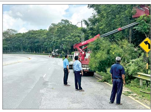
လေလွင့်ဆုံးရှုံးမှုမရှိစေရေး လျှပ်စစ်ဓာတ်တိုင်များနှင့် လျှော့ကျနေသည့် ဓာတ်အားကြိုးများအား စဉ်ဆက်မပြတ် ပြန်လည်ပြုပြင်ပေးလျက်ရှိကြောင်း သိရသည်။

မင်္ဂလာဒုံမြို့နယ် လျှပ်စစ်မန်နေဂျာရုံးအနေဖြင့် ဓာတ်အားကြိုးများနှင့် မလွတ်ကင်းသည့် သစ်ပင်သစ်ကိုင်းများ ခုတ်ထွင်ရှင်းလင်းခြင်းများအပြင် ပြည်သူများ လျှပ်စစ်အန္တရာယ်မရှိစေရေး၊ ဓာတ်အား