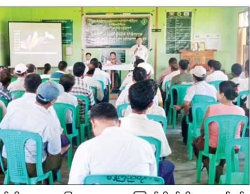
ဦးစွာ စိုက်ပျိုးရေး၊ မွေးမြူရေးနှင့် ဆည်မြောင်းဝန်ကြီးဌာန နေပြည်တော် ဒုတိယတိုင်းဦးစီးမှူးဦးစိုးနိုင်က အယ်လ်နီညိုရာသီဥတုကြောင့် စိုက်ပျိုးရေးလုပ်ငန်းများအပေါ် သက်ရောက်လာမည့် ထိခိုက်နစ်နာမှုများကို အနည်းဆုံးဖြစ်စေရန် ကြိုတင်ပြင်ဆင်ရမည့်

ပြည်ထောင်စုနယ်မြေ နေပြည်တော် ဧမ္မာသီရိမြို့နယ်တွင် အယ်လ်နီညို ရာသီဥတုဖြစ်စဉ်ကြောင့် စိုက်ပျိုးရေးကဏ္ဍတွင် ထိခိုက်ပျက်စီးဆုံးရှုံးမှု လျော့နည်းရေး နည်းပညာပေးဟောပြောပွဲကို ယနေ့မွန်းလွဲပိုင်းက တဲကြီးကုန်းကျေးရွာ SMU ခန်းမ၌ ကျင်းပရာ သက်ဆိုင်ရာဌာနဆိုင်ရာများမှ တာဝန်ရှိသူများ၊ မြို့နယ်ဦးစီးမှူးများနှင့် ဝန်ထမ်းများ၊ ဒေသခံတောင်သူ ၇၂ ဦး တက်ရောက်ကြသည်။