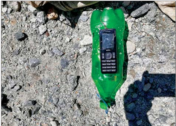
ပဲခူးတိုင်းဒေသကြီး ဖြူးမြို့နယ် ရန်ကုန်-မန္တလေး ရထားလမ်းမကြီး၏ တောကျွန်းအင်းနှင့် ကညွတ်ကွင်းဘူတာအကြား မိုင်တိုင် ၁၂၀/၇-၈ ရှိ တံတားအမှတ် (၁၇၉)အနီးတွင် ဝါယာကြိုးများနှင့် သွယ်တန်းထားသည့် မိုင်းဟုယူဆရသော ဆာလာအိတ်နှင့်ထည့်ထားသည့် ကော်ပိုးနှစ်ပုံးနှင့် ကီးပက်ဖုန်းအား တွေ့ရှိရစဉ်။