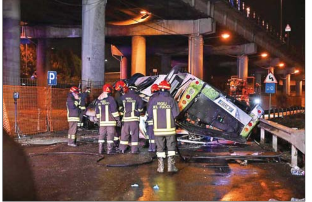
ရေခဲကြီးဌာန တာဝန်ရှိသူ ဒီဘာရီက ပြောကြားသည်။ လက်ရှိအချိန်တွင် အသက်ရှင်ကျန်ရစ်သူ ရှိ၊ မရှိကို တာဝန်ရှိသူများက စစ်ဆေးနေသည်။ မိမိနှင့်အစိုးရအဖွဲ့သည် ကားမီးလောင်မှုအတွင်း သေဆုံးခဲ့သူများ၏ မိသားစုဝင်များနှင့် ထပ်တူထပ်မျှဝမ်းနည်းရကြောင်း ဝန်ကြီးချုပ်ကျော်ဂျီယာ မီလိုနီ ကပြောကြားသည်။ ကိုးကား - စီဂျီတီအင်န်၊ ဘာသာပြန် - စိုးသူရ

ဗင်းနစ် အောက်တိုဘာ ၄ ခရီးသည်များကို တင်ဆောင်လာသည့် ဘတ်စ်ကားတစ်စီးသည် အီတလီနိုင်ငံမြောက်ပိုင်း ဗင်းနစ်မြို့ အနီးရှိ ခုံးကျော်တံတားအောက်သို့ ပြုတ်ကျ၍ မီးလောင်ခဲ့မှုကြောင့် ခရီးသည် ၂၁ ဦး သေဆုံးပြီး ၁၈ ဦး ဒဏ်ရာရရှိခဲ့ကြောင်း တာဝန်ရှိသူများက အောက်တိုဘာ ၄ ရက်တွင် ပြောကြားသည်။ ဘတ်စ်ကားသည် ဦးတည်ရာလမ်းကြောင်းမှ လွဲချော်သွားခဲ့ပြီး ခုံးကျော်တံတားအောက်ရှိ လျှပ်စစ်မီးရထားလမ်းများအနီးသို့ ပြုတ်ကျသွားခဲ့ကာ မီးလောင်ခြင်းဖြစ်သည်။ ယခုဖြစ်စဉ်ကြောင့် မိမိတို့ဝမ်းနည်းရကြောင်း ဗင်းနစ်မြို့တော်ကောင်စီဝင် ရီနာတို ဘိုရာဆိုက စကင်း အီတလီယာ ရုပ်မြင်သံကြားဌာနကို ပြောကြားခဲ့သည်။ အဆိုပါ ဘတ်စ်ကားတွင် ခရီးသည် ၄၀ တင်ဆောင်လာကြောင်း၊ သေဆုံးသူအရေအတွက်မှာ ထပ်မံဖြင့်တက်လာနိုင်ပြီး ဖြစ်စဉ်အတွင်း ဒဏ်ရာရရှိသူများကို ဆေးရုံများတွင်ကုသပေးနေကြောင်း ၎င်းက ထပ်လောင်းပြောကြားသည်။ မီးလောင်မှုကြောင့် ကားအတွင်းမှ ရုပ်အလောင်းများကို မီးသတ်သမားများက ခက်ခက်ခဲခဲထုတ်ယူခဲ့ရကြောင်း ပြည်ထဲ