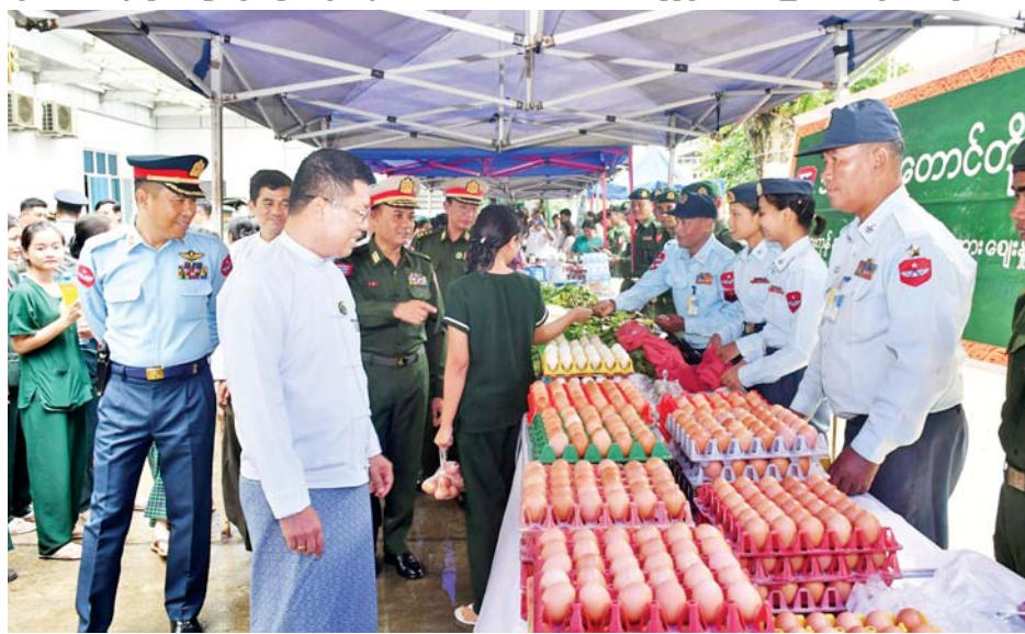
လည်းကောင်း၊ ပုသိမ်မြို့နယ် ဆန်စက်ပိုင်အသင်းနှင့် လျှင် ငွေကျပ် ၂၅၀၀ နှုန်းဖြင့် ရောင်းချပေးနေမှုများအားလည်းကောင်း၊ အနောက်တောင်တိုင်းစစ်ဌာနချုပ်ဆန်ကုန်သည်များအသင်းတို့မှ ဧည့်မထဆန်တစ်ပြည်

ဦးစွာ ပုသိမ်မြို့ ခုတင် (၅၀၀)ပြည်သူ့ဆေးရုံကြီး၌ မြန်မာနိုင်ငံဆီကုန်သည်နှင့် ဆီလုပ်ငန်းရှင်များအသင်း အစီအစဉ်ဖြင့် ရောဂါတိုင်းဒေသကြီးဆီကုန်သည်နှင့် ဆီလုပ်ငန်းရှင်များအသင်း စားသုံးဆီလက်လီအရောင်းဈေးကားဖြင့် ဆီတစ်ပိဿာလျှင် ငွေကျပ် ၄၈၀၀ နှုန်းဖြင့် ရောင်းချပေးနေမှုအား