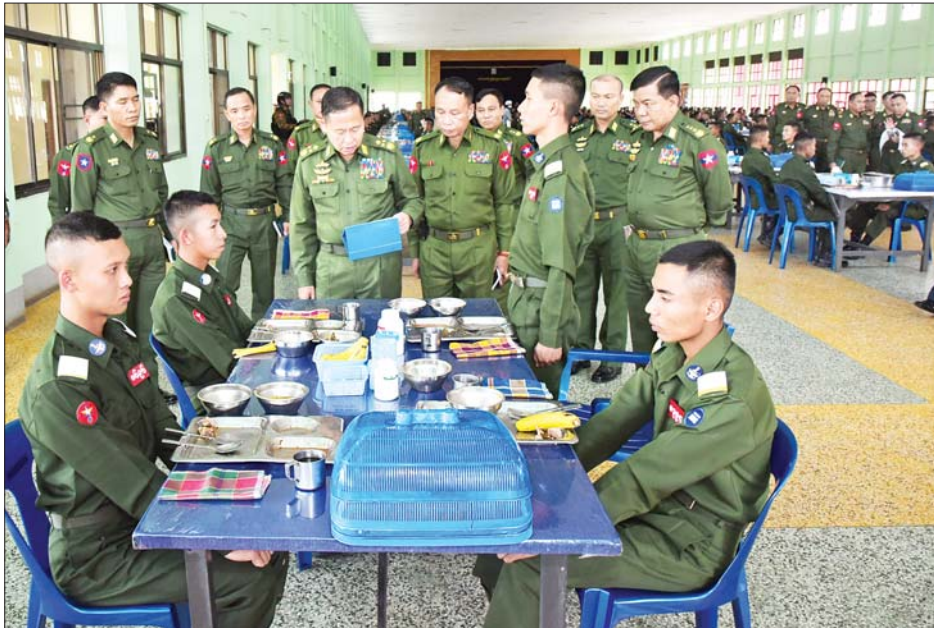
နိုင်ငံတော်စီမံအုပ်ချုပ်ရေးကောင်စီ ဒုတိယဥက္ကဋ္ဌ ဒုတိယတပ်မတော်ကာကွယ်ရေးဦးစီးချုပ် ကာကွယ်ရေးဦးစီးချုပ်(ကြည်း) ဒုတိယဗိုလ်ချုပ်မှူးကြီးစိုးဝင်း တပ်မတော်နည်းပညာတက္ကသိုလ် ဗိုလ်လောင်းသင်တန်းအမှတ်စဉ် (၂၆) သင်တန်းသားဗိုလ်လောင်းများအား ရင်းရင်းနှီးနှီး လိုက်လံ နှုတ်ဆက်စဉ်။

* ရှေ့ဖုံးမှ အဆိုပါ စစ်လက်ရုံးရွေးချယ်ပွဲသို့ နိုင်ငံတော်စီမံအုပ်ချုပ်ရေးကောင်စီ ဒုတိယဥက္ကဋ္ဌ ဒုတိယတပ်မတော်ကာကွယ်ရေး ဦးစီးချုပ် ကာကွယ်ရေးဦးစီးချုပ်(ကြည်း) နှင့်အတူ ညှိနှိုင်းကွပ်ကဲရေးမှူး (ကြည်း၊ ရေ၊ လေ) ဗိုလ်ချုပ်ကြီး