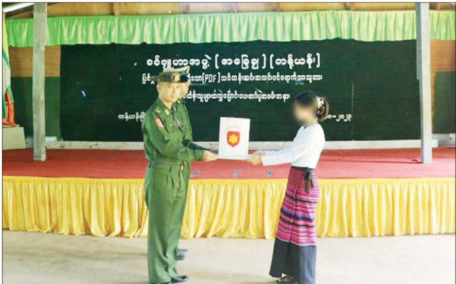
ဘောင်အတွင်းသို့ ပြန်လည်ဝင်ရောက်ရန် ဆန္ဒရှိသူများ ကျန်ရှိနေသေးကြောင်း သိရှိရပြီး ဥပဒေဘောင်အတွင်း ပြန်လည်ဝင်ရောက်လိုသူများအနေဖြင့် နီးစပ်ရာ ခရိုင်၊ မြို့နယ်စီမံအုပ်ချုပ်ရေးအဖွဲ့များ၊ တပ်စခန်းများနှင့် ရဲစခန်းများသို့ အမြန်ဆက်သွယ်သတင်းပေးပို့လာပါက ကြိုဆိုလက်ခံပေးသွားမည် ဖြစ်ကြောင်း သိရသည်။ သတင်းစဉ်

တာဝန်ရှိသူများ၊ ဌာနဆိုင်ရာတာဝန်ရှိသူများ၊ ဥပဒေဘောင်အတွင်း ဝင်ရောက်လာသူနှင့် မိဘအုပ်ထိန်းသူများ တက်ရောက်ကြသည်။ ထောက်ပံ့ငွေများပေးအပ် ဦးစွာ တာဝန်ရှိသူတစ်ဦးက အမှာစကားပြောကြားသည်။ ထို့နောက် ဥပဒေဘောင်အတွင်း ပြန်လည်ဝင်ရောက်ခဲ့သည့် ပြစ်မှုကျူးလွန်ခြင်းမရှိခဲ့သော မန္တလေးတိုင်းဒေသကြီး အမရပူရမြို့နယ်မှ PDF အဖွဲ့ဝင် အမျိုးသမီးတစ်ဦးကို ဝန်ခံကတိလက်မှတ်ရေးထိုးစေကာ ထောက်ပံ့ငွေများပေးအပ်ပြီး ၎င်း၏ မိဘအုပ်ထိန်းသူများထံသို့ လွှဲပြောင်းအပ်နှံပေးသည်။ ထိုသို့ နိုင်ငံတော်စီမံအုပ်ချုပ်ရေးကောင်စီမှ ဥပဒေဘောင်အတွင်း ဝင်ရောက်လာသူများအား ပြန်လည်ကြိုဆိုလက်ခံ၍ လိုအပ်သည့်ကူညီပံ့ပိုးမှုများ ဆောင်ရွက်ပေးလျက်ရှိခြင်းကြောင့် ဥပဒေ