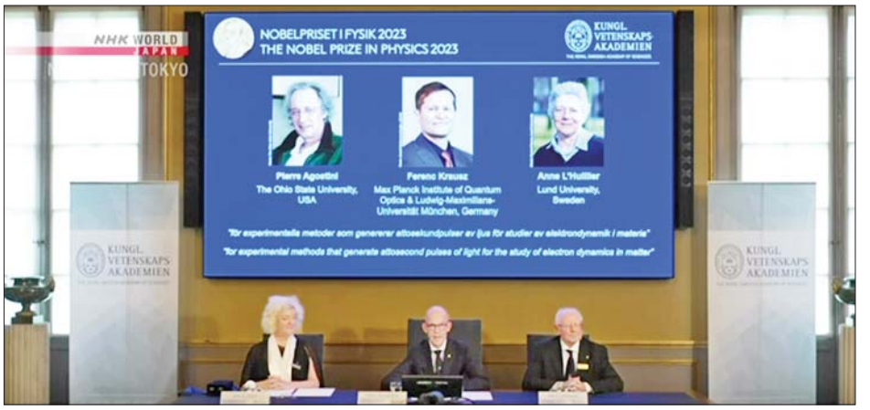
ရူပဗေဒဆိုင်ရာ နိုဘယ်လ်ဆုကို ရရှိခဲ့သည့် အမေရိကန်၊ ဂျာမနီနှင့် ဆွီဒင်နိုင်ငံတို့မှ သိပ္ပံပညာရှင် သုံးဦး ဖြစ်ကြောင်း သိရသည်။ ကိုးကား - အင်န်အိတ်ချ်ကော့ဘာသာပြန် - အောင်ကျော်ကျော်

အသုံးပြုရာတွင် အောင်မြင်မှုရရှိသည့် ပထမဆုံး သိပ္ပံပညာရှင်များဖြစ်သည်။ ၎င်းတို့အသုံးပြုသည့် အလင်းရောင်များကို "attosecond" ဟုခေါ်သည့် တစ်စက္ကန့်၏ သန်းတစ်ထောင်အတိုင်းအတာနှုန်းဖြင့် တိုင်းတာနိုင်သည်။ များစွာအထောက်အကူပြု အီလက်ထရွန်ဆိုင်ရာ လေ့လာမှုများ ဆက်လက်လုပ်ဆောင်ရန် ၎င်းတို့၏တွေ့ရှိမှုများသည် များစွာအထောက်အကူပြုမည်ဖြစ်ကြောင်း နိုဘယ်လ်ဆုချီးမြှင့်ရေးကော်မတီက ဆိုသည်။ ၎င်းတို့၏ တွေ့ရှိချက်များသည် အီလက်ထရွန် နှစ် ပစ္စည်းများတွင် အီလက်ထရွန်များ အလုပ်လုပ်ဆောင်ပုံနှင့်ပတ်သက်ပြီး လူသားများ၏နားလည်မှုကို ပြောင်းလဲစေသည့်အပြင် ဆေးဘက်ဆိုင်ရာရောဂါ