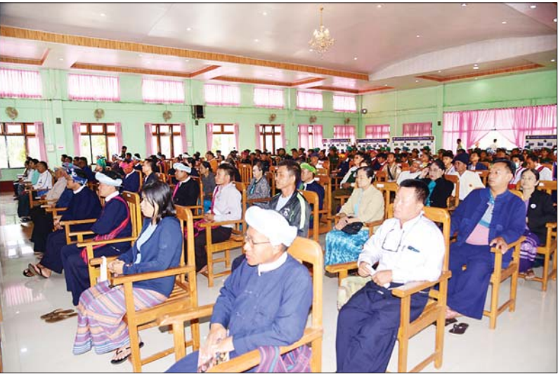
နိုင်ငံတော်စီမံအုပ်ချုပ်ရေးကောင်စီအဖွဲ့ဝင် ခွန်စုံလွင် ပအိုဝ်းကိုယ်ပိုင်အုပ်ချုပ်ခွင့်ရဒေသခန်းမ၌ မြို့နယ်အဆင့်ဌာနဆိုင်ရာများ၊ မြို့မိ မြို့ဖများ၊ တိုင်းရင်းသားစာပေနှင့်ယဉ်ကျေးမှုအဖွဲ့များ၊ စီးပွားရေးလုပ်ငန်းရှင်များနှင့် တွေ့ဆုံအမှာစကားပြောကြားစဉ်။

ရှင်းလင်းပြောကြား တွေ့ဆုံပွဲတွင် နိုင်ငံတော်စီမံ အုပ်ချုပ်ရေး ကောင်စီအဖွဲ့ဝင် ခွန်စုံလွင်က နိုင်ငံတော်စီမံ အုပ်ချုပ်ရေးကောင်စီ၏ ရေ့လုပ် ငန်းစဉ်(၅)ရပ်၊ ဦးတည်ချက်(၉) ရပ်တို့နှင့် လွတ်လပ်၍ တရားမျှတ