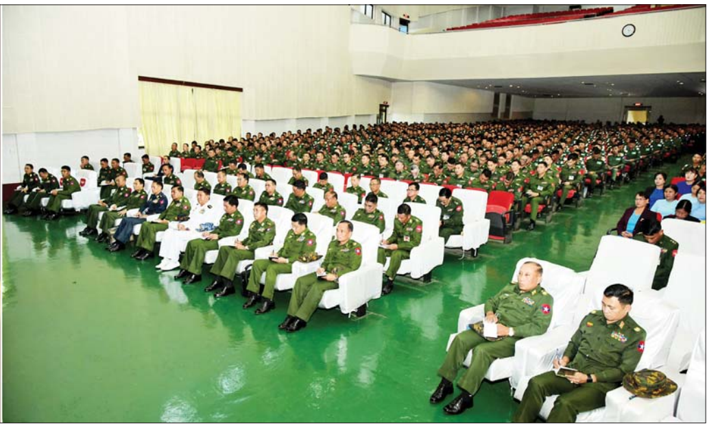
နိုင်ငံတော်စီမံအုပ်ချုပ်ရေးကောင်စီ ဒုတိယဥက္ကဋ္ဌ ဒုတိယတပ်မတော်ကာကွယ်ရေးဦးစီးချုပ်(ကြည်း) ဒုတိယဗိုလ်ချုပ်မှူးကြီးစိုးဝင်း စစ်တက္ကသိုလ်ရှိ နည်းပြအရာရှိများ၊ နည်းပြဆရာ ဆရာမများနှင့် သင်တန်းသားဗိုလ်လောင်းများအား တွေ့ဆုံအမှာစကားပြောကြားစဉ်။

တွေ့ဆုံပွဲသို့ နိုင်ငံတော်စီမံအုပ်ချုပ်ရေးကောင်စီ ဒုတိယဥက္ကဋ္ဌ ဒုတိယတပ်မတော်ကာကွယ်ရေးဦးစီးချုပ်(ကြည်း)နှင့်အတူ ညှိနှိုင်းကွပ်ကဲရေးမှူးကြီး(ကြည်း၊ ရေ၊ လေ) ဗိုလ်ချုပ်ကြီး မောင်မောင်အေး၊ ကာကွယ်ရေးဦးစီးချုပ်မှူးမှ အဆင့်မြင့် တပ်မတော်အရာရှိကြီးများ၊ အလယ်ပိုင်းတိုင်း စစ်ဌာနချုပ်တိုင်းမှူး၊ စစ်တက္ကသိုလ် ကျောင်းအုပ်ကြီးနှင့် တာဝန်ရှိသူများ၊ နည်းပြအရာရှိများ၊ နည်းပြဆရာ ဆရာမများနှင့် သင်တန်းသားဗိုလ်လောင်းများ တက်ရောက်ကြသည်။ ဦးစီးချုပ်(ကြည်း) ဒုတိယဗိုလ်ချုပ်မှူးကြီးစိုးဝင်းက အမှာစကားပြောကြားရာတွင် စာပေပညာ၊ စစ်ပညာများကို သင်ကြားပေးနေသော နည်းပြများအနေဖြင့် မိမိတို့ သင်ကြားပေးရသည့် ဘာသာရပ်များကို ကိုယ်တိုင်ကျွမ်းကျင်စွာ တတ်မြောက်ရန် လိုအပ်ပြီး ပြောင်းလဲတိုးတက်နေသော Revolutionary of Military Affair (RMA) စစ်ရေးရာတော်လှန်ပြောင်းလဲမှု နည်းပညာများနှင့် လိုက်လျောညီထွေ တတ်သိနေရန်အတွက် စဉ်ဆက်မပြတ်လေ့လာဆည်းပူးသွားရန် လိုကြောင်း၊ တပည့်များ၏ရှေ့တွင် မားမားမတ်မတ်ရပ်ကာ သင်ကြားပေး