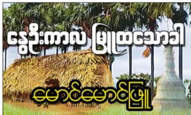
စာမျက်နှာ » ၁၇