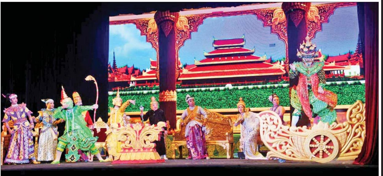
(၂၃) ကြိမ်မြောက် မြန်မာ့ရိုးရာယဉ်ကျေးမှု အဆို၊ အက၊ အရေး၊ အတီးပြိုင်ပွဲ၌ ‘ရာမာယဏ’ ဇာတ်တော်ကြီးပြိုင်ပွဲ ကပြဖျော်ဖြေမှုကို တွေ့ရစဉ်။

နိပါတ်ခင်းသည် ရိုးရာအစဉ်အလာ ယဉ်ကျေးမှုလမ်းကြောင်းပေါ်တွင်သာ အဓိကထား အားပြုသည်။ နောက်ထပ်ဖွံ့ဖြိုးလာသည့်