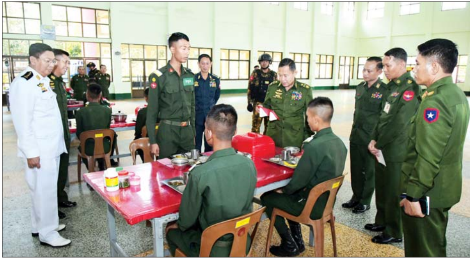
နိုင်ငံတော်စီမံအုပ်ချုပ်ရေးကောင်စီဒုတိယဥက္ကဋ္ဌ ဒုတိယတပ်မတော်ကာကွယ်ရေးဦးစီးချုပ် ကာကွယ်ရေးဦးစီးချုပ်(ကြည်း) ဒုတိယဗိုလ်ချုပ်မှူးကြီး စိုးဝင်း စစ်တက္ကသိုလ် ဗိုလ်လောင်းသင်တန်းအမှတ်စဉ် (၆၆) သင်တန်းသားဗိုလ်လောင်းများအား ရင်းရင်းနှီးနှီး လိုက်လံနှုတ်ဆက်စဉ်။

ရှေးဦးစွာ များအား တစ်ဦးချင်းစီတွေ့ဆုံ အသီးသီးအတွက် စိစစ်ရွေးချယ် ကာကွယ်ရေးဦးစီးချုပ်မှ အဆင့် မေးမြန်း၍ စာပေပညာ၊ စစ်ပညာ ပေးခဲ့ကြသည်။ မြင့် တပ်မတော်အရာရှိကြီးများ၊ ဘာသာရပ်အလိုက် ထူးချွန် နေ့လယ်စာ ထက်မြက်မှု၊ ဝါသနာနှင့် ကြိုးစား အတူတကွသုံးဆောင် တိုင်းမှူး၊ စစ်တက္ကသိုလ် ကျောင်း အားထုတ်မှုများအပေါ် မူတည်၍ မွန်လွဲပိုင်းတွင် နိုင်ငံတော်စီမံ အုပ်ကြီးနှင့် တာဝန်ရှိသူများ အုပ်ချုပ်ရေးကောင်စီ ဒုတိယဥက္ကဋ္ဌ ဒုတိယတပ်မတော်ကာကွယ်ရေး တက်ရောက်ကြပြီး ဗိုလ်လောင်း (ကြည်း၊ ရေ၊ လေ) စစ်လက်ရုံး