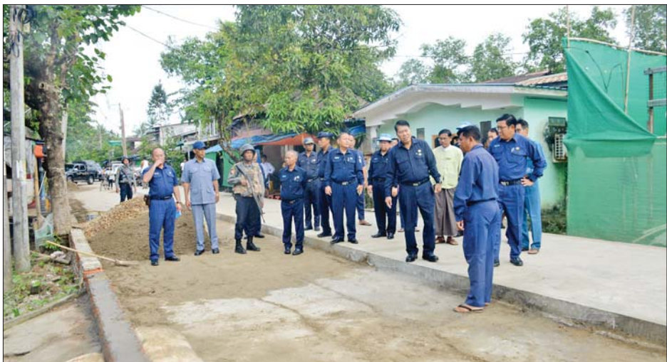
မွန်းလွဲပိုင်းတွင် မြို့တော်ဝန်သည် မြို့တော် ခန်းမ ပထမထပ် အစည်းအဝေးခန်းမ၌ ကျင်းပသည့် ရန်ကုန်မြို့တော် စည်ပင်သာယာရေးကော်မတီ ကော်မတီဝင်နှင့် ဌာနမှူးများ လုပ်ငန်းညှိနှိုင်း အစည်းအဝေးသို့ တက်ရောက်ပြီး မြို့တော်သန့်ရှင်း သာယာသပ်ရပ်ရေး၊ ရေပေးဝေရေး၊ ရေစီးလေသ ကောင်းမွန်ရေး၊ ယာဉ်စည်းကမ်း၊ လမ်းစည်းကမ်း ကောင်းမွန်ရေး၊ ပြည်သူများ ရေပြတ်လပ်မှုမရှိစေရေး၊ အများပြည်သူများနှင့် အဆင်ပြေချောမွေ့စွာ ဆက်ဆံ ရေးကိစ္စရပ်များကို ဆွေးနွေးမှာကြားပြီး လုပ်ငန်း လိုအပ်ချက်များကို ပေါင်းစပ်ညှိနှိုင်းဆောင်ရွက် ပေးခဲ့ကြောင်း သိရသည်။ သတင်းစဉ်

လမ်းတစ်လျှောက် 110 mm HDPE ပိုက်သွယ်တန်း ခြင်းလုပ်ငန်း၊ အောင်မင်္ဂလာ ရေပေးဝေရေးစခန်း အတွင်း သုံးနာရီလျှင် ရေဂါလန် ၂၀၀၀ ထွက်ရှိသည့် အကြိုရေသန့်စင်စက်ရုံနှင့် ရေဂါလန် ၃၆ သန်းဆုံ အောင်မင်္ဂလာရေကန်တို့ကိုလည်းကောင်း၊ ဒလ မြို့နယ် အောင်မင်္ဂလာရပ်ကွက် ဒလ-တံတား ကား လမ်းဘေးရှိ ပြည်သူ့ဆေးရုံဝင်းအတွင်း သန့်ရှင်းရေး ဆောင်ရွက်နေမှုကိုလည်းကောင်း၊ ဒဂုံမြို့နယ် ပြည်သူ့ရင်ပြင်၌ ပန်းကွက်ဖော်မြေယာရှင်း ဆောင်ရွက်နေမှုကိုလည်းကောင်း၊ ပန်းဥယျာဉ်နှင့် အားကစားကွင်းများဌာနက ဆောင်ရွက်လျက်ရှိသည့် အာဆီယံသပြေ စိုက်ပျိုးထားရှိမှု၊ မြေယာရှင်း ဆောင်ရွက်နေမှုနှင့် ပျိုးခြံအတွင်း ပေါ်လိုနီယာ နှစ်ရှည်ပင်အပင် ၅၀၀ ပြုစုပျိုးထောင်ထားရှိမှုတို့ကို လည်းကောင်း သွားရောက်ကြည့်ရှုစစ်ဆေးပြီး လိုအပ် သည်များ မှာကြားဖြည့်ဆည်းဆောင်ရွက်ပေးသည်။