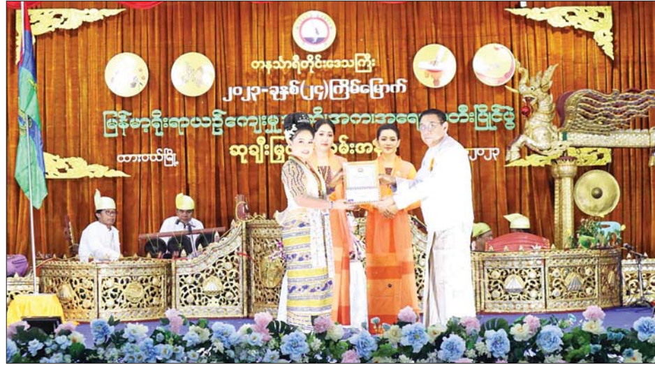
ဆက်လက်ကျင်းပရာ တိုင်းဒေသကြီး ၂၀၂၃ ခုနှစ် (၂၄)ကြိမ်မြောက် မြန်မာ့ရိုးရာယဉ်ကျေးမှု အဆို၊ အက၊ အရေး၊ အတီးပြိုင်ပွဲ ကျင်းပရေးဦးစီးကော်မတီ နာယက တိုင်းဒေသကြီး ဝန်ကြီးချုပ် ဦးမြတ်ကို၊ တိုင်းဒေသကြီး တရားလွှတ်တော်တရားသူကြီးချုပ် ဒေါ်ပိုက်ပိုက်အေးနှင့် တာဝန်ရှိသူများက ပြိုင်ပွဲများ အလိုက် ပထမ၊ ဒုတိယ၊ တတိယဆုရရှိသူများအား ဆုများ ပေးအပ်ချီးမြှင့်ခဲ့ပြီး ဆုရရှိသူ ပြိုင်ပွဲဝင် များက ပြန်လည်ဖျော်ဖြေတင်ဆက် ကပြခဲ့ကြ သည်။

ညအချိန်အိပ်နေချိန်တွင် လျှပ်စစ်မီးများ ပိတ်ထားခြင်းဖြင့် လျှပ်စစ်ကို နေ့စဉ် ရွှေ့တာသင့်ပါသည်