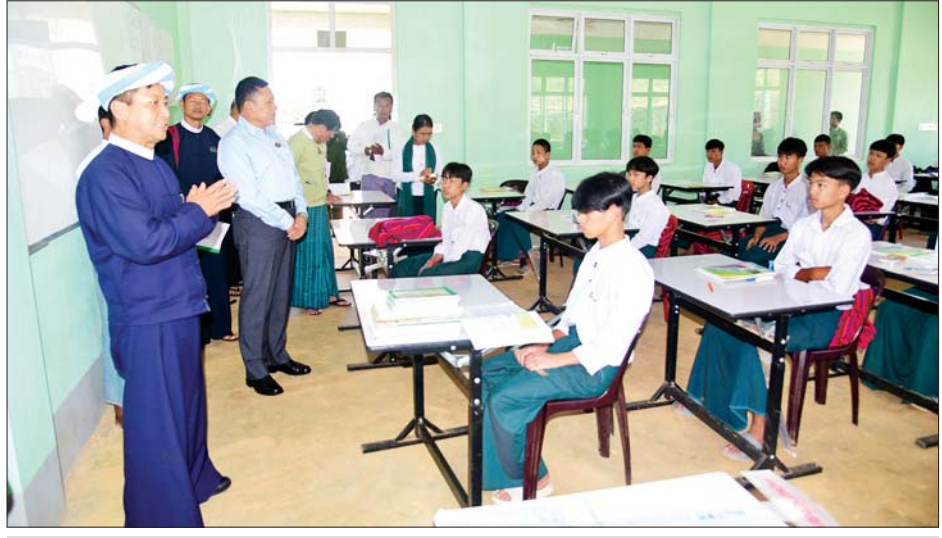
နိုင်ငံတော်စီမံအုပ်ချုပ်ရေးကောင်စီအဖွဲ့ဝင် ခွန်စုံလွင် စက်မှု၊ စိုက်ပျိုး၊ မွေးမြူရေး အထက်တန်း ကျောင်း (ပေါင်လင်း)၌ ပညာသင်ကြားနေသော ကျောင်းသား ကျောင်းသူများကို အားပေးစကား ပြောကြားစဉ်။

ထို့နောက် အခမ်းအနားသို့ တက်ရောက်လာကြသည့် ဆန် စက်လုပ်ငန်းရှင်၊ ကော်ဖီလုပ်ငန်း ရှင်၊ မွေးမြူရေးလုပ်ငန်းရှင်၊ ထောပတ်အစုအဖွဲ့၊ ကျေးရွာ အုပ်စုများမှ တာဝန်ရှိသူများက သက်ဆိုင်ရာ ကဏ္ဍအလိုက် လိုအပ်ချက်နှင့် အခက်အခဲများကို တင်ပြဆွေးနွေး၍ အထွေထွေ ဆွေးနွေးကြပြီး ပြည်နယ်ဝန်ကြီး ချုပ်က တင်ပြချက်များအပေါ် ဖြေရှင်းဆောင်ရွက်ပေးသည်။