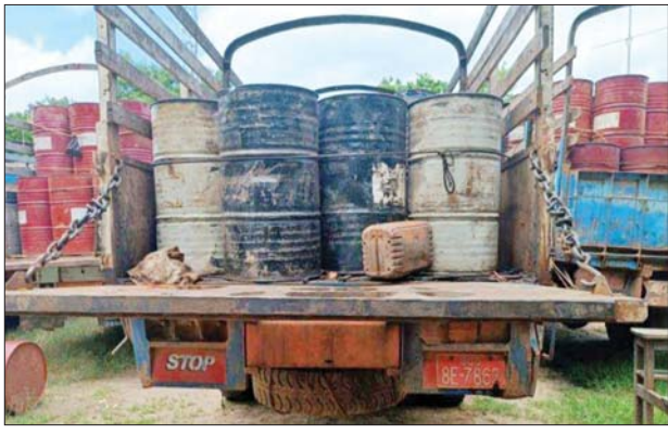
စစ်ကိုင်းတိုင်းဒေသကြီး၌ သိမ်းဆည်းရမိမှု။

တရားမဝင်ကုန်သွယ်မှုတိုက်ဖျက်ရေး ဦးဆောင်ကော်မတီ၏ ကြီးကြပ်ကွပ်ကဲမှုဖြင့် တရားမဝင်ကုန်သွယ်မှုများကို ဥပဒေနှင့်အညီ ထိရောက်စွာ တားဆီးအရေးယူနိုင်ရေး ဆောင်ရွက်လျက်ရှိရာ စက်တင်ဘာ ၂၉ ရက်တွင် စစ်ကိုင်းတိုင်းဒေသကြီး တရားမဝင်ကုန်သွယ်မှုတိုက်ဖျက်ရေးအထူးအဖွဲ့၏ စီမံခန့်ခွဲမှုဖြင့် တာဝန်ကျပူးပေါင်းအဖွဲ့များက စစ်ဆေးမှုများ ဆောင်ရွက်ရာတွင် မုံရွာမြို့၊ စက်မှုဇုန်ရပ်ကွက်အင်းဖြတ်လမ်း၌ တရားမဝင်စက်သုံးဆီ ဒီဇယ်ဆီချက်ဆီ ၃၈၉၅ ဂါလန် (ခန့်မှန်းတန်ဖိုးငွေကျပ် ၁၈၆၉၆၉၆၀)ကို ရေနံနှင့်ရေနံထွက်ပစ္စည်းဆိုင်ရာဥပဒေအရ လည်းကောင်း၊ စစ်ကိုင်းမြို့၊ ရွှေမင်းဝံရပ်ကွက်ပေါ်တော်မူဘုရားအနီး၌ လိုင်စင်မဲ့ Sambo CZI ဆိုင်ကယ်တစ်စီး (ခန့်မှန်းတန်ဖိုးငွေကျပ် ၃၀၀၀၀၀)နှင့် စစ်ကိုင်းမြို့၊ ကံတလူ ပူးပေါင်းစစ်ဆေးရေးဂိတ်၌ လိုင်စင်မဲ့ Toyota Hilux Surf ယာဉ်သုံးစီး (ခန့်မှန်းတန်ဖိုးငွေကျပ် ၃၀၀၀၀၀၀)တို့ကို ပို့ကုန်သွင်းကုန် ဥပဒေအရ လည်းကောင်း စုစုပေါင်း(ခန့်မှန်းတန်ဖိုးငွေကျပ် ၂၇၅၆၉၆၀၀) ကို သိမ်းဆည်းအရေးယူဆောင်ရွက်လျက်ရှိသည်။