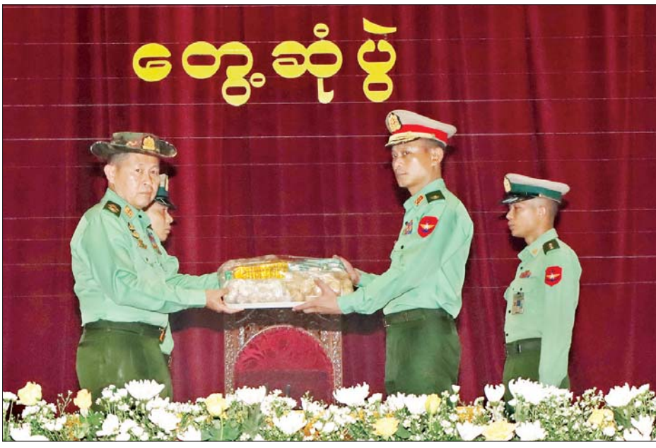
နိုင်ငံတော်စီမံအုပ်ချုပ်ရေးကောင်စီ ဒုတိယဥက္ကဋ္ဌ ဒုတိယတပ်မတော်ကာကွယ်ရေးဦးစီးချုပ် ကာကွယ်ရေးဦးစီးချုပ်(ကြည်း) ဒုတိယဗိုလ်ချုပ်မှူးကြီးစိုးဝင်း ပြင်ဦးလွင်တပ်နယ်ရှိ အရာရှိ၊ စစ်သည်၊ မိသားစုများအတွက် စားသောက်ဖွယ်ရာများ ပေးအပ်စဉ်။

နိုင်ငံတော် စီမံအုပ်ချုပ်ရေးကောင်စီ ဖြစ်ပေါ်လာခြင်းသည် ၂၀၂၀ ပြည့်နှစ် အထွေထွေရွေးကောက်ပွဲ၌ မဲမသမာမှုများနှင့် ယှဉ်တွဲ အမြတ်ထုတ်လျက် နိုင်ငံတော် အာဏာသုံးရပ်ကို အမွေရယူရန် ကြိုးပမ်းမှုအတွက် အဆိုပါ ပြဿနာရပ်များအပေါ် တပ်မတော်က ဖြေရှင်းပေးရန် အကြိမ်ကြိမ်တောင်းဆိုမှုအပေါ် တာဝန်ရှိသည့် ပုဂ္ဂိုလ်၊ အဖွဲ့