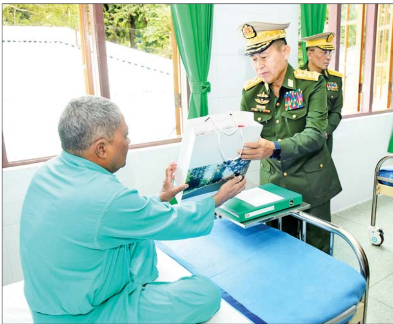
နိုင်ငံတော်စီမံအုပ်ချုပ်ရေးကောင်စီ ဒုတိယဥက္ကဋ္ဌ ဒုတိယတပ်မတော်ကာကွယ်ရေး ဦးစီးချုပ် ကာကွယ်ရေးဦးစီးချုပ် (ကြည်း) ဒုတိယဗိုလ်ချုပ်မှူးကြီးစိုးဝင်း ကင်ဆာဆောင်၌ တက်ရောက်ဆေးကုသမှုခံယူလျက်ရှိသည့် လူနာတစ်ဦးအား ကြည့်ရှုအားပေးကာ စားသောက်ဖွယ်ရာများ ထောက်ပံ့ပေးအပ်စဉ်။

၁၉၂၃ ခုနှစ်တွင် စတင်တည်ထောင် ခဲ့ပြီး ခေတ်အဆက်ဆက် ကောင်းမြတ်သည့် အစဉ်အလာ များကို လက်ဆင့်ကမ်းထိန်းသိမ်း လာခဲ့သည့်အတွက် ယခုအခါတွင် အလွန်ဂုဏ်ယူဖွယ်ရာ နှစ်(၁၀၀) ပြည့် အခမ်းအနားသို့ ရောက်ရှိခဲ့ ကြောင်း၊ ထို့အတူ ဆေးဝန်ထမ်း တပ်ဖွဲ့၏ သုတေသနဆောင်ရွက် ချက်များကို နိုင်ငံတကာအထိ ရောက်ရှိအောင် တင်ပြနိုင်သည့်