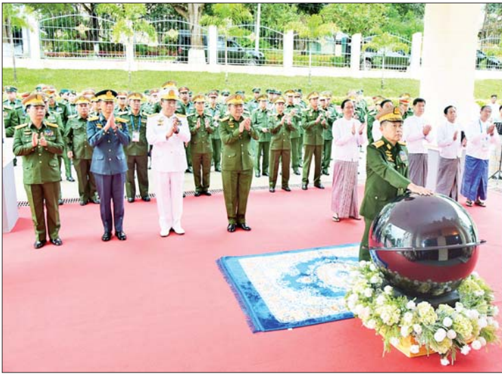
နိုင်ငံတော်စီမံအုပ်ချုပ်ရေးကောင်စီ ဒုတိယဥက္ကဋ္ဌ ဒုတိယတပ်မတော်ကာကွယ်ရေးဦးစီးချုပ် ကာကွယ်ရေးဦးစီးချုပ် (ကြည်း) ဒုတိယဗိုလ်ချုပ်မှူးကြီးစိုးဝင်း အမှတ်(၁) တပ်မတော်ဆေးရုံ(ခုတင်-၇၀၀) နှစ်(၁၀၀)ပြည့် အထိမ်းအမှတ် ဓာတ်ရောင်ခြည်နှင့် ကင်ဆာရောဂါကုသဆောင် ဆိုင်းဘုတ်ကို စက်ခလုတ်နှိပ် ဖွင့်လှစ်ပေးစဉ်။

ဆက်လက်၍ နိုင်ငံတော် စီမံအုပ်ချုပ်ရေးကောင်စီ ဒုတိယ ဥက္ကဋ္ဌ ဒုတိယတပ်မတော်ကာကွယ် ရေးဦးစီးချုပ်ကာကွယ်ရေးဦးစီးချုပ် (ကြည်း)နှင့် အဖွဲ့ဝင်များသည် ကမ္ဘာ့ပတ်ဝန်းကျင်ထိန်းသိမ်းရေး အဖွဲ့ဝင်များ ပန်ဖျန်းပေးကြ ပြီး ဓာတ်ရောင်ခြည်နှင့် ကင်ဆာ ကုသဆောင်အတွင်း လှည့်လည် ကြည့်ရှုကြ၍ ကင်ဆာဆောင်၌ တက်ရောက် ဆေးကုသမှုခံယူ