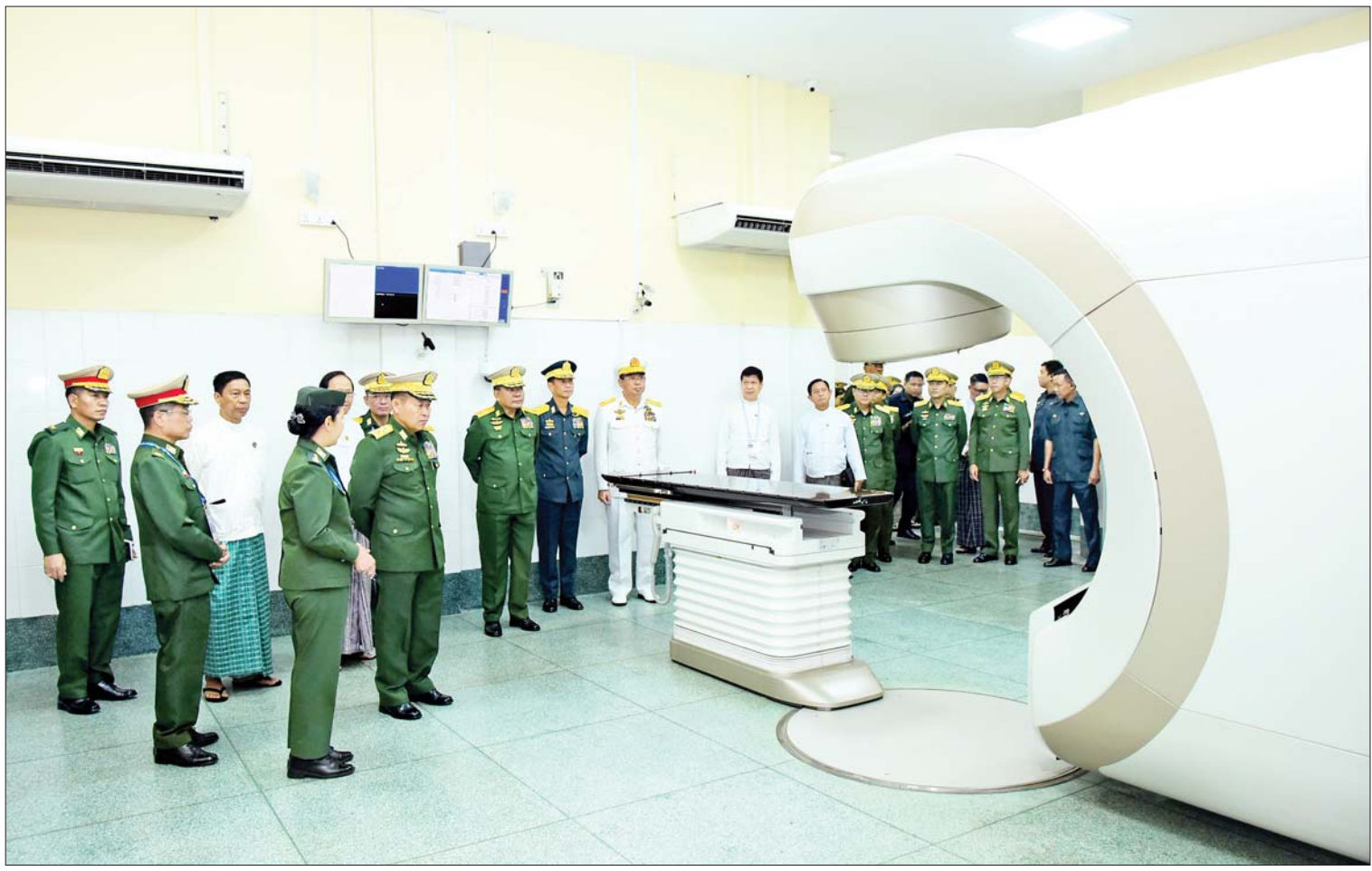
နိုင်ငံတော်စီမံအုပ်ချုပ်ရေးကောင်စီ ဒုတိယဥက္ကဋ္ဌ ဒုတိယတပ်မတော်ကာကွယ်ရေးဦးစီးချုပ် ကာကွယ်ရေးဦးစီးချုပ်(ကြည်း) ဒုတိယဗိုလ်ချုပ်မှူးကြီးစိုးဝင်း ဓာတ်ရောင်ခြည်နှင့် ကင်ဆာရောဂါကုသဆောင်အတွင်း လှည့်လည်ကြည့်ရှုစဉ်။

တက်ရောက် အဆိုပါ အခမ်းအနားများသို့ နိုင်ငံတော်စီမံအုပ်ချုပ်ရေးကောင်စီ ဒုတိယဥက္ကဋ္ဌ ဒုတိယတပ်မတော်ကာကွယ်ရေးဦးစီးချုပ် ကာကွယ်ရေးဦးစီးချုပ်(ကြည်း)နှင့် အတူညီနိုင်ငံကွယ်ရေးမှူး(ကြည်း၊ ရေ၊ လေ) ဗိုလ်ချုပ်ကြီး မောင်မောင်အေး၊ ကျန်းမာရေးဝန်ကြီးဌာန ပြည်ထောင်စုဝန်ကြီး ပါမောက္ခ ဒေါက်တာသက်ခိုင်ဝင်း၊ လူမှုဝန်ထမ်း၊ ကယ်ဆယ်ရေးနှင့် ပြန်လည်နေရာချထားရေးဝန်ကြီးဌာန ပြည်ထောင်စုဝန်ကြီး ဒေါက်တာစိုးဝင်း၊ ကာကွယ်ရေးဦးစီးချုပ်ရုံးမှ အဆင့်မြင့်တပ်မတော်အရာရှိကြီးများ၊ မန္တလေးတိုင်းဒေသကြီး ဝန်ကြီးချုပ်၊ စာမျက်နှာ ၃ ကော်လံ ၁ သို့ ။