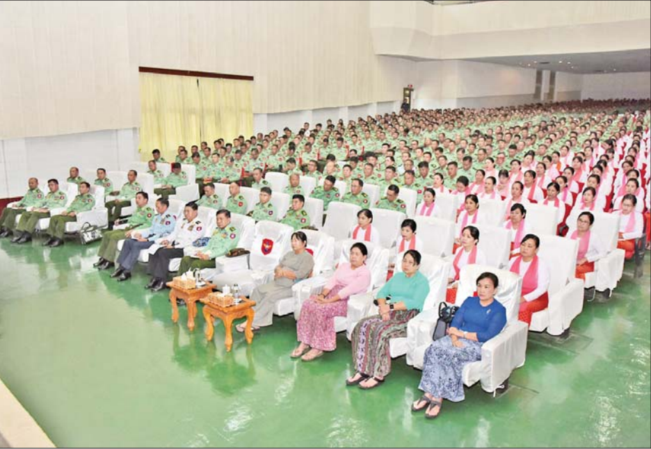
နိုင်ငံတော်စီမံအုပ်ချုပ်ရေးကောင်စီ ဒုတိယဥက္ကဋ္ဌ ဒုတိယတပ်မတော်ကာကွယ်ရေးဦးစီးချုပ် ကာကွယ်ရေးဦးစီးချုပ်(ကြည်း) ဒုတိယဗိုလ်ချုပ်မှူးကြီးစိုးဝင်း ပြင်ဦးလွင်တပ်နယ်ရှိ သင်တန်းသားအရာရှိများ၊ နည်းပြအရာရှိများနှင့် မိသားစုများအား တွေ့ဆုံအမှာစကားပြောကြားစဉ်။