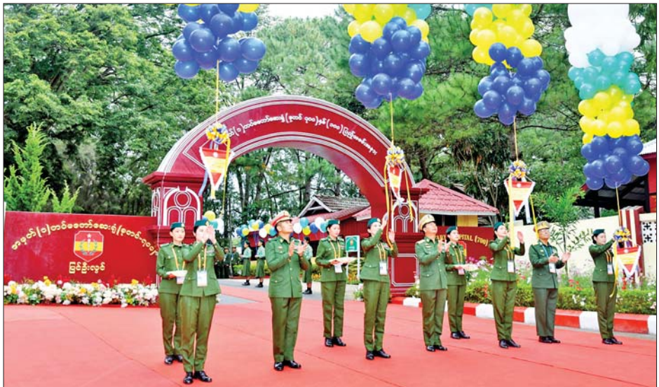
ကာကွယ်ရေးဦးစီးချုပ်ရုံး(ကြည်း)မှ ဒုတိယဗိုလ်ချုပ်ကြီးကိုကိုဦး၊ တိုင်းမှူး ဗိုလ်မှူးချုပ်ကြည်ခိုင်နှင့် ဆေးဝန်ထမ်းညွှန်ကြားရေးမှူး ဗိုလ်ချုပ်ကိုလွင်တို့က အမှတ်(၁) တပ်မတော်ဆေးရုံ(ခုတင်-၇၀၀) နှစ်(၁၀၀)ပြည့် အခမ်းအနားကို ဖဲကြိုးဖြတ်ဖွင့်လှစ်ပေးစဉ်။

ထို့အပြင် ၁၉၉၈ ခုနှစ်မှစတင်၍ အစာအိမ်နှင့် အူလမ်းကြောင်း ဆိုင်ရာ ရောဂါများအတွက် မှန်ပြောင်းနှင့် ရောဂါရှာဖွေကုသ ရေးလုပ်ငန်းများကို ဆောင်ရွက် ပေးနိုင်ခဲ့သည်ကို တွေ့ရှိရကြောင်း၊ မှန်ပြောင်းမှတစ်ဆင့် သည်းခြေ ကျောက်တည်လူနာ ၁၁၉၄ ဦး အပါအဝင် စုစုပေါင်း လူနာ ၉၉၃၀ ကို ခွဲစိတ်ကုသမှုများ ဆောင်ရွက် ပေးနိုင်ခဲ့သည်ကို တွေ့ရှိရကြောင်း၊ နှလုံးကုသမှုဆေးပညာဌာနကို ၂၀၀၈ ခုနှစ်တွင် စတင်ဖွင့်လှစ် ခဲ့ပြီး နှလုံး၏ လုပ်ဆောင်နိုင်မှုကို စာမျက်နှာ ၄ သို့ >>>