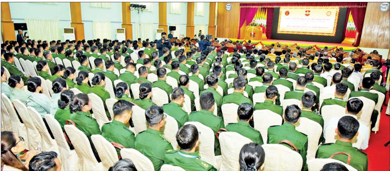
နိုင်ငံတော်စီမံအုပ်ချုပ်ရေးကောင်စီ ဒုတိယဥက္ကဋ္ဌ ဒုတိယတပ်မတော်ကာကွယ်ရေးဦးစီးချုပ် ကာကွယ်ရေးဦးစီးချုပ်(ကြည်း) ဒုတိယဗိုလ်ချုပ်မှူးကြီးစိုးဝင်း အမှတ်(၁) တပ်မတော်ဆေးရုံ(ခုတင်-၇၀၀) နှစ်(၁၀၀)ပြည့် အထိမ်းအမှတ်နှင့် အကြိမ်(၃၀)မြောက် မြန်မာ့တပ်မတော် ဆေးပညာရပ်ဆိုင်ရာ နှီးနှောဖလှယ်ပွဲ အထိမ်းအမှတ် ဂုဏ်ပြုအမှာစကားပြောကြားစဉ်။

ယခုကဲ့သို့အမှတ်(၁)တပ်မတော် ဆေးရုံ(ခုတင်-၇၀၀)၏ နှစ်(၁၀၀) ပြည့် အခမ်းအနားနှင့်အတူ ယနေ့ တွင် အကြိမ်(၃၀)မြောက် မြန်မာ့ တပ်မတော် ဆေးပညာရပ်ဆိုင်ရာ နှီးနှောဖလှယ်ပွဲ၏ ဖွင့်ပွဲအခမ်း အနားကိုလည်း တစ်ပေါင်းတည်း ဖွင့်လှစ်ပေးသွားမည်ဖြစ်ကြောင်း။ ဆေးဝန်ထမ်းတပ်ဖွဲ့သည် စတင် တည်ထောင်စဉ်ကပင် ကုသရေး၊ ရောဂါရှာဖွေရေးနှင့် ကာကွယ်ရေး လုပ်ငန်းများအပြင် ဆေးသုတေ သနလုပ်ငန်းများကိုပါ ဆောင်ရွက် ခဲ့ကြောင်း၊ ထိုသို့ သုတေသနတွေ့ရှိ ချက်များကို ၁၉၉၀ ပြည့်နှစ်ကပင် စတင်ခဲ့ပြီး ဆေးပညာရပ်ဆိုင်ရာ