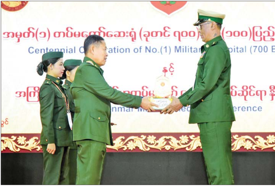
နိုင်ငံတော်စီမံအုပ်ချုပ်ရေးကောင်စီ ဒုတိယဥက္ကဋ္ဌ ဒုတိယတပ်မတော်ကာကွယ်ရေးဦးစီးချုပ် ကာကွယ်ရေးဦးစီးချုပ်(ကြည်း) ဒုတိယဗိုလ်ချုပ်မှူးကြီးစိုးဝင်း အမှတ်(၁) တပ်မတော်ဆေးရုံ (ခုတင်-၇၀၀) နှစ်(၁၀၀)ပြည့်အထိမ်းအမှတ် ဆုရရှိသည့် အရာရှိတစ်ဦးကို ဂုဏ်ပြုဆုပေးအပ်ချီးမြှင့်စဉ်။

ကင်ဆာလူနာ များအတွက် ဓာတ်ရောင်ခြည်ကုသမှု လိုအပ် ချက်သည်တစ်စတစ်စများပြားလာ သည့်အတွက် တပ်မတော် ကာကွယ်ရေးဦးစီးချုပ် ဗိုလ်ချုပ် မှူးကြီး မင်းအောင်လှိုင်သည် တပ်မတော်ကာကွယ်ရေး ဦးစီး ချုပ် တာဝန်ယူချိန်မှစပြီး Linear Accelerator (LA) ဟု ခေါ်သည့် ဓာတ်ရောင်ခြည်ဖြင့် ကင်ဆာရောဂါ ကုသစက်ကြီးများနှင့် ခေတ်မီ ကုသရေး အဆောက်အအုံများကို တပ်မတော်ဆေးရုံကြီးများတွင် တိုးချဲ့ဆောက်လုပ် တပ်ဆင်ပေးခဲ့ ရာမှယခင်က အမှတ်(၂) တပ်မတော် ဆေးရုံ(ခုတင်-၅၀၀) (ရန်ကုန်)နှင့် အမှတ်(၂) တပ်မတော်ဆေးရုံ (ခုတင်-၇၀၀) (အောင်ပန်း)တို့၌ သာ ဓာတ်ရောင်ခြည်ဖြင့် ကင်ဆာ ရောဂါကုသစက်ကြီးများ ကုသရာ မှ ယခုအခါတွင် အမှတ်(၁) တပ်မတော်ဆေးရုံ(ခုတင်-၇၀၀) (ပြင်ဦးလွင်)မှာပင် ဓာတ်ရောင် ခြည်ဖြင့် ကင်ဆာရောဂါကုသစက် ကြီးများကို တပ်ဆင်ပေးနိုင်ခဲ့ပြီး