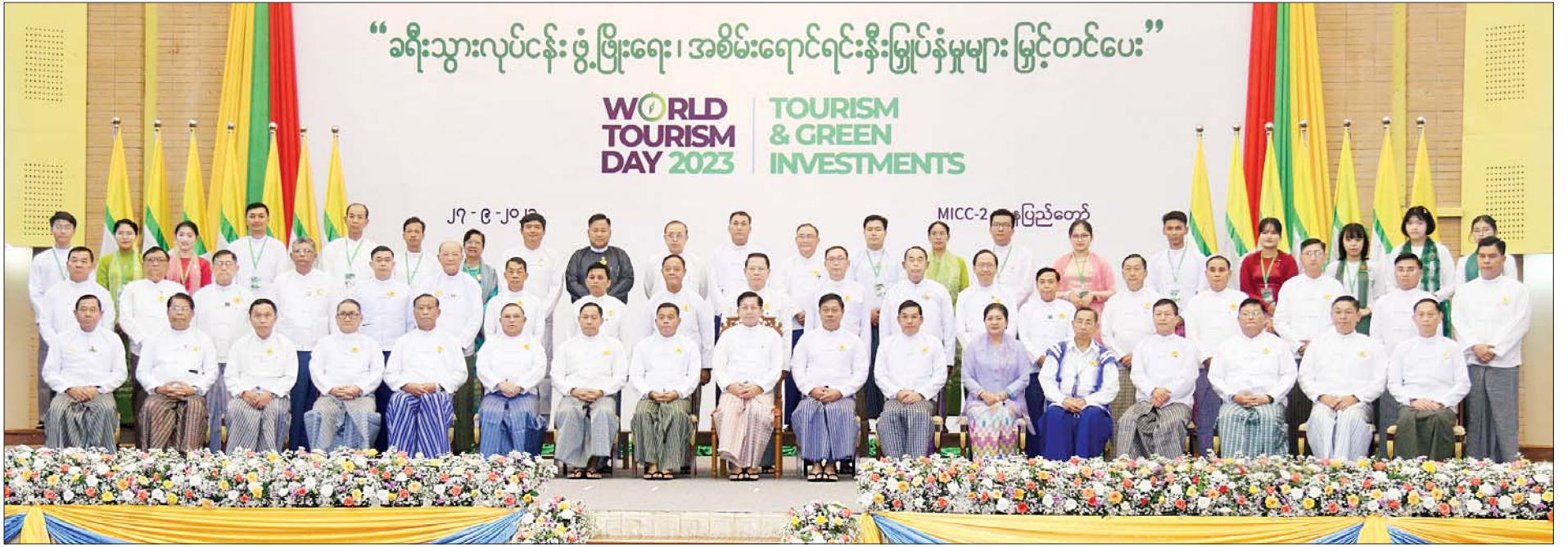
နိုင်ငံတော်စီမံအုပ်ချုပ်ရေးကောင်စီဥက္ကဋ္ဌ နိုင်ငံတော်ဝန်ကြီးချုပ် ဗိုလ်ချုပ်မှူးကြီး မင်းအောင်လှိုင်နှင့်အဖွဲ့ဝင်များ ဆုရရှိသူများနှင့်အတူ စုပေါင်းမှတ်တမ်းတင်ဓာတ်ပုံရိုက်စဉ်။

✦ စာမျက်နှာ ၃ မှ စက်မှုဖွံ့ဖြိုးပြီး နိုင်ငံများတွင် အရေးပါသည့် လုပ်ငန်းအဖြစ် အလေးထား ဆောင်ရွက်သကဲ့သို့ ဖွံ့ဖြိုးဆဲနိုင်ငံများလည်း ပြည်တွင်း၊ ပြည်ပခရီးသွားကဏ္ဍ ဖွံ့ဖြိုးတိုးတက်ရေးအတွက် အလေးထား ဆောင်ရွက်နေကြသည်ကို တွေ့ရ မည်ဖြစ်ပါကြောင်း၊ တည်ငြိမ် အေးချမ်းမှုရှိခြင်းသည် ခရီးသွား ကဏ္ဍ ဖွံ့ဖြိုးတိုးတက်ရေးကို အထောက်အကူ ပြုစေသော ကြောင့် နိုင်ငံဖွံ့ဖြိုးတိုးတက်ရန် အတွက် ဘက်ပေါင်းစုံ၊ ကဏ္ဍ ပေါင်းစုံ တည်ငြိမ်အေးချမ်းရေးကို ဆောင်ရွက်သွားကြရမည် ဖြစ်ပါ ကြောင်း။