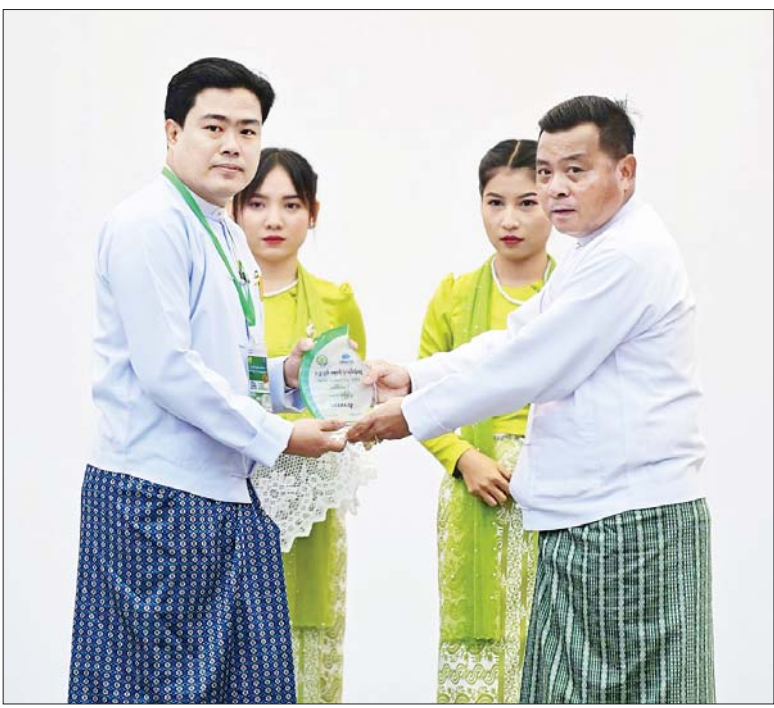
နိုင်ငံတော်စီမံအုပ်ချုပ်ရေးကောင်စီတွဲဖက်အတွင်းရေးမှူး ဒုတိယဗိုလ်ချုပ်ကြီး ရဲဝင်းဦး ကမ္ဘာ့ခရီးသွားလုပ်ငန်းနေ့အထိမ်းအမှတ် ဆောင်းပါးပြိုင်ပွဲတွင် ဆုရရှိသူတစ်ဦး အား ဆုပေးအပ်ချီးမြှင့်စဉ်။

ခရီးစဉ်ဒေသဖော်ထုတ် မိမိတို့နိုင်ငံတွင် သဘာဝတရား ကြီးမားပေးထားသည့် အကြီးမား ဆုံးလက်ဆောင်ဖြစ်သည့် မြေပေါ်၊ မြေအောက် သဘာဝသယံဇာတ အရင်းအမြစ်များ ပေါကြွယ်ဝသည် ကိုအားလုံးအသိပင် ဖြစ်ပါကြောင်း၊ အလားတူ အဖိုးမဖြတ်နိုင်သည့် ယဉ်ကျေးမှုအမွေအနှစ် များစွာရှိ ပါကြောင်း၊ အဆိုပါသဘာဝအရင်း အမြစ် ယဉ်ကျေးမှုအမွေအနှစ်များ ကို အခြေခံပြီး ခရီးစဉ်ဒေသနှင့် ခရီးသွား ဆွဲဆောင်မှုများအဖြစ် ဖော်ထုတ်ပြီး ဖိတ်ခေါ်ပြသသည့် ခရီးသွားလုပ်ငန်းကို ရေရှည်ဖွံ့ဖြိုး ချိန်ဆောင်နိုင်ရန်အတွက် ကြိုးစားဆောင် ရွက်ကြရမည် ဖြစ်ပါကြောင်း။ ယနေ့အချိန်အခါ၌ ကိုဗစ်-၁၉ ရောဂါ ဖြစ်ပွားမှုတွေ လျော့နည်း လာပြီး ကမ္ဘာ့နိုင်ငံအသီးသီးက ပြည်တွင်း၊ ပြည်ပခရီးသွားလုပ်ငန်း များ ပြန်လည်ဆောင်ရွက်လာ ကြပြီဖြစ်ပါကြောင်း၊ ကမ္ဘာ့ ခရီးသွားလုပ်ငန်း အဖွဲ့ချုပ်၏ စာရင်းများအရ ၂၀၂၃ ခုနှစ်