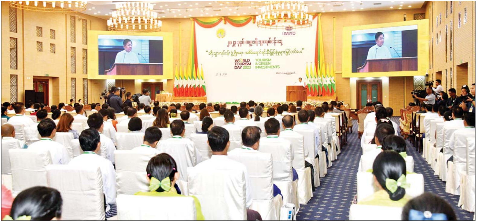
နိုင်ငံတော်စီမံအုပ်ချုပ်ရေးကောင်စီဥက္ကဋ္ဌ နိုင်ငံတော်ဝန်ကြီးချုပ် ဗိုလ်ချုပ်မှူးကြီး မင်းအောင်လှိုင် ၂၀၂၃ ခုနှစ် ကမ္ဘာ့ခရီးသွားလုပ်ငန်းနေ့ အထိမ်းအမှတ် အခမ်းအနားတွင် အမှာစကားပြောကြားစဉ်။

ထိုသို့ ကျင်းပပြုလုပ်ရာတွင် ခရီးသွားလုပ်ငန်း၏ ဖြစ်ပေါ် ပြောင်းလဲမှုများကို ထင်ဟပ် စေရန် လတ်တလော ဖြစ်ပေါ် လျက်ရှိသော အခြေအနေနှင့် ကိုက်ညီသည့် ဆောင်ပုဒ်များကို