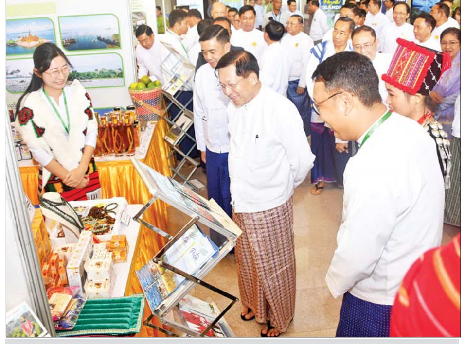
နိုင်ငံတော်စီမံအုပ်ချုပ်ရေးကောင်စီဥက္ကဋ္ဌ နိုင်ငံတော်ဝန်ကြီးချုပ် ဗိုလ်ချုပ်မှူးကြီး မင်းအောင်လှိုင် ၂၀၂၃ ခုနှစ် ကမ္ဘာ့ခရီးသွားလုပ်ငန်းနေ့ အထိမ်းအမှတ်အဖြစ် ခင်းကျင်းပြသထားသည့် ပြခန်းများကို လှည့်လည်ကြည့်ရှုစဉ်။