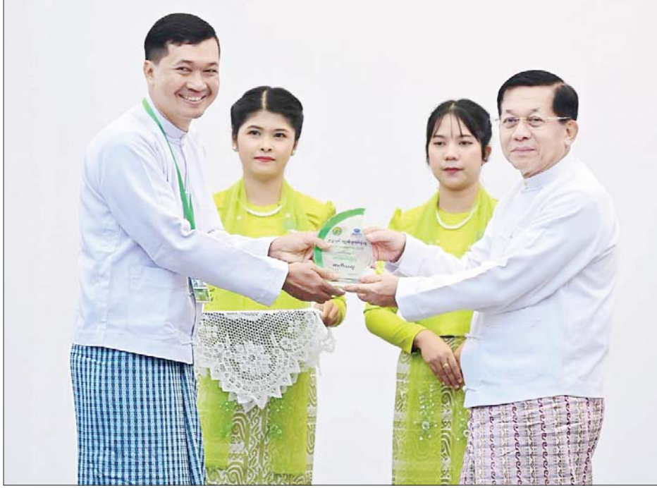
နိုင်ငံတော်စီမံအုပ်ချုပ်ရေးကောင်စီဥက္ကဋ္ဌ နိုင်ငံတော်ဝန်ကြီးချုပ် ဗိုလ်ချုပ်မှူးကြီး မင်းအောင်လှိုင် ကမ္ဘာ့ခရီးသွားလုပ်ငန်းနေ့ အထိမ်းအမှတ် ရောင်စုံဓာတ်ပုံပြိုင်ပွဲတွင် တတိယဆုရရှိသည့် ဦးကျော်ဇော်မင်း အား ဆုပေးအပ်ချီးမြှင့်စဉ်။

ခရီးသွားလုပ်ငန်းသည် နိုင်ငံ၏ စီးပွားရေး ဖွံ့ဖြိုးတိုးတက်မှုကို တိုက်ရိုက် အထောက်အကူပြု ခြင်း၊ နိုင်ငံခြားဝင်ငွေ ရှာဖွေ ပေးနိုင်ခြင်း၊ အလုပ်အကိုင်အခွင့် အလမ်းများ ဖန်တီးပေးနိုင်ခြင်း၊ လူထုလူတန်းစား အသီးသီးထံသို့ ဝင်ငွေများတိုက်ရိုက်နှင့် သွယ်ဝိုက် သောနည်းလမ်းများနှင့် စီးဝင် စေခြင်းစသည့် အကျိုးကျေးဇူး များစွာရရှိစေနိုင်သည့် မီးခိုး မထွက်သည့်စက်ရုံ (Smokeless Industry) တစ်ခုဖြစ်ပါကြောင်း၊ ထို့ကြောင့်လည်း ခရီးသွားလုပ်ငန်း ကို စာမျက်နှာ ၄ သို့ ☆