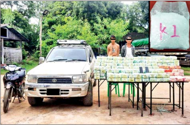
သိမ်းဆည်းရမိသည့် အိုက်စ(မက်သ်အဖက်တမင်း) များနှင့် အတူ တွေ့ရစဉ်။