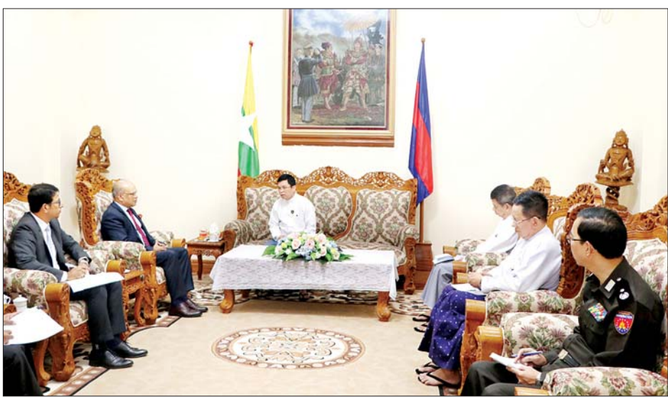
အမြဲတမ်းအတွင်းဝန် ဦးဝင်းဇော် ဦးစီးဌာန ညွှန်ကြားရေးမှူးချုပ် တက်ရောက်ကြကြောင်း သိရ အောင်၊ လူဝင်မှုကြီးကြပ်ရေး ဦးရဲထွန်းဦးနှင့် တာဝန်ရှိသူများ သတင်းစဉ်

တက်ရောက် တွေ့ဆုံပွဲသို့ ဒုတိယဝန်ကြီး ဦးဌေးလှိုင်နှင့် ဒေါက်တာမျိုးသန်း၊