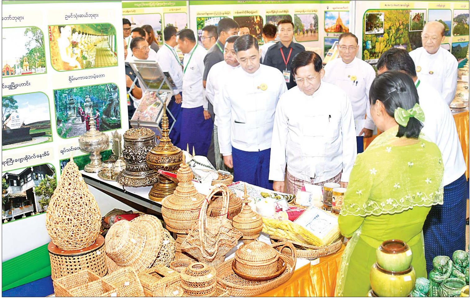
နိုင်ငံတော်စီမံအုပ်ချုပ်ရေးကောင်စီဥက္ကဋ္ဌ နိုင်ငံတော်ဝန်ကြီးချုပ် ဗိုလ်ချုပ်မှူးကြီး မင်းအောင်လှိုင် ၂၀၂၃ ခုနှစ် ကမ္ဘာ့ခရီးသွားလုပ်ငန်းနေ့ အထိမ်းအမှတ်အဖြစ် ခင်းကျင်းပြသထားသည့် ပြခန်းများကို လှည့်လည်ကြည့်ရှုစဉ်။

နေပြည်တော် စက်တင်ဘာ ၂၇ ၂၀၂၃ ခုနှစ် ကမ္ဘာ့ခရီးသွားလုပ်ငန်းနေ့ အထိမ်းအမှတ်အခမ်းအနားကို ယနေ့ နံနက်ပိုင်းတွင် နေပြည်တော်ရှိ မြန်မာ အပြည်ပြည်ဆိုင်ရာကွန်ဗင်းရှင်း (ဗဟိုဌာန-၂)၌ ကျင်းပပြုလုပ်ရာ နိုင်ငံတော်စီမံအုပ်ချုပ်ရေးကောင်စီဥက္ကဋ္ဌ နိုင်ငံတော်ဝန်ကြီးချုပ် ဗိုလ်ချုပ်မှူးကြီး မင်းအောင်လှိုင် တက်ရောက် အမှာစကား ပြောကြားသည်။ တက်ရောက် အခမ်းအနားသို့ ကောင်စီတွဲဖက်အတွင်းရေးမှူး ဒုတိယဗိုလ်ချုပ်ကြီး ရဲဝင်းဦး၊ ကောင်စီအဖွဲ့ဝင်များ၊ ပြည်ထောင်စုဝန်ကြီးများ၊ နေပြည်တော်ကောင်စီဥက္ကဋ္ဌ၊ ကာကွယ်ရေးဦးစီးချုပ်ရုံးမှ အဆင့်မြင့်တပ်မတော် အရာရှိကြီးများ၊ နေပြည်တော် တိုင်းစစ်ဌာနချုပ်တိုင်းမှူး၊ ဒုတိယဝန်ကြီးများ၊ မြန်မာနိုင်ငံဆိုင်ရာ နိုင်ငံခြားသံရုံးများမှ သံအမတ်ကြီးများ၊ ဝန်ကြီးဌာနများမှ အမြဲတမ်းအတွင်းဝန်များ၊ ညွှန်ကြားရေးမှူးချုပ်များ၊ အမျိုးသားခရီးသွားလုပ်ငန်း ဖွံ့ဖြိုးတိုးတက်ရေးကော်မတီ အဖွဲ့ဝင် ခရီးသွားလုပ်ငန်း တတ်သိပညာရှင်များနှင့် ပုဂ္ဂလိကခရီးသွားအဖွဲ့အစည်း ကိုယ်စားလှယ်များ၊ ၂၀၂၃ ခုနှစ် ကမ္ဘာ့ခရီးသွားလုပ်ငန်းနေ့ စာမျက်နှာ ၃ ကော်လံ ၁ သို့ ✪