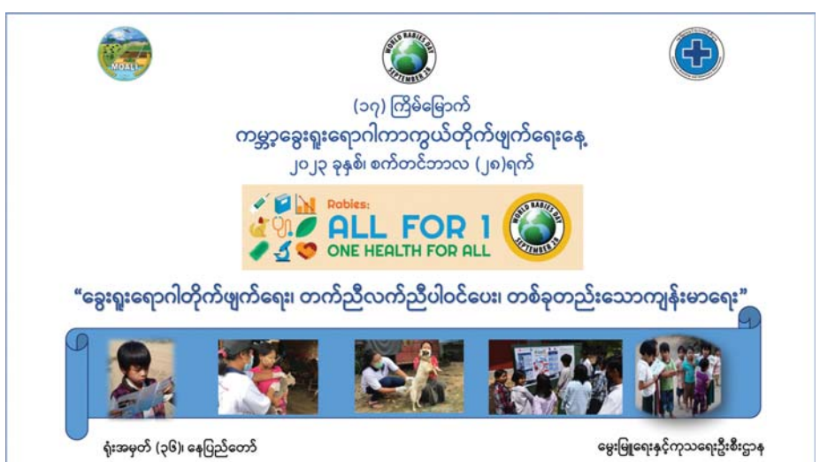
ရူးအမှတ် (၃၆) နေပြည်တော် မွေးမြူရေးနှင့်ကုသရေးဦးစီးဌာန

ခွေးရူးရောဂါသည် Rhabdo (ခေါ်) ကျည်ဆန်ပုံဗိုင်းရပ်စ်ကြောင့် ဖြစ်ပွားရပြီး ဦးနှောက်နှင့် အာရုံကြောအဖွဲ့အစည်းကို အဓိကတိုက်ခိုက်သည်။ ၎င်းဗိုင်းရပ်စ်က လူအပါအဝင် သွေးနွေးသတ္တဝါ