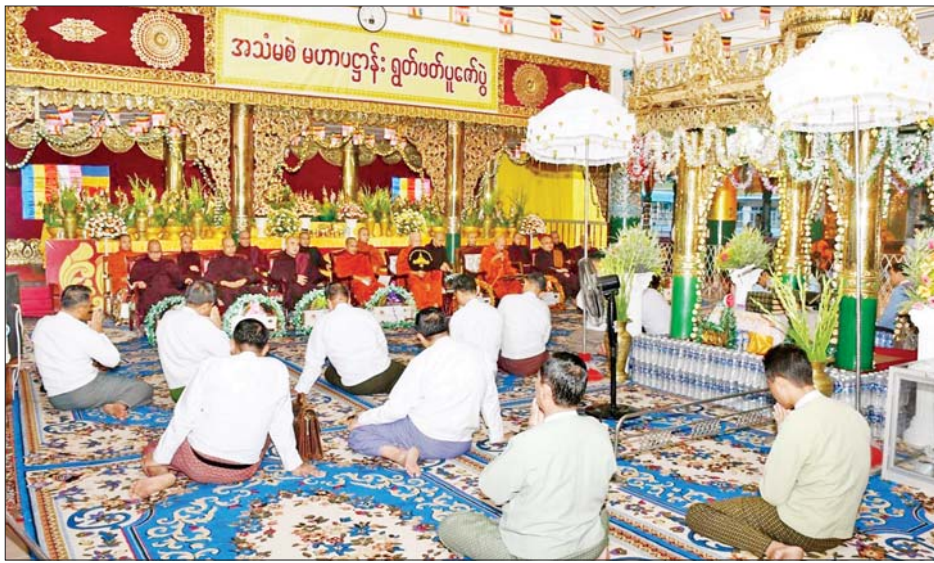
ဘဏ္ဍာတော်ထိန်းဂေါပကအဖွဲ့၊ ဩဝါဒါစရိယ ရန်ကုန်တိုင်းဒေသကြီး သံဃနာယကအဖွဲ့၊ ဥက္ကဋ္ဌ ဆရာတော်ထံမှ ငါးပါးသီလ ခံယူဆောက်တည်ကြ