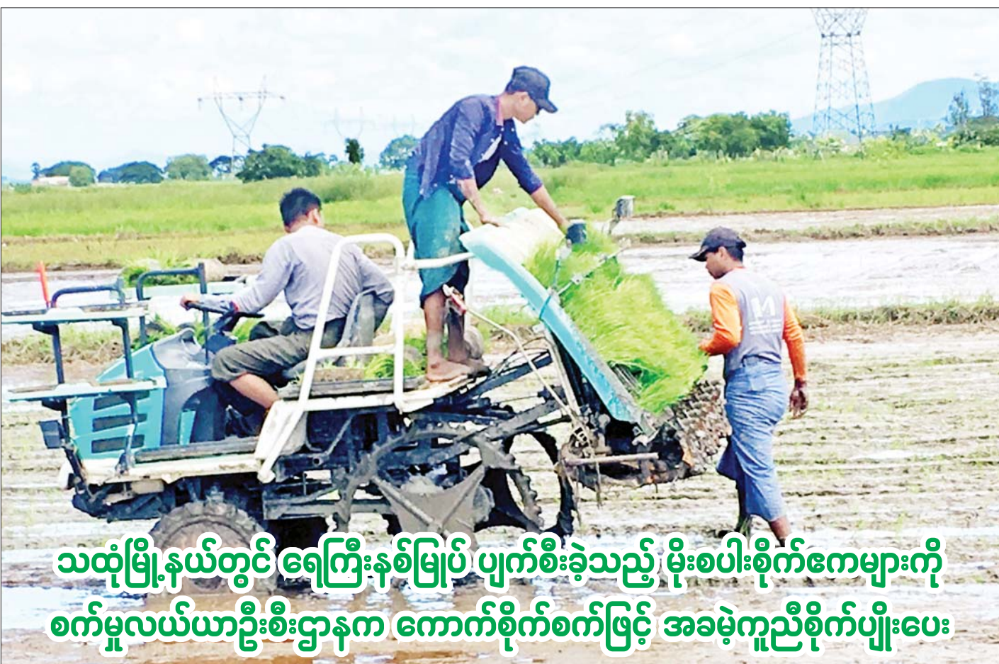
သထုံမြို့နယ်တွင် ရေကြီးနစ်မြုပ် ပျက်စီးခဲ့သည့် မိုးစပါးစိုက်ဧကများကို စက်မှုလယ်ယာဦးစီးဌာနက ကောက်စိုက်စက်ဖြင့် အခမဲ့ကူညီစိုက်ပျိုးပေး

သထုံ စက်တင်ဘာ ၂၅ မွန်ပြည်နယ် သထုံမြို့နယ် သုဝဏ္ဏဝတီမြို့ သိမ်ဆိပ်ကွင်းတွင် ရေကြီး နစ်မြုပ်ပျက်စီးခဲ့သည့် မိုးစပါးစိုက်ဧကများ အမြန်ဆုံးပြန်လည်အစားထိုး စိုက်ပျိုးပြီးစီးရေးအတွက် မြို့နယ်စက်မှုလယ်ယာဦးစီးဌာနက အဆိုပါကျေးရွာရှိ တောင်သူတစ်ဦး၏ လယ်ယာမြေ၌ ယနေ့နံနက်ပိုင်းတွင် ကောက်စိုက်စက်ဖြင့် အခမဲ့ ကူညီစိုက်ပျိုးပေးခဲ့ကြောင်း သိရသည်။ ကူညီစိုက်ပျိုးပေးရာတွင် မြို့နယ်စီမံအုပ်ချုပ်ရေးအဖွဲ့၏ ကြီးကြပ်မှုဖြင့် မြို့နယ်စက်မှုလယ်ယာဦးစီးဌာနမှ ဝန်ထမ်းများက တောင်သူတစ်ဦး၏ လယ်ယာ မြေ ခုနစ်ဧက၌ ၁၈ ရက်သား ရွှေသွယ်ရင်မျိုးစပါးလေးတင်းခွဲရှိ ပျိုးဗန်းအချပ်ရေ ၇၀၀ ကို ကောက်စိုက်စက်ဖြင့် အခမဲ့ကူညီစိုက်ပျိုးပေးခဲ့ကြသည်။ သထုံမြို့နယ်အတွင်း မိုးစပါးစိုက်ဧကပေါင်း ၁၃၃၁၁ ဧက ရှိသည့်အနက် ပြီးခဲ့သည့် စာမျက်နှာ ၃ ကော်လံ ၃ သို့ ❖