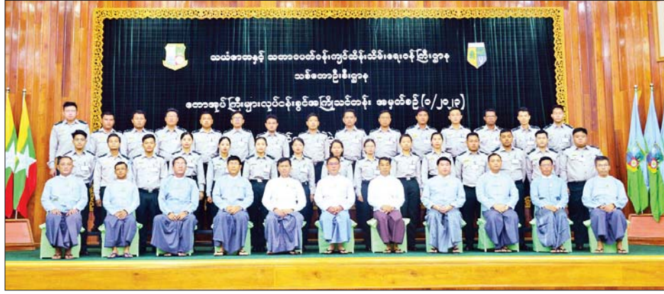
ယခင်က အစည်းအဝေးများတွင် အစည်းအဝေးခန်းမတွင် ကျင်းပခဲ့သည့် သစ်တောဦးစီးဌာန တောအုပ်ကြီးများ လုပ်ငန်းခွင်အကြိုသင်တန်း အမှတ်စဉ်(၁/၂၀၂၃)

ကျိုးစားသွားကြရန် မှာကြား အကြီးအကဲများ၊ သင်တန်းသား သည်။ များနှင့် တာဝန်ရှိသူများ အခမ်းအနားသို့ ဒုတိယဝန်ကြီး တက်ရောက်ကြကြောင်း သိရ များ၊ အမြဲတမ်းအတွင်းဝန်၊ ဌာန သည်။ သတင်းစဉ်