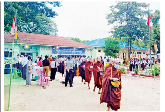
(၅၉)နှစ်မြောက် မြန်မာနိုင်ငံ ရဲတပ်ဖွဲ့နေ့ကို ကြိုဆိုဂုဏ်ပြုသော အားဖြင့် တပ်ကုန်းမြို့နယ် ရဲတပ်ဖွဲ့မှ ရဲတပ်ဖွဲ့ဝင်များ၊ မိသားစုဝင်များ စုပေါင်း၍ တပ်ကုန်းမြို့နယ်အတွင်းရှိ ဘုန်းကြီးကျောင်း ၃၃ ကျောင်း မှ ရဟန်း၊ သံဃာတော် စုစုပေါင်း ၅၈၁ ပါးတို့အား ဝါတွင်းကာလ ဆွမ်းလောင်းလှူခြင်းကို စက်တင်ဘာ ၂၄ ရက်က မြို့မရဲစခန်းဝင်း အတွင်း လောင်းလှူစဉ်။ တင်စိုးလွင်

နှင့်အညီ သစ်တောသယံဇာတ များကို အကောင်းဆုံးစီမံခန့်ခွဲ နိုင်စေရန်၊ လုပ်ငန်းစွမ်းဆောင်ရည် မြင့်မားစေရန်နှင့် လုပ်ထုံးလုပ် နည်း၊ စည်းမျဉ်းစည်းကမ်းများ အတိုင်း လိုက်နာအကောင် အထည်ဖော်ဆောင်ရွက်နိုင်စေရန် ရည်ရွယ်ပြီး ယခုသင်တန်းအား ဖွင့်လှစ်ခြင်းဖြစ်ကြောင်း။ ယခုသင်တန်းတွင် သစ်တော ဦးစီးဌာန၏ လက်ရှိလုပ်ငန်း