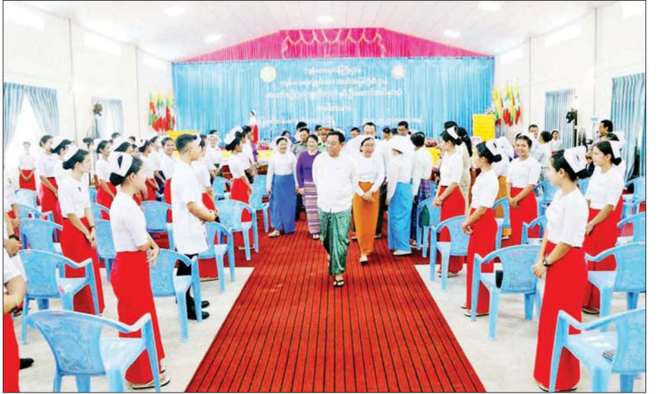
ပါစေကြောင်း ပြောကြားသည်။ အင်္ကျီနှင့် ဦးဆောင်း အပ်နှင်း တတိယ) ပညာရည်ချွန်ဆုရရှိသူ ခွဲကြသည်။ များအား ဆုချီးမြှင့်ခဲ့ကြောင်း သိရ သည်။ ဆက်လက်၍ တိုင်းဒေသကြီး သည်။ ဝန်ကြီးချုပ်က (ပထမ၊ ဒုတိယ၊ တိုင်းဒေသကြီး(ပြန်/ဆက်)

နှင့် သားဖွားဒီပလိုမာသင်တန်း ကျောင်းကိုလည်း ကျောင်း ၅၀ အထိ တိုးချဲ့ဖွင့်လှစ်ပေးခဲ့ပြီးဖြစ်ကြောင်း၊ နိုင်ငံရပ်ခြားနှင့်ဆက်သွယ် အကူအညီယူပြီး အဆင့်မြင့်သူနာပြု အတတ်ပညာများကို ထပ်လောင်း သင်ကြား ပေးလျက်ရှိကြောင်း၊ မိမိတို့၏ အသက်မွေးဝမ်းကျောင်း အတတ်ပညာရပ်ဖြစ်သော သူနာပြု ပညာရပ်ကို မွန်မြတ်သောလုပ်ငန်း အဖြစ် ရေရှည်အောင်မြင်စေရန် အတွက် အထူးအလေးထား ကြိုးစား ဆောင်ရွက်ကြရန်နှင့် ဖလော့ရင့် နိုက်တင်ဂေးကဲ့သို့ သူနာပြုများ များစွာပေါ်ထွန်းလာ