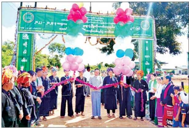
ရှေးဖုံးမှ ယင်းတောင်သူများသည် ဆန်ကို ဆန်ဆိုင်များမှ ကာလပေါက်ဈေးဖြင့် လက်လီ ပြန်လည်ဝယ်ယူစားသောက်ကြောင်း သိရသည်။ ဒေသတွင်း၌ GW 11 လယ်ကွင်း(စက်ကျ) ရောင်းချပါက ပေါင်

ဟိုပုံး စက်တင်ဘာ ၂၄ ရှမ်းပြည်နယ်(တောင်ပိုင်း) ပအိုဝ်းကိုယ်ပိုင်အုပ်ချုပ်ခွင့်ရဒေသ ဟိုပုံးမြို့နယ် ကျေးလက်ဒေသဖွံ့ဖြိုးတိုးတက်ရေးဦးစီးဌာနက လုံ့ခတ် ကျေးရွာအုပ်စု ဟိုနမ့်ကျေးရွာ၌ ကျေးရွာတွင်းကွန်ကရစ်လမ်းဖွင့်ပွဲ အခမ်းအနားကို စက်တင်ဘာ ၂၃ ရက် နံနက်ပိုင်းက အဆိုပါကျေးရွာ၌ ကျင်းပခဲ့ကြောင်း သိရသည်။