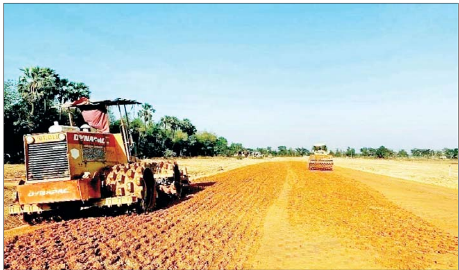
ကွမ်းခြံကုန်းမြို့ရှောင်လမ်းဖောက်လုပ်နေစဉ်။

များ တိုးတက်မြင့်မားစေရန်အတွက် လမ်းကွန်ရက် များ၊ မြို့ရှောင်လမ်းသစ်များဆောက်လုပ်ခြင်းနှင့် လမ်းမကြီးများအား အဆင့်မြှင့်တင်ခြင်း၊ ပြုပြင် ထိန်းသိမ်းခြင်းလုပ်ငန်းများကို ဆောက်လုပ်ရေး ဝန်ကြီးဌာနက စဉ်ဆက်မပြတ် ကြိုးပမ်းဆောင်ရွက် ပေးလျက်ရှိပါကြောင်း ရေးသားတင်ပြလိုက်ရပါ သည်။ ။