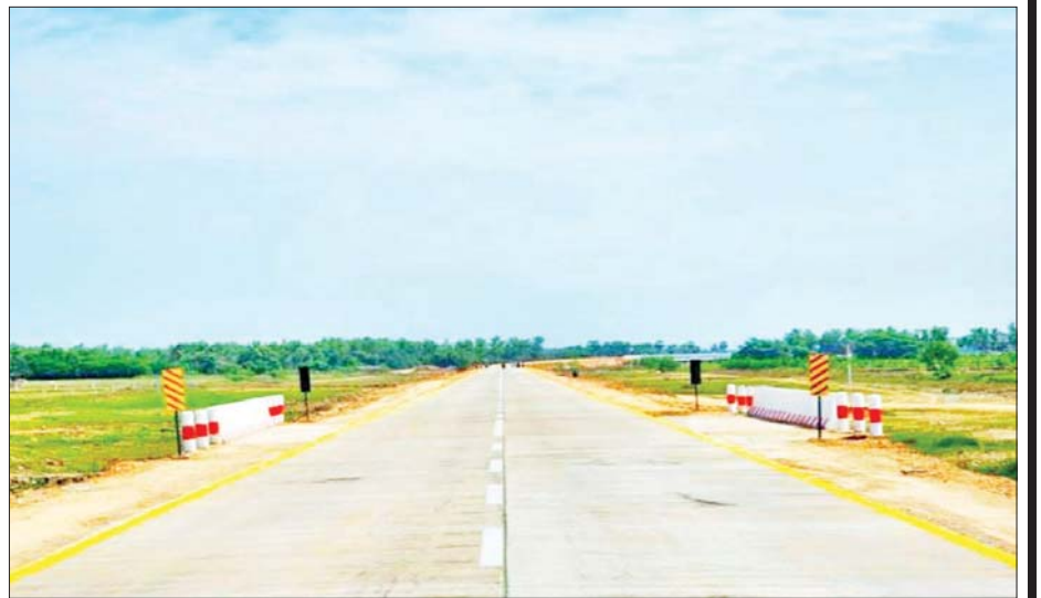
ဖောက်လုပ်ပြီးစီးပြီဖြစ်သော ကွမ်းခြံကုန်းမြို့ရှောင်လမ်းအား တွေ့ရစဉ်။