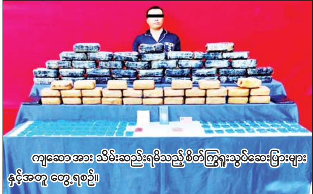
ကျဆောအား သိမ်းဆည်းရမိသည့် စိတ်ကြွေးသွပ်ဆေးပြားများ နှင့်အတူ တွေ့ရစဉ်။

နေပြည်တော် စက်တင်ဘာ ၂၄ မြစ်ကြီးနားမြို့နှင့် နမ့်ခမ်းမြို့တို့တွင် မူးယစ်ဆေးဝါးများ သိမ်းဆည်းရမိခဲ့ကြောင်း မြန်မာနိုင်ငံရဲတပ်ဖွဲ့မှ သိရသည်။