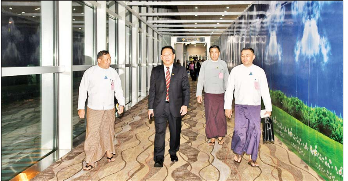
နိုင်ငံများမှ ပြန်ကြားရေးနှင့် ဆက်သွယ် အကဲများ၊ အာဆီယံအထွေထွေအတွင်း ကိုယ်စားလှယ်များ တက်ရောက်ကြ ရေးဝန်ကြီးများနှင့် ဌာနဆိုင်ရာအကြီး ရေးမှူးချုပ်ရုံးမှ တာဝန်ရှိသူများ၊ ကြောင်း သိရသည်။ သတင်းစဉ်

တက်ရောက် အဆိုပါ (၁၆)ကြိမ်မြောက် အာဆီယံ ပြန်ကြားရေးဝန်ကြီးများအစည်းအဝေး (16 th Conference of ASEAN Ministers Responsible for Information-AMRI)၊ အကြိမ်(၂၀)မြောက် အာဆီယံပြန်ကြားရေး ဆိုင်ရာ အဆင့်မြင့်အရာရှိကြီးများအစည်း အဝေး (20 th ASEAN Senior Officials Meeting Responsible for Information-SOMRI) နှင့် ဆက်စပ်အစည်းအဝေးများသို့ အာဆီယံအဖွဲ့ဝင်နိုင်ငံများ၊ မိတ်ဖက် သုံးနိုင်ငံဖြစ်သည့် တရုတ်၊ ဂျပန်၊ ကိုရီးယား