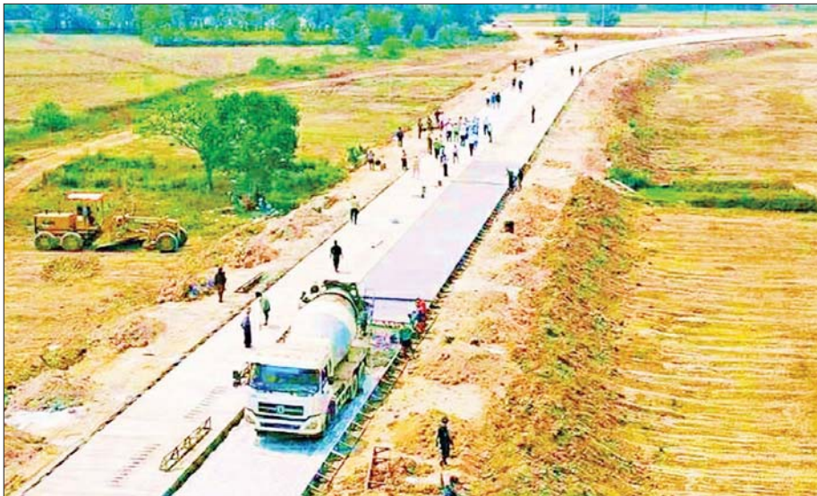
မြို့ရှောင်လမ်းအား ကွန်ကရစ်လမ်းအဖြစ်ဆောင်ရွက်နေစဉ်။

ကွမ်းခြံကုန်းမြို့ရှောင်လမ်း ကွန်ကရစ်လမ်း သစ်ကြီးအား ၂၄-၃-၂၀၂၃ ရက်နေ့တွင် (၆၈)နှစ် မြောက် တစ်မတော်နေ့ကို ဂုဏ်ပြုကြိုဆိုသောအား