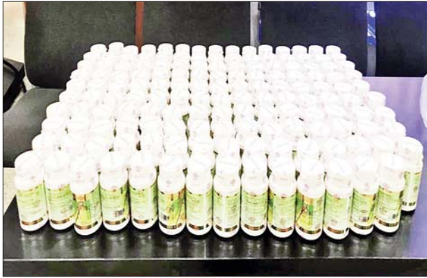
ရန်ကုန်အပြည်ပြည်ဆိုင်ရာလေဆိပ် လေဆိပ်(သွင်းကုန်)၌ သိမ်းဆည်းရမိမှု။

တရားမဝင်ကုန်သွယ်မှုတိုက်ဖျက်ရေး ဦးဆောင်ကော်မတီ၏ ကြီးကြပ်ကွပ်ကဲမှုဖြင့် တရားမဝင်ကုန်သွယ်မှုများကို ဥပဒေနှင့်အညီ ထိရောက်စွာ တားဆီးအရေးယူနိုင်ရေး ဆောင်ရွက်လျက်ရှိရာ စက်တင်ဘာ ၂၀ ရက်နှင့် ၂၁ ရက်တို့တွင် မန္တလေးတိုင်းဒေသကြီး တရားမဝင်ကုန်သွယ်မှုတိုက်ဖျက်ရေးအထူးအဖွဲ့၏ စီမံခန့်ခွဲမှုဖြင့် တာဝန်ကျပူးပေါင်းအဖွဲ့က စစ်ဆေးမှုများဆောင်ရွက်ခဲ့ရာ မူဆယ်-မန္တလေးကားလမ်း မိုင်တိုင်အမှတ်(၂၃)မိုင် (၅)ဖာလုံနှင့် မိုင်တိုင်အမှတ်(၂၁)မိုင် (၆)ဖာလုံတို့၌ မူဆယ်မြို့မှ မန္တလေးမြို့သို့ မောင်းနှင်လာသော ယာဉ်နှစ်စီးပေါ်မှ တရားဝင်စာရွက်စာတမ်း အထောက်အထား တင်ပြနိုင်ခြင်းမရှိသည့် ကလေးထိုင်ခုံ ၁၈ လုံး၊ Collagen Day & Night Cream ဘူး ၅၇၆၀ အပါအဝင် ကုန်ပစ္စည်း ၁၄ မျိုး (ခန့်မှန်းတန်ဖိုးငွေကျပ် ၂၄၀၇၉၉၀၀)နှင့် အဆိုပါပစ္စည်းများတင်ဆောင်လာသည့် Mitsubishi Fuso Truck နှစ်စီး (ခန့်မှန်းတန်ဖိုးငွေကျပ် ၇၅၀၀၀၀၀) စုစုပေါင်း ခန့်မှန်းတန်ဖိုးငွေကျပ် ၉၉၀၇၉၉၀၀ ကို သိမ်းဆည်းရမိခဲ့ပြီး အကောက်ခွန်လုပ်ထုံးလုပ်နည်းများနှင့်အညီ အရေးယူဆောင်ရွက်လျက်ရှိသည်။