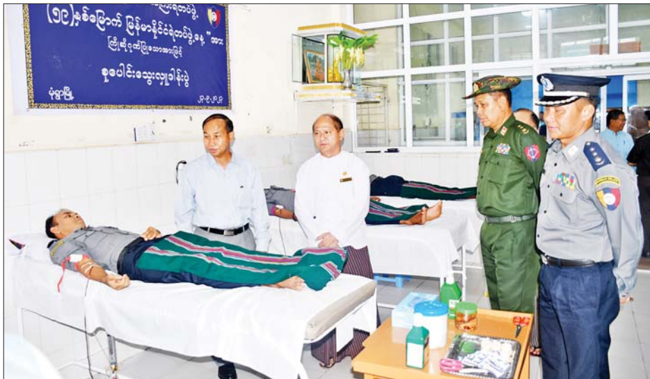
ခရိုင်/မြို့နယ်ရဲတပ်ဖွဲ့ဝင်များ၊ မိသားစုဝင်များနှင့် နေမှုများကို လိုက်လံကြည့်ရှုအားပေးပြီး တာဝန်ရှိသူများနှင့်အတူ အာဟာရဖြည့်စွက်စာများ ပေးအပ်