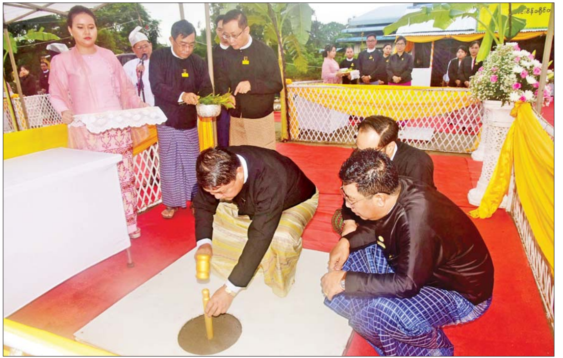
ယင်းအဆောက်အအုံမှာ အလျားပေ ၂၀၀၊ အနံပေ ၁၄၀ ရှိ သံကူကွန်ကရစ် ငါးထပ် အဆောက်အအုံဖြစ်ပြီး M Interior Design ကုမ္ပဏီက တာဝန်ယူတည်ဆောက် သွားမည်ဖြစ်ကြောင်း သိရသည်။ သတင်းစဉ်

ပန္နက်တော်တင် တွင်းတော်ဝန်းပြီး အမွှေးနံ့သာများ ပက်ဖျန်းပေးကြသည်။ ထို့နောက် ပြည်ထောင်စုတရားသူ ကြီးချုပ် ဦးသာဌေးက ပန္နက်တော်တင် တွင်းတော်ဝန်း အောင်မြင်ခြင်းအထိမ်း အမှတ်အဖြစ် ရတနာရွှေမိုးငွေမိုး ရွာသွန်း ပေးပြီး အဆောက်အအုံဆောက်လုပ်မည့် ပရဝဏ်အတွင်း လှည့်လည်ကြည့်ရှု သည်။ အကောင်အထည်ဖော်ဆောင်ရွက် အဆိုပါ အဆောက်အအုံကို ပြည်ထောင်စုတရားလွှတ်တော်ချုပ်က အကောင်အထည်ဖော် ဆောင်ရွက်နေ သည့် ၂၀၂၃-၂၀၂၅ (၅)နှစ်တာ တရား စီရင်ရေး မဟာဗျူဟာစီမံကိန်း၊ ပထမနှစ် လုပ်ငန်းအစီအစဉ် (၂၀၂၃)၏ မဟာဗျူဟာ လုပ်ငန်းနယ်ပယ် (၁)၊ မဟာဗျူဟာ ရည်မှန်းချက် ၁ ဒသမ ၄၊ မဟာဗျူဟာအစီ အစဉ် ၁.၄.၁ နှင့်အညီ စီမံကိန်းချမှတ်၍ ဦးစားပေးအဆင့်(၁)အနေဖြင့် အကောင် အထည်ဖော်ဆောင်ရွက်ခဲ့ခြင်း ဖြစ်သည်။