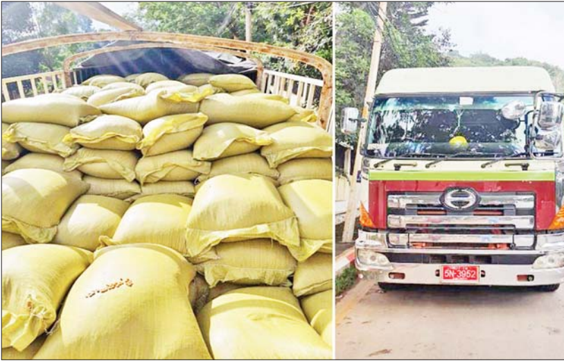
ရှမ်းပြည်နယ်၌ သိမ်းဆည်းရမိမှု။

နေပြည်တော် စက်တင်ဘာ ၁၇ တရားမဝင် ကုန်သွယ်မှုတိုက်ဖျက်ရေး ဦးဆောင်ကော်မတီ၏ ကြီးကြပ်ကွပ်ကဲမှုဖြင့် တရားမဝင် ကုန်သွယ်မှုများကို ဥပဒေနှင့်အညီ ထိရောက်စွာ တားဆီးအရေးယူနိုင်ရေး ဆောင်ရွက်လျက်ရှိရာ စက်တင်ဘာ ၈ ရက်တွင် ရှမ်းပြည်နယ် တရားမဝင်ကုန်သွယ်မှု တိုက်ဖျက်ရေးအထူးအဖွဲ့၏ စီမံခန့်ခွဲမှုဖြင့် တာဝန်ကျပူးပေါင်းအဖွဲ့က စစ်ဆေးမှုများ ဆောင်ရွက်ခဲ့ရာ တောင်ကြီးမြို့ (၄)မိုင်ပူးပေါင်း စစ်ဆေးရေးဂိတ်၌ ယာဉ်နှစ်စီးပေါ်မှ စီးပွားရေးနှင့် ကူးသန်းရောင်းဝယ်ရေးဝန်ကြီးဌာန၏ QR Code (Vehicle Gate Pass Certificate) အား အတုလုပ်ဆောင်၍ တင်ဆောင်လာသည့် ပြောင်းဖူးစေ အိတ် ၁၄၄၀ (ခန့်)မှန်းတန်ဖိုး ငွေကျပ် ၅၀၄၀၀၀၀)နှင့် အဆိုပါပြောင်းဖူးစေ အိတ်များ တင်ဆောင်လာသည့် Hino Profia Tractor Head တစ်စီး၊ MAM Tractor Head တစ်စီးနှင့် နောက်တွဲယာဉ်နှစ်စီး (ခန့်)မှန်း တန်ဖိုးငွေကျပ် ၁၉၀၀၀၀၀၀) စုစုပေါင်း ခန့်မှန်းတန်ဖိုးငွေကျပ် ၂၄၀၄၀၀၀၀ ကို သိမ်းဆည်းရမိခဲ့ပြီး အကောက်ခွန်လုပ်ထုံး လုပ်နည်းများနှင့်အညီ အရေးယူဆောင်ရွက် လျက်ရှိသည်။