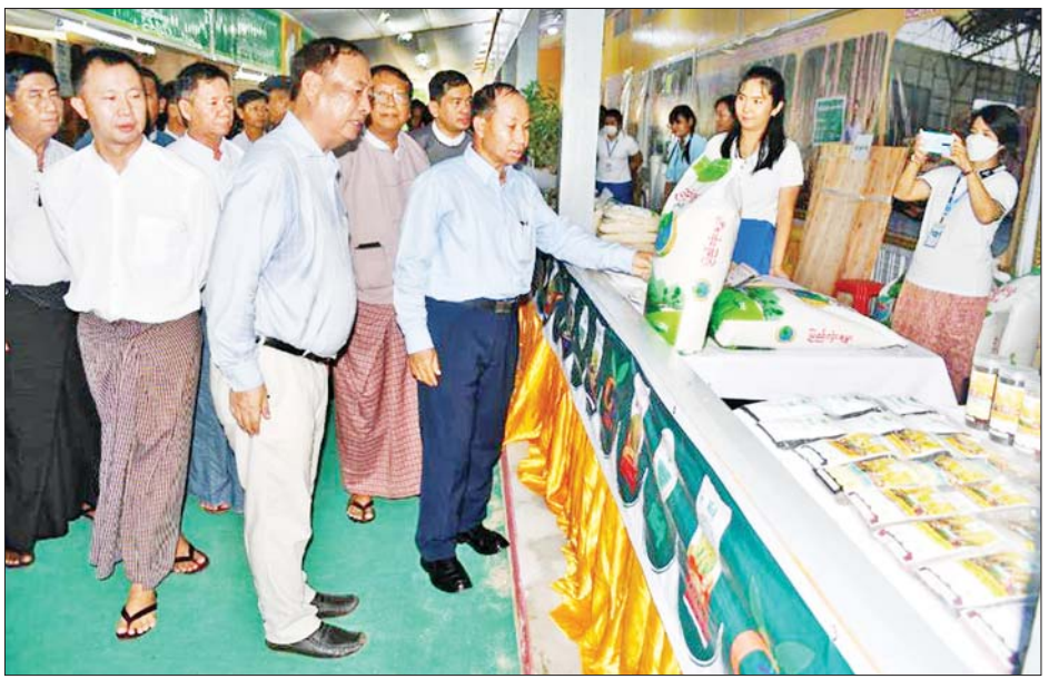
ပစ္စည်း၊ မွေးမြူရေးထုတ်ကုန်များနှင့် စိုက်ပျိုးရေး ကြည့်ရှုကြကြောင်း သိရသည်။ ထုတ်ကုန်ပြခန်း စုစုပေါင်း ၆၆ ခန်းကို လိုက်လံ တိုင်းဒေသကြီး(ပြန်/ဆက်)

ဆက်လက်၍ တိုင်းဒေသကြီး ဝန်ကြီးချုပ်နှင့် တာဝန်ရှိသူများသည် အသေးစား၊ အငယ်စားနှင့် အလတ်စားစီးပွားရေးလုပ်ငန်းရှင်များ၏ ခင်းကျင်း ပြသထားသော စားသောက်ကုန်၊ လျှပ်စစ်ပစ္စည်း၊ ပရိဘောဂပစ္စည်း၊ ပလတ်စတစ်ပစ္စည်း၊ လူသုံးကုန်