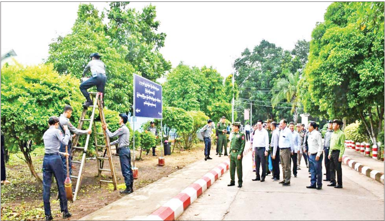
မှူးချုပ်များ၊ ဒုတိယဗိုလ်ချုပ်များ၊ တပ်ဖွဲ့/ဦးစီးဌာနများမှ ရဲအရာရှိကြီးများ၊ ဆေးရုံအုပ်ကြီး ဒေါက်တာရဲမြင့်နှင့် ဆေးရုံတာဝန်ရှိသူများက လှည့်လည် ကြည့်ရှုအားပေးကာ စုပေါင်းသန့်ရှင်းရေး လုပ်အားပေးဆောင်ရွက်သည့် တပ်ဖွဲ့ဝင်နှင့် စာရေးဝန်ထမ်းများကို ရေသန့်၊ ကော်ဖီ၊ ဆီထမင်းနှင့် အကြော်စုတို့ဖြင့် ဧည့်ခံကျွေးမွေးသည်။

အဆိုပါ စုပေါင်းသန့်ရှင်းရေးလုပ်အားပေးပွဲသို့ နိုင်ငံတော်စီမံ အုပ်ချုပ်ရေးကောင်စီအဖွဲ့ဝင် ပြည်ထောင်စုဝန်ကြီးဌာန ပြည်ထောင်စု ဝန်ကြီး ဒုတိယဗိုလ်ချုပ်ကြီးရာပြည့်၊ ဒုတိယဝန်ကြီး ဗိုလ်ချုပ်တိုးရီ၊ ကျန်းမာရေးဝန်ကြီးဌာနမှ ဒုတိယဝန်ကြီး ပါမောက္ခ ဒေါက်တာအေးထွန်း၊ ပြည်ထောင်စုဝန်ကြီးဌာနမှ အမြဲတမ်းအတွင်းဝန်ဦးခိုင်ထွန်းဦး၊ အထွေထွေ အုပ်ချုပ်ရေးဦးစီးဌာန၊ အထူးစုံစမ်းစစ်ဆေးရေးဦးစီးဌာန၊ အကျဉ်းဦးစီး ဌာန၊ မီးသတ်ဦးစီးဌာနနှင့် ကျန်းမာရေးဝန်ကြီးဌာနတို့မှ ညွှန်ကြားရေး