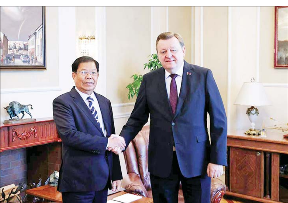
ဒုတိယဝန်ကြီးချုပ်နှင့် ပြည်ထောင်စုဝန်ကြီး ဦးသန်းဆွေနှင့် ဘယ်လာရစ်နိုင်ငံခြားရေးဝန်ကြီး မစ္စတာ ဆာဂေးအယ်လယ်နိမ်တို့ ရင်းရင်းနှီးနှီးနှုတ်ဆက်စဉ်။

လေ့လာလည်ပတ်ခဲ့ကြသည်။ ညနေပိုင်းတွင် ဒုတိယဝန်ကြီးချုပ်နှင့် ပြည်ထောင်စုဝန်ကြီးသည် ဘယ်လာရစ် ဒုတိယနိုင်ငံခြားရေးဝန်ကြီး မစ္စတာ ရော်ဂန်နီးရက် စသော ကော့ဗစ်နှင့်အတူ မြန်မာကောင်စစ်ဝန်ချုပ်ရုံး မင့်စ်မြို့ မြန်မာ ပညာသင်များလည်း တက်ရောက်ခဲ့ကြသည်။ စက်တင်ဘာ ၁၆ ရက်တွင် ဒုတိယဝန်ကြီးချုပ်နှင့် ပြည်ထောင်စုဝန်ကြီး ဦးသန်းဆွေနှင့် ကိုယ်စားလှယ်အဖွဲ့အား နိုမိုစီဗစ်မြို့တွင် နိုမိုစီဗစ်ဒေသအစိုးရအဖွဲ့ ဒုတိယအုပ်ချုပ်ရေးမှူး(၁) မစ္စတာ ယူရီပက်တိုကော့ဗစ်နှင့်အဖွဲ့က နိုမိုစီဗစ်မြို့ရှိ အထက်ကရနေရာများ၊ မြန်မာကောင်စစ်ဝန်ချုပ်ရုံး၊ နိုမိုစီဗစ်မြို့ ဖွင့်လှစ်ရန် လျာထားသော အဆောက်အအုံနှင့် နေရာတို့ကို လိုက်လံပြသခဲ့ပြီး ညစာစားပွဲဖြင့် တည်ခင်းစဉ်ခံသည်။ မြန်မာ ကိုယ်စားလှယ်အဖွဲ့သည် စက်တင်ဘာ ၁၇ ရက် နံနက်ပိုင်းတွင် နိုမိုစီဗစ်မြို့မှ မန္တလေးမြို့သို့ မြန်မာအပြည်ပြည်ဆိုင်ရာလေကြောင်း(MAI)ဖြင့် ပြန်လည်ရောက်ရှိခဲ့ရာ နိုင်ငံခြားရေးဝန်ကြီးဌာနမှ တာဝန်ရှိသူများက ကြိုဆိုခဲ့ကြကြောင်း သိရသည်။