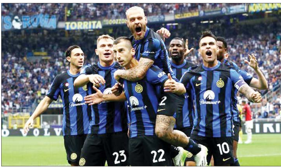
အင်တာမီလန်အသင်းဟာ အေစီမီလန်အသင်းကို အနိုင်ရရှိခဲ့တာကြောင့် စီးရီးအေပွဲစဉ် လေးပွဲကစားပြီးချိန်မှာ ရမှတ် ၁၂ မှတ်ရရှိခဲ့ကာ အမှတ်ပေးဇယားထိပ်ဆုံး ဦးဆောင်နိုင်ခဲ့ပြီး အေစီမီလန်အသင်းကတော့ ရမှတ်ကိုးမှတ်သာ ရရှိထားသေးတာ ဖြစ်ပါတယ်။ ဂျူဗင်တပ် အသင်းကတော့ ရမှတ် ၁၀ မှတ်ရရှိထားတာဖြစ်တဲ့ အတွက် အီတလီစီးရီးအေအမှတ်ပေးဇယား အဆင့်(၂)နေရာမှာ ရပ်တည်နေတာ ဖြစ်ပါတယ်။ အေစီမီလန်အသင်းဟာ စက်တင်ဘာ ၂၆ ရက်မှာ ချန်ပီယံလိဂ်ပွဲစဉ်အဖြစ် နယူးကာဆယ်အသင်းကို အိမ်ကွင်းမှာ ဧည့်ခံကစားရမှာလည်း ဖြစ်ပါတယ်။

အင်တာမီလန် အသင်းဟာ အီတလီစီးရီးအေပြိုင်ပွဲရဲ့ ပွဲစဉ်(၄) မှာ မြို့ခံပြိုင်ဘက် အေစီမီလန်အသင်းနဲ့ ယှဉ်ပြိုင်ကစားခဲ့ရပြီး အဲဒီပွဲစဉ်မှာ ငါးဂိုး-တစ်ဂိုးနဲ့ ဂိုးပြတ် အနိုင်ရရှိခဲ့တာကြောင့် အမှတ်ပေးဇယား ထိပ်ဆုံးမှာ ဆက်လက်ဦးဆောင်ခွင့် ရရှိခဲ့ပါတယ်။ အဲဒီပွဲစဉ်မှာ အင်တာမီလန်အသင်းအတွက် သွင်းဂိုးတွေကို ပွဲကစားချိန် ငါးမိနစ်နဲ့ ၆၉ မိနစ်မှာ အဲဒီတာယန်းက နှစ်ဂိုး၊ ၃၈ မိနစ်မှာ တူရမ်ကတစ်ဂိုး၊ ၇၉ မိနစ်မှာ ပင်နယ်တီကနေ ကာဟန်နော့ဂ်လုက တစ်ဂိုးနဲ့ ၉၀ မှာ ဖရက်တီဆီက တစ်ဂိုး အသီးသီးသွင်းယူပေးခဲ့ပြီး အေစီမီလန်အသင်းအတွက် ချေပဂိုးတစ်ဂိုးကိုတော့ ၅၇ မိနစ်မှာ ရာဖေးလ်လီယိုက သွင်းယူပေးခဲ့တာဖြစ်ပါတယ်။