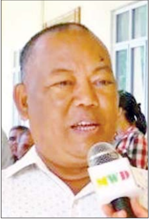
ဒေသခံပြည်သူ အမျိုးသားတစ်ဦး

ကြည့်ရှုအားပေးပြီး နေ့လယ်စာ စားသောက်ဖွယ်ရာများ လှူဒါန်း ခြင်း၊ ပါမောက္ခ/အထူးကုဆရာဝန် ကြီးများအား တွေ့ဆုံနှုတ်ဆက်၍ ကျေးဇူးတင်စကား ပြောကြားကာ ဒေသထွက်လက်ဆောင်ပေးအပ်ခဲ့ သည်။ အလားတူ မွန်ပြည်နယ် လူမှုရေးဝန်ကြီး ဦးမြတ်သွင် သည် ယင်းနေ့ညပိုင်းတွင် ပါမောက္ခ/အထူးကုဆရာဝန်ကြီး များနှင့်အတူ ဂုဏ်ပြုညစာ သုံးဆောင်ခဲ့သည်။ ဆက်လက်ဆောင်ရွက်မည့် အထူးကုဆေးကုသရေးအဖွဲ့ များသည် ၂၀၂၃ ခုနှစ်အတွင်း ကျန်းမာရေးဝန်ကြီးဌာန အစီအစဉ် ဖြင့် ရခိုင်ပြည်နယ် စစ်တွေ မြို့သို့ သုံးကြိမ်နှင့် ပုသိမ်မြို့၊ တောင်ကြီးမြို့၊ မကွေးမြို့၊ ပြည်မြို့၊ မိတ္ထီလာမြို့နှင့် မြိတ်မြို့ တို့သို့ သွားရောက်၍ ဆေးကုသမှု များ ဆောင်ရွက်ပြီးဖြစ်ကာ ကျန်တိုင်းဒေသကြီး/ပြည်နယ်များ သို့လည်း ဆက်လက်ဆောင်ရွက် မည်ဖြစ်ကြောင်း သိရသည်။ သတင်းစဉ်