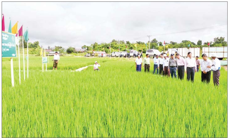
နိုင်ငံတော်စီမံအုပ်ချုပ်ရေးကောင်စီအဖွဲ့ဝင် ဒေါက်တာဘရွှေနှင့်အဖွဲ့ ရမ်းဗြဲမြို့နယ် ကုန်ဘောင်ကျေး ရွာအနီးတွင် မိုးစပါးမျိုးစေ့ထုတ်စံပြစိုက်ကွင်း ဖြစ်ထွန်းအောင်မြင်နေမှုနှင့် ယူရီးယားဓာတ်မြေဩဇာနှင့် စူပါဘိုကာရီ သဘာဝမြေဩဇာစေ့စပ်ကြပက်ခြင်း ကွင်းသရုပ်ပြပွဲသို့ ကြည့်ရှုအားပေးစဉ်။

ယင်းနောက် မြို့မိ မြို့ဖများ နှင့် ဒေသခံပြည်သူများက တောင်ကုတ်မြို့နယ်၏ ဖွံ့ဖြိုး တိုးတက်ရေးအတွက် လိုအပ်ချက် များကို ရှင်းလင်းတင်ပြကြရာ ပြည်နယ်ဝန်ကြီးချုပ်နှင့် ဌာန အလိုက် တာဝန်ရှိသူများက တင်ပြချက်များအပေါ် ပြန်လည် ရှင်းလင်းဆွေးနွေးပြောကြားပြီး နိုင်ငံတော်စီမံ အုပ်ချုပ်ရေး ကောင်စီအဖွဲ့ဝင်က မဟော်သဓာ ကိုယ်ပိုင် အထက်တန်းကျောင်း အတွက် အလှူငွေများကို ပေးအပ် လှူဒါန်းကာ တက်ရောက်လာကြ သူများအား ရင်းရင်းနှီးနှီးတွေ့ဆုံ နှုတ်ဆက်ခဲ့ကြကြောင်း သိရ သည်။