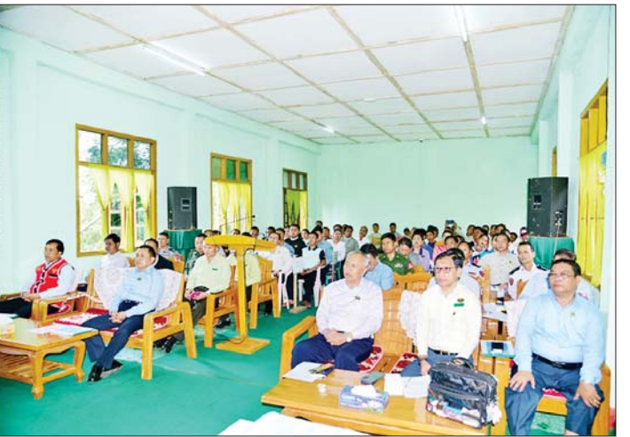
နိုင်ငံတော်စီမံအုပ်ချုပ်ရေးကောင်စီအဖွဲ့ဝင် ဦးရွှေကြိမ်း၊ ဦးရန်ကျော်တို့နှင့် “ဝ” ကိုယ်ပိုင်အုပ်ချုပ်ခွင့်ရတိုင်း မက်မန်းခရိုင် မက်မန်းမြို့နယ် စီမံအုပ်ချုပ်ရေးအဖွဲ့၊ ခရိုင်/မြို့နယ်ဌာနဆိုင်ရာများ၊ တိုင်းရင်းသားစာပေယဉ်ကျေးမှုအဖွဲ့များ၊ မြို့မိမြို့ဖများ၊ ဒေသခံပြည်သူများနှင့် တွေ့ဆုံစဉ်။

လည်းကောင်း၊ ကျေးလက်ဒေသ ဖွံ့ဖြိုးတိုးတက်ရေးအတွက် VDP ရန်ပုံငွေများကို နိုင်ငံတော်စီမံအုပ်ချုပ်ရေးကောင်စီ အဖွဲ့ဝင် ဦးရွှေကြိမ်း၊ ဦးရန်ကျော်၊ ရှမ်းပြည်နယ်ဝန်ကြီးချုပ် ဦးအောင်ဇော်အေး၊ “ဝ” ကိုယ်ပိုင်အုပ်ချုပ်ခွင့်ရ