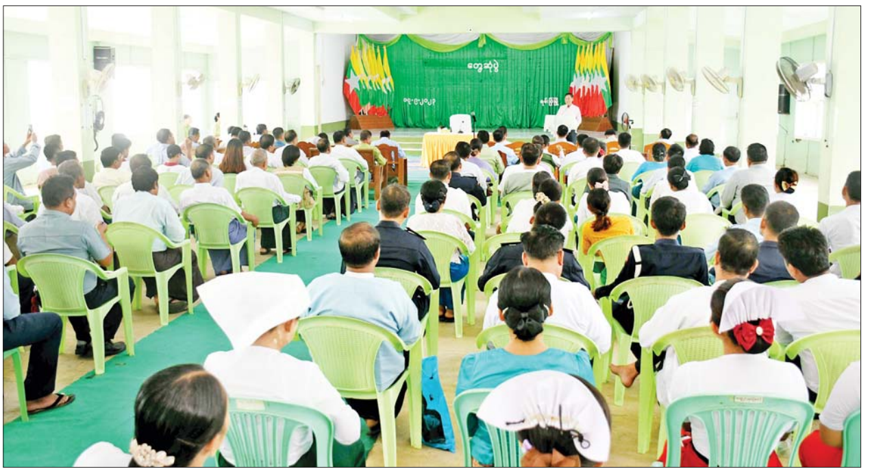
နိုင်ငံတော်စီမံအုပ်ချုပ်ရေးကောင်စီအဖွဲ့ဝင် ဒေါက်တာဘရွှေ ရမ်းဗြဲမြို့ အထွေထွေအုပ်ချုပ်ရေးဦးစီးဌာန ရမ္မာဝတီခန်းမ၌ မြို့နယ်အဆင့် ဌာနဆိုင်ရာများ၊ မြို့မိ မြို့ဖများ၊ ရပ်ကွက်၊ ကျေးရွာအုပ်ချုပ်ရေးမှူးများ၊ လူမှုရေးအဖွဲ့အစည်းများမှ ကိုယ်စားလှယ်များ၊ ဒေသခံပြည်သူများနှင့် တွေ့ဆုံအမှာစကားပြောကြားစဉ်။

ယင်းနောက် နိုင်ငံတော်စီမံ အုပ်ချုပ်ရေးကောင်စီအဖွဲ့ဝင်နှင့် အဖွဲ့သည် ရမ်းဗြဲမြို့သို့သွား ရောက်ပြီး ရမ်းဗြဲမြို့ အထွေထွေ အုပ်ချုပ်ရေးဦးစီးဌာန ရမ္မာဝတီ ခန်းမ၌ မြို့နယ်အဆင့်ဌာနဆိုင်ရာ များ၊ မြို့မိ မြို့ဖများ၊ ရပ်ကွက်၊ ကျေးရွာအုပ်ချုပ်ရေးမှူးများ၊ လူမှု ရေးအဖွဲ့အစည်းများမှ ကိုယ်စား လှယ်များ၊ ဒေသခံပြည်သူများနှင့် တွေ့ဆုံကြသည်။ နိုင်ငံတော်စီမံ