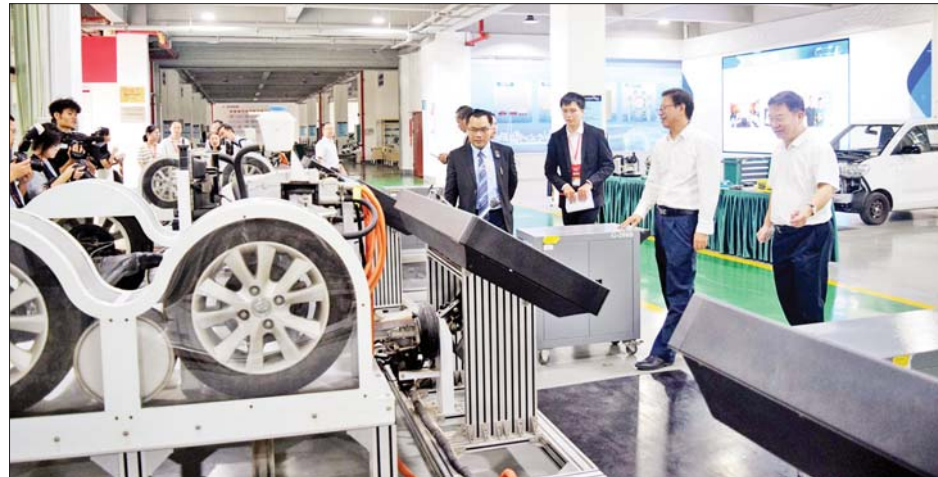
တော်တွင် တိုင်းပြည်သာယာဝပြောရေးနှင့် စားရေ အဖြစ် မျှော်မှန်းဆောင်ရွက်လျက်ရှိပြီး ပြည်သူ ရိက္ခာဖူလုံစေရေးကို အမျိုးသားရေးလုပ်ငန်းစဉ် လူထုတစ်ရပ်လုံး၏ လူမှုစီးပွားဘဝ မြှင့်မားရန်

နေပြည်တော် စက်တင်ဘာ ၁၇ ယနေ့နံနက်ပိုင်းတွင် သိပ္ပံနှင့် နည်းပညာဝန်ကြီး ဌာန ဒုတိယဝန်ကြီး ဒေါက်တာအောင်ဇေယျသည် တရုတ်ပြည်သူ့သမ္မတနိုင်ငံ ကွမ်မင်းကျွန်းကိုယ်ပိုင် အုပ်ချုပ်ခွင့်ရဒေသ နန်နင်းမြို့၌ ကျင်းပသည့် အကြိမ်(၂၀)မြောက် တရုတ်-အာဆီယံ ကုန်စည်ပြပွဲ ဖွင့်ပွဲသို့ တက်ရောက်ပြီး ခင်းကျင်းပြသထားသည့် စက်မှုပစ္စည်းများ၊ လျှပ်စစ်သုံးယာဉ်များနှင့် ပြန်ပြည့်မြဲ စွမ်းအင်သုံးစနစ်များကို ကြည့်ရှုသည်။ ဆွေးနွေး မွန်းလွဲပိုင်းတွင် ဒုတိယဝန်ကြီးသည် နန်နင်း သက်မွေးနည်းပညာကောလိပ်သို့ ရောက်ရှိရာ ပါမောက္ခချုပ်၊ ဒုတိယပါမောက္ခချုပ်နှင့် ကျောင်းအုပ် ကြီးများက ကြိုဆိုကြသည်။ အစည်းအဝေး၌ ဒုတိယဝန်ကြီးက ပြည်ထောင်စုသမ္မတမြန်မာနိုင်ငံ