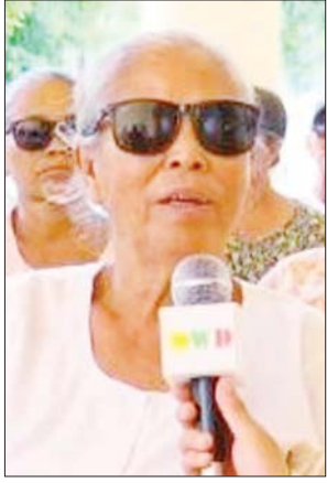
ဒေသခံပြည်သူ အမျိုးသမီးတစ်ဦး

ဧည့်ခံကျွေးမွေးကြသည်။ ယင်းသို့ ဆောင်ရွက်ပေးနေမှုများကို ရွှေဘိုတပ်နယ်မှတာဝန်ရှိသူများ၊ ရွှေဘိုမြို့နယ်အုပ်ချုပ်ရေးမှူးနှင့် တာဝန်ရှိသူများက လာရောက်ကြည့်ရှုအားပေးသည်။ နယ်လှည့်အထူးဆေးကုသရေးအဖွဲ့ထံသို့ လာရောက်ဆေးကုသမှု ခံယူနေသည့် ဒေသခံပြည်သူများ၏ စကားသံများကိုလည်း ယခုလို ကြားသိရပါတယ်-