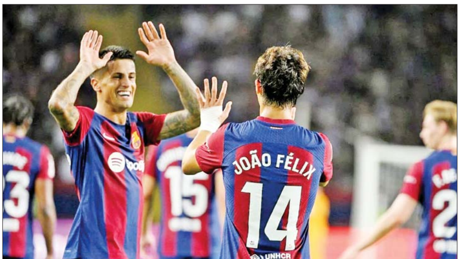
မရှိ၊ ဗလင်စီယာအသင်းက အက်သလက်တီကို အသင်းက ဆယ်လ်တာဗီဂိုအသင်းကို တစ်ဂိုး-ဂိုးမရှိ မက်ဒရစ်အသင်းကို သုံးဂိုး-ဂိုးမရှိ၊ မာယော့က စသဖြင့် အနိုင်ရရှိခဲ့တာဖြစ်ပါတယ်။

ဖြစ်ပါတယ်။ အခုပွဲစဉ်မှာ ဘာစီလိုနာအသင်းအတွက် ပထမဆုံး သွင်းဂိုးသွင်းယူပေးနိုင်ခဲ့တဲ့ ပေါ်တူဂီတိုက်စစ်မှူး ဂျာဆိုဖီလစ်ဟာ အက်သလက်တီကိုမက်ဒရစ်အသင်းကနေ ဘာစီလိုနာအသင်းဆီ ပြောင်းရွှေ့လာခဲ့ပြီးနောက် ပထမဆုံးသွင်းယူခဲ့တဲ့ သွင်းဂိုးလည်း ဖြစ်ပါတယ်။ ဘာစီလိုနာအသင်းဟာ ရီးယဲလ်မက်ဒရစ်အသင်းနဲ့ ရီးယဲလ်ဆိုဒီဒက်အသင်းတို့ ပွဲစဉ်မတိုင်မီ အမှတ်ပေးဇယားဒုတိယနေရာက ရီးယဲလ်မက်ဒရစ်အသင်းကို တစ်မှတ်အသာနဲ့ ဦးဆောင်ထားနိုင်ခဲ့တာဖြစ်ပြီး ဘာစီလိုနာအသင်းအနေနဲ့ စပိန်လာလီဂါ ပွဲစဉ် ငါးပွဲကစားပြီးချိန်မှာ လေးပွဲနိုင်၊ တစ်ပွဲသရေ ရလဒ်နဲ့အတူ ရမှတ် ၁၃ မှတ်ရရှိထားတာဖြစ်ပါတယ်။ အခြားသော စပိန်လာလီဂါပွဲစဉ်တွေမှာတော့ ဘီဘာအိုအသင်းက ကာဒစ်စ်အသင်းကို သုံးဂိုး-ဂိုး