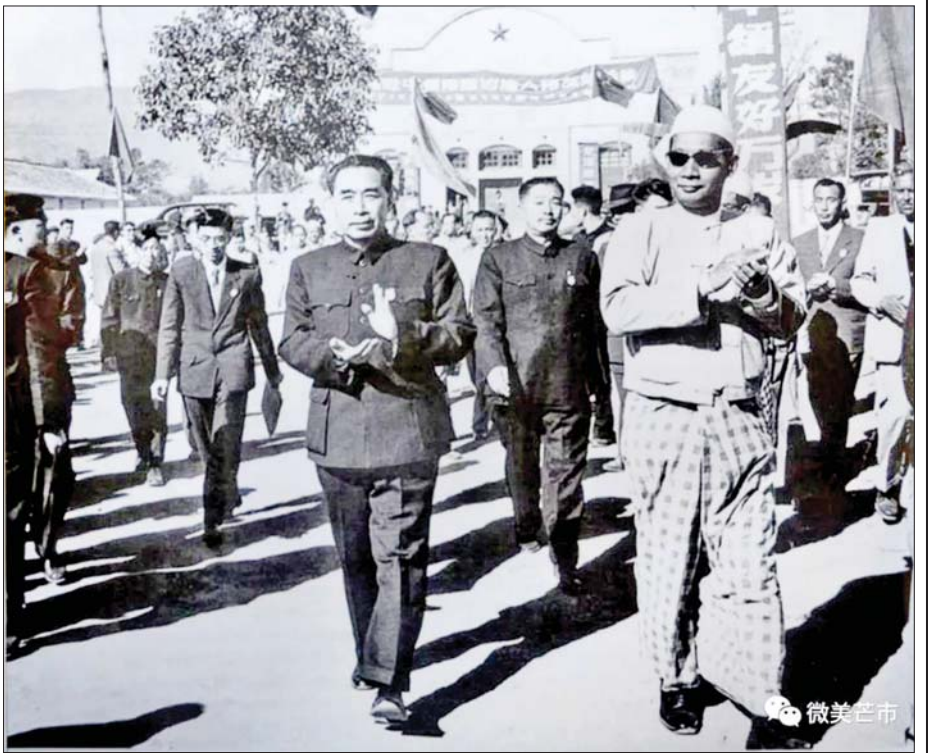
၁၉၅၆ ခုနှစ်က ယူနန်ပြည်နယ် မန်စီမြို့၌ ဆွေမျိုးပေါက်ဖော် ချစ်ကြည်ရေးစတင်တည်ထောင်ခြင်း အထိမ်းအမှတ် ကျင်းပရာ မြန်မာဝန်ကြီးချုပ် ဦးဗဆွေနှင့် တရုတ်ဝန်ကြီးချုပ် မစ္စတာချူအင်လိုင်းတို့ တက်ရောက်ကြစဉ်။

ယခုလိုဒေသတွင်းမှာ ပထဝီအနေအထားအရ အရေးပါတဲ့ မြန်မာနိုင်ငံကို ကိုဗစ်ကာလအလွန် ပထမဆုံးအကြိမ်ကျင်းပတဲ့ (၇)ကြိမ်မြောက် တရုတ်-တောင်အာရှ ကုန်စည်ပြပွဲရဲ့ ဂုဏ်ထူးဆောင်နိုင်ငံအဖြစ်ပါဝင်ဖို့ တရုတ်နိုင်ငံ ယူနန်ပြည်နယ်အစိုးရက ဖိတ်ကြားခဲ့ပါတယ်။ မြန်မာနိုင်ငံအနေနဲ့ ကုမင်းမြို့မှာ ကျင်းပတဲ့ တရုတ်-တောင်အာရှ ကုန်စည်ပြပွဲနဲ့ တရုတ်(ကုမင်း) ပို့ကုန်/သွင်းကုန် ကုန်စည်ပြပွဲတွေမှာ နှစ်စဉ်ပါဝင်ပြသခဲ့ပါတယ်။ မြန်မာနိုင်ငံအနေနဲ့ ၂၀၁၈ ခုနှစ်မှာ ကျင်းပပြုလုပ်ခဲ့တဲ့ တရုတ်-တောင်အာရှ ကုန်စည်ပြပွဲရဲ့ ဂုဏ်ထူးဆောင်နိုင်ငံအဖြစ် ပါဝင်ဆောင်ရွက်ခဲ့ပြီး ယခုနှစ်မှာ ဒုတိယအကြိမ် ပါဝင်ဆင်နွှဲခြင်းဖြစ်ပါတယ်။