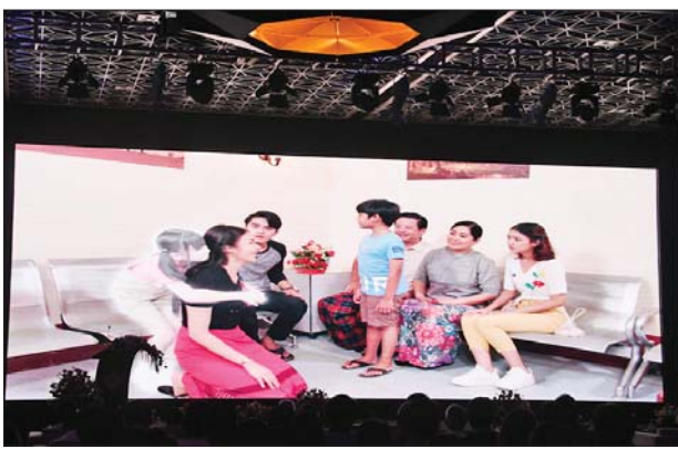
ပြည်ထောင်စုဝန်ကြီး ဦးမောင်မောင်အုန်းနှင့် တာဝန်ရှိသူများ “ချစ်လှစွာသော” ရုပ်သံဇာတ်လမ်းတွဲမှ ပြကွက်များထုတ်နုတ်ပြသမှုကို ကြည့်ရှုအားပေးစဉ်။

ရန်ကုန် စက်တင်ဘာ ၁၅ (၆၇)နှစ်မြောက် မြန်မာ-ဖိလစ်ပိုင် ချစ်ကြည်ရေးအထိမ်းအမှတ် နှစ်နိုင်ငံ အနုပညာပူးပေါင်းဆောင်ရွက်မှု အဖြစ် ရိုက်ကူးတင်ဆက်သည့် “ချစ်လှစွာသော” မြန်မာရုပ်သံဇာတ်လမ်းတွဲ စာနယ်ဇင်းမိတ်ဆက်ပွဲကို ယနေ့ မွန်းလွဲပိုင်းတွင် ရန်ကုန်မြို့ Wyndham Grand Yangon ဟိုတယ် အမရပူရခန်းမ၌ ကျင်းပသည်။