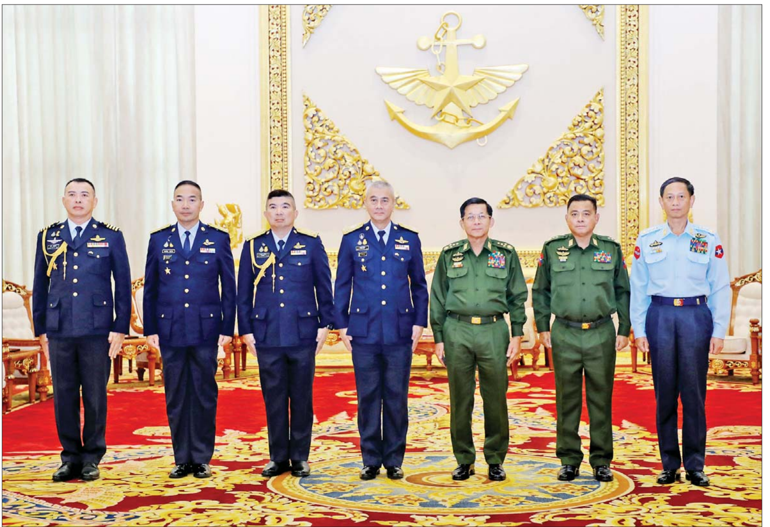
နိုင်ငံတော်စီမံအုပ်ချုပ်ရေးကောင်စီဥက္ကဋ္ဌ တပ်မတော်ကာကွယ်ရေးဦးစီးချုပ် ဗိုလ်ချုပ်မှူးကြီး မင်းအောင်လှိုင် ဦးဆောင်သောအဖွဲ့နှင့် ထိုင်းဘုရင့်လေတပ်ဦးစီးချုပ် Air Chief Marshal Alongkorn Vannarot ဦးဆောင်သည့် ကိုယ်စားလှယ်အဖွဲ့တို့ စုပေါင်းမှတ်တမ်းတင်ဓာတ်ပုံရိုက်စဉ်။

☆ ရှေးဦးမှ ထိုသို့ တွေ့ဆုံဆွေးနွေးရာတွင် နှစ်နိုင်ငံ တပ်မတော်နှစ်ရပ်အကြား ချစ်ကြည်ရင်းနှီးမှုများ တိုးတက်ကောင်းမွန်လျက်ရှိသည့် အခြေအနေများနှင့် မြန်မာ့တပ်မတော်(လေ)နှင့် ထိုင်းဘုရင့်လေတပ်အကြား ပူးပေါင်းဆောင်ရွက်လျက်ရှိသည့် အခြေအနေများ၊ မြန်မာ-ထိုင်းတပ်မတော်နှစ်ရပ်အကြား အဆင့်မြင့်အရာရှိကြီးများ အစည်းအဝေး (HLC)နှင့် မြန်မာ-ထိုင်း ဒေသဆိုင်ရာ နယ်ခြားကော်မတီအစည်းအဝေး (RBC) ကို နှစ်စဉ်ဆောင်ရွက်နေသည့် အခြေအနေများ၊ နှစ်နိုင်ငံ ချစ်ကြည်ရင်းနှီးမှု တိုးတက်ရေးဆိုင်ရာ ကိစ္စရပ်များနှင့် ချစ်ကြည်ရေးခရီးစဉ်များ လည်ပတ်ရေးဆိုင်ရာကိစ္စရပ်များကို ခင်မင်ရင်းနှီးစွာ အပြန်အလှန်ဆွေးနွေးခဲ့ကြသည်။ အမှတ်တရ လက်ဆောင်ပစ္စည်းများ အပြန်အလှန် ပေးအပ် တွေ့ဆုံပွဲအပြီးတွင် နိုင်ငံတော်စီမံအုပ်ချုပ်ရေးကောင်စီဥက္ကဋ္ဌ တပ်မတော်ကာကွယ်ရေးဦးစီးချုပ်နှင့် ထိုင်းနိုင်ငံလေတပ်ဦးစီးချုပ်တို့သည် အမှတ်တရ လက်ဆောင်ပစ္စည်းများ အပြန်အလှန် ပေးအပ်ခဲ့ပြီး တက်ရောက်လာကြသူများနှင့်အတူ စုပေါင်းမှတ်တမ်းတင်ဓာတ်ပုံ ရိုက်ခဲ့ကြကြောင်း သိရသည်။ သတင်းစဉ်