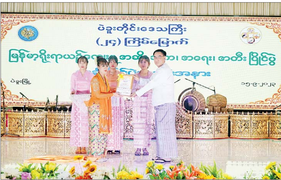
ဆုတံဆိပ်နှင့် ဂုဏ်ပြုမှတ်တမ်းလွှာများ၊ တရား အစိုးရအဖွဲ့ဝင် ဝန်ကြီးများနှင့် ၎င်းတို့၏ဇနီးများက လွှတ်တော်တရားသူကြီးချုပ်ဒေါ်လွင်လွင်အေးကျော်၊ အထူးဆုရရှိသူများ၊ ဒုတိယဆု ရရှိသူများ၊ တတိယဆု

ထို့နောက် တိုင်းဒေသကြီး ဝန်ကြီးချုပ် ဦးမျိုးဆွေဝင်းနှင့် ဇနီးတို့က ပထမဆုရရှိသူများအား