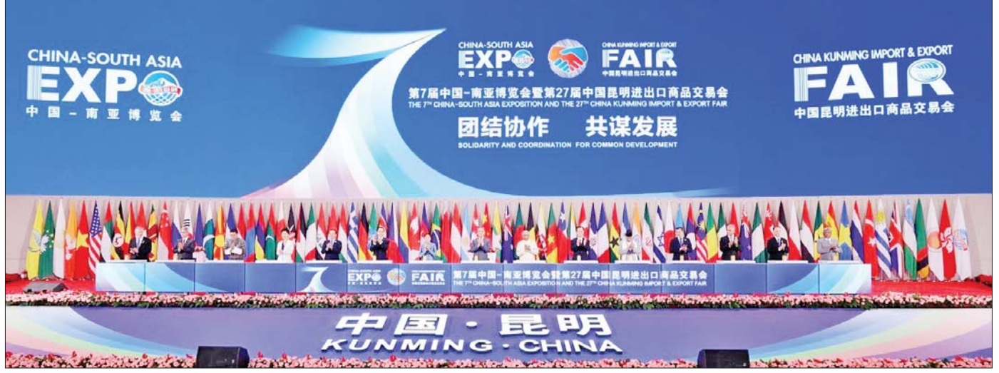
ပြည်ထောင်စုဝန်ကြီး ဦးအောင်နိုင်ဦး တရုတ်၊ တောင်အာရှနှင့် အရှေ့တောင်အာရှနိုင်ငံများမှ ကိုယ်စားလှယ်အဖွဲ့ခေါင်းဆောင်တို့နှင့်အတူ (၇)ကြိမ်မြောက် တရုတ်-တောင်အာရှ ကုန်စည်ပြပွဲကို ဖွင့်လှစ်ပေးစဉ်။

(၇)ကြိမ်မြောက် တရုတ်-တောင်အာရှကုန်စည်ပြပွဲနဲ့ (၂၇)ကြိမ်မြောက် တရုတ် (ကုမင်း) ပို့ကုန်/သွင်းကုန်ကုန်စည်ပြပွဲမှာ စီးပွားရေးနှင့် ကူးသန်းရောင်းဝယ်ရေးဝန်ကြီးဌာန မြန်မာကုန်သွယ်မှု မြှင့်တင်ရေးအဖွဲ့ရဲ့ ဦးဆောင်မှုနဲ့ မြန်မာကုန်သည် လုပ်ငန်းရှင်တွေက ကုန်စည်ပြခန်း ၃၅ ခန်းမှာ မြန်မာ့ထွက်ကုန်ပစ္စည်းတွေဖြစ်တဲ့ ဆန်၊ ပဲ၊ ပြောင်း၊ နှမ်း၊ ကော်ဖီ၊ လက်ဖက်၊ ပျားရည်နဲ့ အသင့်စားစားသောက်ကုန်တွေ၊ ရေထွက်ကုန်ပစ္စည်းတွေနဲ့ ကျောက်မျက်ရတနာတွေကို ငါးရက်ကြာ ခင်းကျင်းပြသရောင်းချခဲ့ကြပါတယ်။ ဒါ့အပြင် မြန်မာကုန်စည်ပြခန်းကို လာရောက်ကြည့်ရှုသူတွေကို မြန်မာ့ထုတ်ကုန်တွေဖြစ်တဲ့ စာမျက်နှာ ၁၇ သို့