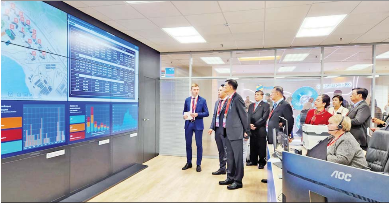
နိုင်ငံတော်စီမံအုပ်ချုပ်ရေးကောင်စီအဖွဲ့ဝင် ဒုတိယဝန်ကြီးချုပ်နှင့် ပြည်ထောင်စုဝန်ကြီး ဗိုလ်ချုပ်ကြီးမြထွန်းဦး ခေါင်းဆောင်သော မြန်မာကိုယ်စားလှယ်အဖွဲ့ ဗလာဒီဗော့စတော့ခ် အပြည်ပြည်ဆိုင်ရာဆိပ်ကမ်းတွင် ကြည့်ရှုလေ့လာစဉ်။

* စာမျက်နှာ ၄ မှ နံနက်ပိုင်းတွင် Aquarius နည်းပညာကုမ္ပဏီမှ တာဝန်ရှိသူများအား လက်ခံတွေ့ဆုံရာတွင် မြန်မာနိုင်ငံ၏ ဒစ်ဂျစ်တယ်အသွင်ကူးပြောင်းရေး၊ ဒစ်ဂျစ်တယ်စီးပွားရေး၊ ဆိုက်ဘာလုံခြုံရေးနှင့် သတင်းအချက်အလက်နည်းပညာ ကဏ္ဍများတွင် ပူးပေါင်းဆောင်ရွက်နိုင်ရေးနှင့် ရင်းနှီးမြှုပ်နှံနိုင်မည့် အခွင့်အလမ်းများ၊ Aquarius နည်းပညာကုမ္ပဏီ၏ ထုတ်ကုန်များအား ပိုမိုနားလည်စေရန် စီးပွားရေးလုပ်ငန်းများ အချင်းချင်း တွေ့ဆုံဆွေးနွေးမှုများ ဆောင်ရွက်ရန်ကိစ္စရပ်များကို လည်းကောင်း၊ စက်တင်ဘာ ၁၃ ရက် နံနက်ပိုင်းတွင် Far Eastern Federal University မှ တာဝန်ရှိသူများအား လက်ခံတွေ့ဆုံရာတွင် မြန်မာနိုင်ငံ ကျန်းမာရေးဝန်ကြီးဌာနနှင့် Far Eastern Federal University (FEFU) တို့အကြား လက်မှတ်ရေးထိုးထားသည့် ဆေးဘက်ဆိုင်ရာပညာရပ်ပူးပေါင်းဆောင်ရွက်မှုဆိုင်ရာ နားလည်မှုစာချုပ်လွှာအကောင်