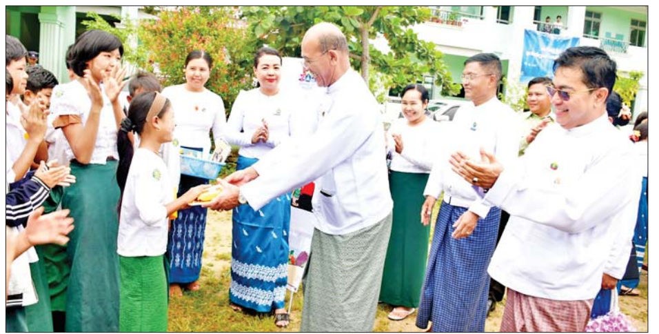
ဒုတိယဝန်ကြီး ဒေါက်တာမိုးဇော်ထွန်း ကျောင်းအားကစားပြိုင်ပွဲတွင် ဆုရရှိသူ ကျောင်းသူတစ်ဦးကို စာရေးကိရိယာနှင့် မုန့်များပေးအပ်စဉ်။

ထို့နောက် ဒုတိယဝန်ကြီး ဦးရဲတင့်က နှုတ်ခွန်းဆက်စကားပြောကြားရာတွင် ပညာသင်နေသည့် အရွယ်တွင် စာကို ကြိုးစားသင်ယူပြီး စာတတ်စေရန်၊ အတန်းပညာ အောင်မြင်စေရေး ဆောင်ရွက်သွားကြရန်လိုအပ်ကြောင်း၊ သို့သော် စာတတ်ရုံ ပညာတတ်ရုံဖြင့် ဘဝတွင် ပြည့်စုံနိုင်မည်မဟုတ်ကြောင်း၊ ယခုကျင်းပခဲ့သည့် ဟောပြောပွဲရည်ရွယ်ချက်အတိုင်း ဗလင်းတန်နှင့်ပြည့်ဝသည့် လူငယ်များဖြစ်ကြရန် မျှော်လင့်ကြောင်း၊ ကျန်းမာကြံ့ခိုင်ပြီး အကျင့်စာရိတ္တကောင်းမွန်သော လူငယ်များ၊ ပတ်ဝန်းကျင်နှင့် နိုင်ငံတော်အတွက် အတွေးအခေါ်မှန်မှန်ကန်ကန်ဖြင့် ကောင်းကျိုးပြုနိုင်သူများဖြစ်အောင် ကြိုးစားကြစေလိုကြောင်း၊ နိုင်ငံတော်က လူငယ်များကို အနာဂတ်အင်အားအဖြစ် အားကိုးအားထားပြုစေချင်ကြောင်း၊ ဘက်ပေါင်းစုံမှ ထူးချွန်ထက်မြက်သော၊ နိုင်ငံအနာဂတ်အတွက် ကိုယ်ခံအားကောင်းသော လူငယ်များ၊ ခေါင်းဆောင်များဖြစ်အောင် ကြိုးစားသွားကြရန်