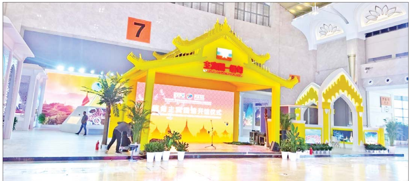
(၇)ကြိမ်မြောက် တရုတ်-တောင်အာရှ ကုန်စည်ပြပွဲ၏ ဂုဏ်ထူးဆောင်နိုင်ငံဖြစ်သည့် မြန်မာပြခန်းဆောင်ကို တွေ့ရစဉ်။

ပြည်ထောင်စုဝန်ကြီး ဦးအောင်နိုင်ဦးက ကူမင်း မြို့မှာ China Media Group (CMG) မြန်မာအစီအစဉ် သတင်းထောက်ကို လက်ခံတွေ့ဆုံပြီး မြန်မာ- တရုတ် စီးပွားရေးပူးပေါင်းဆောင်ရွက်မှုများ၊ တရုတ်နိုင်ငံက အကောင်အထည်ဖော်လျက်ရှိတဲ့ Belt and Road Initiative (BRI) အပေါ် သုံးသပ်ချက် တွေကို ရှင်းလင်းဖြေကြားခဲ့ပါတယ်။ အလားတူ Phoenix ရုပ်သံဌာနမှ သတင်းထောက်နဲ့တွေ့ပြီး မြန်မာနိုင်ငံအနေနဲ့ နိုင်ငံတကာနဲ့ ပူးပေါင်း ဆောင်ရွက်လျက်ရှိတဲ့ အခြေအနေ၊ တရုတ်နိုင်ငံက