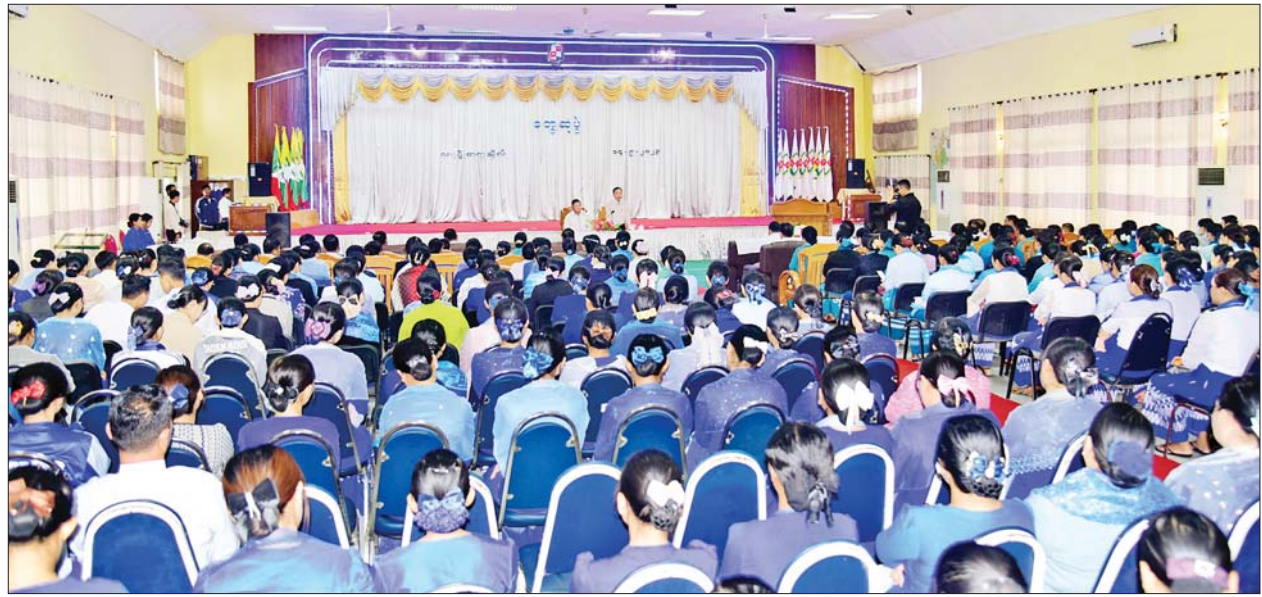
နိုင်ငံတော်စီမံအုပ်ချုပ်ရေးကောင်စီအဖွဲ့ဝင် ဦးရွှေကြိမ်း၊ လားရှိုးတက္ကသိုလ်၌ အဆင့်မြင့်ပညာဦးစီးဌာနမှ ဆရာ ဆရာမများနှင့် တွေ့ဆုံအမှာစကားပြောကြားစဉ်။

များဖြစ်လာရန် ဆရာ ဆရာမများ က ရှေ့ဆောင်လမ်းပြ ဆောင်ရွက် ပေးမှသာလျှင် အောင်မြင်မှုရရှိ မည်ဖြစ်ကြောင်း၊ နိုင်ငံတော် အကြီးအကဲက ပညာရေးကို အားသွန်ခွန်စိုက် အားပေး ဆောင်ရွက်နေသည်ကို ဆရာ ဆရာမများ အသိဖြစ်ကြောင်း၊ ဆရာ ဆရာမများအနေဖြင့် ကျောင်းသား ကျောင်းသူများကို သင်ကြားဆုံးမလမ်းညွှန်သည့် အခါဗလငါးတန်နှင့် ပြည့်စုံစေရေး ဆောင်ရွက်ပေးရန် လိုကြောင်း ပြောကြားသည်။