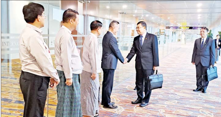
ဖွံ့ဖြိုးတိုးတက်ရေးဝန်ကြီးဌာနမှ ဝန်ကြီးနှင့် တာဝန်ရှိသူများ၊ အာဆီယံနိုင်ငံများမှ ဖိတ်ကြားထားသော ဝန်ကြီးများ တက်ရောက်မည်ဖြစ်ကြောင်း သိရသည်။ သတင်းစဉ်

ရေးဝန်ကြီးဌာန မြို့ပြနှင့်အိမ်ရာဖွံ့ဖြိုးရေးဦးစီးဌာနမှ ညွှန်ကြားရေးမှူးချုပ်၊ ဒုတိယညွှန်ကြားရေးမှူးချုပ်နှင့် တာဝန်ရှိသူများ၊ မြန်မာနိုင်ငံဆိုင်ရာ တရုတ်ပြည်သူ့သမ္မတနိုင်ငံသံရုံးမှ တာဝန်ရှိသူများက ရန်ကုန်အပြည်ပြည်ဆိုင်ရာလေဆိပ်၌ ပို့ဆောင်နှုတ်ဆက်ကြသည်။ အဆိုပါ အစည်းအဝေးကို ကွမ်ရှီးကျွန်းကိုယ်ပိုင်အုပ်ချုပ်ခွင့်ရဒေသ နန်နင်းမြို့တွင် စက်တင်ဘာ ၁၅ ရက်မှ ၁၇ ရက်အထိ ကျင်းပမည်ဖြစ်ပြီး တရုတ်ပြည်သူ့သမ္မတနိုင်ငံရှိ အိမ်ရာနှင့် မြို့ပြ - ကျေးလက်