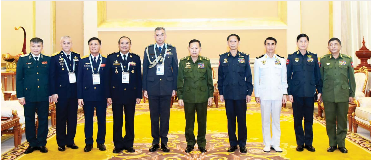
နိုင်ငံတော်စီမံအုပ်ချုပ်ရေးကောင်စီ ဒုတိယဥက္ကဋ္ဌ ဒုတိယတပ်မတော်ကာကွယ်ရေးဦးစီးချုပ် ကာကွယ်ရေးဦးစီးချုပ်(ကြည်း) ဒုတိယဗိုလ်ချုပ်မှူးကြီး စိုးဝင်း ဦးဆောင်သောအဖွဲ့နှင့် အာဆီယံလေတပ်ဦးစီးချုပ်များ စုပေါင်းမှတ်တမ်းတင်ဓာတ်ပုံရိုက်စဉ်။

တွေ့ဆုံရာတွင် နိုင်ငံတော်စီမံအုပ်ချုပ်ရေးကောင်စီဒုတိယဥက္ကဋ္ဌ ဒုတိယတပ်မတော် ကာကွယ်ရေးဦးစီးချုပ် ကာကွယ်ရေးဦးစီးချုပ်(ကြည်း) ဒုတိယဗိုလ်ချုပ်မှူးကြီး စိုးဝင်းက နိုင်ငံတော်စီမံအုပ်ချုပ်ရေးကောင်စီ အနေဖြင့် နိုင်ငံတော် ဘက်စုံဖွံ့ဖြိုးတိုးတက်ရေးအတွက် ရှေ့လုပ်ငန်းစဉ်(၅)ရပ်၊ ဦးတည်ချက် (၉)ရပ် ချမှတ်၍ နိုင်ငံရေးရည်မှန်းချက်(၂)ရပ်၊ အမျိုးသားရေးရည်မှန်းချက်(၂)ရပ်ကို အောင်မြင်အောင် အကောင်အထည်ဖော်ဆောင်ရွက်နေသည့် အခြေအနေများ၊ လူဦးရေနှင့် အိမ်အကြောင်းအရာ သန်းခေါင်စာရင်း စမ်းသပ်ကောက်ယူမှုအခြေအနေနှင့် (၁၀)နှစ်တစ်ကြိမ် ဆောင်ရွက်ရမည့် လူဦးရေနှင့် အိမ်အကြောင်းအရာ သန်းခေါင်စာရင်းကောက်ယူရေးဆိုင်ရာ ပြင်ဆင်ဆောင်ရွက်နေမှုများ၊ လွတ်လပ်ပြီးတရားမျှတသော (Free and Fair) ပါတီစုံဒီမိုကရေစီအထွေထွေရွေးကောက်ပွဲ အောင်မြင်စွာ ကျင်းပနိုင်ရေးအတွက် ကြိုတင်ပြင်ဆင်မှုဆောင်ရွက်နေသည့် အခြေအနေများ၊ အာဆီယံတပ်မတော်များအချင်းချင်း ပူးပေါင်းဆောင်ရွက်နိုင်ရေးဆိုင်ရာ ကိစ္စရပ်များအား ဦးစွာဆွေးနွေးပြောကြားပြီး အကြိမ် (၂၀)မြောက် အာဆီယံလေတပ်ဦးစီးချုပ်များအစည်းအဝေး ကျင်းပပြုလုပ်နိုင်ခဲ့မှုအပေါ် အောင်မြင်ပြီးမြောက်ခဲ့မှုအခြေအနေများကို သုံးသပ်ဆွေးနွေး