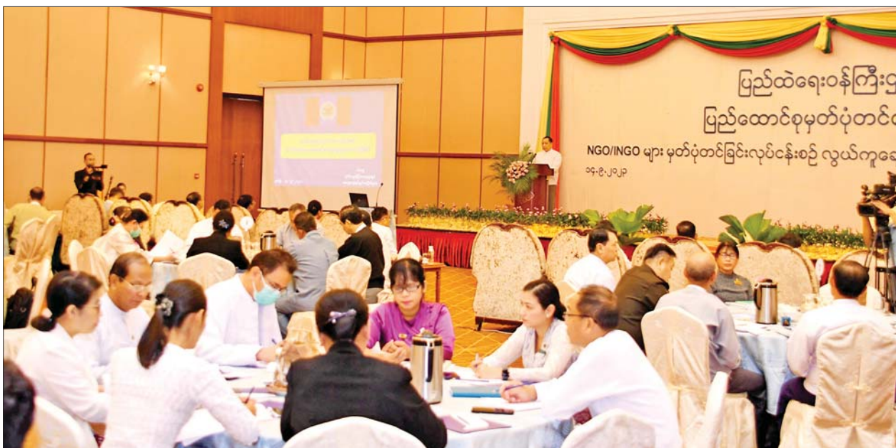
နိုင်ငံတော်စီမံအုပ်ချုပ်ရေးကောင်စီအဖွဲ့ဝင် ပြည်ထောင်စုဝန်ကြီး ဒုတိယဗိုလ်ချုပ်ကြီးရာပြည့် NGO/INGO များ မှတ်ပုံတင်ခြင်းလုပ်ငန်းစဉ် လွယ်ကူချောမွေ့စေရေးအလုပ်ရုံဆွေးနွေးပွဲ ဖွင့်ပွဲအခမ်းအနားတွင် အမှာစကား ပြောကြားစဉ်။

နေပြည်တော် စက်တင်ဘာ ၁၄ NGO/INGO များ မှတ်ပုံတင်ခြင်းလုပ်ငန်းစဉ် လွယ်ကူချောမွေ့စေရေးအလုပ်ရုံဆွေးနွေးပွဲ ဖွင့်ပွဲအခမ်းအနားကို ယနေ့နံနက်ပိုင်းတွင် နေပြည်တော်ရှိ Hotel Maxi Kumudra Ballroom ၌ ကျင်းပရာ ပြည်ထောင်စုမှတ်ပုံတင်ရေးအဖွဲ့ဥက္ကဋ္ဌ နိုင်ငံတော်စီမံအုပ်ချုပ်ရေးကောင်စီအဖွဲ့ဝင် ပြည်ထောင်စုဝန်ကြီး ဒုတိယဗိုလ်ချုပ်ကြီး ရာပြည့် တက်ရောက် အမှာစကားပြောကြားသည်။