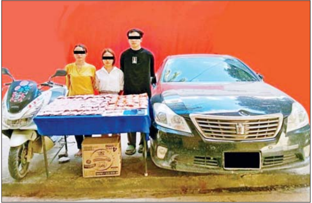
မမှုမှုကြူ(ခ) နန်းလောင်ငင်၊ စိုင်းဝိလတ်၊ မမိညား တို့အား သိမ်းဆည်းရမိသည့် စိတ်ပြောင်းဆေးဝါးများနှင့်အတူ တွေ့ရစဉ်။

မူးယစ်ဆေးဝါးတားဆီးနှိမ်နင်းရေးရဲတပ်ဖွဲ့မှ တပ်ဖွဲ့ဝင်များပါဝင်သော ပူးပေါင်းအဖွဲ့သည် စက်တင်ဘာ ၇ ရက် ညနေ ၄ နာရီခွဲတွင် ရှမ်းပြည်နယ်(အရှေ့ပိုင်း) တာချီလိတ် လေဆိပ်၌ မဖြိုးကေသီကျော်မှ ရန်ကုန်သို့ တင်ပို့ရန် သယ်ဆောင်လာသည့် စက္ကူချပ်ဖာကို ရှာဖွေစစ်ဆေးရာ ဒေသ