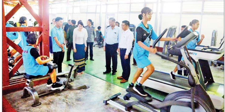
နိုင်ငံတော်စီမံအုပ်ချုပ်ရေးကောင်စီအဖွဲ့ဝင် ပိုးရယ်အောင်သိန်းနှင့်အဖွဲ့ အားကစားနှင့်ကာယ ပညာသိပ္ပံ (လွိုင်ကော်)၌ အားကစားခန်းမအတွင်း အားကစားနည်းများအလိုက် လေ့ကျင့်ဆောင်ရွက် နေမှုများကို လှည့်လည်ကြည့်ရှုအားပေးကြစဉ်။

အနေဖြင့် လိုအပ်ချက်များ ပံ့ပိုး ဖြည့်ဆည်း ဆောင်ရွက်ပေးသွား မည်ဖြစ်ပါကြောင်း၊ မြန်မာ့ရိုးရာ ယဉ်ကျေးမှု အဆို၊ အက၊ အရေး၊ အတီး ပြိုင်ပွဲသည် တည်ရှိနေဆဲ ဖြစ်သည့် ရိုးရာယဉ်ကျေးမှု အနု သုခုမ ပညာရပ်များ မတိမ်မြုပ်၊ မပျောက်ပျက်အောင် ထိန်းသိမ်း စောင့်ရှောက်မြှင့်တင်ပေးနေခြင်း ဖြစ်၍ ပြည်နယ်သူ ပြည်နယ်သား အားလုံးက ဂုဏ်ပြုကြိုဆိုအားပေး ရမည်ဖြစ်ပါကြောင်း ပြောကြား သည်။