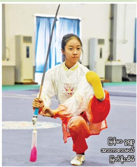
မြန်မာ ဝတ္ထု အားကစားမယ် မြတ်နိုးအိမ်

(နိုင်ငံတော်စီမံအုပ်ချုပ်ရေးကောင်စီဥက္ကဋ္ဌ နိုင်ငံတော် ဝန်ကြီးချုပ် ဗိုလ်ချုပ်မှူးကြီးမင်းအောင်လှိုင်က ၂၀၂၃ ခုနှစ်၊ ဧပြီလ ၂၄ ရက်နေ့တွင် ပြုလုပ်သော ပြည်ထောင်စုတိုင်းရင်းသား လူမျိုးများဖွံ့ဖြိုးရေးတက္ကသိုလ် ပညာရေးဘွဲ့ ၅ နှစ်သင်တန်း အမှတ်စဉ် (၅) ကျောင်းသား၊ ကျောင်းသူများကို တွေ့ဆုံအမှာ စကားပြောကြားမှုမှကောက်နုတ်ချက်)