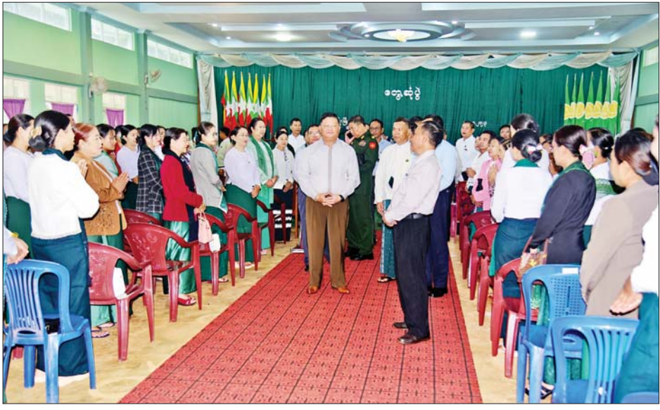
နိုင်ငံတော်စီမံအုပ်ချုပ်ရေးကောင်စီအဖွဲ့ဝင် ဦးရွှေကြိမ်း၊ ဦးရန်ကျော်နှင့်အဖွဲ့၊ ပြည်နယ်၊ ခရိုင်၊ မြို့နယ်ပညာရေးမှူးများနှင့် ဆရာ ဆရာမများအား ရင်းရင်းနှီးနှီးနှုတ်ဆက်စဉ်။

ယင်းနောက် လားရှိုးမြို့ ဂိုဏ်း ပေါင်းစုံ ခရစ်ယာန်အသင်းတော် များကောင်စီသို့ သွားရောက်၍ နိုင်ငံတော် စီမံအုပ်ချုပ်ရေး ကောင်စီအဖွဲ့ဝင် ဦးရန်ကျော်က နှုတ်ခွန်းဆက်စကားပြောကြားပြီး နိုင်ငံတော် စီမံအုပ်ချုပ်ရေး ကောင်စီအဖွဲ့ဝင်များနှင့် ပြည်နယ် ဝန်ကြီးချုပ်တို့က ဂိုဏ်းပေါင်းစုံ