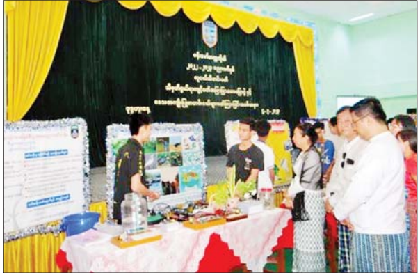
စက်တင်ဘာ ၆ ရက်က ဗန်းမော်တက္ကသိုလ်တွင် Project Show နှင့် ဒေသအကျိုးပြု စာတမ်းငယ်များ ဖတ်ကြားပွဲကျင်းပစဉ်။