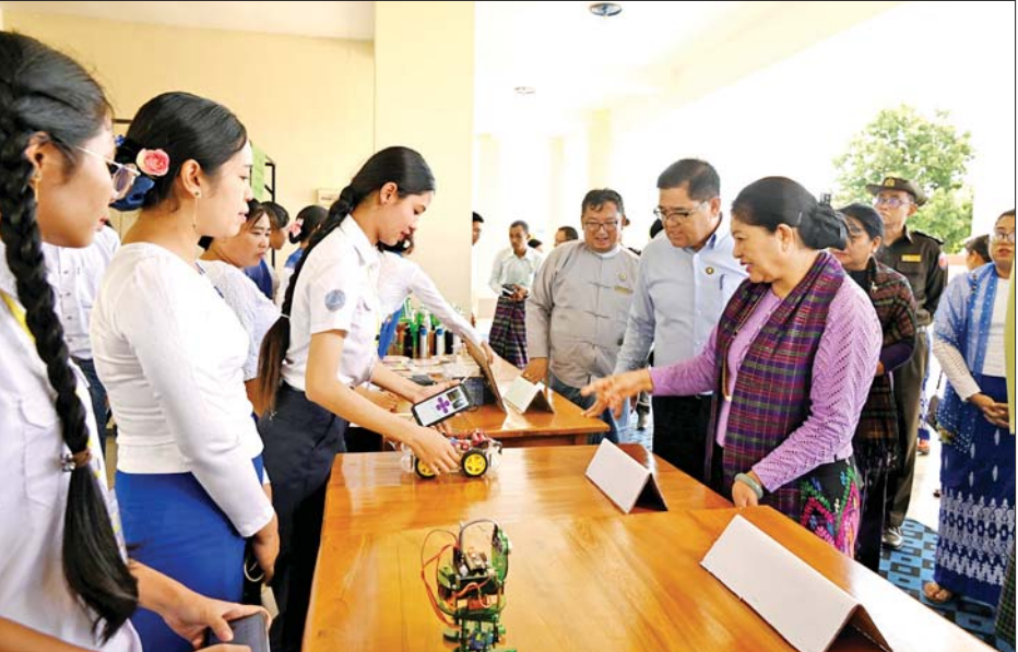
နိုင်ငံတော်စီမံအုပ်ချုပ်ရေးကောင်စီအဖွဲ့ဝင် ဒေါ်ဒွဲဘူ အစိုးရစက်မှုလက်မှုသိပ္ပံကျောင်း(မိုးညှင်း)၌ ကျောင်းသား ကျောင်းသူများ လက်တွေ့စွမ်းရည်ပြသထားသည့် Project များကို ကြည့်ရှုအားပေးစဉ်။

MSME လုပ်ငန်းများကို အားပေး မြှင့်တင် ဆောင်ရွက်ပေးရေး၊ ကျန်းမာကြံ့ခိုင်ပြီး ပညာရည်ပြည့်ဝသော၊ ဗလင်းတန်နှင့် ပြည့်စုံသော အနာဂတ်လူငယ်များ လေ့ကျင့်ပေးထုတ်ပေးနိုင်ရေး၊ ပြည်တွင်း ငြိမ်းချမ်းရေးရရှိရေး၊ တရားဥပဒေစိုးမိုးရေး၊ တည်ငြိမ်အေးချမ်းမှုရရှိရေးနှင့် လွတ်လပ်ပြီး တရားမျှတသည့် ပါတီစုံဒီမိုကရေစီအထွေထွေ ရွေးကောက်ပွဲအောင်မြင်စွာ ကျင်းပနိုင်ရေးကို အလေးထားဆောင်ရွက်လျက်ရှိကြောင်း၊ ယခုလို ရေခဲမြေခံကောင်းမွန်ပြီး စိုက်ပျိုးရေး ဖြစ်ထွန်းသည့် မိုးညှင်းဒေသပြည်သူများ အနေဖြင့်လည်း မိမိတို့ဒေသတွင်း စိုက်ပျိုးရေး