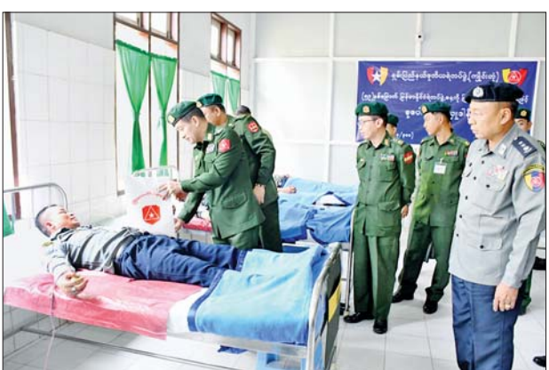
ဝင်များ စုပေါင်းသွေးလှူဒါန်း နေမှုကို ကြိုဆိုသောအားဖြင့် စစ်ဌာန ချုပ်တိုင်းမှူး ဗိုလ်ချုပ်အောင်ခိုင်ဝင်း၊ ပြည်နယ်အစိုးရအုပ်ချုပ်ရေးအဖွဲ့

ကျိုင်းတုံ စက်တင်ဘာ ၁၄ (၅၉)နှစ်မြောက် မြန်မာနိုင်ငံ ရဲတပ်ဖွဲ့နေ့ကို ကြိုဆိုဂုဏ်ပြုသော အားဖြင့် ယနေ့နံနက်ပိုင်းက ရှမ်းပြည်နယ် (အရှေ့ပိုင်း) ကျိုင်းတုံမြို့ရှိ အမှတ်(၃) တပ်မတော်ဆေးရုံ(ခုတင်-၃၀၀)၌ မြန်မာနိုင်ငံ ရဲတပ်ဖွဲ့ဝင်များက စုပေါင်းသွေးလှူဒါန်းကြသည်။ ကြည့်ရှုအားပေး ထိုသို့ စုပေါင်းသွေးလှူဒါန်းရာ တွင် ရှမ်းပြည်နယ် ဒုတိယရဲတပ်ဖွဲ့ (ကျိုင်းတုံ)၊ ခရိုင်၊ မြို့နယ် ရဲတပ်ဖွဲ့