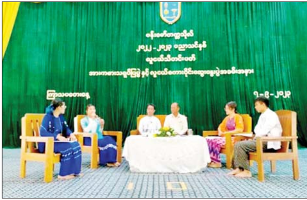
စက်တင်ဘာ ၇ ရက်က ဗန်းမော်တက္ကသိုလ်တွင် လူငယ် စကားဝိုင်းဆွေးနွေးပွဲ ကျင်းပစဉ်။

စက်တင်ဘာ ၇ ရက်က ကာယဗလနှင့် ဉာဏဗလကို ဖော်ဆောင်