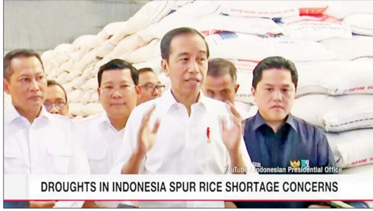
DROUGHTS IN INDONESIA SPUR RICE SHORTAGE CONCERNS