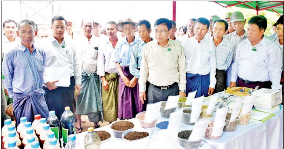
မွန်းလွဲပိုင်းတွင် နေပြည်တော်ကောင်စီဥက္ကဋ္ဌနှင့် အဖွဲ့သည် တပ်ကုန်းမြို့နယ် အထွေထွေအုပ်ချုပ်ရေး ဦးစီးဌာန အစည်းအဝေးခန်းမ၌ မြို့နယ်အဆင့် ဌာန ဆိုင်ရာများနှင့်တွေ့ဆုံ အမှာစကားပြောကြားပြီး တပ်ကုန်းမြို့နယ် ရေအေးကျေးရွာ စိုက်ပျိုးရေးစင်တာ ၌ မြို့နယ်စိုက်ပျိုးရေးဌာနနှင့် သိန်မျိုးစေ့ထုတ် ကုမ္ပဏီများက ခင်ကျင်းပြာထားသည့် မျိုးစေ့များ၊ သဘာဝမြေဩဇာများနှင့် စိုက်ပျိုးရေးသုံးဆက်စပ် ပစ္စည်းများကိုလည်းကောင်း၊ စပါးသားတက်ဆင့်ပွား စိုက်ပျိုးနည်းပညာနှင့် စိုက်ပျိုးရေး ခြောက်တစ်ခါ ရေထိန်းသိမ်းနည်းပညာပေးစိုက်ခင်း၊ မြေဩဇာနှင့် သဘာဝမြေဩဇာများ အမျိုးမျိုးပေါင်းစပ်နေမှု သရုပ် ပြသခြင်းကို ကြည့်ရှုအားပေး၍ တောင်သူများ၏ လိုအပ်ချက်များကို ပေါင်းစပ်ညှိနှိုင်း ဆောင်ရွက်ပေး ခဲ့ကြောင်း သိရသည်။ သတင်းစဉ်

အတွင်းရှိ မြို့ရှေ့စန္ဒာရုံကျောင်းတိုက် ပဓာနနာယက ဆရာတော် အဘိဓဇအဂ္ဂမဟာ သဒ္ဓမ္မဇောတိက အဂ္ဂ မဟာပဏ္ဍိတ ဘဒ္ဒန္တစန္ဒသီရိ မဟာထေရ်မြတ်အား သွားရောက်ဖူးမြော် ကြည့်ညှိပြီး လှူဖွယ်ဝတ္ထုပစ္စည်း များ ဆက်ကပ်လှူဒါန်းသည်။ ဆက်လက်၍ နေပြည်တော်ကောင်စီဥက္ကဋ္ဌနှင့် အဖွဲ့သည် တပ်ကုန်းမြို့ စိုက်ပျိုးရေး သုတေသနမြို့ အတွင်း စိုက်ပျိုးထားသည့် စိုက်ခင်းကိုလည်းကောင်း၊ နိုင်ငံစီးပွားရန်ပုံငွေဖြင့် ဆောင်ရွက်လျက်ရှိသည့် ကျော်ပြည့်စုံဆီစက်နှင့် စိန်စိဆီစက်များကို လည်းကောင်း ကြည့်ရှုစစ်ဆေးသည်။ ထိုမှတစ်ဆင့် နေပြည်တော်ကောင်စီဥက္ကဋ္ဌနှင့် အဖွဲ့သည် နိုင်ငံတော်သြဝါဒါစရိယ တပ်ကုန်းမြို့ မဟာသီဟနာဒကျောင်းတိုက် ပဓာနနာယက ဆရာတော် အဘိဓဇမဟာရဋ္ဌဂုရု ဘဒ္ဒန္တအာစိန္တ မဟာထေရ်မြတ်အား သွားရောက်ဖူးမြော် ကြည့်ညှိ ပြီး လှူဖွယ်ဝတ္ထုပစ္စည်းများ ဆက်ကပ်လှူဒါန်းသည်။