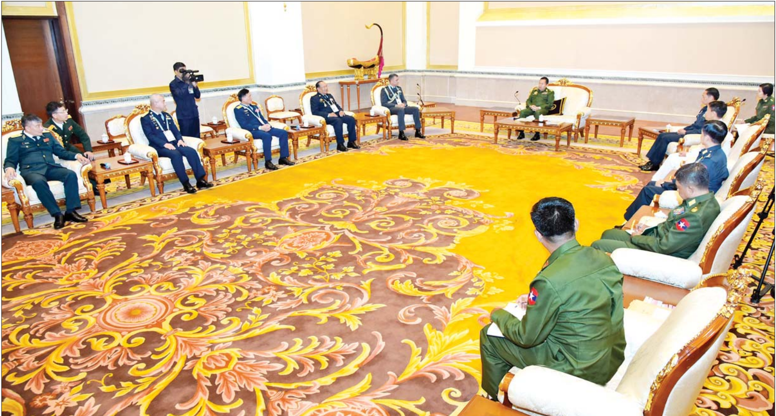
နိုင်ငံတော်စီမံအုပ်ချုပ်ရေးကောင်စီဒုတိယဥက္ကဋ္ဌ ဒုတိယတပ်မတော်ကာကွယ်ရေးဦးစီးချုပ် ကာကွယ်ရေးဦးစီးချုပ်(ကြည်း) ဒုတိယဗိုလ်ချုပ်မှူးကြီး စိုးဝင်း အာဆီယံလေတပ် ဦးစီးချုပ်များအား လက်ခံတွေ့ဆုံစဉ်။

နေပြည်တော် စက်တင်ဘာ ၁၄ နိုင်ငံတော် စီမံအုပ်ချုပ်ရေး ကောင်စီဒုတိယဥက္ကဋ္ဌ ဒုတိယ တပ်မတော်ကာကွယ်ရေးဦးစီးချုပ် ကာကွယ်ရေးဦးစီးချုပ်(ကြည်း) ဒုတိယဗိုလ်ချုပ်မှူးကြီး စိုးဝင်း သည် ယနေ့ နံနက်ပိုင်းတွင် နေပြည်တော်ရှိ ဧပျာသီရိမာန် ဧည့်ခန်းမဆောင်၌ မြန်မာနိုင်ငံက အိမ်ရှင်အဖြစ် လက်ခံကျင်းပသည့် အကြိမ် (၂၀)မြောက် အာဆီယံ လေတပ်ဦးစီးချုပ်များ ညီလာခံ 20 th AACC သို့ တက်ရောက်ခဲ့သည့် အာဆီယံ လေတပ်ဦးစီးချုပ်များ အား လက်ခံတွေ့ဆုံသည်။ အဆိုပါတွေ့ဆုံပွဲသို့ နိုင်ငံတော် စီမံအုပ်ချုပ်ရေးကောင်စီ ဒုတိယ ဥက္ကဋ္ဌ ဒုတိယတပ်မတော်ကာကွယ် ရေးဦးစီးချုပ် ကာကွယ်ရေးဦးစီး ချုပ်(ကြည်း)နှင့်အတူ ကာကွယ် ရေးဦးစီးချုပ်(လေ) ဗိုလ်ချုပ်ကြီး ထွန်းအောင်၊ စစ်ဦးစီးအရာရှိချုပ် (၈၅) ဒုတိယဗိုလ်ချုပ်ကြီး ဇွဲဝင်း မြင့်၊ စစ်ဦးစီးအရာရှိချုပ်(လေ) စာမျက်နှာ ၃ ကော်လံ ၁ သို့ ။