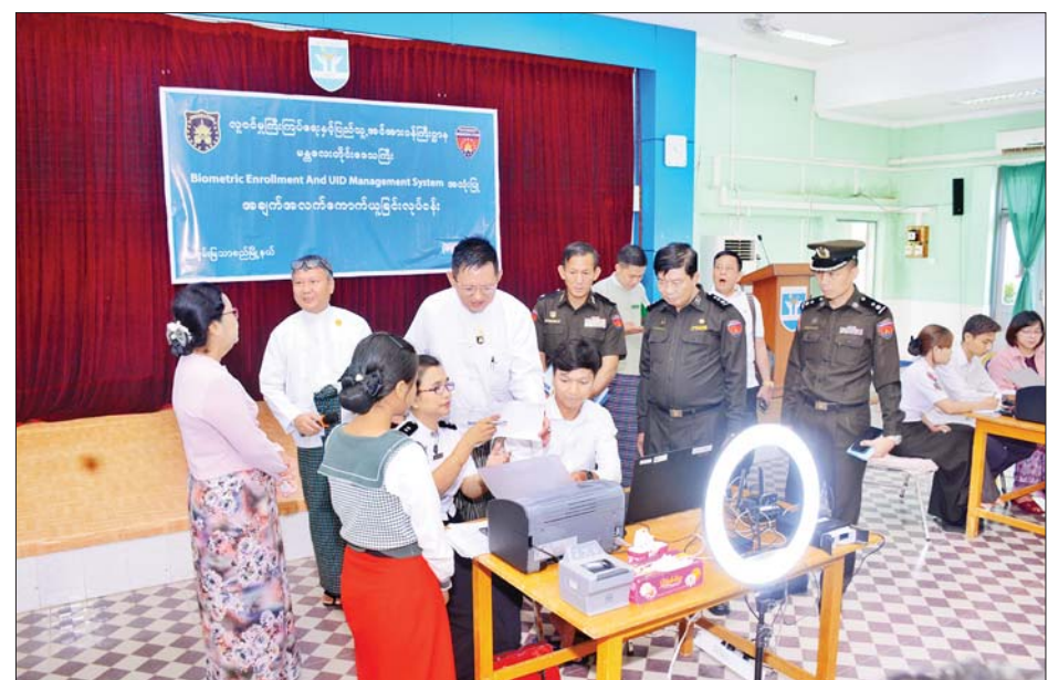
ပြည်နယ်အားလုံးရှိ နိုင်ငံ-မှတ်တမ်း ၅၂ သန်းကျော် နှင့် အိမ်ထောင်စု ၁၃ သန်းကျော်ကို data base အတွင်း ထည့်သွင်းပြီးဖြစ်ကြောင်း၊ လူဝင်မှုကြီးကြပ် ရေးနှင့် ပြည်သူ့အင်အားဝန်ကြီးဌာနကို digital စနစ် ဖြစ်အောင်ဆောင်ရွက်နေသဖြင့် ဝန်ထမ်းများ IT ကျွမ်းကျင်နားလည်ရန်လိုအပ်သကဲ့သို့ cyber security ကိုလည်း ဂရုစိုက်ရန်လိုကြောင်း၊ မိမိတို့ဌာနသည် public services ပေးသည့်ဌာနဖြစ်၍ ဝန်ထမ်းများ အနေဖြင့် ပြည်သူလူထုကို အကောင်းဆုံးဝန်ဆောင်မှု ပေးရန်လိုကြောင်း မှာကြားသည်။ သတင်းစဉ်

ထည့်သွင်းပြီးဖြစ် ယင်းနောက် ဒုတိယဝန်ကြီးသည် တိုင်းဒေသကြီး လွှတ်တော်အဆောက်အအုံဟောင်း၌ တိုင်းဒေသကြီး အတွင်းရှိ တိုင်းဒေသကြီး၊ ခရိုင်၊ မြို့နယ်များမှ ဦးစီးမှူး များ၊ ဝန်ထမ်းများနှင့် တာဝန်ရှိသူများအား တွေ့ဆုံ၍ Biometric ကောက်ယူသည့်လုပ်ငန်းသည် တိုင်းပြည် အတွက် အလွန်အရေးကြီးကြောင်း၊ တိုင်းဒေသကြီးနှင့်