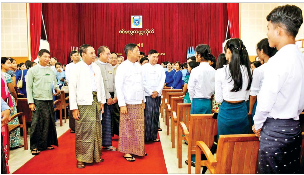
နိုင်ငံတော်စီမံအုပ်ချုပ်ရေးကောင်စီအဖွဲ့ဝင် ဒေါက်တာ ဘရွှေနှင့်အဖွဲ့ စစ်တွေတက္ကသိုလ်၊ နည်းပညာတက္ကသိုလ်(စစ်တွေ)နှင့် ကွန်ပျူတာတက္ကသိုလ် (စစ်တွေ)တို့မှ ပါမောက္ခချုပ်၊ ဒုတိယပါမောက္ခချုပ်များ၊ ပါမောက္ခ/ ဌာနမှူးများ၊ ဆရာ ဆရာမများ၊ ကျောင်းသားကျောင်းသူများနှင့်တွေ့ဆုံ၍ ရင်းရင်းနှီးနှီးနှုတ်ဆက်စဉ်။

ဗိမာန်တော်၌ ဌာနဆိုင်ရာများ၊ မြို့မိ မြို့ဖများ၊ စီးပွားရေးလုပ်ငန်းရှင်များ၊ စာပေပညာရှင်များ၊ လူမှုရေးအဖွဲ့များ၊ ရပ်ကွက်၊ ကျေးရွာအုပ်စု အုပ်ချုပ်ရေးမှူးများနှင့် တွေ့ဆုံပွဲတွင် နိုင်ငံတော်စီမံအုပ်ချုပ်ရေး ကောင်စီအဖွဲ့ဝင် ဒေါက်တာ ဘရွှေက နိုင်ငံတော်စီမံအုပ်ချုပ်ရေးကောင်စီ၏ နိုင်ငံရေးရည်မှန်းချက်မှာ စစ်မှန်၍ စည်းကမ်းပြည့်ဝသည့် ပါတီစုံဒီမိုကရေစီစနစ်ခိုင်မာရေးနှင့် ဒီမိုကရေစီနှင့် ဖက်ဒရယ်စနစ်ကို အခြေခံသည့် ပြည်ထောင်စုတည်ဆောက် နိုင်ငံရေးဖြစ်ကြောင်း၊ ပြည်ထောင်စုစိတ်ဓာတ်သည် အရေးအကြီးဆုံးဖြစ်ကြောင်း၊ ထို့ပြင် ကျေးလက်နေပြည်သူများနှင့် ဝေးလံဒေသများမှ တိုင်းရင်းသားပြည်သူများ စာတတ်မြောက်ရေး၊ အတန်းပညာ တတ်မြောက်ရေးကို ဆောင်ရွက် လျက်ရှိကြောင်း၊ တိုင်းပြည်တစ်ပြည် တိုးတက်ရန်အခြေခံမှာ ပညာတတ်များ ပေါကြွယ်ဝခြင်းပင် ဖြစ်ကြောင်း၊ ထို့ကြောင့် အသိပညာ၊ အတတ်ပညာ နှင့် ပြည့်စုံသည့် လူသား