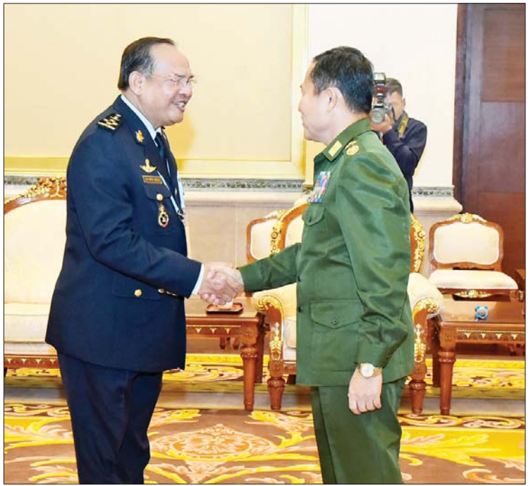
နိုင်ငံတော်စီမံအုပ်ချုပ်ရေးကောင်စီ ဒုတိယဥက္ကဋ္ဌ ဒုတိယတပ်မတော်ကာကွယ်ရေးဦးစီးချုပ် ကာကွယ်ရေးဦးစီးချုပ်(ကြည်း) ဒုတိယဗိုလ်ချုပ်မှူးကြီး စိုးဝင်း အာဆီယံလေတပ်ဦးစီးချုပ်များအား ရင်းရင်းနှီးနှီးနှုတ်ဆက်စဉ်။

သည်။ ထို့နောက် အာဆီယံလေတပ်ဦးစီးချုပ်များက နိုင်ငံအလိုက် တစ်ဦးချင်းမိတ်ဆက်ကြပြီး မြန်မာနိုင်ငံအတွင်းရှိ အထင်ကရ နေရာများသို့ သွားရောက်၍ လေ့လာလည်ပတ်ခဲ့မှု၊ ဧည့်ဝတ်ကျေပွန်မှုနှင့် အစည်းအဝေး အောင်မြင်စွာကျင်းပနိုင်ခဲ့မှုများကို ဆွေးနွေးတင်ပြကြသည်။ တွေ့ဆုံပွဲအပြီးတွင် နိုင်ငံတော်စီမံအုပ်ချုပ်ရေးကောင်စီ ဒုတိယဥက္ကဋ္ဌ ဒုတိယတပ်မတော်ကာကွယ်ရေးဦးစီးချုပ်(ကြည်း) သည် အာဆီယံ လေတပ်ဦးစီးချုပ်များအား လက်ဆောင်ပစ္စည်းများ ပေးအပ်ကာ စုပေါင်းမှတ်တမ်းတင်ဓာတ်ပုံရိုက်ခဲ့ကြကြောင်း သိရသည်။ သတင်းစဉ်