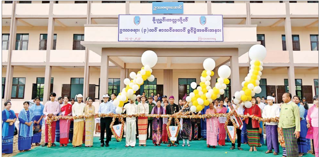
နိုင်ငံတော်စီမံအုပ်ချုပ်ရေးကောင်စီအဖွဲ့ဝင် ဒေါ်ဒွဲဘူ၊ ပြည်နယ်ဝန်ကြီးချုပ် ဦးခက်ထိန်နန်နှင့် မိုးညှင်းတက္ကသိုလ် ပါမောက္ခချုပ်တို့က သုံးထပ်စာသင်ဆောင်သစ် ဥဿဖရားဆောင်ကို ဖဲကြိုးဖြတ်ဖွင့်လှစ်ပေးစဉ်။

IBPD Centre ၌ သင်ကြားနေမှု အင်္ဂလိပ်စာစွမ်းရည်သင်ကြားနေမှုနှင့် လက်တွေ့စွမ်းရည်ပြသထားသည့် Project များကို လှည့်လည်ကြည့်ရှု အားပေးကြသည်။