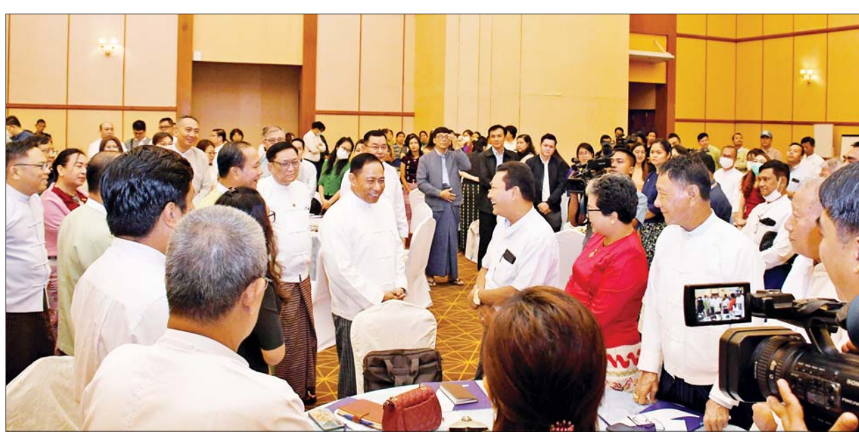
နိုင်ငံတော်စီမံအုပ်ချုပ်ရေးကောင်စီအဖွဲ့ဝင် ပြည်ထောင်စုဝန်ကြီး ဒုတိယဗိုလ်ချုပ်ကြီးရာပြည့် NGO/INGO များ မှတ်ပုံတင်ခြင်းလုပ်ငန်းစဉ် လွယ်ကူချောမွေ့စေရေးအလုပ်ရုံဆွေးနွေးပွဲသို့ တက်ရောက်လာကြသူများကို ရင်းရင်းနှီးနှီး နှုတ်ဆက်စဉ်။

များ၏ ထောက်ခံချက်များရယူရန် လိုအပ်ပါကြောင်း၊ သက်ဆိုင်ရာဌာနများအနေဖြင့် ဌာနအဖွဲ့အစည်း၏မူဝါဒ၊ လုပ်ထုံးလုပ်နည်းများနှင့်အညီ စိစစ်ပြီး မြန်ဆန်စွာ ဆောင်ရွက်ပေးစေလိုပါကြောင်း၊ မြန်မာနိုင်ငံရှိ အသင်းအဖွဲ့များ၏ အကူအညီပေးရေး လုပ်ငန်းများ ဆောင်ရွက်မှုအပေါ် အကဲဖြတ်သတ်မှတ်သည့် အာဂျင်တင်မီဇာ ဒေသ ငွေကြေးခဝါချမှုတိုက်ဖျက်ရေးအဖွဲ့၏ နိုင်ငံအချင်းချင်း အပြန်အလှန် အကဲဖြတ်မှုအစီရင်ခံစာအရပရဟိတအဖွဲ့အစည်းများသည် အကြမ်းဖက်မှုကို ငွေကြေးထောက်ပံ့ရာ၌ အသုံးပြုရခြင်းမြေများသည်အတွက် ငွေကြေးခဝါချမှုတိုက်ဖျက်ရေးဆိုင်ရာ စံနှုန်းများကို လိုက်နာဆောင်ရွက်မှု