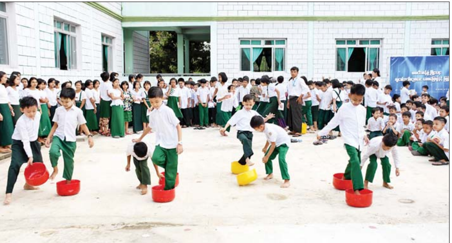
နေပြည်တော် မွှေးသီရိမြို့နယ် အထက (၁၁) ၌ ပြုလုပ်သော ဗလငါးတန်ဖွံ့ဖြိုးရေးအသိပညာပေးဟောပြောပွဲတွင် ကျောင်းသား ကျောင်းသူများ ပါဝင်ဆင်နွှဲကြစဉ်။