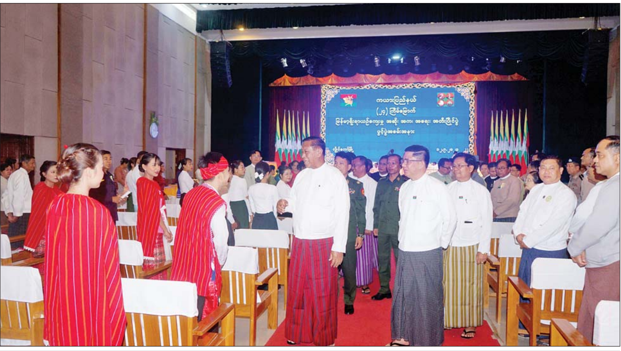
နိုင်ငံတော်စီမံအုပ်ချုပ်ရေးကောင်စီအဖွဲ့ဝင် ပိုးရယ်အောင်သိန်းနှင့် ပြည်နယ်ဝန်ကြီးချုပ်ဦးဇော်မျိုးတင် ပြိုင်ပွဲဝင်အဖွဲ့များနှင့် ပြိုင်ပွဲဝင် မိသားစုများအား ရင်းရင်းနှီးနှီးလိုက်လံ နှုတ်ဆက်စဉ်။

မြန်မာ့ရိုးရာ ယဉ်ကျေးမှု အဆို၊ အက၊ အရေး၊ အတီးပြိုင်ပွဲ (ပြည်နယ်အဆင့်) ဖွင့်ပွဲအခမ်း အနားကို ဖဲကြိုးဖြတ်ဖွင့်လှစ်ပေး ကြသည်။ ထို့နောက် ကယားပြည်နယ် ဝန်ကြီးချုပ် ဦးဇော်မျိုးတင်က အဖွင့်အမှာ စကားပြောကြား သည်။ လှိုင်ကော် ယင်းနောက် ဖျော်ဖြေရေးအဖွဲ့ များက တေးသီချင်းများ၊ တိုင်းရင်း သားရိုးရာအကများဖြင့် ဖျော်ဖြေ တင်ဆက်ကြရာ ဖွင့်ပွဲအခမ်းအနား သို့ တက်ရောက်လာကြသူများက ကြည့်ရှုအားပေးကြပြီး နိုင်ငံတော် စီမံအုပ်ချုပ်ရေးကောင်စီအဖွဲ့ဝင် နှင့် ပြည်နယ်ဝန်ကြီးချုပ်တို့က ဖျော်ဖြေရေး အဆို အကအဖွဲ့များ အား ဂုဏ်ပြုချီးမြှင့် ငွေများ ပေးအပ်ကြကာ ပြိုင်ပွဲဝင်အဖွဲ့ များနှင့် ပြိုင်ပွဲဝင်မိသားစုများအား ရင်းရင်းနှီးနှီး လိုက်လံနှုတ်ဆက် ကြသည်။ ဆက်လက်၍ ပြိုင်ပွဲများကို