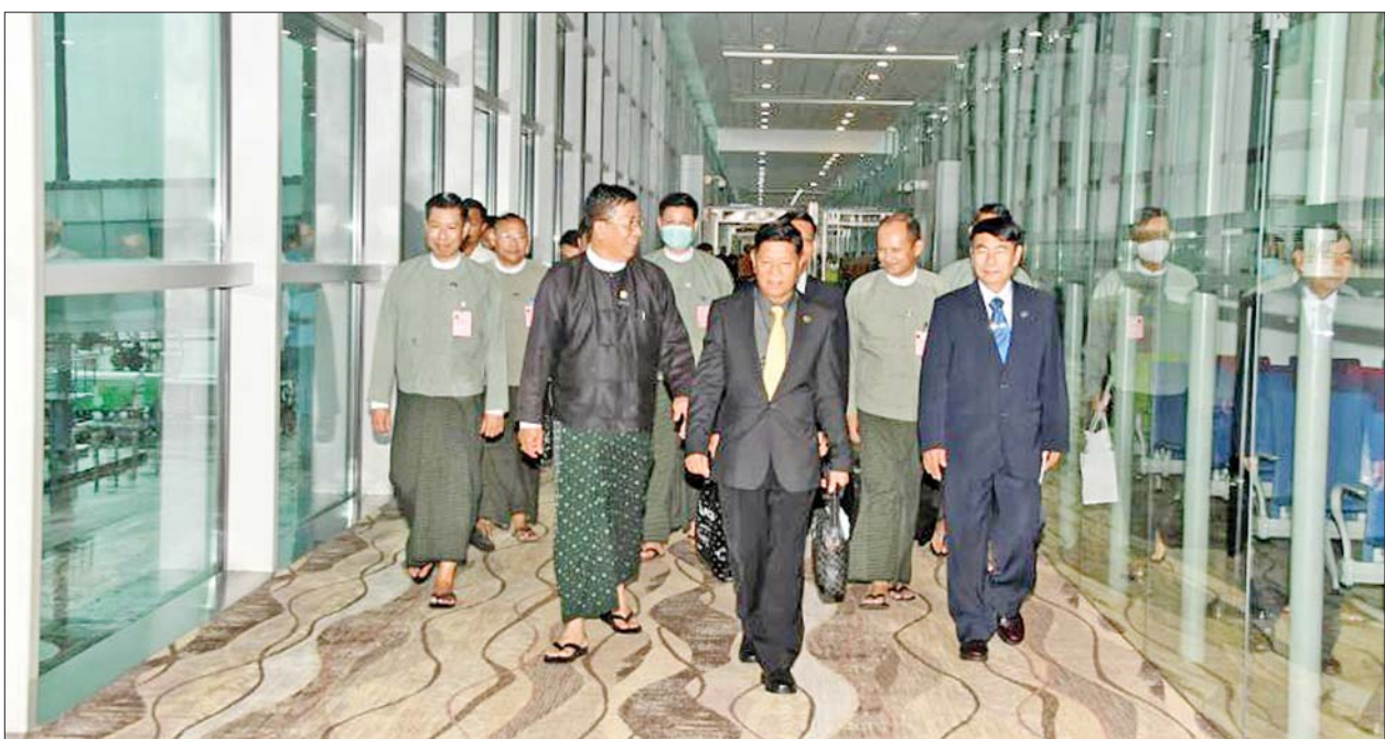
ရွေးကော်မရှင်ဥက္ကဋ္ဌ ဦးသိန်းစိုးနှင့် အဖွဲ့ဝင်များ

လေဆိပ်၌ ကြိုဆိုကြသည်။ လက်မှတ်ရေးထိုးခရီးစဉ်အတွင်း ပြည်ထောင်စုရွေးကော်မရှင်ဥက္ကဋ္ဌ ဦးဆောင်သော ကိုယ်စားလှယ်အဖွဲ့သည် ရုရှားဖက်ဒရေးရှင်းနိုင်ငံ ဗဟိုရွေးကော်မရှင်ဥက္ကဋ္ဌနှင့် ပြည်ထောင်စုရွေးကော်မရှင်တို့အကြား ရွေးကော်မရှင်ပွဲဆိုင်ရာလုပ်ငန်းများ ပူးပေါင်းဆောင်ရွက်သွားနိုင်ရေး အတွက် နားလည်မှု စာချုပ်လွှာတစ်ရပ်ကို စက်တင်ဘာ ၇ ရက်တွင် ရုရှားနိုင်ငံ မော်စကိုမြို့ရှိ ဗဟိုရွေးကော်မရှင်ဦးဆောင်သော လက်မှတ်ရေးထိုးခဲ့သည်။ စက်တင်ဘာ ၈ ရက်တွင် ကော်မရှင်ဥက္ကဋ္ဌနှင့် အဖွဲ့သည် ရုရှားဖက်ဒရေးရှင်းနိုင်ငံ ဗဟို