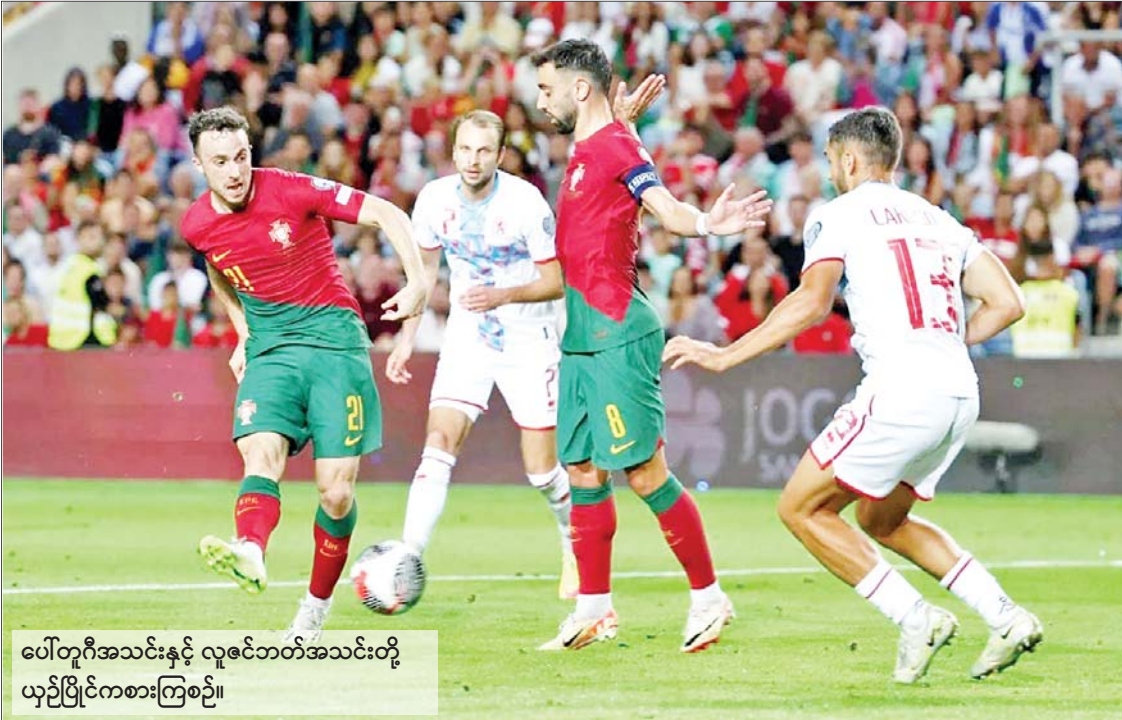
ပေါ်တူဂီအသင်းနှင့် လူဇင်ဘတ်အသင်းတို့ ယှဉ်ပြိုင်ကစားကြစဉ်။

(နိုင်ငံတော်စီမံအုပ်ချုပ်ရေးကောင်စီဥက္ကဋ္ဌ နိုင်ငံတော်ဝန်ကြီးချုပ် ဗိုလ်ချုပ်မှူးကြီး မင်းအောင်လှိုင်က ၂၀၂၃ ခုနှစ်၊ ဧပြီလ ၂၄ ရက်နေ့တွင် ပြုလုပ်သော ပြည်ထောင်စု တိုင်းရင်းသားလူမျိုးများ ဖွံ့ဖြိုးရေးတက္ကသိုလ် ပညာရေးဘွဲ့ ၅ နှစ်သင်တန်း အမှတ်စဉ်(၅)ကျောင်းသား၊ ကျောင်းသူများကို တွေ့ဆုံအမှာစကားပြောကြားမှုမှ ကောက်နုတ်ချက်)