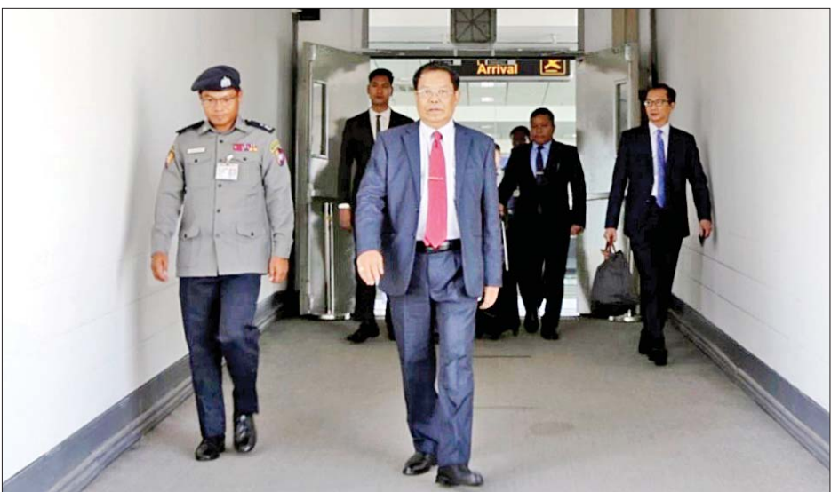
(MAI)ဖြင့် ထွက်ခွာသွားသည်။ ဝန်ကြီး ဦးဆောင်သော မြန်မာ မြန်မာကိုယ်စားလှယ်အဖွဲ့အား နိုင်ငံခြားရေးဝန်ကြီးဌာနမှ တာဝန်ရှိသူများက မန္တလေးအပြည်ပြည်ဆိုင်ရာလေဆိပ်၌ ပို့ဆောင်နှုတ်ဆက်ကြသည်။ သတင်းစဉ်

နေပြည်တော် စက်တင်ဘာ ၁၂ ရုရှား နိုင်ငံခြားရေးဝန်ကြီး မစ္စတာ ဆာဂျီလတ်ဗ်ရှေ့နှင့် ဘယ်လာရုစ် နိုင်ငံခြားရေးဝန်ကြီး မစ္စတာ ဆာဂေး အယ်လယ်နိန် တို့၏ ဖိတ်ကြားချက်များအရ ဒုတိယဝန်ကြီးချုပ်နှင့် နိုင်ငံခြားရေးဝန်ကြီးဌာန ပြည်ထောင်စုဝန်ကြီး ဦးသန်းဆွေ ဦးဆောင်သော မြန်မာကိုယ်စားလှယ်အဖွဲ့သည် ရုရှားဖက်ဒရေးရှင်းနိုင်ငံ နှင့် ဘယ်လာရုစ်သမ္မတနိုင်ငံ တို့သို့ စက်တင်ဘာ ၁၂ ရက်မှ ၁၇ ရက်အထိ အလုပ်သဘောခရီးစဉ်များ သွားရောက်ရန် ယနေ့ ညနေပိုင်းတွင် မန္တလေးမြို့မှ ရုရှားဖက်ဒရေးရှင်းနိုင်ငံ နိမ့်စီဖစ်မြို့သို့ အပြည်ပြည်ဆိုင်ရာ မြန်မာ့လေကြောင်း