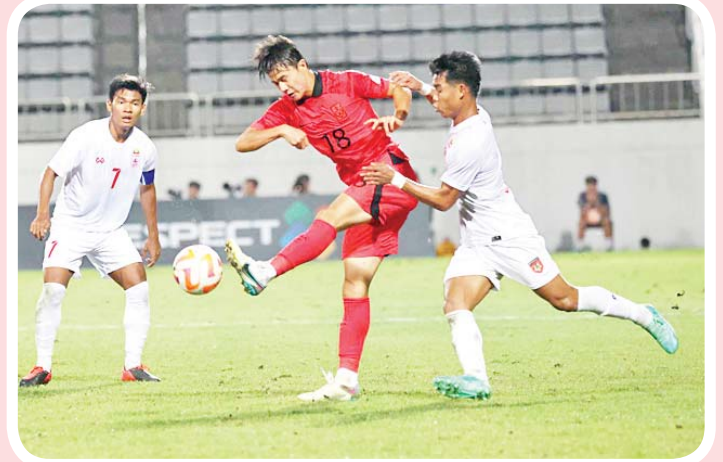
မြန်မာအသင်းနှင့် တောင်ကိုရီးယားအသင်းတို့ ခြေစစ်ပွဲ ယှဉ်ပြိုင်ကစားကြစဉ်။

ရန်ကုန် စက်တင်ဘာ ၁၂ ၂၀၂၄ အာရှဖလား ယူ-၂၃ ခြေစစ်ပွဲ အုပ်စု(ခ)နောက်ဆုံးနေ့ကို စက်တင်ဘာ ၁၂ ရက်က တောင်ကိုရီးယားနိုင်ငံ၌ကျင်းပရာ မြန်မာအသင်းသည် တောင်ကိုရီးယားအသင်းကို သုံးဂိုးပြတ် ရှုံးနိမ့်ခဲ့သည်။ မြန်မာအသင်းသည် အုပ်စုပထမပွဲတွင် ကာဂျစ္စတန်ကို သရေကျကတည်းက ခြေစစ်ပွဲအောင်မြင်ရေးမျှော်လင့်ချက် နည်းသွားခြင်းဖြစ်ပြီး တောင်ကိုရီးယားကို ထပ်မံအရေးနိမ့်ခဲ့သဖြင့် ခြေစစ်ပွဲအဆင့်ဖြင့် ကျေနပ်ခဲ့ရသည်။ မြန်မာအသင်းသည် ပထမဆုံးကျင်းပသည့် ၂၀၁၄ ပြိုင်ပွဲ တစ်ကြိမ်သာ ခြေစစ်ပွဲအောင်မြင်ခဲ့ပြီး နောက်ပိုင်းကျင်းပသည့် ၂၀၁၆၊ ၂၀၁၈၊ ၂၀၂၀၊ ၂၀၂၂၊ ၂၀၂၄ ငါးကြိမ်ဆက်တိုက် ခြေစစ်ပွဲအောင်မြင်ခဲ့ခြင်း မရှိပေ။ တောင်ကိုရီးယားအသင်းသည် ပွဲအစ ငါးမိနစ်မှာပင် အဖွင့်ဂိုးရခဲ့ပြီး ပတ်ဆောင်ဟွန်က သွင်းယူခဲ့ခြင်းဖြစ်သည်။ ယင်းနောက်ပိုင်းတွင် မြန်မာအသင်းသည် တောင်ကိုရီးယားတိုက်စစ်ကို ဟန့်တားနိုင်ခဲ့ပြီး ပွဲပြီးခါနီးမှ နှစ်ဂိုးပေးခဲ့ခြင်း ဖြစ်သည်။ ခြေစစ်ပွဲအုပ်စုပွဲစဉ်များအပြီးတွင် မြန်မာအသင်းသည် နှစ်ပွဲကစား တစ်ပွဲသရေ တစ်ပွဲရှုံး တစ်မှတ်သာရရှိပြီး ခြေစစ်ပွဲ မအောင်မြင်ခဲ့ပေ။ သတင်း - ကိုညီလေး၊ ဓာတ်ပုံ - MFF